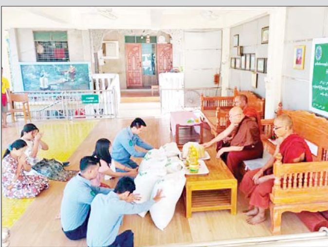
နယ်စပ်ရေးရာဝန်ကြီးဌာနက တိုင်းဒေသကြီးနှင့် ပြည်နယ်အသီးသီးတွင် သီတင်းသုံးနေထိုင်တော်မူကြသော ဆရာတော်၊ သံဃာတော်များ၊ ရှင်သာမဏေများနှင့် သီလရှင်များ ဆွမ်းကိစ္စ ခက်ခဲပင်ပန်းမှု မရှိစေရေးအတွက် ဆွမ်းဆန်တော်၊ ဆီ၊ ပဲနှင့် လှူဖွယ်ပစ္စည်းများကို ဆက်ကပ်လှူဒါန်းပေးလျက်ရှိရာ ဇန်နဝါရီ ၄ ရက် နံနက်ပိုင်းက နယ်စပ်ရေးရာဝန်ကြီးဌာန မြဝတီမြို့နယ် ဖွံ့ဖြိုးမှုကြီးကြပ်ရေးမှူးမှ တာဝန်ရှိသူများ ငွေရိပ်သာဘုန်းတော်ကြီးကျောင်းသို့ ဆွမ်းဆန်တော်၊ ဆီ နှင့် ပဲ တို့ကို သွားရောက် ဆက်ကပ်လှူဒါန်းကြသည်။ စောမျိုးမင်းသိန်း(ပြန်/ဆက်)