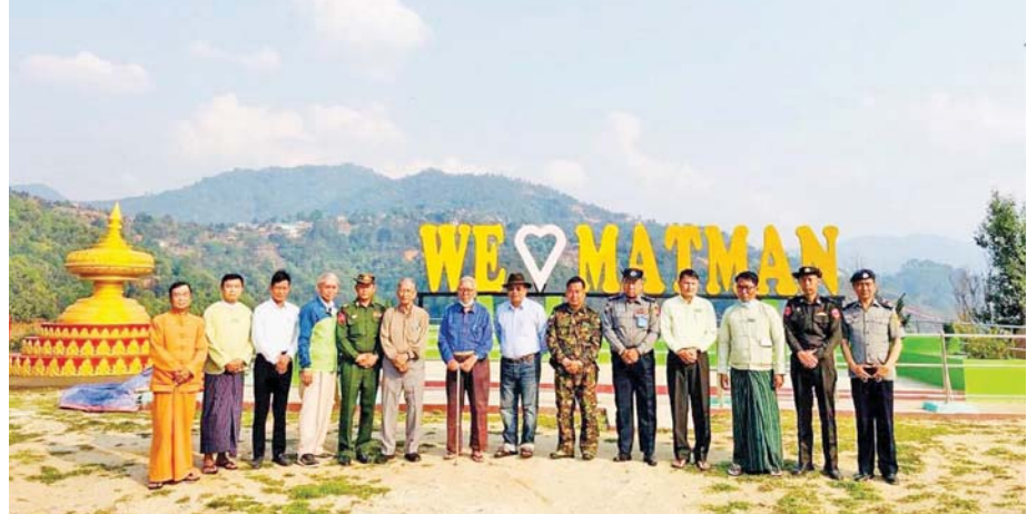
မှတ်နိုးကျေးရွာမှအပြန် မက်မန်းမြို့ဝင်ဆိုင်းဘုတ်အနီး မှတ်တမ်းတင်ဓာတ်ပုံရိုက်ကူးစဉ်။

သို့သော် အဘဦးညွန့်ဆွေက သံခမောက်ကုန်းသို့ အရောက် သူ၏တပည့်ကျော် ဗိုလ်မှူးသီဟသူရ မောင်ရီကို အထူးပင်သတိရသွားပုံပေါ်သည်။ သူထံမှ ဝမ်းနည်းစကားသံကို ဤကဲ့သို့ကြားလိုက်ရပါသည်- “ဒီကုန်းကို တိုက်ရင်းကျသွားတဲ့ ခမရ ၁၀၀ ယာယီခွဲမှူး(ဗိုလ်မှူး)၊ ဗိုလ်ကြီးမောင်ရီရဲ့ နာမည် အမှန်က မောင်ရီဗျူး၊ မောင်ရီမဟုတ်ဘူး၊ သူက ရခိုင် တိုင်းရင်းသား။ ဗိုလ်ချုပ်ကြီးထွန်းရီနဲ့ ကျွန်တော်တို့ ခမရ ၁၀၅ မှာ တပ်ခွဲမှူး၊ တပ်စုမှူးနဲ့ ရှိစဉ်ကတည်း က မောင်ရီနဲ့ဆုံခဲ့ကြတာ။ တပ်ကြပ်ကြီးဘဝ ကတည်းက သီဟဗလတဲ့တံဆိပ်ရထားပြီးသား၊ တိုက်ရည်ခိုက်ရည်ကောင်းတယ်။ ကောင်းမှန်းသိလို့ လည်း ပွင့် ၆၀၀၀ ကုန်းကို ခမရ ၁၀၁ တိုက်ရ ပြုရခက်နေတဲ့အချိန်မှာ သူ့ကိုစိတ်ကြိုက် လက်ရွေးစင်စစ်သည်တွေ ထုတ်နုတ်စုဖွဲ့ခိုင်းပြီး ပွင့် ၆၀၀၀ ရဲ့ ရှေ့ကာကုန်းဖြစ်တဲ့ ဒီသံခမောက် ကုန်းကို နောက်ဘက်လျှိုထဲကနေ ပတ်တိုက်ခိုင်း လိုက်တာ။ မောင်ရီနဲ့အဖွဲ့ ရန်သူ့ခြံစည်းရိုးနား ကပ်မိတာနဲ့ ကျွန်တော့်ကုန်း ပွင့် ၅၇၁၀ ကနေ ၁၀၅ မမ အမြောက်နဲ့ ပစ်ကူးပေးထားတယ်။ စာမျက်နှာ ၇ သို့ □