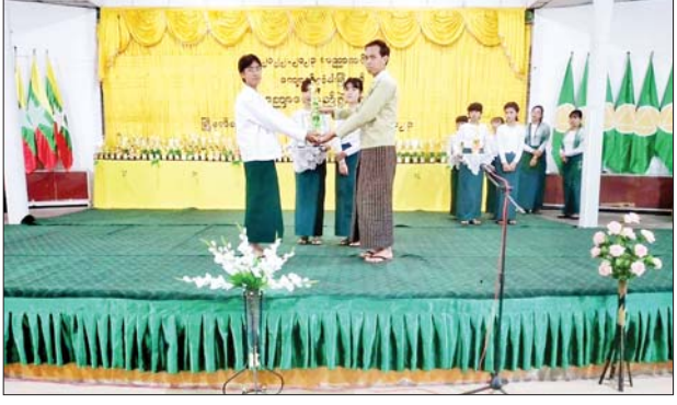
ဆက်လက်၍ မြို့နယ်အတွင်းရှိ သူများက ဆုများချီးမြှင့်ကြပြီး တိုင်း၊ ခရိုင်၊ မြို့နယ်အဆင့် မြို့နယ်အတွင်းရှိ ကျောင်းသား ဆုရကျောင်းများနှင့် ကျောင်းသား ကျောင်းသူ ၁၉၀ အား တာဝန်အဖွဲ့လိုက် အဆို၊ အကများဖြင့်

ပဲခူးတိုင်းဒေသကြီး ကျောက်တံခါးမြို့နယ်တွင် ၂၀၂၂-၂၀၂၃ ပညာသင်နှစ် မြို့နယ်အဆင့် ပညာရေးစုံညီပွဲတော်ကို ယမန်နေ့က မြို့နယ်စည်ပင်သာယာခန်းမ၌ ကျင်းပသည်။