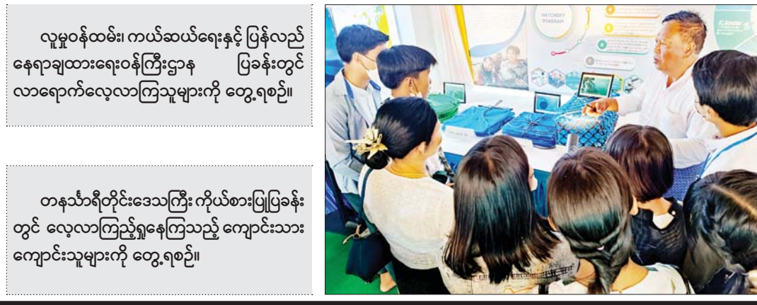
တနင်္သာရီတိုင်းဒေသကြီး ကိုယ်စားပြုပြခန်း တွင် လေ့လာကြည့်ရှုနေကြသည့် ကျောင်းသား ကျောင်းသူများကို တွေ့ရစဉ်။