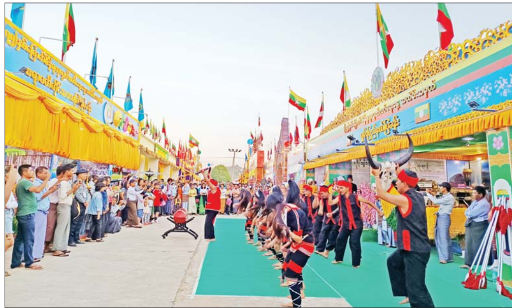
ရှမ်းပြည်နယ်ကိုယ်စားပြုပြခန်း၌ 'ဝ' ရိုးရာယဉ်ကျေးမှုအဖွဲ့၏ ကပြဖျော်ဖြေနေမှုအား ကြည့်ရှုအားပေးကြသူ များကို တွေ့ရစဉ်။