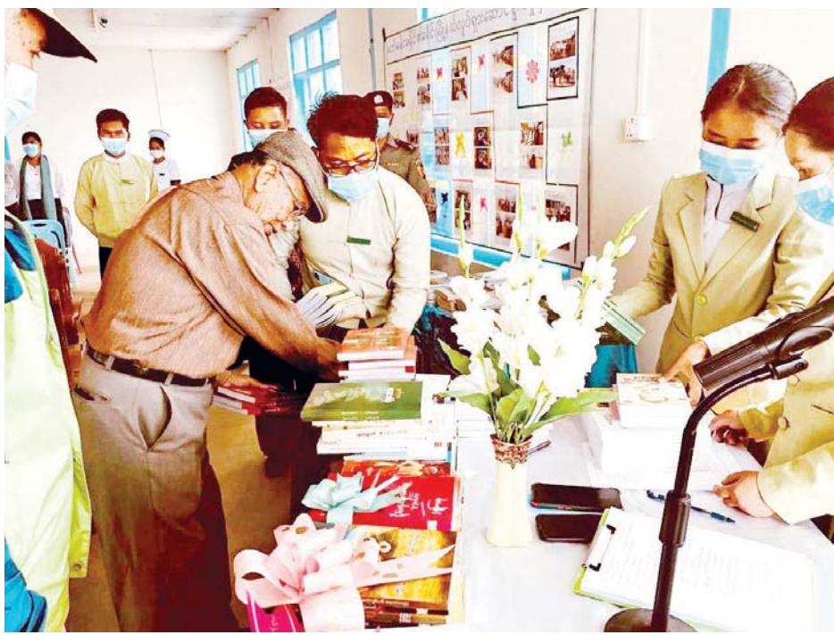
မက်မန်းမြို့နယ် ပြန်/ဆက်ရုံး၌ စာအုပ်များ လှူဒါန်းစဉ်။