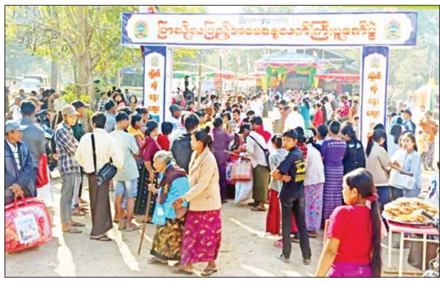
သီချင်းဆိုပြိုင်ပွဲ၊ စာစီစာကုံး၊ ပန်းချီပြိုင်ပွဲနှင့် ကဗျာပြိုင်ပွဲတို့တွင် ဆုရရှိသူများကို ဆုများပေးအပ်သည်။ လှိုင်သန်းတင့်(ရမည်းသင်း)

မန္တလေးတိုင်းဒေသကြီး ရမည်းသင်းမြို့နယ် မြို့လှအုပ်စု မြို့လှကျေးရွာတွင် သက်ကြီးပူဇော်ပွဲကို ယနေ့နံနက်ပိုင်းက မြို့လှကျေးရွာ ဒက္ခိဏရာမတောင်ကျောင်းတိုက်ပရိသတ်အတွင်း၌ ကျင်းပသည်။