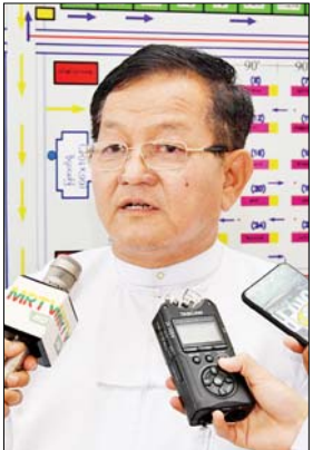
ဦးမြင့်စိုး