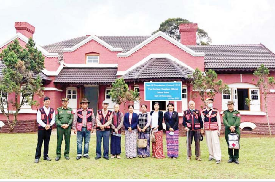
လွယ်မွေမြို့ရှိ နှစ် ၁၀၀ စံအိမ်ရွှေ့ မှတ်တမ်းတင်ဓာတ်ပုံရိုက်ကူးစဉ်။

“၁၉၇၅ ခုနှစ်မှာ ဗကပ ဗဟိုကော်မတီကို ပြန်လည်ဖွဲ့စည်းပြီး စစ်ရေးလှုပ်ရှားမှုတွေ ပိုလုပ် လာကြတယ်။ ၇၅၁၀ စီမံကိန်းပေါ်လာတယ်။ တိုက်ခိုက်ရေးအင်အား ၁၂၀၀၀ လောက်ထိ ရှိလာ တဲ့ ဗကပဟာ ကိုးကန့်ဒေသနဲ့ “ဝ”ဒေသတွေကို လွှမ်းမိုးခြယ်လှယ်လာခဲ့တယ်။ ၁၉၇၉ ခုနှစ်မှာ ဗကပဗဟိုကို ပန်ဆန်းကို ရွှေ့လာပြီး အသံလွှင့်ရုံ