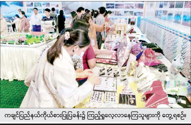
ကချင်ပြည်နယ်ကိုယ်စားပြုပြခန်း၌ ကြည့်ရှုလေ့လာနေကြသူများကို တွေ့ရစဉ်။