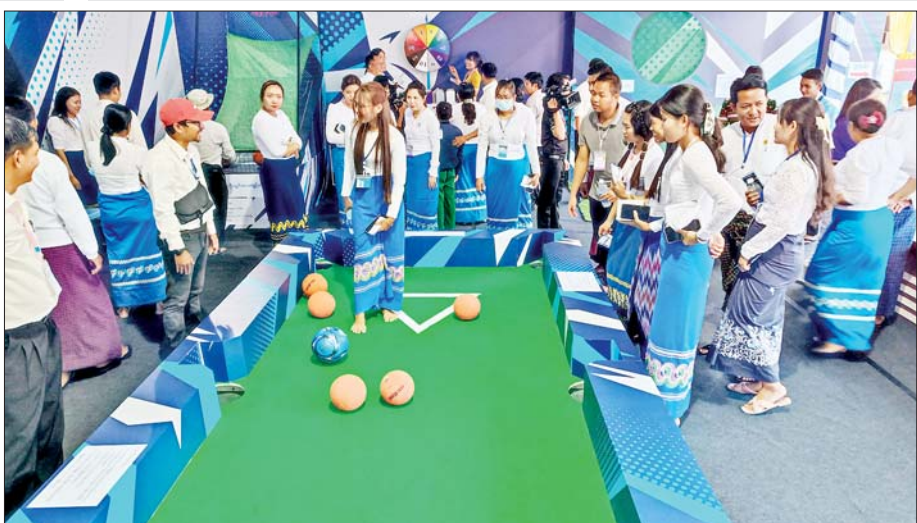
အားကစားနှင့် လူငယ်ရေးရာဝန်ကြီးဌာန ကိုယ်စားပြုပြခန်းတွင် ဖျော်ရွှင်စွာဂိမ်းကစားနေကြသူ များကို တွေ့ရစဉ်။