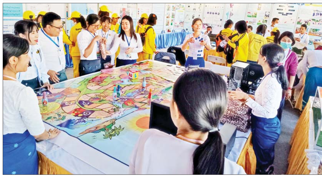
လူမှုဝန်ထမ်း၊ ကယ်ဆယ်ရေးနှင့် ပြန်လည် နေရာချထားရေးဝန်ကြီးဌာန ပြခန်းတွင် လာရောက်လေ့လာကြည့်ရှုသူများကို တွေ့ရစဉ်။