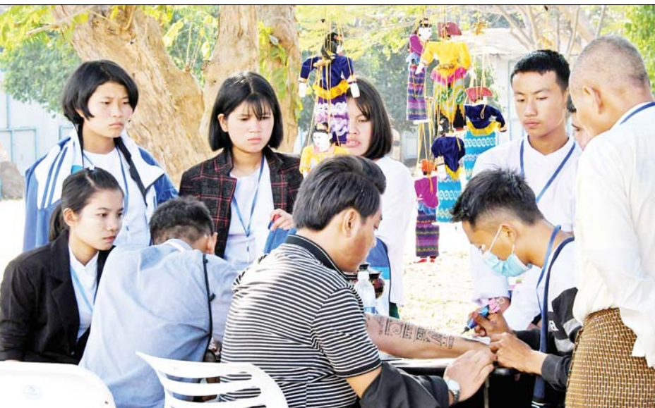
(၇၅)နှစ်မြောက် စိန်ရတုလွတ်လပ်ရေးနေ့အထိမ်းအမှတ်ပြခန်းများကို လာရောက်လေ့လာကြည့်ရှုသူများဖြင့် စည်ကားနေသည်ကို တွေ့ရစဉ်။