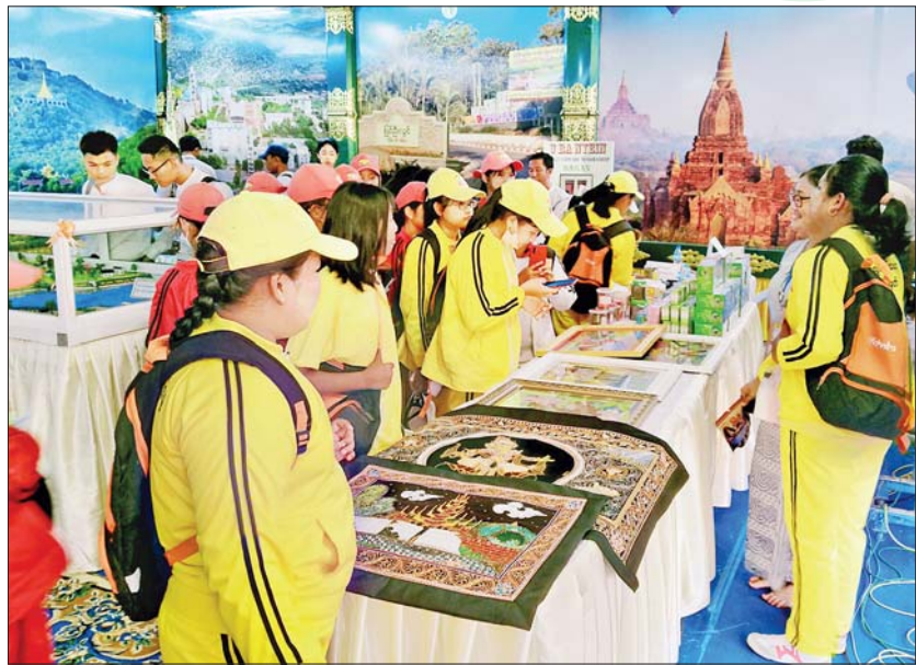
မန္တလေးတိုင်းဒေသကြီးကိုယ်စားပြုပြခန်းတွင် လာရောက်လေ့လာကြည့်ရှုကြသူများကို တွေ့ရစဉ်။