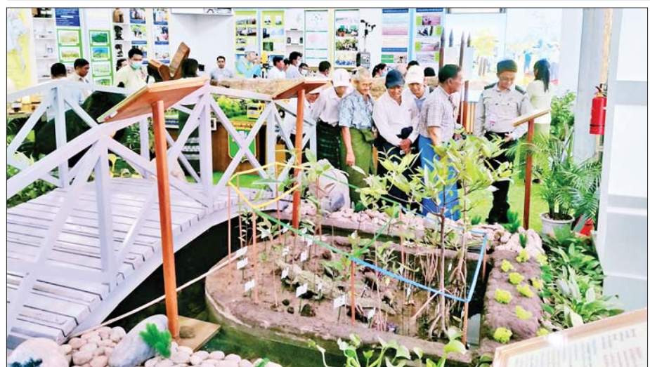
သယံဇာတနှင့် သဘာဝပတ်ဝန်းကျင်ထိန်းသိမ်းရေးဝန်ကြီးဌာန ကိုယ်စားပြုပြခန်း၌ ကြည့်ရှုလေ့လာ နေကြသူများကို တွေ့ရစဉ်။