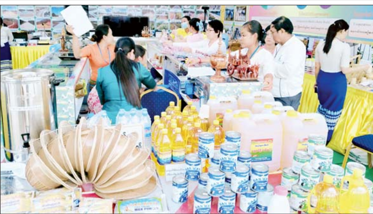
သမဝါယမနှင့် ကျေးလက်ဖွံ့ဖြိုးရေးဝန်ကြီးဌာန ကိုယ်စားပြုပြခန်း၌ ကြည့်ရှု လေ့လာနေကြသူများကို တွေ့ရစဉ်။