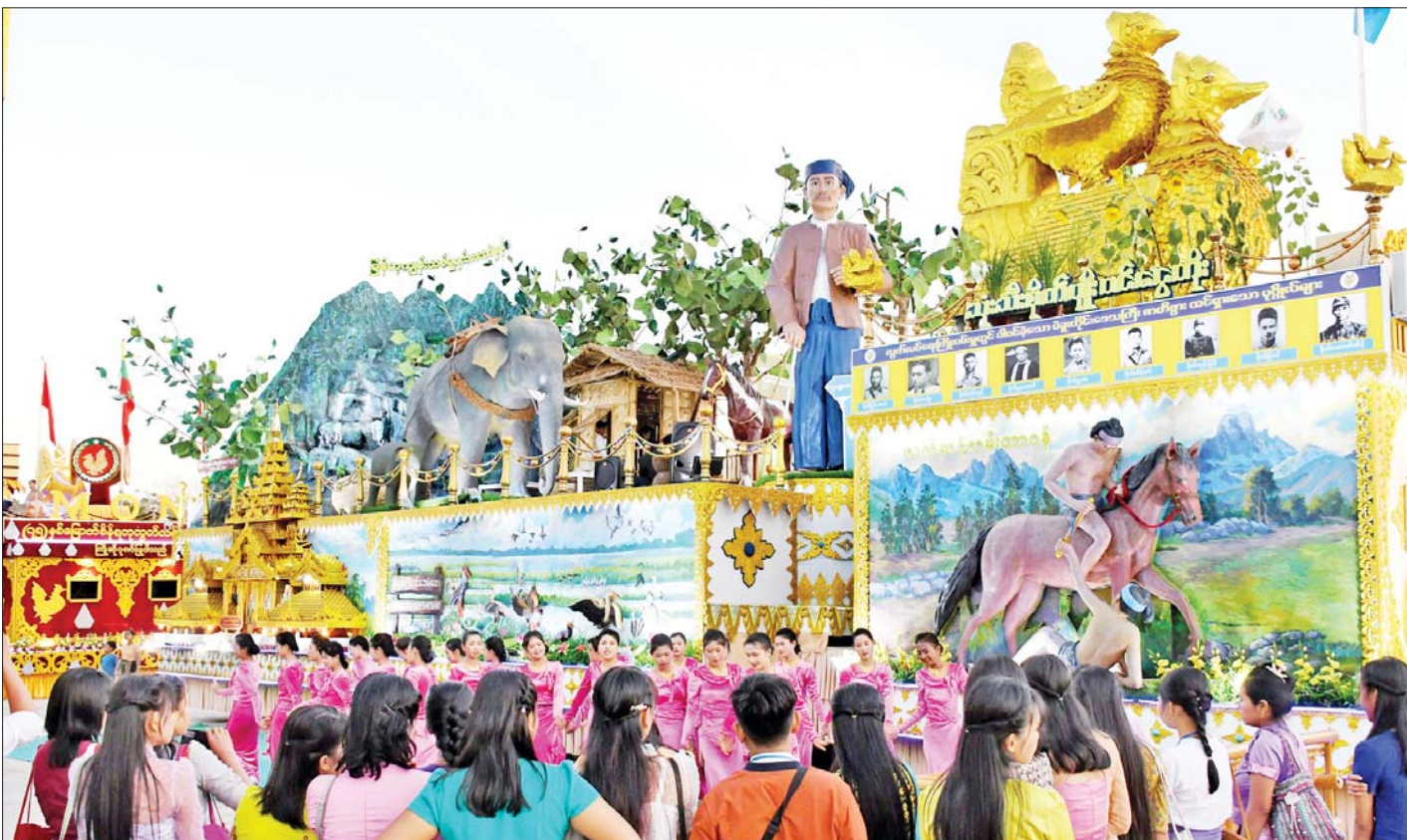
(၇၅)နှစ်မြောက် စိန်ရတုလွတ်လပ်ရေးနေ့အထိမ်းအမှတ်ပြခန်းများ၊ ဂုဏ်ပြုယာဉ်များနှင့် ရိုးရာယဉ်ကျေးမှုအကအဖွဲ့များ၏ ဖော်ပြတင်ဆက်မှုကို လာရောက်လေ့လာကြည့်ရှုသူများအား တွေ့ရစဉ်။

ထို့ပြင် တိုင်းရင်းသားရိုးရာဝတ်စုံများနှင့် အထိမ်းအမှတ်ပစ္စည်းများကို ပြည်သူများ အမြတ် တနိုးတနိုးထား ဝယ်ယူဝတ်ဆင်နိုင်စေရန်အတွက် လည်း ရိုးရာဝတ်စုံများနှင့် အထိမ်းအမှတ်ပစ္စည်းများ ကို ဈေးနှုန်းချိုသာစွာဖြင့် ရောင်းချပေးလျက်ရှိရာ