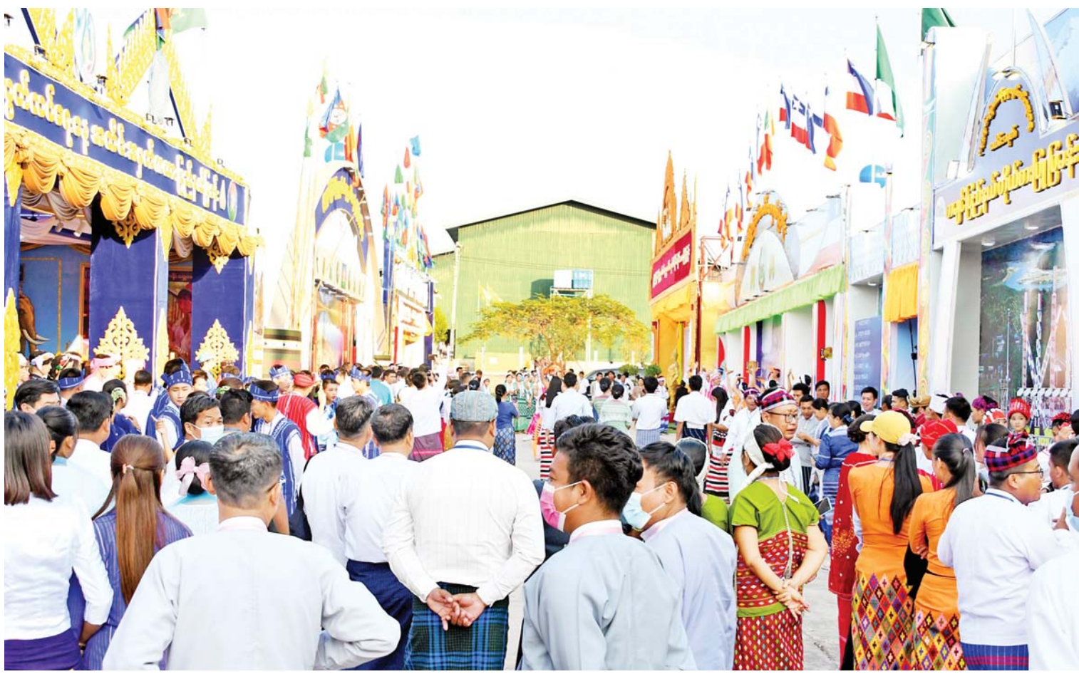
(၇၅)နှစ်မြောက် စိန်ရတုလွတ်လပ်ရေးနေ့အထိမ်းအမှတ်ပြခန်းများ၊ တိုင်းရင်းသားရိုးရာအစားအစာပြခန်းများနှင့် ဂုဏ်ပြုယာဉ်များကို နေပြည်တော် ဥပျာတသန္တီစေတီတော်ရှေ့ တပေါင်းကွင်း၌ ဒုတိယနေ့အဖြစ် ခင်းကျင်းပြသထားရာ လာရောက်လေ့လာကြည့်ရှုသူများဖြင့် စည်ကားလျက်ရှိသည်ကို တွေ့ရစဉ်။

ဒိနှစ်မှာတော့ တိုင်းဒေသကြီးနဲ့ ပြည်နယ်အသီးသီးက ရိုးရာ အစားအစာတွေကို အခုလို စုံစုံလင်လင် ခမ်းခမ်းနားနားနဲ့ ရောင်းချပြီး ပြည်သူလူထုကို လာရောက် လေ့လာစားသောက် နိုင်အောင်၊ အခြားအစားအသောက် တွေ၊ အဝတ်အထည်တွေကိုလည်း သက်သာတဲ့ဈေးနှုန်းနဲ့ ရောင်းချနေပါတယ် စာမျက်နှာ » ၁၀