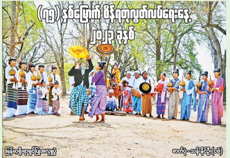
မြန်မာ့ရိုးရာရှင်ပြုအလှူပွဲ (ဘယ်) - သန်းဦး(ဘယ်)

[ဗိုလ်ချုပ်အောင်ဆန်း ၁၉၄၇ ခုနှစ် ဇွန်လဆန်း၌ ဗမာနိုင်ငံလုံးဆိုင်ရာ မီးသတ်အစည်းအရုံးကြီးတွင် ပြောကြားသော မိန့်ခွန်းမှ ကောက်နုတ်ချက်]