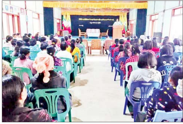
တောင်ပိုင်းတိုင်းစစ်ဌာနချုပ်အနေဖြင့် အားကစားပြိုင်ပွဲတွင် ထူးချွန်ဆုရရှိခဲ့သည့် တောင်ပိုင်းတိုင်းစစ်ဌာနချုပ် ကိုယ်စားပြု အားကစားသမားများအား ဂုဏ်ပြုချီးမြှင့်ပွဲကျင်းပ

ပြီး ဆုရရှိခဲ့သည့် ပြိုင်ပွဲဝင် အားကစားသမားများကို ဂုဏ်ပြုဆုငွေများ ပေးအပ်သည်။ ထို့နောက် တိုင်းမှူး က ဆုရရှိခဲ့သည့် အားကစားသမားများကို ရင်းရင်း နှီးနှေးလိုက်လံနှုတ်ဆက်ပြီး ဆုရရှိခဲ့သည့် အားကစား သမားများအား ဂုဏ်ပြုနေ့လယ်စာဖြင့် တည်ခင်း ဧည့်ခံသည်။ အဆိုပါ အားကစားပြိုင်ပွဲတွင် တောင်ပိုင်းတိုင်း စစ်ဌာနချုပ်အနေဖြင့် အားကစားနည်း ၁၀ မျိုးတွင် ရွှေတံဆိပ် ၃၂ ဆု၊ ငွေတံဆိပ် ၂၄ ဆုနှင့် ကြေးတံဆိပ် ၃၂ ဆု ဆွတ်ခူးရရှိခဲ့ကြောင်း သိရသည်။ သတင်းစဉ်