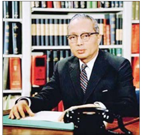
ကုလသမဂ္ဂအတွင်းရေးမှူးချုပ်ဟောင်း ဦးသန့်

လွတ်လပ်ရေးရပြီး ၁၀ နှစ်သို့ ရောက်သော် ဖဆပလအဖွဲ့၏ တတိယအကြိမ် မြန်မာနိုင်ငံလုံး