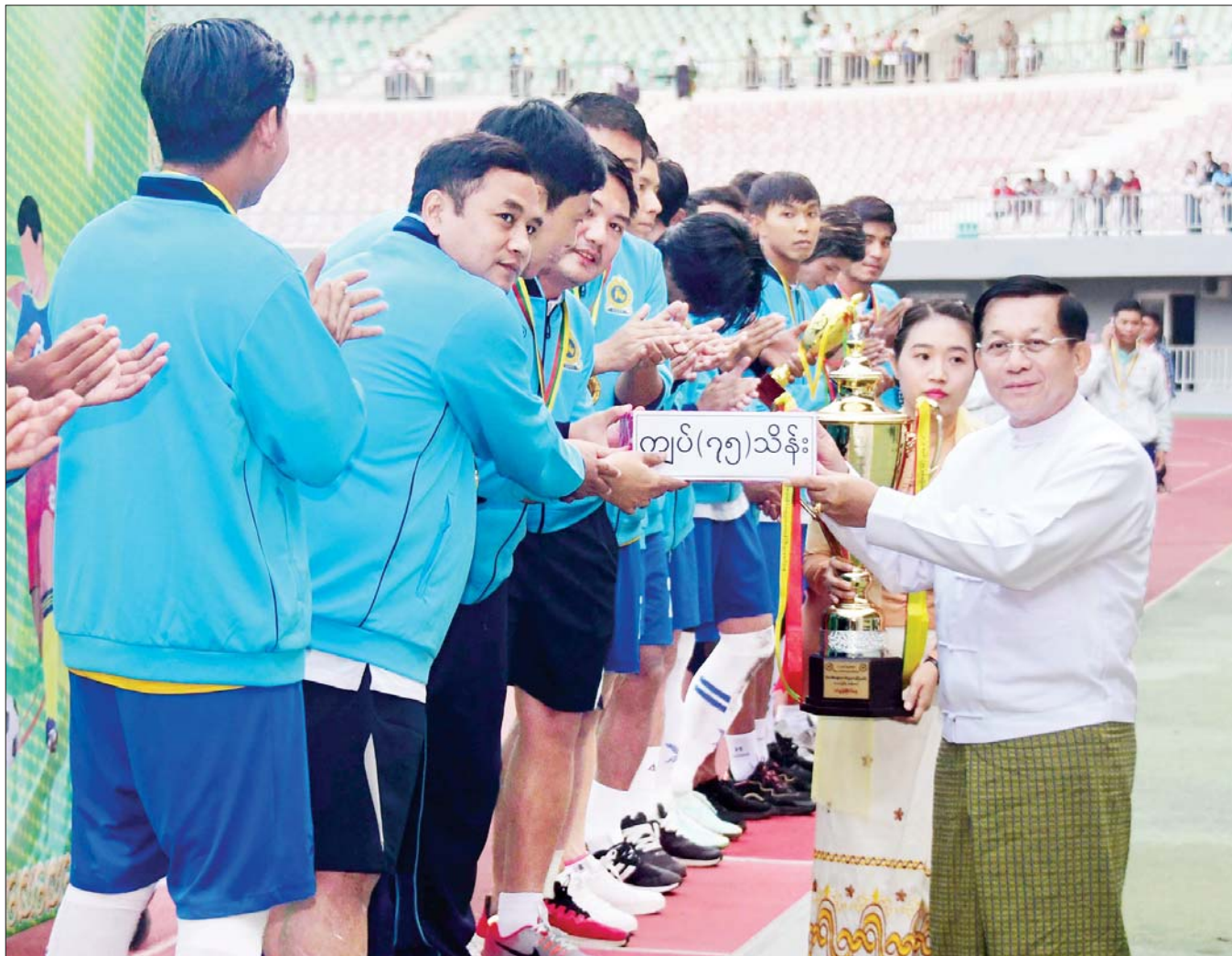
နိုင်ငံတော်စီမံအုပ်ချုပ်ရေးကောင်စီဥက္ကဋ္ဌ နိုင်ငံတော် ဝန်ကြီးချုပ် ဗိုလ်ချုပ်မှူးကြီးမင်းအောင်လှိုင် ပထမဆုံးရရှိ သည့် စီမံကိန်းနှင့်ဘဏ္ဍာရေးဝန်ကြီးဌာနအသင်းအား ဂုဏ်ပြုချီးမြှင့်ငွေ ပေးအပ်ချီးမြှင့်စဉ်။

ယနေ့ ဖတ်စရာ နိုင်ငံတော်စီမံအုပ်ချုပ်ရေးကောင်စီဝင်များ (၇၅)နှစ်မြောက် စိန်ရတုလွတ်လပ်ရေးနေ့ အထိမ်းအမှတ် နိုင်ငံတော်စီမံ အုပ်ချုပ်ရေးကောင်စီဥက္ကဋ္ဌဖလား ပြည်နယ်နှင့်တိုင်းဒေသ ကြီး(အလွတ်တန်းဖိတ်ခေါ်) မြန်မာ့သိုင်းပြိုင်ပွဲ ဖွင့်ပွဲအခမ်း အနား တက်ရောက် စာမျက်နှာ » ၆