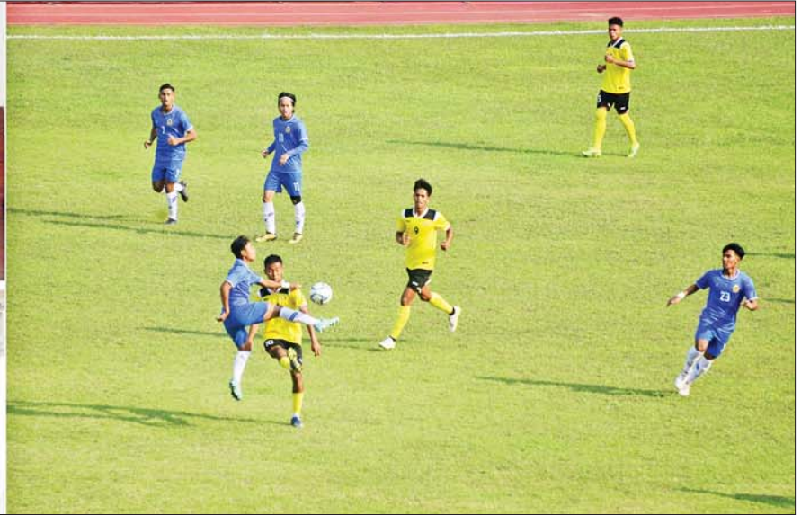
နိုင်ငံတော်စီမံအုပ်ချုပ်ရေးကောင်စီဥက္ကဋ္ဌ နိုင်ငံတော်ဝန်ကြီးချုပ် ဗိုလ်ချုပ်မှူးကြီးမင်းအောင်လှိုင်နှင့် တက်ရောက်လာကြသူများ စိန်ရတုလွတ်လပ်ရေးနေ့အထိမ်းအမှတ် နိုင်ငံတော်စီမံအုပ်ချုပ်ရေးကောင်စီ ဥက္ကဋ္ဌဖလား ဝန်ကြီးဌာနပေါင်းစုံ(အမျိုးသား) ဘောလုံးပြိုင်ပွဲဗိုလ်လုပွဲယှဉ်ပြိုင်ကစားမှုအား ကြည့်ရှုအားပေးစဉ်။