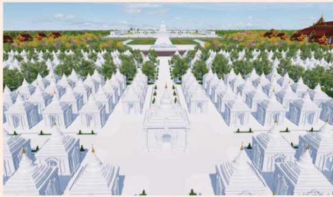
ကျောက်စာရုံစေတီ(၁၂ x ၁၂x ၁၈)ပေ ၁ ဆူ တန်ဖိုး-၂၇၉ သိန်း