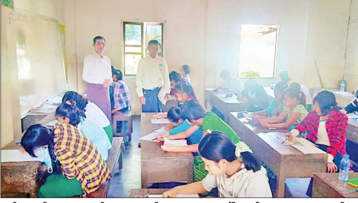
လွန်ကျောင်းများမှကျောင်းသားကျောင်းသူ အား မြို့နယ်စာရေးဆရာအသင်းက စုစုပေါင်း ၆၉ ဦး လာရောက်ဖြေဆို ပြိုင်ပွဲ ဝင်ခဲ့သည်။ ထို့နောက် လာရောက်ဖြေဆို ကြောင်း သိရသည်။ မြို့နယ်(ပြန်/ဆက်)

ပန်းတောင်း ဒီဇင်ဘာ ၂၄ ပဲခူးတိုင်းဒေသကြီး ပြည်ခရိုင် ပန်းတောင်းမြို့နယ်၌ (၇၅)နှစ်မြောက် စိန်ရတုလွတ်လပ်ရေးနေ့အထိမ်းအမှတ်အကြို ကဗျာ၊ စာစီစာကုံးနှင့် ဉာဏ်စမ်းပဟေဠိဖြေဆိုပြိုင်ပွဲကို ဝန်လိုရပ်ကွက် မြို့မစာကြည့်တိုက်၌ ဒီဇင်ဘာ ၂၂ ရက် နံနက်ပိုင်းက ကျင်းပသည်။ အဆိုပါ ပြိုင်ပွဲများတွင် ပန်းတောင်းမြို့နယ် စာရေးဆရာအသင်းနှင့် မြို့မစာကြည့်တိုက် ကြီးကြပ်မှုကော်မတီတို့ ကြိုးပမ်းကျင်းပသော စာပေပြိုင်ပွဲဖြစ်သည့် ကဗျာ၊ စာစီစာကုံးနှင့် ဉာဏ်စမ်းပဟေဠိဖြေဆိုပြိုင်ပွဲသို့ ပန်းတောင်းမြို့နယ် အတွင်းရှိ အထက၊ အလကနှင့် မူလတန်း