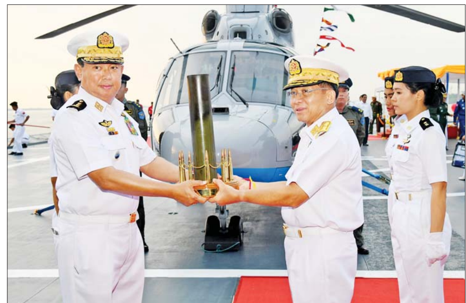
နိုင်ငံတော်စီမံအုပ်ချုပ်ရေးကောင်စီဥက္ကဋ္ဌ တပ်မတော်ကာကွယ်ရေးဦးစီးချုပ် ဗိုလ်ချုပ်မှူးကြီး မင်းအောင်လှိုင်ထံသို့ ကာကွယ်ရေးဦးစီးချုပ်(ရေ) ဗိုလ်ချုပ်ကြီးမိုးအောင်က ဂုဏ်ပြုအလေးပြု ပစ်ခတ်ထား သည့် ပထမဆုံး အမြောက်ကျည်ဆန်ခွံအား အထိမ်းအမှတ်လက်ဆောင်အဖြစ် ဂါရဝပြုပေးအပ်စဉ်။

နိုင်ငံတော်၏ အချုပ်အခြာ အာဏာတည်တံ့ခိုင်မြဲရေးအတွက် အကောင်းဆုံး အာမခံချက်မှာ စွမ်းရည်ထက်မြက်သည့် ကာကွယ် ရေးအင်အားစု တည်ဆောက် ပိုင်ဆိုင်ခြင်းပင် ဖြစ်ကြောင်း၊ တပ်မတော်(ရေ)ကို တည်ဆောက် ရာတွင် အဆင့်လိုက် မျှော်မှန်း ချက်များ ချမှတ်ဆောင်ရွက်လျက် ရှိရာ ပထမအဆင့်ဖြစ်သည့် မြန်မာ့ပင်လယ်ပြင် သီးသန့် စီးပွားရေးဇုန်အထိ အပြည့်အဝ ကာကွယ်နိုင်သည့် သုံးဖက်မြင် စစ်ဆင်နိုင်စွမ်းရှိသော တိုက်ပွဲဝင် အသင့်ရေတပ်(Three Dimensional Combat Ready Navy) အဆင့်သို့ ရောက်ရှိနေပြီဖြစ် ကြောင်း၊ ဒုတိယအဆင့်အနေဖြင့် အိန္ဒိယသမုဒ္ဒရာအတွင်းရှိ မြန်မာ့ ပင်လယ်ပြင်နှင့် ဆက်စပ်ပင်လယ် ပြင်များသို့ အင်အားဖြန့်ဖြူး ကိုင်စွမ်းရှိသည့်ရေတပ် (Adjacent Force Projection Navy/ Regional Navy)အဖြစ် တည်ဆောက် လျက်ရှိကြောင်း၊ ရေရှည်မျှော်မှန်း ချက်အနေဖြင့် မိမိအကျိုးစီးပွား များ ဆက်စပ်တည်ရှိရာ ရေပြာသို့ အင်အားပို့လွှတ်နိုင်သည့် ရေတပ် (Blue Water Navy Ambition) အဖြစ် မျှော်မှန်းတည်ဆောက် သွားမည်ဖြစ်ကြောင်း။ ရေယာဉ်များ တည်ဆောက် ဖြည့်တင်းခြင်း လုပ်ငန်းများ ဆောင်ရွက်နိုင်ရန်အတွက် ရေတပ် သင်တန်းကျင်း ဋ္ဌာနချုပ်ကို အဆင့်ဆင့် အဆင့်မြှင့်တင် ဆောင်ရွက်ခဲ့ကြောင်း၊ ရေယာဉ် တည်ဆောက်မှု အတွေ့အကြုံ