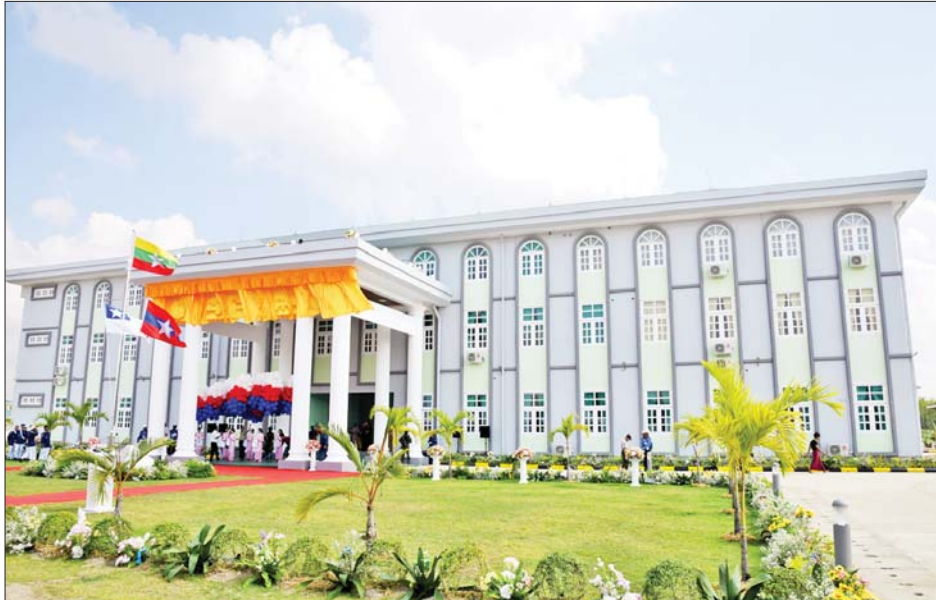
မြန်မာနိုင်ငံကမ်းခြေစောင့်တပ်ဖွဲ့ ကွပ်ကဲမှုဌာနချုပ်ရုံး အဆောက်အအုံကို တွေ့ရစဉ်။