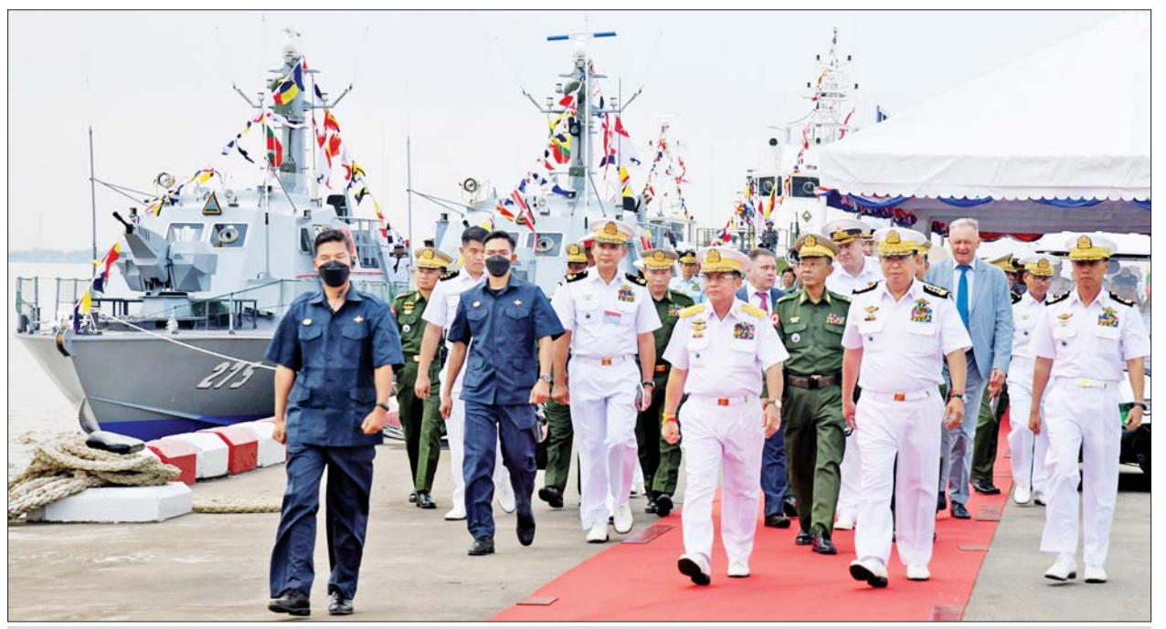
နိုင်ငံတော်စီမံအုပ်ချုပ်ရေးကောင်စီဥက္ကဋ္ဌ တပ်မတော်ကာကွယ်ရေးဦးစီးချုပ် ဗိုလ်ချုပ်မှူးကြီးမင်းအောင်လှိုင်နှင့် အဖွဲ့ဝင်များ တပ်တော်ဝင် စစ်ရေယာဉ်များအား လှည့်လည်ကြည့်ရှုကြစဉ်။

ကြီးများနှင့် ဇနီးများ၊ ရန်ကုန် တိုင်းဒေသကြီး ဝန်ကြီးချုပ်၊ ရန်ကုန်တိုင်းစစ်ဌာနချုပ်တိုင်းမှူး၊ ရေတပ်စခန်းဌာနချုပ်မှူးများနှင့် တပ်မတော်(ရေ)မှ အရာရှိ စစ်သည် များ၊ မိသားစုများ၊ ဖိတ်ကြားထား သည့် ဧည့်သည်တော်ကြီးများ တက်ရောက်ကြသည်။ ရှင်းလင်းတင်ပြ အခမ်းအနား အစီအစဉ်အရ စစ်ဦးစီးအရာရှိချုပ်(ရေ) ဒုတိယ ဗိုလ်ချုပ်ကြီး ဇွဲဝင်းမြင့်က တပ်တော်ဝင်စစ်ရေယာဉ်ဆိုင်ရာ အချက်အလက်များအား ရှင်းလင်း တင်ပြသည်။ ထို့နောက် ရေတပ် သင်တန်းဌာနချုပ် ဌာနချုပ် မှူးက ဗျူဟာစစ်ရေယာဉ်စုမှူးထံ စစ်ရေယာဉ်များနှင့် ပတ်သက် သော စာရွက်စာတမ်းများကို လည်းကောင်း၊ ပမ္မဝတီ ရေတပ် စခန်းဌာနချုပ်မှူးက မြန်မာနိုင်ငံ ကမ်းခြေစောင့်တပ်ဖွဲ့ ညွှန်ကြား ရေးမှူးချုပ်ထံ တပ်မတော်(ရေ)မှ လွှဲပြောင်းပေးအပ်သည့် စစ်ရေ ယာဉ်နှင့် ပတ်သက်သည့် စာရွက် စာတမ်းများကို လည်းကောင်း လွှဲပြောင်းပေးအပ်ကြသည်။ ယင်းနောက် နိုင်ငံတော် စီမံအုပ်ချုပ်ရေးကောင်စီ ဥက္ကဋ္ဌ တပ်မတော်ကာကွယ်ရေးဦးစီးချုပ် ထံသို့ ကာကွယ်ရေးဦးစီးချုပ်(ရေ) က တပ်တော်ဝင်အခမ်းအနား အထိမ်းအမှတ်စစ်ရေယာဉ်ပုံစံငယ် များနှင့် (၆၅)နှစ်မြောက်တပ်မတော် (ရေ)နေ့မှ (၇၅)နှစ်မြောက် စိန်ရတု တပ်မတော်(ရေ)နေ့အထိ ၁၁ နှစ်တာ ကာလအတွင်း တပ်တော်ဝင်၊ တိုးတက်ဖွဲ့စည်း ခဲ့သည့် စစ်ရေယာဉ်များ၏ အထိမ်းအမှတ်တံဆိပ်ကို ဂါရဝပြု ပေးအပ်သည်။ ဆက်လက်၍ စစ်ဦးစီးအရာရှိ ချုပ်(ရေ)က တပ်တော်ဝင် စစ်ရေ ယာဉ်များအဖြစ် ကြေညာခြင်း၊ နိုင်ငံတော်အလံ လွှင့်တင်ခြင်း၊