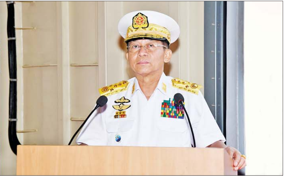
နိုင်ငံတော်စီမံအုပ်ချုပ်ရေးကောင်စီဥက္ကဋ္ဌ တပ်မတော်ကာကွယ်ရေးဦးစီးချုပ် ဗိုလ်ချုပ်မှူးကြီးမင်းအောင်လှိုင် (၇၅)နှစ်မြောက် စိန်ရတုတပ်မတော်(ရေ)နေ့အထိမ်းအမှတ် စစ်ရေယာဉ်များတပ်တော်ဝင်ခြင်း နှင့် မြန်မာနိုင်ငံကမ်းခြေစောင့်တပ်ဖွဲ့သို့ လွှဲပြောင်းတပ်တော်ဝင်ခြင်း အခမ်းအနားတွင် ဂုဏ်ပြုအမှာစကားပြောကြားစဉ်။