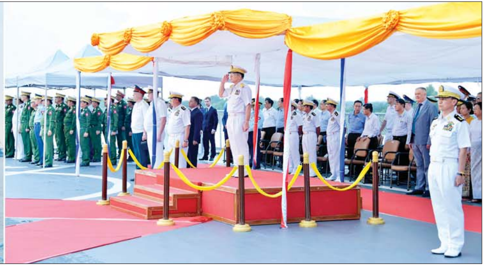
နိုင်ငံတော်စီမံအုပ်ချုပ်ရေးကောင်စီဥက္ကဋ္ဌ တပ်မတော်ကာကွယ်ရေးဦးစီးချုပ် ဗိုလ်ချုပ်မှူးကြီးမင်းအောင်လှိုင် စစ်ရေယာဉ်(မုတ္တမ)ပေါ်ရှိ အလေးပြုခံစင်မြင့်မှနေ၍ ဂုဏ်ပြုတပ်ဖွဲ့၏ အလေးပြုခြင်းကိုခံယူစဉ်။

»» စာမျက်နှာ ၆ မှ လေ့ကျင့်သင်ကြား ပေးနိုင်ခဲ့ပြီး ဖြစ်ကြောင်း၊ ရေတပ်သားများ လေ့ကျင့်ရေးဆိုင်ရာ တိုးတက် မြင့်မားစေရန်အတွက် လေ့ကျင့် ရေး သင်ထောက်ကူ Simulator နှင့် Trainer များ ဖြည့်ဆည်းပေး ခြင်း၊ လေ့ကျင့်ရေးအထောက် အကူပြု အဆောက်အအုံများ တိုးချဲ့တည်ဆောက်ပေးခြင်းတို့ ကို ဆောင်ရွက်ပေးနိုင်ခဲ့ကြောင်း၊ အဖွဲ့လိုက်စွမ်းရည် တိုးတက် စေရေးအတွက် ကြည်း၊ ရေ၊ လေ ပူးပေါင်းစစ်ဆင်ရေးလေ့ကျင့်ခန်း များ၊ Sea Shield လေ့ကျင့်ခန်းများ၊ အိမ်နီးချင်းနိုင်ငံများနှင့် ပူးတွဲ ကင်းလှည့်မှု လေ့ကျင့်ခန်းများ၊ ပြည်ပနိုင်ငံများနှင့် ရေကြောင်း မှု လေ့ကျင့်ခန်းများကို နှစ်စဉ်ပုံမှန် ဆောင်ရွက်စေလျက်ရှိကြောင်း၊ ထိုသို့ ဆောင်ရွက်စေခြင်းဖြင့် နိုင်ငံတကာ ရေတပ်များနှင့် ချစ်ကြည်ရင်းနှီးမှု ပိုမိုတိုးတက် စေသကဲ့သို့ တပ်ဖွဲ့အချင်းချင်း အတွေ့အကြုံများ ဖလှယ်နိုင်ခြင်း၊ အပြန်အလှန် ယုံကြည်မှုရှိစေနိုင် ခြင်း၊ ပင်လယ်ပြင် တာဝန် ထမ်းဆောင်နိုင်မှု အတွေ့အကြုံ၊ သမုဒ္ဒရာဖြတ်ကျော် မောင်းနှင် ရသည့် အတွေ့အကြုံများ ရရှိနိုင် ခြင်း စသည့်အကျိုးကျေးဇူးများကို