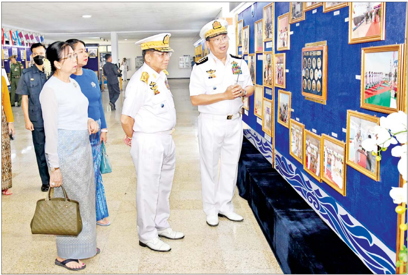
နိုင်ငံတော်စီမံအုပ်ချုပ်ရေးကောင်စီဥက္ကဋ္ဌ တပ်မတော်ကာကွယ်ရေးဦးစီးချုပ် ဗိုလ်ချုပ်မှူးကြီး မင်းအောင်လှိုင်နှင့် ဇနီး ဒေါ်ကြူကြူလှ (၇၅)နှစ်မြောက် စိန်ရတုတပ်မတော်(ရေ)နှစ်ပတ်လည်နေ့ အထိမ်းအမှတ်အခမ်းအနားတွင် ခင်းကျင်းပြသထားသည့် ပြခန်းများကို ကြည့်ရှုစဉ်။

မိမိတို့နိုင်ငံ ကုန်းမြေဧရိယာ၏ တစ်ဝက်ကျော်ရှိ သည့် ရေပြင်ဧရိယာသည် စတုရန်းရေမိုင်ပေါင်း ၁၄၄၉၁၂ မိုင်ရှိပြီး ရေပေါ်ရေအောက် အဖိုးတန် သယံဇာတများ၊ ရေသတ္တဝါများ နားခိုကျက်စားရာ နေရာများနှင့် ကျွန်းကြီး၊ ကျွန်းငယ်များ၊ ပင်လယ် ကမ်းရိုးတန်း သဘာဝအလှတရားများစွာတို့နှင့် ပြည့်နှက်နေကြောင်း၊ နိုင်ငံတော်၏ စီးပွားရေးဖွံ့ဖြိုး တိုးတက်စေရေးအတွက် ပင်လယ်ပြင်မှ အဓိက ဖော်ဆောင်ပေးနေသည်ကို တွေ့ရမည်ဖြစ်ကြောင်း၊ မြန်မာ့ရေပြင်သည် ဘင်္ဂလားပင်လယ်အော်၊ ကပ္ပလီ ပင်လယ်ပြင်တို့ကို ပိုင်ဆိုင်ထားရှိပြီး ကုန်သွယ် ရေလမ်းကြောင်းများ ထိန်းချုပ်နေရာ(Choke Point) များကို စိုးမိုးချုပ်ကိုင်ထားနိုင်သော သဘာဝက ပေးသည့် ထူးခြားသောလက်ဆောင်ကောင်းများ ရရှိထားခဲ့သည်ကို တွေ့မြင်ရကြောင်း၊ ထို့အပြင် အမေရိကန်၏ Indo-Pacific Strategy၊ တရုတ်၏ Two Ocean Strategy၊ အိန္ဒိယ၏ Act East Policy တို့ ဆုံမှတ်နေရာဖြစ်နေသည်ကိုလည်း သတိပြုဖွယ် တွေ့ရှိရမည်ဖြစ်ကြောင်း၊ ပင်လယ်ပြင်ကို အကျိုးရှိ စွာ အသုံးချနိုင်ရန်ရည်ရွယ်ပြီး ပင်လယ်ပြင်နှင့် ဆက်စပ်နေသည့် နိုင်ငံရေး၊ စီးပွားရေး၊ စစ်ရေး အခြေအနေများကို သုံးသပ်ကာ မြန်မာ့ရေကြောင်း အကျိုးစီးပွားများ ကာကွယ်ရန်တပ်မတော်(ရေ)ကို