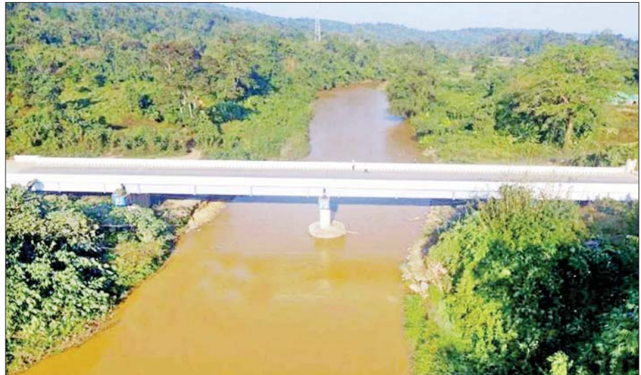
မန္တလေး-လားရှိုး-ဗန်းမော်-မြစ်ကြီးနားလမ်းပေါ်ရှိ မလီယန်တံတား (ပေ ၃၂၀) ကို တွေ့ရစဉ်။