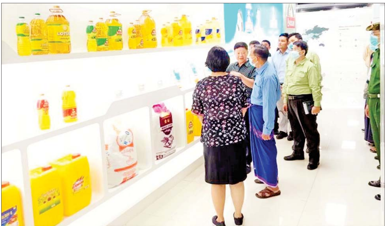
ထုတ်ကုန်လုပ်ငန်းများနှင့် ဆန်နှင့် ဆန်ဆက်စပ်ထုတ်ကုန်များကို ခတ်အားပေးစက်ရုံမှ လျှပ်စစ်ဓာတ်အား ထုတ်လုပ်၍ လုပ်ငန်းများ ဆောင်ရွက်လျက်ရှိရာ ထိုလုပ်ငန်းများအတွက် စပါးခွဲသုံးလျှပ်စစ် ခေတ်မီရွက်နေခြင်းဖြစ်သည်။ သတင်းစဉ်

Wilmar Myanmar ကုမ္ပဏီအနေဖြင့် သီလဝါဆိပ်ကမ်းတွင် ခေတ်မီဘက်စုံသုံး နိုင်ငံတကာဆိပ်ခံတံတားနှင့် မြေဖွံ့ဖြိုးရေးလုပ်ငန်း များကို BOT စာချုပ်ဖြင့် ဆောင်ရွက်ခြင်း၊ စီးပွားရေးဆိုင်ရာ လုပ်ငန်း များ၊ ဂျုံနှင့်ဘေးထွက်ပစ္စည်းများ ထုတ်လုပ်ခြင်း၊ စားသုံးဆီနှင့် ဆက်စပ်