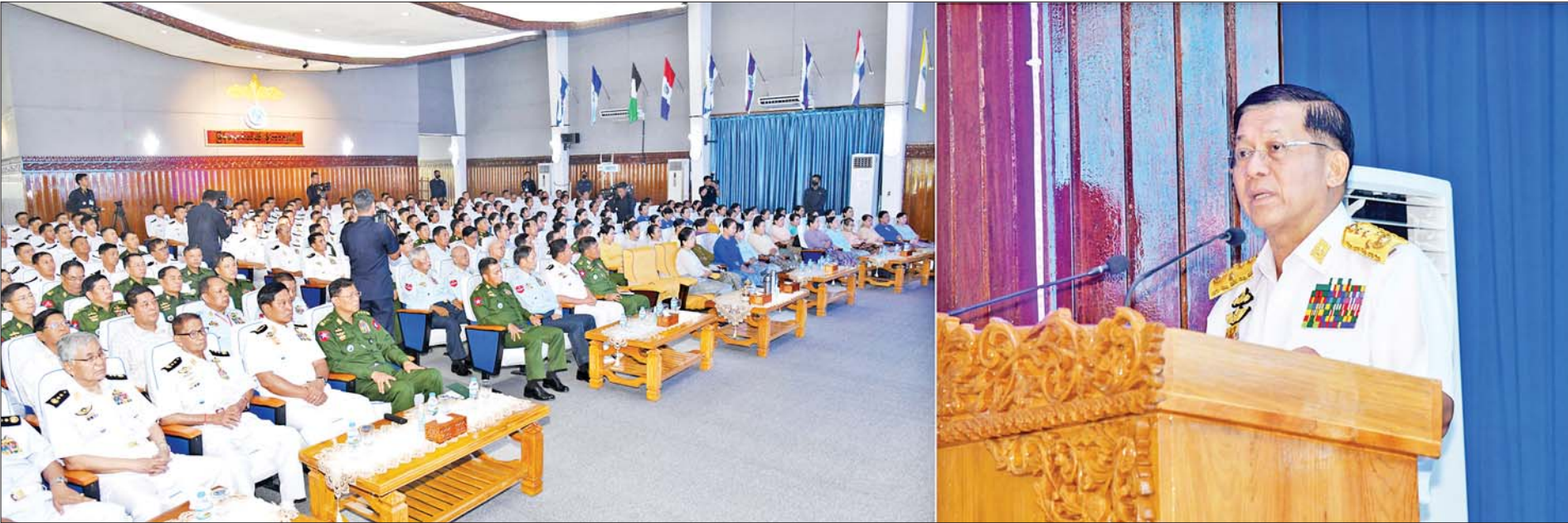
နိုင်ငံတော်စီမံအုပ်ချုပ်ရေးကောင်စီဥက္ကဋ္ဌ တပ်မတော်ကာကွယ်ရေးဦးစီးချုပ် ဗိုလ်ချုပ်မှူးကြီးမင်းအောင်လှိုင် (၇၅)နှစ်မြောက် စိန်ရတုတပ်မတော်(ရေ)နှစ်ပတ်လည်နေ့အထိမ်းအမှတ် အခမ်းအနားတွင် အမှာစကားပြောကြားစဉ်။

ယနေ့အချိန်၌ သုံးဖက်မြင်စစ်ဆင်နိုင်စွမ်းရှိသည့် တိုက်ပွဲဝင်အသင့် ရေတပ်အဆင့်ကို တက်လှမ်းနိုင်ခဲ့ပြီး နိုင်ငံတော်နှင့် တပ်မတော်အတွက်အားထားရသည့် ပြည်သူ့ကအားကိုးရသည့် တပ်ဖွဲ့ကြီးတစ်ခုအဖြစ် ခန့်ညားထည်ဝါစွာရပ်တည်နိုင်ခဲ့ပြီ