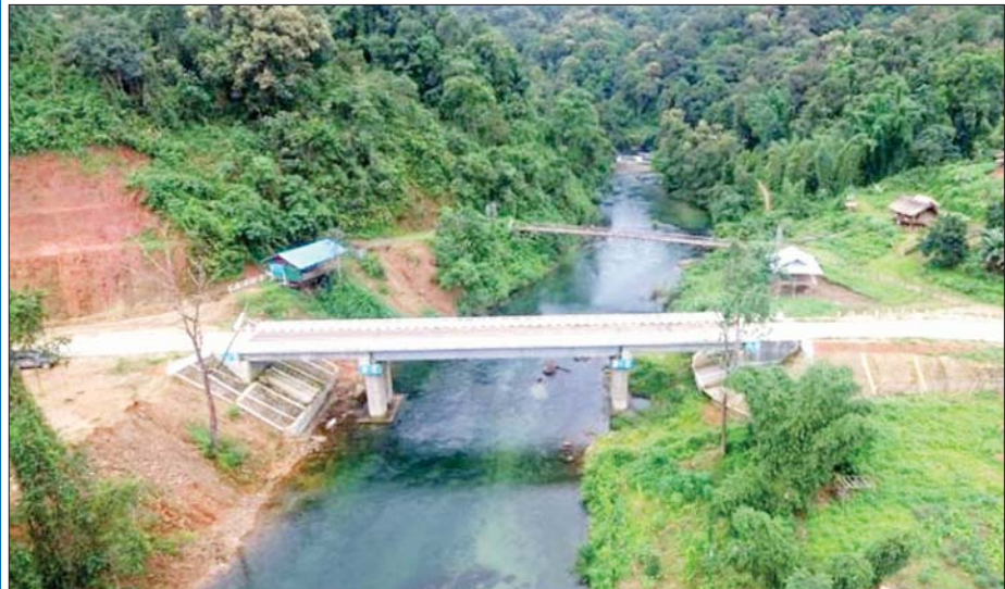
မချမ်းဘော့-ဖရူခ-ရပ်ဘော့-နောင်မွန်လမ်းပေါ်ရှိ တာခတံတား (ပေ ၂၀၀) ကို တွေ့ရစဉ်။

အချုပ်အားဖြင့်ဆိုရလျှင် တံတားဦးစီးဌာနက တည်ဆောက်ပြီးစီးသည့် တံတားများသည် ပြည်နယ် စီးပွား၊ နိုင်ငံဖွံ့ဖြိုး တိုးတက်ရေးကို အထောက်အကူ ပြုနိုင်ခဲ့သည်။ ထို့အတူ ပြည်နယ်အတွင်း တည်ဆောက်ဆဲတံတားများ ပြီးစီးပါကလည်း ဒေသတွင်း လူမှုစီးပွား တိုးတက်ရေးအတွက် အထောက်အကူပြုနိုင်မည့်အပြင် ဒေသခံပြည်သူများ ပိုမိုအဆင်ပြေလွယ်ကူစွာ သွားလာနိုင်တော့မည် ဖြစ်ပါကြောင်း တင်ပြရေးသားလိုက်ရပါသည်။ ။