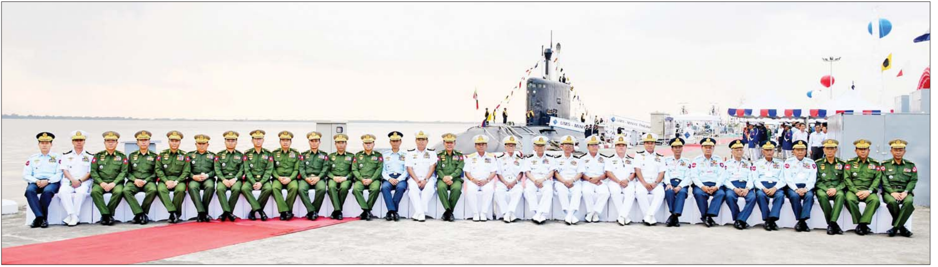
နိုင်ငံတော်စီမံအုပ်ချုပ်ရေးကောင်စီဥက္ကဋ္ဌ တပ်မတော်ကာကွယ်ရေးဦးစီးချုပ် ဗိုလ်ချုပ်မှူးကြီးမင်းအောင်လှိုင်နှင့် အဖွဲ့ဝင်များ (၇၅)နှစ်မြောက် စိန်ရတုတပ်မတော်(ရေ)နေ့အထိမ်းအမှတ် စစ်ရေယာဉ်များ တပ်တော်ဝင်ခြင်းနှင့် မြန်မာနိုင်ငံ ကမ်းခြေစောင့်တပ်ဖွဲ့သို့ လွှဲပြောင်းတပ်တော်ဝင်ခြင်း အခမ်းအနားသို့ တက်ရောက်လာကြသည့် ဧည့်သည်တော်များနှင့်အတူ မှတ်တမ်းတင်ဓာတ်ပုံရိုက်ကြစဉ်။

»» စာမျက်နှာ ၅ မှ နှစ်ပတ်လည်နေ့ အခမ်းအနား ဖြစ်သကဲ့သို့ တပ်မတော်(ရေ) အတွက် ပဉ္စမနှင့် ဆဋ္ဌမမြောက် Super Dvora အမြန်သွားကင်းလှည့် ရေယာဉ်များ အပါအဝင် စစ်ရေ ယာဉ်များ တပ်တော်ဝင်ခြင်း အခမ်း အနားဖြစ်ပြီး တပ်မတော်အတွက် ထူးခြားလေးနက်သည့် စွမ်းအား တစ်ရပ်ကို ထပ်မံဖြည့်ဆည်းပေး နိုင်သည့် နေ့တစ်နေ့ပင်ဖြစ် ကြောင်း၊ ထို့ပြင် ပြည်ပမှ နည်းပညာ လွှဲပြောင်းခဲ့ပြီး တပ်မတော်(ရေ)က ကိုယ်တိုင် တည်ဆောက်ခဲ့သည့် အမြန်သွား ကင်းလှည့်ရေယာဉ် နှစ်စင်း အပါအဝင် တပ်ဖွဲ့တင်ကမ်းတိုး ရေယာဉ် နှစ်စင်းနှင့် ရေသယ် ရေယာဉ်တစ်စင်းတို့ကို အောင်မြင် စွာ တပ်တော်ဝင်နိုင်ခဲ့ကြောင်း။ တိုးတက်ထုတ်လုပ်နိုင်ခဲ့ တပ်မတော်(ရေ)ကို ယခင်က စစ်ရေယာဉ်(မေယု)ဖြင့် စတင် ခဲ့ပြီး ၁၉၉၀ ပြည့်နှစ်မှစ၍ အဆင့်ဆင့် ပြောင်းလဲတိုးတက် လာခဲ့ကာ အမြန်သွားတိုက်ခိုက်ရေး ရေယာဉ်များမှတစ်ဆင့် ကိုယ်ပိုင် ဒီဇိုင်းရေးဆွဲပြီး ကိုယ်တိုင် တည်ဆောက်နိုင်သည့် စစ်ရေ ယာဉ်များအဖြစ် တိုးတက် ထုတ်လုပ်နိုင်ခဲ့ကြောင်း၊ လွန်ခဲ့ သည့် (၇၅)နှစ်ကစပြီး အဆင့်ဆင့် တည်ဆောက်လာခဲ့သည်မှာ ယခု အခါ ခုံးပျံတင်ဖရီးဂိတ်စစ်ရေယာဉ် များကို ကိုယ်တိုင်တည်ဆောက်ပြီး တိုက်ပွဲဝင်နိုင်စွမ်းအဆင့် ရောက်ရှိ အောင် မိမိတို့ ဆောင်ရွက်နိုင်ခဲ့ပြီး ဖြစ်ကြောင်း။