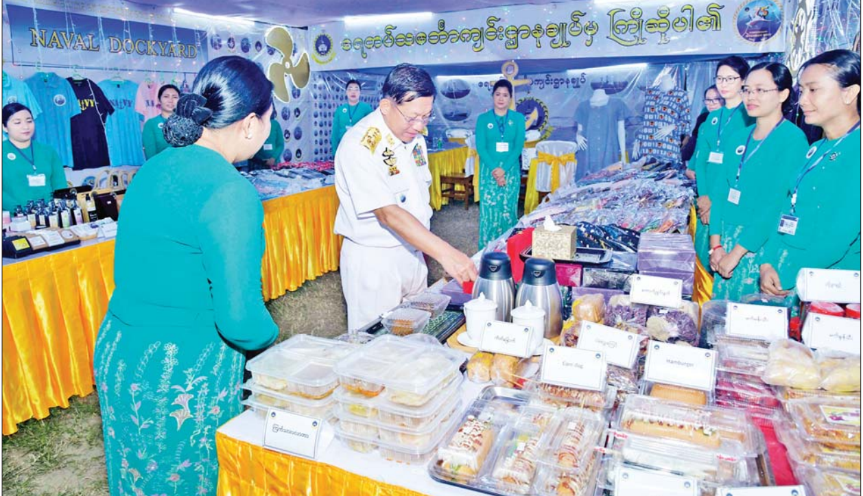
နိုင်ငံတော်စီမံအုပ်ချုပ်ရေးကောင်စီဥက္ကဋ္ဌ တပ်မတော်ကာကွယ်ရေးဦးစီးချုပ် ဗိုလ်ချုပ်မှူးကြီးမင်းအောင်လှိုင် တပ်မတော်ထုတ် လှူသုံးကုန် ပစ္စည်း အရောင်းဆိုင်များအား လှည့်လည်ကြည့်ရှုစဉ်။

ဆောင်ရွက်ကြသည်။ ထို့နောက် နိုင်ငံတော်စီမံအုပ်ချုပ်ရေးကောင်စီ ဥက္ကဋ္ဌ တပ်မတော်ကာကွယ်ရေး ဦးစီးချုပ် ဗိုလ်ချုပ်မှူးကြီး မင်းအောင်လှိုင်နှင့် အငြိမ်းစား ကာကွယ်ရေးဦးစီးချုပ်(ရေ)များ၊ အငြိမ်းစား ကာကွယ်ရေးဦးစီးချုပ် (လေ)များနှင့် ကာကွယ်ရေး ဦးစီးချုပ်(လေ) ဗိုလ်ချုပ်ကြီး ထွန်းအောင်တို့အား ကာကွယ်ရေး ဦးစီးချုပ်(ရေ) ဗိုလ်ချုပ်ကြီး မိုးအောင်က (၇၅)နှစ်မြောက် တပ်မတော်(ရေ) စိန်ရတုနှစ်ပတ် လည်နေ့ အထိမ်းအမှတ်တံဆိပ် များအား အမှတ်တရလက်ဆောင် အဖြစ် ပေးအပ်သည်။ ဖဲကြိုးဖြတ်ဖွင့်လှစ် ယင်းနောက် နိုင်ငံတော်စီမံ အုပ်ချုပ်ရေးကောင်စီ ဥက္ကဋ္ဌ တပ်မတော်ကာကွယ်ရေးဦးစီးချုပ် နှင့် ဇနီးတို့သည် ဧရာဝတီရေတပ် စခန်းဌာနချုပ်ရှိ (၇၅)နှစ်မြောက် တပ်မတော်(ရေ) စိန်ရတုနှစ်ပတ် လည်နေ့ အထိမ်းအမှတ်ပြခန်းကို ဖဲကြိုးဖြတ် ဖွင့်လှစ်ပေးပြီး တပ်မတော်(ရေ)နှစ်ပတ်လည်နေ့ အထိမ်းအမှတ် စာအုပ်တွင် မှတ်တမ်းတင် လက်မှတ်ရေးထိုး ကာ အထိမ်းအမှတ်ပြခန်းများနှင့် ရေတပ်စခန်း ဌာနချုပ်အလိုက် ခင်းကျင်းပြသထားသည့် ပြခန်း များ၊ အမှတ်တရပစ္စည်း အရောင်း ဆိုင်များ၊ မြန်မာ့ရိုးရာ စားသောက် ဖွယ်ရာ အရောင်းဆိုင်များ၊ စာအုပ် အရောင်းဆိုင်နှင့် တပ်မတော် ထုတ်လှူသုံးကုန်ပစ္စည်း အရောင်း ဆိုင်များကို လှည့်လည်ကြည့်ရှု ကြသည်။ ဆက်လက်၍ တပ်မတော်(ရေ) စစ်တီးပိုင်းတပ်ဖွဲ့၏ တီးမှုတ် ဖျော်ဖြေမှုများနှင့် ပဒေသာ ကပွဲများ၊ တိုင်းရင်းသားရိုးရာ တေးသီချင်းအကအလှ တို့ဖြင့် ဖျော်ဖြေမှုတို့ကို ကြည့်ရှုအားပေး ပြီး ဂုဏ်ပြုပန်းခြင်းနှင့် ဂုဏ်ပြု ဆုငွေများ ပေးအပ်ချီးမြှင့်သည်။