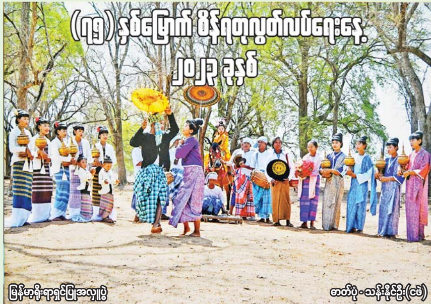
မြန်မာ့ရိုးရာရှင်ပြုအလှူပွဲ

[ဗိုလ်ချုပ်အောင်ဆန်း ၁၉၄၇ ခုနှစ် ဇွန်လဆန်း၌ ဗမာနိုင်ငံလုံး ဆိုင်ရာ မီးသတ်အစည်းအရုံးကြီးတွင် ပြောကြားသော မိန့်ခွန်းမှ ကောက်နုတ်ချက်]