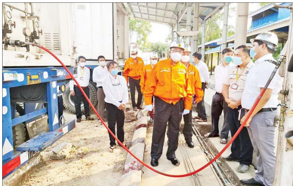
ဌာနအတွင်းရှိ တစ်သျှူးငှက်ပျောများ စိုက်ပျိုးရန် သည်။ လျာထားသော မြေနေရာများကို ကြည့်ရှုစစ်ဆေး ဆက်လက်၍ ပြည်ထောင်စုဝန်ကြီးနှင့်အဖွဲ့

ထို့နောက် ပြည်ထောင်စုဝန်ကြီးသည် လုပ်ငန်း ခွင်ဘေးအန္တရာယ်ကင်းရှင်းရေး မှာကြားပြီး CNG