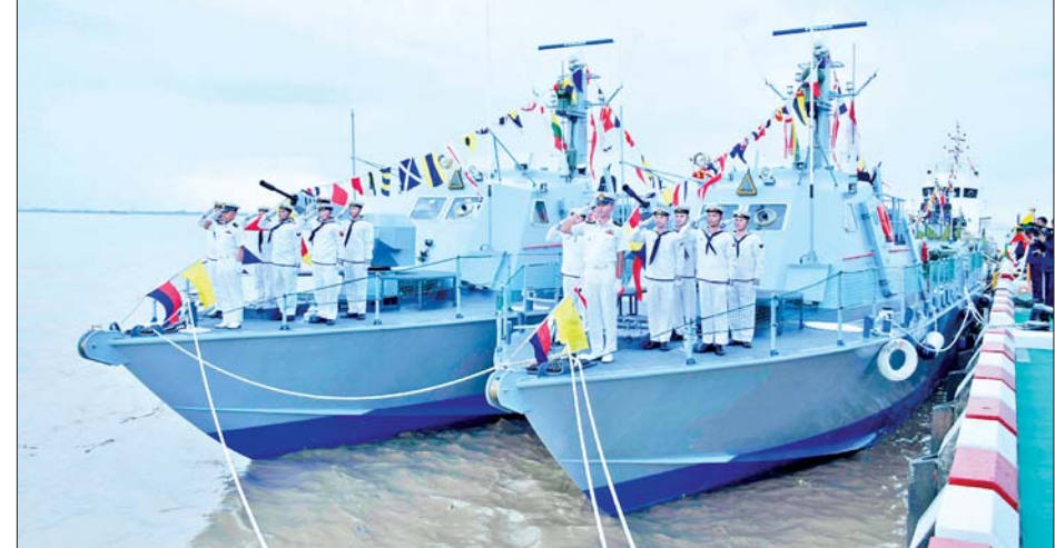
တပ်တော်ဝင် စစ်ရေယာဉ်များကို တွေ့ရစဉ်။