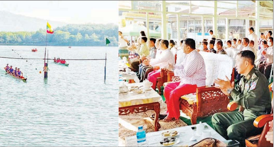
ပြောကြားသည်။ မြို့နယ် လှေလှော်အသင်းနှင့် ကို ကြည့်ရှုအားပေးခဲ့ကြောင်း ထို့နောက်ပြည်နယ်ဝန်ကြီးချုပ် သံဖြူဇရပ်မြို့နယ် လှေလှော် သိရသည်။ နှင့် အဖွဲ့ဝင်များက ကျိုက်မရော အသင်းတို့ယှဉ်ပြိုင်လှော်ခတ်နေမှု

အားကစားကို တန်ဖိုးထားမြတ်နိုး တတ်စေရန်၊ ထူးချွန်ပြီး အရည် အချင်းပြည့်ဝသည့် လှေလှော် အားကစားသမားများ မွေးထုတ် ပေးနိုင်ရန် စသည့်ရည်ရွယ်ချက် ကောင်းများဖြင့် ကျင်းပခြင်းဖြစ် ကြောင်း၊ မြို့နယ် ၁၀ မြို့နယ်လုံး မှ လှေလှော်အသင်း ၁၀ သင်းတို့ က အားတက်သရော စိတ်အား ထက်သန်စွာ ဝင်ရောက်ယှဉ်ပြိုင် ကြသည့်အတွက် များစွာအားရ ဝမ်းသာမိကြောင်းနှင့် လှေလှော် အားကစားသမားများအနေဖြင့် လည်း မိမိတို့၏ မြို့နယ်ဂုဏ်မြှင့် တင်နိုင်အောင် အစွမ်းကုန် ကြိုးစား ယှဉ်ပြိုင်သွားကြရန်