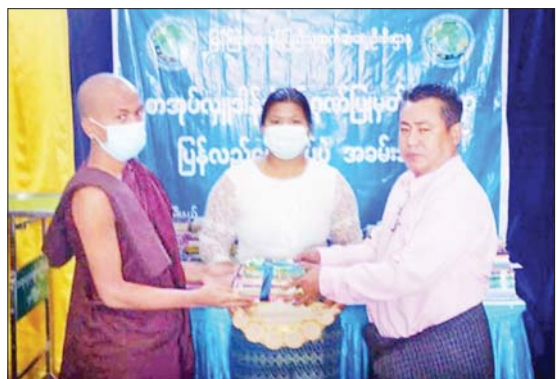
ပြန်လည်ပေးအပ်ခဲ့ပြီး ကျေးရွာစာကြည့်တိုက်ကော်မတီဝင် များထံ သုတ/ရသစာအုပ်များစုံ ၁၆၀၀ ကို လွှဲပြောင်းပေးအပ်ခဲ့ ကြောင်း သိရသည်။ သားငယ်(ပုဗ္ဗသီရိ)

ပုဗ္ဗသီရိ ဒီဇင်ဘာ ၂၃ ပြည်ထောင်စုနယ်မြေ နေပြည်တော် ပုဗ္ဗသီရိမြို့နယ် ပြန်ကြားရေးနှင့် ပြည်သူ့ဆက်ဆံရေးဦးစီးဌာန ပြည်သူ့ စာကြည့်တိုက်၌ ကျေးရွာစာကြည့်တိုက်များ ရှင်သန်ဖွံ့ဖြိုးရေး အတွက် သုတ/ရသစာအုပ်များ လှူဒါန်းပွဲနှင့် ဂုဏ်ပြုမှတ်တမ်း လွှာပြန်လည်ပေးအပ်ပွဲအခမ်းအနားကို ယနေ့နံနက် ၉ နာရီက ကျင်းပသည်။