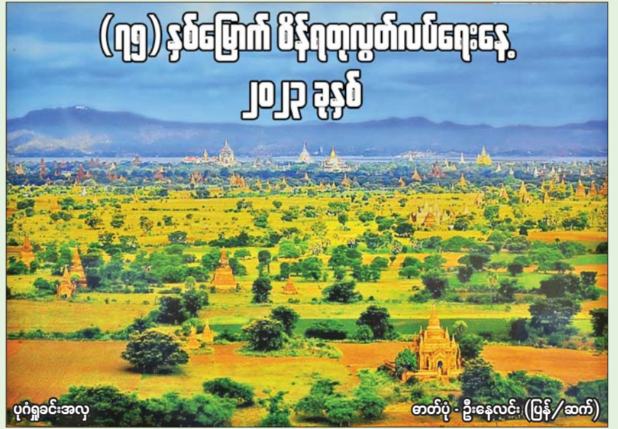
ပုဂံရှုခင်းအလှ

[နိုင်ငံတော်စီမံအုပ်ချုပ်ရေးကောင်စီဥက္ကဋ္ဌ နိုင်ငံတော်ဝန်ကြီးချုပ် ဗိုလ်ချုပ်မှူးကြီးမင်းအောင်လှိုင်၏ ၁၂-၂-၂၀၂၁ ရက်နေ့တွင် (၇၄)နှစ်မြောက် ပြည်ထောင်စုနေ့အခမ်းအနားသို့ ပေးပို့သည့် သဝဏ်လွှာမှ ကောက်နုတ်ချက်]