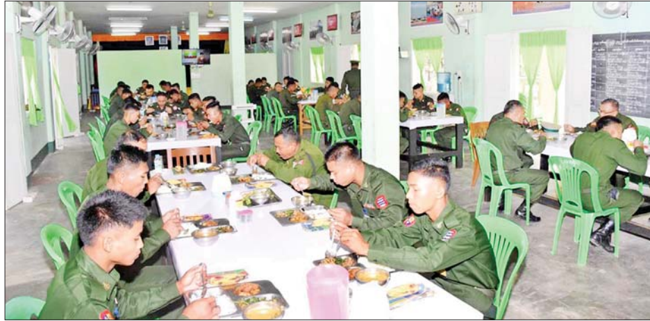
အနောက်တောင်တိုင်းစစ်ဌာနချုပ်တိုင်းမှူး ဗိုလ်မှူးချုပ်ကြည်ခိုင်နှင့် တာဝန်ရှိသူများ ပုသိမ်မြို့နယ်မြေခံတပ်ရင်းမှ အရာရှိ၊ စစ်သည်များနှင့်အတူ လက်ရည်တစ်ပြင်တည်း သုံးဆောင်နေစဉ်။