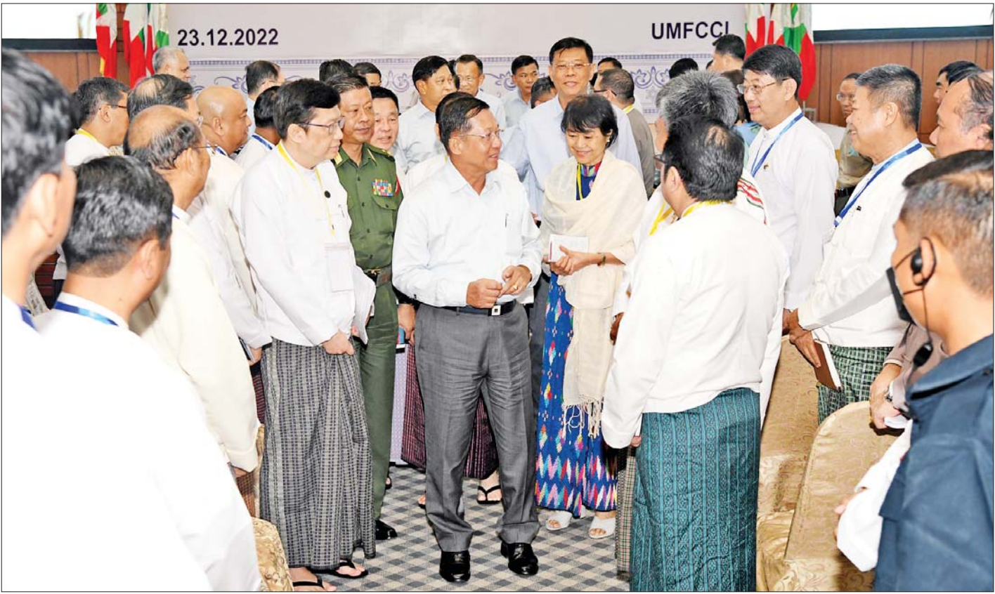
နိုင်ငံတော်စီမံအုပ်ချုပ်ရေးကောင်စီဥက္ကဋ္ဌ နိုင်ငံတော်ဝန်ကြီးချုပ် ဗိုလ်ချုပ်မှူးကြီးမင်းအောင်လှိုင် ပြည်ထောင်စုသမ္မတမြန်မာနိုင်ငံ ကုန်သည်များနှင့် စက်မှုလက်မှုလုပ်ငန်းရှင်များအသင်းချုပ်(UMFCCI) ညီနောင်အသင်းအဖွဲ့များမှ တာဝန်ရှိသူများအား ရင်းရင်းနှီးနှီးနှုတ်ဆက်စဉ်။

ရန်လိုအပ်မှု၊ ပြည်သူများ အလုပ်အကိုင်ကောင်းမွန် စွာရရှိရေး၊ ပြည်ပပို့ကုန်များ ဈေးကွက်ပိုမိုရရှိရေး၊ စီးပွားရေးဖွံ့ဖြိုးတိုးတက်ရေးတို့အတွက် အစိုးရနှင့် စီးပွားရေးလုပ်ငန်းရှင်များ၊ အသင်းအဖွဲ့များ ညီညီ ညွတ်ညွတ်ဖြင့် ပူးပေါင်းကြိုးပမ်းဆောင်ရွက်ရန် လိုအပ်မှု၊ ICT ဆိုင်ရာ သွင်းကုန်ပစ္စည်းများ အခွန်နှုန်း သက်သာစွာဖြင့်ရရှိရေး ကန့်သတ်ချက်များဖြေလျှော့ ပေးစေလိုမှု၊ ကျောက်မျက်ရတနာ ရောင်းချပွဲများတွင် နိုင်ငံခြားငွေဖြင့် ရောင်းချသည့် ပြပွဲများအပြင် မြန်မာ ကျပ်ငွေဖြင့်ရောင်းချသည့် ပြပွဲများကိုလည်း စီစဉ် ဆောင်ရွက်ပေးစေလိုမှု စသည်တို့နှင့်ပတ်သက်၍ လိုအပ်ချက်များ အသီးသီးအကြံပြု ဆွေးနွေးတင်ပြ ကြသည်။