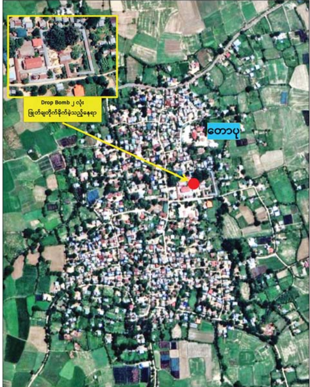
တောပုကျေးရွာရှိ ဘုရားကြီးဘုန်းတော်ကြီးကျောင်းဝင်းအတွင်းသို့ Drop Bomb နှစ်လုံး ပြတ်ချတိုက်ခိုက်ခဲ့သည့် နေရာပြပုံ

ပြည်သူ အမျိုးသမီး ၁၀ ဦး ဗုံးစထိမှန်ဒဏ်ရာ များရရှိခဲ့ကြောင်းနှင့် ဒဏ်ရာရရှိသူများအား လုံခြုံရေးတပ်ဖွဲ့ဝင်များက ချောင်းဦးမြို့ ပြည်သူ့ဆေးရုံသို့ ပို့ဆောင်ဆေးကုသမှုခံယူ လျက်ရှိသည်။ ဖြစ်စဉ်တွင် အကြမ်းဖက်မှုများ၌ ပါဝင် ပတ်သက်သူများအား ဖော်ထုတ်ဖမ်းဆီး၍ တရားဥပဒေနှင့်အညီ ထိရောက်စွာအရေးယူ နိုင်ရေး လုံခြုံရေးတပ်ဖွဲ့ဝင်များက စုံစမ်း ဖော်ထုတ်လျက်ရှိကြောင်းနှင့် ယခုကဲ့သို့ NUG၊ CRPH တို့၏ လက်ဝေခံ PDF အမည်ခံ အကြမ်း ဖက်သမားများ၏ လူမဆန်သည့်အကြမ်းဖက် လုပ်ရပ်များအား ဒေသခံပြည်သူများက ရွံရှာ မုန်းတီးလျက်ရှိကြောင်း သိရသည်။ သတင်းစဉ်