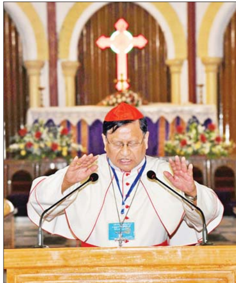
ရန်ကုန်ကက်သလစ် ဂိုဏ်းချုပ်သာသနာဂိုဏ်းချုပ်ဆရာတော်ကြီး ကာဒီနယ်ချားလ်စ်ဘို က ခရစ္စမတ် သတင်းကောင်းနှင့် ဆုမွန်စကားမျှဝေပြောကြားစဉ်။

စောင့်ရှောက်လျက်ရှိပါကြောင်း၊ ဖွဲ့စည်းပုံအခြေခံဥပဒေအခြေခံမူများ ပုဒ်မ ၃၄ တွင် “ငြိမ်ဝပ်ပိပြားရေးနှင့်သော်လည်းကောင်း၊ ပြည်သူ့ကိုယ်ကျင့်တရားနှင့် သော်လည်းကောင်း၊ ပြည်သူ့ကျန်းမာရေးနှင့်သော်လည်းကောင်း၊ ဖွဲ့စည်းပုံအခြေခံဥပဒေပါ အခြားပြဋ္ဌာန်းချက်တို့နှင့်သော်လည်းကောင်း မဆန့်ကျင်လျှင် နိုင်ငံသားတိုင်းသည် ဘာသာ သာသနာရေးတွင် လွတ်လပ်စွာယူဆနိုင်သော အခွင့်အရေး၊ လွတ်လပ်စွာ ဆောင်ရွက်နိုင်သော အခွင့်အရေးတို့ကို အညီအမျှရရှိစေရမည်” ဟု ပြဋ္ဌာန်းထားပါကြောင်း။