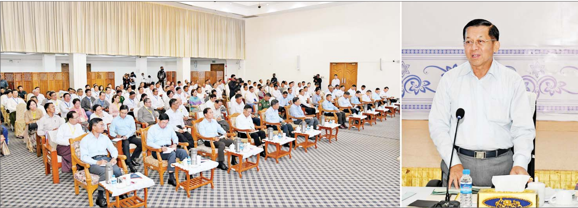
နိုင်ငံတော်စီမံအုပ်ချုပ်ရေးကောင်စီဥက္ကဋ္ဌ နိုင်ငံတော်ဝန်ကြီးချုပ် ဗိုလ်ချုပ်မှူးကြီးမင်းအောင်လှိုင် ပြည်ထောင်စုသမ္မတမြန်မာနိုင်ငံ ကုန်သည်များနှင့် စက်မှုလက်မှုလုပ်ငန်းရှင်များအသင်းချုပ်(UMFCCI) ညီနောင်အသင်းအဖွဲ့များနှင့် တွေ့ဆုံပွဲတွင် အမှာစကားပြောကြားစဉ်။