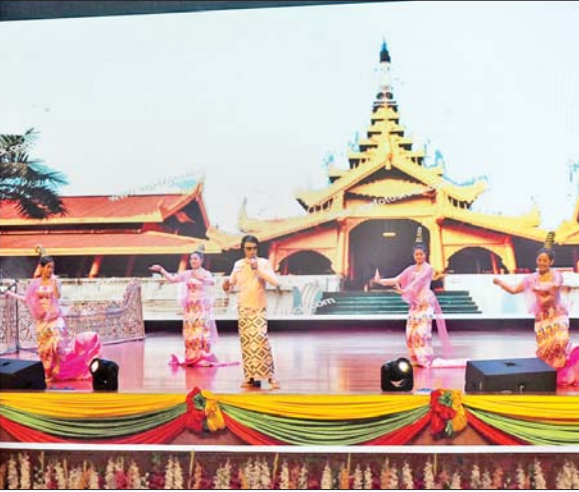
နိုင်ငံတော်စီမံအုပ်ချုပ်ရေးကောင်စီဒုတိယဥက္ကဋ္ဌ ဒုတိယတပ်မတော်ကာကွယ်ရေးဦးစီးချုပ် ကာကွယ်ရေးဦးစီးချုပ်(ကြည်း) ဒုတိယဗိုလ်ချုပ်မှူးကြီးစိုးဝင်း နိုင်ငံကျော် အဆိုတော် မြန်မာပြည်သိန်းတန်၏ ကြယ်ကလေးများ၏အနာဂတ် တစ်ကိုယ်တော်သီဆိုဖျော်ဖြေပွဲအား ကြည့်ရှုအားပေးစဉ်။