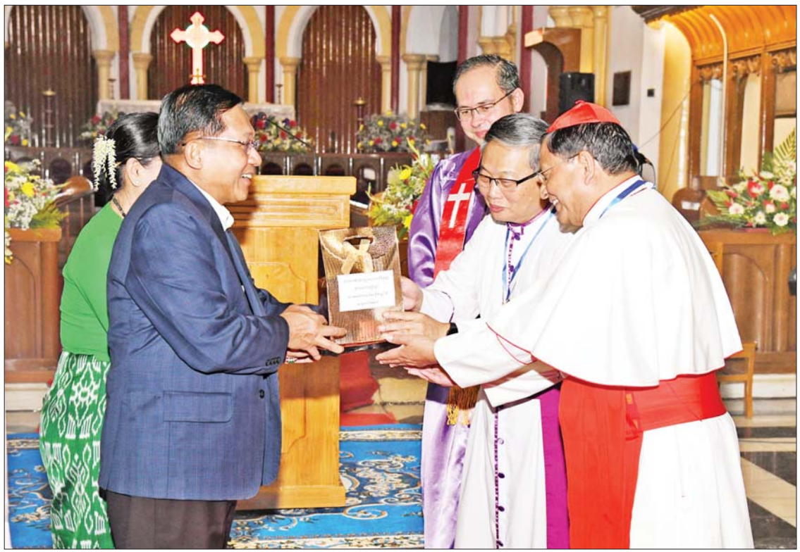
နိုင်ငံတော်စီမံအုပ်ချုပ်ရေးကောင်စီဥက္ကဋ္ဌ နိုင်ငံတော်ဝန်ကြီးချုပ် ဗိုလ်ချုပ်မှူးကြီး မင်းအောင်လှိုင်နှင့် ဇနီး ဒေါ်ကြူကြူလှ တို့က ဂိုဏ်းချုပ်ဆရာတော်ကြီး ကာဒီနယ်ချားလ်စ်ဘို၊ သာသနာပိုင်ချုပ်ကြီး စတီဗင်သန်းမြင့်ဦးနှင့် သိက္ခာတော်ရဆရာဒေါက်တာအေးမင်းတို့အား ခရစ္စမတ် အထိမ်းအမှတ်လက်ဆောင် ပေးအပ်စဉ်။

နေပြည်တော် ဒီဇင်ဘာ ၂၃ မြန်မာနိုင်ငံ ခရစ်ယာန်အသင်းတော်များကောင်စီ၊ ပြည်ထောင်စုသမ္မတမြန်မာနိုင်ငံတော် ကက်သလစ်ဆရာတော်ကြီးများ၊ မြန်မာနိုင်ငံ ဧဝဂလိခရစ်ယာန်မဟာမိတ်အဖွဲ့ချုပ် မြန်မာနိုင်ငံခရစ်တော်သာသနာပြန့်ပွားမှု ပူးပေါင်းဆောင်ရွက်ရေးအဖွဲ့တို့က စုပေါင်းကျင်းပပြုလုပ်သည့် ခရစ်တော်မွေးနေ့ (ခရစ္စမတ်) ကျေးဇူးတော်ချီးမွမ်းခြင်း အခမ်းအနားကို ယနေ့ညနေပိုင်းတွင် ရန်ကုန်တိုင်းဒေသကြီး ပန်းဘဲတန်းမြို့နယ် ဗိုလ်ချုပ်အောင်ဆန်းလမ်းနှင့် ရွှေတိဂုံဘုရားလမ်းထောင့်ရှိ Holy Cathedral Church ၌ ကျင်းပပြုလုပ်ရာ နိုင်ငံတော်စီမံအုပ်ချုပ်ရေးကောင်စီဥက္ကဋ္ဌ နိုင်ငံတော်ဝန်ကြီးချုပ် ဗိုလ်ချုပ်မှူးကြီး မင်းအောင်လှိုင် တက်ရောက်ချီးမြှင့်သည်။