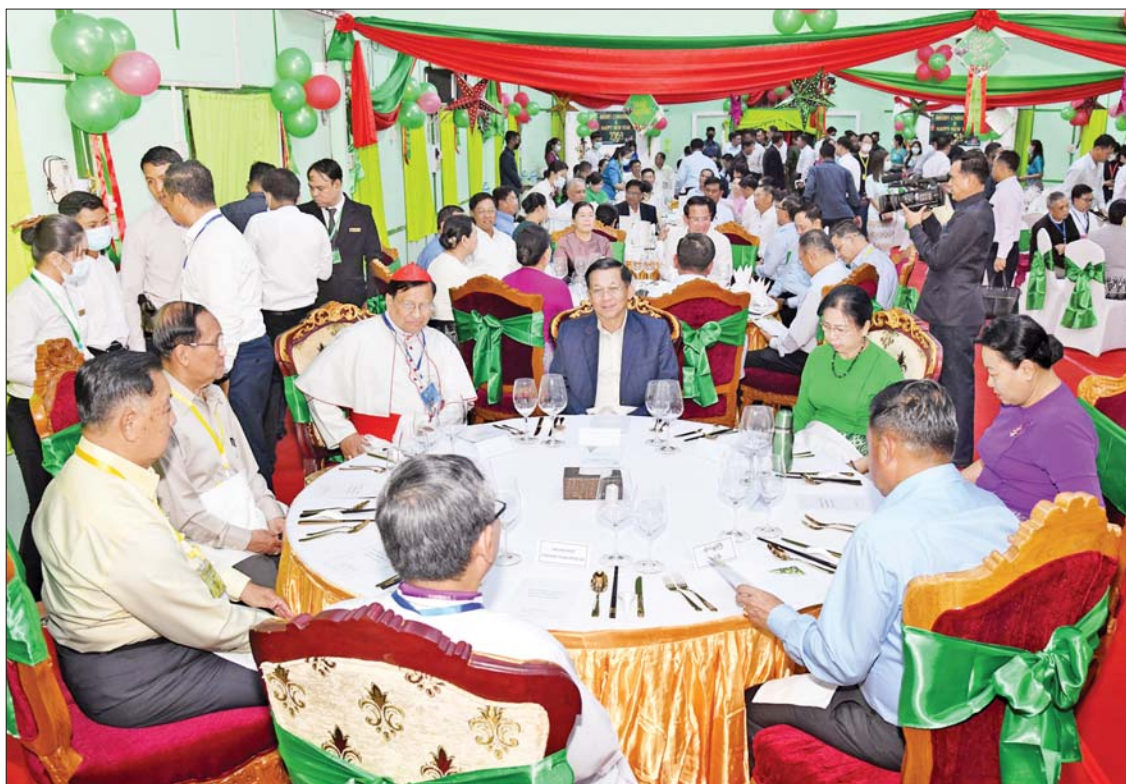
နိုင်ငံတော်စီမံအုပ်ချုပ်ရေးကောင်စီဥက္ကဋ္ဌ နိုင်ငံတော်ဝန်ကြီးချုပ် ဗိုလ်ချုပ်မှူးကြီး မင်းအောင်လှိုင်နှင့် အဖွဲ့ဝင်များအား မြန်မာနိုင်ငံခရစ်ယာန်အသင်းတော်များကောင်စီ၊ ပြည်ထောင်စုသမ္မတမြန်မာနိုင်ငံတော် ကက်သလစ်ဆရာတော်ကြီးများ၊ မြန်မာနိုင်ငံဧဝေါလီခရစ်ယာန် မဟာမိတ်အဖွဲ့ချုပ်၊ မြန်မာနိုင်ငံခရစ်တော်သာသနာပြန့်ပွားမှု ပူးပေါင်းဆောင်ရွက်ရေးအဖွဲ့တို့က မိတ်သဟာယ ညစာစားပွဲဖြင့် တည်ခင်းဧည့်ခံစဉ်။

မြန်မာနိုင်ငံတွင်ဘာသာကြီး လေးခုအပြင် အခြားသောဘာသာများကိုလည်း ဖွဲ့စည်းပုံအခြေခံဥပဒေအရ လွတ်လပ်စွာ ကိုးကွယ်ခွင့်ပြုထားပါကြောင်း၊ နိုင်ငံတော်အနေဖြင့် အသိအမှတ်ပြုထားသည့် ဘာသာများကို တတ်နိုင်သမျှ ကူညီ