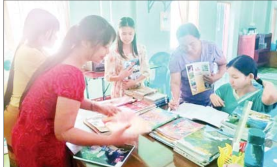
သုတ/ရသ စာအုပ်စာစောင်များကို ငှားရမ်းပေးခြင်း၊ ပြန်လည်အပ်နှံသည့် စာအုပ်များသိမ်းဆည်းပေးခြင်းတို့ကို ဆောင်ရွက်ခဲ့ကြသည်။ ခရိုင်(ပြန်/ဆက်)

သထုံ ဒီဇင်ဘာ ၂၃ မွန်ပြည်နယ် သထုံမြို့နယ်အတွင်းရှိ ဌာနအသီးသီးတို့မှ ဝန်ထမ်းများ စာအုပ်စာစောင်များကို အလွယ်တကူငှားရမ်းဖတ်ရှုနိုင်ပြီး အသိပညာ ဗဟုသုတများ တိုးပွားစေရေးအတွက် ခရိုင်ပြန်ကြားရေးနှင့် ပြည်သူ့ဆက်ဆံရေးဦးစီးဌာနမှ ဝန်ထမ်းများက ယနေ့မွန်လွဲပိုင်းတွင် မိုဘိုင်းစနစ်ဖြင့် စာအုပ်စာစောင်ငှားရမ်းပေးခြင်းများကို လိုက်လံဆောင်ရွက်ခဲ့ကြသည်။ မိုဘိုင်းစာကြည့်တိုက် ဆောင်ရွက်ရာတွင် ပြန်ကြားရေးနှင့် ပြည်သူ့ဆက်ဆံရေးဦးစီးဌာနမှ ဝန်ထမ်းများက သထုံမြို့နယ်အတွင်းရှိ ခရိုင်ပတ်ဝန်းကျင်ထိန်းသိမ်းရေးဦးစီးဌာနရုံးနှင့် ဆည်မြောင်းနှင့် ရေအသုံးချမှုစီမံခန့်ခွဲရေးဦးစီးဌာနရုံးတို့သို့ သွားရောက်၍ ဝန်ထမ်းများနှင့် ဝန်ထမ်းမိသားစုဝင်များအား