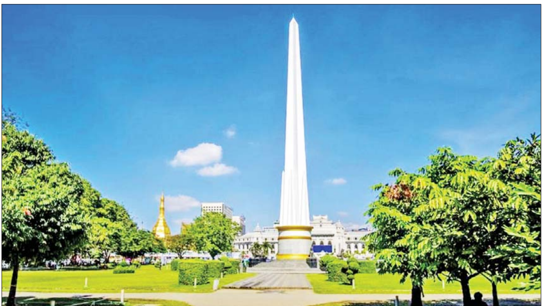
ဖြစ်ပါသည်။

လွတ်လပ်မှုမှာ တာဝန်ခံမှု၊ တာဝန်ယူမှု ရှိရတတ်သည်။ မိမိ၏ လွတ်လပ်မှုသည် အခြားသူတစ်ဦး၏ လွတ်လပ်မှုကို မထိခိုက်စေသင့်။ လေးစားရမည်ဖြစ်သည်။ နိုင်ငံသားတစ်ဦး၏ အခြေခံအခွင့်အရေးဆိုသည်မှာ တရားမျှတမှုရှိ၊ မရှိ၊ ခွဲခြားဆက်ဆံမှုရှိ၊ မရှိ၊ တန်းတူညီမျှမှုရှိ၊ မရှိအပေါ်တွင် အခြေခံသည်။ အဆိုပါ အခြေခံအချက်မျှလောက်မှ မရှိသော လူ့အဖွဲ့အစည်းတစ်ခုတွင် တရားဥပဒေ စိုးမိုးမှုအားနည်းနေတတ်ပြီး နိုင်ငံသားတစ်ဦး၏ အခွင့်အရေး ဆုံးရှုံးနစ်နာမှုသည် များသည်ထက်များလာနိုင်ပါသည်။ ဆိုလိုသည်မှာ လူတစ်ဦးချင်းစီ၏ လုံခြုံမှု မရှိခြင်း၊ လွတ်လပ်မှုကင်းမဲ့ခြင်းမှသည် လူ့အဖွဲ့အစည်း၏ လွတ်လပ်မှုကို ထိခိုက်နိုင်ခြေ၊ ထိုမှတစ်ဆင့် နိုင်ငံတစ်နိုင်ငံ၏ အချုပ်အခြာထိပါးနိုင်ခြေ အထိ ရှိလာနိုင်ခြင်းကို သတိထားနိုင်ရန်