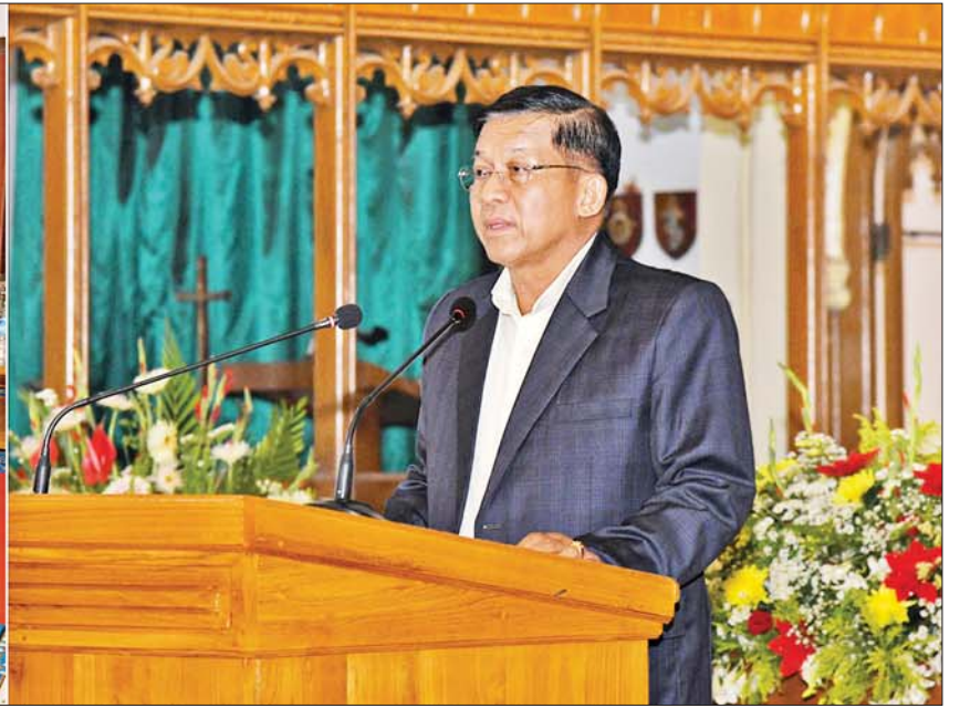
နိုင်ငံတော်စီမံအုပ်ချုပ်ရေးကောင်စီဥက္ကဋ္ဌ နိုင်ငံတော်ဝန်ကြီးချုပ် ဗိုလ်ချုပ်မှူးကြီး မင်းအောင်လှိုင် ခရစ်တော်မွေးနေ့ (ခရစ္စမတ်) ကျေးဇူးတော်ချီးမွမ်းခြင်း အခမ်းအနားတွင် ခရစ္စမတ်နှုတ်ခွန်းဆက်စကား ပြောကြားစဉ်။