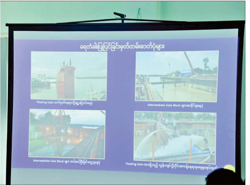
နိုင်ငံတော်စီမံအုပ်ချုပ်ရေးကောင်စီဥက္ကဋ္ဌ နိုင်ငံတော်ဝန်ကြီးချုပ် ဗိုလ်ချုပ်မှူးကြီး မင်းအောင်လှိုင်နှင့် အဖွဲ့ဝင်များအား တာဝန်ရှိသူတစ်ဦးက မြန်မာ့သင်္ဘောကျင်းလုပ်ငန်း ဆောင်ရွက်နေမှုအခြေအနေများကို ရှင်းလင်းတင်ပြစဉ်။