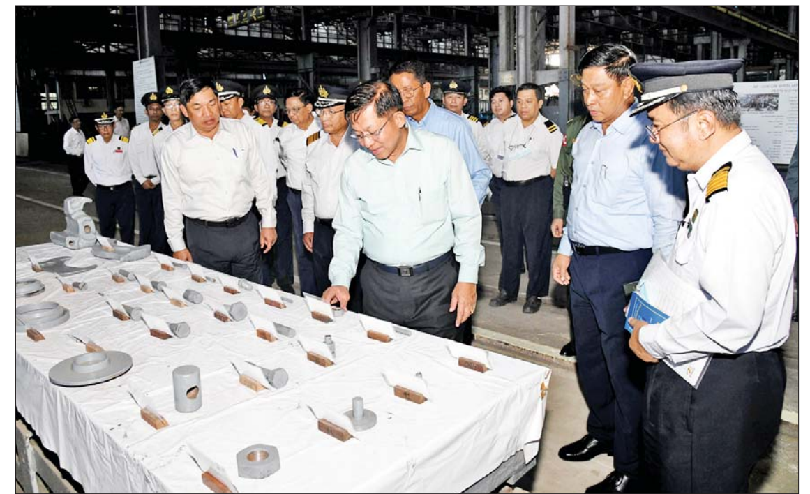
နိုင်ငံတော်စီမံအုပ်ချုပ်ရေးကောင်စီဥက္ကဋ္ဌ နိုင်ငံတော်ဝန်ကြီးချုပ် ဗိုလ်ချုပ်မှူးကြီးမင်းအောင်လှိုင်နှင့်အဖွဲ့ဝင်များ မီးရထားစက်ခေါင်းစက်ရုံအတွင်း မီးရထားစက်ခေါင်း အရန်ပစ္စည်းများ ထုတ်လုပ်ထားရှိမှုကို ကြည့်ရှုစစ်ဆေးစဉ်။

လက်နက်ကိုင်များနှင့်လည်း ငြိမ်းချမ်းရေး ဆွေးနွေးပွဲများပြုလုပ်၍ ဆောင်ရွက်လျက်ရှိကြောင်း၊ ထိုသို့ တွေ့ဆုံဆွေးနွေးရာတွင် တိုင်းရင်းသားလက်နက်ကိုင်အဖွဲ့များ၏လိုလားချက်များမှ အခြေခံဥပဒေအရ ဆောင်ရွက်နိုင်သည့်ကိစ္စရပ်များကို တပ်မတော်အနေဖြင့် ဆောင်ရွက်ပေးသွားမည်ဖြစ်ကြောင်း၊ အချို့သောကိစ္စရပ်များကို လွှတ်တော်တွင် မဲဆွဲဆုံးဖြတ်၍ အတည်ပြု ဆောင်ရွက်ပေးသွားမည်ဖြစ်ကြောင်း၊ တိုင်းရင်းသားခေါင်းဆောင်များ၊ နိုင်ငံရေးခေါင်းဆောင်များနှင့် တွေ့ဆုံချိန်များတွင်လည်း ဖွံ့စည်းပုံအခြေခံဥပဒေတွင် ပြင်ဆင်လိုသည့် ကိစ္စရပ်များအနက် ဖြစ်နိုင်သည့် ကိစ္စရပ်များကို ပြင်ဆင်နိုင်ရေး တပ်မတော်မှ သဘောတူညီသည်ကို ဆွေးနွေးပြောကြားပြီးဖြစ်ကြောင်း၊ နိုင်ငံဖွံ့ဖြိုးတိုးတက်ရန်အတွက် အဓိကလိုအပ်ချက်သည် နိုင်ငံရေးအရ တည်ငြိမ်အေးချမ်းရန်နှင့် စီးပွားရေးအရ ဖွံ့ဖြိုးတိုးတက်ရန် ဖြစ်သည့်အတွက် ယခုကဲ့သို့ နိုင်ငံ၏ဖြတ်သန်းခဲ့ရသည့် နိုင်ငံရေးသမိုင်းကြောင်းကို ရှင်းလင်းပြောကြား