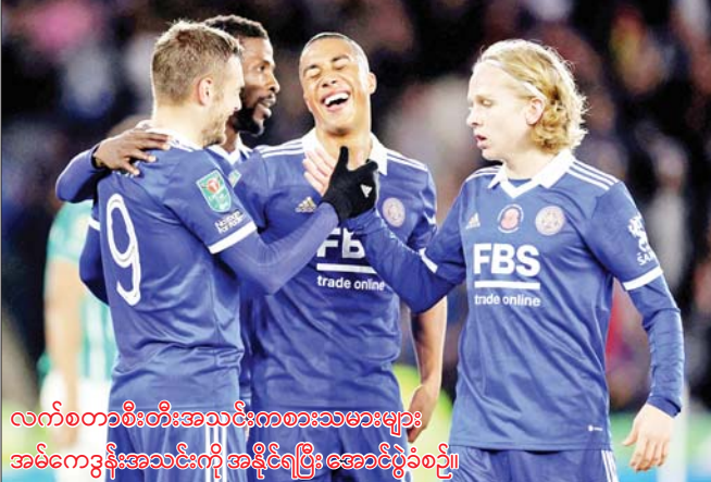
လက်စတားစီးတီးအသင်းကစားသမားများ အမ်ကော့ဒွန်းအသင်းကို အနိုင်ရပြီး အောင်ပွဲခံစဉ်။

လက်စတားစီးတီးအသင်း၊ ဆောက်သမ်တန် အသင်း၊ နယူးကာဆယ်အသင်းနဲ့ ဝုလ်ဗဟမ်တန် အသင်းတို့ဟာ ဒီဇင်ဘာ ၂၁ ရက် နံနက်ပိုင်းက ယှဉ်ပြိုင်ကစားခဲ့တဲ့ ကာရာဘောင်ဖလား ၁၆ သင်း အဆင့်ပွဲစဉ်မှာ ပြိုင်ဘက်အသင်းအသီးသီးကို အနိုင် ရရှိခဲ့တာကြောင့် ကွာတားဖိုင်နယ်အဆင့်ကို တက်လှမ်းခွင့်ရရှိခဲ့ပြီဖြစ်ပါတယ်။ လက်စတားစီးတီးအသင်းဟာ အမ်ကော့ဒွန်း အသင်းနဲ့ ယှဉ်ပြိုင်ကစားခဲ့ရပြီး လက်စတားစီးတီး အသင်းက တီယယ်လီမန်၊ အယိုဇီပီရက်စ်၊ ဂျိမ်းဗာဒီတို့ရဲ့ သွင်းဂိုးတွေနဲ့ အမ်ကော့ဒွန်းအသင်းကို စာမျက်နှာ ၁၅ ကော်လံ ၅ သို့ ၀