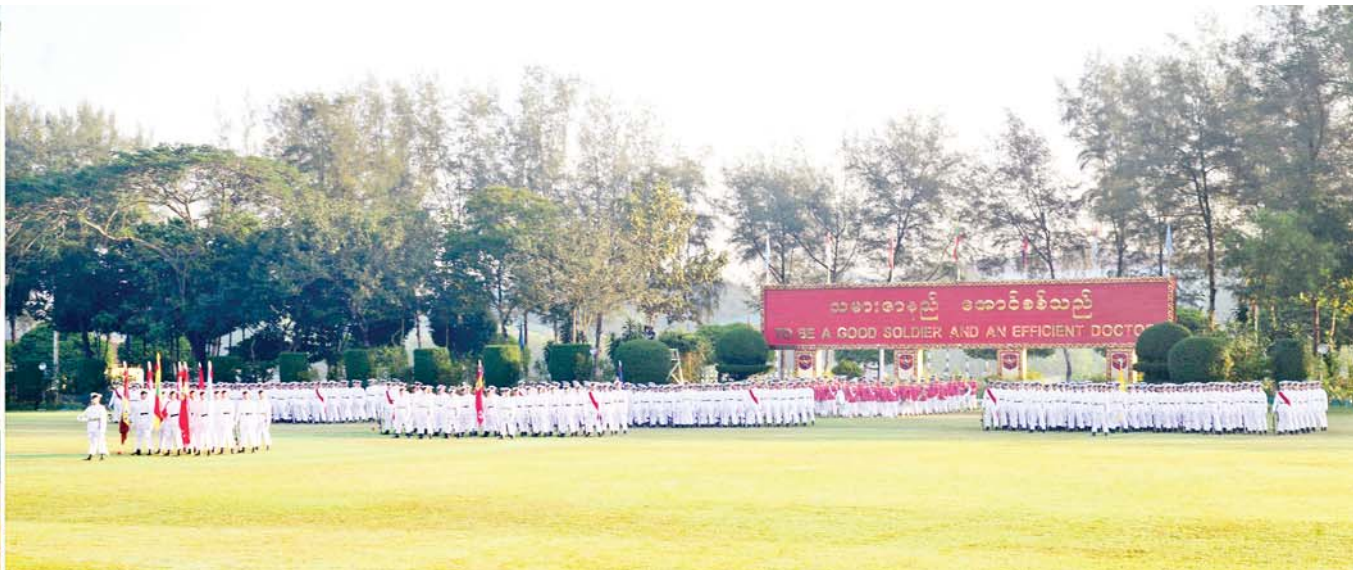
နိုင်ငံတော်စီမံအုပ်ချုပ်ရေးကောင်စီဥက္ကဋ္ဌ နိုင်ငံတော်ဝန်ကြီးချုပ် ဗိုလ်ချုပ်မှူးကြီး မဟာသရေစည်သူ မင်းအောင်လှိုင် တပ်မတော်ဆေးတက္ကသိုလ် ဗိုလ်လောင်းသင်တန်းအမှတ်စဉ်(၂၃) သင်တန်းဆင်းဂုဏ်ပြု စစ်ရေးပြအခမ်းအနားတွင် သင်တန်းဆင်းမိန့်ခွန်းပြောကြားစဉ်။

★ နိုင်ငံတော်မှ အဆိုပါအခမ်းအနားသို့ နိုင်ငံတော် စီမံအုပ်ချုပ်ရေးကောင်စီ ဥက္ကဋ္ဌ တပ်မတော်ကာကွယ်ရေး ဦးစီးချုပ်နှင့်အတူ ဇနီး ဒေါ်ကြူကြူလှ၊ ညိုနှိုင်းကွပ်ကဲရေးမှူး (ကြည်း၊ ရေ၊ လေ) ဗိုလ်ချုပ်ကြီး သီရိပျံချီမောင်မောင်အေးနှင့် ဇနီး၊ ကာကွယ်ရေးဦးစီးချုပ်(ရေ) ဗိုလ်ချုပ်ကြီး ဇေယျကျော်ထင် မိုးအောင်နှင့်ဇနီး၊ ကာကွယ်ရေးဦးစီးချုပ်(လေ) ဗိုလ်ချုပ်ကြီး ဇေယျကျော်ထင်ထွန်းအောင်နှင့်ဇနီး၊ ကာကွယ်ရေးဦးစီးချုပ်ရုံးမှ တပ်မတော် အရာရှိကြီးများနှင့် ဇနီးများ၊ ပြည်ထောင်စုဝန်ကြီးများ၊ ရန်ကုန်တိုင်းဒေသကြီး ဝန်ကြီးချုပ်၊ ရန်ကုန်တိုင်းစစ်ဌာနချုပ်တိုင်းမှူး၊ ရန်ကုန်မြို့တော်ဝန်၊ တပ်မတော် ဆေးတက္ကသိုလ် ကျောင်းအုပ်ကြီးနှင့် မင်္ဂလာဒုံ တပ်နယ်မှ တာဝန်ရှိသူများ၊ ကျောင်းဆင်းဗိုလ်လောင်းများ၏