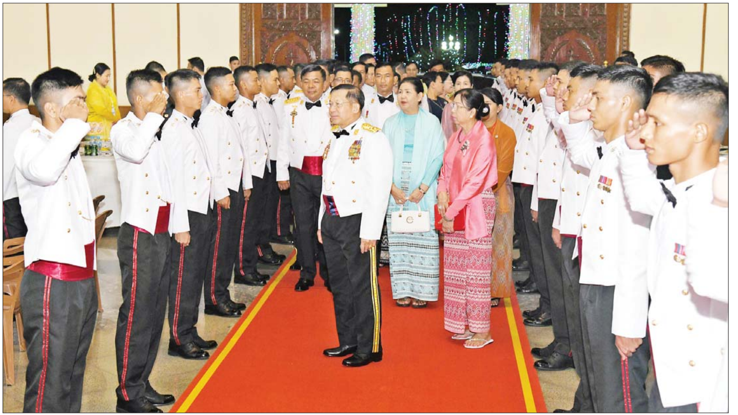
နိုင်ငံတော်စီမံအုပ်ချုပ်ရေးကောင်စီဥက္ကဋ္ဌ တပ်မတော်ကာကွယ်ရေးဦးစီးချုပ် ဗိုလ်ချုပ်မှူးကြီးမင်းအောင်လှိုင် သင်တန်းဆင်းအရာရှိများအား တစ်ဦးချင်း ရင်းရင်းနှီးနှီးလိုက်လံနှုတ်ဆက်စဉ်။

ဦးစွာ နိုင်ငံတော်စီမံအုပ်ချုပ်ရေးကောင်စီဥက္ကဋ္ဌ တပ်မတော်ကာကွယ်ရေးဦးစီးချုပ်က သင်တန်းဆင်း အရာရှိများအား တစ်ဦးချင်း ရင်းရင်းနှီးနှီးလိုက်လံ နှုတ်ဆက်သည်။ ထို့နောက် နိုင်ငံတော်စီမံအုပ်ချုပ်