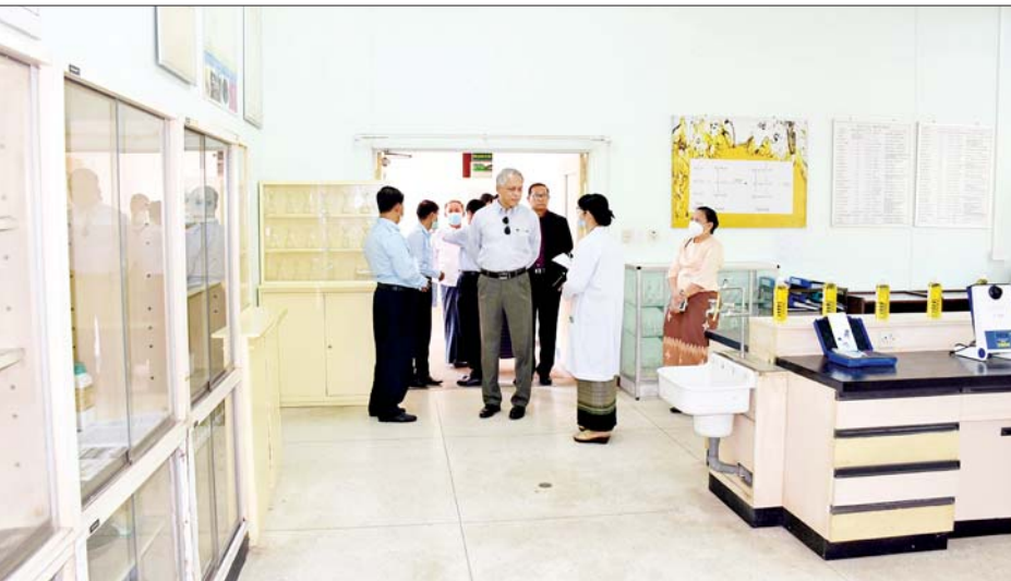
ရှိသည့် အရည်အသွေးများ၊ ဘဏ္ဍာနှစ်အလိုက် လုပ်ငန်းဆောင်ရွက်နိုင်ခဲ့မှု၊ လူ့စွမ်းအားအရင်းအမြစ် ဖွံ့ဖြိုးတိုးတက်ရေးအတွက် သင်တန်းများဖွင့်လှစ် ပို့ချပေးနိုင်မှု၊ သုတေသနလုပ်ငန်းများဆောင်ရွက်မှု၊ နိုင်ငံတကာအသိအမှတ်ပြု ဓာတ်ခွဲခန်းလက်မှတ် ရရှိရေးအတွက် ကြိုးပမ်းဆောင်ရွက်လျက်ရှိသည့်

နေပြည်တော် ဒီဇင်ဘာ ၂၁ စီးပွားရေးနှင့်ကူးသန်းရောင်းဝယ်ရေးဝန်ကြီးဌာန ပြည်ထောင်စုဝန်ကြီး ဦးအောင်နိုင်ဦးသည် တာဝန်ရှိသူများနှင့်အတူ ယနေ့တွင် ရန်ကုန်တိုင်း ဒေသကြီး လှည်းကူးမြို့နယ်ရှိ စားသုံးသူရေးရာဦးစီးဌာန ကုန်ပစ္စည်းစမ်းသပ်စစ်ဆေးရေးနှင့်အရည်အသွေးစီမံခန့်ခွဲမှုဌာန (Commodity Testing and Quality Management - CTQM) သို့ သွားရောက်ပြီး လုပ်ငန်းဆောင်ရွက်နေမှုကို ကြည့်ရှုစစ်ဆေး သည်။ ရှင်းလင်းတင်ပြ ထိုသို့ ကြည့်ရှုစစ်ဆေးစဉ် ကုန်ပစ္စည်းစမ်းသပ် စစ်ဆေးရေးနှင့် အရည်အသွေးစီမံခန့်ခွဲမှုဌာန မှူးက လယ်ယာထွက်ကုန်သီးနှံများ စမ်းသပ် စစ်ဆေးပေးလျက်ရှိသည့် ဓာတ်ခွဲခန်းများ တည်ထောင်ထားရှိမှု၊ ဓာတ်ခွဲခန်းအလိုက်၊ သီးနှံ အမျိုးအစားအလိုက် စမ်းသပ်စစ်ဆေးပေးလျက်