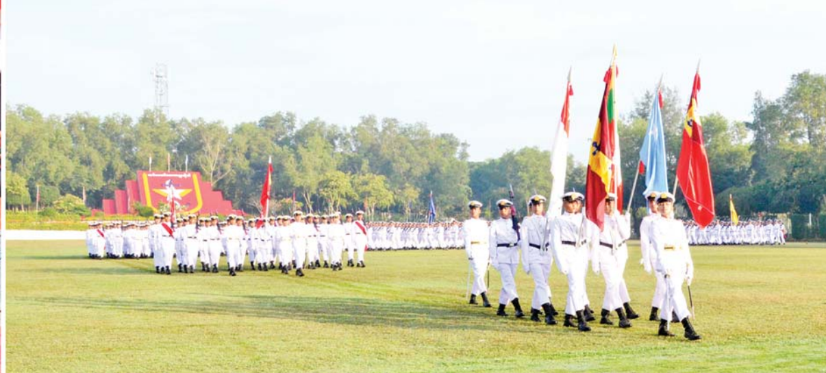
နိုင်ငံတော်စီမံအုပ်ချုပ်ရေးကောင်စီဥက္ကဋ္ဌ နိုင်ငံတော်ဝန်ကြီးချုပ် ဗိုလ်ချုပ်မှူးကြီး မဟာသရေစည်သူ မင်းအောင်လှိုင်အား ဗိုလ်လောင်းတပ်ခွဲများက အနှေးလျှောက်၊ အမြန်လျှောက်ဖြင့် ချီတက်အလေးပြုစဉ်။

မိဘအုပ်ထိန်းသူများ ဖြစ်သည့် တပ်မတော် ဆေးတက္ကသိုလ်၊ စာပေဌာနနှင့် လေ့ကျင့်ရေးဌာန တို့မှ နည်းပြအရာရှိများနှင့် ဆရာဆရာမများ၊ ဖိတ်ကြားထားသည့် ဧည့်သည်တော်များ တက်ရောက်ကြသည်။ အလေးပြုခြင်းကိုခံယူ ဦးစွာနိုင်ငံတော်စီမံအုပ်ချုပ်ရေးကောင်စီဥက္ကဋ္ဌ တပ်မတော်ကာကွယ်ရေးဦးစီးချုပ် ဗိုလ်ချုပ်