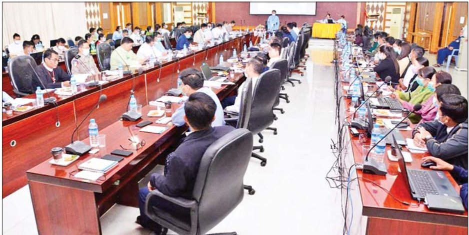
သင်တန်းသို့ မန္တလေးတိုင်းဒေသကြီးအစိုးရအဖွဲ့၊ တားဆီးကာကွယ်ရေး CPU အဖွဲ့ဝင် ၆၀ သက်ဆိုင်ရာဌာနအသီးသီးမှ အဂတိလိုက်စားမှု တက်ရောက်ခဲ့ကြောင်း သိရသည်။ သတင်းစဉ်

(Public Feedback Programme - PFP) တို့နှင့် စပ်လျဉ်း၍ ရှင်းလင်းဆွေးနွေးပြီး PFP အသုံးပြု ဆောင်ရွက်နိုင်ရေး လက်တွေ့လေ့ကျင့်ကြသည်။ ကော်မရှင်အဖွဲ့ဝင် ဒေါက်တာထွန်းထွန်းဦးက အများပြည်သူထံမှ တုံ့ပြန်မှုရယူခြင်းအစီအစဉ်ကို ဆောင်ရွက်ခြင်းဖြင့် အများပြည်သူတို့၏ပူးပေါင်း ပါဝင်မှုကို ပိုမိုမြှင့်တင်ဆောင်ရွက်လာနိုင်မည် ဖြစ်ကြောင်းနှင့် တက်ရောက်လာသည့် သင်တန်းသား များကိုလည်း သန့်ရှင်းသောအစိုးရနှင့် ကောင်းမွန် သော အုပ်ချုပ်ရေးစနစ်ဖြစ်ပေါ်စေရေး တည်ဆောက် ရာတွင် မိမိတို့နှင့်ပတ်သက်သည့် အခန်းကဏ္ဍမှ တက်ကြွစွာတာဝန်ယူဆောင်ရွက်ပေးပါရန် တိုက်တွန်း ပြောကြားသည်။