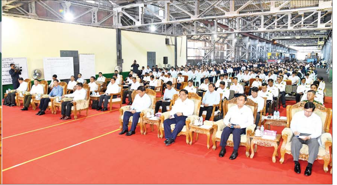
နိုင်ငံတော်စီမံအုပ်ချုပ်ရေးကောင်စီဥက္ကဋ္ဌ နိုင်ငံတော်ဝန်ကြီးချုပ် ဗိုလ်ချုပ်မှူးကြီးမင်းအောင်လှိုင် အင်းစိန်မြို့နယ်ရှိ မြန်မာ့မီးရထားစက်ခေါင်းစက်ရုံ(အင်းစိန်)မှ ဝန်ထမ်းများအား တွေ့ဆုံအမှာစကား ပြောကြားစဉ်။