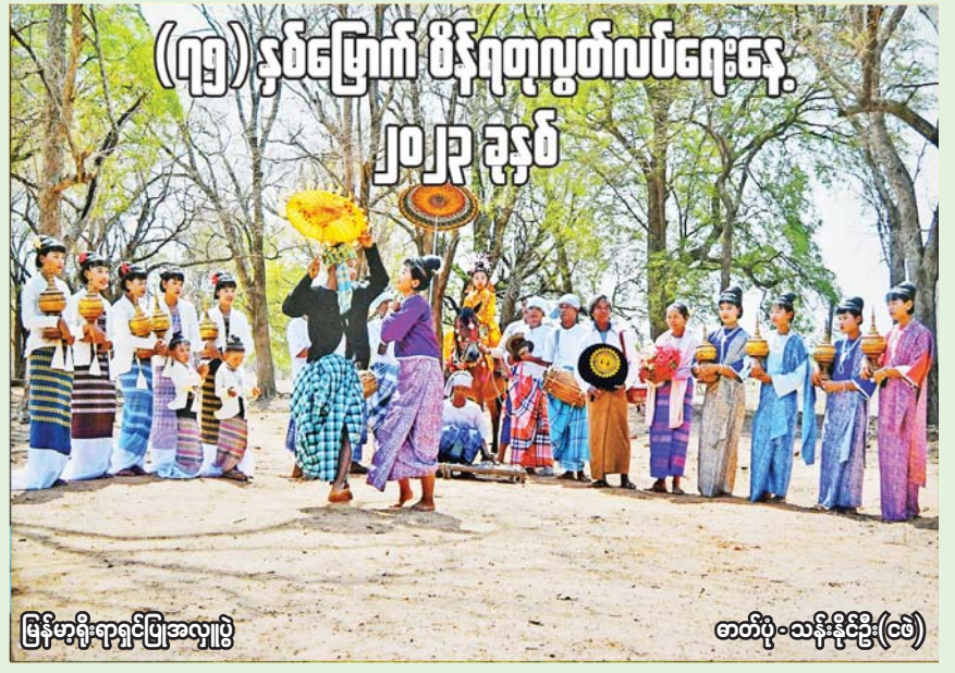
မြန်မာ့ရိုးရာရှင်ပြုအလှူပွဲ တစ်ပိုင်းသန်းနိုင်ဦး(ခေ)

[ဗိုလ်ချုပ်အောင်ဆန်း ၁၉၄၇ ခုနှစ် ဇွန်လဆန်း၌ ဗမာနိုင်ငံလုံး ဆိုင်ရာ မီးသတ်အစည်းအရုံးကြီးတွင် ပြောကြားသော မိန့်ခွန်းမှ ကောက်နုတ်ချက်]