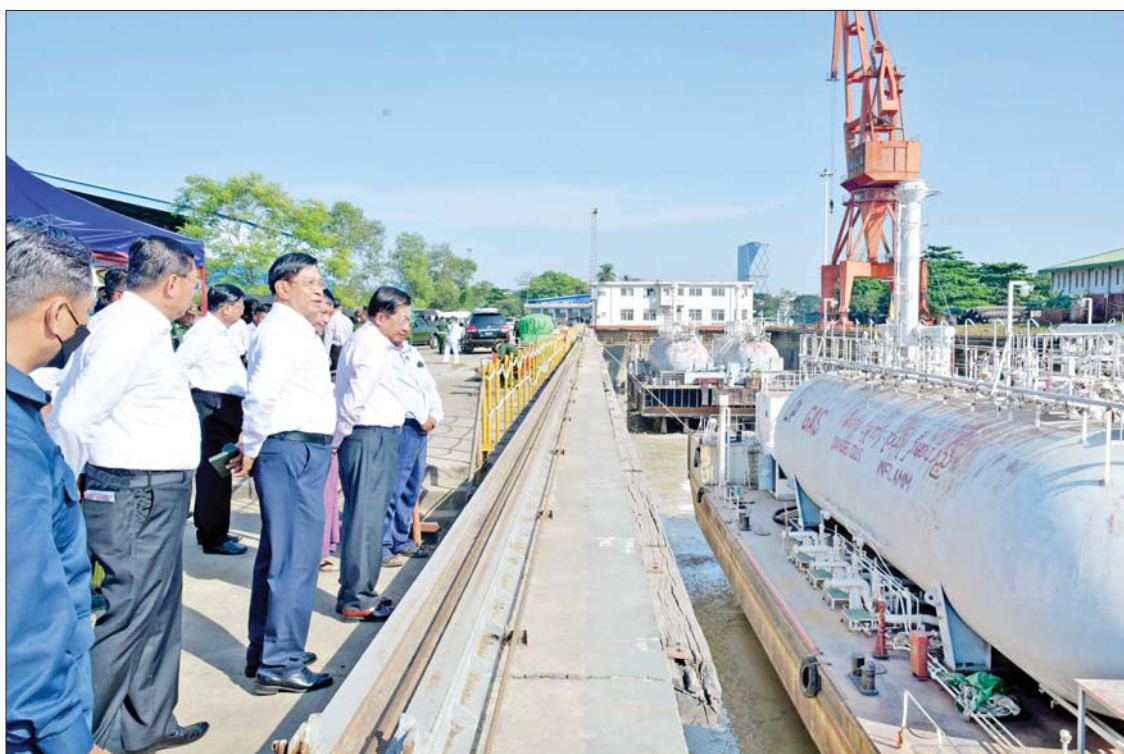
နိုင်ငံတော်စီမံအုပ်ချုပ်ရေးကောင်စီဥက္ကဋ္ဌ နိုင်ငံတော်ဝန်ကြီးချုပ် ဗိုလ်ချုပ်မှူးကြီး မင်းအောင်လှိုင်နှင့် အဖွဲ့ဝင်များ မြန်မာ့သင်္ဘောကျင်းလုပ်ငန်းအတွင်း ကြည့်ရှုစစ်ဆေးစဉ်။

နေပြည်တော် ဒီဇင်ဘာ ၂၀ နိုင်ငံတော်စီမံအုပ်ချုပ်ရေးကောင်စီ ဥက္ကဋ္ဌ နိုင်ငံတော်ဝန်ကြီးချုပ် ဗိုလ်ချုပ်မှူးကြီး မင်းအောင်လှိုင်သည် ဒီဇင်ဘာ ၂၀ ရက် မွန်းလွဲပိုင်းတွင် တွဲဖက်အတွင်းရေးမှူး ဒုတိယဗိုလ်ချုပ်ကြီး ရဲဝင်းဦး၊ ပြည်ထောင်စုဝန်ကြီးများ၊ ရန်ကုန်တိုင်းဒေသကြီးဝန်ကြီးချုပ်၊ ကာကွယ်ရေးဦးစီးချုပ်ရုံးမှ တပ်မတော်အရာရှိကြီးများ၊ ရန်ကုန်တိုင်းစစ်ဌာနချုပ် တိုင်းမှူး၊ ရန်ကုန်မြို့တော်ဝန်နှင့် တာဝန်ရှိသူများ လိုက်ပါ၍ ရန်ကုန်တိုင်းဒေသကြီး ကမာရွတ်မြို့နယ်ရှိ ပို့ဆောင်ရေးနှင့် ဆက်သွယ်ရေးဝန်ကြီးဌာန မြန်မာ့သင်္ဘောကျင်းလုပ်ငန်းသို့ သွားရောက်ကြည့်ရှုစစ်ဆေးသည်။ ဦးစွာ နိုင်ငံတော်စီမံအုပ်ချုပ်ရေးကောင်စီဥက္ကဋ္ဌ နိုင်ငံတော်ဝန်ကြီးချုပ်နှင့် အဖွဲ့ဝင်များအား ပို့ဆောင်ရေးနှင့် ဆက်သွယ်ရေးဝန်ကြီးဌာန ပြည်ထောင်စုဝန်ကြီး ဗိုလ်ချုပ်ကြီး တင်အောင်စန်းနှင့် မြန်မာ့သင်္ဘောကျင်းလုပ်ငန်း ဦးဆောင်ညွှန်ကြားရေးမှူး ဦးကျော်နိုင်အေးတို့က မြန်မာ့သင်္ဘောကျင်းလုပ်ငန်း၏ သမိုင်းအကျဉ်း၊ လုပ်ငန်းဆောင်ရွက်ခဲ့မှုနှင့် လုပ်ငန်းဆောင်ရွက်လျက်ရှိသည့်အခြေအနေများ၊ မြန်မာ့သင်္ဘောကျင်းလုပ်ငန်းကပြည်တွင်း၊ ပြည်ပမှ ရေယာဉ်များကို တည်ဆောက်ခြင်း၊ ပြုပြင်ခြင်းလုပ်ငန်းများ ဆောင်ရွက်လျက်ရှိသည့်အခြေအနေများကို ရှင်းလင်းတင်ပြကြသည်။ ရှင်းလင်းတင်ပြမှုများအပေါ်နိုင်ငံတော်