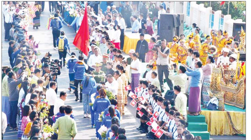
အမျိုးသမီးအားကစားဆက်တော်မတီ၊ အသင်းအဖွဲ့ များနှင့် စေတနာရှင်များမှ လှူဒါန်းငွေများကို များနှင့်နည်းပြများကို ဂုဏ်ပြုငွေများ ချီးမြှင့်ပြီး ဂုဏ်ပြုနေ့လယ်စာ အတူတကွ သုံးဆောင်ခဲ့ ကြောင်း သိရသည်။ သတင်းစဉ်

၎င်းနောက် မန္တလေးတိုင်းဒေသကြီးဝန်ကြီးချုပ် သည် တိုင်းဒေသကြီးအစိုးရအဖွဲ့၊ အလယ်ပိုင်း တိုင်းစစ်ဌာနချုပ်၊ တိုင်းဒေသကြီးအားကစားနှင့် ကာယပညာဦးစီးဌာန၊ ဘောလုံးဆက်တော်မတီ၊ မန္တလေးတိုင်းဘောလုံးအဖွဲ့ချုပ်၊ ဝှူဂျူးအဖွဲ့ချုပ်၊