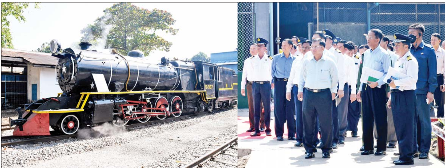
နိုင်ငံတော်စီမံအုပ်ချုပ်ရေးကောင်စီဥက္ကဋ္ဌ နိုင်ငံတော်ဝန်ကြီးချုပ် ဗိုလ်ချုပ်မှူးကြီးမင်းအောင်လှိုင်နှင့်အဖွဲ့ဝင်များ ရေဇွေးငွေ့စက်ခေါင်းအား ကျောက်မီးသွေးသုံးစက်ခေါင်းအဖြစ် ပြုပြင်ထားရှိသည့် မီးရထားစက်ခေါင်း စမ်းသပ်မောင်းနှင်နေမှုကို ကြည့်ရှုစစ်ဆေးစဉ်။

မြန်မာ့မီးရထားသည် တိုင်းပြည်ဖွံ့ဖြိုးတိုးတက်ရေးအတွက် အဓိကကျသည့် အဖွဲ့အစည်းတစ်ခုဖြစ်သဖြင့် မီးရထားဝန်ထမ်းများ၏ တာဝန်ထမ်းဆောင်မှုသည် အရေးပါသည်ကိုလည်း သတိပြုစေလိုကြောင်း၊ ကုန်စည်စီးဆင်းမှုများ လျင်မြန်စေရေး၊ ပြည်သူများ ဈေးနှုန်းသက်သာစွာဖြင့် သွားလာနိုင်ရေးအတွက် ရထားလမ်း ကွန်ရက်များအားလုံး ရထားပြေးဆွဲနိုင်အောင် ဆောင်ရွက်ပေးရမည်ဖြစ်ကြောင်း၊ စက်ခေါင်းစက်ရုံ(အင်းစိန်) ၏တာဝန်အနေဖြင့် ရထားတစ်စင်းလုံး၏ အဓိကဖြစ်သည့် စက်ခေါင်းတွဲများကို ထုတ်လုပ်တပ်ဆင်ခြင်း၊ ပြုပြင်ထိန်းသိမ်းခြင်းများကို ဆောင်ရွက်ခြင်းပင်ဖြစ်ကြောင်း၊ ဒီဇယ်လျှပ်စစ်စက်ခေါင်းများကို အဓိကထား ထုတ်လုပ်တပ်ဆင်သည်ကို တွေ့ရှိရပြီး စက်ခေါင်းတွဲများ ကြံ့ခိုင်ကောင်းမွန်မှသာ မြန်မာ့မီးရထားကဏ္ဍသည်လည်း ဖွံ့ဖြိုးတိုးတက်လာမည်ဖြစ်ကြောင်း၊ လက်ရှိအချိန်တွင် ကမ္ဘာ့နိုင်ငံအသီးသီး၌ စက်သုံးဆီဈေးနှုန်းမြင့်တက်မှုများကို ကြုံတွေ့နေကြရကြောင်း၊ စက်သုံးဆီတင်သွင်းနေမှုများကို လျှော့ချနိုင်ရေးအတွက် သယ်ယူပို့ဆောင်ရေးလုပ်ငန်းများတွင် လျှပ်စစ်စွမ်းအင်သုံး ပို့ဆောင်ရေးယာဉ်များကို ပြောင်းလဲအသုံးပြုနိုင်ရေး ဆောင်ရွက်နိုင်ရန် လိုကြောင်း၊ မိမိတို့နိုင်ငံ၌ လျှပ်စစ်ရထားပြေးဆွဲနိုင်မည့် အခွင့်အလမ်းများ များစွာ