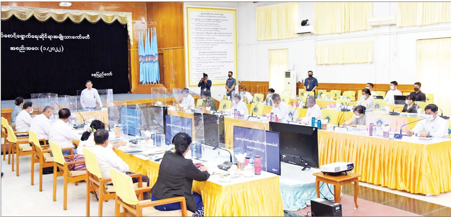
နိုင်ငံတော်စီမံအုပ်ချုပ်ရေးကောင်စီ ဒုတိယဥက္ကဋ္ဌ ဒုတိယဝန်ကြီးချုပ် ဒုတိယဗိုလ်ချုပ်မှူးကြီးစိုးဝင်း လူမှုကာကွယ်စောင့်ရှောက်ရေးဆိုင်ရာအမျိုးသားကော်မတီ အစည်းအဝေး (၁/၂၀၂၂)တွင် အမှာစကားပြောကြားစဉ်။

နေပြည်တော် ဒီဇင်ဘာ ၂၁ လူမှုကာကွယ်စောင့်ရှောက်ရေး ဆိုင်ရာ အမျိုးသားကော်မတီ အစည်းအဝေး(၁/၂၀၂၂)ကို ယနေ့ မွန်းလွဲ ၁ နာရီခွဲတွင် နေပြည်တော် ရှိ လူမှုဝန်ထမ်း၊ ကယ်ဆယ်ရေးနှင့် ပြန်လည်နေရာချထားရေးဝန်ကြီးဌာန အစည်းအဝေးခန်းမ၌ ကျင်းပ ရာ လူမှုကာကွယ်စောင့်ရှောက်ရေး ဆိုင်ရာ အမျိုးသားကော်မတီဥက္ကဋ္ဌ နိုင်ငံတော်စီမံအုပ်ချုပ်ရေးကောင်စီ ဒုတိယဥက္ကဋ္ဌ ဒုတိယဝန်ကြီးချုပ် ဒုတိယဗိုလ်ချုပ်မှူးကြီး စိုးဝင်း တက်ရောက်အမှာစကားပြောကြား သည်။ အစည်းအဝေးသို့ ကော်မတီဝင် ပြည်ထောင်စုဝန်ကြီးများ၊ ဒုတိယ ဝန်ကြီးများ၊ အခွန်အယူခံခုံအဖွဲ့ ဥက္ကဋ္ဌ၊ ဒုတိယစာရင်းစစ်ချုပ်၊ အမြဲတမ်းအတွင်းဝန်၊ ညွှန်ကြား ရေးမှူးချုပ်များနှင့် တာဝန်ရှိသူများ တက်ရောက်ကြသည်။ စာမျက်နှာ ၁၀ ကော်လံ ၁ သို့ *