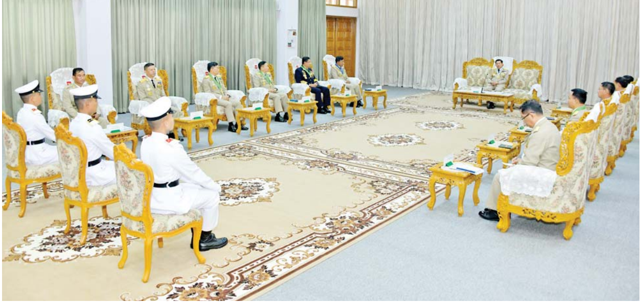
နိုင်ငံတော်စီမံအုပ်ချုပ်ရေးကောင်စီဥက္ကဋ္ဌ နိုင်ငံတော်ဝန်ကြီးချုပ် ဗိုလ်ချုပ်မှူးကြီး မဟာသရေစည်သူ မင်းအောင်လှိုင် ထူးချွန်ဆုရရှိကြသည့် ဗိုလ်လောင်းများကို တွေ့ဆုံအမှာစကားပြောကြားစဉ်။

☆ စာမျက်နှာ ၄ မှ ထိုကဲ့သို့ ဆောင်ရွက်ရာတွင် လူကိုယ်တိုင် ဝင်ရောက်ထိန်းချုပ် ပြီး ခွဲစိတ်ကုသမှုပြုလုပ်နိုင်သည့် စက်ရုပ်များနှင့် သုံးဖက်မြင် နည်းပညာ (Three Dimension) ကို အသုံးပြုပြီး တိကျမှုအလွန် ကောင်းမွန်သည့် ခြေတုလက်တု ထုတ်လုပ်နိုင်သည့် စက်များကိုပါ တီထွင်ဖန်တီး အသုံးပြုနေကြပြီ ဖြစ်ခြင်းကြောင့် ခေတ်မီ နည်းပညာပိုင်းဆိုင်ရာ သုတေသန လုပ်ငန်းများကို စဉ်ဆက်မပြတ် ဆက်လက်ဆောင်ရွက်သွားကြရန် မှာကြားလိုကြောင်း။