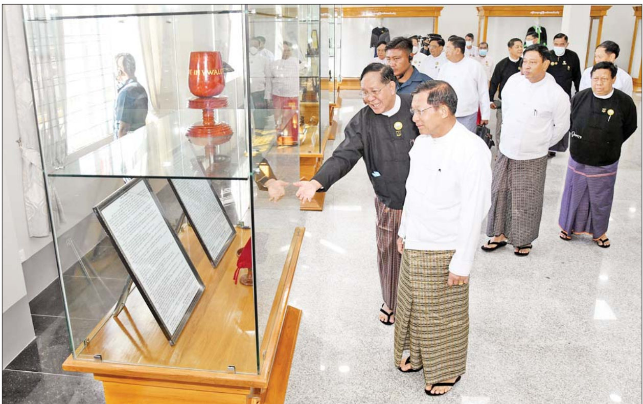
နိုင်ငံတော်စီမံအုပ်ချုပ်ရေးကောင်စီဥက္ကဋ္ဌ နိုင်ငံတော်ဝန်ကြီးချုပ် ဗိုလ်ချုပ်မှူးကြီးမင်းအောင်လှိုင်နှင့် အဖွဲ့ဝင်များ မွန်ပြည်နယ် တရားလွှတ်တော်အဆောက်အအုံသစ်အတွင်း လှည့်လည်ကြည့်ရှုကြစဉ်။

ဆက်လက်၍ ပြည်ထောင်စု တရားသူကြီးချုပ်က မွန်ပြည်နယ်