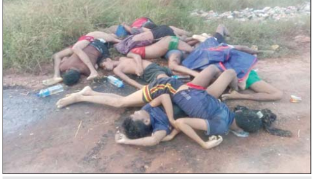
၅-၁၂-၂၀၂၂ရက်တွင်လှည်းကူးမြို့နယ် ဘားလားကျေးရွာအနီး၌ ဘင်္ဂလီလူမျိုး ၁၃ ဦးအား သေဆုံးလျက်ရှိသည်ကို တွေ့ရစဉ်။