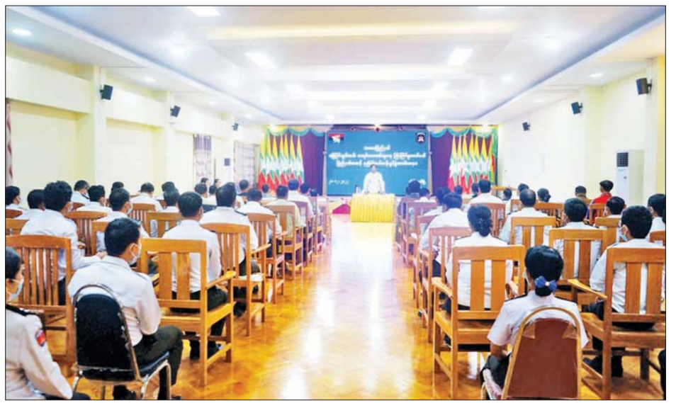
ခွဲကြွကြောင်း၊ ပြည်နယ်အဆင့် နည်းပြများက ဆင့်ပွားသင်တန်းများ ဆက်လက်ပို့ချပေးသွားမည် ဖြစ်ကြောင်း သိရသည်။ ပြည်နယ်(ပြန်/ဆက်)

ယင်းနောက် ပြည်နယ်ဝန်ကြီးချုပ်နှင့် တာဝန်ရှိ သူများက သင်တန်းသားများအား ရင်းရင်းနှီးနှီး တွေ့ဆုံနှုတ်ဆက်၍ အားပေးစကားပြောကြားသည်။ အဆိုပါသင်တန်းကို ဒီဇင်ဘာ ၂၀ ရက်မှ ၂၁ ရက် အထိ ပို့ချပေးသွားမည်ဖြစ်ပြီး ပြည်နယ်အတွင်းရှိ မြို့နယ်အသီးသီးမှ သင်တန်းသား ၂၀ တက်ရောက်