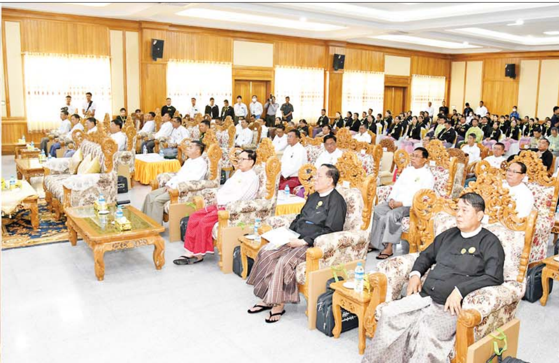
နိုင်ငံတော်စီမံအုပ်ချုပ်ရေးကောင်စီဥက္ကဋ္ဌ နိုင်ငံတော်ဝန်ကြီးချုပ် ဗိုလ်ချုပ်မှူးကြီးမင်းအောင်လှိုင် မွန်ပြည်နယ်တရားလွှတ်တော်အဆောက်အအုံသစ်ဖွင့်လှစ်ခြင်းနှင့် ပတ်သက်၍ အမှာစကားပြောကြားစဉ်။

နေပြည်တော် ဒီဇင်ဘာ ၂၀ မွန်ပြည်နယ် တရားလွှတ်တော်အဆောက်အအုံသစ် ဖွင့်ပွဲ အခမ်းအနားကို ယနေ့ နံနက်ပိုင်းတွင် မွန်ပြည်နယ် မော်လမြိုင်မြို့ရှိ အဆိုပါရုံးနေရာ၌ ကျင်းပပြုလုပ်ရာ နိုင်ငံတော်စီမံအုပ်ချုပ်ရေး ကောင်စီဥက္ကဋ္ဌ နိုင်ငံတော်ဝန်ကြီးချုပ် ဗိုလ်ချုပ်မှူးကြီးမင်းအောင်လှိုင် တက်ရောက်ချီးမြှင့်သည်။ အခမ်းအနားသို့ တွဲဖက်အတွင်းရေးမှူး ဒုတိယဗိုလ်ချုပ်ကြီး ရဲဝင်းဦး၊ နိုင်ငံတော်စီမံအုပ်ချုပ်ရေးကောင်စီအဖွဲ့ဝင်များ၊ ပြည်ထောင်စု တရားသူကြီးချုပ် ဦးထွန်းထွန်းဦး၊ ပြည်ထောင်စုဝန်ကြီးများ၊ မွန်ပြည် နယ်ဝန်ကြီးချုပ် ဦးဇော်လင်းထွန်း၊ ကာကွယ်ရေးဦးစီးချုပ်ရုံးမှ တပ်မတော်အရာရှိကြီးများ၊ အရှေ့တောင်တိုင်းစစ်ဌာနချုပ်တိုင်းမှူး ဗိုလ်ချုပ်မြတ်သက်ဦး၊ တိုင်းဒေသကြီးအစိုးရအဖွဲ့၊ တိုင်းဒေသကြီး၊ ခရိုင်၊ မြို့နယ်အဆင့် ဌာနဆိုင်ရာများမှ တာဝန်ရှိသူများ၊ ဖိတ်ကြားထား သူများ တက်ရောက်ကြသည်။ စာမျက်နှာ ၃ ကော်လံ ၁ သို့ ☆