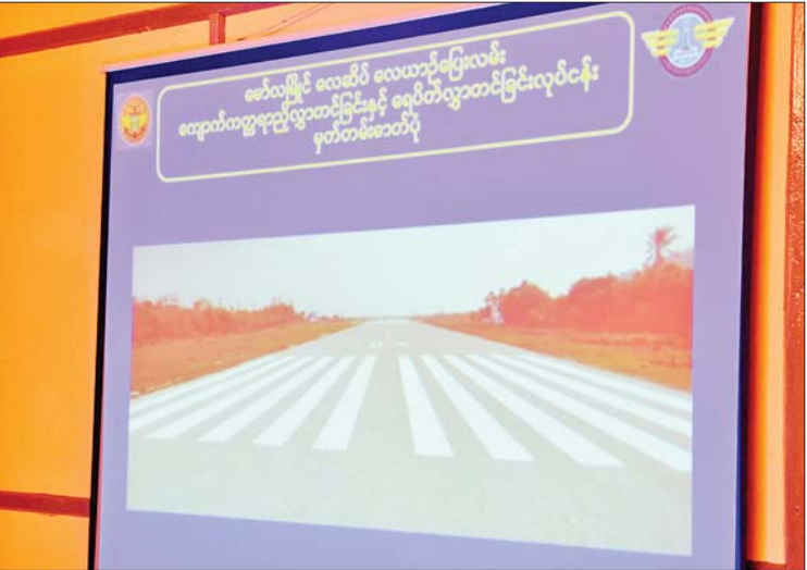
နိုင်ငံတော်စီမံအုပ်ချုပ်ရေးကောင်စီဥက္ကဋ္ဌ နိုင်ငံတော်ဝန်ကြီးချုပ် ဗိုလ်ချုပ်မှူးကြီး မင်းအောင်လှိုင်အား ပြည်ထောင်စုဝန်ကြီး ဗိုလ်ချုပ်ကြီးတင်အောင်စန်းက မော်လမြိုင်လေဆိပ် အဆင့်မြှင့်တင်ဆောင်ရွက်နေမှုအခြေအနေများနှင့် ပတ်သက်၍ ရှင်းလင်းတင်ပြစဉ်။

သာယာလှပရေးအတွက်လည်း တာဝန်ရှိသူများ အနေဖြင့် ကြပ်မတ် ဆောင်ရွက်ကြရန် လိုကြောင်း၊ ထို့ပြင် အသစ်ထပ်မံဖောက်လုပ်မည့် မော်လမြိုင်-ထားဝယ် ရထားလမ်းပိုင်း တည်ဆောက်ရာတွင်လည်း လမ်းကြောင်း ပြေပြစ်မှုရှိစေရေးနှင့် တတ်နိုင်သမျှ တစ်ဖြောင့်တည်း ဖြစ်စေရေး စနစ်တကျကွင်းဆင်း တွက်ချက် ဆောင်ရွက်သွားရန် လိုကြောင်းနှင့် လုပ်ငန်းများ ဆောင်ရွက်ရာတွင် ရေရှည်အကျိုးကိုကြည့်၍ မြော်တွေးဆောင်ရွက် ကြရန်လိုကြောင်း မှာကြားခဲ့ကြောင်း သိရသည်။ သတင်းစဉ်