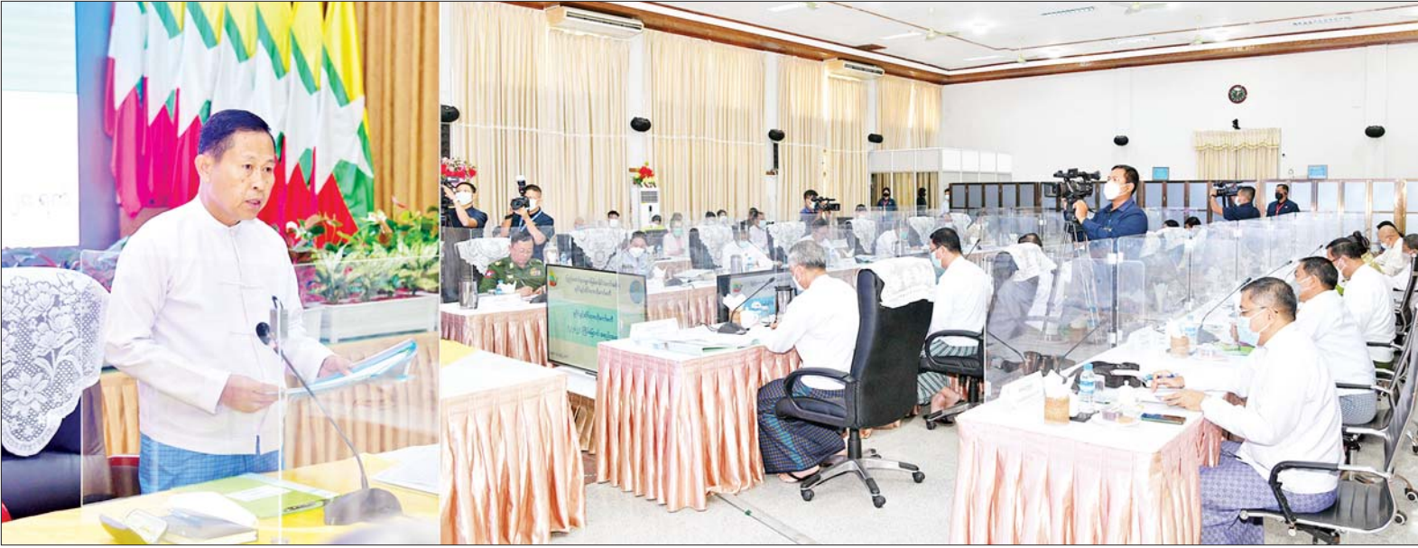
နိုင်ငံတော်စီမံအုပ်ချုပ်ရေးကောင်စီ ဒုတိယဥက္ကဋ္ဌ ဒုတိယဝန်ကြီးချုပ် ဒုတိယဗိုလ်ချုပ်မှူးကြီးစိုးဝင်း မူပိုင်ခွင့်ဆိုင်ရာဗဟိုကော်မတီအစည်းအဝေး (၂/၂၀၂၂)တွင် အမှာစကား ပြောကြားစဉ်။

နေပြည်တော် ဒီဇင်ဘာ ၂၀ မူပိုင်ခွင့်ဆိုင်ရာဗဟိုကော်မတီအစည်းအဝေး(၂/၂၀၂၂)ကို ယနေ့မွန်းလွဲ ၂ နာရီတွင် နေပြည်တော်ရှိ စီးပွားရေးနှင့် ကူးသန်းရောင်းဝယ်ရေးဝန်ကြီးဌာန ညီလာခံခန်းမ၌ ကျင်းပရာ မူပိုင်ခွင့်ဆိုင်ရာ ဗဟိုကော်မတီဥက္ကဋ္ဌ နိုင်ငံတော်စီမံအုပ်ချုပ်ရေးကောင်စီ ဒုတိယဥက္ကဋ္ဌ ဒုတိယဝန်ကြီးချုပ် ဒုတိယဗိုလ်ချုပ်မှူးကြီးစိုးဝင်း တက်ရောက်အမှာစကား ပြောကြားသည်။