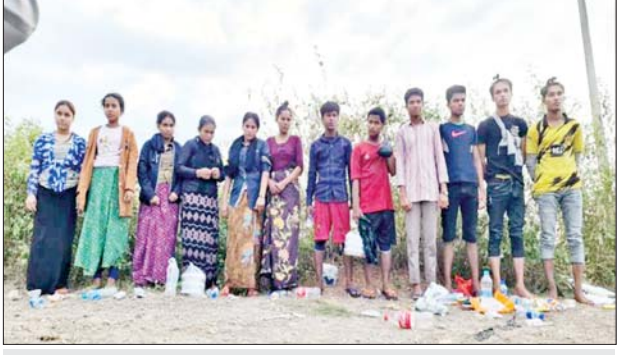
၈-၁၂-၂၀၂၂ ရက်တွင် မင်္ဂလာဒုံမြို့နယ် ရွှေ့သွားရေးဌာနအနီး၌ ဖမ်းဆီးရမိခဲ့သည့် ဘင်္ဂလီလူမျိုးများကို တွေ့ရစဉ်။