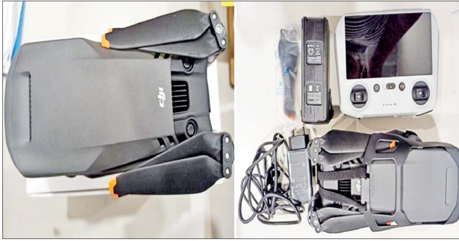
ရန်ကုန်အပြည်ပြည်ဆိုင်ရာလေဆိပ်၌ သိမ်းဆည်းရမိသည့် DJI Drone များကို တွေ့ရစဉ်။

တရားမဝင်ကုန်သွယ်မှု တိုက်ဖျက်ရေးဦးဆောင်ကော်မတီ၏ ကြီးကြပ်ကွပ်ကဲမှုဖြင့် တရားမဝင်ကုန်သွယ်မှုများကို ဥပဒေနှင့်အညီ ထိရောက်စွာ တားဆီးအရေးယူနိုင်ရေး ဆောင်ရွက်လျက်ရှိရာ အကောက်ခွန်ဦးစီးဌာန၏ စီမံခန့်ခွဲမှုဖြင့် တာဝန်ကျ ပူးပေါင်းစစ်ဆေးရေးအဖွဲ့များက စစ်ဆေးမှုများ ဆောင်ရွက်ခဲ့ရာ ဒီဇင်ဘာ ၁၆ ရက်တွင် အကောက်ခွန်ဦးစီးဌာန၏ စီမံခန့်ခွဲမှုဖြင့် ရန်ကုန်အပြည်ပြည်ဆိုင်ရာ လေဆိပ်၌ တာဝန်ကျစစ်ဆေးရေးအဖွဲ့က စစ်ဆေးမှုများ ဆောင်ရွက်ခဲ့ရာ တရားဝင်စာရွက်စာတမ်း အထောက်အထား တင်ပြနိုင်ခြင်းမရှိသော DJI Drone နှစ်စင်း (ခန့်မှန်းတန်ဖိုးငွေကျပ် ၁၉၃၀၀၀၀)ကို သိမ်းဆည်းရမိခဲ့ပြီး အကောက်ခွန် လုပ်ထုံးလုပ်နည်းနှင့်အညီ အရေးယူဆောင်ရွက်လျက်ရှိသည်။