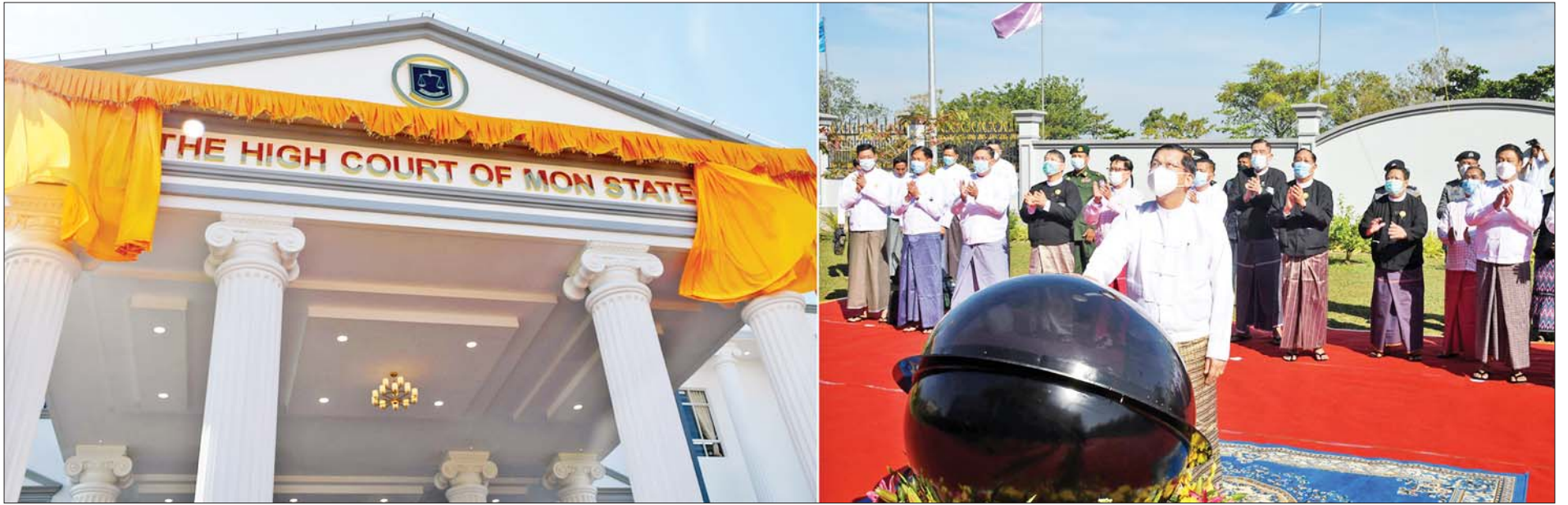
နိုင်ငံတော်စီမံအုပ်ချုပ်ရေးကောင်စီဥက္ကဋ္ဌ နိုင်ငံတော်ဝန်ကြီးချုပ် ဗိုလ်ချုပ်မှူးကြီး မင်းအောင်လှိုင် မွန်ပြည်နယ်တရားလွှတ်တော်ဆိုင်းဘုတ်အား စက်ခလုတ်နှိပ်ဖွင့်လှစ်ပေးစဉ်။

☆ ရှေ့ဖုံးမှ ဦးစွာနိုင်ငံတော်စီမံအုပ်ချုပ်ရေးကောင်စီဥက္ကဋ္ဌ နိုင်ငံတော်ဝန်ကြီးချုပ်နှင့် အဖွဲ့ဝင်များသည် မွန်ပြည်နယ် တရားလွှတ်တော်အဆောက်အအုံသစ် ဖွင့်ပွဲအခမ်းအနားသို့ ရောက်ရှိကြရာ ဒေသခံတိုင်းရင်းသားများနှင့် ဥပဒေရေးရာဝန်ထမ်းများက ကြိုဆိုနှုတ်ဆက်ကြသည်။ ယင်းနောက် ပြည်ထောင်စု တရားသူကြီးချုပ် ဦးထွန်းထွန်းဦး၊ ဆောက်လုပ်ရေးဝန်ကြီးဌာန ပြည်ထောင်စုဝန်ကြီးဦးမျိုးသန့်၊ ပြည်နယ်ဝန်ကြီးချုပ်