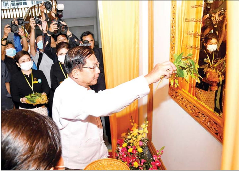
နိုင်ငံတော်စီမံအုပ်ချုပ်ရေးကောင်စီဥက္ကဋ္ဌ နိုင်ငံတော်ဝန်ကြီးချုပ် ဗိုလ်ချုပ်မှူးကြီးမင်းအောင်လှိုင် မွန်ပြည်နယ်တရားလွှတ်တော် ကမ္ဘည်းမော်ကွန်းအား အမွှေးနံ့သာရည်ဖြင့် ပက်ဖျန်းပေးစဉ်။

ဥပဒေပြုရေး၊ အုပ်ချုပ်ရေး၊ တရားစီရင်ရေးဟူသည့် နိုင်ငံတော်၏ အာဏာကြီး(၃)ရပ်တွင် တရားစီရင်ရေးအာဏာကို ပြည်ထောင်စု တရားလွှတ်တော်ချုပ်က ကျင့်သုံးဆောင်ရွက်နေခြင်းဖြစ်ကြောင်း၊ တရားဥပဒေစိုးမိုးရေး အခန်းကဏ္ဍဟူသည် အရေးကြီးသည့် မဏ္ဍိုင်တစ်ရပ်ဖြစ်ပြီး ပြည်သူတစ်ရပ်လုံး၏ နေ့စဉ်လူမှုဘဝ လုံခြုံရေးအတွက်လည်း မရှိမဖြစ်သည့် ကဏ္ဍတစ်ခုဖြစ်ကြောင်း။ နိုင်ငံတော်အစိုးရ အနေဖြင့် ပြည်သူလူထု၏ ဆန္ဒနှင့်အညီ စစ်မှန်၍ စည်းကမ်းပြည့်ဝသော ပါတီစုံဒီမိုကရေစီစနစ်ခိုင်မာရေးနှင့် ဒီမိုကရေစီနှင့် ဖက်ဒရယ်စနစ်ကို အခြေခံသော ပြည်ထောင်စုတည်ဆောက်ရေးဟူသည့် နိုင်ငံရေးလုပ်ငန်းစဉ် (၂)ရပ် ချမှတ်ဆောင်ရွက်လျက်ရှိကြောင်း၊ မိမိတို့အားလုံးမျှော်မှန်းတည်ဆောက်နေသည့် ဒီမိုကရေစီခိုင်မာရေးဆောင်ရွက်ရာတွင် လွတ်လပ်ခြင်း၊ ငြိမ်းချမ်းခြင်း၊ တရားမျှတခြင်း စသည့်အခြေခံလိုအပ်ချက်များကို ဖြစ်ပေါ်စေရေးအတွက် တရားရေးကဏ္ဍသည် အလွန်အရေးကြီးကြောင်း၊ ဖွဲ့စည်းပုံအခြေခံဥပဒေတွင် ပြဋ္ဌာန်းထားသည့် “နိုင်ငံတော်သည်မည်သူ့ကိုမဆို ဥပဒေအရာတွင်တန်းတူညီမျှအခွင့်အရေးရှိစေရမည်၊ ထို့အပြင် ဥပဒေ၏ အကာအကွယ်ကိုလည်း တန်းတူညီမျှစွာ ရယူပိုင်ခွင့်ပေးရမည်” ဟူသည့် ပြဋ္ဌာန်းချက်များအတိုင်း လိုက်နာဆောင်ရွက်ပေးကြရမည်ဖြစ်ကြောင်း၊ တစ်နည်းအားဖြင့် “ဥပဒေအထက်တွင် မည်သူမျှ မရှိစေရ” ဟူသည့် အတိုင်း အဘက်ဘက်က မှန်ကန်တိကျပြီး တရားမျှတမှုရှိသည့် စီရင်ဆုံးဖြတ်ချက်များနှင့် နိုင်ငံနှင့် ပြည်သူလူထုအကျိုးကိုဆောင်ရွက်နိုင်ကြရန်လည်း တိုက်တွန်းမှာကြားလိုကြောင်း။