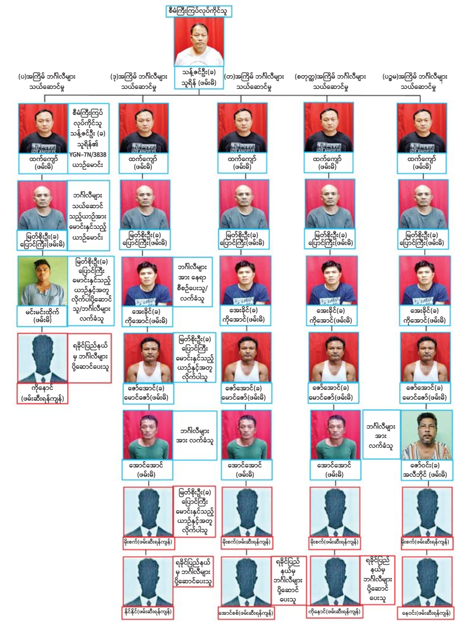
ဘင်္ဂလီလူမျိုးများအား တရားမဝင်သယ်ယူပို့ဆောင်ရာတွင် ပူးပေါင်းပါဝင်ပတ်သက်သူများ၏ အခြေပြဇယား