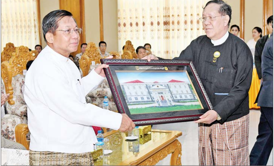
နိုင်ငံတော်စီမံအုပ်ချုပ်ရေးကောင်စီဥက္ကဋ္ဌ နိုင်ငံတော်ဝန်ကြီးချုပ် ဗိုလ်ချုပ်မှူးကြီး မင်းအောင်လှိုင်ထံ ပြည်ထောင်စုတရားသူကြီးချုပ် ဦးထွန်းထွန်းဦးက မွန်ပြည်နယ်တရားလွှတ်တော် ဖွင့်လှစ်ခြင်းအထိမ်းအမှတ် အဆောက်အအုံပုံစံငယ် ကျောက်စိပ်နန်းချီကားကို ပေးအပ်စဉ်။

ကြောင့်ခေါက်ရေတိုးချဲ့ပြေးဆွဲရန် ကန့်သတ်ချက်ရှိခြင်း၊ လေယာဉ်ပြေးလမ်းအား တိုးချဲ့ရန် ကန့်သတ်ချက်ရှိခြင်းတို့ကြောင့် မော်လမြိုင်လေဆိပ်ကို နေရာသစ်သို့ ပြောင်းရွှေ့ရန်အတွက် စီမံဆောင်ရွက်လျက်ရှိကြောင်း၊ ထို့ကြောင့် မွန်ပြည်နယ်နှင့် ကရင်ပြည်နယ် ဖွံ့ဖြိုးတိုးတက်ရေးအတွက် အထောက်အကူပြုနိုင်သည့် ပြည်တွင်းလေကြောင်းလိုင်းများမှ လေယာဉ်အမျိုးအစားအားလုံး ဆင်းသက်နိုင်သည့် အဆင့်မီ လေယာဉ်ကွင်းတစ်ခု တည်ဆောက်ရန် စီမံဆောင်ရွက်လျက်ရှိကြောင်း၊ ရန်ကုန်-မော်လမြိုင်-ရေးရထားလမ်းပိုင်းကို ခရီးသွားပြည်သူများ သွားလာနိုင်ရေးအတွက် လူစီးရထားတွဲများ ပြန်လည်ပြေးဆွဲပေးရန်နှင့် ကုန်စည်များ ပို့ဆောင်ရန်လိုအပ်ပါကလည်း ကုန်တင်ရထားတွဲများ ပြေးဆွဲနိုင်ရေး ဆောင်ရွက်ပေးသွားရန်လိုကြောင်း၊ အဆိုပါ ရထားလမ်းပိုင်းအား အမြဲတမ်း စဉ်ဆက်မပြတ်သွားလာနိုင်ရေး စနစ်တကျဖြင့် ထိန်းသိမ်းပြုပြင်အဆင့်မြှင့်တင်နေရန်လိုကြောင်း၊ ရထားလမ်းပိုင်း တစ်လျှောက်