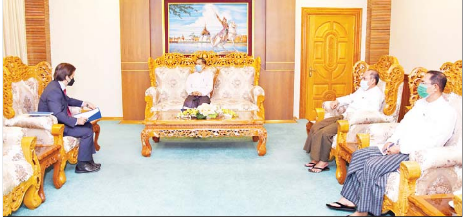
ချင်းဖလှယ် ဆွေးနွေးကြသည်။ တွေ့ဆုံပွဲသို့ အပြည်ပြည်

မြန်မာနိုင်ငံရှိ ပြည်သူများအတွက် စနစ်တကျ ရွှေ့ပြောင်းသွားလာခြင်းဆိုင်ရာ ဝန်ဆောင်မှုများ၊ အကူအညီများ ပေးအပ်လျက်ရှိသည့် အခြေအနေနှင့် IOM ၏ မြန်မာနိုင်ငံ၌ ဆောင်ရွက်လျက်ရှိသော လုပ်ငန်းစဉ်များကို အမြင်