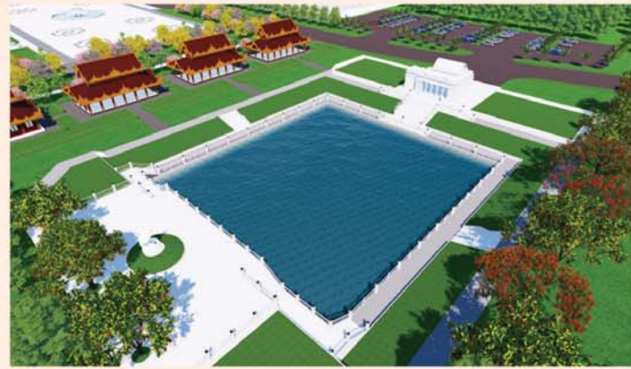
ကျောက်စာရုံစေတီ(၁၂ x ၁၂x ၁၈)ပေ ၁ ဆူ တန်ဖိုး-၂၇၉ သိန်း