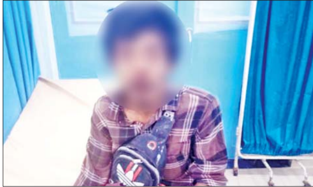
ချယ်ရီ(၂)ရေယာဉ်မိုင်းပေါက်ကွဲမှုကြောင့် ဒဏ်ရာရရှိသူ တစ်ဦး ကို တွေ့ရစဉ်။

ပြည်သူ ၁၇ ဦး မိုင်းစထိမှန်ဒဏ်ရာများ ရရှိခဲ့ကြောင်းနှင့် ဒဏ်ရာရလူနာ များအား ရန်ကုန်ပြည်သူ့ဆေးရုံကြီးသို့ ပို့ဆောင်ဆေးကုသမှု ခံယူစေ လျက်ရှိကြောင်း သိရသည်။