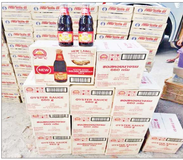
ရန်ကုန် - မန္တလေး အမြန်လမ်း တံတားဦးအပိုင်းထိပ် BOC ဆီဆိုင်အနီး၌ သိမ်းဆည်းရမိသည့် စားသောက်ကုန်ပစ္စည်းများကို တွေ့ရစဉ်။

နေပြည်တော် ဒီဇင်ဘာ ၁၉ တရားမဝင်ကုန်သွယ်မှု တိုက်ဖျက်ရေး ဦးဆောင်ကော်မတီ၏ ကြီးကြပ်ကွပ်ကဲမှုဖြင့် တရားမဝင်ကုန်သွယ်မှုများကို ဥပဒေနှင့်အညီ ထိရောက်စွာ တားဆီးအရေးယူနိုင်ရေး ဆောင်ရွက်လျက်ရှိရာ အကောက်ခွန်ဦးစီးဌာန၏ စီမံခန့်ခွဲမှုဖြင့် တာဝန်ကျပူးပေါင်းစစ်ဆေးရေးအဖွဲ့များက စစ်ဆေးမှုများ ဆောင်ရွက်ခဲ့ရာ ဒီဇင်ဘာ ၁၇ ရက်တွင် မွန်ပြည်နယ် မရမ်းချောင်းမြို့နယ်၊ စစ်ဆေးရေးစခန်း၌ မြဝတီမြို့မှ ရန်ကုန်မြို့သို့ မောင်းနှင်လာသော မော်တော်ယာဉ်တစ်စီးပေါ်မှ သွင်းကုန်ကြေညာလွှာ (ID) တွင် ကြေညာထားခြင်းမရှိသည့် MDF Board (Medium Density Fibreboard) ကီလိုဂရမ် ၂၅၀၀ (ခန့်မှန်းတန်ဖိုးငွေကျပ် ၂၀၀၀၀၀)၊ အဆိုပါပစ္စည်းများ တင်ဆောင်လာသည့် Cheng Long, Tractor Head တစ်စီးနှင့် နောက်တွဲယာဉ်တစ်စီး (ခန့်မှန်းတန်ဖိုးငွေကျပ် ၁၅၀၀၀၀၀) ကိုလည်းကောင်း၊ ဒီဇင်ဘာ ၁၈ ရက်တွင် မော်လမြိုင်မြို့ ဂေါက်ကလပ် ကျွဲခြံကုန်းကျေးရွာအနီးတွင် မော်တော်ယာဉ်တစ်စီးပေါ်မှ တရားဝင် တင်သွင်းခွင့်အထောက်အထား တစ်စုံတစ်ရာ တင်ပြနိုင်ခြင်းမရှိသည့် ကတ္တရာပုံး ၅၀၀၀ ကီလိုဂရမ် (ခန့်မှန်းတန်ဖိုးငွေကျပ် ၆၀၀၀၀၀) နှင့် အဆိုပါ