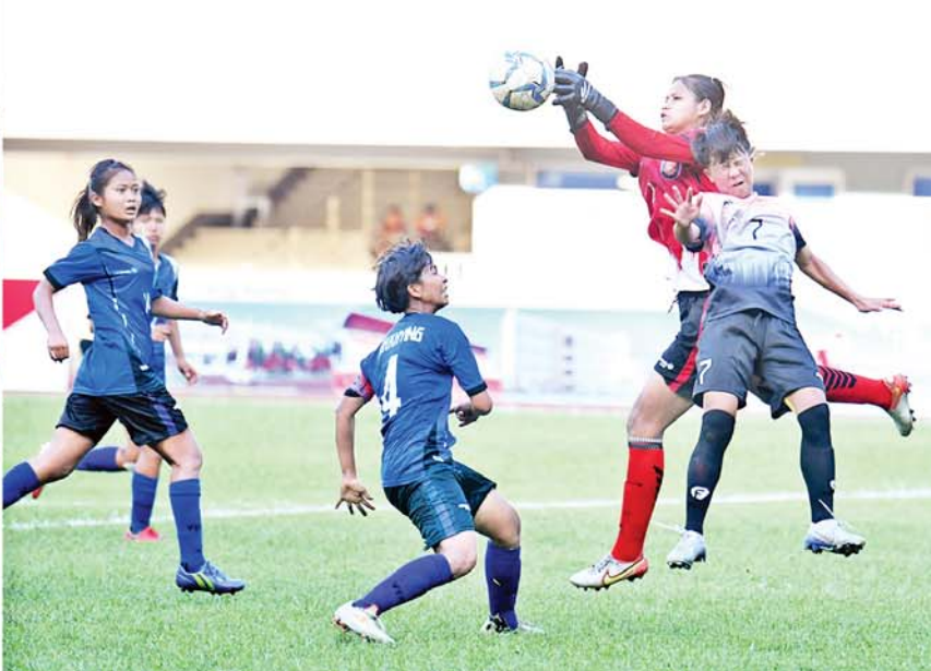
နိုင်ငံတော်စီမံအုပ်ချုပ်ရေးကောင်စီဥက္ကဋ္ဌ နိုင်ငံတော်ဝန်ကြီးချုပ် ဗိုလ်ချုပ်မှူးကြီးမင်းအောင်လှိုင်နှင့် ဇနီး ဒေါ်ကြူကြူလှ တို့ စိန်ရတုလွတ်လပ်ရေးနေ့အထိမ်းအမှတ် နိုင်ငံတော်စီမံအုပ်ချုပ်ရေးကောင်စီဥက္ကဋ္ဌ ဖလား ပြည်နယ်နှင့် တိုင်းဒေသကြီး(အလွတ်တန်းဖိတ်ခေါ်) အသက်(၁၈)နှစ်အောက် အမျိုးသမီးဘောလုံးပြိုင်ပွဲ ဗိုလ်လုပွဲယှဉ်ပြိုင်နေမှုကို ကြည့်ရှုအားပေးစဉ်။