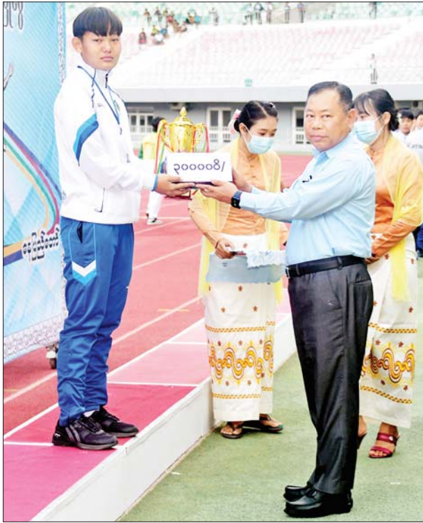
နိုင်ငံတော်စီမံအုပ်ချုပ်ရေးကောင်စီဝင် ဒုတိယဗိုလ်ချုပ်ကြီးစိုးထွဋ် အကောင်းဆုံးအားကစားသမားဆုရရှိသူတစ်ဦးအား ဂုဏ်ပြုဆုတံဆိပ်နှင့် ချီးမြှင့်ငွေ ပေးအပ်စဉ်။