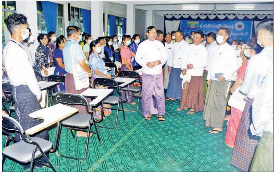
အဆိုပါသင်တန်းအား တိုင်းဒေသကြီးအတွင်းရှိ ရပ်ကွက်/ကျေးရွာ စာကြည့်တိုက်များမှ စာကြည့်တိုက်မှူးသင်တန်းသား ၂၆ ဦး၊ သင်တန်းသူ ၂၂ ဦး တက်ရောက်ကြပြီး သင်တန်းအား ဒီဇင်ဘာ ၁၉ ရက် မှ ၂၁ ရက်ထိ သင်ကြားပေးသွားမည်ဖြစ်ကြောင်း သိရသည်။ တိုင်းဒေသကြီး(ပြန်/ဆက်)

ယင်းနောက် တိုင်းဒေသကြီးဝန်ကြီးချုပ်က သင်တန်း ဆရာ ဆရာမများ၊ သင်တန်းသား သင်တန်းသူများကို ရင်းရင်းနှီးနှီး တွေ့ဆုံနှုတ်ဆက်၍ သင်ခန်းစာသင်ကြားနေမှုများကို ကြည့်ရှုသည်။