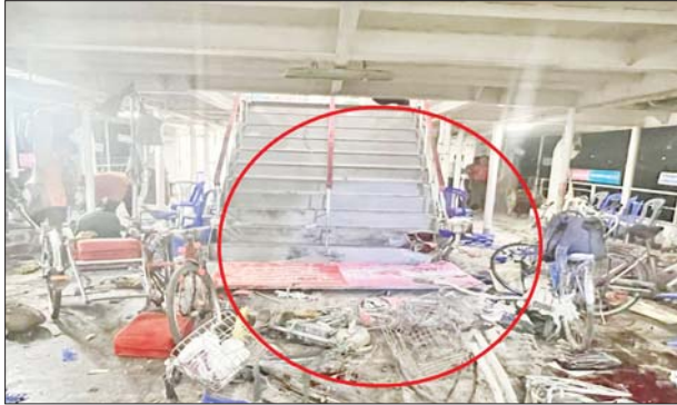
ရန်ကုန်တိုင်းဒေသကြီး ချယ်ရီ(၂)ရေယာဉ် မိုင်းပေါက်ကွဲမှုကို တွေ့ရစဉ်။

ထိုသို့ လုပ်ဆောင်လျက်ရှိရာ ဒီဇင်ဘာ ၁၈ ရက် ညနေ ၆ နာရီ မိနစ် ၄၀ ခန့်တွင် ရန်ကုန်တိုင်းဒေသကြီး ဗိုလ်တထောင်မြို့နယ် မိသားစု ရပ်ကွက် ပန်းဆိုးတန်းဆိပ်ကမ်းမှ ဒလဆိပ်ကမ်းသို့ ခရီးသည်များ တင်ဆောင်မောင်းနှင်လာသည့် ပြည်တွင်းရေကြောင်းပိုင် ချယ်ရီ(၂) ရေယာဉ်အား PDF အမည်ခံအကြမ်းဖက်သမားများက ဒေသန္တရ လက်လုပ်မိုင်းတစ်လုံးဖြင့် ဖောက်ခွဲဖျက်ဆီးခဲ့ကြောင်း၊ မိုင်းဖောက်ခွဲမှု ကြောင့် ရေယာဉ်ပေါ်တွင် စီးနင်းလိုက်ပါလာသည့် အပြစ်မဲ့ခရီးသွား