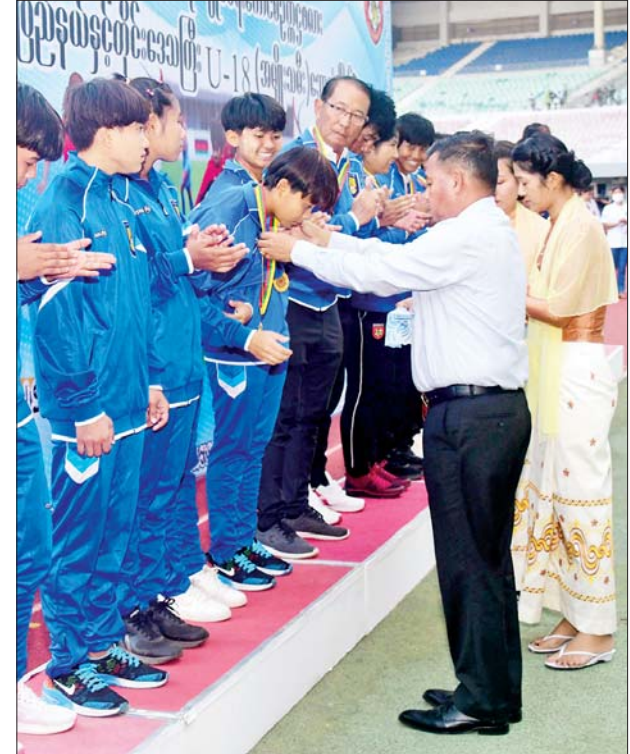
နိုင်ငံတော်စီမံအုပ်ချုပ်ရေးကောင်စီ တွဲဖက်အတွင်းရေးမှူး ဒုတိယဗိုလ်ချုပ်ကြီးရဲဝင်းဦး ပထမဆုရရှိသည့် မန္တလေးတိုင်းဒေသကြီးအသင်းအား တစ်ဦးချင်းဆုတံဆိပ်များ ပေးအပ်ချီးမြှင့်စဉ်။