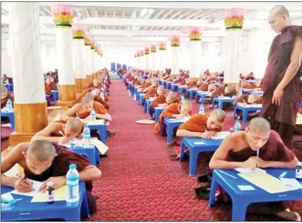
တောရရှိပံ့ပိုးသည့် သာသနာ့ရိပ်သာရပ်ကွက်ရှိ နိဗ္ဗာန်ဆိပ်ဦး ဗိမာန် တို့တွင် စာပေဌာန နှစ်ခုတို့၌ ကျင်းပခဲ့ကြောင်း သိရသည်။

ရန်ကုန်တိုင်းဒေသကြီး လှည်းကူးမြို့နယ်တွင် မဇ္ဈိမလင်္ကာရ သာမဏေကျော် စာမေးပွဲကို မဇ္ဈိမဂုဏ်ရည် မဟာစည်တောရရှိပံ့ပိုးသည့် သာသနာ့ရိပ်သာရပ်ကွက်ရှိ နိဗ္ဗာန်ဆိပ်ဦး ဗိမာန်စာပေဌာန နှစ်ခုတို့၌ တတိယနေ့အဖြစ် ဆက်လက်ပြေဆိုလျက်ရှိရာ မဇ္ဈိမလင်္ကာရ သာမဏေကျော်စာမေးပွဲကို ပရိယတ္တိသာသနာတော် တည်တံ့ခိုင်မြဲ စည်ပင်ပြန့်ပွားစေရန်နှင့် သာသနာ့အာဇာနည် အရှင်မြတ်များ တိုးပွား စေရန်ရည်ရွယ်၍ ကျင်းပခြင်းဖြစ်ပြီး ယနေ့(တတိယနေ့)တွင် ကျင်းပ သည့် ပထမအဆင့်စာမေးပွဲ၊ ဒုတိယအဆင့်စာမေးပွဲနှင့် တတိယအဆင့် စာမေးပွဲသို့ ဝင်ရောက်ပြေဆိုကြသည့် သံဃာတော်နှင့် သီလရှင် ၉၈၇ ပါး ရှိကြောင်း သိရသည်။