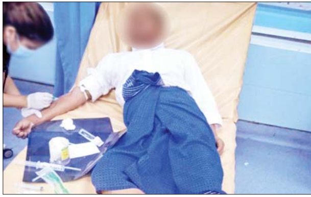
ချယ်ရီ(၂)ရေယာဉ်မိုင်းပေါက်ကွဲမှုကြောင့် ဒဏ်ရာရရှိသူများကို တွေ့ရစဉ်။