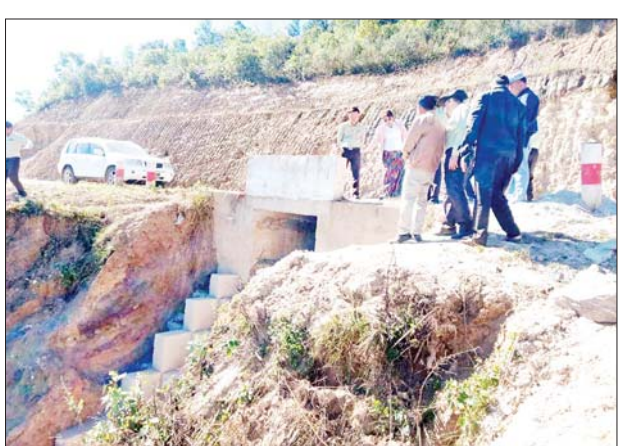
ဒသမ ၄၀၂ သန်းဖြင့် ဆောင်ရွက်လျက်ရှိကြောင်း သိရသည်။ ခရိုင်(ပြန်/ဆက်)

အဆိုပါလုပ်ငန်းများကို ၂၀၂၂-၂၀၂၃ ဘဏ္ဍာနှစ် နယ်စပ်ဒေသဖွံ့ဖြိုးရေး ပြည်ထောင်စုရန်ပုံငွေမှ ခွင့်ပြုရန်ပုံငွေကျပ် ၃၄၂