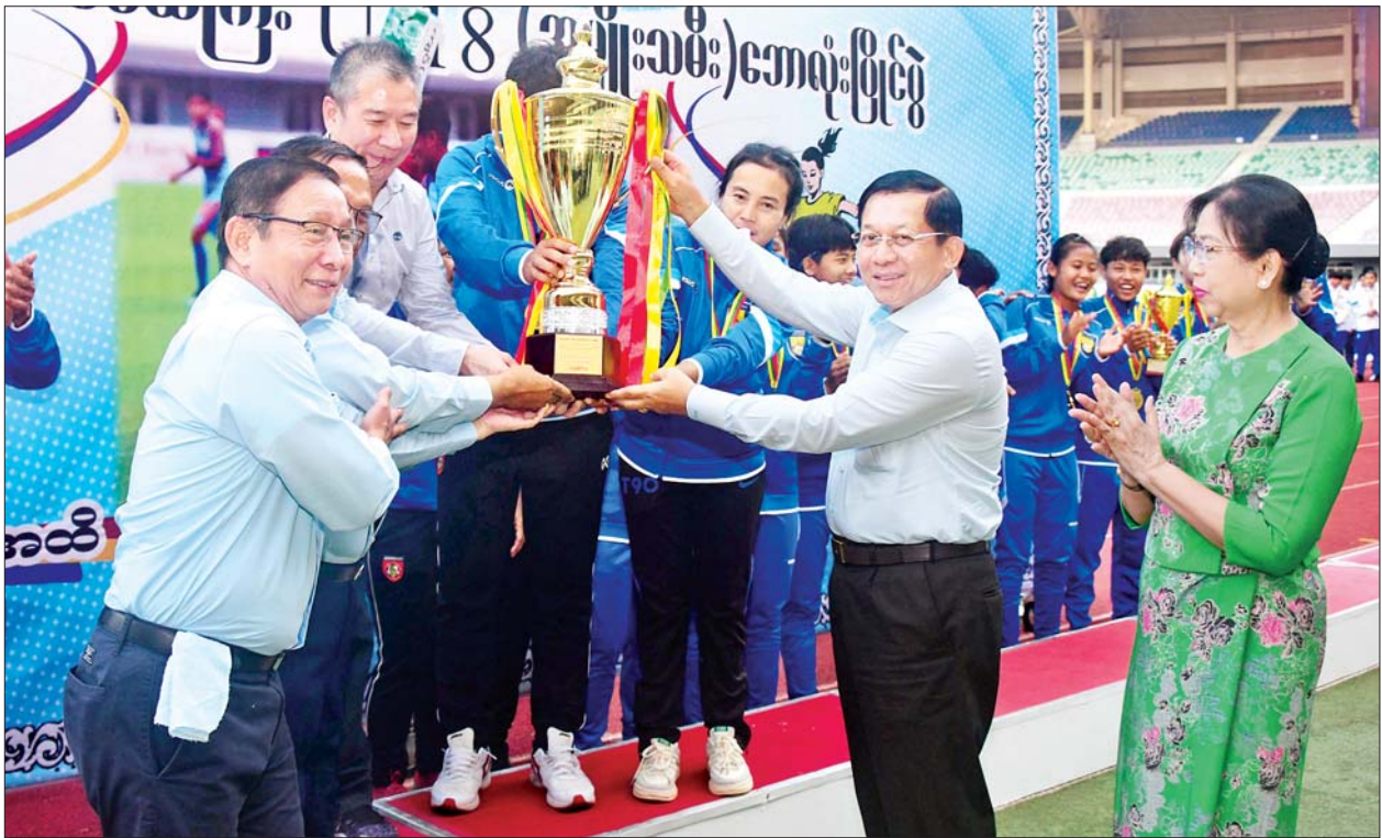
နိုင်ငံတော်စီမံအုပ်ချုပ်ရေးကောင်စီဥက္ကဋ္ဌ နိုင်ငံတော်ဝန်ကြီးချုပ် ဗိုလ်ချုပ်မှူးကြီးမင်းအောင်လှိုင်နှင့် ဇနီးဒေါ်ကြာကြာလှတို့က ပထမဆုရရှိသည့် မန္တလေးတိုင်းဒေသကြီးအသင်းအား တံခွန်စိုက်ဖလား ပေးအပ်ချီးမြှင့်စဉ်။

မြန်မာ့ဘောလုံးအားကစားလောက အဆင့်အတန်းတိုးတက်မြှင့်တင်လာစေရန်နှင့် ပြည်နယ်နှင့် တိုင်းဒေသကြီးများမှ ထူးချွန်ထက်မြက်သည့် မျိုးဆက်သစ်(အမျိုးသမီး)ဘောလုံးအားကစားသမားများစွာ ပေါ်ထွက်လာစေရန်ရည်ရွယ်၍ အားကစားနှင့် လူငယ်ရေးရာဝန်ကြီးဌာန အားကစားနှင့်ကာယပညာဦးစီးဌာနနှင့် မြန်မာနိုင်ငံဘောလုံးအဖွဲ့ချုပ်တို့ပူးပေါင်း၍ ၂၀၂၃ ခုနှစ် (၇၅)နှစ်မြောက် စိန်ရတုလွတ်လပ်ရေးနေ့အထိမ်းအမှတ်အဖြစ် နိုင်ငံတော်စီမံအုပ်ချုပ်ရေးကောင်စီဥက္ကဋ္ဌဖလား ပြည်နယ်နှင့် တိုင်းဒေသကြီး(အလွတ်တန်းဖိတ်ခေါ်) U - 18(အမျိုးသမီး) ဘောလုံးပြိုင်ပွဲ ပွဲစဉ်များကို ဒီဇင်ဘာ ၅ ရက်မှ စတင်ကျင်းပခဲ့ခြင်းဖြစ်ပြီး ယနေ့တွင် ဗိုလ်လှပွဲ ပွဲစဉ်အဖြစ် ရှမ်းပြည်နယ်အသင်းနှင့် မန္တလေးတိုင်းဒေသကြီးအသင်းတို့ ယှဉ်ပြိုင်ကစားခဲ့ခြင်းဖြစ်ကာ မန္တလေးတိုင်းဒေသကြီးအသင်းက အနိုင်ရရှိခဲ့ပြီး တံခွန်စိုက်ခိုင်းဆုကိုရရှိခဲ့ကြောင်း သိရသည်။ သတင်းစဉ်