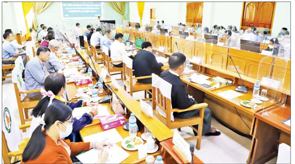
အဝေးသို့ တက်ရောက်လာသူများ၏ ဆွေးနွေးတင်ပြချက်များအပေါ် လိုအပ်သည်များကို တာဝန်ရှိသူများနှင့် ဖြည့်ဆည်း ပေါင်းစပ် ဆောင်ရွက်ပေးကာ

ထို့နောက် တိုင်းဒေသကြီးဝန်ကြီးချုပ်က အစည်း