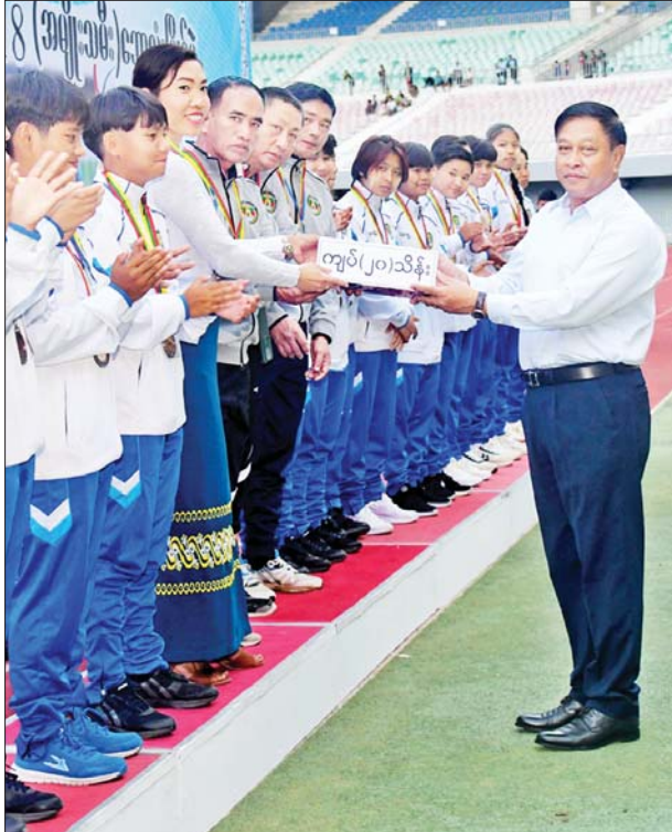
နိုင်ငံတော်စီမံအုပ်ချုပ်ရေးကောင်စီဝင် ဗိုလ်ချုပ်ကြီးတင်အောင်စန်း တတိယဆုရရှိသည့် ဧရာဝတီတိုင်းဒေသကြီးအသင်းအား တစ်ဦးချင်းဆုတံဆိပ်၊ ဂုဏ်ပြုဆုနှင့် ချီးမြှင့်ငွေ ပေးအပ်စဉ်။