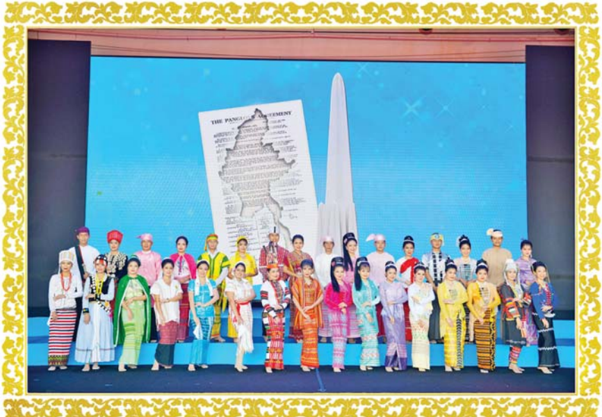
ပြည်ထောင်စုတိုင်းရင်းသားများ