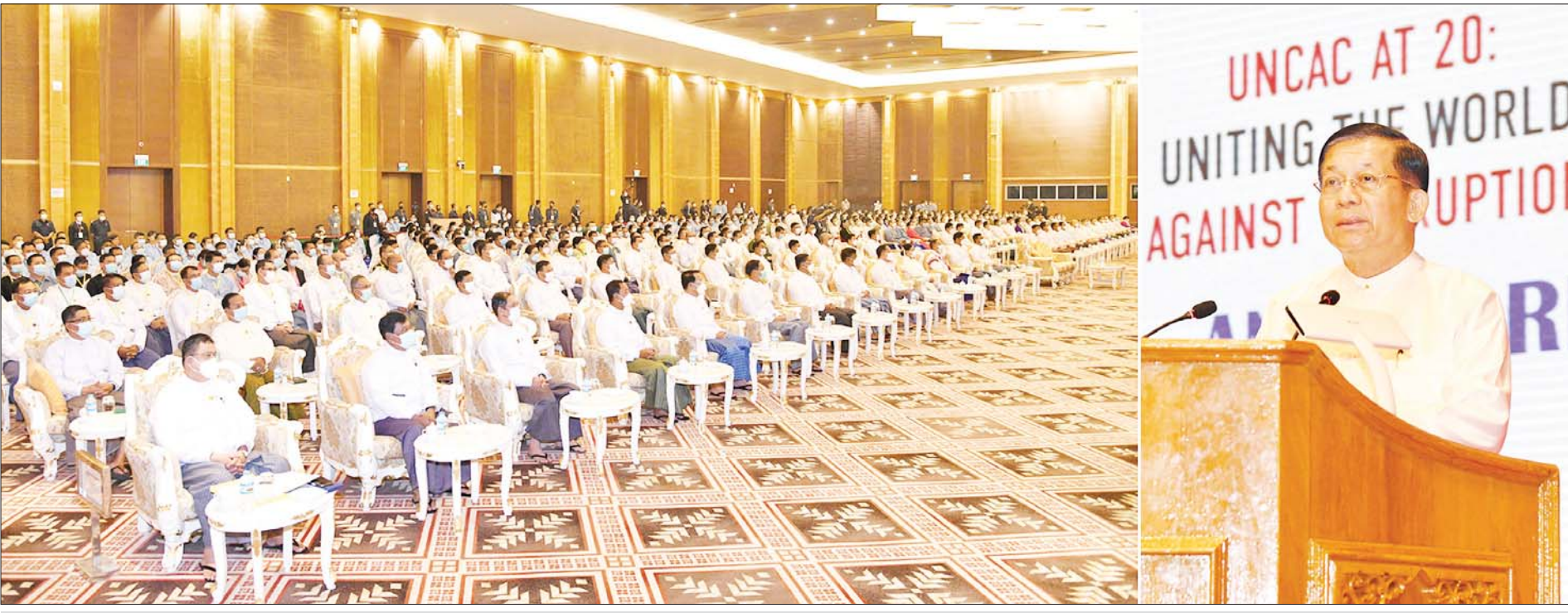
နိုင်ငံတော်စီမံအုပ်ချုပ်ရေးကောင်စီဥက္ကဋ္ဌ နိုင်ငံတော်ဝန်ကြီးချုပ် ဗိုလ်ချုပ်မှူးကြီး မင်းအောင်လှိုင် အပြည်ပြည်ဆိုင်ရာအဂတိလိုက်စားမှုတိုက်ဖျက်ရေးနေ့အခမ်းအနားတွင် အမှာစကားပြောကြားစဉ်။