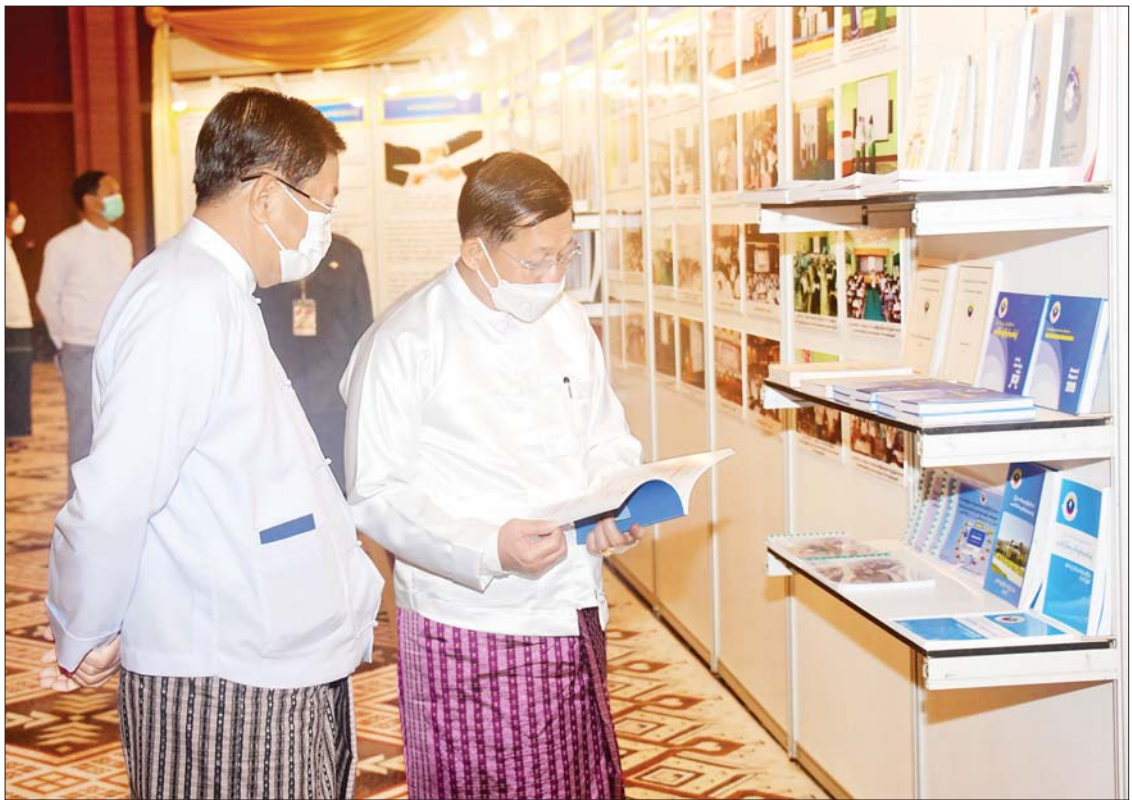
နိုင်ငံတော်စီမံအုပ်ချုပ်ရေးကောင်စီဥက္ကဋ္ဌ နိုင်ငံတော်ဝန်ကြီးချုပ် ဗိုလ်ချုပ်မှူးကြီး မင်းအောင်လှိုင် အဂတိလိုက်စားမှုတိုက်ဖျက်ရေးလှုပ်ရှားမှု မှတ်တမ်းများကို ကြည့်ရှုစဉ်။

သန့်ရှင်းသောအစိုးရနှင့် ကောင်းမွန်သော အုပ်ချုပ်ရေးစနစ် ဖြစ်ပေါ်လာစေရေး၊ အများပြည်သူဆိုင်ရာ အုပ်ချုပ်ရေးတွင် ဂုဏ်သိက္ခာနှင့် တာဝန်ယူနိုင်မှု မြင့်မားတိုးတက်လာစေရေး၊ လူ့အဖွဲ့အစည်း၊ နိုင်ငံသားများ၏ အခွင့်အရေးနှင့် အကျိုးစီးပွားများကို ထိခိုက်မှုမရှိစေရေး တို့အတွက် မိမိတို့အနေဖြင့် ဘက်ပေါင်းစုံ