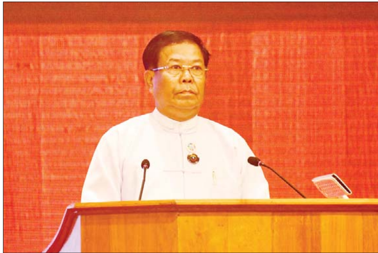
အဂတိလိုက်စားမှုတိုက်ဖျက်ရေးကော်မရှင်ဥက္ကဋ္ဌ ဦးသန်းဆွေ ရှင်းလင်းတင်ပြစဉ်။

က အလေးထား ဆောင်ရွက်လျက်ရှိသည်ကို အသိပေးပြောကြားလိုပါကြောင်း။ အဂတိလိုက်စားမှုကို အဓိပ္ပာယ်ဖွင့်ဆိုကြရာတွင် လာဘ်ပေးလာဘ်ယူခြင်းထက် ပိုမိုကျယ်ဝန်းပါကြောင်း၊ မြိမ်းခြောက်ငွေညစ်ခြင်း၊ လိမ်လည်ခြင်း၊ နိုင်ငံတော်ပိုင်ဘဏ္ဍာနှင့် ပစ္စည်းများကို အလွဲသုံးစားပြုခြင်း၊ ပြည်သူပိုင်ပစ္စည်းများကို ကိုယ်ပိုင်ပစ္စည်းအဖြစ်သုံးစွဲခြင်း၊ မလျော်ကြဇာ