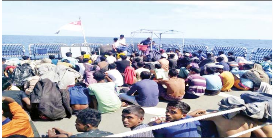
ဘင်္ဂါလီလူမျိုးများအား စစ်ရေယာဉ်ဖြင့် လွှဲပြောင်းကယ်ဆယ်လာမှု မှတ်တမ်းဓာတ်ပုံ။

ချက်အရ ၎င်းတို့သည် ဘင်္ဂလားဒေ့ရှ်နိုင်ငံ ကော့ဘာဇား ခရိုင် ဒေါ့ကာစီဒုက္ခသည်စခန်းများမှ ဖြစ်ကြောင်း၊ ဒုက္ခသည်စခန်းအတွင်း လူဦးရေများပြားခြင်း၊ လုံခြုံမှုမရှိခြင်းနှင့် စားနပ်ရိက္ခာမလုံလောက်ခြင်းတို့ ကြောင့် အင်ဒိုနီးရှားနိုင်ငံသို့သွားရောက်ရန်အတွက် လိုက်ပါလိုသူမိသားစုများထံမှ တာကာငွေ ၁၀ သိန်း ကောက်ခံပြီး စက်လှေတစ်စင်း ဝယ်ယူခဲ့ကြောင်း၊ နိုဝင်ဘာ ၂၇ ရက်တွင် အဆိုပါ စက်လှေဖြင့် အင်ဒိုနီးရှား နိုင်ငံသို့ စတင်ထွက်ခွာလာခဲ့ခြင်းဖြစ်ကြောင်း၊ ၎င်းတို့ တွင်ကုလသမဂ္ဂဒုက္ခသည်များဆိုင်ရာ မဟာမင်းကြီးရုံး (United Nations High Commissioner for Refugees-UNHCR)မှ ထုတ်ပေးထားသည့် ဒုက္ခသည် ကတ်များ ကိုင်ဆောင်ထားရှိကြောင်း၊ ဒီဇင်ဘာ ၇ ရက်တွင် လှေအတွင်းသို့ ရေများဝင်ရောက်၍ နစ်မြုပ် နေစဉ် HAI DUONG 38 ရေယာဉ်နှင့် တွေ့ဆုံခဲ့ခြင်း ဖြစ်ကြောင်းနှင့် လှေပေါ်ပါသူအားလုံး အသက်ရှင် လျက်ရှိကြောင်း သိရသည်။ ယင်းဘင်္ဂါလီလူမျိုးများအား မြိတ်မြို့နယ် လူဝင်မှုကြီးကြပ်ရေးဦးစီးဌာနပါဝင်သော အဖွဲ့စုံဖြင့် စစ်ဆေးမေးမြန်းမှုများ ဆောင်ရွက်ပြီးပါက စစ်တွေမြို့သို့ ဆက်လက်ပို့ဆောင်၍ ဥပဒေလုပ်ထုံး လုပ်နည်းများနှင့်အညီ ဆက်လက်ဆောင်ရွက်သွား မည်ဖြစ်ကြောင်း သိရသည်။ သတင်းစဉ်