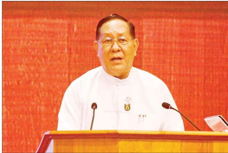
ပြည်ထောင်စုတရားသူကြီးချုပ် ဦးထွန်းထွန်းဦး ရှင်းလင်းတင်ပြစဉ်။

တံတားများသဖွယ်ဆက်သွယ်ဆက်ဆံပြီး ယုံကြည်မှု တည်ဆောက်ပေးရသူများလည်းဖြစ်ပါကြောင်း၊ ကောင်းမွန်သည့် အုပ်ချုပ်ရေးကို ပုံဖော်ရာတွင် အဂတိလိုက်စားမှုတိုက်ဖျက်ရေး လုပ်ငန်းစဉ်များသည် အရေးပါသကဲ့သို့ ပြည်သူ့ဝန်ထမ်း၊ နိုင်ငံ့ဝန်ထမ်းများ၏ စည်းကမ်းလိုက်နာမှု၊ ဖြောင့်မတ်တည်ကြည်မှုနှင့် ကျင့်ဝတ်စောင့်ထိန်းမှုများမှ လမ်းချော်လွဲမှားသွားစေသည့် အဓိကအချက်မှာ အဂတိလိုက်စားမှုပင်ဖြစ်ပါကြောင်း၊ ထို့ကြောင့် နိုင်ငံ့ဝန်ထမ်းများအနေဖြင့် သတ်မှတ်ထားသည့် စည်းမျဉ်း၊ စည်းကမ်း၊ လုပ်ထုံးလုပ်နည်း၊ ကျင့်ဝတ်များနှင့်အညီ လိုက်နာဆောင်ရွက်ကြမည်ဆိုပါက ပြည်သူများ၏ ယုံကြည်မှုကိုရရှိပြီး ကောင်းမွန်သည့် အုပ်ချုပ်မှုစနစ်ကို ဖြစ်ပေါ်စေကာ