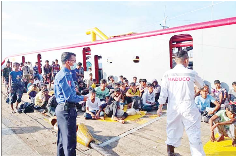
ဘင်္ဂါလီလူမျိုးများအား HAI DUONG 38 ရေယာဉ်မှ လွှဲပြောင်းပေးနေမှု မှတ်တမ်းဓာတ်ပုံ။

မြန်မာ့ရေနံနှင့် သဘာဝဓာတ်ငွေ့လုပ်ငန်း၏ ရေနံရှာဖွေရေးဖော်ရေးလုပ်ငန်းများတွင် အကျိုးတူ ပူးပေါင်းဆောင်ရွက်လျက်ရှိသော PTTEP International Limited မှ အထောက်အကူပြုရယူသည့် HAI DUONG 29 နှင့် HAI DUONG 38 ရေယာဉ်တို့သည် ဇေတီကစီမံကိန်း ကမ်းလှန် လုပ်ကွက်၌ လုပ်ငန်းများဆောင်ရွက်ရန် မြန်မာနိုင်ငံ ရေပြင်အတွင်း ဖြတ်သန်းလာစဉ် ဒီဇင်ဘာ ၇ ရက် နံနက် ၅ နာရီ ၄၅ မိနစ်ခန့်တွင် မြိတ်မြို့၏ အနောက် တောင်ဘက် ၁၅၅ မိုင်ခန့်အကွာသို့အရောက်၌ ဘင်္ဂါလီလူမျိုးများ တင်ဆောင်လာသည့် လှေတစ်စင်း သည် ရေဝင်၍နစ်မြုပ်လုနီးပါးဖြစ်နေသည်ကို တွေ့ရှိ ရသဖြင့် ကယ်ဆယ်ထားကြောင်း တပ်မတော်(ရေ) မှ လုံခြုံရေးစစ်ရေယာဉ်များသို့ သတင်းပေးပို့လာ ခဲ့သည်။