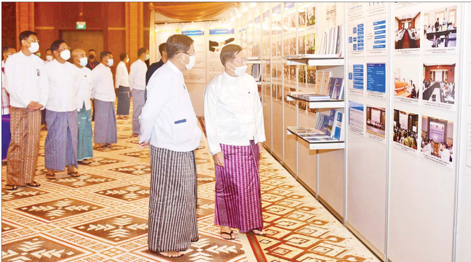
နိုင်ငံတော်စီမံအုပ်ချုပ်ရေးကောင်စီဥက္ကဋ္ဌ နိုင်ငံတော်ဝန်ကြီးချုပ် ဗိုလ်ချုပ်မှူးကြီး မင်းအောင်လှိုင် အဂတိလိုက်စားမှုတိုက်ဖျက်ရေးလှုပ်ရှားမှု မှတ်တမ်းဓာတ်ပုံများကို ကြည့်ရှုစဉ်။

အဂတိလိုက်စားမှုတိုက်ဖျက်ရေး မဟာဗျူဟာစီမံချက်နှင့်အညီ အများပြည်သူဆိုင်ရာ အဖွဲ့အစည်းများ၏ ဖြောင့်မတ်တည်ကြည်မှု မြှင့်တင်ရေးကို ပူးပေါင်းဆောင်ရွက်နိုင်ရန်အတွက် ပြည်ထောင်စုဝန်ကြီးဌာနများ၊ အဖွဲ့အစည်းများ၊ တိုင်းဒေသကြီး/ပြည်နယ်အစိုးရအဖွဲ့များတွင် အဂတိလိုက်စားမှုတားဆီးကာကွယ်ရေးအဖွဲ့ (Corruption Prevention Unit - CPU) များ တိုးချဲ့ဖွဲ့စည်းထားပြီး ဖြစ်သည့်အတွက် သက်ဆိုင်ရာအောက်ခြေအဆင့်များမှစပြီး ထိန်းသိမ်းဆောင်ရွက်ကြရန်လိုအပ်ပါကြောင်း၊ ထို့ပြင် အသေးစားအဂတိလိုက်စားမှုများကို ထိရောက်စွာ ဟန့်တားနိုင်ရန်အတွက် “အများပြည်သူထံမှ တုံ့ပြန်မှုရယူခြင်းအစီအစဉ် (Public Feedback Programme - PFP)” ကိုလည်း အကောင်အထည်ဖော်ဆောင်ရွက်လျက်ရှိပါကြောင်း၊ အဓိကအားဖြင့် မိမိ