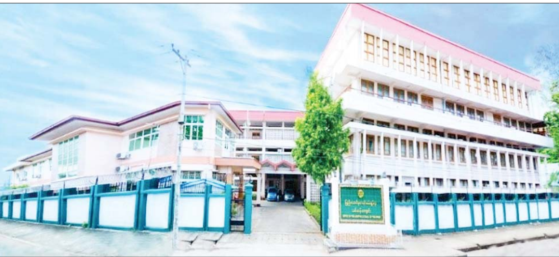
၁၉၉၃ ခုနှစ်က ပြည်ထောင်စုစာရင်းစစ်ချုပ်ရုံး သင်တန်းကျောင်း (ရန်ကုန်)ကို တွေ့ရစဉ်။

၁၃၉၂ ဦးတို့ကို လေ့ကျင့်ပေးထုတ်ပေးခဲ့ပြီးဖြစ်ပါသည်။ လေ့ကျင့်ပေးထုတ်ပေးရာ၌ အရေအတွက်သာမက စာရင်းစစ်တို့ စောင့်ထိန်းကြရမည့် ကျင့်ဝတ်သိက္ခာပိုင်းဆိုင်ရာ စိတ်ဓာတ်နှင့်သို့ချက်မြင်မားရေးတို့ကိုပါ အလေးထားလေ့ကျင့်သင်ကြားလျက်ရှိပါသည်။ ဒီပလိုမာနှင့်ဘွဲ့လွန်သင်တန်းများ နိုင်ငံပိုင်နှင့် ပုဂ္ဂလိကပိုင်ကဏ္ဍနှစ်ရပ်လုံးတွင် အရည်အချင်းပြည့်မီသော စာရင်းပညာရှင်နှင့် စာရင်းကျွမ်းကျင်သူများ မွေးထုတ်ပေးနိုင်ရန်အတွက် ဒီပလိုမာစာရင်းကိုင်သင်တန်း (Diploma in Accountancy - DA) နှင့် လက်မှတ်ရပြည်သူ့စာရင်းကိုင်သင်တန်း (Certified Public Accountant - CPA) များကို ရန်ကုန်သင်တန်းကျောင်းနှင့် နေပြည်တော် သင်တန်းကျောင်းတို့တွင် တစ်ပြိုင်တည်း ဖွင့်လှစ်သင်ကြားပေးလျက်ရှိပါသည်။ ယနေ့အထိ ဒီပလိုမာစာရင်းကိုင်သင်တန်း အောင်မြင်ပြီးသူ ၄၇၁၄ ဦးနှင့် လက်မှတ်ရပြည်သူ့စာရင်းကိုင်သင်တန်းအောင်မြင်ပြီးသူ ၂၆၆၆