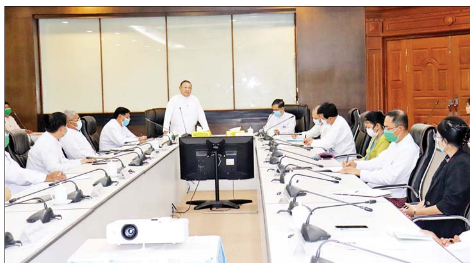
ပြည်ထောင်စုဝန်ကြီး ဦးဝဏ္ဏမောင်လွင် ပြည်ပရှိ မြန်မာသံရုံး၊ အဖွဲ့ရုံးနှင့် ကောင်စစ်ဝန်ချုပ်ရုံးများသို့ သွားရောက်တာဝန်ထမ်းဆောင်ကြမည့် အရာထမ်း၊ အမှုထမ်းများအား ဂုဏ်ပြုစကားပြောကြားစဉ်။

နေပြည်တော် ဒီဇင်ဘာ ၈ မြန်မာသံရုံး၊ မြန်မာအမြဲတမ်းကိုယ်စားလှယ် အဖွဲ့ရုံးနှင့် မြန်မာကောင်စစ်ဝန်ချုပ်ရုံးများသို့ သွားရောက်တာဝန်ထမ်းဆောင်ကြမည့် အရာထမ်း၊ အမှုထမ်းများအား ပြည်ထောင်စုဝန်ကြီးများက တွေ့ဆုံအမှာစကားပြောကြားသည့် အခမ်းအနားကို ယနေ့ နံနက် ၁၀ နာရီတွင် နိုင်ငံခြားရေးဝန်ကြီးဌာန ဧရာဝတီခန်းမ၌ ကျင်းပရာ နိုင်ငံခြားရေးဝန်ကြီးဌာန ပြည်ထောင်စုဝန်ကြီး၊ အပြည်ပြည်ဆိုင်ရာပူးပေါင်း ဆောင်ရွက်ရေးဝန်ကြီးဌာန ပြည်ထောင်စုဝန်ကြီး၊ နိုင်ငံခြားရေးဝန်ကြီးဌာန ဒုတိယဝန်ကြီး၊ အမြဲတမ်း အတွင်းဝန်နှင့် ဦးစီးဌာနအသီးသီးမှ ညွှန်ကြားရေးမှူး ချုပ်များ၊ ဒုတိယညွှန်ကြားရေးမှူးချုပ်များနှင့် ပြည်ပ သို့ သွားရောက်တာဝန်ထမ်းဆောင်ကြမည့် ဝန်ထမ်း များ တက်ရောက်ကြသည်။