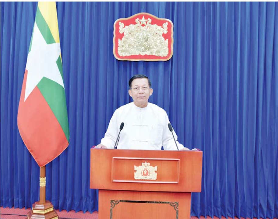
နိုင်ငံတော်စီမံအုပ်ချုပ်ရေးကောင်စီဥက္ကဋ္ဌ နိုင်ငံတော်ဝန်ကြီးချုပ် ဗိုလ်ချုပ်မှူးကြီးမင်းအောင်လှိုင် (၂၁)ကြိမ်မြောက် မြန်မာ့တိုင်းရင်းဆေးသမားတော်များညီလာခံနှင့် မြန်မာ့တိုင်းရင်းဆေးပညာ နီးနှောဖလှယ်ပွဲသို့ Video Message ဖြင့် ဂုဏ်ပြုမိန့်ခွန်းပြောကြားစဉ်။

မြန်မာ့တိုင်းရင်းဆေးပညာဟာ ရှေးဘုရင်များ လက်ထက် တကောင်း၊ သရေခေတ္တရာ၊ ပုဂံ၊ အင်းဝ၊ ပင်းယ၊ ကုန်းဘောင်စတဲ့ ခေတ်အဆက်ဆက် ကတည်းက ထွန်းကားလာခဲ့တဲ့ ဆေးပညာတစ်ရပ် ဖြစ်ပါတယ်။ မြန်မာနိုင်ငံအတွင်းမှာ မှီတင်းနေထိုင် ကြတဲ့တိုင်းရင်းသားလူမျိုးပေါင်းစုံ အားကိုးယုံကြည် စွာနဲ့ လက်ဆင့်ကမ်း သုံးစွဲခဲ့ကြတဲ့ ဆေးပညာလည်း ဖြစ်ပါတယ်။ မြန်မာလူမျိုးတို့ဟာ မြန်မာ့တိုင်းရင်း ဆေးပညာနဲ့ နေထိုင်ကြကာ ကျန်းမာအသက်ရှည် ခဲ့ကြပြီး နိုင်ငံကိုကာကွယ်စောင့်ရှောက်နိုင်ခဲ့ကြပါ တယ်။ မြန်မာ့ဆေးပညာဟာ နယကြီးလေးပါးနဲ့ ဖွဲ့စည်းတည်ဆောက်ထားတာ ဖြစ်တဲ့အတွက် မြန်မာ့ရေမြေသာတာဝန် ကိုက်ညီပြီး တခြားနိုင်ငံ တွေက ဆေးဝါးတွေနဲ့မတူဘဲ အဆင့်မီတဲ့ ယုဉ်ဖက် ဆေးပညာတစ်ရပ်အဖြစ်နဲ့ သမိုင်းအဆက်ဆက်