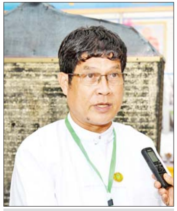
ဦးသန်းညွန့်

အဆိုပါအခမ်းအနားသို့တက်ရောက် လာကြသည့် ကျန်းမာရေးဝန်ကြီးဌာန တိုင်းရင်းဆေးပညာဦးစီးဌာနမှ တာဝန် ရှိသူများ၊ တိုင်းဒေသကြီးနှင့်ပြည်နယ် များမှ ပြခန်း တာဝန်ခံများ၊ မြန်မာနိုင်ငံ တိုင်းရင်းဆေးကောင်စီနှင့် တိုင်းရင်း ဆေးထုတ်လုပ်သူများ၏ စကားသံများ ကို စုစည်းဖော်ပြလိုက်ပါသည်။