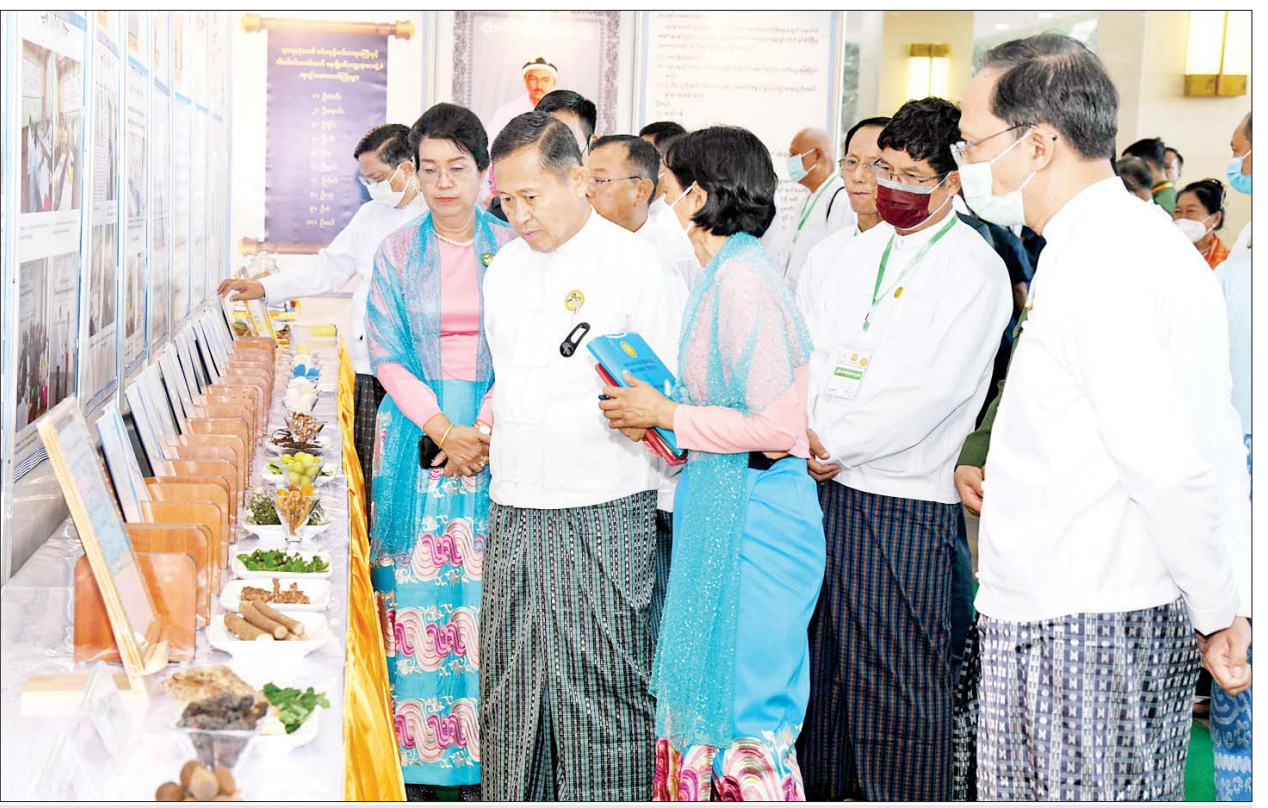
နိုင်ငံတော်စီမံအုပ်ချုပ်ရေးကောင်စီ ဒုတိယဥက္ကဋ္ဌ ဒုတိယဝန်ကြီးချုပ် ဒုတိယဗိုလ်ချုပ်မှူးကြီးစိုးဝင်း တိုင်းဒေသကြီးနှင့် ပြည်နယ်များအလိုက် ခင်းကျင်းပြသထားသည့် တိုင်းရင်းဆေးပြခန်းများကို ကြည့်ရှုအားပေးစဉ်။

MSME လုပ်ငန်းများ အောင်မြင် ရေးတွင်လည်း တစ်ခန်းတစ်ကဏ္ဍ မှ ပါဝင်သည့်အတွက် နိုင်ငံတော် ၏ GDP တိုးတက်မြှင့်တင်မှုကို လည်း အထောက်အကူပြုနိုင်မှု အခြေအနေများ၊ နိုင်ငံတော်အနေ ဖြင့်လည်း မြန်မာ့တိုင်းရင်းဆေး ထုတ်လုပ်ရေး လုပ်ငန်းများ၏ လိုအပ်ချက်များကို အတတ်နိုင်ဆုံး ဖြည့်ဆည်း ဆောင်ရွက်ပေးသွား မည့် အခြေအနေများနှင့်စပ်လျဉ်း ၍ အကျယ်တဝင့် ဆွေးနွေး ပြောကြားသည်။ ထို့နောက် တိုင်းရင်းဆေးပညာ ဦးစီးဌာန၏ ဆောင်ရွက်ချက် မှတ်တမ်း Video ကို ပြသသည်။ ယင်းနောက် နိုင်ငံတော်စီမံ အုပ်ချုပ်ရေးကောင်စီ ဒုတိယ ဥက္ကဋ္ဌ ဒုတိယဝန်ကြီးချုပ်နှင့် အဖွဲ့ဝင်များသည် တိုင်းရင်းဆေး သမားတော်များ၊ တိုင်းရင်းဆေးဝါး ထုတ်လုပ်သူများ၊ ကိုယ်စားလှယ် တော်ကြီးများ၊ တာဝန်ရှိသူများ နှင့်အတူ စုပေါင်းမှတ်တမ်းတင် ဓာတ်ပုံများ ရိုက်ကြသည်။ ဖွင့်ပွဲ အခမ်းအနားအပြီးတွင် နိုင်ငံတော်စီမံအုပ်ချုပ်ရေးကောင်စီ ဒုတိယဥက္ကဋ္ဌ ဒုတိယဝန်ကြီးချုပ်