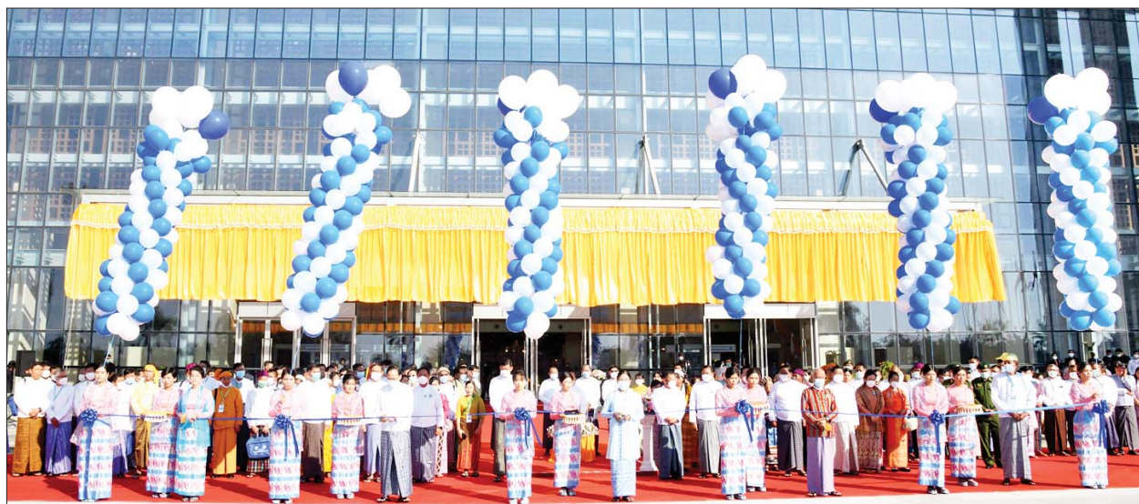
(၂၁)ကြိမ်မြောက် မြန်မာ့တိုင်းရင်းဆေးသမားတော်များညီလာခံနှင့် မြန်မာ့တိုင်းရင်းဆေးပညာနီးနှောဖလှယ်ပွဲကို နိုင်ငံတော်စီမံအုပ်ချုပ်ရေးကောင်စီဝင်များဖြစ်သည့် ဒေါ်အေးနုစိန်နှင့် ဦးမောင်ဟာ၊ ပြည်ထောင်စုဝန်ကြီး ဒေါက်တာသက်ခိုင်ဝင်း၊ တိုင်းရင်းဆေးပညာဦးစီးဌာန ညွှန်ကြားရေးမှူးချုပ် ဒေါက်တာစုစုဒွေးနှင့် တိုင်းရင်းဆေးသမားတော်ကြီး ဦးသန်းညွန့်တို့က ဖဲကြိုးဖြတ်ဖွင့်လှစ်ပေးကြစဉ်။

ဆေးပညာ ဖွံ့ဖြိုးတိုးတက်ရေးအတွက် သုတေသနလုပ်ငန်းများ တိုးမြှင့်ဆောင်ရွက်နိုင်ရန် အကောင်အထည်ဖော်ခြင်းဆိုင်ရာ သုတေသနများကို နှစ်စဉ်ဆောင်ရွက်လျက် ရှိပြီး သုတေသနတွေ့ရှိချက်များကို မြန်မာနိုင်ငံ ကျန်းမာရေးဆိုင်ရာ သုတေသနညီလာခံနှင့် တိုင်းရင်းဆေးသုတေသန စာတမ်းဖတ်ပွဲများတွင် တင်သွင်းဖတ်ကြားကြခြင်းဖြင့် ပိုမိုကောင်းမွန်ပြည့်စုံသော သုတေသနများ