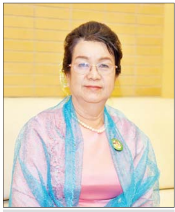
ဒေါ်စုစုဒွေး

တွေ့ဆုံမေးမြန်း မျိုးဆက်သစ်