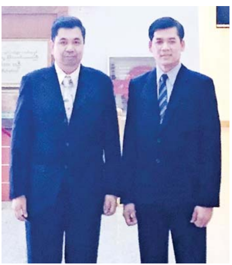
အာရှဒေသဆေးနှင့်ကျန်းမာရေးပညာရပ်များ သင်ကြားရေးဆိုင်ရာ အရည်အသွေး မြှင့်တင်ရေး ဖိုရမ်သို့ တက်ရောက်မည့် ကျန်းမာရေးဝန်ကြီး ဌာနမှ ကိုယ်စားလှယ်နှစ်ဦး။