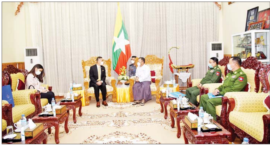
တွေ့ဆုံပွဲသို့ ပြည်ထောင်စုဝန်ကြီးဌာန ဒုတိယ ဝန်ကြီး ဗိုလ်ချုပ်စိုးထွဋ်နှင့် ဒုတိယဝန်ကြီး မြန်မာနိုင်ငံရဲ့တပ်ဖွဲ့ရဲချုပ် ဗိုလ်ချုပ်ဇင်မင်းထက်တို့ တက်ရောက်ကြသည်။ သတင်းစဉ်

တွေ့ဆုံစဉ် နှစ်နိုင်ငံအကြား တရားဥပဒေစိုးမိုးရေး ဆိုင်ရာကိစ္စရပ်များ၊ နိုင်ငံပြတ်ကျော်မှုခင်းများ တိုက်ဖျက်ရေးဆိုင်ရာကိစ္စ၊ လူကုန်ကူးမှုတားဆီး နှိမ်နင်းရေးဆိုင်ရာကိစ္စ၊ မူးယစ်ဆေးဝါးတားဆီး နှိမ်နင်းရေးဆိုင်ရာကိစ္စ၊ မြန်မာနိုင်ငံရဲ့တပ်ဖွဲ့၏ စွမ်းရည်မြှင့်တင်ရေးဆိုင်ရာကိစ္စနှင့် နှစ်နိုင်ငံပေါင်း ဆောင်ရွက်ရေးဆိုင်ရာကိစ္စရပ်များနှင့်စပ်လျဉ်း၍ ရင်းနှီးပွင့်လင်းစွာ အမြင်ချင်းဖလှယ်ဆွေးနွေးခဲ့ကြ သည်။