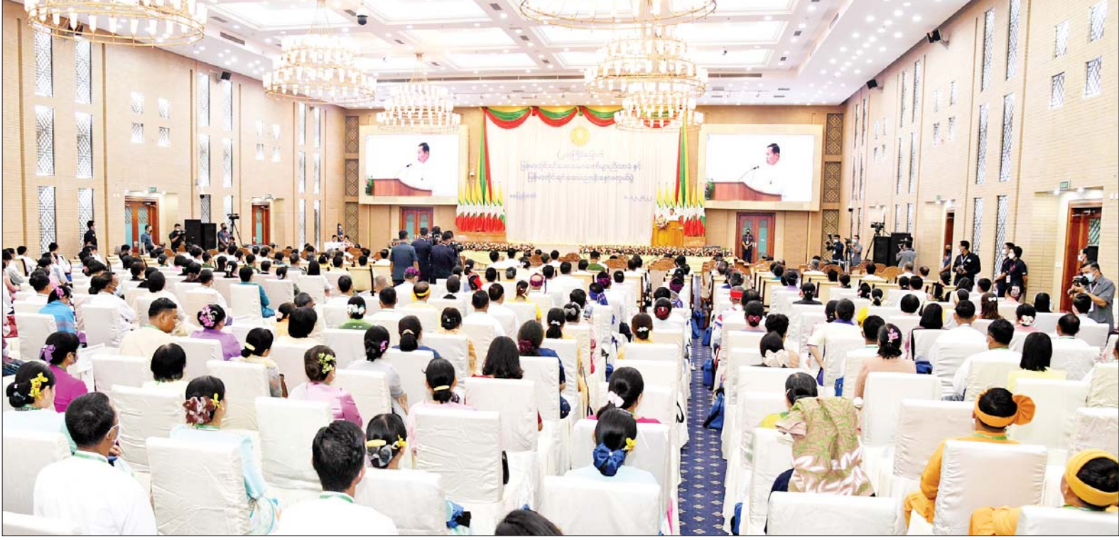
နိုင်ငံတော်စီမံအုပ်ချုပ်ရေးကောင်စီဒုတိယဥက္ကဋ္ဌ ဒုတိယဝန်ကြီးချုပ် ဒုတိယဗိုလ်ချုပ်မှူးကြီးစိုးဝင်း (၂၁)ကြိမ်မြောက် မြန်မာ့တိုင်းရင်းဆေးသမားတော်များ ညီလာခံနှင့် မြန်မာ့တိုင်းရင်းဆေးပညာ နှီးနှောဖလှယ်ပွဲ ဖွင့်ပွဲအခမ်းအနားတွင် အမှာစကားပြောကြားစဉ်။

အခမ်းအနားသို့ (၂၁)ကြိမ် မြောက် မြန်မာ့တိုင်းရင်းဆေး သမားတော်များ ညီလာခံနှင့် မြန်မာ့တိုင်းရင်းဆေးပညာ နှီးနှော ဖလှယ်ပွဲကျင်းပရေး ဦးစီး ကော်မတီနာယက နိုင်ငံတော် စီမံအုပ်ချုပ်ရေးကောင်စီ ဒုတိယ ဥက္ကဋ္ဌ ဒုတိယဝန်ကြီးချုပ် ဒုတိယ ဗိုလ်ချုပ်မှူးကြီးစိုးဝင်း၊ နိုင်ငံတော် စီမံအုပ်ချုပ်ရေးကောင်စီဝင်များ၊ ပြည်ထောင်စု ဝန်ကြီးများ၊ နေပြည်တော်တိုင်း စစ်ဌာနချုပ် တိုင်းမှူး၊ ဒုတိယဝန်ကြီးများ၊ နေပြည်တော်ကောင်စီဝင်များ၊ ဌာနဆိုင်ရာ အကြီးအကဲများ၊ မြန်မာနိုင်ငံဆိုင်ရာ နိုင်ငံခြားသံရုံး များမှ သံအမတ်ကြီးများ၊ ကုလသမဂ္ဂလက်အောက်ခံ အဖွဲ့ အစည်းများမှ ဌာနကိုယ်စား လှယ်များ၊ အစိုးရမဟုတ်သော အသင်း/အဖွဲ့များ၊ တိုင်းရင်းဆေး ကောင်စီဝင်များ၊ မြန်မာနိုင်ငံ စာမျက်နှာ ၄ ကော်လံ ၁ သို့