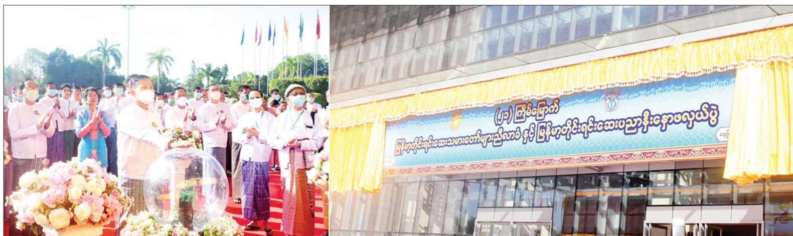
နိုင်ငံတော်စီမံအုပ်ချုပ်ရေးကောင်စီ ဒုတိယဥက္ကဋ္ဌ ဒုတိယဝန်ကြီးချုပ် ဒုတိယဗိုလ်ချုပ်မှူးကြီးစိုးဝင်း (၂၁)ကြိမ်မြောက် မြန်မာ့တိုင်းရင်းဆေးသမားတော်များညီလာခံနှင့် မြန်မာ့တိုင်းရင်းဆေးပညာနီးနှောဖလှယ်ပွဲ ဆိုင်းဘုတ်ကို စက်ခလုတ်နှိပ်ဖွင့်လှစ်ပေးစဉ်။

ဦးစွာ (၂၁)ကြိမ်မြောက် မြန်မာ့တိုင်းရင်းဆေး သမားတော်များ ညီလာခံနှင့် မြန်မာ့တိုင်းရင်းဆေးပညာနီးနှောဖလှယ်ပွဲကို နိုင်ငံတော်စီမံအုပ်ချုပ်ရေးကောင်စီဝင်များ ဖြစ်သည့် ဒေါ်အေးနုစိန်နှင့် ဦးမောင်ဟာ၊ ပြည်ထောင်စုဝန်ကြီး ဒေါက်တာသက်ခိုင်ဝင်း၊ တိုင်းရင်းဆေးပညာဦးစီးဌာန ညွှန်ကြားရေးမှူးချုပ် ဒေါက်တာစုစုဒွေးနှင့် တိုင်းရင်းဆေးသမားတော်ကြီး ဦးသန်းညွန့်တို့က ဖဲကြိုးဖြတ်ဖွင့်လှစ်ပေးကြသည်။