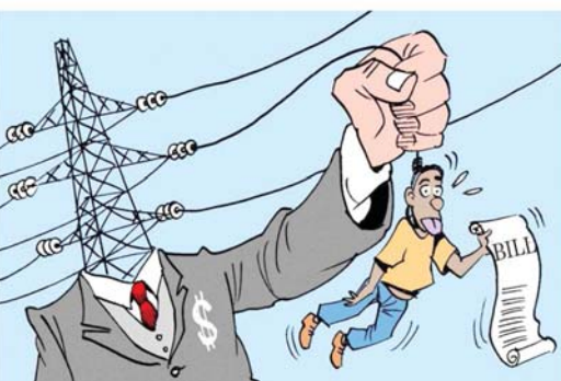
လျှပ်စစ်ကို ဈေးတာသုံးစွဲခြင်းဖြင့် ဝိတာပေးများ ကျသင့်ခြင်းမှ ရှောင်ရှားပါ။

မူးယစ်ကိုပစ် ပန်းတိုင်သစ် စိတ်သစ် လူသစ် ဘဝသစ်