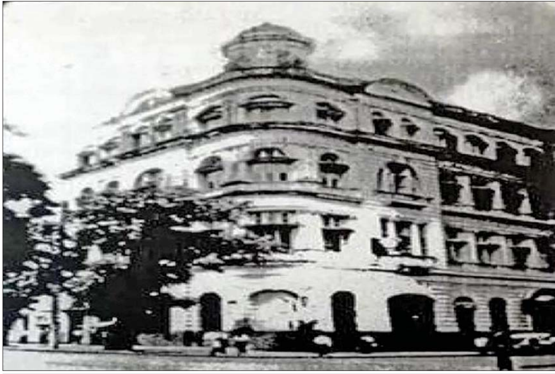
၁၉၅၈ ခုနှစ်က အစိုးရစာရင်းကိုင်နှင့် စာရင်းစစ်သင်တန်းကျောင်း (ရန်ကုန်)ကို တွေ့ရစဉ်။

ပြည်ထောင်စု စာရင်းစစ်ချုပ်ရုံး၏ မျှော်မှန်းချက်မှာ ပြည်သူ့အကျိုးစီးပွားကို