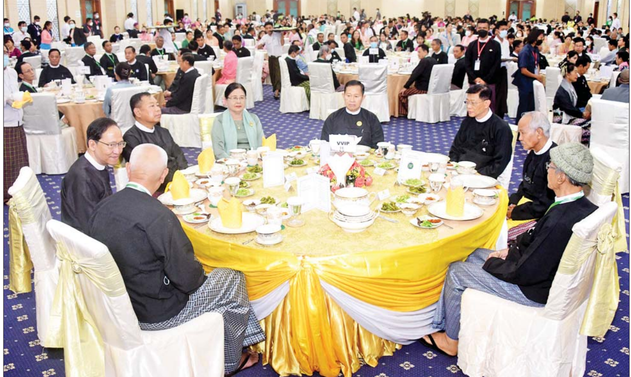
နိုင်ငံတော်စီမံအုပ်ချုပ်ရေးကောင်စီ ဒုတိယဥက္ကဋ္ဌ ဒုတိယ ဝန်ကြီးချုပ် ဒုတိယဗိုလ်ချုပ်မှူးကြီးစိုးဝင်း (၂၁)ကြိမ်မြောက် မြန်မာ့ တိုင်းရင်းဆေးသမားတော်များညီလာခံကို တက်ရောက်လာကြသည့် ကိုယ်စားလှယ်တော်ကြီးများကို ဂုဏ်ပြုညစာစားပွဲဖြင့် တည်ခင်း ဧည့်ခံစဉ်။

ညပိုင်းတွင် နိုင်ငံတော်စီမံ အုပ်ချုပ်ရေးကောင်စီ ဒုတိယဥက္ကဋ္ဌ ဒုတိယဝန်ကြီးချုပ်သည် (၂၁)ကြိမ် မြောက် မြန်မာ့တိုင်းရင်းဆေး သမားတော်များ ညီလာခံကို ဆက်လက်ကျင်းပ ကြောင်းနှင့် ညစာစားပွဲတွင် ဝန်ကြီးဌာန အနုပညာဦးစီးဌာနမှ