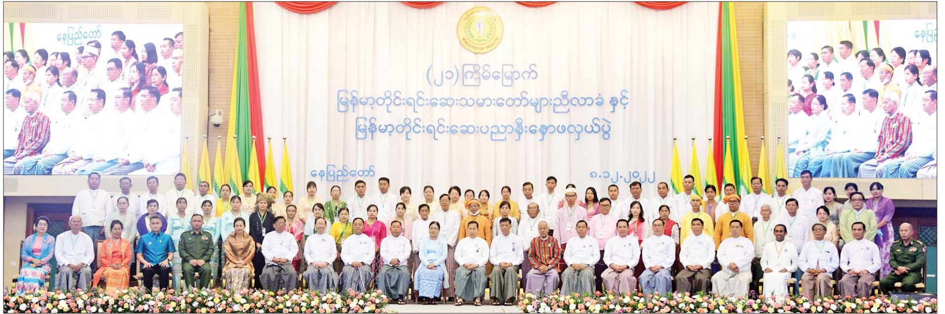
နိုင်ငံတော်စီမံအုပ်ချုပ်ရေးကောင်စီ ဒုတိယဥက္ကဋ္ဌ ဒုတိယဝန်ကြီးချုပ် ဒုတိယဗိုလ်ချုပ်မှူးကြီးစိုးဝင်းနှင့် အဖွဲ့ဝင်များ၊ တိုင်းရင်းဆေးသမားတော်များ၊ တိုင်းရင်းဆေးဝါးထုတ်လုပ်သူများ၊ ကိုယ်စားလှယ်တော်ကြီးများ၊ တာဝန်ရှိသူများနှင့်အတူ စုပေါင်းမှတ်တမ်းတင်ဓာတ်ပုံရိုက်စဉ်။

☐ စာမျက်နှာ ၄ မှ ဆက်လက် ဆောင်ရွက်လာနိုင် စေပြီး တိုင်းရင်းဆေးပညာရပ် ပိုမို ဖွံ့ဖြိုးတိုးတက်လာမည်ဖြစ်သည့် အခြေအနေများ၊ (၂၁)ကြိမ်မြောက် မြန်မာ့တိုင်းရင်းဆေးသမားတော် များ ညီလာခံနှင့် မြန်မာ့တိုင်းရင်း ဆေးပညာ နိုးနှောဖလှယ်ပွဲ ကျင်းပရသည့် ရည်ရွယ်ချက်များ၊ ညီလာခံနှင့် နိုးနှောဖလှယ်ပွဲနှင့် ညှိနှိုင်းဆွေးနွေးနိုင်မည့် အခြေ အနေများ၊ အဆိုပြုချက်များ၊ ထောက်ခံချက်များ၊ တင်ပြ ဆွေးနွေးချက်များမှ ထွက်ပေါ်လာ သော လုပ်ဆောင်သင့်သည့် လုပ်ငန်းစဉ်များကို အကောင် အထည်ဖော် ဆောင်ရွက်သွားရ မည့်အခြေအနေများ၊ မျိုးဆက်သစ် တိုင်းရင်းဆေးသမားတော်များ အနေဖြင့်လည်း မြန်မာ့တိုင်းရင်း ဆေးပညာကို ဂုဏ်ယူဝင့်ကြားစွာ ချပြနိုင်ရန်နှင့် သုတေသနလုပ်ငန်း များ စနစ်တကျ လုပ်ကိုင်ပြီး တိုင်းရင်းဆေးပညာ ဖွံ့ဖြိုးတိုးတက် ရန်ဆက်လက်ဆောင်ရွက်သွားရ မည့်အခြေအနေများ၊ မြန်မာ တိုင်းရင်းဆေးဝါး ထုတ်လုပ်ရေး လုပ်ငန်းသည် နိုင်ငံတော်၏