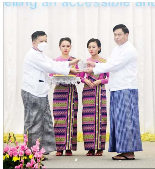
နိုင်ငံတော်စီမံအုပ်ချုပ်ရေးကောင်စီဝင် ဗိုလ်ချုပ်ကြီးတင်အောင်စန်း က ဂုဏ်ပြုဆုပေးအပ်ချီးမြှင့်စဉ်။