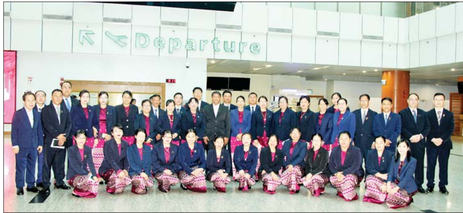
အဆိုပါ သင်တန်းသားများသည် သင်တန်း၌ အိန္ဒိယနိုင်ငံ ဖွဲ့စည်းပုံအခြေခံဥပဒေ၊ အိန္ဒိယနိုင်ငံ တရားစီရင်ရေးစနစ်၊ တရားသူကြီးကျင့်ဝတ်၊ စီရင်ချက်ရေးသားခြင်း၊ တရားရုံးစီမံခန့်ခွဲမှု၊ သက်သေခံဥပဒေ၊ တရားရုံးနည်းပညာ၊ တရားမနှင့် ရာဇဝတ်ဥပဒေများ၊ ဥပဒေရေးရာဆေးပညာ၊ တရားမကျင့်ထုံး

အိန္ဒိယနိုင်ငံ ဘိုပါးမြို့ရှိ အမျိုးသားတရားစီရင်ရေး အကယ်ဒမီ (National Judicial Academy, Bhopal India) တွင် ၂၀၂၂ ခုနှစ် ဒီဇင်ဘာ ၅ ရက် မှ ၈ ရက်အထိ ဖွင့်လှစ်မည့် “တရားသူကြီးများနှင့် တရားရေးအရာရှိများအတွက် စွမ်းဆောင်ရည်မြှင့်တင်မှုသင်တန်းအစီအစဉ်” သို့ တက်ရောက်ရန် ပြည်ထောင်စုတရားလွှတ်တော်ချုပ်မှ ဒုတိယအမြဲတမ်းအတွင်းဝန်၊ ညွှန်ကြားရေးမှူးများ၊ ဒုတိယညွှန်ကြားရေးမှူးများ၊ လက်ထောက်ညွှန်ကြားရေးမှူးများ၊ ဦးစီးအရာရှိများနှင့် တရားရုံးအဆင့်ဆင့်ရှိ ခရိုင်အဆင့်နှင့် မြို့နယ်အဆင့် တရားသူကြီးများ၊ တရားရေးအရာရှိများ ပါဝင်သည့် သင်တန်းသား ၄၀ သည် ယနေ့တွင် ရန်ကုန်မြို့မှ အိန္ဒိယနိုင်ငံသို့ လေကြောင်းခရီးဖြင့် ထွက်ခွာသွားသည်။