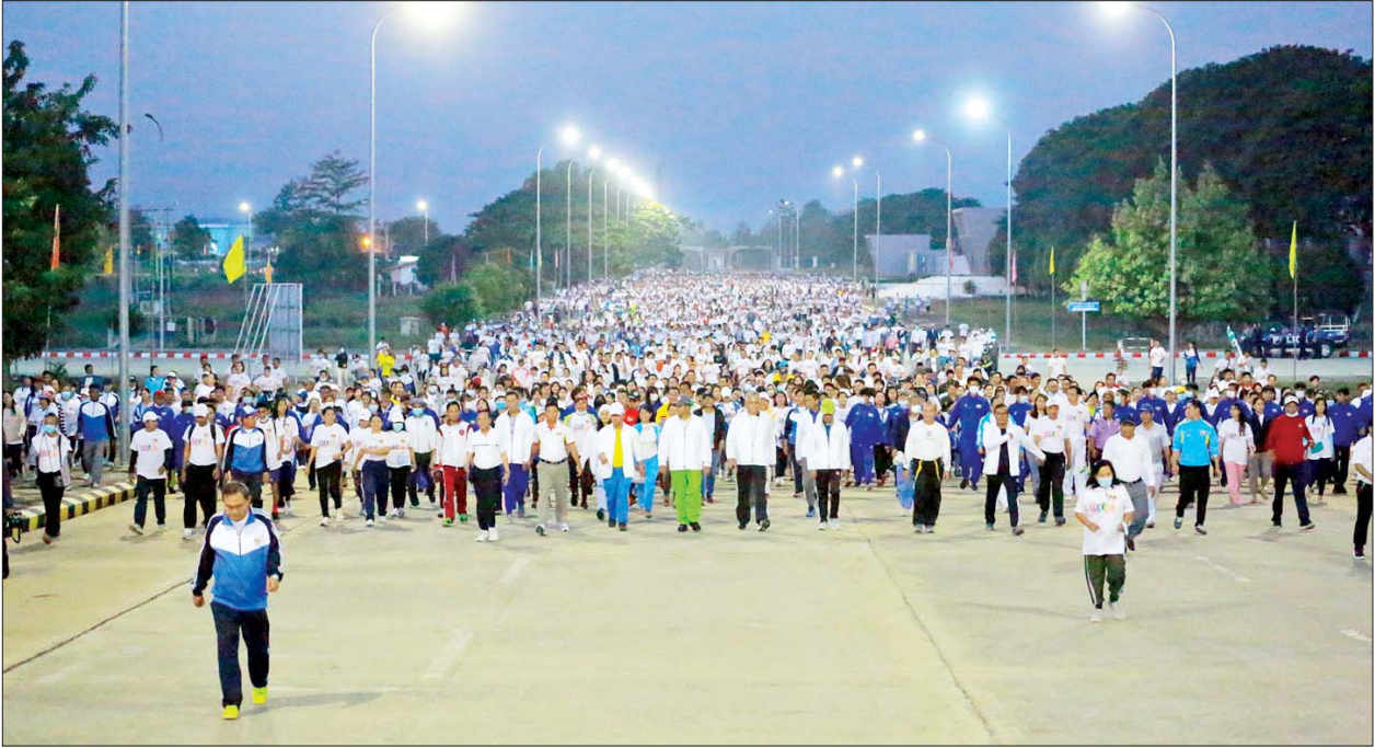
အဆိုပါ လူထုစုပေါင်းလမ်းလျှောက်ပွဲကို ဒီဇင်ဘာလ၏ အပတ်စဉ် ဝန်ထမ်းများအပြင် ဝန်ထမ်းမိသားစုဝင်များပါ ပျော်ပျော်ပါးပါး ပါဝင် စနေနေ့တိုင်း ပြုလုပ်ဆောင်ရွက်သွားမည်ဖြစ်ပြီး ဝန်ကြီးဌာနအသီးသီးမှ ဆင်နွှဲသွားမည်ဖြစ်ကြောင်း သိရသည်။ သတင်းစဉ်

လူထုစုပေါင်းလမ်းလျှောက်ပွဲသို့ ပါဝင်ဆင်နွှဲကြသူများသည် ဝဏ္ဏသိဒ္ဓိအားကစားကွင်း ဂိတ်အမှတ်(၁)မှ စတင်တာထွက်ပြီး ဝဏ္ဏသိဒ္ဓိ အားကစားကွင်း၏ သတ်မှတ်လမ်းကြောင်းများအတိုင်း ဂိတ်(A) ရှေ့အထိ ပျော်ပျော်ပါးပါးလမ်းလျှောက်ကာ စုပေါင်းကိုယ်လက် ကြံ့ခိုင်ရေး လေ့ကျင့်ခန်း အတွဲ(၁)၊ (၂)နှင့် Physical Fitness Dance Exercises လေ့ကျင့်ခန်းများကို စုပေါင်းပါဝင်လှုပ်ရှားဆောင်ရွက်ခဲ့ ကြပြီး အားကစားနှင့် ကာယပညာဦးစီးဌာနမှ တာဝန်ရှိသူများက ရေသန့်ဘူး၊ Pocari Sweat နှင့် အာဟာရမုန့်များ ပေးဝေကြသည်။