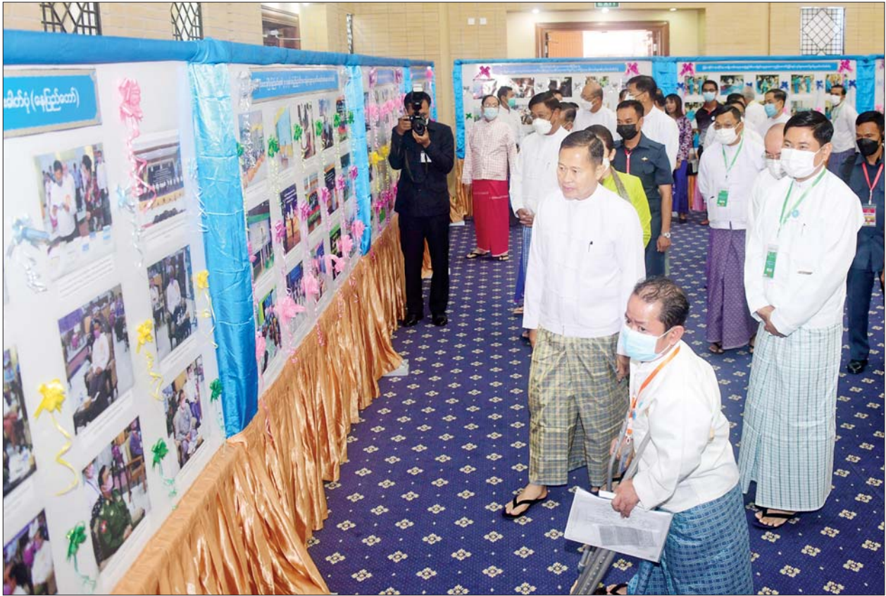
နိုင်ငံတော်စီမံအုပ်ချုပ်ရေးကောင်စီဒုတိယဥက္ကဋ္ဌ ဒုတိယဝန်ကြီးချုပ် ဒုတိယဗိုလ်ချုပ်မှူးကြီးစိုးဝင်း ၂၀၂၂ ခုနှစ် အပြည်ပြည်ဆိုင်ရာ မသန်စွမ်းသူများနေ့ အထိမ်းအမှတ် အခမ်းအနားတွင် ခင်းကျင်းပြသထားသည့် မှတ်တမ်းဓာတ်ပုံများကို ကြည့်ရှုစဉ်။

“ယခုနှစ်တွင်ကျရောက်သည့် အပြည်ပြည်ဆိုင်ရာ မသန်စွမ်းသူများနေ့၏ ဦးတည်ဆောင်ပုဒ်ဖြစ်သည့် “အားလုံးပါဝင်ဖွံ့ဖြိုးဖို့၊ ဆန်းသစ်တီထွင် အဖြေရှာဖို့၊ အားလုံးလက်လှမ်းမီ ညီမျှရေး၊ တီထွင်ဖန်တီးမှု စွမ်းအားဖြင့် ဆောင်ရွက်ပေး” နှင့်အညီ မသန်စွမ်းသူများ၏ ဘဝအခြေအနေ မြင့်မားတိုးတက်စေရေး၊ နောက်ကျမကျန်ရစ်စေရေး အတွက် တီထွင်ဆန်းသစ်မှု၊ နည်းပညာနှင့် ပြုပြင်ပြောင်းလဲနိုင်သည့် နည်းလမ်းများကို ရှာဖွေဖော်ထုတ်ပြီး လက်လှမ်းမီရယူအသုံးပြု နိုင်မည့် ညီမျှသည့် လူ့အသိုင်းအဝိုင်း ဖြစ်ပေါ်လာစေရေး ဆောင်ရွက်ပေးကြစေလို”