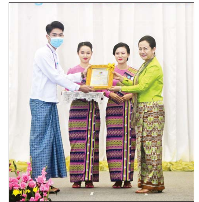
ပြည်ထောင်စုဝန်ကြီး ဒေါက်တာသက်သက်ခိုင်က ဂုဏ်ပြုဆု ပေးအပ်ချီးမြှင့်စဉ်။