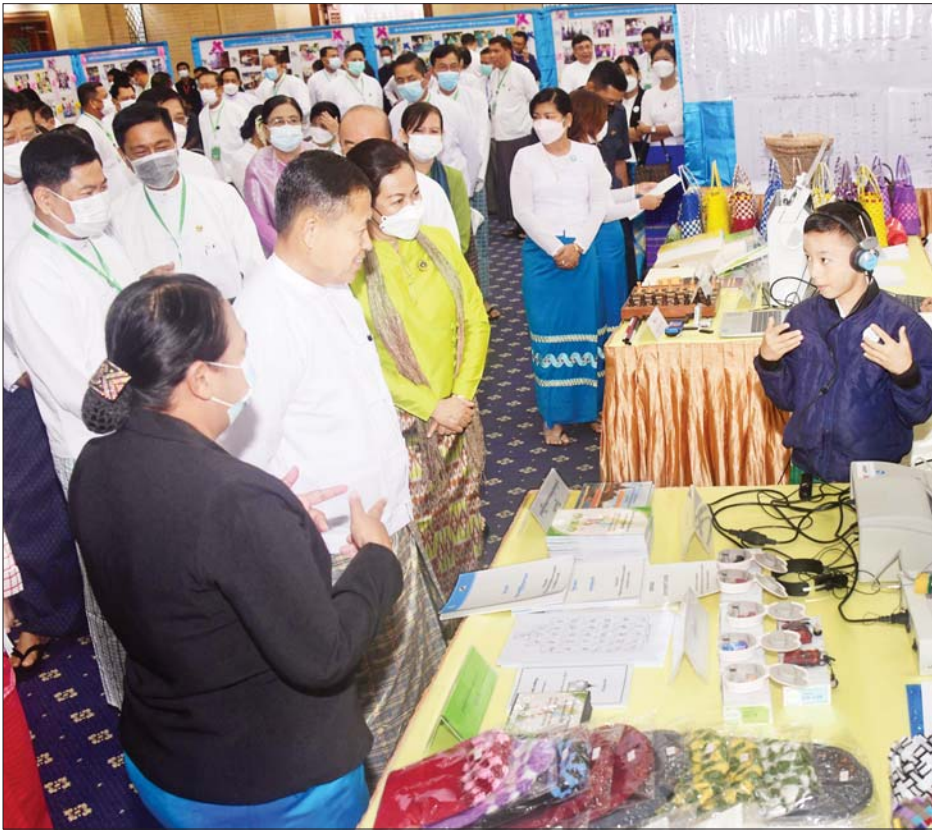
နိုင်ငံတော်စီမံအုပ်ချုပ်ရေးကောင်စီဒုတိယဥက္ကဋ္ဌ ဒုတိယဝန်ကြီးချုပ် ဒုတိယဗိုလ်ချုပ်မှူးကြီးစိုးဝင်း ၂၀၂၂ ခုနှစ် အပြည်ပြည်ဆိုင်ရာ မသန်စွမ်းသူများနေ့ အထိမ်းအမှတ် အခမ်းအနားတွင် ခင်းကျင်းပြသထား သည့် ပြခန်းများကို ကြည့်ရှုစဉ်။

»» စာမျက်နှာ ၃ မှ လူမှုအဖွဲ့အစည်းများတွင် ဘေးဖယ် ချန်လှပ်ထားခြင်းမျိုး မဖြစ်စေဘဲ ပါဝင်လှုပ်ရှားဆောင်ရွက်နိုင်ရေး ကြိုးစားပေးကြစေလိုကြောင်း၊ မသန်စွမ်းသူများအနေဖြင့်လည်း စိတ်ဆင်းရဲအားငယ်မှုများ မဖြစ် ကြဘဲ ဘဝကို ကြံ့ကြံ့ခံရင်ဆိုင်၍ စိတ်ရောကိုယ်ပါ ကျန်းမာသန်စွမ်း အောင် လေ့ကျင့်နေထိုင်နိုင်ကြပြီး နိုင်ငံတော်တည်ဆောက်ရေးတွင် အုတ်တစ်ချပ် သဲတစ်ပွင့်အဖြစ် ကျရာတာဝန်ကို ကျေပွန်စွာ ထမ်းဆောင်နိုင်ရေး ကြိုးစား လုပ်ဆောင်ပေးကြရန် တိုက်တွန်း မှာကြားလိုကြောင်း ပြောကြား သည်။ ယင်းနောက် မသန်စွမ်းသူများ ၏ အခွင့်အရေးများဆိုင်ရာ အမျိုးသားကော်မတီ ဒုတိယ ဥက္ကဋ္ဌ ပြည်ထောင်စုဝန်ကြီး ဒေါက်တာသက်သက်ခိုင်က မသန် စွမ်းသူများ၏ အခွင့်အရေးများ ဆိုင်ရာ ဆောင်ရွက်ထားမှုများကို ရှင်းလင်းတင်ပြသည်။