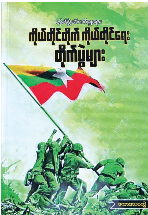
စစ်၏သဘော

ဤကဲ့သို့သော စာအုပ်မျိုးသည် စစ်ဗိုလ်စစ်သားမှသာ ဖတ်ရှုရန် မဟုတ်ဘဲ သာမန်အရပ်သူအရပ်သားများလည်း ဗဟုသုတအသိအမြင် ရရှိနိုင်သော မိမိတို့တပ်မတော်သားများ ရှေ့တန်းစစ်မြေပြင်ဝယ် မည်ကဲ့သို့လှုပ်ရှား၍ မည်မျှရဲဝံ့စွန့်စားကြိုးစားတိုက်ခိုက်ခဲ့ကြပုံကို ဖတ်သင့်၊ မြင်သင့်၊ သိသင့်ကြသည် မဟုတ်ပါလား။