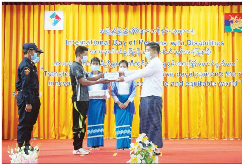
ထောက်ပံ့ပေးခြင်း၊ အလုပ်အကိုင် အခွင့်အလမ်းများ ရရှိစေရေးအတွက် အသက်မွေးဝမ်းကျောင်း ပညာသင်တန်းများ တက်ရောက်စေပြီး စက်မှုဇုန်စီမံခန့်ခွဲရေး

ရှေးဦးစွာ ပြည်နယ်ဝန်ကြီးချုပ် ဦးဇော်မျိုးတင်က အဖွင့်အမှာစကားပြောကြားရာတွင် နိုင်ငံတော်အနေဖြင့် မြန်မာ့လူ့ဘောင်အဖွဲ့အစည်းအတွင်းရှိ မသန်စွမ်းသူများ၏ ဘဝအရည်အသွေးပိုမိုဖွံ့ဖြိုးလာစေရန်၊ အများပြည်သူနည်းတူ တန်းတူညီမျှအခွင့်အရေးရရှိရေး ကြိုးပမ်းဖော်ဆောင်ရန်၊ မသန်စွမ်းသူများ၏ ဂုဏ်သိက္ခာနှင့် စွမ်းဆောင်ရည်တို့ကို အလေးဂရုပြုတတ်စေရန် ရည်ရွယ်၍ မသန်စွမ်းသူများ၏ အခွင့်အရေးဆိုင်ရာ မဟာဗျူဟာစီမံကိန်းများ ရေးဆွဲပြီးအကောင်အထည်ဖော် ဆောင်ရွက်ပေးလျက်ရှိကြောင်း၊ ပြည်နယ်အနေဖြင့် မသန်စွမ်းသူများကို နှစ်စဉ်ငွေကြေးများ ထောက်ပံ့ခြင်း၊ ချိုင်းထောက်၊ လက်ထောက်၊ ခြေတုနှင့် ဝှိုးချများ