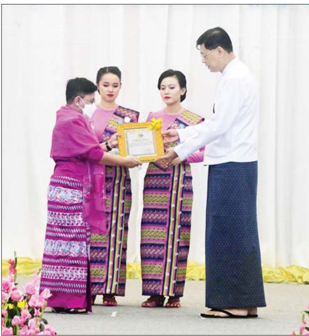
နိုင်ငံတော်စီမံအုပ်ချုပ်ရေးကောင်စီဝင် ဗိုလ်ချုပ်ကြီးမြထွန်းဦးက ဂုဏ်ပြုဆုပေးအပ်ချီးမြှင့်စဉ်။

မသန်စွမ်းအားကစားပြိုင်ပွဲတွင် ဆုတံဆိပ်များရရှိခဲ့ပြီး အဆင့်(၆) တွင်ရပ်တည်နိုင်ခဲ့သည့် မြန်မာနိုင်ငံ မသန်စွမ်းအားကစားအဖွဲ့ချုပ်ကို လည်းကောင်း၊ ပြည်ထောင်စု ဝန်ကြီး ဒေါက်တာသက်သက်ခိုင် က မသန်စွမ်းသူများအတွက် အလုပ်အကိုင် အခွင့်အလမ်း ဖန်တီးပေးရေး ဂုဏ်ပြုဆုရရှိသူကို လည်းကောင်း ဂုဏ်ပြုဆုများ ပေးအပ်ချီးမြှင့်ကြသည်။ ယင်းနောက် မသန်စွမ်းသူများ ၏ အခွင့်အရေးများဆိုင်ရာ အမျိုးသားကော်မတီ ဥက္ကဋ္ဌ နိုင်ငံတော်စီမံအုပ်ချုပ်ရေးကောင်စီ ဒုတိယဥက္ကဋ္ဌ ဒုတိယဝန်ကြီးချုပ် ဒုတိယဗိုလ်ချုပ်မှူးကြီးစိုးဝင်း သည် အခမ်းအနားသို့ တက်ရောက် လာကြသူများနှင့်အတူ စုပေါင်း မှတ်တမ်းတင် ဓာတ်ပုံရိုက်ပြီး ခင်းကျင်းပြသထားသည့် မသန်စွမ်း သူများနှင့် သက်ဆိုင်သော စာအုပ် များနှင့် လုပ်ငန်းဆောင်ရွက်ချက် မှတ်တမ်းဓာတ်ပုံများကို ကြည့်ရှုခဲ့ ကြောင်း သိရသည်။ သတင်းစဉ်