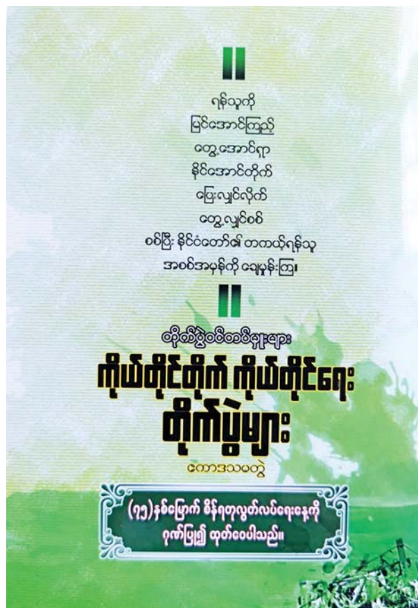
လူနေမှုအတော်မြင့်မားစွာ ချောင်လည်ခဲ့ပါသည်။) ရှုရှားနိုင်ငံနာခေါင်း

ဆိုဗီယက်ပြည်ထောင်စုထဲမှာ အေးအေးလူလူ ဖွံ့ဖြိုးတိုးတက် လာခဲ့သော ယူကရိန်း ပြည်နယ်က (သမ္မတခရူးရှက်၏ ဇာတိလူမျိုး ဖြစ်၍ သိသိသာသာ တိုးတက်အောင် ပျိုးထောင်မြှင့်တင်ပေးခဲ့သဖြင့်