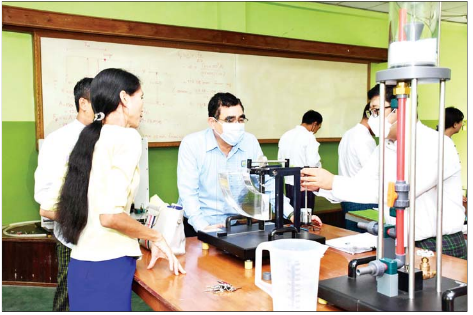
ပြီးစီးမှု၊ တက္ကသိုလ်ဝင်းအတွင်းရှိ ပလက်ဖောင်း လုပ်ငန်းလုပ်ဆောင်နေမှုနှင့် ကျောင်းသား နေရာများ၏ အခြေအနေများကို လှည့်လည်စစ်ဆေးကြည့်ရှုပြီး လိုအပ်သည်များ မှာကြားခဲ့ကြောင်း သိရသည်။ သတင်းစဉ်

ထို့နောက် ဒုတိယဝန်ကြီးသည် တက္ကသိုလ်ဝင်းအတွင်းရှိ စာကြည့်တိုက်အသစ်၊ Motivation Hall ဆောင်ရွက်နေမှု၊ Laboratory အခန်းများ ပြင်ဆင်ထားမှု၊ အလုပ်ရုံနှင့် Towing Tank အဆောင်များတွင် လုပ်ငန်းဆောင်ရွက်နေမှု၊ ဘောလုံးကွင်းတည်ဆောက်