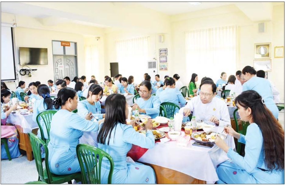
အားတိုက်ထမ်းဆောင်ကြရန် တိုက်တွန်းပြောကြား ခဲ့ပြီး ပြည်ထောင်စုဝန်ကြီး၊ ဒုတိယဝန်ကြီး ဒေါက်တာ အေးထွန်း၊ ညွှန်ကြားရေးမှူးချုပ်များနှင့် တာဝန်ရှိသူ များသည် ဝန်ထမ်းများနှင့်အတူ နေ့လယ်စာအတူ တကွသုံးဆောင်ကာ တေးသီချင်းအက၊ အလှများဖြင့် ပျော်ရွှင်စွာပါဝင်ဆင်နွှဲကြသည့် ဝန်ထမ်းများကို ဆုများချီးမြှင့်ကြသည်။

စုပေါင်းမိတ်ဆုံ နေ့လယ်စာစားပွဲတွင် ပြည်ထောင်စုဝန်ကြီး ဒေါက်တာသက်ခိုင်ဝင်းက တက်ရောက်လာကြသည့် ဝန်ထမ်းများအား ရင်းရင်း နှီးနှီးတွေ့ဆုံနှုတ်ဆက်ကာ ကျန်းမာရေးလူ့စွမ်းအား အရင်းအမြစ်ဦးစီးဌာနသည် လူ့စွမ်းအားအရင်းအမြစ် များ မွေးထုတ်ပေးသည့် ဌာနဖြစ်သည့်အလျောက် အရည်အသွေးပြည့်ဝသည့် ကျန်းမာရေးလူ့စွမ်းအား အရင်းအမြစ်များ ပေါ်ထွန်းရေးအတွက် ရှေ့လုပ်ငန်းစဉ် များကို အစွမ်းကုန် ကြိုးပမ်းဆောင်ရွက်ရန်လိုကြောင်း နှင့် ဝန်ထမ်းများအနေဖြင့် အချင်းချင်းရင်းနှီးချစ်ခင် စွာဖြင့် ကျရာတာဝန်များကို ပျော်ရွှင်စွာ အင်တိုက်