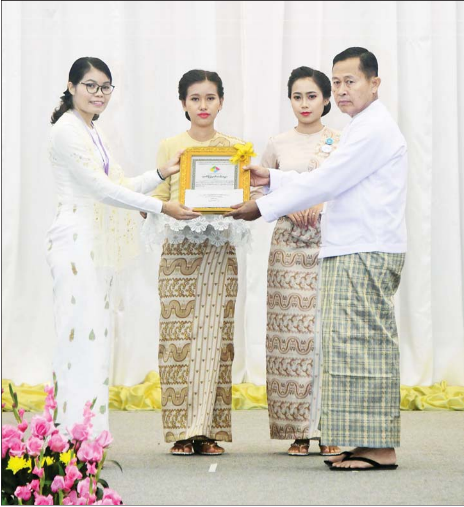
နိုင်ငံတော်စီမံအုပ်ချုပ်ရေးကောင်စီဒုတိယဥက္ကဋ္ဌ ဒုတိယဝန်ကြီးချုပ် ဒုတိယဗိုလ်ချုပ်မှူးကြီးစိုးဝင်း အပြည်ပြည်ဆိုင်ရာ မသန်စွမ်းသူများနေ့ အထိမ်းအမှတ် အလွတ်တန်းဆောင်းပါးပြိုင်ပွဲတွင် ဂုဏ်ပြုဆု ရရှိသူတစ်ဦးအား ဂုဏ်ပြုဆုပေးအပ်ချီးမြှင့်စဉ်။

ဦးတည်ဆောင်ပုဒ် ၂၀၂၂ ခုနှစ် အပြည်ပြည်ဆိုင်ရာ မသန်စွမ်းသူများနေ့ အတွက် ကုလသမဂ္ဂအဖွဲ့ကြီးက သတ်မှတ်ပေးသည့် ဦးတည်ဆောင်ပုဒ်မှာ “Transformative solutions for inclusive development: the role of innovation in fuelling an accessible and equitable world” “အားလုံးပါဝင်ဖွံ့ဖြိုးဖို့၊ ဆန်းသစ်တီထွင် အဖြေရှာဖို့၊ အားလုံးလက်လှမ်းမီ ညီမျှရေး၊ တီထွင်ဖန်တီးမှု စွမ်းအားဖြင့် ဆောင်ရွက်ပေး” ပင် ဖြစ်ကြောင်း။ အခြားသော အခက်အခဲနှင့် စိန်ခေါ်မှုများကို ရင်ဆိုင်ကျော်လွှားနိုင်ရန်အတွက် တီထွင်ဖန်တီးမှုနှင့် နည်းပညာ အကူအညီများကို ရယူသွားရမည် ဖြစ်ကြောင်း၊ နည်းပညာနှင့် တီထွင်ဖန်တီးမှုသည် မသန်စွမ်းသူများအတွက် အလွယ်တကူ လက်လှမ်းမီရယူနိုင်မှု (accessibility) နှင့် အသုံးပြုနိုင်မှု (usability) များကို မြှင့်တင်ပေးနိုင်