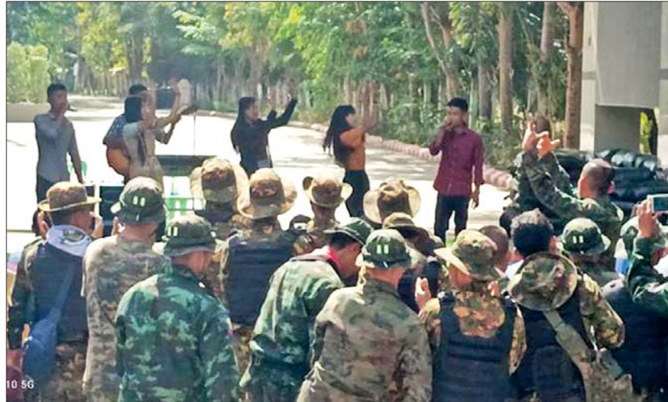
နယ်လှည့်ပြည်သူ့ဆက်ဆံရေးအဖွဲ့မှ စစ်သည်၊ စစ်သမီးများ မြဝတီတပ်နယ်တွင် လုံခြုံရေးတာဝန် ထမ်းဆောင်နေသော တပ်ဖွဲ့ဝင်များအား ဖျော်ဖြေမှု မှတ်တမ်းဓာတ်ပုံ။