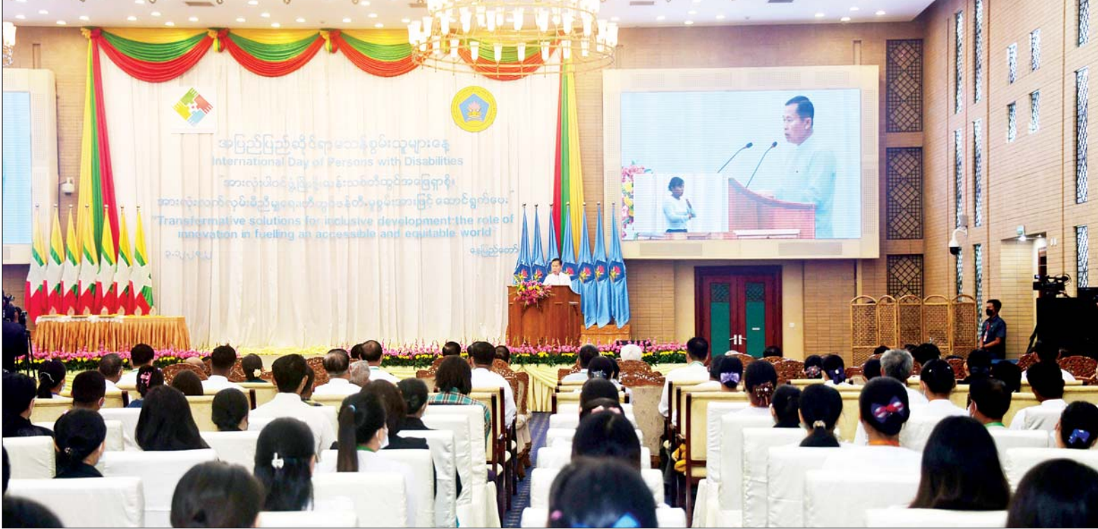
နိုင်ငံတော်စီမံအုပ်ချုပ်ရေးကောင်စီဒုတိယဥက္ကဋ္ဌ ဒုတိယဝန်ကြီးချုပ် ဒုတိယဗိုလ်ချုပ်မှူးကြီးစိုးဝင်း ၂၀၂၂ ခုနှစ် အပြည်ပြည်ဆိုင်ရာ မသန်စွမ်းသူများနေ့ အထိမ်းအမှတ် အခမ်းအနားတွင် အမှာစကားပြောကြားစဉ်။

အခမ်းအနားသို့ နိုင်ငံတော် စီမံအုပ်ချုပ်ရေးကောင်စီဝင်များ၊ ပြည်ထောင်စု ဝန်ကြီးများ၊ နေပြည်တော်တိုင်းစစ်ဌာနချုပ် တိုင်းမှူး၊ ဒုတိယဝန်ကြီးများ၊ အမြဲတမ်း အတွင်းဝန်များ၊ ညွှန်ကြားရေးမှူးချုပ်များ၊ NGO၊ INGO များ၊ မြန်မာနိုင်ငံမသန်စွမ်းသူများ အသင်းချုပ်မှ တာဝန်ရှိသူများ၊ မသန်စွမ်းသူများ၊ ဖိတ်ကြားထားသူများနှင့် တာဝန်ရှိသူများ တက်ရောက်ကြသည်။ နှစ်စဉ်ကျင်းပ အခမ်းအနားတွင် မသန်စွမ်းသူများ၏ အခွင့်အရေးများဆိုင်ရာ အမျိုးသားကော်မတီ ဥက္ကဋ္ဌ နိုင်ငံတော်စီမံအုပ်ချုပ်ရေးကောင်စီ ဒုတိယဥက္ကဋ္ဌ ဒုတိယဝန်ကြီးချုပ် ဒုတိယဗိုလ်ချုပ်မှူးကြီးစိုးဝင်းက အမှာစကား ပြောကြားရာတွင် မသန်စွမ်းမှုဆိုင်ရာ အရေးကိစ္စများကို သိရှိနားလည်နိုင်စွမ်း စာမျက်နှာ ၃ ကော်လံ ၁ သို့