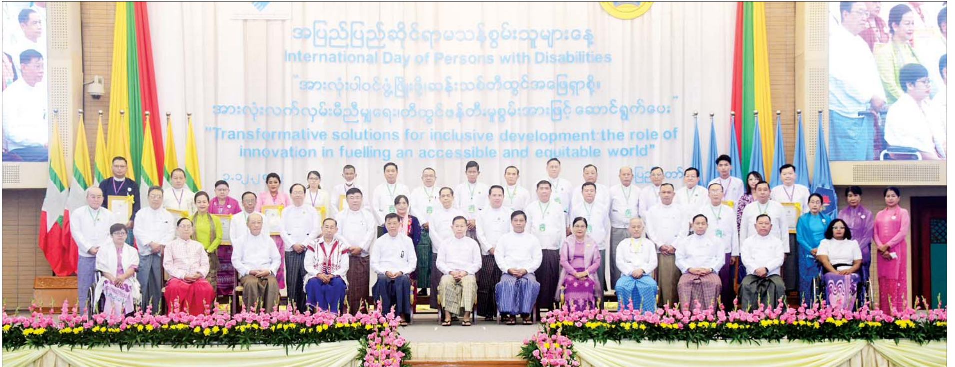
နိုင်ငံတော်စီမံအုပ်ချုပ်ရေးကောင်စီဒုတိယဥက္ကဋ္ဌ ဒုတိယဝန်ကြီးချုပ် ဒုတိယဗိုလ်ချုပ်မှူးကြီးစိုးဝင်း ၂၀၂၂ ခုနှစ် အပြည်ပြည်ဆိုင်ရာ မသန်စွမ်းသူများနေ့ အထိမ်းအမှတ် အခမ်းအနားသို့ တက်ရောက်လာကြ သူများနှင့်အတူ စုပေါင်းမှတ်တမ်းတင်ဓာတ်ပုံရိုက်စဉ်။