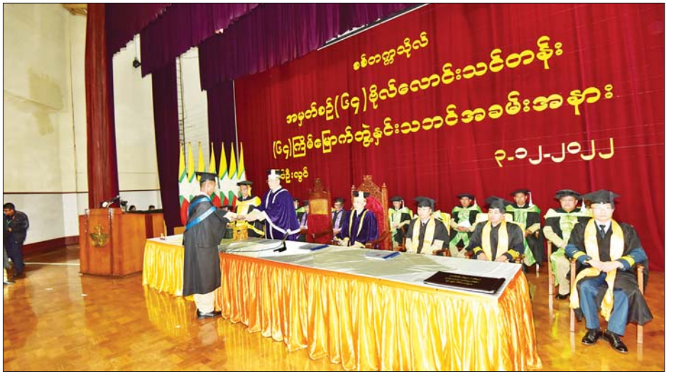
စစ်တက္ကသိုလ်အနေဖြင့် ပထမအကြိမ်ဘွဲ့နှင်းသဘင်မှ ယခု (၆၄)ကြိမ်မြောက် ဘွဲ့နှင်းသဘင်အထိ

ထို့နောက် ပါမောက္ခချုပ်က ဘွဲ့နှင်းသဘင်မိန့်ခွန်းပြောကြားပြီး အခမ်းအနားကို ရုပ်သိမ်းကြောင်း ကြေညာကာ စစ်တက္ကသိုလ် ကျောင်းအုပ်ကြီး၊ ပါမောက္ခချုပ်နှင့် ပညာရေးအဖွဲ့ဝင်များသည် ဘွဲ့နှင်းသဘင်ခန်းမမှ ပြန်လည်ထွက်ခွာ