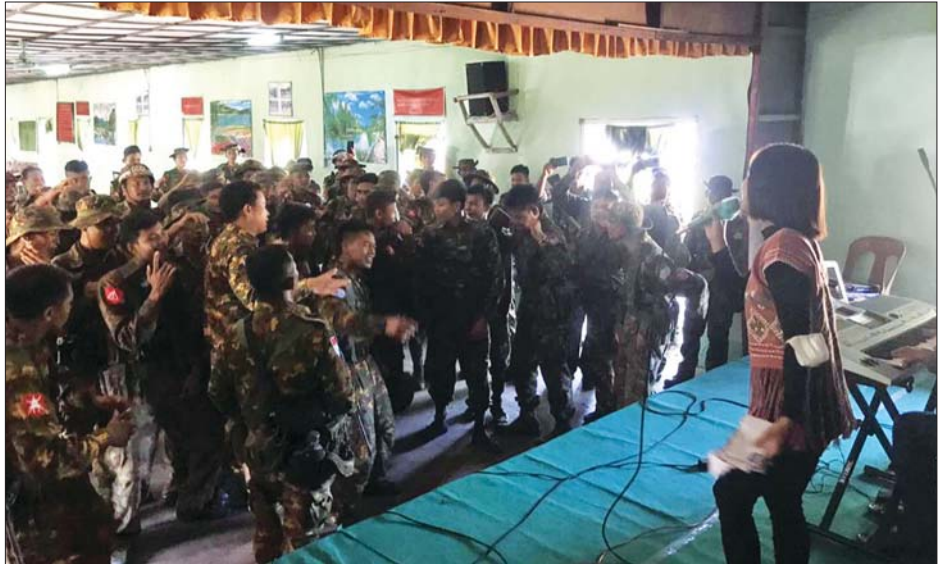
MRTV မှ ဖျော်ဖြေရေးအဖွဲ့ သူ့အဖွဲ့သားများက ကြာအင်းဆိပ်ကြီးတပ်နယ်ရှိ လုံခြုံရေးတပ်ဖွဲ့ဝင် များအား ဖျော်ဖြေနေမှုမှတ်တမ်းဓာတ်ပုံ။