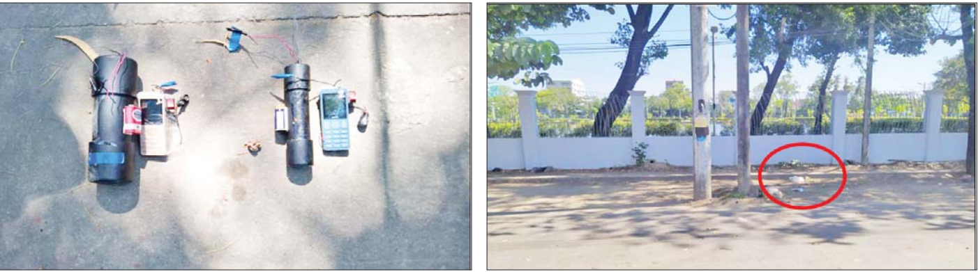
၂၀၂၂ ခုနှစ် အောက်တိုဘာလ ၁၆ ရက်တွင် မြောက်ဥက္ကလာပမြို့နယ် ကန်သာယာလမ်းဆုံ၌ လက်လုပ်မိုင်းနှစ်လုံး တွေ့ရှိခဲ့သည့် မှတ်တမ်းဓာတ်ပုံ။