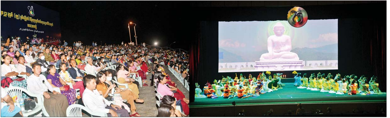
(၇၅)နှစ်မြောက် စိန်ရတု လွတ်လပ်ရေးနေ့အထိမ်းအမှတ် ပဒေသာကပွဲတွင် အနုပညာရှင်များ၏ ဖျော်ဖြေတင်ဆက်မှုနှင့် ကြည့်ရှုအားပေးသည့်ပရိသတ်များကို တွေ့ရစဉ်။

နေပြည်တော် ဒီဇင်ဘာ ၁၁ ၂၀၂၃ ခုနှစ် (၇၅)နှစ်မြောက် စိန်ရတုလွတ်လပ်ရေးနေ့အထိမ်းအမှတ် ပဒေသာကပွဲ (ဆဋ္ဌမနေ့) ကို ယနေ့ ညနေပိုင်းတွင် နေပြည်တော် မြို့တော်ခန်းမရှိ လဟာပြင်ကဇာတ်ရုံ၌ စည်ကားသိုက်မြိုက်စွာ ဆက်လက်ကျင်းပရာ ဝန်ထမ်းမိသားစုများ၊ တပ်မတော်သားမိသားစုများ၊ ပြည်သူများနှင့် ကျောင်းသား ကျောင်းသူများ တက်ရောက်ကြည့်ရှုအားပေးကြသည်။