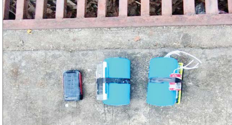
ဒီဇင်ဘာ ၃၀ ရက်တွင် တရားခံ လေးဦးနှင့်အတူ သိမ်းဆည်းရမိခဲ့သည့် လက်လုပ်မိုင်းနှစ်လုံး၏ မှတ်တမ်းဓာတ်ပုံ။

နေပြည်တော် ဒီဇင်ဘာ ၁ အကြမ်းဖက်အုပ်စုအဖြစ် ကြေညာထားသော CRPH၊ NUG နှင့် ယင်းတို့၏ လက်အောက်ခံ PDF အမည်ခံ အကြမ်းဖက်အဖွဲ့များ၊ ယင်းတို့နှင့်ဆက်နွှယ်နေသော အဖွဲ့အစည်းများနှင့် လူပုဂ္ဂိုလ်များသည် နိုင်ငံတော် တည်ငြိမ်အေးချမ်းရေးကို ပျက်ပြားစေရန်နှင့် ပြည်သူ့ လူထုကို အကြောက်တရားများဖြစ်ပေါ်စေပြီး အစိုးရ ယန္တရားများ ပျက်ပြားစေရန် ရည်ရွယ်လျက် နိုင်ငံဝန်ထမ်း များအပါအဝင် အပြစ်မဲ့ပြည်သူများအား အဓိကပစ်မှတ် ထား၍ လုပ်ကြံသတ်ဖြတ်ခြင်း၊ အများပြည်သူနှင့် သက်ဆိုင်သောနေရာများအား ဖောက်ခွဲဖျက်ဆီးခြင်း၊ အများပြည်သူပိုင်ပစ္စည်းများအား ဓားပြတိုက်လုယက်ခြင်း စသည့် အကြမ်းဖက်လုပ်ငန်းများကို နည်းမျိုးစုံဖြင့် ပြုလုပ်လျက်ရှိသည်။