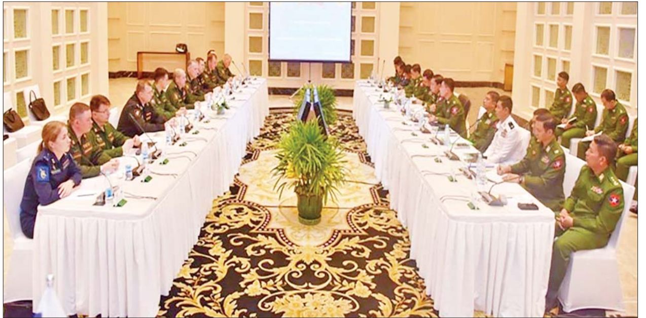
ဗိုလ်ချုပ်ကြီး မိုးမြင့်ထွန်းနှင့် ရုရှားတပ်မတော် စစ်ဦးစီးချုပ်ရုံးအကြီး Alexey Rostislavovich တို့က နိဂုံးချုပ်အမှာစကားများ ပြောကြားခဲ့ကြ အကဲနှင့် ပထမဒုတိယကြည်းတပ်ဦးစီးချုပ် Colonel-General Kim ကြောင်း သိရသည်။ သတင်းစဉ်

ထို့နောက် မြန်မာ-ရုရှား အကြမ်းဖက်မှုတိုက်ဖျက်ရေးကော်မတီ ပူးတွဲဥက္ကဋ္ဌများဖြစ်ကြသည့် ကာကွယ်ရေးဦးစီးချုပ်ရုံးကြည်းမှ ဒုတိယ