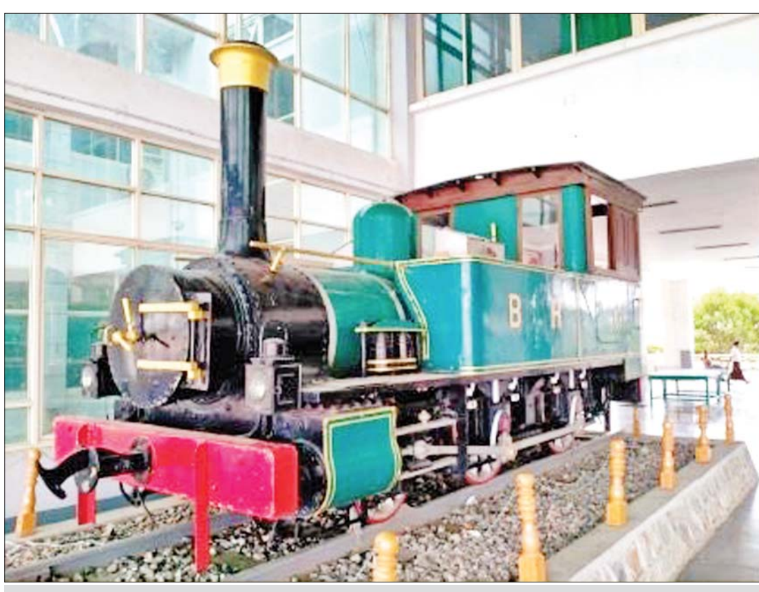
၁၈၇၇ ခုနှစ် မေလ ၁ ရက် ရန်ကုန်-ပြည် ရထားလမ်းပိုင်းဖွင့်ပွဲ၌ စတင်ပြေးဆွဲသည့် ရထား၏ စက်ခေါင်းအမှတ် (A-01)။

★ စာမျက်နှာ ၈ မှ အိန္ဒိယနိုင်ငံတွင် ရထားသယ်ယူ ပို့ဆောင်ရေးအတွက် နှစ်စဉ်ပျမ်းမျှ အမေရိကန်ဒေါ်လာ ၅ ဒသမ ၈ ဘီလီယံ ကို လျာထားခဲ့ပေးလျက်ရှိပြီး ရုရှား ဖက်ဒရေးရှင်းနိုင်ငံတွင် နှစ်စဉ်ပျမ်းမျှ အမေရိကန်ဒေါ်လာ ၁ ဒသမ ၅ ဘီလီယံ ကို လျာထားခဲ့ပေးလျက်ရှိသည်။ ဤနည်းဖြင့် အများပြည်သူသုံး မီးရထား သယ်ယူပို့ဆောင်ရေးစနစ်ကို အသက်ဝင် ရှင်သန်နိုင်စေရန် ဆောင်ရွက်ပေးလျက် ရှိနေသည်။ မျှော်မှန်းရလဒ်အနေဖြင့် ၎င်းနိုင်ငံများ၌ ခရီးသည်နှင့် ကုန်စည် ပို့ဆောင်ရေးတွင် တစ်နိုင်ငံလုံး၏ ၉၀ ရာခိုင်နှုန်းကို ရထားလုပ်ငန်းက ပိုင်ဆိုင်လျက်ရှိသည်။ ဤသို့ဖြင့် ကနဦး တွင် အရှုံးနှင့်စတင်ရသော်လည်း ရေရှည်တွင် နိုင်ငံအတွက်ရော အများ ပြည်သူအတွက်ပါ နှစ်ဖက်အကျိုးရှိ သည့်လုပ်ငန်းတစ်ခုလည်းဖြစ်သည်။ မိုဒိုအားထားလျက်ရှိ မိမိတို့နိုင်ငံတွင် မီးရထားသယ်ယူ ပို့ဆောင်ရေးကို အခြေခံလူတန်းစား အများအပြား မိုဒိုအားထားလျက်ရှိသည်။ သို့ရာတွင် အဘက်ဘက်မှ ယိုယွင်းအိုမင်း လာပြီဖြစ်သော မြန်မာ့မီးရထား၏ စွမ်းဆောင်ရည်မှာလည်း ကျဆင်းလျက် ရှိသဖြင့် ခရီးသည်နှင့် ကုန်စည်ပို့ဆောင် ရေးတို့တွင်ပါ တစ်စတစ်စ လျော့နည်း လာလျက်ရှိနေသည်။ ခရီးသွားကဏ္ဍ နှင့် ကုန်စည်ပို့ဆောင်ရေးကဏ္ဍတို့တွင် ဝေစုရာခိုင်နှုန်း အနည်းငယ်သာ ကျန်နေ တော့သည့် မြန်မာ့မီးရထားလုပ်ငန်းကို ပြန်လည်တိုးတက် ပြေးဆွဲနိုင်ရန်မှာ