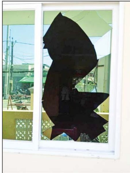
၂၀၂၂ ခုနှစ် အောက်တိုဘာ ၁၈ ရက်တွင် မြောက်ဥက္ကလာပမြို့နယ် (၂၂)ရပ်ကွက်ရှိ အုပ်ချုပ်ရေးမှူးရုံး၌ လက်လုပ်ခိုင်းပေါက်ကွဲခဲ့မှု မှတ်တမ်းဓာတ်ပုံ။