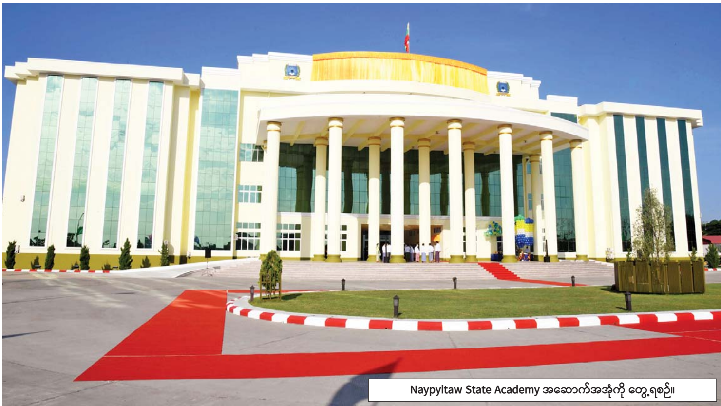
Naypyitaw State Academy အဆောက်အအုံကို တွေ့ရစဉ်။

တက္ကသိုလ်ဆိုသည်မှာ နိုင်ငံ၏ တန်ဖိုးမဖြတ်နိုင်သော ရတနာဖြစ်ပါ သည်။ တက္ကသိုလ်ကို အဆင့်မြင့် တင်မည်ဆိုလျှင် နိုင်ငံစုံမှ အဆင့်မြင့် ထိပ်တန်းတက္ကသိုလ်များကို နမူနာယူ၍ လေ့လာသင့်ပါသည်။ တက္ကသိုလ် ကောင်းတစ်ခု၏ အင်္ဂါရပ်များကို အဖွဲ့ အစည်းအသီးသီးမှ သက်ဆိုင်ရာ “စံ” သတ်မှတ်ချက်များနှင့် အကဲဖြတ်လေ့ ရှိကြပါသည်။ အများစုမှာ (၁) တက္ကသိုလ် ၏ သုတေသနအရည်အသွေး၊ (၂) ဘွဲ့ရ များ၏ အလုပ်အကိုင်အခြေအနေ၊ (၃) တက္ကသိုလ်၏ နိုင်ငံခြားဆက်ဆံရေး၊ (၄) တက္ကသိုလ်၏ ကျောင်းသားနှင့် ဆရာ အချိုးတို့ကို အဓိကအခြေခံပါသည်။