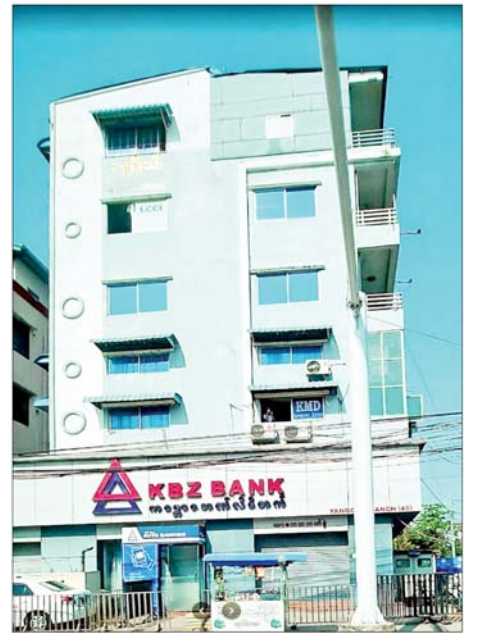
သာကောတမြို့နယ် မြင်တော်သာလမ်းနှင့် ဇင်္ဂလမ်းထောင့်ရှိ ကမ္ဘောဇဘဏ်ခွဲအိမ်မှတ်တမ်းဓာတ်ပုံ။