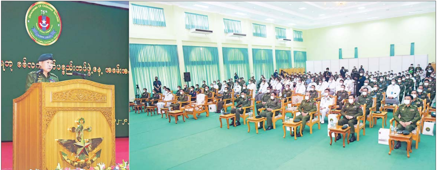
နိုင်ငံတော်စီမံအုပ်ချုပ်ရေးကောင်စီ ဒုတိယဥက္ကဋ္ဌ ဒုတိယတပ်မတော်ကာကွယ်ရေးဦးစီးချုပ် ကာကွယ်ရေးဦးစီးချုပ်(ကြည်း) ဒုတိယဗိုလ်ချုပ်မှူးကြီးစိုးဝင်း (၇၅)နှစ်မြောက် စိန်ရတုစစ်လက်နက်ပစ္စည်းတပ်ဖွဲ့နေ့ အခမ်းအနားတွင် ဂုဏ်ပြုအမှာစကားပြောကြားစဉ်။

စစ်လက်နက်ပစ္စည်းတပ်ဖွဲ့ ကွပ်ကဲမှုအောက်တွင်ရှိသည့် တပ်မတော်စက်ရုံများအနေဖြင့် ပြည်ပနိုင်ငံထုတ် စစ်ဝတ်တန်ဆာပလာများအပေါ် အမှီအခိုကင်းပြီး မိမိတပ်မတော်၏ ပြည်တွင်းစက်ရုံများတွင် ထုတ်လုပ်သော အရည်အသွေးမြင့် စစ်လက်နက်ပစ္စည်းများဖြင့် တပ်မတော်တစ်ရပ်လုံး၏ လိုအပ်ချက်များကို ပြည့်ဝစွာ ဖြည့်ဆည်းပေးလျက်ရှိ