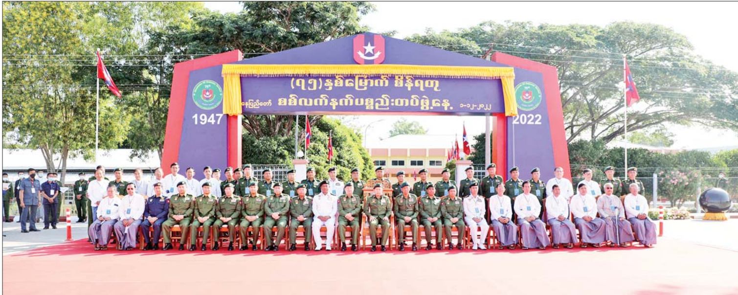
နိုင်ငံတော်စီမံအုပ်ချုပ်ရေးကောင်စီ ဒုတိယဥက္ကဋ္ဌ ဒုတိယတပ်မတော်ကာကွယ်ရေးဦးစီးချုပ် ကာကွယ်ရေးဦးစီးချုပ်(ကြည်း) ဒုတိယဗိုလ်ချုပ်မှူးကြီးစိုးဝင်း (၇၅)နှစ်မြောက် စိန်ရတု စစ်လက်နက်ပစ္စည်းတပ်ဖွဲ့နေ့ အခမ်းအနား တက်ရောက်လာကြသူများနှင့်အတူ စုပေါင်းမှတ်တမ်းတင်ဓာတ်ပုံရိုက်စဉ်။

ထို့နောက် နိုင်ငံတော်စီမံအုပ်ချုပ်ရေးကောင်စီ ဒုတိယဥက္ကဋ္ဌ ဒုတိယတပ်မတော် ကာကွယ်ရေးဦးစီးချုပ်(ကြည်း)က တက်ရောက်လာကြသည့် အငြိမ်းစား စစ်လက်နက်ပစ္စည်းတပ်ဖွဲ့ဝင် အရာရှိကြီးများအား ရင်းရင်းနှီးနှီး နှုတ်ဆက်ပြီး တက်ရောက်လာကြသူများနှင့်အတူ (၇၅)နှစ်မြောက်စိန်ရတု စစ်လက်နက်ပစ္စည်းတပ်ဖွဲ့နေ့ အထိမ်းအမှတ်ပြခန်းအတွင်း လှည့်လည်ကြည့်ရှုလေ့လာခဲ့ကြကြောင်း သိရသည်။ သတင်းစဉ်