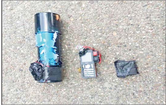
၂၀၂၂ ခုနှစ် ဩဂုတ် ၁၅ ရက်တွင် မြောက်ဥက္ကလာပမြို့နယ် (၅)ရပ်ကွက်၌ လက်လုပ်ခိုင်းပေါက်ကွဲခဲ့မှု မှတ်တမ်းဓာတ်ပုံ။