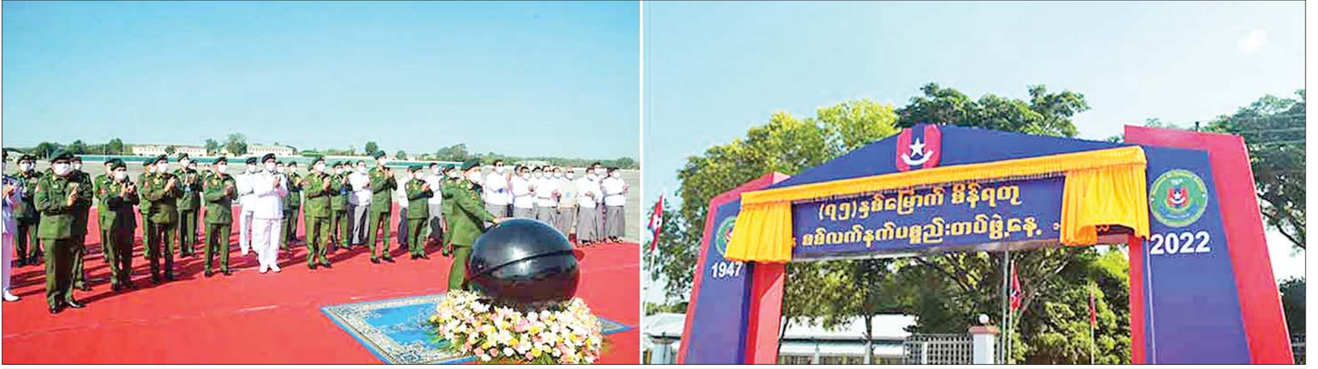
နိုင်ငံတော်စီမံအုပ်ချုပ်ရေးကောင်စီ ဒုတိယဥက္ကဋ္ဌ ဒုတိယတပ်မတော်ကာကွယ်ရေးဦးစီးချုပ် ကာကွယ်ရေးဦးစီးချုပ်(ကြည်း) ဒုတိယဗိုလ်ချုပ်မှူးကြီးစိုးဝင်း (၇၅)နှစ်မြောက် စိန်ရတုစစ်လက်နက်ပစ္စည်းတပ်ဖွဲ့နေ့ ဆိုင်းဘုတ်ကို စက်ခလုတ်နှိပ် ဖွင့်လှစ်ပေးစဉ်။