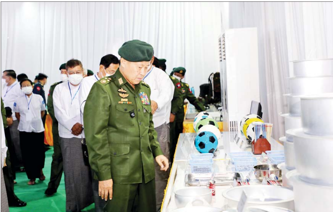
နိုင်ငံတော်စီမံအုပ်ချုပ်ရေးကောင်စီ ဒုတိယဥက္ကဋ္ဌ ဒုတိယတပ်မတော်ကာကွယ်ရေးဦးစီးချုပ် ကာကွယ်ရေးဦးစီးချုပ်(ကြည်း) ဒုတိယဗိုလ်ချုပ်မှူးကြီးစိုးဝင်း (၇၅)နှစ်မြောက် စိန်ရတုစစ်လက်နက်ပစ္စည်းတပ်ဖွဲ့နေ့ အထိမ်းအမှတ်ပြခန်းအတွင်း ကြည့်ရှု လေ့လာစဉ်။

★ ရှေးဦးမှ ဒုတိယတပ်မတော်ကာကွယ်ရေးဦးစီးချုပ် ကာကွယ်ရေးဦးစီးချုပ်(ကြည်း)က (၇၅) နှစ်မြောက် စိန်ရတုစစ်လက်နက်ပစ္စည်း တပ်ဖွဲ့နေ့ဆိုင်းဘုတ်ကို စက်ခလုတ်နှိပ် ဖွင့်လှစ်ပေးပြီး တက်ရောက်လာကြသူများ နှင့်အတူ စုပေါင်းမှတ်တမ်းတင်ဓာတ်ပုံ ရိုက်ကြသည်။ ယင်းနောက် နိုင်ငံတော်စီမံအုပ်ချုပ် ရေးကောင်စီဒုတိယဥက္ကဋ္ဌ ဒုတိယ တပ်မတော်ကာကွယ်ရေးဦးစီးချုပ်ကာကွယ် ရေးဦးစီးချုပ်(ကြည်း)က (၇၅)နှစ်မြောက်