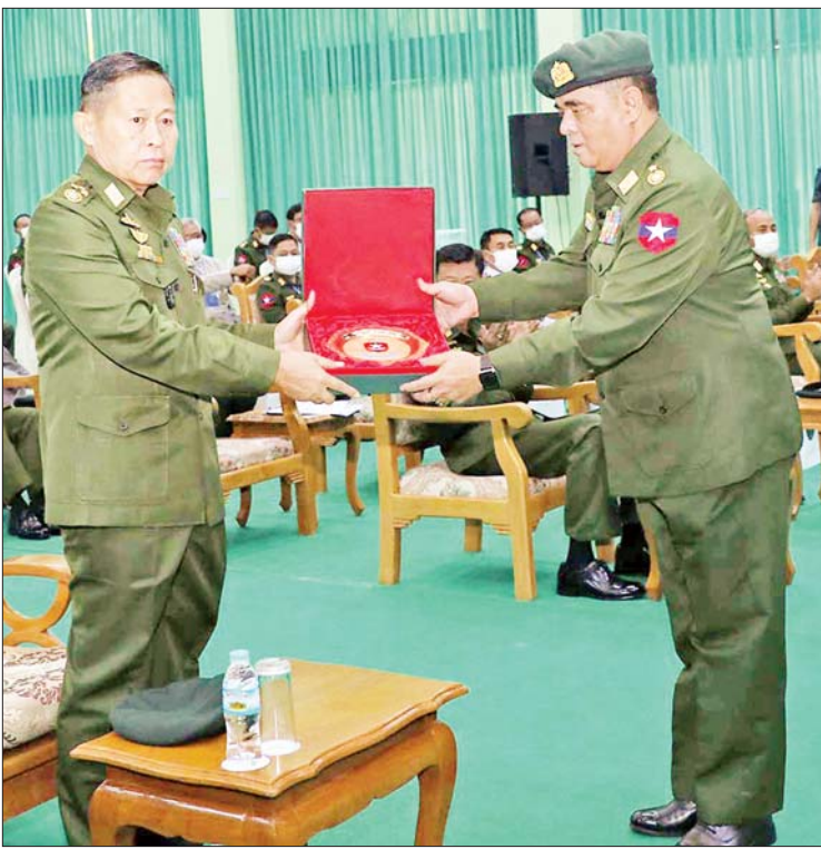
နိုင်ငံတော်စီမံအုပ်ချုပ်ရေးကောင်စီ ဒုတိယဥက္ကဋ္ဌ ဒုတိယတပ်မတော်ကာကွယ်ရေးဦးစီးချုပ် ကာကွယ်ရေးဦးစီးချုပ်(ကြည်း) ဒုတိယဗိုလ်ချုပ်မှူးကြီးစိုးဝင်းထံ စစ်လက်နက်ပစ္စည်း ညွှန်ကြားရေးမှူးက (၇၅)နှစ်မြောက်စိန်ရတုစစ်လက်နက်ပစ္စည်းတပ်ဖွဲ့နေ့ အထိမ်းအမှတ်လက်ဆောင်ကို ဂါရဝပြုပေးအပ်စဉ်။

ဝင့်ကြားထည့်ဝါစွာ ရပ်တည်နိုင် မြန်မာ့ လွတ်လပ်ရေးကြိုးပမ်းမှု