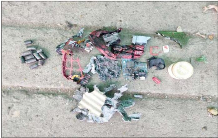
၂၀၂၂ ခုနှစ် နိုဝင်ဘာ ၂၂ ရက်တွင် မြောက်ဥက္ကလာပမြို့နယ် (၅)ဈေးအနီး၌ လက်လုပ်ခိုင်းပေါက်ကွဲခဲ့မှု မှတ်တမ်းဓာတ်ပုံ။