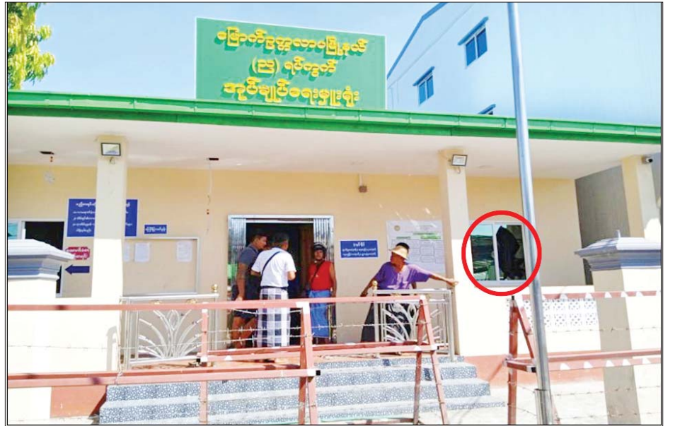
၂၀၂၂ ခုနှစ် အောက်တိုဘာ ၁၈ ရက်တွင် မြောက်ဥက္ကလာပမြို့နယ် (၂၂)ရပ်ကွက်ရှိ အုပ်ချုပ်ရေးမှူးရုံး၌ လက်လုပ်ခိုင်းပေါက်ကွဲခဲ့မှု မှတ်တမ်းဓာတ်ပုံ။