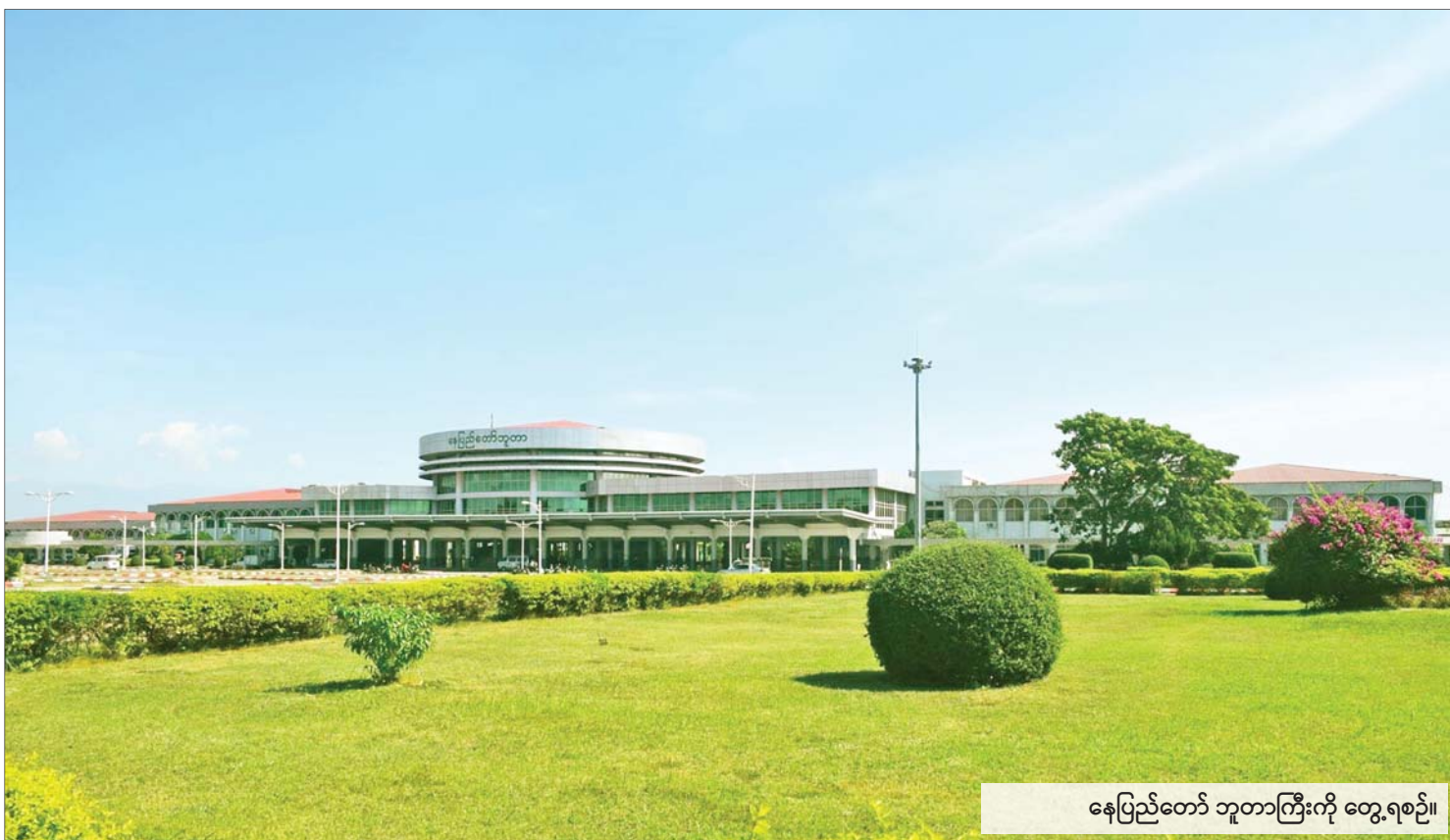
နေပြည်တော် ဘူတာကြီးကို တွေ့ရစဉ်။

မြန်မာ့မီးရထားအနေဖြင့် ယခုနှစ် မေလ ၁ ရက်နေ့က သက်တမ်း ၁၄၅ နှစ် ဆိုသည့် ဘူတာစဉ်အမှတ်ကို ဖြတ်ကျော် ခုတ်မောင်းခဲ့ပြီဖြစ်သည်။ မြန်မာ့ မီးရထားပေါ်ပေါက်လာပုံသမိုင်းအကျဉ်း ပြန်ပြောင်းကြည့်ရလျှင် ၁၈၅၂ ခုနှစ်တွင် အင်္ဂလိပ်နယ်ချဲ့တို့အနေဖြင့် မြန်မာနိုင်ငံ ကို ဒုတိယအကြိမ်ကျူးကျော်သိမ်းပိုက် ပြီးနောက် အောက်မြန်မာပြည်၏ လမ်းပန်းဆက်သွယ်ရေးမှာ လူသွား လမ်း၊ လှည်းလမ်းကြောင်းများနှင့် မြစ်ချောင်းတို့တွင် လှေသမ္ဗန်များဖြင့်သာ ဆက်သွယ်သွားလာလျက်ရှိခြင်း၊ ၁၈၆၉ ခုနှစ်တွင် စူးအက်တူးမြောင်း ဖွင့်လှစ်ပြီးနောက် အဓိကဒေသ ထွက်ကုန်ဖြစ်သည့် ဆန်နှင့်အခြားပို့ကုန် များ တင်ပို့မှုတိုးတက်လာခြင်းနှင့် အထက်မြန်မာပြည်ကို အုပ်ချုပ်လျက် ရှိသည့် မြန်မာဘုရင်က စစ်တို့ပြန်သည့် အခါ ၎င်းတို့၏ ဗြိတိသျှစစ်တပ်နှင့် စစ်လက်နက်ပစ္စည်းများကို အလျင် အမြန် ရွှေ့ပြောင်းပို့ဆောင်နိုင်ရန်တို့ အတွက် ရထားလမ်းဖောက်လုပ်ရန် သုံးသပ်လာကြသည်။