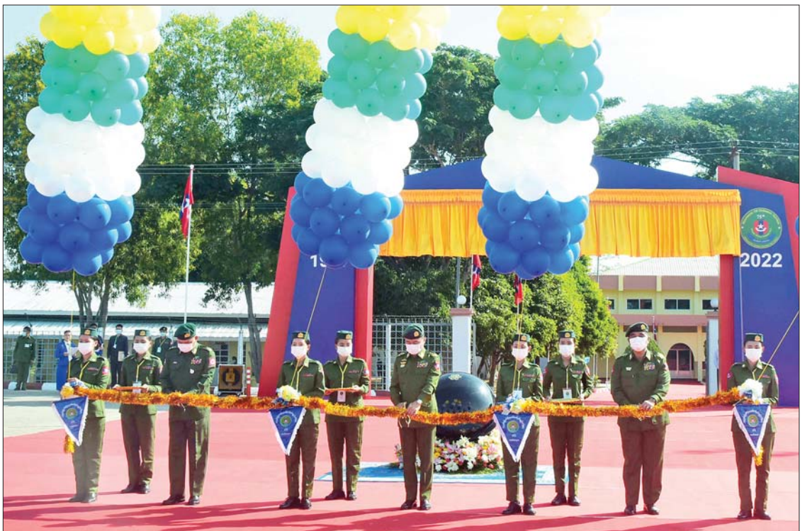
ကာကွယ်ရေးဦးစီးချုပ်(ကြည်း)မှ စစ်ထောက်ချုပ် ဒုတိယဗိုလ်ချုပ်ကြီး ကျော်စွာလင်း၊ စစ်လက်နက်ပစ္စည်းညွှန်ကြားရေး မှူး ဗိုလ်ချုပ်ဝင်းလွင်နှင့် တိုင်းမှူး ဗိုလ်ချုပ်ဇော်ဟိန်းတို့ (၇၅)နှစ်မြောက် စိန်ရတုစစ်လက်နက်ပစ္စည်းတပ်ဖွဲ့နေ့ အခမ်းအနားကို ဖဲကြိုးဖြတ် ဖွင့်လှစ်ပေးစဉ်။