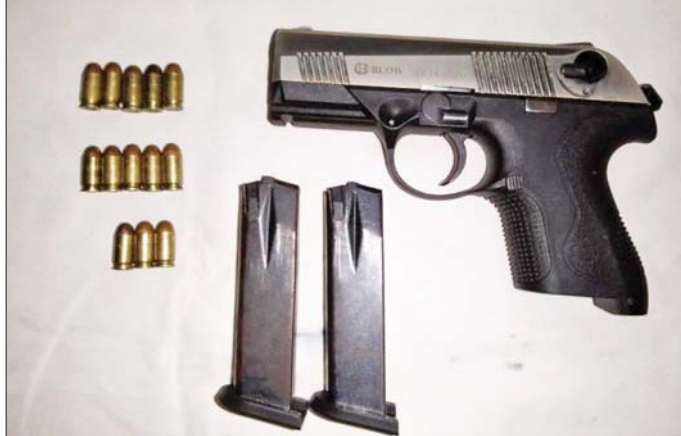
ဝေယံကောင်းထက်(ခ) Lu Aye ၏ နေအိမ်မှ သိမ်းဆည်းရမိခဲ့သည့် လက်နက်/ ခဲယမ်းများ မှတ်တမ်းဓာတ်ပုံ။