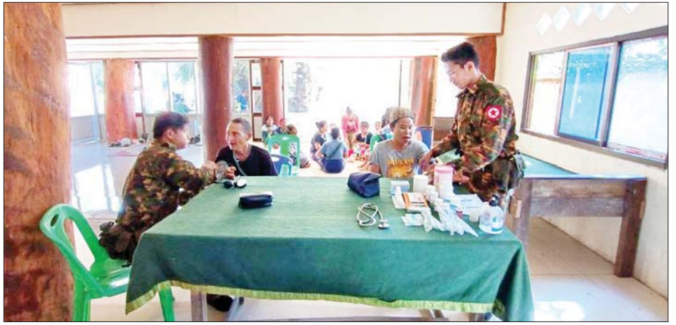
သေဘောဘိုးကျေးရွာနှင့် ဘလက်ဒိုကျေးရွာသို့ ပြန်လည်ဝင်ရောက်လာသည့် ပြည်သူများကို ကျန်းမာရေးစောင့်ရှောက်မှုများဆောင်ရွက်ပေးစဉ်။

နေပြည်တော် ဒီဇင်ဘာ ၁၀ ကရင်ပြည်နယ်အတွင်းရှိ ဖလူး၊ ကျောက်ခက်၊ သေဘောဘိုး၊ ဝေါလေဒေသတစ်ဝိုက်နှင့် မြဝတီ-ဝေါလေကားလမ်းတစ်လျှောက်တို့အား KNU၊ KNLA မှ အကြမ်းဖက်မှုကို လိုလားသောအဖွဲ့၊ NUG အဖွဲ့နှင့် ၎င်း၏လက်ဝေခံ PDF အမည်ခံအကြမ်းဖက်သမားများက ၂၀၂၂ မေလမှ စတင်ထိန်းချုပ်၍ အဆိုပါ ဒေသတစ်ဝိုက်ရှိ လူနေအိမ်များ၊ ဘာသာရေးဆိုင်ရာ အဆောက်အအုံများ၊ စာသင်ကျောင်းများအတွင်း ဝင်ရောက်နေထိုင်ကာ အဖျက်အမှောင့်လုပ်ငန်းများ လုပ်ဆောင်ခြင်း၊ ခြိမ်းခြောက်ခြင်းများကြောင့် ဒေသခံတိုင်းရင်းသားများ အနေဖြင့် ဘေးလွတ်ရာ နေရာများသို့ ခေတ္တထွက်ပြေးတိမ်းရှောင်လျက်ရှိ သည်။