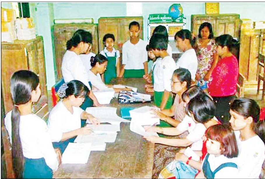
မြန်မာနိုင်ငံ၏ မသင်မနေရပညာရေးစနစ်အရ အခမဲ့ကျောင်းအပ်နှံနေသော မူလတန်းကျောင်းသား ကျောင်းသူလေးများ။

ပညာရေးစီမံခန့်ခွဲမှု ကောင်းခြင်းနှင့်အတူ ပညာရေးအဆောက်အအုံ၏ “မသင်မနေရပညာရေး” ဆိုသည့် အုတ်မြစ်လည်း ခိုင်မာရပါမည်။ မြင့်နေရ ပါမည်။ မြင့်မားနေရန်အတွက် လုံလောက်သော ပညာသင်ကြားရေးကာလနှင့် အဆင့်လိုအပ်ပါသည်။ မြောက်အမေရိက၊ အနောက်ဥရောပ၊ အိန္ဒိယ၊ ဂျပန်၊ ကိုရီးယား၊ ထိုင်း၊ ဩစတြေးလျနှင့် စင်ကာပူနိုင်ငံတို့ ဖွံ့ဖြိုးခြင်း၊ တိုးတက် ခြင်းမှာ သူတို့နိုင်ငံသားတိုင်းသည် တောင့်တင်းခိုင်မာသည့် အခြေခံပညာရေး ကို မသင်မနေရသင်ယူခဲ့ကြ၍ဖြစ်