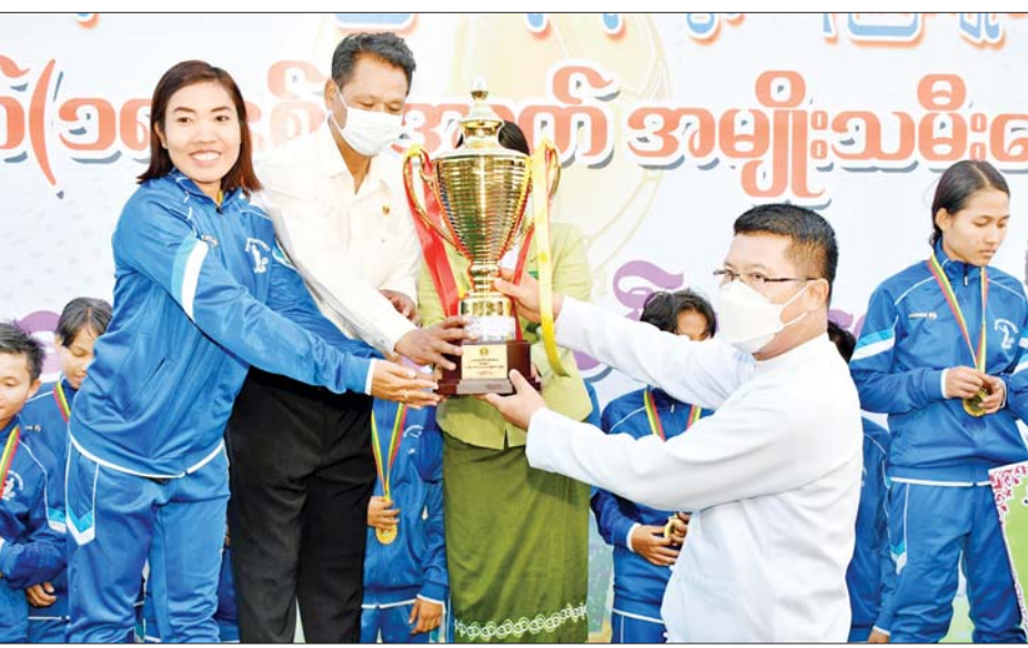
လည်းကောင်း ပေးအပ်ချီးမြှင့်ပွဲကြပြီး ပထမဆု ရရှိသည့် ကျိုပျော်ခရိုင်အသင်းအား တံခွန်စိုက် ဆုဖလားကို တိုင်းဒေသကြီး ဝန်ကြီးချုပ်က တိုင်းဒေသကြီး(ပြန်/ဆက်) တိုင်းဒေသကြီး(ပြန်/ဆက်)

ခဲ့ရာ ကျိုပျော်ခရိုင် ဘောလုံးအသင်းက ပုသိမ်ခရိုင် ဘောလုံးအသင်းကို တစ်ဂိုး-ဂိုးမရှိဖြင့် အနိုင်ရရှိခဲ့ သည်။ ပေးအပ်ချီးမြှင့် ဆက်လက်၍ ဆုချီးမြှင့်ပွဲအခမ်းအနားကို ပြုလုပ်ရာ ဒုတိယဆုရရှိသည့် ပုသိမ်ခရိုင်အသင်းမှ အားကစားသမားများအား တစ်ဦးချင်းဆုတံဆိပ်နှင့် ငွေသားဆုအား တိုင်းရင်းသားရေးရာဝန်ကြီးကလည်း ကောင်း၊ ပထမဆုရရှိသည့် ကျိုပျော်ခရိုင်အသင်းမှ အားကစားသမားများအား တစ်ဦးချင်းဆုတံဆိပ်နှင့် ငွေသားဆုအား လမ်းပန်းဆက်သွယ်ရေးဝန်ကြီးက လည်းကောင်း၊ နေရာအလိုက်အကောင်းဆုံး ကစား သမားဆုရရှိသူများအား တစ်ဦးချင်းဆုတံဆိပ်နှင့် ငွေသားဆုများကို သယံဇာတရေးရာဝန်ကြီးက