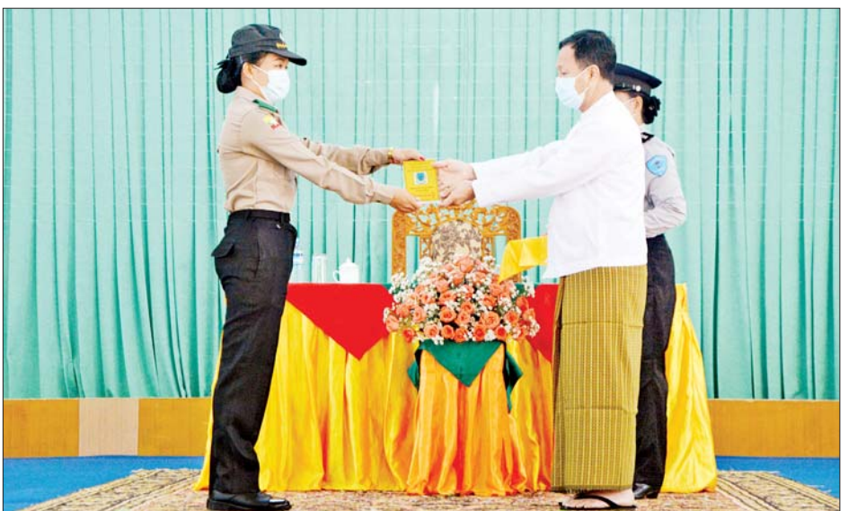
ကျောင်းသားဆိုသကဲ့သို့ အစဉ်လေ့လာနေကြ ရမည်လည်းဖြစ်ကြောင်း။ ယခုသင်တန်းမှ သင်ကြားပို့ချပေးလိုက်သည့် အသိအမြင်၊ ဗဟုသုတများကို လုပ်ငန်းခွင်တွင် အသုံးပြုပြီး မိမိတို့တွင်ရှိသည့် လိုအပ်ချက်များ၊ ပြုပြင်ရမည့်အချက်များရှိပါက ပြုပြင်ဆောင်ရွက် သွားရင်း မိမိကျောင်းနှင့် မိမိရပ်ရွာ၏ ပညာရေး တိုးတက်မြှင့်တင်ရေးအောင် အားသွန်ခွန်စိုက် ကြိုးပမ်း ဆောင်ရွက်သွားကြပါရန် တိုက်တွန်းပြောကြားသည်။ ဆက်လက်၍ သင်တန်းထူးချွန်ဆု ရရှိသူများကို ဆုများပေးအပ်ချီးမြှင့်ပြီး သင်တန်းဆင်း ဂုဏ်ပြု လက်မှတ်များ ပေးအပ်သည်။ အခြေခံပညာ ဆရာ ဆရာမများ အထူးမွမ်းမံ သင်တန်းအမှတ်စဉ်(၉၉)သို့ သင်တန်းသား ၅၀၊ သင်တန်းသူ ၄၃၈ ဦး စုစုပေါင်း ၄၈၈ ဦး တက်ရောက် ခဲ့ကြပြီး သင်တန်းကာလမှာ အောက်တိုဘာ ၂၅ ရက်မှ နိုဝင်ဘာ ၂၄ ရက်အထိ ရက်သတ္တငါးပတ် ကြာမြင့်ခဲ့ကြောင်း သိရသည်။ သတင်းစဉ်

တတ်မြောက်ရုံမျှဖြင့် မြင့်မားခြင်းမဟုတ်ဘဲ နိုင်ငံသား တိုင်း အမှားအမှန် ဝေဖန်ပိုင်းခြားနိုင်ကာ နောင်မျိုး ဆက်များကို အလေ့အကျင့်ကောင်း၊ အတွေးအခေါ် ကောင်းများနှင့် မှန်ကန်သည့်ခံယူချက်များကို လက်ဆင့်ကမ်းပြီး ပြုစုပျိုးထောင် လေ့ကျင့်ပေးခြင်း ဖြစ်ကြောင်း။ ယနေ့ကာလတွင် လူ့စွမ်းအားအရင်းအမြစ်များ အဓိကကျနေချိန်တွင် ပညာတတ်လူငယ်များ ပေါ်ထွက်လာစေရန် ဆရာ ဆရာမများတွင် တာဝန် ရှိကြောင်း၊ သို့မှသာ နိုင်ငံသားတိုင်း၏ စွမ်းဆောင်ရည် ကောင်းမွန်တိုးတက်လာပြီး နိုင်ငံတော်ဖွံ့ဖြိုး တိုးတက်မှု မြန်ဆန်လာမည်ဖြစ်ကြောင်း၊ ထို့ကြောင့် ယနေ့နိုင်ငံတော်အနေဖြင့် ပညာရေး ဖွံ့ဖြိုးတိုးတက်မှုကို အလေးထားဆောင်ရွက်ပေး လျက်ရှိကြောင်း။ လူ့စွမ်းအားအရင်းအမြစ်များကို ဖန်တီးပေးနေ ရသည့် ဆရာ ဆရာမများသည် ခေတ်နှင့်အညီ ရင်ပေါင်တန်း လိုက်ပါနိုင်ရမည် ဖြစ်သည့်အတွက် မိမိတို့၏ အရည်အသွေးကို အမြဲမြှင့်တင်နေရမည် ဖြစ်ကြောင်း၊ ထို့ကြောင့် “ဆရာဆိုတာ ထာဝရ