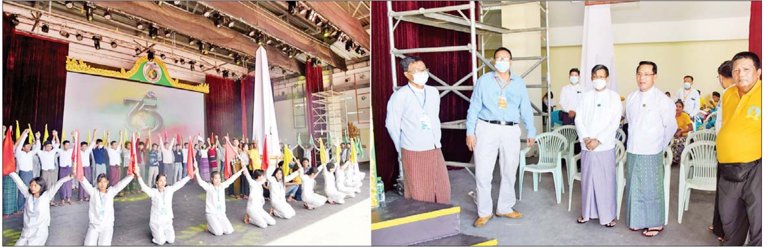
ပြည်ထောင်စုဝန်ကြီး ဦးမောင်မောင်အုန်းနှင့် နေပြည်တော်ကောင်စီဥက္ကဋ္ဌ ဦးတင်ဦးလွင်တို့ စိန်ရတုလွတ်လပ်ရေးနေ့အထိမ်းအမှတ်ပဒေသာကပွဲ ကျင်းပနိုင်ရေးအတွက် ကြိုတင်စီစဉ်ဆောင်ရွက်နေမှုများကို ကြည့်ရှုစစ်ဆေးစဉ်။

နေပြည်တော် နိုဝင်ဘာ ၂၄ (၇၅)နှစ်မြောက် စိန်ရတုလွတ်လပ်ရေးနေ့အထိမ်းအမှတ် ပဒေသာကပွဲကို နေပြည်တော်မြို့တော်ခန်းမ လဟာပြင် ကဇာတ်ရုံ၌ နိုဝင်ဘာ ၂၆ ရက်မှ ၃၀ ရက်အထိ စည်ကားသိုက်မြိုက်စွာ ကျင်းပ သွားမည်ဖြစ်သည်။