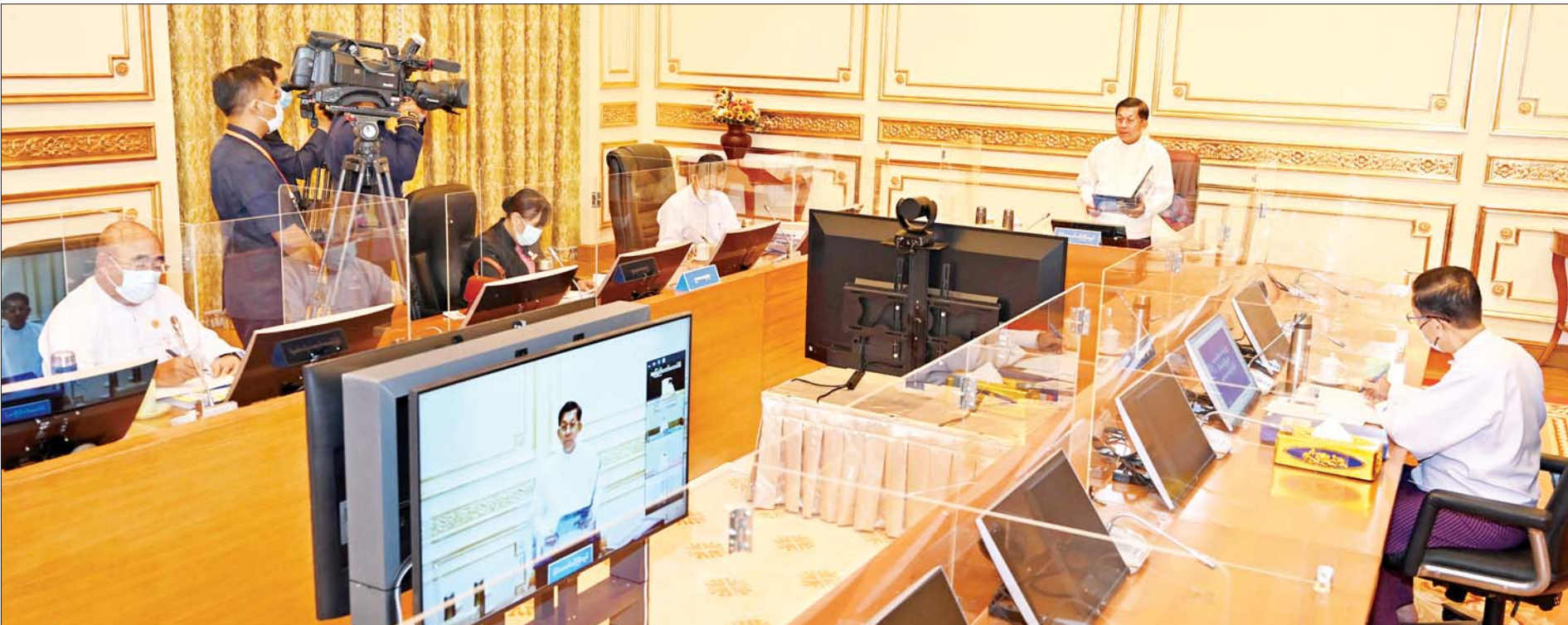
ဘဏ္ဍာရေးဆိုင်ရာကော်မရှင်ဥက္ကဋ္ဌ နိုင်ငံတော်စီမံအုပ်ချုပ်ရေးကောင်စီဥက္ကဋ္ဌ နိုင်ငံတော်ဝန်ကြီးချုပ် ဗိုလ်ချုပ်မှူးကြီးမင်းအောင်လှိုင် ဘဏ္ဍာရေးဆိုင်ရာကော်မရှင် အစည်းအဝေးအမှတ်စဉ် (၂/၂၀၂၂)တွင် အမှာစကားပြောကြားစဉ်။