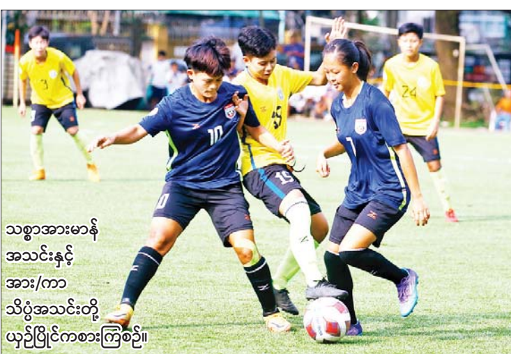
သစ္စာအားမာန် အသင်းနှင့် အား/ကာ သိပွဲအသင်းတို့ ယှဉ်ပြိုင်ကစားကြစဉ်။

ရန်ကုန် နိုဝင်ဘာ ၂၄ ၂၀၂၂ ရာသီ မြန်မာအမျိုးသမီးလိဂ် ပြိုင်ပွဲပွဲစဉ်(၁၃)ကို နိုဝင်ဘာ (၂၃၊ ၂၄) ရက် တွင် ဆက်လက်ကျင်းပရာ သစ္စာအားမာန် အသင်းက လက်ရှိချန်ပီယံ အား/ကာသိပွဲ အသင်းကို အနိုင်ယူခဲ့သဖြင့် ချန်ပီယံဆု အတွက် နောက်ဆုံးပွဲအထိ စောင့်ကြည့်ရ မည်ဖြစ်သည်။ ပွဲစဉ်(၁၃)တွင် သစ္စာအားမာန်အသင်း က အား/ကာသိပွဲအသင်းကို သုံးဂိုး- နှစ်ဂိုး၊ မြဝတီအသင်းက YREO အသင်းကို တစ်ဂိုး-ဂိုးမရှိ၊ အား/ကာသိပွဲအသင်းက စာမျက်နှာ ၂၁ ကော်လံ ၁ သို့ ❖