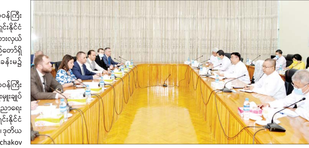
တွေ့ဆုံစဉ် နိုင်ငံတော်စီမံအုပ်ချုပ်ရေးကောင်စီ ဥက္ကဋ္ဌ နိုင်ငံတော်ဝန်ကြီးချုပ်၏ ရုရှားဖက်ဒရေးရှင်း နိုင်ငံခရီးစဉ်အတွင်း ဆွေးနွေးခဲ့သော နှစ်နိုင်ငံ အကြား ပညာရေးပူးပေါင်းဆောင်ရွက်မှုမြှင့်တင်ရေး ကိစ္စ အကောင်အထည်ဖော်ဆောင်ရွက်ရေး၊ နှစ်နိုင်ငံ အကြား ပညာရေး၊ ပညာအရည်အသွေးနှင့်ဘွဲ့ဒီဂရီများ

နေပြည်တော် နိုဝင်ဘာ ၂၄ ပညာရေးဝန်ကြီးဌာန ပြည်ထောင်စုဝန်ကြီး ဒေါက်တာညွန့်ဖေသည် ရုရှားဖက်ဒရေးရှင်းနိုင်ငံ တက္ကသိုလ်များမှ အဆင့်မြင့်ပညာရေး ကိုယ်စားလှယ် အဖွဲ့နှင့် ယနေ့မနက်လွှဲပိုင်းတွင် နေပြည်တော်ရှိ ပညာရေးဝန်ကြီးဌာန အစည်းအဝေးခန်းမ၌ တွေ့ဆုံသည်။ အဆိုပါ တွေ့ဆုံဆွေးနွေးပွဲသို့ ဒုတိယဝန်ကြီး များ၊ အမြဲတမ်းအတွင်းဝန်နှင့် ညွှန်ကြားရေးမှူးချုပ် များ တက်ရောက်ကြပြီး ရုရှားအဆင့်မြင့်ပညာရေး ကိုယ်စားလှယ်အဖွဲ့တွင် ရုရှားဖက်ဒရေးရှင်းနိုင်ငံ တက္ကသိုလ်များမှ အဆင့်မြင့်အရာရှိကြီးများ၊ ဒုတိယ ပါမောက္ခချုပ်များ၊ The Alexander Gorchakov Public Diplomacy Fund နှင့် ရုရှား-မြန်မာ ချစ်ကြည်ရေးနှင့် ပူးပေါင်းဆောင်ရွက်ရေးအသင်းမှ တာဝန်ရှိသူများ တက်ရောက်ကြသည်။