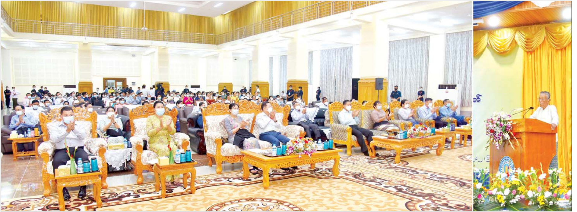
နိုင်ငံတော်စီမံအုပ်ချုပ်ရေးကောင်စီဥက္ကဋ္ဌ နိုင်ငံတော်ဝန်ကြီးချုပ် ဗိုလ်ချုပ်မှူးကြီးမင်းအောင်လှိုင် စာဆိုတော်နေ့အထိမ်းအမှတ် စာပေဟောပြောပွဲအခမ်းအနားသို့ တက်ရောက်ကြည့်ရှုအားပေးစဉ်။