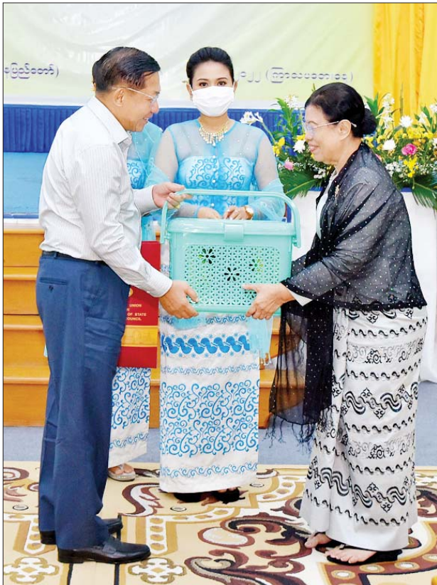
နိုင်ငံတော်စီမံအုပ်ချုပ်ရေးကောင်စီဥက္ကဋ္ဌ နိုင်ငံတော်ဝန်ကြီးချုပ် ဗိုလ်ချုပ်မှူးကြီးမင်းအောင်လှိုင် စာပေဟောပြောပွဲသို့ စာရေးဆရာမကြီး မစန္ဒာအား ဂုဏ်ပြုလက်ဆောင်များ ပေးအပ်စဉ်။