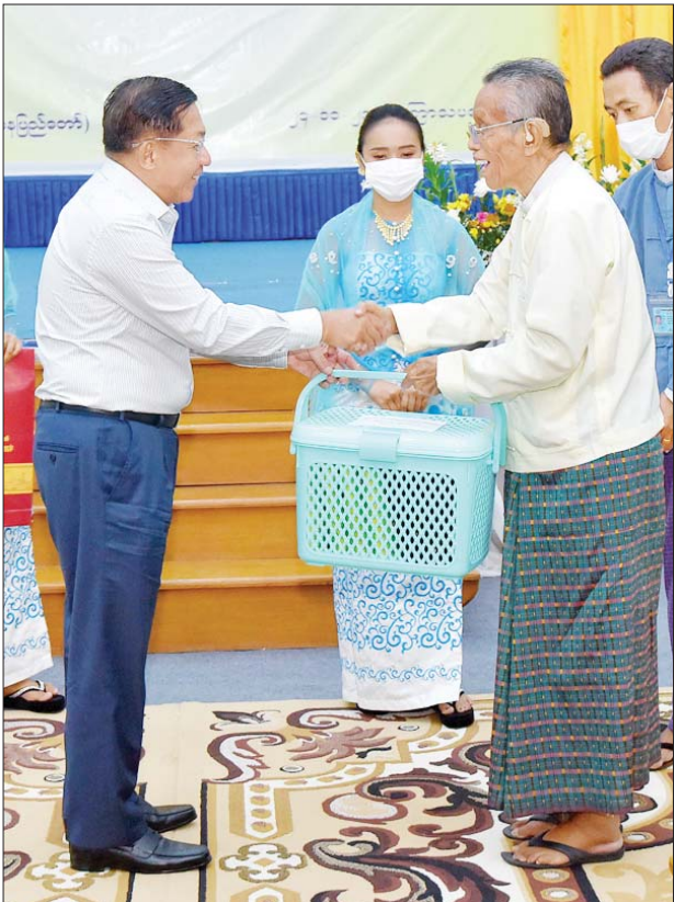
နိုင်ငံတော်စီမံအုပ်ချုပ်ရေးကောင်စီဥက္ကဋ္ဌ နိုင်ငံတော်ဝန်ကြီးချုပ် ဗိုလ်ချုပ်မှူးကြီးမင်းအောင်လှိုင် စာပေဟောပြောပွဲသို့ စာရေးဆရာကြီး တက္ကသိုလ်မြတ်သူအား ဂုဏ်ပြုလက်ဆောင်များ ပေးအပ်စဉ်။