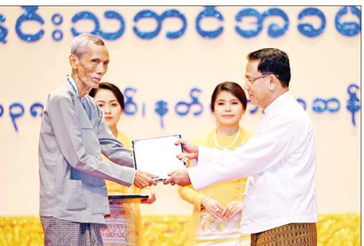
ပြည်ထောင်စုဝန်ကြီး ဦးမောင်မောင်အုန်း စာပေဗိမာန်စာမူဆု ပြဇာတ်စာပေ ပထမဆုရရှိသူ ဆရာမောင်ယဉ်လှိုင် (ပျဉ်းမမြိုင်)အား ဆုပေးအပ်ချီးမြှင့်စဉ်။