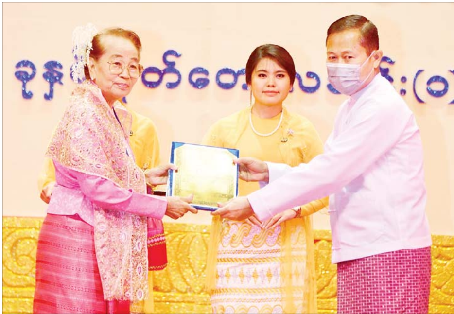
နိုင်ငံတော်စီမံအုပ်ချုပ်ရေးကောင်စီဒုတိယဥက္ကဋ္ဌ ဒုတိယဝန်ကြီးချုပ် ဒုတိယဗိုလ်ချုပ်မှူးကြီးစိုးဝင်း အမျိုးသားစာပေဆု မြန်မာ့ယဉ်ကျေးမှုနှင့် အနုပညာဆိုင်ရာ စာပေဆုရှင် ရွှေကုန်းနွဲ့နွဲ့အား ဆုပေးအပ် ချီးမြှင့်စဉ်။