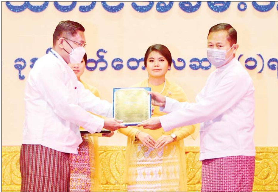
နိုင်ငံတော်စီမံအုပ်ချုပ်ရေးကောင်စီဒုတိယဥက္ကဋ္ဌ ဒုတိယဝန်ကြီးချုပ် ဒုတိယဗိုလ်ချုပ်မှူးကြီးစိုးဝင်း အမျိုးသားစာပေဆု ဝတ္ထုတိုဆုရှင် မင်းခိုက်စိုးစန်အား ဆုပေးအပ်ချီးမြှင့်စဉ်။