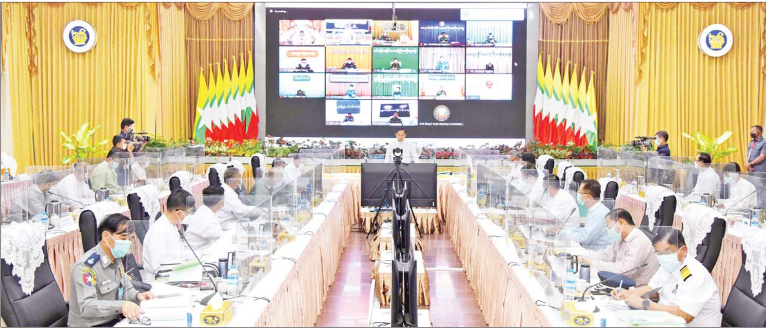
နိုင်ငံတော်စီမံအုပ်ချုပ်ရေးကောင်စီဒုတိယဥက္ကဋ္ဌ ဒုတိယဝန်ကြီးချုပ် ဒုတိယဗိုလ်ချုပ်မှူးကြီးစိုးဝင်း တရားမဝင်ကုန်သွယ်မှုတိုက်ဖျက်ရေး ဦးဆောင်ကော်မတီလုပ်ငန်းညှိနှိုင်း အစည်းအဝေး (၅/၂၀၂၂)တွင် အမှာစကားပြောကြားစဉ်။

နေပြည်တော် နိုဝင်ဘာ ၂၃ တရားမဝင်ကုန်သွယ်မှုတိုက်ဖျက်ရေး ဦးဆောင် ကော်မတီ လုပ်ငန်းညှိနှိုင်းအစည်းအဝေး (၅/၂၀၂၂)ကို ယနေ့ မွန်းလွဲပိုင်းတွင် နေပြည်တော်ရှိ စီးပွားရေးနှင့် ကူးသန်း ရောင်းဝယ်ရေးဝန်ကြီးဌာန အစည်းအဝေးခန်းမ၌ ကျင်းပရာ တရားမဝင် ကုန်သွယ်မှုတိုက်ဖျက်ရေးဦးဆောင် ကော်မတီဥက္ကဋ္ဌ နိုင်ငံတော်စီမံအုပ်ချုပ်ရေးကောင်စီ ဒုတိယဥက္ကဋ္ဌ ဒုတိယဝန်ကြီးချုပ် ဒုတိယဗိုလ်ချုပ်မှူးကြီး စိုးဝင်း တက်ရောက်အမှာစကား ပြောကြားသည်။ စီမံကိန်းနှင့် ဘဏ္ဍာရေးဝန်ကြီးဌာန ပြည်ထောင်စုဝန်ကြီး ဦးဝင်းရှိန်၊ အဖွဲ့ဝင်များဖြစ်ကြသည့် စီးပွားရေးနှင့် ကူးသန်းရောင်းဝယ်ရေးဝန်ကြီးဌာန ပြည်ထောင်စုဝန်ကြီး ဦးအောင်နိုင်ဦး၊ ကာကွယ်ရေးဝန်ကြီးဌာနနှင့် စာမျက်နှာ ၉ ကော်လံ ၁ သို့ ။