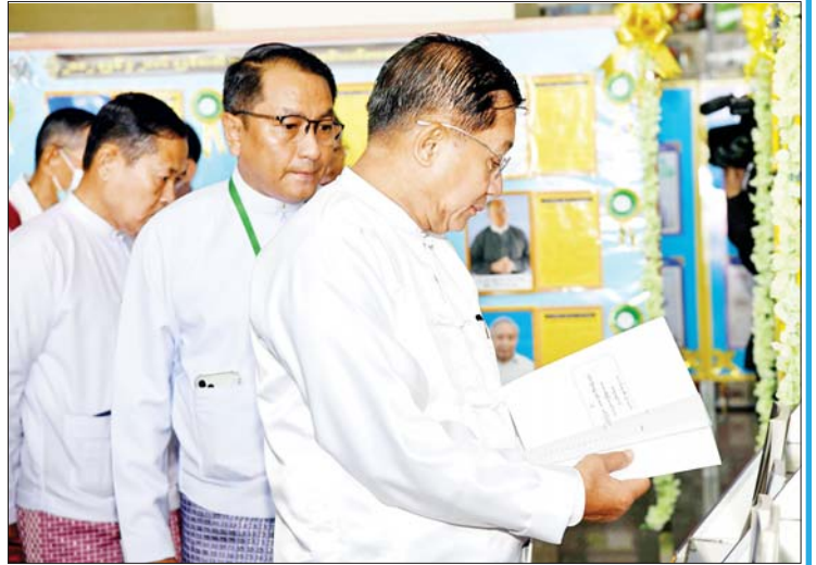
နိုင်ငံတော်စီမံအုပ်ချုပ်ရေးကောင်စီ ဥက္ကဋ္ဌ နိုင်ငံတော်ဝန်ကြီးချုပ် ဗိုလ်ချုပ် မျိုးကြီးမင်းအောင်လှိုင် စာပေဆုစိစစ် ရွေးချယ်ရေးကော်မတီဝင် ဆရာကြီး၊ ဆရာမကြီးများ၊ ဆုရပုဂ္ဂိုလ်များ၊ စာပေ ပညာရှင်များ၊ အနုပညာရှင်များ၊ စာပေ ဝါသနာရှင်များအား ရင်းရင်းနှီးနှီး နှုတ်ဆက်စဉ်။