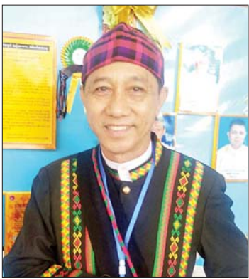
အကြီးကိုကို(ကသာ)