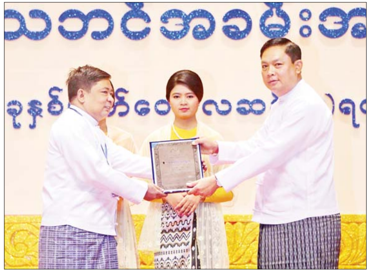
နိုင်ငံတော်စီမံအုပ်ချုပ်ရေးကောင်စီဝင် ဒုတိယဗိုလ်ချုပ်ကြီး မိုးမြင့်ထွန်း စာပေဗိမာန်စာမူဆု သုတပဒေသာ (ရိုးရိုးသိပ္ပံနှင့် အသုံးချသိပ္ပံ) ပထမဆုရ ဆရာ ဇော်လွင်ဦး (ဟင်္သာတ) အား ဆုပေးအပ်ချီးမြှင့်စဉ်။

☆ စာမျက်နှာ ၄ မှ လူမှုရေးဦးတည်ချက် သုံးရပ် ဖြစ်သည့် “စစ်မှန်သော မျိုးချစ် စိတ်ဓာတ်ဖြစ်သည့် ပြည်ထောင်စု စိတ်ဓာတ် ရှင်သန်ထက်မြက်ရေး” “တိုင်းရင်းသားလူမျိုး အပေါင်းတို့၏ ဓလေ့ထုံးတမ်း အစဉ်အလာများကို လေးစားလိုက်နာပြီး အမျိုးသားယဉ်ကျေးမှု စရိုက်လက္ခဏာများ မပျောက်ပျက်အောင် ထိန်းသိမ်းစောင့်ရှောက်ရေး” “တစ်မျိုးသားလုံး ကျန်းမာ ကြံ့ခိုင်ရေးနှင့် ပညာရည်မြှင့်တင်ရေး” စသည့် ဦးတည်ချက်များကို အကောင်အထည်ဖော်နိုင်ရန်မှာ စာပေပညာရှင်ကြီးများ အပါအဝင် ရုပ်ရှင်၊ ဂီတ၊ သဘင်စသည့် အနုပညာရှင်အသီးသီး၏ စစ်မှန်ကောင်းမွန်သည့် စွမ်းဆောင်မှုများက များစွာထိရောက်အောင်မြင်စေမည် ဖြစ်သည်ကို ပြောကြားလိုပါကြောင်း။