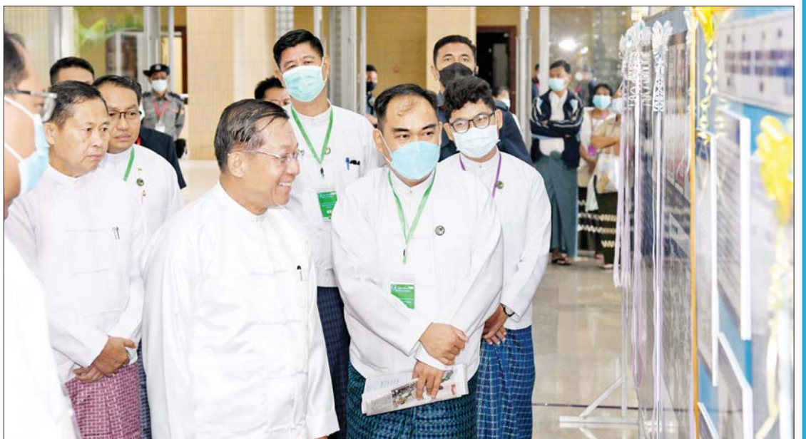
နိုင်ငံတော်စီမံအုပ်ချုပ်ရေးကောင်စီဥက္ကဋ္ဌ နိုင်ငံတော်ဝန်ကြီးချုပ် ဗိုလ်ချုပ်မျိုးကြီးမင်းအောင်လှိုင် ဆုနှင်းသဘင်အထိမ်း အမှတ်ပြခန်းရှိ ကြေးမုံသတင်းစာနှင့် မြန်မာ့အလင်းသတင်းစာပြခန်းအား ကြည့်ရှုစဉ်။