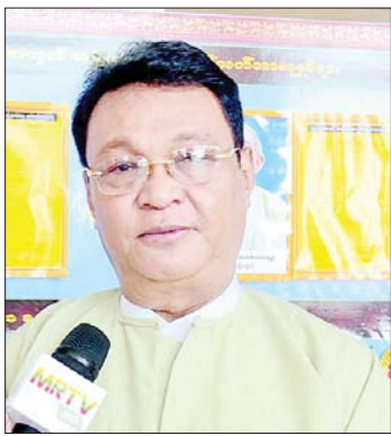
ဦးအုန်းမောင်(မြင်းမူမောင်နိုင်မိုး)

ဦးအုန်းမောင်(မြင်းမူမောင်နိုင်မိုး) ၂၀၂၁ ခုနှစ် အမျိုးသားစာပေတစ်သက်တာဆုရင် ကျွန်တော့်အနေနဲ့ စာပေလောကကို ရောက်ရှိခဲ့တာ နှစ်ပေါင်း ၆၀ ရှိပါပြီ။ ၁၉၆၅ ခုနှစ်ကတည်းက ကဗျာတွေ ရေးခဲ့တာ ဖြစ်ပါတယ်။ ကျွန်တော် ၁၉၈၁ ခုနှစ်ကစပြီး ၂၀၁၁ ခုနှစ်အတွင်းမှာ အမျိုးသားစာပေဆု ခုနစ်ကြိမ် ရရှိခဲ့ပါတယ်။ အမျိုးသားစာပေတစ်သက်တာဆုကို မမျှော်လင့်ဘဲ အခုလိုရရှိခဲ့တဲ့ အတွက် အတိုင်းမသိ ဝမ်းသာပီတိဖြစ်မိပါတယ်။ နိုင်ငံတော်က စာပေပညာရှင်တွေကို အရေးတယူ ချီးမြှင့်မြှောက်စားပေးနေတာက နိုင်ငံတော်ဖွံ့ဖြိုးတိုးတက်ရေးအတွက် စာပေလောကသားတွေရဲ့ စွမ်းအားတွေကို အားကိုးပြီး ယုံကြည်လေးစားမှုနဲ့ အဆင့်ဆင့်သောဘဝတွေကို မြှင့်တင်ပေးနေမှုက အင်မတန်ခွန်အားဖြစ်စေပါတယ်။ ကျွန်တော်တို့ စာပေလောကမှာရှိနေတဲ့ ဝတ္ထု၊ ကဗျာ၊ ဆောင်းပါး ရေးတဲ့သူတွေအားလုံးကလည်း အခုလို စာပေဆုတွေချီးမြှင့်ပေးတဲ့အပေါ်မှာ နိုင်ငံတော်ကို အထူးပဲကျေးဇူးတင်ရှိပါတယ်။ စာပေလောကမှာရှိတဲ့ ဘာသာရပ်တွေထဲက မိမိတို့စိတ်ဝင်စားတဲ့ ဘယ်ဘာသာရပ်ကိုမဆို စွမ်းစွမ်းတမ်း ကြိုးစားအားထုတ်ပြီး တစ်စုံတစ်ရာမတ်မတ် ရေးသားပြုစုမယ်ဆိုရင် တစ်နေ့နေ့မှာ အောင်မြင်မှုရနိုင်ပါတယ်။ မြန်မာစာပေကို ချစ်မြတ်နိုးစွာနဲ့ မြန်မာ့ဂန္ထဝင် ကဗျာတွေ၊ မြန်မာ့ရသမြောက်ဝတ္ထုတို့၊ ဝတ္ထုရှည်တွေကို ရေးသားကြဖို့ လူငယ်တွေကို တိုက်တွန်းပြောကြားလိုပါတယ်။