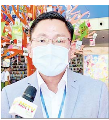
မင်းခိုက်စိုးစန်

ခေါင်းစဉ်က ဘာလဲဆိုတော့ လောကခံ ပါပဲ။ ပျော်စရာလည်း လောကခံပါပဲ။ ဝမ်းနည်းစရာလည်း လောကခံပါပဲ။ အောင်မြင်တယ် ဆိုတာကလည်း လောကခံပါပဲ။ ကျရှုံးတယ်ဆိုတာက လည်း လောကခံပါပဲ။ ကျွန်တော်တို့ အားလုံး ဖြတ်သန်းခဲ့ရတာ လောကခံ ပါပဲ ဒီလိုပဲခံစားရပါတယ်။ ရေနံ့သာ မောင်ကျော်ညွန့် ၂၀၂၁ ခုနှစ် စာပေဗိမာန် စာမူဆုရှင် ကျွန်တော်က ၂၀၂၁ ခုနှစ် စာပေ ဗိမာန်စာမူဆုကို “ရေအဆန်လေထန် ကြမ်းပေမယ့် ကမ်းရောက်ခဲ့ပြီ” စာမူနဲ့ လူငယ်စာပေ ဒုတိယဆုရခဲ့တာ ဖြစ်ပါ တယ်။ ကျွန်တော်တို့ ဖြတ်သန်းခဲ့ရတာ က ကျောင်းပေါ့။ သင်ယူခဲ့ရတဲ့ ကျောင်း သင်ခန်းစာတွေက ဘဝအတွက် သင်ခန်းစာတွေ အများကြီးပါပါတယ်။ ကျောင်းသင်ခန်းစာကို အခြေပြုပြီး တော့မှ “ရေအဆန်လေထန်ကြမ်းပေမယ့် ကမ်းရောက်ခဲ့ပြီ” ဆိုတဲ့ လူငယ်ဝတ္ထု ပေါင်းချုပ်ကို ရေးခဲ့တာဖြစ်ပါတယ်။