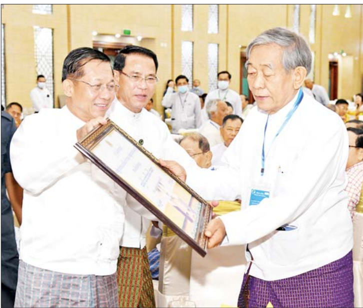
နိုင်ငံတော်စီမံအုပ်ချုပ်ရေးကောင်စီဥက္ကဋ္ဌ နိုင်ငံတော်ဝန်ကြီးချုပ် ဗိုလ်ချုပ် မျိုးကြီးမင်းအောင်လှိုင် အမျိုးသားစာပေတစ်သက်တာဆုရရှိသည့် ဆရာဒေါက်တာ မျိုးသန့်တင်အား အမှတ်တရစာပေပေးစာတံပုံ ပေးအပ်စဉ်။