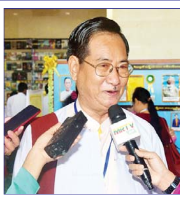
ရေနံ့သာမောင်ကျော်ညွန့်