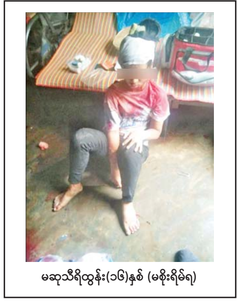
မဆုသီရိထွန်း(၁၆)နှစ် (မစိုးရိမ်ရ)