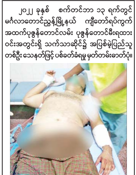
၂၀၂၂ ခုနှစ် စက်တင်ဘာ ၁၃ ရက်တွင် မင်္ဂလာတောင်ညွန့်မြို့နယ် ကျိုတော်ရပ်ကွက် အထက်ပုဇွန်တောင်လမ်း ပုဇွန်တောင်မီးရထား ဝင်းအတွင်းရှိ သက်သာဆိုင်၌ အပြစ်မဲ့ပြည်သူ တစ်ဦး သေနတ်ဖြင့် ပစ်ခတ်ခံရမှု မှတ်တမ်းဓာတ်ပုံ။

၂၀၂၂ ခုနှစ် ဩဂုတ် ၈ ရက်တွင် တာမွေ မြို့နယ် ကျောက်မြောင်းကြီး(အရှေ့)ရပ်ကွက် ရပ်ကွက်အုပ်ချုပ်ရေးမှူးရုံးရှေ့၌ ရာအိမ်မှူး တစ်ဦး အား အကြမ်းဖက်သူများက သေနတ်ဖြင့် ပစ်ခတ် လုပ်ကြံသတ်ဖြတ်ခဲ့သည့် မှတ်တမ်းဓာတ်ပုံ။