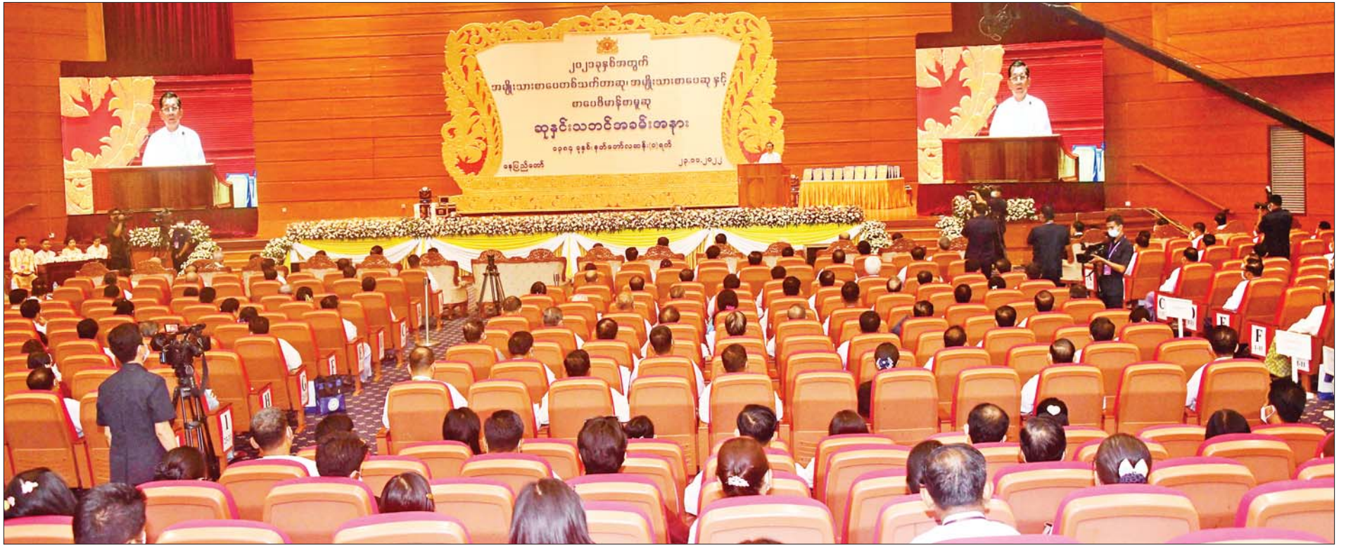
နိုင်ငံတော်စီမံအုပ်ချုပ်ရေးကောင်စီဥက္ကဋ္ဌ နိုင်ငံတော်ဝန်ကြီးချုပ် ဗိုလ်ချုပ်မှူးကြီးမင်းအောင်လှိုင် ၂၀၂၂ ခုနှစ်အတွက် အမျိုးသားစာပေတစ်သက်တာဆု၊ အမျိုးသားစာပေဆုနှင့် စာပေဗိမာန်စာမူဆု ဆုနှင်းသဘင်အခမ်းအနားတွင် အမှာစကား ပြောကြားစဉ်။