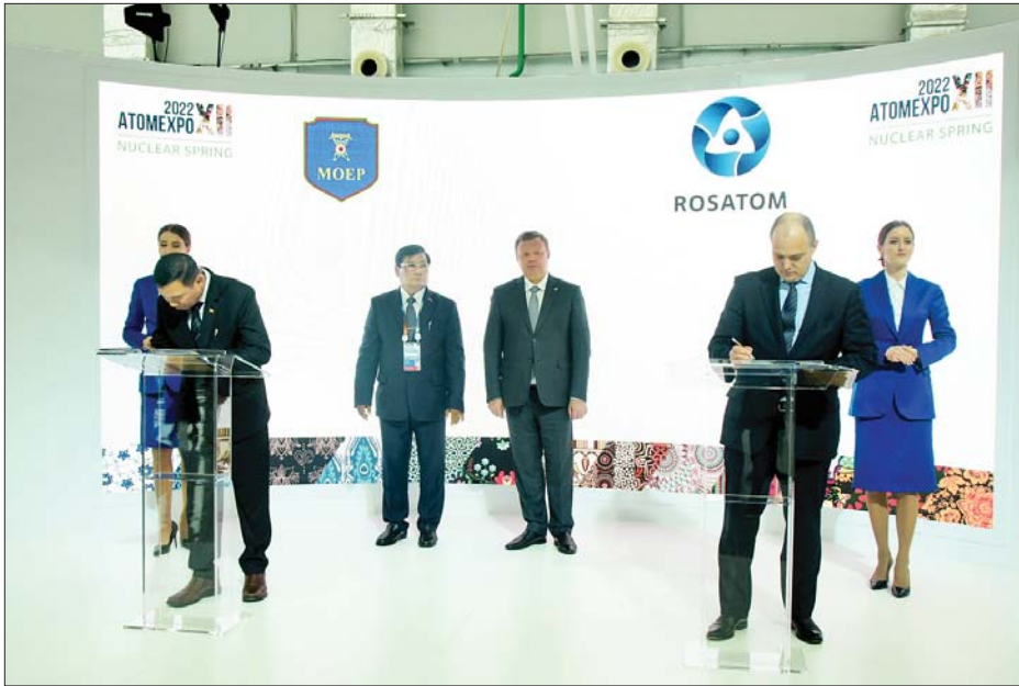
ရုရှားဖက်ဒရေးရှင်းနိုင်ငံရှိ Rosatom ကုမ္ပဏီနှင့် မြန်မာနိုင်ငံ လျှပ်စစ်စွမ်းအားဝန်ကြီးဌာနတို့ နားလည်မှုစာချုပ်လွှာ လက်မှတ်ရေးထိုးစဉ်။