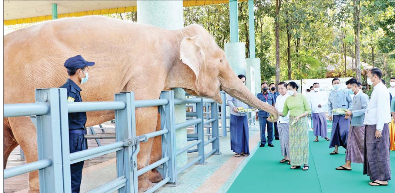
နိုင်ငံတော်စီမံအုပ်ချုပ်ရေးကောင်စီဥက္ကဋ္ဌ နိုင်ငံတော်ဝန်ကြီးချုပ် ဗိုလ်ချုပ်မှူးကြီးမင်းအောင်လှိုင်နှင့်ဇနီး ဒေါ်ကြူကြူလှ ရတနာဆင်ဖြူတော် များအား အစာအာဟာရများကျွေးမွေးစဉ်။