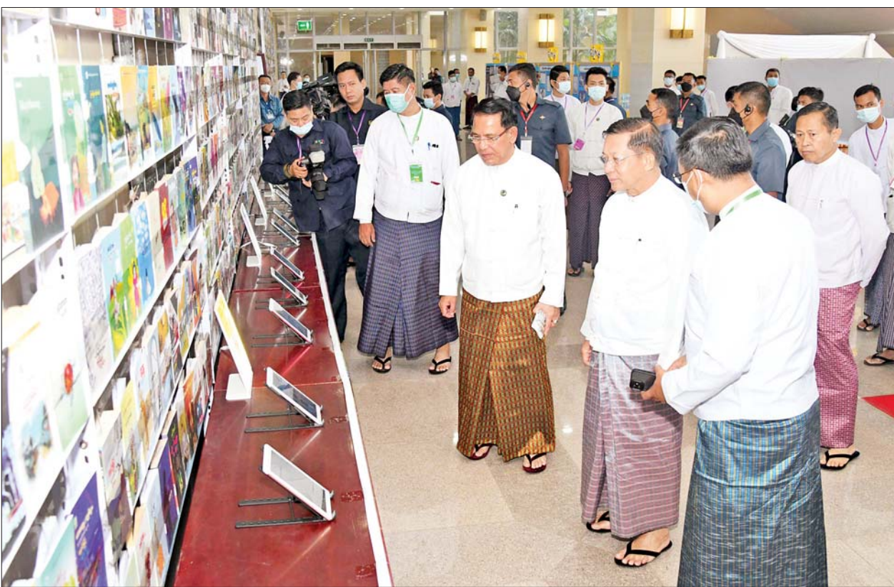
နိုင်ငံတော်စီမံအုပ်ချုပ်ရေးကောင်စီဥက္ကဋ္ဌ နိုင်ငံတော်ဝန်ကြီးချုပ် ဗိုလ်ချုပ်မျိုးကြီးမင်းအောင်လှိုင် ဆုနှင်းသဘင်အထိမ်းအမှတ်ပြခန်းရှိ စာအုပ်စာစောင်များကို ကြည့်ရှုစဉ်။

မြန်မာ့သမိုင်းတစ်လျှောက်တွင် ရဟန်း စာဆို၊ လူစာဆိုများအပါအဝင် မြန်မာစာဆို တော်ကြီးများ၏ မြန်မာစာပေအားဖြင့် နိုင်ငံ့အကျိုးစီးပွားအတွက် ဆောင်ရွက် ခဲ့မှုများကို ချီးကျူးဂုဏ်ပြု ပူဇော်ခြင်း ဖြစ်သည့် စာဆိုတော်နေ့ကျင်းပခြင်းနှင့် စာပေဆုများ ချီးမြှင့်ပေးသည့်ခလေးကို ဝါရင့်စာပေပညာရှင်တို့က ဆက်လက် သယ်ဆောင်ထိန်းသိမ်းကြပြီး “စာရေး ဆရာနိတိ”ကို စောင့်ထိန်းကြသည့် ခေတ်ကို ထင်ဟပ်ဖွဲ့ဆိုကြသည့် နိုင်ငံပုံရိပ်ကို မြှင့်တင် နိုင်ကြသည့် မျိုးဆက်သစ် စာရေးဆရာများ၊ ကလောင်သစ်များ တိုးပွားလာစေရေး ပြုစု ပျိုးထောင်ပေး