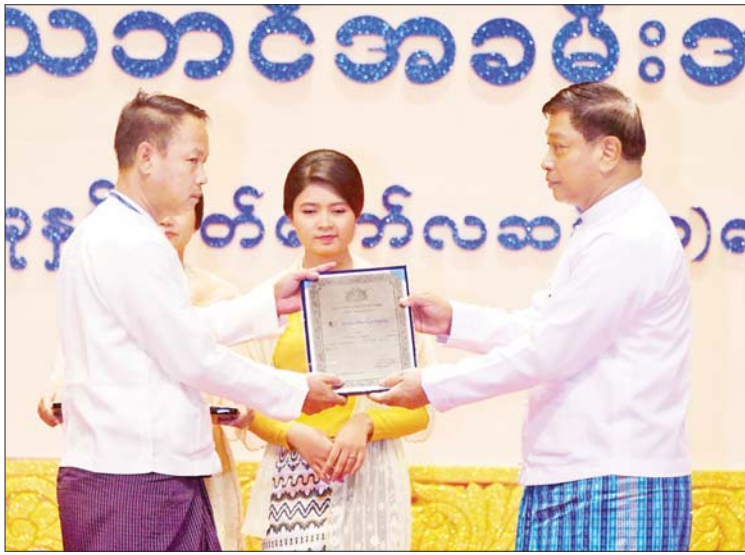
နိုင်ငံတော် စီမံအုပ်ချုပ်ရေးကောင်စီဝင် တင်အောင်စန်း တင်အောင်စန်း စာပေဗိမာန်စာမူဆုကဗျာပေါင်းချုပ် ပထမဆုရ ဆရာစာပေအဖွဲ့အစည်းအဖွဲ့ဝင်များနှင့်အတူ နိုင်ငံတော်စီမံအုပ်ချုပ်ရေးကောင်စီဝင် ဒုတိယဗိုလ်ချုပ်ကြီး မိုးမြင့်ထွန်း စာပေဗိမာန်စာမူဆု သုတပဒေသာ (ရိုးရိုးသိပ္ပံနှင့် အသုံးချသိပ္ပံ) ပထမဆုရ ဆရာ ဇော်လွင်ဦး (ဟင်္သာတ) အား ဆုပေးအပ်ချီးမြှင့်စဉ်။