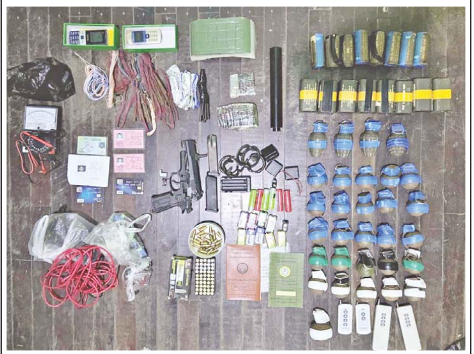
နိုဝင်ဘာ ၂၂ ရက်တွင် ဒဂုံမြို့သစ်(ဆိပ်ကမ်း)မြို့နယ် အမှတ်(၉၄)ရပ်ကွက် ယုဇနဥယျာဉ်မြို့တော် တိုက်အမှတ်(၃၁) အခန်းအမှတ်(၃၀၃)၌ သိမ်းဆည်းရမိခဲ့သည့် လက်နက်/ခဲယမ်းများ၏ မှတ်တမ်းဓာတ်ပုံ။