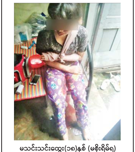
မသင်းသင်းထွေး(၁၈)နှစ် (မစိုးရိမ်ရ)