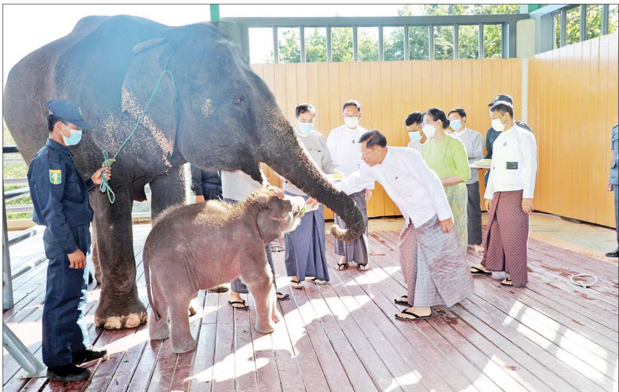
နိုင်ငံတော်စီမံအုပ်ချုပ်ရေးကောင်စီဥက္ကဋ္ဌ နိုင်ငံတော်ဝန်ကြီးချုပ် ဗိုလ်ချုပ်မှူးကြီးမင်းအောင်လှိုင်နှင့်ဇနီး ဒေါ်ကြူကြူလှ “ရဋ္ဌနန္ဒက” ရတနာ ဆင်ဖြူတော်လေးအား အစာအာဟာရများကျွေးမွေးစဉ်။

သွားရောက်ကျွေးမွေးသည်။ ဦးစွာ နိုင်ငံတော်စီမံအုပ်ချုပ်ရေး ကောင်စီဥက္ကဋ္ဌ နိုင်ငံတော် ဝန်ကြီးချုပ် ဇနီးနှင့် အဖွဲ့ဝင်များ အား သယ်ဇာတနှင့် သဘာဝ ပတ်ဝန်းကျင်ထိန်းသိမ်းရေးဝန်ကြီး ဌာန ပြည်ထောင်စုဝန်ကြီး ဦးခင်မောင်ရှိနှင့် တာဝန်ရှိသူများ က ကြိုဆိုနှုတ်ဆက်ကြသည်။ ထို့နောက် နိုင်ငံတော်စီမံအုပ်ချုပ် ရေးကောင်စီဥက္ကဋ္ဌ နိုင်ငံတော် ဝန်ကြီးချုပ်နှင့် ဇနီးတို့က “ရဋ္ဌ နန္ဒက” (တိုင်းပြည်က ချစ်ခင် မြတ်နိုး၍ နိုင်ငံတော်၏ သာယာ