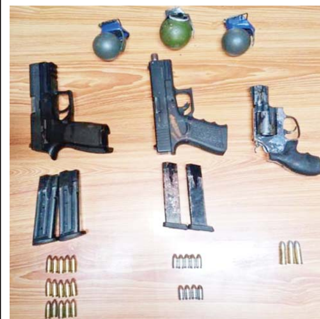
နိုဝင်ဘာ ၂၂ ရက်တွင် ဒဂုံမြို့သစ် (ဆိပ်ကမ်း) မြို့နယ် အမှတ်(၉၄) ရပ်ကွက် ယုဇနဥယျာဉ် မြို့တော် တိုက်အမှတ်(၃၁) အခန်းအမှတ် (၃၀၃)၌ သိမ်းဆည်း ရမိခဲ့သည့် လက်နက်/ခဲယမ်းများ၏ မှတ်တမ်းဓာတ်ပုံ။