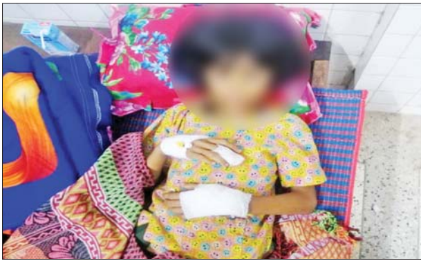
PDF အမည်ခံ အကြမ်းဖက်အဖွဲ့များက ပစ်ခတ်သတ်ဖြတ်မှုကြောင့် ထိခိုက်ဒဏ်ရာရရှိမှု မှတ်တမ်းဓာတ်ပုံ။

နှင့် မပြည့်ပြည့်ဖြိုးတို့မှာ ထိမှန်ဒဏ်ရာများရရှိခဲ့ကြောင်း သိရသည်။ ဖြစ်စဉ်တွင် သေဆုံးခဲ့သူများကို ဘားအံမြို့ရှိ ပြည်သူ့ဆေးရုံသို့ ပို့ဆောင်ပေးခဲ့ပြီး ဒဏ်ရာရရှိခဲ့သူများအား နယ်မြေခံတပ်မတော် ဆေးရုံသို့ ပို့ဆောင်၍ လိုအပ်သည့်ဆေးဝါးကုသပေးမှုများ ဆောင်ရွက် ပေးလျက်ရှိသည်။