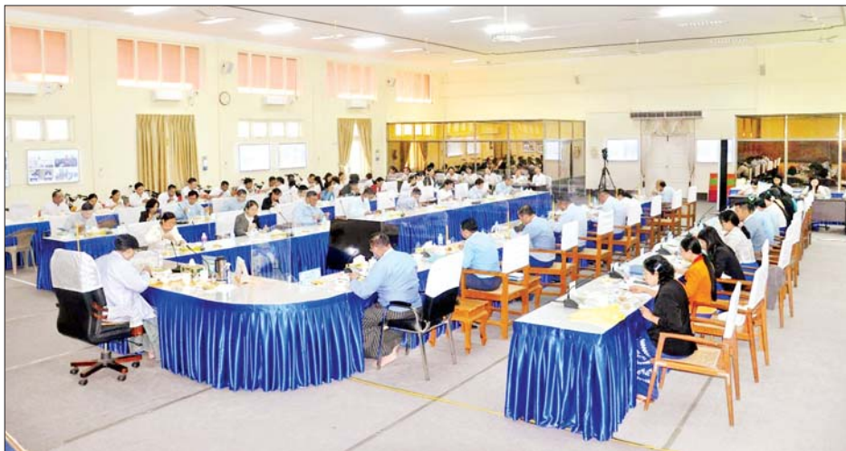
ပြည်ထောင်စုဝန်ကြီး ဒေါက်တာချာလီသန်း ဝန်ထမ်းများနှင့် နေ့လယ်စာ အတူတကွသုံးဆောင်စဉ်။

နေပြည်တော် နိုဝင်ဘာ ၁၈ စက်မှုဝန်ကြီးဌာန၏ ၂၀၂၂-၂၀၂၃ ဘဏ္ဍာနှစ် အောက်တိုဘာလ၌ လုပ်ငန်းအကောင်အထည်ဖော် ဆောင်ရွက်ခဲ့မှုကို ပြန်လည်သုံးသပ်ခြင်းနှင့် ရှေ့ဆက်လက်ဆောင်ရွက်မည့်အစီအမံများ ချမှတ်သည့် ညှိနှိုင်းအစည်းအဝေးကို ယနေ့နံနက်ပိုင်းက စက်မှုဝန်ကြီးဌာန ရုံးအမှတ်(၃၀) အစည်းအဝေးခန်းမ၌ ကျင်းပရာ စက်မှုဝန်ကြီးဌာန ပြည်ထောင်စုဝန်ကြီး ဒေါက်တာချာလီသန်း၊ ဒုတိယဝန်ကြီးဦးရင်မောင်ညွန့်၊ ညွှန်ကြားရေးမှူးချုပ်၊ ဒုတိယညွှန်ကြားရေးမှူးချုပ်များနှင့် တာဝန်ရှိသူများ တက်ရောက်ကြသည်။