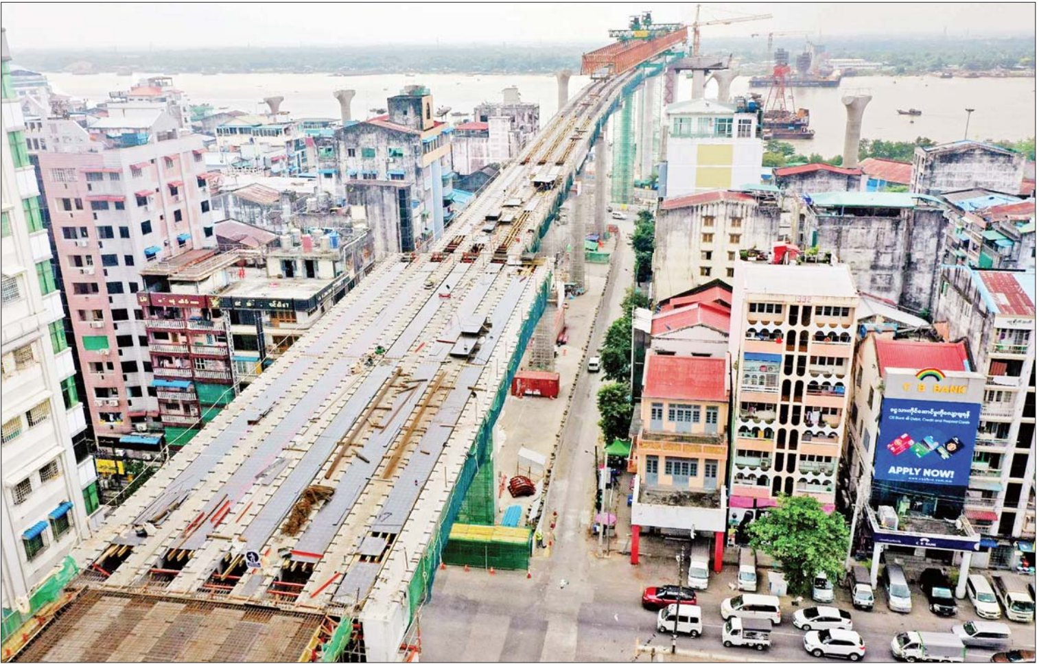
မြန်မာ-ကိုရီးယား ချစ်ကြည်ရေး (ဒလ)မြစ်ကူးတံတား၏ ရန်ကုန်ဘက်ခြမ်း တည်ဆောက်ရေးလုပ်ငန်းခွင်ကို တွေ့ရစဉ်။

တစ်ဖက်သတ်စွပ်စွဲချက်များအပေါ် အခြေခံပြီး နိုင်ငံရေးသဘောသက်ဝင်သည့် နိုင်ငံတစ်နိုင်ငံတည်းအပေါ် ပစ်မှတ်ထား ချမှတ်သော ဆုံးဖြတ်ချက်အဆိုကို မြန်မာနိုင်ငံက ကန့်ကွက်ပယ်ချ အမေရိကန်ပြည်ထောင်စု၊ နယူးယောက်မြို့၌ ၁၆-၁၁-၂၀၂၂ ရက်တွင် ကျင်းပခဲ့သည့် (၇၇)ကြိမ်မြောက် ကုလသမဂ္ဂ အထွေထွေညီလာခံ၊ တတိယကော်မတီအစည်းအဝေးတွင် “မြန်မာနိုင်ငံရှိ ‘ရိုဟင်ဂျာ’ ဆိုသူ မွတ်စလင်များနှင့် အခြား လူနည်းစုများ၏ လူ့အခွင့်အရေးအခြေအနေ” ဟု ခေါင်းစဉ်တပ် ထားသည့် ဆုံးဖြတ်ချက်အဆိုကို မြန်မာနိုင်ငံ၏ တရားဝင် ကိုယ်စားလှယ်များ ပါဝင်တက်ရောက်ခြင်းမရှိဘဲ အတည်ပြု ချမှတ်ခဲ့သည်။ လူ့အခွင့်အရေးမြှင့်တင်ရေးနှင့် ကာကွယ်စောင့်ရှောက် ရေးတွင် သမာသမတ်ကျရေး၊ ဓမ္မဓိဋ္ဌာန်ကျရေးနှင့် ရွေးချယ် ပစ်မှတ်မထားရေး မူဝါဒများကို ဆန့်ကျင်၍ နိုင်ငံတစ်နိုင်ငံ တည်းအပေါ် ဦးတည်ဆောင်ရွက်သည့် ဖန်တီးထားသော ဆုံးဖြတ်ချက်အဆိုများနှင့် လုပ်ပိုင်ခွင့်များကို မြန်မာနိုင်ငံက အစဉ်တစိုက် ကန့်ကွက်သည်။ အီးယူနှင့် အိုင်အိုတို့က နှစ်စဉ် ကမကထပြု တင်သွင်း သည့် ရှည်လျားလှသော ဆုံးဖြတ်ချက်အဆိုတွင် အခြေအမြစ် မရှိသော ထပ်တလဲလဲ စွပ်စွဲချက်များ ပါဝင်သည်။ ဆုံးဖြတ်ချက် အဆိုတွင် အချုပ်အခြာအာဏာပိုင် နိုင်ငံတစ်နိုင်ငံ၏ ပြည်တွင်း ရေးကို ဝင်ရောက်စွက်ဖက်ရန် နိုင်ငံရေးရည်ရွယ်ချက်ဖြင့် ကုလသမဂ္ဂအတွင်းရေးမှူးချုပ်၏ မြန်မာနိုင်ငံဆိုင်ရာ အထူး ကိုယ်စားလှယ်ကို ပေးအပ်သည့် လက်တွေ့မကျသော လုပ်ငန်း တာဝန်များလည်း ပါဝင်သည်။ ထို့အပြင် ကုလသမဂ္ဂအထွေထွေ ညီလာခံနှင့် “IIMM” ဆိုသည့် ယန္တရားအကြား ဆွေးနွေးမှု ပြုလုပ်ရန် ထပ်ဆောင်းအစီအစဉ်ကို ဖန်တီးမှုသည် မြန်မာ နိုင်ငံအပေါ် တိုးမြှင့်ဖိအားပေးရန်သာ ဆောင်ရွက်ခြင်း ဖြစ်သည်။ စာမျက်နှာ ၅ ကော်လံ ၁ သို့ ❖