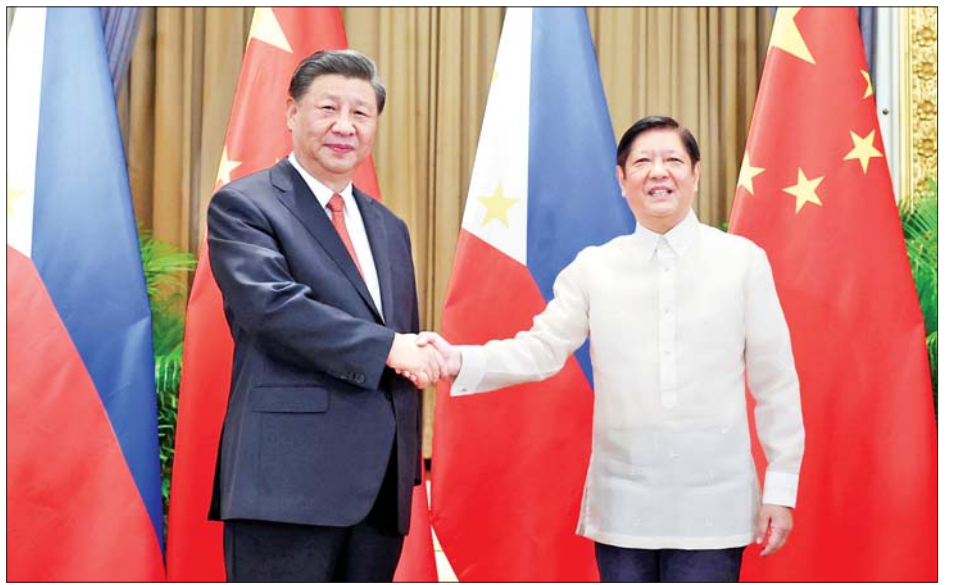
ဖာဒီနန်မားကိုစ်ဂျူနီယာသည် ဇွန်လမှစပြီး ကြောင်း သိရသည်။ ကိုးကား - အင်န်အိတ်ချ်ကေ သမ္မတရာထူးအာဏာကို စတင်ထမ်းဆောင်လျက်ရှိ ဘာသာပြန် - အောင်ကျော်ကျော်

ရေးအလုံးစုံကို အဓိပ္ပာယ်ဖွင့်ဆိုခြင်း မပြုရန် ခေါင်းဆောင်နှစ်ဦးက သဘောတူညီခဲ့ကြောင်း ဖိလစ်ပိုင်နိုင်ငံခြားရေးဝန်ကြီးဌာနက ပြောကြားသည်။ သမ္မတရှိကျင့်ဖျင်က နှစ်နိုင်ငံချစ်ကြည်ရေး စာမျက်နှာသစ်ဖွင့်လှစ်ရန် ဆန္ဒရှိကြောင်း ဖိလစ်ပိုင် သမ္မတမားကိုစ်အား ပြောကြားခဲ့ကြောင်း တရုတ် နိုင်ငံခြားရေးဝန်ကြီးဌာနက ဆိုသည်။ တရုတ်သမ္မတရှိကျင့်ဖျင်နှင့် ဖိလစ်ပိုင်သမ္မတ မားကိုစ်တို့၏ အဆိုပါ အစည်းအဝေးသည် အမေရိကန်ဒုတိယသမ္မတ ကင်မလာဟ်ရစ် မနီလာ မြို့တော်သို့ မလာရောက်မီ ရက်ပိုင်းအလိုတွင် ဖြစ်ပွားခဲ့ခြင်းဖြစ်သည်။ ကင်မလာဟ်ရစ်က အငြင်း ပွားလျက်ရှိသည့် ရေပြင်အခြေအနေကို ကြည့်ရှုရန် စီစဉ်ထားကြောင်း သိရသည်။ မားကိုစ်သည် သမ္မတရှိကျင့်ဖျင်၏ ဖိတ်ကြား ချက်အရ တရုတ်နိုင်ငံသို့ ပထမဆုံးအကြိမ်လာရောက် မည်ဖြစ်ကြောင်း ယခုလအစောပိုင်းတွင် ဖိလစ်ပိုင် သမ္မတရုံးက ကြေညာခဲ့သည်။