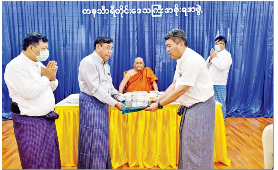
တနင်္သာရီတိုင်းဒေသကြီးအစိုးရအဖွဲ့

မြိတ်မြို့ သီတဂူဇိဝိတဒါန စက္ခုဒါနဆေးရုံကို သီတဂူဆရာတော်ဦးဆောင်မှုဖြင့် ခုနစ်ရက်သားသမီး အလှူရှင်များ စုပေါင်းလှူဒါန်းငွေကျပ်သိန်း ၄၅၀၀ ကျော်နှင့် ဆေးရုံအတွင်း တပ်ဆင်အသုံးပြုရန် သီတဂူဆရာတော်ကြီး လှူဒါန်းသည့် စက်ပစ္စည်း တန်ဖိုး အမေရိကန်ဒေါ်လာ တစ်သိန်းခွဲတို့ဖြင့်