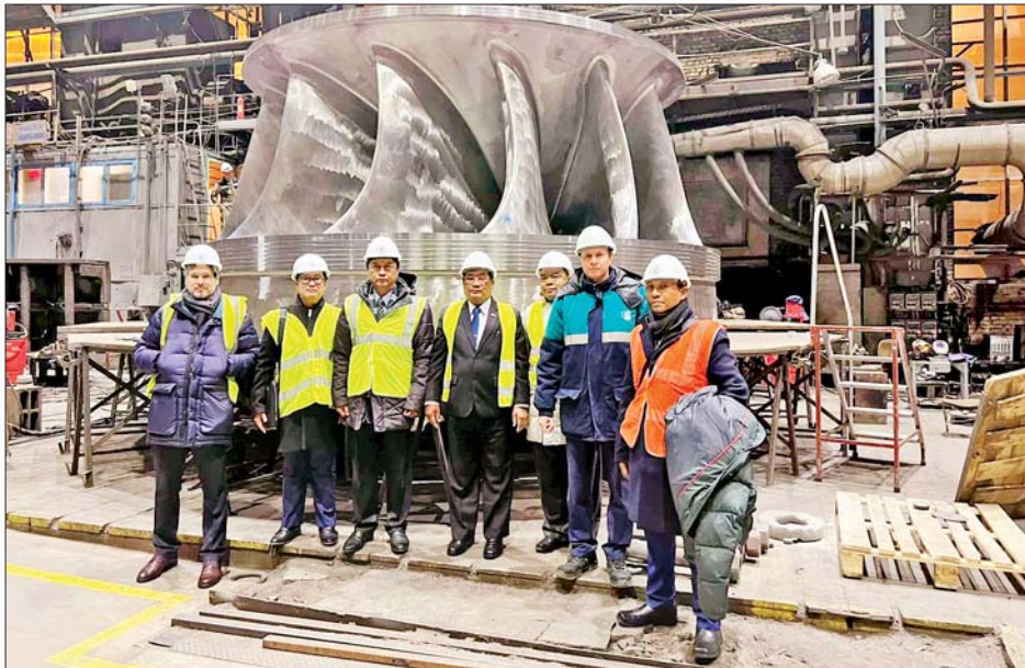
ပြည်ထောင်စုဝန်ကြီး ဦးသောင်းဟန်နှင့်အဖွဲ့ဝင်များ Power Machines ကုမ္ပဏီ၏ Leningrad Metal Machine စက်ရုံ၌ ကြည့်ရှုလေ့လာစဉ်။