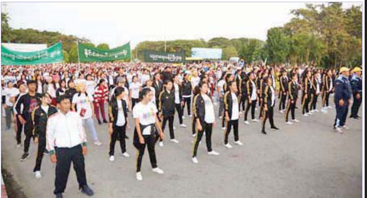
ပြည်ထောင်စုနယ်မြေ နေပြည်တော်၌ ဒီဇင်ဘာလပထမပတ် လူထုစုပေါင်းလမ်းလျှောက်ပွဲကျင်းပစဉ်။

လွတ်လပ်ရေးမရခင်က မြန်မာလူမျိုးထဲမှ ပထမဦးဆုံးသော အိုလံပစ်ပြိုင်ပွဲဝင်ခဲ့သူ အလေးမအားကစားသမား ဦးဇော်ဝိတ်နှင့် နည်းပြ ကာယဗလဦးရှိန်တို့သည် ၁၉၃၆ ခုနှစ် ဘာလင်အိုလံပစ်ပြိုင်ပွဲတွင် သွားရောက်ယှဉ်ပြိုင်နိုင်ခဲ့သော်လည်း အိန္ဒိယအားကစားသမား