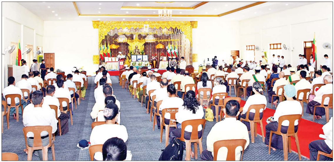
ဗုဒ္ဓဘာသာကလျာဏယုဝအသင်း(YMBA)က ကြီးမှူးကျင်းပသည့် (၁၀၂)နှစ်မြောက် အမျိုးသားအောင်ပွဲနေ့အခမ်းအနား ကျင်းပစဉ်။

ရန်ကုန် နိုဝင်ဘာ ၁၇ ဗုဒ္ဓဘာသာ ကလျာဏယုဝအသင်း (YMBA)က ကြီးမှူးကျင်းပသည့် (၁၀၂) နှစ်မြောက် အမျိုးသားအောင်ပွဲနေ့အခမ်းအနားကို ယနေ့နံနက် ၉ နာရီတွင် ရန်ကုန်တိုင်းဒေသကြီး အင်းစိန်မြို့နယ် ကြို့ကုန်းအရှေ့ရပ်ကွက် မင်းဓမ္မလမ်းရှိ သီရိမင်္ဂလာ မဟာသာသနာ့ဗိမာန်တော်၌ ကျင်းပသည်။