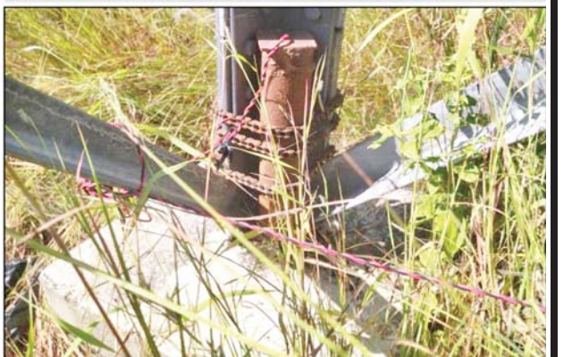
၂၃၀ ကေစီ မင်းဘူး(မန်း)-အမ်း ဓာတ်အားလိုင်း တာဝါတိုင် အမှတ် (၉၄)ရှိ အောက်ခြေထောက်တိုင်တစ်ခု ဖောက်ခွဲဖျက်ဆီးခံရမှု အထောက်အထားများအား တွေ့ရစဉ်။