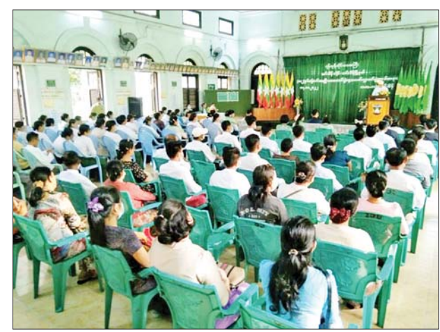
အလယ်တန်း၊ မူလတန်းကျောင်းအုပ်ကြီးများနှင့် တာဝန်ရှိသူများ တက်ရောက်ကြကြောင်း သိရသည်။ ဉာဏ်ဟိန်း

အဆိုပါအခမ်းအနားသို့ မြို့နယ်စီမံအုပ်ချုပ်ရေးအဖွဲ့ဥက္ကဋ္ဌနှင့် အဖွဲ့ဝင်များ၊ မြို့နယ်အဆင့် ဌာနဆိုင်ရာတာဝန်ရှိသူများ၊ အထက်တန်း၊