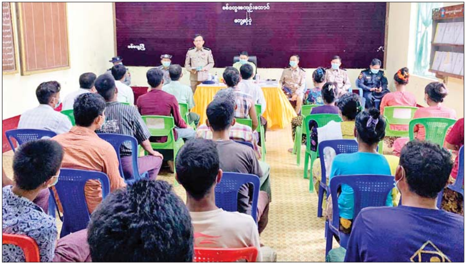
အကျဉ်းသား အကျဉ်းသူ ၁၉၄ ဦး လွှတ်မြောက်ခဲ့ကြောင်း သိရသည်။ အဆိုပါလွှတ်မြောက်လာသူများအား မိသားစုဝင်များ၊ သူငယ်ချင်းများနှင့် မိတ်ဆွေများက ရင်းနှီးပျော်ရွှင်စွာကြိုဆိုကြကြောင်း သိရသည်။ တင်ထွန်း(ပြန်/ဆက်)

ထိုသို့လွတ်ငြိမ်းခွင့်ပေးရာတွင် စစ်တွေ အကျဉ်းထောင်မှ အကျဉ်းသား ၆၂ ဦး၊ အကျဉ်းသူ ကိုးဦး၊ ကျောက်ဖြူအကျဉ်းထောင်မှ အကျဉ်းသား ၃၀၊ အကျဉ်းသူတစ်ဦး၊ ဘူးသီးတောင်အကျဉ်းထောင်မှ အကျဉ်းသား ၁၆ ဦးနှင့် သံတွဲအကျဉ်းထောင်မှ အကျဉ်းသား ၇၄ ဦး၊ အကျဉ်းသူနှစ်ဦး စုစုပေါင်း