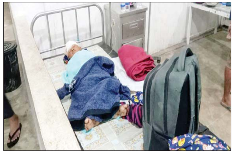
လောင်းခုံး(မြို့)ကျေးရွာအတွင်း AA အဖွဲ့က ပစ်ခတ်သည့် ၆၀ မမဗုံးသီးသုံးလုံး ကျရောက်ပေါက်ကွဲမှုကြောင့် ဒဏ်ရာရရှိသည့် ကျေးရွာသူ ကျေးရွာသားများကို တွေ့ရစဉ်။

ကျရောက်ပေါက်ကွဲ ဖြစ်စဉ်မှာ နိုဝင်ဘာ ၁၆ ရက် မွန်းလွဲ ၁၂ နာရီ မိနစ် ၄၀ ခန့်တွင် လုံခြုံရေး လုပ်ငန်းများ ဆောင်ရွက်လျက်ရှိသည့် ကြိမ်ချောင်းကျေးရွာ နယ်မြေခံရကင်း စခန်းအား AA အဖွဲ့က လက်နက်ကြီး၊ လက်နက်ငယ်များဖြင့် လာရောက်ပစ်ခတ် တိုက်ခိုက်ခဲ့ရာ နယ်မြေခံရကင်းစခန်း အနီးရှိ လယ်ကွင်းသို့ လက်နက်ကြီး သုံးလုံး၊ လောင်းခုံး(မြို့)ကျေးရွာအတွင်းသို့ လက်နက်ကြီးကျည်သုံးလုံး ကျရောက် ပေါက်ကွဲခဲ့သည်။