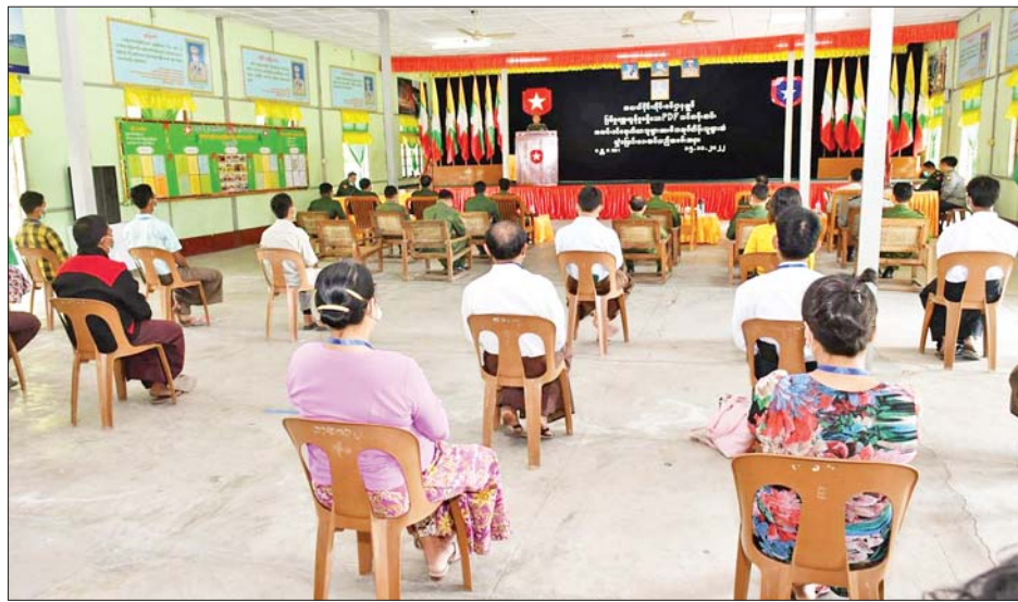
မန္တလေးတိုင်းဒေသကြီး အောင်မြေသာစံမြို့နယ်ရှိ နယ်မြေခံသင်တန်းကျောင်း အနော်ရထာခန်းမ၌ ဥပဒေအောင်အတွင်း ဝင်ရောက်လာသည့် ပြစ်မှုကျူးလွန်ခြင်းမရှိခဲ့သော PDF အဖွဲ့ဝင်များအား မိဘအုပ်ထိန်းသူများထံ လွှဲပြောင်းပေးအပ်စဉ်။

နေပြည်တော် နိုဝင်ဘာ ၁၅ တိုင်းရင်းသားလက်နက်ကိုင်အဖွဲ့ နယ်မြေအတွင်း သင်တန်းများတက်ရောက်ခဲ့ပြီး ပြစ်မှုကျူးလွန်ခြင်းမရှိခဲ့သည့် ဥပဒေအောင်အတွင်း ဝင်ရောက်လာသော PDF အဖွဲ့ဝင်များကို ပြန်လည်ကြိုဆိုလက်ခံ၍ ၎င်း၏ မိဘအုပ်ထိန်းသူများထံသို့ လွှဲပြောင်းပေးအပ်လျက်ရှိသည်။ တက်ရောက် ယနေ့မွန်းလွဲပိုင်းတွင်လည်း ရှမ်းပြည်နယ် (တောင်ပိုင်း) ကလေးခရိုင် စီမံအုပ်ချုပ်ရေးမှူးရုံးအစည်းအဝေးခန်းမ၌ ပြန်လည်ကြိုဆိုလက်ခံခြင်းအခမ်းအနားကိုပြုလုပ်ရာ အရှေ့ပိုင်းတိုင်းစစ်ဌာနချုပ်ကလေးတပ်နယ်မှ တာဝန်ရှိသူများ၊ မြန်မာနိုင်ငံရဲတပ်ဖွဲ့ဝင်များ၊ အထွေထွေအုပ်ချုပ်ရေးဦးစီးဌာနမှ တာဝန်ရှိသူများနှင့် ဥပဒေအောင်အတွင်း ဝင်ရောက်လာသူနှင့် ၎င်းတို့၏ မိဘအုပ်ထိန်းသူများ တက်ရောက်ကြသည်။ ဦးစွာ တာဝန်ရှိသူတစ်ဦးက နယ်မြေဒေသတည်ငြိမ်အေးချမ်းရေးနှင့် တရားဥပဒေဆိုင်ရာပုဒ်မများကို ရှင်းလင်းဆွေးနွေး ပြောကြားသည်။ ထို့နောက် ဥပဒေအောင်အတွင်း ပြန်လည်ဝင်ရောက်ခဲ့သည့် ပြစ်မှုကျူးလွန်ခြင်းမရှိခဲ့သော ရှမ်းပြည်နယ် (တောင်ပိုင်း) ကလေးမြို့နယ်မှ PDF အဖွဲ့ဝင် အမျိုးသား တစ်ဦးကို ဝန်ခံကတိ လက်မှတ်ရေးထိုးစေကာ ၎င်း၏ မိဘအုပ်ထိန်းသူထံသို့ လွှဲပြောင်းပေးအပ်ပေး