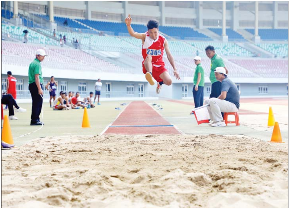
၂၀၂၂ ခုနှစ် တပ်မတော်(ကြည်း၊ ရေ၊ လေ) အားကစားပြိုင်ပွဲ အမျိုးသားအလျားခုန်ပြိုင်ပွဲ ကျင်းပစဉ်။

ပိုက်ကျော်ခြင်းပြိုင်ပွဲမှ အလွတ်တန်းလေးယောက်တွဲ အဖွဲ့လိုက် ပြိုင်ပွဲများနှင့် ကရာတေးဒိုပြိုင်ပွဲတွင် အကြီးတန်း တစ်ဦးချင်းပြိုင်ပွဲ၊ လူသစ်တန်းတစ်ဦးချင်းပြိုင်ပွဲများကိုလည်းကောင်း ယှဉ်ပြိုင်ကစားကြသည်။ အလားတူ တပ်မတော်ကာကွယ်ရေးဦးစီးချုပ်ဖလား(ခ)အဆင့် ဘောလုံး ပြိုင်ပွဲ ပထမအကြိမ်ဗိုလ်လုပွဲကို အရှေ့မြောက်တိုင်း စစ်ဌာနချုပ်ကိုယ်စားပြု(ခ) အသင်းနှင့် အမှတ်(၉၉) ခြေမြန်တပ်မဌာနချုပ်ကိုယ်စားပြု(ခ)အသင်းတို့သည် ယနေ့ညနေပိုင်းတွင် ဖေဖော်ဝါရီတပ်မတော်အားကစားကွင်း၌ ဆက်လက်ယှဉ်ပြိုင်ကစားကြရာ ပြိုင်ပွဲတွင် အရှေ့မြောက်တိုင်းစစ်ဌာနချုပ်ကိုယ်စားပြု(ခ)အသင်းက အမှတ်(၉၉) ခြေမြန်တပ်မဌာနချုပ် ကိုယ်စားပြု(ခ)အသင်းကို သုံးဂိုး-ဂိုးမရှိဖြင့် အနိုင်ရရှိခဲ့သည်။ အဆိုပါ အားကစားပြိုင်ပွဲများသို့ ကာကွယ်ရေးဦးစီးချုပ်ရုံးမှ တပ်မတော်အရာရှိကြီးများ၊ အရာရှိစစ်သည်၊ မိသားစုများ၊ ဒိုင်အဖွဲ့ဝင်များ၊ ပြိုင်ပွဲဝင်အားကစားသမားများနှင့် အားကစားဝါသနာရှင်များ တက်ရောက်ကြည့်ရှုအားပေးခဲ့ကြကြောင်း သိရသည်။