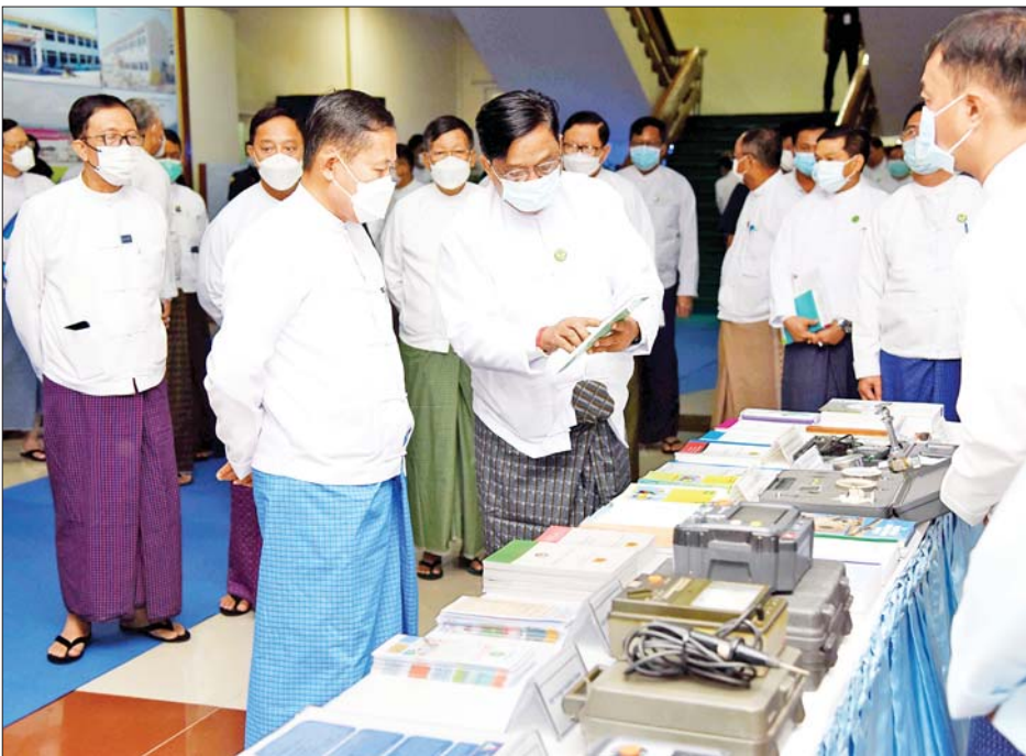
နိုင်ငံတော်စီမံအုပ်ချုပ်ရေးကောင်စီ ဒုတိယဥက္ကဋ္ဌ ဒုတိယဝန်ကြီးချုပ် ဒုတိယဗိုလ်ချုပ်မှူးကြီးစိုးဝင်း ဌာနဆိုင်ရာ ပြခန်းများကို ကြည့်ရှုစဉ်။

ဦးစွာ အသေးစား၊ အငယ်စားနှင့် အလတ်စား စီးပွားရေး (MSME) လုပ်ငန်းများ ဖွံ့ဖြိုးတိုးတက်ရေး လုပ်ငန်းကော်မတီဥက္ကဋ္ဌ နိုင်ငံတော်စီမံအုပ်ချုပ်ရေး ကောင်စီ ဒုတိယဥက္ကဋ္ဌ ဒုတိယဝန်ကြီးချုပ်က အမှာ စကားပြောကြားရာတွင် ယနေ့အချိန်အခါတွင် ကိုဗစ်-၁၉ ကပ်ရောဂါကြောင့် ဖွံ့ဖြိုးပြီးနိုင်ငံများနှင့် ဖွံ့ဖြိုးဆဲနိုင်ငံများပါ စီးပွားရေးအရ လူမှုရေးအရ တိုက်ရိုက်အကျိုးသက်ရောက်မှုကို ခံစားခဲ့ကြောင်း၊ အထူးသဖြင့် ကမ္ဘာ့စီးပွားရေးသည် အဆိုးရွားဆုံး အခြေအနေသို့ ကျရောက်ခဲ့သလို တစ်ဦးချင်းဝင်ငွေ များလည်း ကျဆင်းသွားခဲ့ကြောင်း၊ လူသန်းပေါင်း များစွာသည် အလွန်ဆင်းရဲသည့် အခြေအနေသို့ ကျရောက်ခဲ့ကြောင်း၊ အဆိုးရွားဆုံးထိခိုက်ခဲ့သည် မှာ ကမ္ဘာ့ကုန်သွယ်ရေးကဏ္ဍ၊ ခရီးသွားကဏ္ဍ၊ လူသုံး ကုန်ပစ္စည်းတင်ပို့မှုနှင့် ပြင်ပဘဏ္ဍာငွေကိစ္စရပ်များ ထိခိုက်နစ်နာမှု အကြီးမားဆုံးဖြစ်သည်ကို တွေ့ရှိခဲ့ရ ကြောင်း၊ ထို့ကြောင့် ကဏ္ဍအသီးသီးရှိ လုပ်ငန်းများ ရပ်နားရခြင်း၊ အနည်းဆုံးနှင့် အကျဉ်းဆုံး လုပ်ငန်း ပြန်စတင်ခြင်းစသည့် အကန့်အသတ်များကြောင့် အလုပ်အကိုင် အခွင့်အလမ်းရရှိမှုကိုလည်း ထိခိုက် ခဲ့ကြောင်း၊ မြန်မာနိုင်ငံအနေဖြင့် စီးပွားရေး၊ လူမှုရေးနှင့် ကျန်းမာရေးကဏ္ဍများတွင် အခြားနိုင်ငံ များနှင့်အတူ ခံစားခဲ့ကြောင်း၊ အထူးသဖြင့် ငွေကြေးအရင်းအနှီးအားနည်းသည့် MSME လုပ်ငန်း များ ပိုမိုထိခိုက်ခံစားခဲ့ရပြီး ယခုအချိန်တွင် နိုင်ငံတော်က ကိုဗစ်-၁၉ ကြောင့် ထိခိုက်ခဲ့ရသည့် လုပ်ငန်းများကို ကဏ္ဍအလိုက် ချေးငွေများထုတ်ချေး ထားပြီး ချေးငွေကာလကိုလည်း သက်တမ်းထပ်မံ တိုးမြှင့်ပေးထားကြောင်း၊ နိုင်ငံစီးပွားရေးလုပ်ငန်း အားလုံး၏ ၉၉ ရာခိုင်နှုန်းသည် MSME လုပ်ငန်း များဖြစ်ပြီး နိုင်ငံစီးပွားရေးအတွက် အဓိကမောင်းနှင် အားလည်းဖြစ်ကြောင်း။