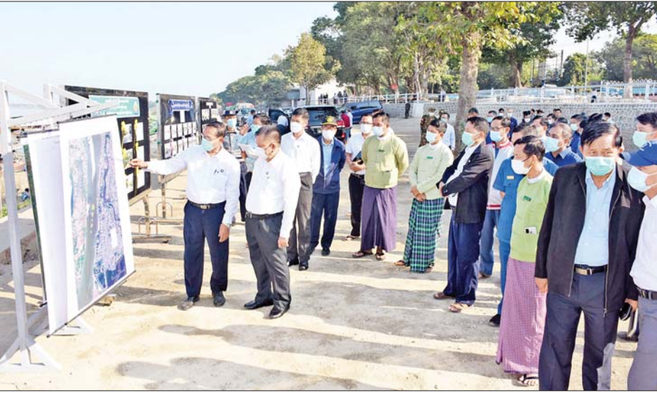
အမှိုက်သရိုက်များနှင့် ကန်တော်ကြီးအတွင်း များကိုလည်းကောင်း ကြည့်ရှုစစ်ဆေးကာ လိုအပ် ဝင်ရောက်သည့် သင်္ဂြိုဟ်ချောင်းအတွင်းမှ ဗေဒါနှင့် သည်များကို မှာကြားခဲ့ကြောင်း သိရသည်။ အမှိုက်များ ဆယ်ယူရှင်းလင်းနေမှု ရှင်းလင်းထားမှု သတင်းစဉ်

နေထိုင်မှုများမရှိစေရန်နှင့် ဈေးဆိုင်ခန်းများ စနစ်တကျရှိစေရေး၊ အစဉ်အမြဲသန့်ရှင်းသာယာလှပ ရန်တို့ကို အလေးထားဆောင်ရွက်ရေး၊ သဘာဝဘေးအန္တရာယ်ကြောင့် မမျှော်မှန်းနိုင်သည့်ဖြစ်စဉ်များ ကြုံတွေ့လာပါက ထိခိုက်မှုအနည်းဆုံးဖြစ်အောင် ကြိုတင်တွက်ဆ ထည့်သွင်းစဉ်းစားထားရေး၊ အခက်အခဲများရှိပါက ပွင့်လင်းမြင်သာစွာ တင်ပြဆောင်ရွက် သွားရေးတို့ကို မှာကြားပြီး လိုအပ်သည်များကို ပေါင်းစပ်ညှိနှိုင်း ဆောင်ရွက်ပေးသည်။ ထို့နောက် တိုင်းဒေသကြီးဝန်ကြီးချုပ်နှင့်အဖွဲ့သည် မရမ်းခြံဆိပ်ကမ်းမှ ပေပင်ဆိပ်ကမ်းအထိ ကမ်းနားလမ်းတစ်လျှောက် လမ်းဘေးဝဲ/ယာသန့်ရှင်း ရေးဆောင်ရွက်ပြီးစီးမှုနှင့် မြင်ကွင်းကွယ် သစ်ပင်ကြီးများကို အလင်းဖွင့်လုပ်ငန်းဆောင်ရွက်နေမှုများ ကိုလည်းကောင်း၊ မန္တလေးကန်တော်ကြီး လူထုအပန်းဖြေဥယျာဉ်ဧရိယာ မန္တလေးကန်တော်ကြီးအတွင်းမှ ဗေဒါများကို စက်အား၊ လူအားဖြင့် ဆယ်ယူရှင်းလင်း ဆောင်ရွက်နေမှု၊ ကန်တော်ကြီးပတ်လမ်းဘေးရှိ