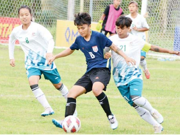
သစ္စာအားမာန်အသင်းနှင့် တနင်္သာရီအသင်း ယှဉ်ပြိုင်နေစဉ်။

ရန်ကုန် နိုဝင်ဘာ ၁၅ ၂၀၂၂ ရာသီ မြန်မာအမျိုးသမီးလိဂ်ပြိုင်ပွဲ ပွဲစဉ် (၁၁) ပထမနေ့ကို နိုဝင်ဘာ ၁၅ ရက်က ဆက်လက်ကျင်းပရာ သစ္စာအားမာန်အသင်းနှင့် လက်ရှိချန်ပီယံ အား/ကာသိပွဲအသင်း နိုင်ပွဲဆက်ခဲ့သည်။ သုဝဏ္ဏလေ့ကျင့်ရေးကွင်း-၁ ၌ ကျင်းပသည့်ပွဲတွင် သစ္စာအားမာန် အသင်းက တနင်္သာရီအသင်းကို ၁၀ ဂိုး-ဂိုးမရှိဖြင့် အနိုင်ရခဲ့သည်။ သစ္စာအားမာန်အသင်းသည် စာမျက်နှာ ၁၆ ကော်လံ ၁ သို့ ▢