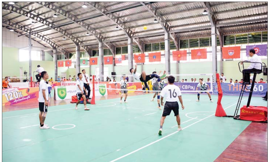
၂၀၂၂ ခုနှစ် တပ်မတော်(ကြည်း၊ ရေ၊ လေ) အားကစားပြိုင်ပွဲ အမျိုးသားပိုက်ကျော်ခြင်းပြိုင်ပွဲ ကျင်းပစဉ်။