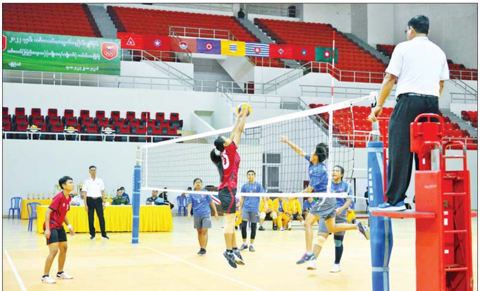
၂၀၂၂ ခုနှစ် တပ်မတော်(ကြည်း၊ ရေ၊ လေ) အားကစားပြိုင်ပွဲ အမျိုးသမီးဘော်လီဘောပြိုင်ပွဲ ကျင်းပစဉ်။