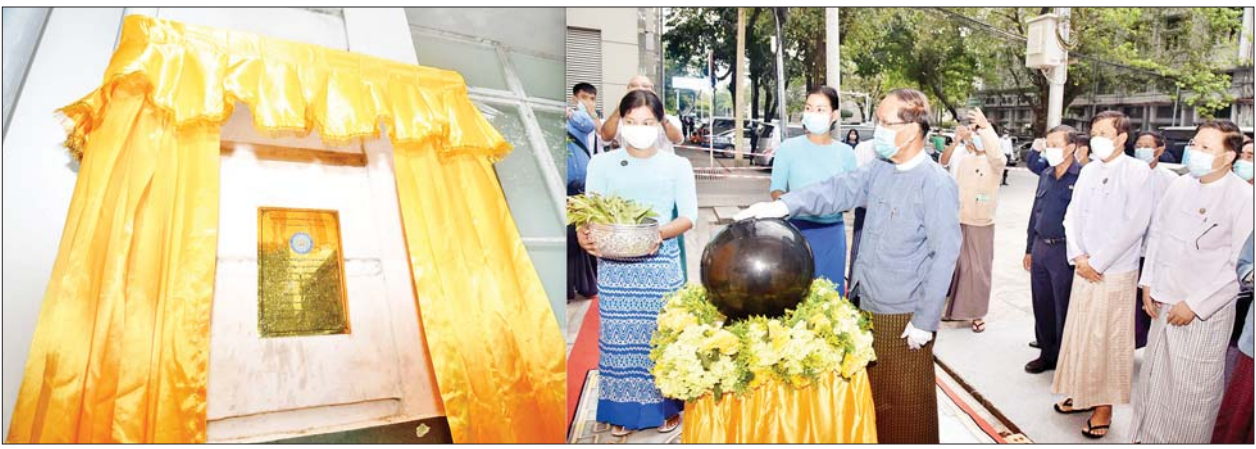
ပြည်ထောင်စုဝန်ကြီးဦးကိုကို အမျိုးသားစာကြည့်တိုက်(ရန်ကုန်) ရှေးဟောင်းအဆောက်အအုံကမ္ဘာ့မော်ကွန်းကြေးပြားကို စက်ခလုတ်နှိပ်ဖွင့်လှစ်ပေးစဉ်။

ဆက်လက်၍ ရန်ကုန်တိုင်းဒေသကြီး လူမှုရေးဝန်ကြီး ဦးအောင်ဝင်းသိန်းက ရှေးဟောင်းအဆောက်အအုံ ကမ္ဘာ့မော်ကွန်းကြေးပြား တပ်ဆင်ခြင်းနှင့်စပ်လျဉ်း၍လည်းကောင်း၊ ရှေးဟောင်းသုတေသနနှင့် အမျိုးသားပြတိုက်ဦးစီးဌာန ညွှန်ကြားရေးမှူးချုပ်