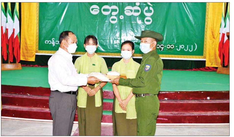
မြို့ တပ်နယ်ခန်းမ၌ သွားရောက်တွေ့ဆုံ၍ ရွှေဘိုမြို့အတွင်းရှိ ကျေးရွာ ၁၆ ရွာအတွက် နေကြာသီးနှံမျိုးစေ့ဖိုး ငွေကျပ်သိန်း ၈၀၊ ယူနီဖောင်းများ၊ ဆန်အိတ် ၂၀၊ ဆီ ၁၀ ပုံ၊ ကြက်ဥအလုံး ၁၂၀၀၊ ခေါက်ဆွဲခြောက် ၁၅ ဖာနှင့် စားသောက်ဖွယ်ရာများကို ထောက်ပံ့ပေးအပ်ခဲ့ကြောင်း သိရသည်။ သတင်းစဉ်

စစ်ခေါင်းဆောင်တစ်ဦးက ကျေးဇူးတင်စကား ပြန်လည်ပြောကြားသည်။ ယင်းနောက် တိုင်းဒေသကြီးဝန်ကြီးချုပ်၊ တိုင်းမှူးနှင့်အဖွဲ့ဝင်များသည် မှော်တော်ကျေးရွာ ဘုန်းတော်ကြီးကျောင်းအတွက် အလှူငွေကျပ် ၁၀ သိန်းနှင့် လှူဖွယ်ပစ္စည်းများကို လှူဒါန်းခဲ့ကြသည်။ ဆက်လက်၍ တိုင်းဒေသကြီးဝန်ကြီးချုပ်၊ တိုင်းမှူးနှင့်အဖွဲ့ဝင်များသည် ကန့်ဘလူမြို့နယ်အတွင်းရှိ ပြည်သူ့စစ်(ဌာနေ)အဖွဲ့ဝင်များကို ကန့်ဘလူမြို့ရှိ ရွှေဆည်မြိုင်အစည်းအဝေးခန်းမ၌ တွေ့ဆုံ၍ ကန့်ဘလူမြို့နယ်အတွင်းရှိ ကျေးရွာ ၄၃ ရွာအတွက် နေကြာသီးနှံမျိုးစေ့ဖိုးငွေကျပ် ၂၁၅ သိန်း၊ ယူနီဖောင်းများ၊ ဆန်အိတ် ၅၀၊ ဆီပိဿာ ၃၀၊ ဆားအိတ် ၅၀၊ ပဲအိတ် ၅၀ နှင့် စားသောက်ဖွယ်ရာများ ထောက်ပံ့ပေးအပ်သည်။ ယင်းနောက် တိုင်းဒေသကြီး ဝန်ကြီးချုပ်၊ တိုင်းမှူးနှင့် အဖွဲ့ဝင်များသည် မွန်းလွဲပိုင်းတွင် ရွှေဘိုမြို့ရှိ ပြည်သူ့စစ်(ဌာနေ)အဖွဲ့ဝင်များကို ရွှေဘို