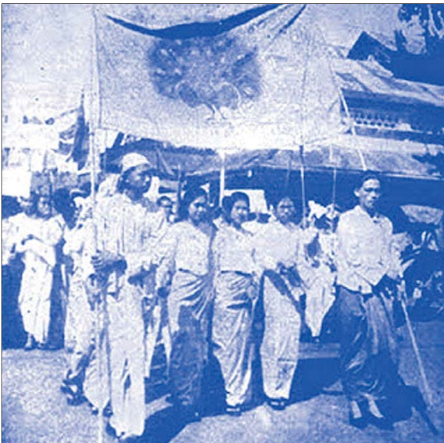
အမျိုးသားအောင်ပွဲနေ့ကို စတင်သန္ဓေတည်ခဲ့သည့် ရန်ကုန်ကျောင်းသားသပိတ်။

အမျိုးသားရေး ဇာတိမာန်ထက်သန်သော ခေါင်းဆောင်ကောင်းတို့ကြောင့် အမျိုးဘာသာ၊ သာသနာ၊ ယဉ်ကျေးမှုအမွေအနှစ်များကို ထိန်းသိမ်း စောင့်ရှောက်နိုင်ဆဲဖြစ်သည်။ ကျွန်တော်တို့သည် နှစ် ၁၀၀ သက်တမ်းပြည့်ခဲ့၊ ကျော်ခဲ့ပြီဖြစ်သော ရာပြည့်အောင်ပွဲများစွာကို ရင်ထဲနဲ့လုံးသားထဲတွင် သတိတရဖြင့် မမေ့နိုင်ဆဲဖြစ်သည်။ ဝိုင်အမ်ဘီအေမှ မွေးဖွားပေးခဲ့သည့် ဂျီစီဘီအေရာပြည့်၊ အမျိုးသား ပညာရေးနှင့် မြို့မအမျိုးသားကျောင်း၊ တက္ကသိုလ် ရာပြည့်၊ အမျိုးသားအောင်ပွဲရာပြည့်များသည် အားလုံးအတွက် မမေ့စကောင်းသော အောင်ပွဲများပင်