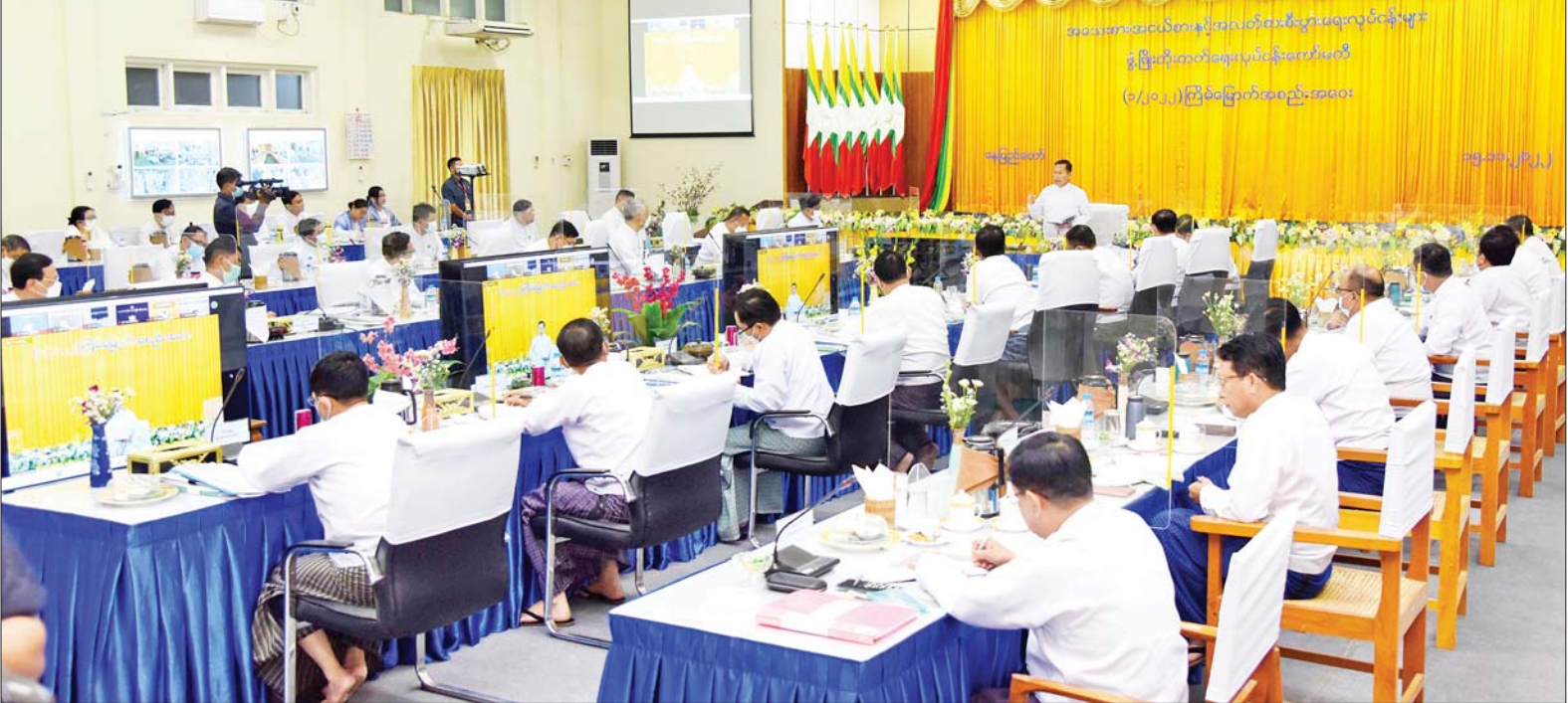
နိုင်ငံတော်စီမံအုပ်ချုပ်ရေးကောင်စီ ဒုတိယဥက္ကဋ္ဌ ဒုတိယဝန်ကြီးချုပ် ဒုတိယဗိုလ်ချုပ်မှူးကြီးစိုးဝင်း အသေးစား၊ အငယ်စားနှင့် အလတ်စားစီးပွားရေးလုပ်ငန်းများ ဖွံ့ဖြိုးတိုးတက်ရေးလုပ်ငန်းကော်မတီအစည်းအဝေး (၁/၂၀၂၂)တွင် အမှာစကားပြောကြားစဉ်။

နေပြည်တော် နိုဝင်ဘာ ၁၅ အသေးစား၊ အငယ်စားနှင့် အလတ်စား စီးပွားရေးလုပ်ငန်းများ ဖွံ့ဖြိုးတိုးတက်ရေးလုပ်ငန်းကော်မတီ အစည်းအဝေး(၁/၂၀၂၂) ကို ယနေ့မွန်းလွဲ ၁ နာရီခွဲတွင် နေပြည်တော်ရှိ စက်မှုဝန်ကြီးဌာန အစည်းအဝေးခန်းမ၌ ကျင်းပရာ အသေးစား၊ အငယ်စားနှင့် အလတ်စား စီးပွားရေးလုပ်ငန်းများ ဖွံ့ဖြိုးတိုးတက်ရေးလုပ်ငန်းကော်မတီ ဥက္ကဋ္ဌ နိုင်ငံတော်စီမံအုပ်ချုပ်ရေးကောင်စီ ဒုတိယဥက္ကဋ္ဌ ဒုတိယဝန်ကြီးချုပ် ဒုတိယဗိုလ်ချုပ်မှူးကြီး စိုးဝင်း တက်ရောက်အမှာစကား ပြောကြားသည်။ တက်ရောက်အစည်းအဝေးသို့ ပြည်ထောင်စုဝန်ကြီးများ၊ နေပြည်တော်ကောင်စီဥက္ကဋ္ဌ၊ ဒုတိယဝန်ကြီးများ၊ လုပ်ငန်းကော်မတီဝင်များနှင့် တာဝန်ရှိသူများ တက်ရောက်ကြပြီး တိုင်းဒေသကြီးနှင့် ပြည်နယ်ဝန်ကြီးချုပ်များနှင့် အသင်းအဖွဲ့များမှ တာဝန်ရှိသူများက ဗီဒီယိုကွန်ဖရင့်ဖြင့် တက်ရောက်ကြသည်။ စာမျက်နှာ ၃ ကော်လံ ၁ သို့ ☆