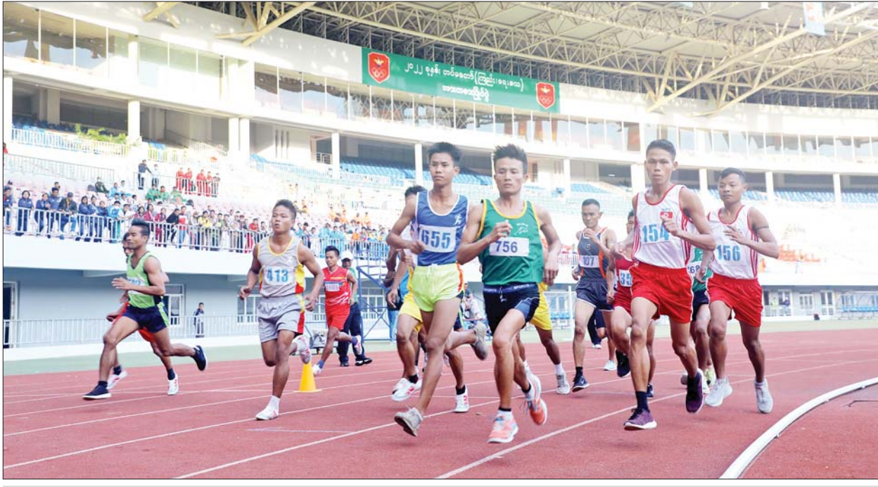
၂၀၂၂ ခုနှစ် တပ်မတော်(ကြည်း၊ ရေ၊ လေ)အားကစားပြိုင်ပွဲများ ကျင်းပစဉ်။

နေပြည်တော် နိုဝင်ဘာ ၁၅ ၂၀၂၂ ခုနှစ် တပ်မတော်(ကြည်း၊ ရေ၊ လေ)အားကစားပြိုင်ပွဲများကို ယနေ့ နံနက်ပိုင်း မှစတင်၍ အားကစားနည်းများအလိုက် ပြိုင်ပွဲများဖြစ်သည့် လက်ဝှေ့ပြိုင်ပွဲကို သတ်မှတ်ထားသော အားကစားကွင်း/ရုံများ တွင် စတင်ကျင်းပသည်။ တပ်မတော်(ကြည်း၊ရေ၊လေ) အားကစား ပြိုင်ပွဲများဖြစ်သည့် လက်ဝှေ့ပြိုင်ပွဲကို နေပြည်တော်ရှိ စစ်ကြောရေးနှင့် တည်းခိုရေး စခန်းရှိ တပ်နယ်အားကစားခန်းမ၌ ကီလိုတန်း အလိုက် ပြိုင်ပွဲများကိုလည်းကောင်း၊ ဇေယျာသီရိ စာမျက်နှာ ၁၁ ကော်လံ ၁ သို့ ▣