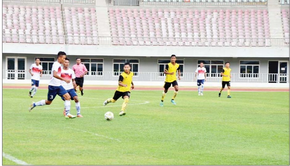
၂၀၂၂ ခုနှစ် တပ်မတော်(ကြည်း၊ ရေ၊ လေ) အားကစားပြိုင်ပွဲ အမျိုးသားဘောလုံးပြိုင်ပွဲ ကျင်းပစဉ်။