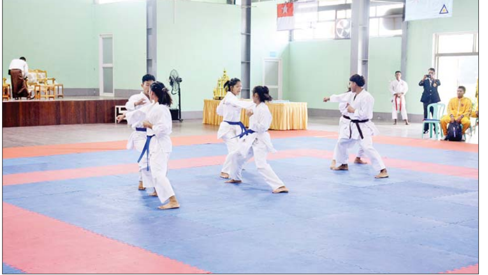
၂၀၂၂ ခုနှစ် တပ်မတော်(ကြည်း၊ ရေ၊ လေ) အားကစားပြိုင်ပွဲ အမျိုးသမီးကရာတေးဒိုပြိုင်ပွဲ ကျင်းပစဉ်။