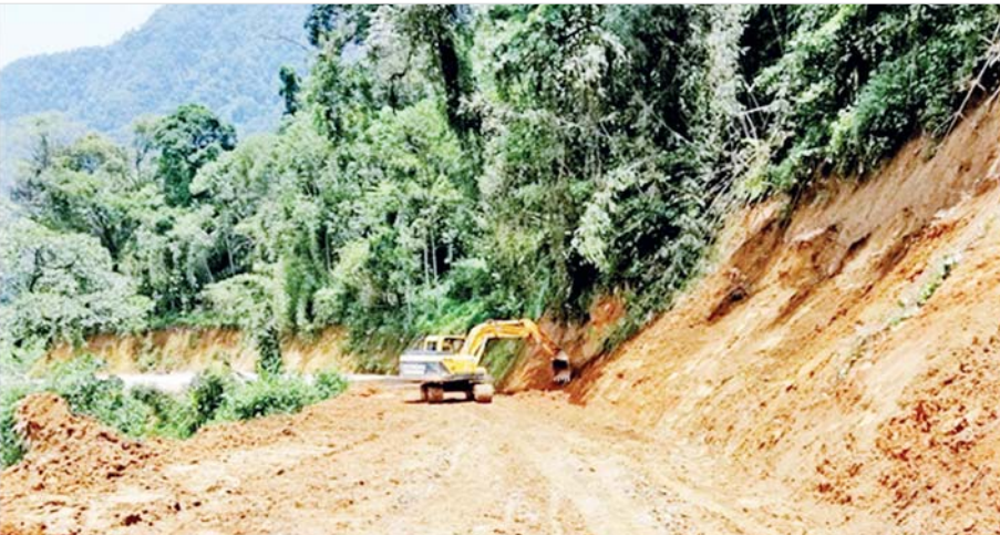
ကချင်ပြည်နယ် မဂွေဇ- ခေါင်လန်ဖူး ၆၅/၄ မိုင် လမ်းပေါ်တွင် မိုးသည်းထန်စွာရွာသွန်းမှုကြောင့် ပြိုကျနေသောမြေစာများအား ယန္တရားများဖြင့် ရှင်းလင်းနေမှုကိုတွေ့ရစဉ်။

ဘိုးတော်ဘုရားလက်ထက် ၁၁၅၄ ခုနှစ်တွင် “တွင်းသင်းမင်းကြီး မဟာစည်သူ ဦးထွန်းညို” ရေးသားခဲ့သော “ဘလ္လာတိယပျို့” ပါ မိုးသက် လေပြင်းတွေထန်၊ သစ်ပင်တွေကျိုးပြတ်လွင့်စင်၊ ချောင်းရေတွေလျှံပြီး တစ်ဖက်၊ တစ်ကမ်းစီ တစ်ည တာ ကွဲကွာခဲ့ရသဖြင့် နှစ်ပေါင်းခုနစ်ရာတိုင်အောင် ငိုကြွေးခဲ့ရသည်ဟု တင်စားခဲ့သည့် ကိစ္စရပ်၊ ကိစ္စရာ မောင်နှံ ချောင်းခြားအလွမ်းအဖြစ်အပျက်သည် လည်းကောင်း၊ ၁၈၁၅ ခုနှစ်က ဖြစ်ပွားခဲ့သော အင်ဒိုနီးရှားနိုင်ငံအပါအဝင် တစ်ကမ္ဘာလုံးအပေါ် နှစ်နာသော အကျိုးသက်ရောက်မှုဖြစ်စေခဲ့သော “တန်ဘိုးရီမီးတောင်” ပေါက်ကွဲမှုသည် လည်း ကောင်း၊ ၂၀၀၈ ခုနှစ် မေလက မြစ်ဝကျွန်းပေါ် ဒေသကို အတိုင်းအတာကြီးကြီးမားမားပျက်စီး ဆုံးရှုံးစေခဲ့သော “နာဂစ်မုန်တိုင်း” သည်လည်း ကောင်း၊ ၂၀၁၁ ခုနှစ် မတ်လက လှုပ်ခတ်ခဲ့သော ဂျပန်နိုင်ငံအဖို့ အကြီးမားဆုံးနှင့် အခဲယဉ်းဆုံးဟု ပြောဆိုရမည့် “ဆန်ဒိုင်ငံလျင်နှင့် ဆူနာမီ” သည် လည်းကောင်း၊ ၂၀၁၄ ခုနှစ်အောက်တိုဘာလအတွင်း အမေရိကန်နိုင်ငံ ကယ်လီဖိုးနီးယားပြည်နယ်သမိုင်း ၏အဆုံးရှုံးဆုံးတောမီးလောင်မှုနှင့် ၂၀၂၂ ခုနှစ် ဇန်နဝါရီလမှ မတ်လအတွင်း ဘရာဇီးနိုင်ငံရှိ ကမ္ဘာ့ အကြီးဆုံးအမေဇုန်မိုးသစ်တောပြုန်းတီးမှုများသည် လည်းကောင်း၊ ကမ္ဘာပေါ်တွင် နှစ်စဉ်နီးပါးဖြစ်ပေါ်လေ့ ရှိသည့် သဘာဝဘေးအန္တရာယ်များဖြစ်ကြလေသည်။ ဘေးအန္တရာယ်ဟူသည်မှာ နေရာဒေသတစ်ခု (သို့မဟုတ်) လူတစ်စုအပေါ် ရွေးချယ်ကျရောက် တတ်ခြင်းမျိုးမဟုတ်ပေ။ ခေတ်မီဖွံ့ဖြိုးပြီး နည်းပညာအဆင့်မြင့်သည့်နိုင်ငံ၊ ဖွံ့ဖြိုးဆဲဒေသ၊ ဖွံ့ဖြိုးမှုနောက်ကျသည့် တိုင်းပြည်ဟူ၍ ရွေးချယ်မှု မရှိ၊ ညာတာမှုမရှိ၊ ခွဲခြားမှုမရှိပေ။ သဘာဝဘေး အန္တရာယ်များကြောင့် လူသားတိုင်း၊ ဒေသတိုင်း၊