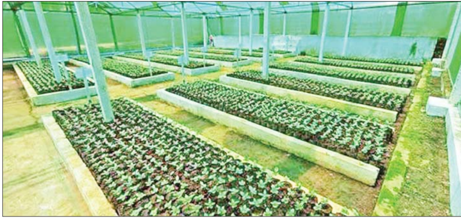
ပြင်ဦးလွင်မြို့ ကော်ဖီနည်းပညာဖွံ့ဖြိုးရေးခြံ(ပွေးတောင်)အတွင်း စိုက်ပျိုးထားသည့် ကော်ဖီပင်များကိုတွေ့ရစဉ်။

ကော်ဖီသည် ကမ္ဘာ့ကုန်စည်ဈေးကွက်တွင် ရေနံရောင်းဝယ်မှုပြီးလျှင် ဒုတိယအဆင့် အရေးပါဆုံးသော တန်ဖိုးမြင့် သီးနှံကုန်စည်တစ်ခုဖြစ်သည်။ ကော်ဖီသည် ရေပြီးနောက် ဒုတိယအများဆုံးသောက်သုံးသောဖျော်ရည်ဖြစ်သည်။ ကမ္ဘာတစ်ဝန်းရှိ တောင်သူပေါင်း ၂၅ သန်းကျော်သည် ကော်ဖီစိုက်ပျိုးရေးတွင် ပါဝင်ပတ်သက်နေကြသည်။ ယနေ့ကာလတွင် အလေးထားစိုက်ပျိုးသင့်သည့်သီးနှံမှာ ကော်ဖီဖြစ်သည်။ အော်ဂဲနစ်ကော်ဖီအတွက် ကမ္ဘာ့ဝယ်လိုအားသည် ၂၀၂၆ ခုနှစ်တွင် နှစ်ဆတိုးလာမည်ဟု နိုင်ငံတကာကော်ဖီဈေးကွက်ကျွမ်းကျင်သည့် အဖွဲ့အစည်းများက ခန့်မှန်းထားသည်။ ကော်ဖီသည် မှတ်ဉာဏ်ကိုကောင်းမွန်စေပြီး ကော်ဖီကို ပုံမှန်သောက်သုံးခြင်းသည် စိတ်ကျရောဂါဖြစ်နိုင်ခြေကို ၆၅ ရာခိုင်နှုန်းအထိ လျော့ချနိုင်ကြောင်း လေ့လာမှုများရှိခဲ့ပြီးဖြစ်သည်။ ထို့ပြင် စိတ်ကိုလန်းဆန်းစေခြင်း၊ ကိုယ်ခံစွမ်းအားကို မြှင့်တင်ပေးခြင်း၊ အာရုံကြောဆိုင်ရာရောဂါများကို ကာကွယ်ပေးခြင်း စသည့် ကော်ဖီနှင့်ဆက်စပ်သော ကျန်းမာရေးအကျိုးကျေးဇူးများကို ရရှိစေကြောင်း သိရသည်။