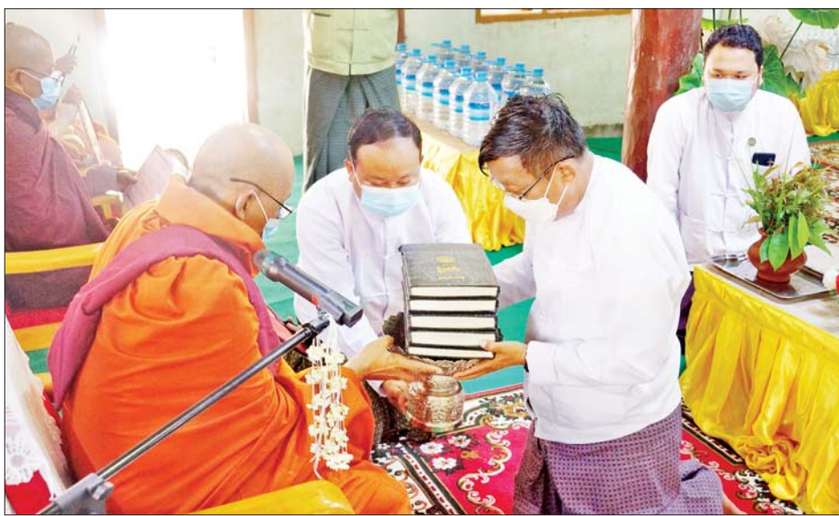
လွင်နှင့် ဧည့်ပရိသတ်များက ဇေယျသီရိမြို့နယ် သံဃနာယကအဖွဲ့ အကျိုးတော်ဆောင် ရှားတောကျောင်းတိုက် ပဓာနနာယကဆရာတော်ဘဒ္ဒန္တဥတ္တရ အရှင်သူမြတ်ထံမှ ငါးပါးသီလခံယူဆောက်တည်ကြပြီး နေပြည်တော်ကောင်စီဥက္ကဋ္ဌက သာသနာရေးဆိုင်ရာများလျှောက်ထား၍ နေပြည်တော်ကောင်စီ

နေပြည်တော် နိုဝင်ဘာ ၁၃ နေပြည်တော်ကောင်စီက ကြီးမှူးကျင်းပသည့် ဇေယျသီရိမြို့နယ်လုံးဆိုင်ရာ ဒုတိယအကြိမ် အသံမစဲမဟာပဋ္ဌာန်းမြတ်ရွတ်ဖတ်ပူဇော်ပွဲ ဖွင့်ပွဲအခမ်းအနားကို ယနေ့နံနက် ၁၀ နာရီတွင် ဇေယျသီရိမြို့နယ် ရွှေကြာပင်ရပ်ကွက် သာယာကုန်းကျောင်းတိုက်၌ ကျင်းပရာ ဇေယျသီရိမြို့နယ် သံဃနာယကအဖွဲ့အကျိုးတော်ဆောင် ရှားတောကျောင်းတိုက် ပဓာနနာယကဆရာတော် ဘဒ္ဒန္တဥတ္တရ အရှင်သူမြတ်အမှူးပြုသည့် ဆရာတော်၊ သံဃာတော်များ ကြွရောက်ချီးမြှင့်တော်မူကြသည်။ အခမ်းအနားသို့ နေပြည်တော်ကောင်စီဥက္ကဋ္ဌ ဦးတင်ဦးလွင်နှင့် ဇနီး ဒေါ်မေမြင့်မောင်၊ နေပြည်တော်ကောင်စီအဖွဲ့ဝင်များဖြစ်ကြသည့် ဦးဇေယျာလင်းနှင့် ဦးမြင့်စိုး၊ ခရိုင်နှင့် မြို့နယ်အဆင့်ဌာနဆိုင်ရာ ဝန်ထမ်းများနှင့် ဒေသခံဧည့်ပရိသတ်များ တက်ရောက်ကြည့်ညိကြသည်။ ရှေးဦးစွာ နေပြည်တော်ကောင်စီဥက္ကဋ္ဌဦးတင်ဦး