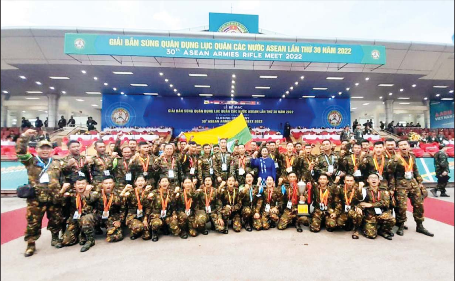
အကြိမ်(၃၀)မြောက် အာဆီယံနိုင်ငံ တပ်မတော်(ကြည်း)များ သေနတ်ပစ်ပြိုင်ပွဲ ဝင်ရောက်ယှဉ်ပြိုင်ခဲ့သည့် မြန်မာ့တပ်မတော် သေနတ်ပစ်အသင်းကို တွေ့ရစဉ်။

နေပြည်တော် နိုဝင်ဘာ ၁၃ အကြိမ်(၃၀)မြောက် အာဆီယံ နိုင်ငံ တပ်မတော်(ကြည်း)များ သေနတ်ပစ်ပြိုင်ပွဲ (AARM-30)ကို နိုဝင်ဘာ ၄ ရက်မှ ၁၁ ရက်ထိ ဗီယက်နမ်နိုင်ငံတွင် ကျင်းပခဲ့ပြီး မြန်မာ့တပ်မတော်သေနတ်ပစ် အသင်း ဝင်ရောက်ယှဉ်ပြိုင်ခဲ့ သည်။