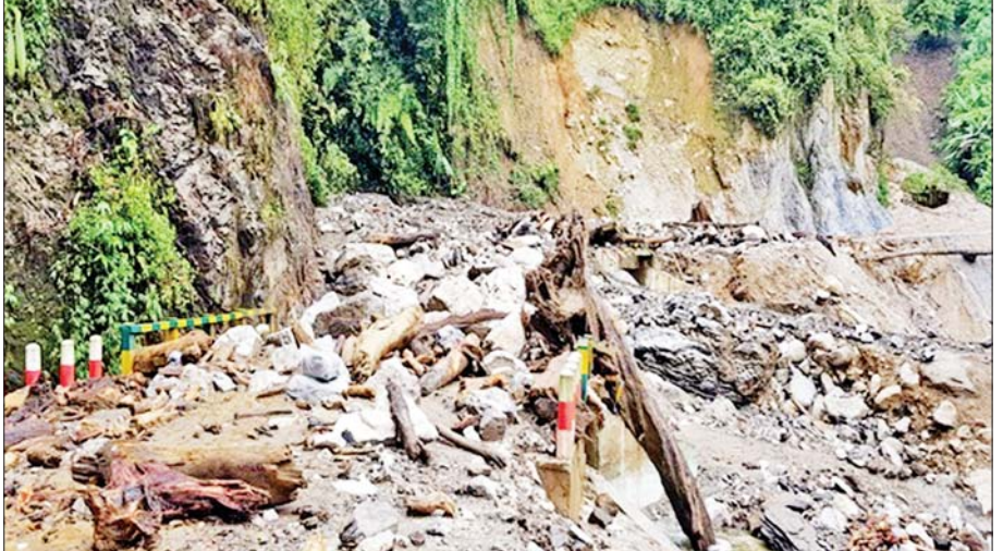
ကချင်ပြည်နယ် မဂွေဇ - ခေါင်လန်ဖူး ၆၅/၄ မိုင် လမ်းပေါ်ရှိ တံတားနှစ်စင်း မိုးသည်းထန် စွာရွာသွန်းပြီး ချောင်းရေကြီးမှုကြောင့် ပျက်စီးနေမှုများကိုတွေ့ရစဉ်။