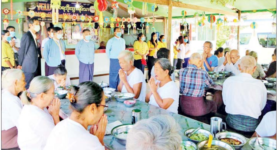
ဒေါ်လာ ၄၈၀၀ တန်ဖိုးရှိ Non-contact Tonometer(NCT) Ct-800 ရေတိမ်တိုင်းစက်ကိုလည်းကောင်း၊ မြန်မာနိုင်ငံ ကြက်ခြေနီအသင်းသို့ လှူဒါန်းရန်အတွက် ငွေကျပ်သိန်း ၅၅၀ ကိုလည်းကောင်း လှူဒါန်းပြီး တန်ဆောင်တိုင်ပွဲတော်ကာလ၌ နိုင်ငံတစ်ဝန်းရှိ ဘုန်းတော်ကြီးကျောင်း၊ အပါအဝင် ထောက်ပံ့ငွေများ သီလရှင်ကျောင်း၊ ဘိုးဘွားရိပ်သာနှင့် မိဘမဲ့ဂေဟာများသို့ ငွေကျပ်

ရန်ကုန် နိုဝင်ဘာ ၁၃ တိုင်းဒေသကြီးနှင့် ပြည်နယ်များရှိ ဘုန်းတော်ကြီးကျောင်း၊ သီလရှင်ကျောင်း၊ ဘိုးဘွားရိပ်သာနှင့် မိဘမဲ့ဂေဟာများသို့ ဆက်သွယ်ရေးအော်ပရေတာတစ်ခုဖြစ်သည့် MPT မှ တန်ဆောင်တိုင်အထိမ်းအမှတ်အဖြစ် နိုဝင်ဘာ ၁၁ ရက်တွင် ငွေကျပ် သိန်း ၅၅၀ တန်ဖိုးရှိ စားသောက်ကုန်နှင့် အလှူငွေများ လှူဒါန်းခဲ့ကြောင်း သိရသည်။ ပညာရေး၊ ကျန်းမာရေးကဏ္ဍများတွင် အထောက်အကူပြုနိုင်ရန် သက်ဆိုင်ရာ ဌာနဆိုင်ရာများ၊ အသင်းအဖွဲ့များနှင့် MPT အနေဖြင့် ပူးပေါင်းဆောင်ရွက်လျက်ရှိရာ စက်တင်ဘာလအတွင်းက မြန်မာ့မီးရထားဆေးရုံ (အင်းစိန်)သို့ မျက်စိစမ်းသပ်ခန်းတွင် အသုံးပြုသည့် အမေရိကန်