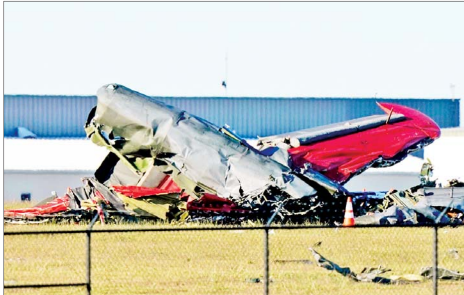
တွင် လေယာဉ်မှူးတစ်ဦး ပါရှိကြောင်း ကနဦးရလဒ် များအရ သိရသည်။

B-17 တွင် လေးဦး သို့မဟုတ် ငါးဦး ရှိပြီး P-63