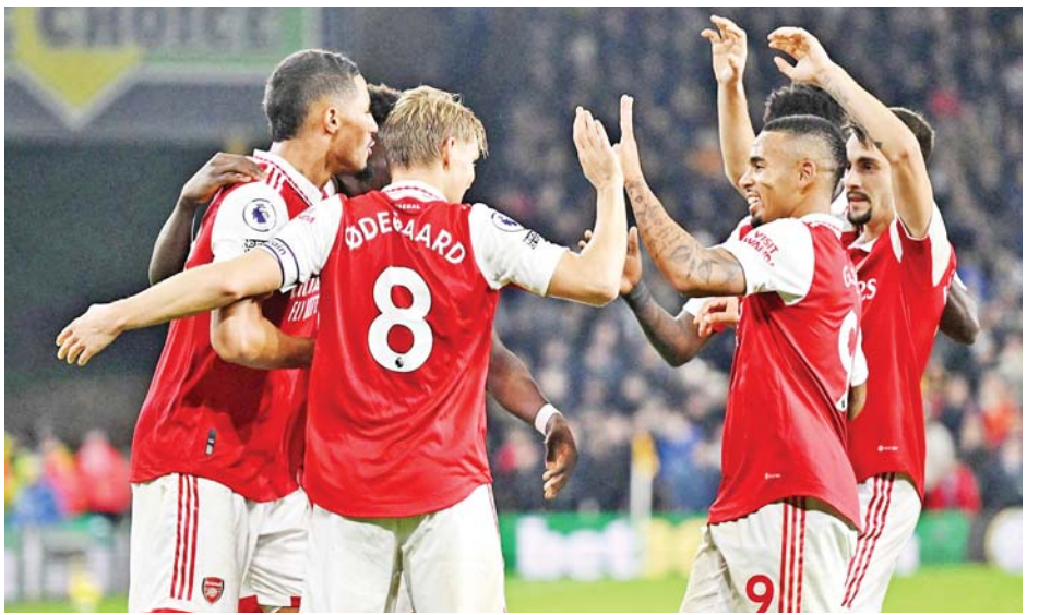
ငွေကြယ် - ရေးသားသည်

နိုဝင်ဘာ ၁၂ ရက်ညပိုင်းက ယှဉ်ပြိုင်ကစားခဲ့တဲ့ ပရီမီယာလိဂ်ပွဲစဉ်(၁၆)ရဲ့ အခြားသော ပွဲစဉ်တွေမှာ တော့ နယူးကော့ဆယ်အသင်းက ချယ်လ်ဆီးအသင်းကို တစ်ဂိုး-ဂိုးမရှိ လက်စတာစီးတီးအသင်းက ဝက်စ်ဟမ်းယူနိုက်တက်အသင်းကို နှစ်ဂိုး-ဂိုးမရှိ၊ စပါးအသင်းက လီဒ်ယူနိုက်တက်အသင်းကို လေးဂိုး-သုံးဂိုး၊ နော့တင်ဟမ်ဖောရက်စ်အသင်းက ခရစ္စတယ်ပဲလို့အသင်းကို တစ်ဂိုး-ဂိုးမရှိ၊ လီဗာပူးအသင်းက ဆောက်သမ်တန်အသင်းကို သုံးဂိုး-တစ်ဂိုး၊ ဘုန်းမောက်အသင်းက အဲဗာတန်အသင်းကို သုံးဂိုး-ဂိုးမရှိ အနိုင်ရရှိခဲ့တာဖြစ်ပါတယ်။