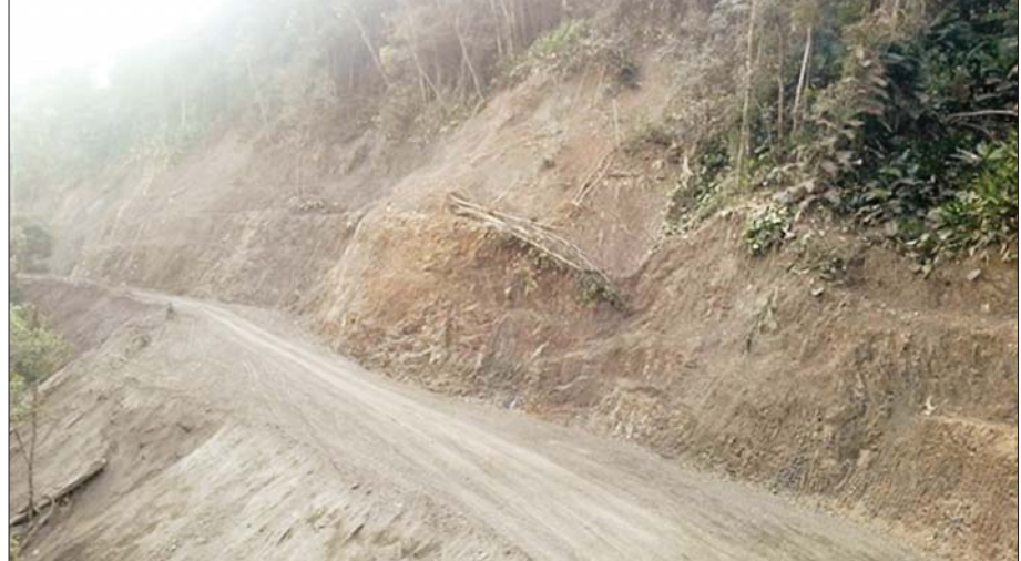
ကချင်ပြည်နယ် မဂွေဇ- ခေါင်လန်ဖူး ၆၅/၄ မိုင် လမ်းပေါ်တွင် မိုးသည်းထန်စွာ ရွာသွန်းမှုကြောင့် ပြိုကျနေသောမြေစာများအား ရှင်းလင်းပြီးစီးမှုကိုတွေ့ရစဉ်။