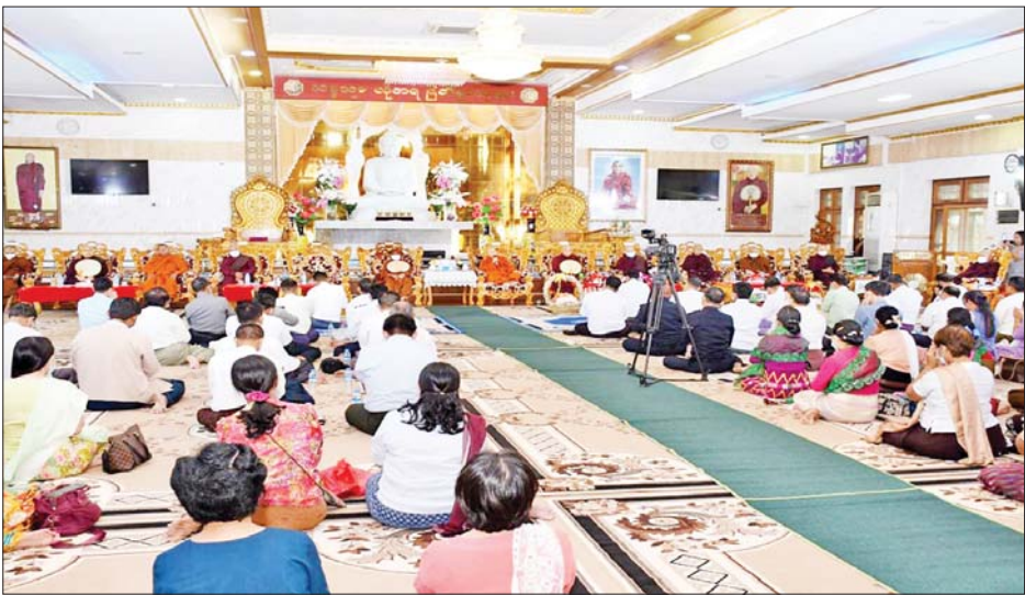
တိုင်းမှူးတို့က တိုင်းဒေသကြီးအစိုးရအဖွဲ့နှင့် တိုင်းစစ်ဌာနချုပ်တို့မှ လှူဒါန်းသော အလှူငွေများကို စားမေးပွဲကျင်းပရေးကော်မတီဥက္ကဋ္ဌထံ ပေးအပ်လှူဒါန်းပြီး စာမေးပွဲမြေဆိုမည့်ရက်များတွင် သံဃာတော်များ၏ ဆွမ်းကိစ္စ၊ ကျန်းမာရေးနှင့် အခြားလိုအပ်သည့် ကိစ္စရပ်များ ဆောင်ရွက်နိုင်ရေး ညှိနှိုင်းဆွေးနွေးခဲ့ကြကြောင်း သိရသည်။ သတင်းစဉ်

တာဝန်ရှိသူများ တက်ရောက်ကြသည်။ ဦးစွာ တိုင်းဒေသကြီးဝန်ကြီးချုပ်၊ တိုင်းမှူးနှင့် တက်ရောက်လာကြသူများက အင်းစိန်မြို့နယ် ရွာမပရိယတ္တိစာသင်တိုက်ကြီး၏ ဦးစီးပဓာန နာယက ဆရာတော်ထံမှ ငါးပါးသီလသံယူဆောက်တည်ကြသည်။ ထို့နောက် မဇ္ဈိမဂုဏ်ရည်ဆရာတော် ဘဒ္ဒန္တကောဝိဒက အစည်းအဝေးကျင်းပခြင်းနှင့် စပ်လျဉ်း၍ လျှောက်ထားမိန့်ကြားသည်။ ယင်းနောက် တိုင်းဒေသကြီးဝန်ကြီးချုပ်က သာသနာရေးဆိုင်ရာများ လျှောက်ထားပြီး တိုင်းမှူး၊ တာဝန်ရှိသူများနှင့် အတူ သံဃာတော်များအား လှူဖွယ်ဝတ္ထုပစ္စည်းများ ဆက်ကပ်လှူဒါန်းကြသည်။ ထို့နောက် တိုင်းဒေသကြီးဝန်ကြီးချုပ်နှင့်