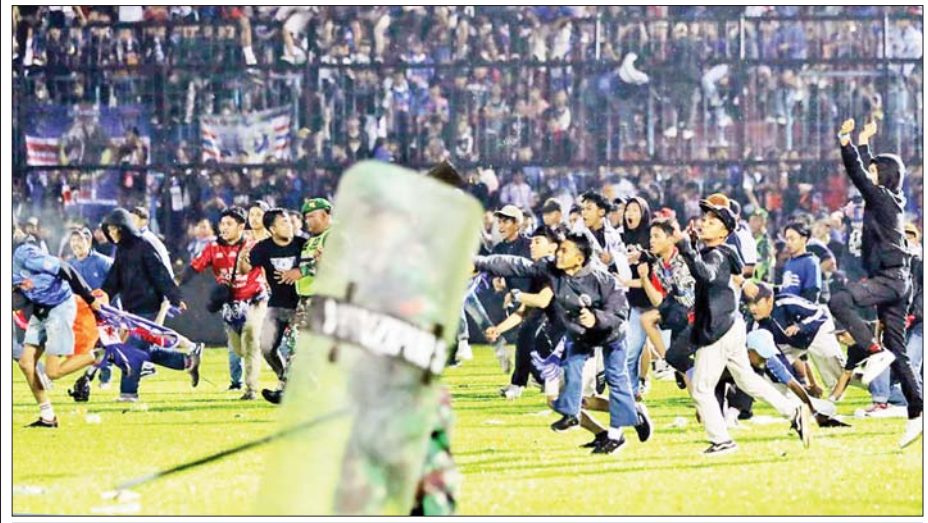
အင်ဒိုနီးရှားနိုင်ငံ၌ အောက်တိုဘာ ၁ ရက်က ဘောလုံးပွဲအပြီး ရုန်းရင်းဆန်ခတ်ဖြစ်ပွားစဉ်။

သို့ပါ၍ ပျော်ပွဲရွှင်ပွဲဟုဆိုသော်လည်း လူစု လူဝေးနှင့် သိပ်သည်းဆ အဆမတန်ခြင်းက အဆိုး သတ်၌ မမျှော်မှန်းနိုင်သော ဝမ်းနည်းဖွယ်ဖြင့်သာ အဆုံးသတ်ရသည်ကို ကြိုတင်တွေးဆသင့်ပါ ကြောင်းနှင့် ထုထည်ကြီးမားသော လူစုလူဝေးသည် တစ်ခါတစ်ရံတွင် အသက်အန္တရာယ်ဖြစ်ပွားနိုင်သည် ကို အထက်ပါ သာဓကများမှတစ်ဆင့် သတိပြု ရှောင်ရှားကြစေလိုကြောင်း အကြံပြုရေးသားလိုက် ရပါသည်။ ။