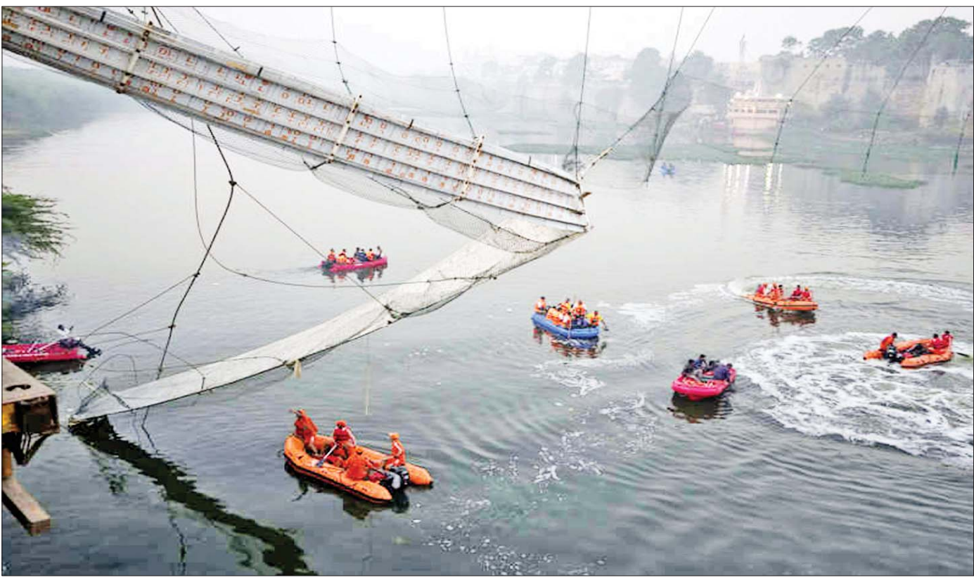
အိန္ဒိယနိုင်ငံ ဂျာဂရတ်ပြည်နယ်၌ အောက်တိုဘာ ၃၀ ရက်က သံမဏိကြိုးဆိုင်းတံတား ပျက်ကျမှုကိုတွေ့ရစဉ်။

ဖော်ပြပါ ဖြစ်ရပ်များသည် အောက်တိုဘာလ အတွင်း ဖြစ်ပွားခဲ့သည့် အဆိုးရွားဆုံး လူစုလူဝေး နှင့်ပတ်သက်သည့် ဘေးအန္တရာယ်များဖြစ်ကြောင်း နိုင်ငံတကာသတင်းဌာနများတွင် ဖော်ပြထားပါ