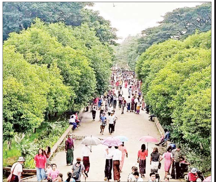
ပြည်ထောင်စုတိုင်းရင်းသားကျေးရွာ (ရန်ကုန်)၌ တန်ဆောင်မုန်းလပြည့်နေ့တွင် အပန်းဖြေလာရောက်လည်ပတ်ကြသူများဖြင့် စည်ကားများပြားလျက်ရှိသည်ကို တွေ့ရစဉ်။ သတင်းစဉ်