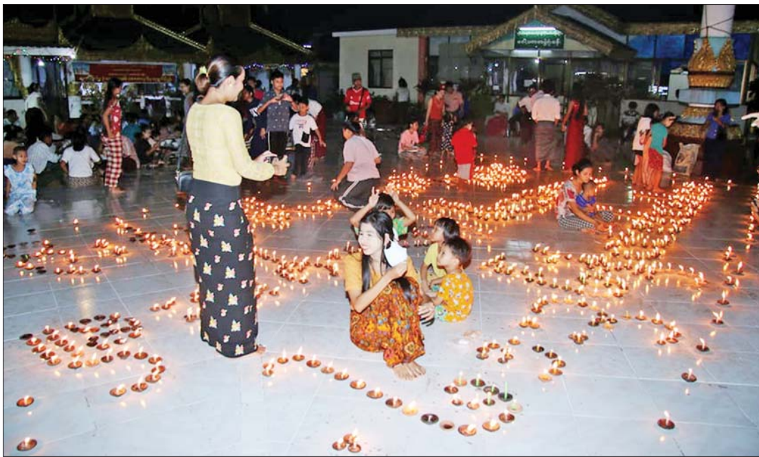
ရန်ကုန်မြို့ ရှေ့ဟောင်းသမိုင်းဝင် အပရာဇိတဆံတော်ရှင်ကျိုက်ဝိုင်းစေတီတော်မြတ်ကြီး၌ တန်ဆောင်မုန်းလပြည့်နေ့ ညပိုင်းက ဆီမီး ၁၀၀၀ ကပ်လှူပူဇော်ကြသူများဖြင့် စည်ကားလျက်ရှိသည်ကို တွေ့ရစဉ်။ ညီညီ(သမိုင်း)