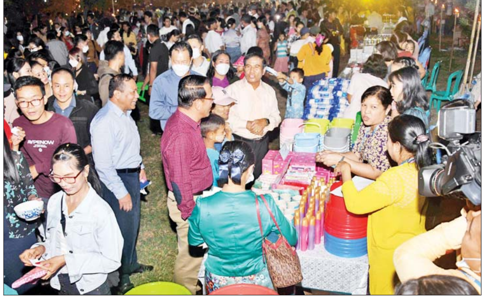
ပြည်ထောင်စုဝန်ကြီး ဦးမောင်မောင်အုန်း နိဗ္ဗာန်ဈေးပွဲတော်တွင် ကြည့်ရှုအားပေးစဉ်။