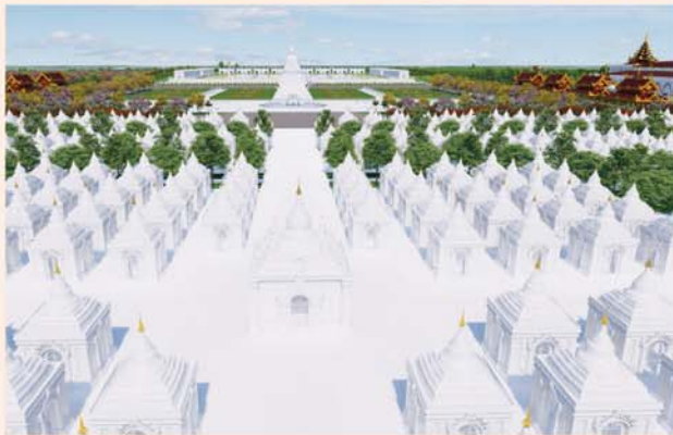
ကျောက်စာရုံစေတီ(၁၂ x ၁၂x ၁၈)ပေ ၁ ဆူ တန်ဖိုး-၂၇၉ သိန်း