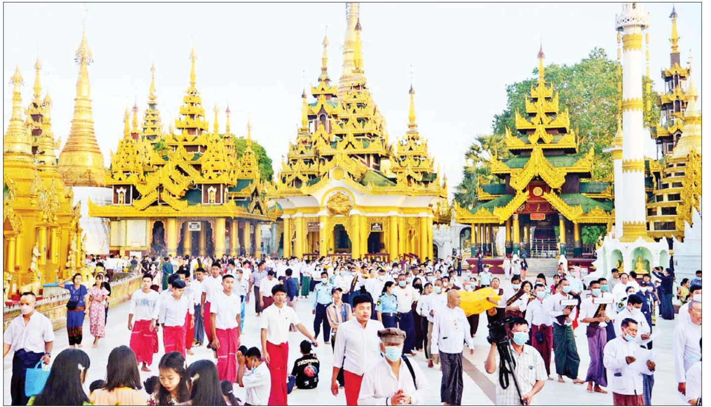
ရွှေတိဂုံစေတီတော် ဘဏ္ဍာတော်ထိန်း ဂေါပကအဖွဲ့ဝင်များ၊ ဘာသာရေးအသင်းအဖွဲ့များနှင့် ဂေါပကရုံးဝန်ထမ်းများက ရွှေတိဂုံစေတီတော်မြတ်ကြီးရှိ ဗုဒ္ဓ ရုပ်ပွားတော်များအား ကပ်လှူပူဇော်မည့် ကထိန်ရွှေကြာသင်္ကန်းများကိုင်ဆောင်၍ စေတီတော်မြတ်ကြီးအား လက်ယာရစ်တစ်ပတ်လှည့်လည်ပူဇော်ကြစဉ်။

ယင်းနောက် ရွှေတိဂုံစေတီတော် ဘဏ္ဍာတော် ထိန်း ဂေါပကအဖွဲ့၊ ဩဝါဒါစရိယ ဆရာတော်ကြီး များထံမှ သာမညဖလအခါတော်နေ့ဆိုင်ရာ တရားတော်များနာကြားခြင်းနှင့် ရေစက်ချအခမ်း အနားကို ရင်ပြင်တော် ရှေးဟောင်းဗုဒ္ဓရုပ်ပွားတော် များ တန်ဆောင်း၌ ဆက်လက်ကျင်းပရာ နိုင်ငံတော် ဩဝါဒါစရိယ၊ ရွှေတိဂုံစေတီတော် ဘဏ္ဍာတော်ထိန်း ဂေါပကအဖွဲ့၏ ဩဝါဒါစရိယ၊ အဘိဓမ္မမဟာဂဠာဂုရု အဂ္ဂမဟာပဏ္ဍိတ အဂ္ဂမဟာဂန္ထဝါစကပဏ္ဍိတ