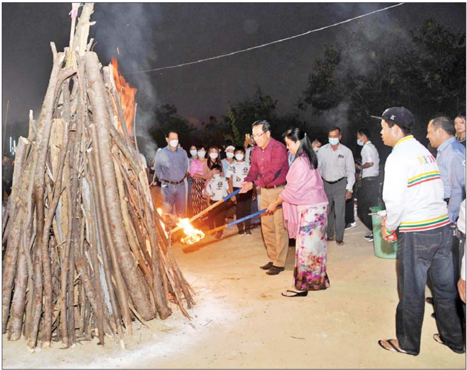
ပြည်ထောင်စုဝန်ကြီး ဦးမောင်မောင်အုန်းနှင့်ဇနီး ဒေါ်ခင်ဆွေဝင်းတို့ ဆီမီးနံ့သာများဖြင့် စုစည်းပူဇော်ရန် မီးထွန်းညှိပေးကြစဉ်။

ထို့နောက် မြန်မာ့အသံနှင့်ရုပ်မြင်သံကြားမှ ဝန်ထမ်းများ၏ တေးဂီတဖျော်ဖြေပွဲ၊ ဝန်ထမ်းများနှင့် မိသားစုများ၏ သီချင်းဆိုပြိုင်ပွဲသို့ တက်ရောက်ကြည့်ရှုအားပေးကာ ဆုများ ချီးမြှင့်ပေးအပ်ခဲ့သည်။ သတင်းစဉ်