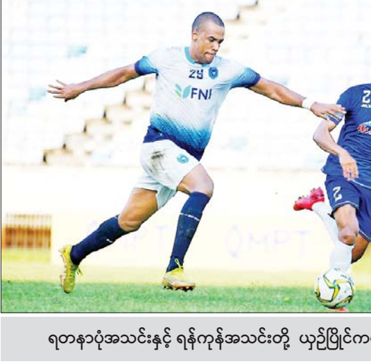
ရတနာပုံအသင်းနှင့် ရန်ကုန်အသင်းတို့ ယှဉ်ပြိုင်ကစားကြစဉ်။

ရန်ကုန်အသင်းသည် ယခုပွဲ အနိုင်ရခဲ့သဖြင့် လက်ကျန်တစ်ပွဲ အလိုတွင် ဒုတိယနေရာရရန် သေချာ သွားခဲ့ပြီး လာမည့်ရာသီ AFC Cup ပြိုင်ပွဲဝင်ခွင့် ရရှိခဲ့သည်။ ရတနာပုံ အသင်းသည် ယခုပွဲ အရေးနိမ့်ခဲ့သဖြင့် ထိပ်ဆုံးငါးသင်းစာရင်းဝင်ရန် ရုန်းကန် ရတော့မည်ဖြစ်သည်။