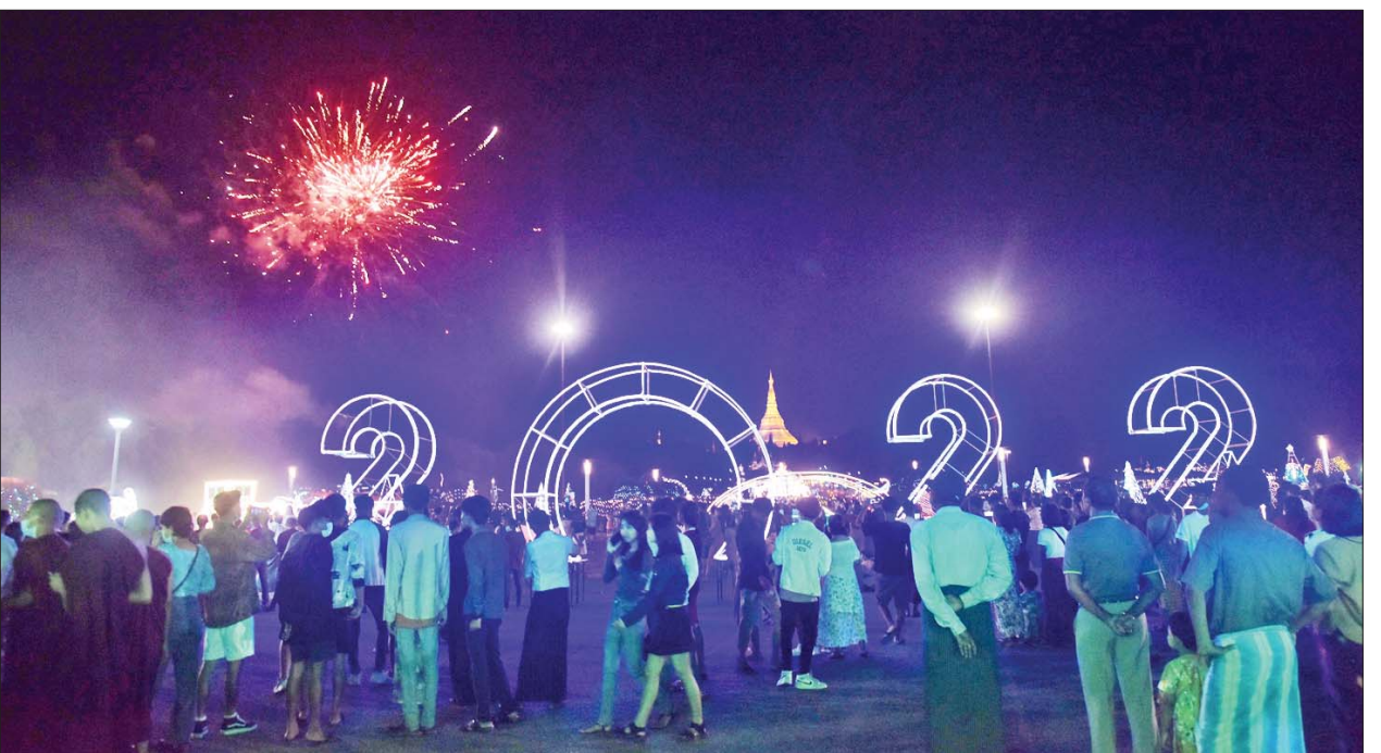
နေပြည်တော် ဥပဂုတ္တမထေရ်မြတ်ကြီးအနီးရှိ တပေါင်းကွင်း၌ FIREWORK အမျိုးအစား မီးရှူးမီးပန်းများ တန်ဆောင်တိုင်ကာလ အခါသမယအဖြစ် ပစ်ဖောက်ပူဇော်ခဲ့ရာ အများပြည်သူများ စိတ်ဝင်တစား လာရောက်ကြည့်ရှုစဉ်။

ထို့အတူ ရှင်ဥပဂုတ္တမထေရ်မြတ် ပူဇော်ပွဲနှင့် မီးမျှောပူဇော်ပွဲများ၊ တန်ဆောင်တိုင် မီးထွန်းပွဲတော်များကိုလည်း တိုင်းဒေသကြီးနှင့် ပြည်နယ်အသီးသီးရှိ ဘုရား၊ စေတီ၊ ပုထိုးများ၌ ကိုဗစ်-၁၉ စည်းမျဉ်း၊ စည်းကမ်းများနှင့် အညီကျင်းပပြုလုပ်ကြရာ အများပြည်သူများ စိတ်အေးချမ်းသာစွာ လာရောက် ထွန်းညှိပူဇော်ဖူးမြော်ကြည်ညိုကြပြီး နိဗ္ဗာန်ဈေးပွဲတော်