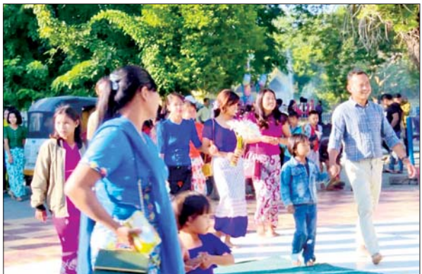
တန်ဆောင်မုန်းလပြည့်နေ့တွင် မန္တလေးမြို့လုံးအနှံ့ ကုသိုလ်ကောင်းမှုပြုကြသူများ၊ အပန်းဖြေအနားယူကြသူများဖြင့် စည်ကားလျက်ရှိသည်ကို တွေ့ရစဉ်။