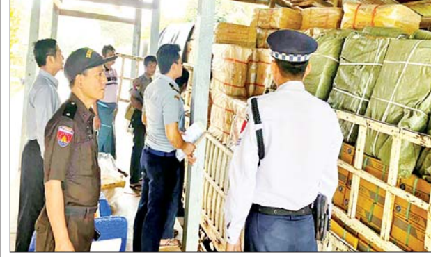
မရမ်းချောင်းအမြဲတမ်းစစ်ဆေးရေးစခန်း၌ သိမ်းဆည်းရမိမှု မှတ်တမ်းဓာတ်ပုံ။

နေပြည်တော် နိုဝင်ဘာ ၇ တရားမဝင် ကုန်သွယ်မှုတိုက်ဖျက်ရေးဦးဆောင်ကော်မတီ၏ ကြီးကြပ်ကွပ်ကဲမှုဖြင့် တရားမဝင် ကုန်သွယ်မှုများကို ဥပဒေနှင့်အညီ ထိရောက်စွာ တားဆီးအရေးယူနိုင်ရေး ဆောင်ရွက်လျက်ရှိရာ နိုဝင်ဘာ ၄ ရက်တွင် အကောက်ခွန်ဦးစီးဌာန၏ စီမံခန့်ခွဲမှုဖြင့် မွန်ပြည်နယ် မရမ်းချောင်းအမြဲတမ်းစစ်ဆေးရေးစခန်း၌ တာဝန်ကျူးပေါင်းစစ်ဆေး ရေးအဖွဲ့က စစ်ဆေးမှုများဆောင်ရွက်ခဲ့ရာ မော်တော်ယာဉ် တစ်စီးပေါ်မှ သွင်းကုန်ကြေညာလွှာ(ID)တွင် ကြေညာထားခြင်းမရှိသော ကြွေပြား ချပ်များ (ခန့်မှန်းတန်ဖိုးငွေကျပ် ၁၉၉၅၀၀၀)နှင့် အဆိုပါပစ္စည်းများ တင်ဆောင်လာသော မော်တော်ယာဉ်တစ်စီးနှင့် နောက်တွဲယာဉ်