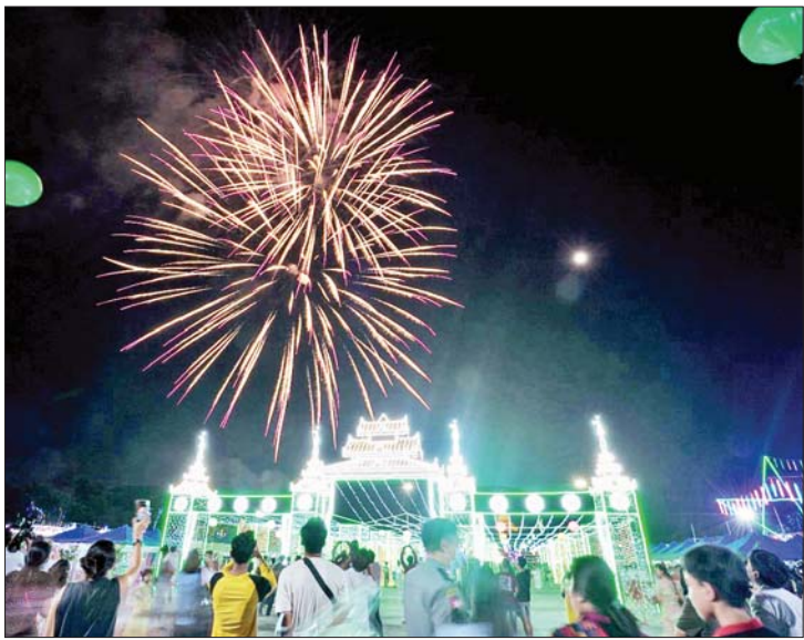
ရန်ကုန်ပြည်သူ့ဥယျာဉ်နှင့် ပြည်သူ့ရင်ပြင်ရှိ ရန်ကုန်တန်ဆောင်တိုင် မီးထွန်းပွဲတော်သို့ လာရောက်ကြည့်ရှုသည့် ပြည်သူများ၊ မီးရှူးမီးပန်းများပစ်ဖောက်မှုကို ကြည့်ရှုသူများဖြင့် စည်ကားလျက်ရှိသည်ကို တွေ့ရစဉ်။ စောရွှေဝိန်း