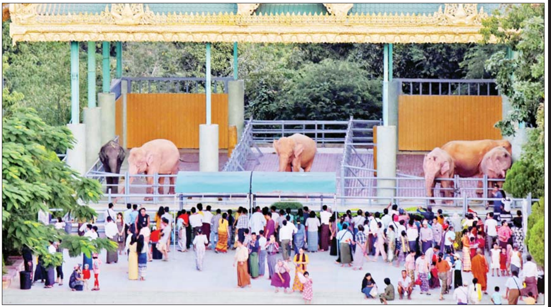
တန်ဆောင်မုန်းလပြည့်နေ့တွင် ဥပ္ပါတသန္တိစေတီတော်၌ထားရှိသည့် ဆင်ဖြူတော်များအား လာရောက်လေ့လာကြည့်ရှုသူများ၊ ဆင်စာကျွေးသူများဖြင့် စည်ကားလျက်ရှိသည်ကို တွေ့ရစဉ်။ သတင်းစဉ်