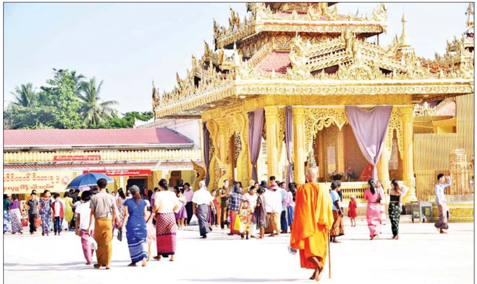
တန်ဆောင်မုန်းလပြည့်နေ့ သာမညဖလအခါတော်နေ့တွင် ဗိုလ်တထောင် ကျိုက်ဒေးအပ်ဆံတော်ဦး စေတီတော်၌ ဘုရားဖူးလာပြည်သူများအား တွေ့ရစဉ်။

သတင်း- ကိုကိုဇော်၊ ကျော်စိုးဝင်း