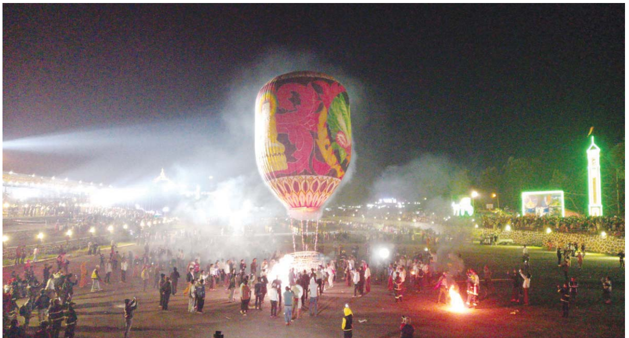
မြင်တွေ့ရသဖြင့် ပြိုင်ပွဲဝင် အသင်းအားလုံးနှင့် ပွဲတော်လာပရိသတ် များအနေဖြင့်လည်း အလွန်ပင်ဝမ်းသာပီတိဖြစ်ကြောင်း ပြိုင်ပွဲဝင် အသင်းခေါင်းဆောင်တစ်ဦးက ပြောကြားသည်။ ခရိုင် (ပြန်/ဆက်)

ပြင်ဦးလွင် နိုဝင်ဘာ ၇ မန္တလေးတိုင်းဒေသကြီး ပြင်ဦးလွင်မြို့တွင် တည်ထားကိုးကွယ်လျက် ရှိသော မဟာအံ့ထူးကံသာ ဆုတောင်းပြည့်ဘုရားကြီး (ပြည်ချစ် ဘုရားကြီး)၏ (၁၆) ကြိမ်မြောက် တန်ဆောင်တိုင်ပွဲတော်၌ နိုဝင်ဘာ ၆ ရက် ညပိုင်းတွင် ညမီးပုံးပျံများ ဝင်ရောက်ယှဉ်ပြိုင်လျက်ရှိ ကြောင်း သိရသည်။ စိန်နားပန်းမီးပုံးပျံများဖြစ်သည့် ဖွင့်ပွဲမီးပုံးပျံ၊ ပညာအလင်းမီး၊ မေတ္တာ ရောင်ခြည်မီး၊ သီရိအောင်မြေမီး၊ နဂါးမီး၊ မေတ္တာမီး၊ အေးချမ်းသာမီး၊ မုဒိတာမီး၊ ဇနက္ကမီး၊ မိုးကြိုးအင်အားမီး၊ ချမ်းမြေ့မီး၊ ဂရုဏာမီး၊ ပရဟိတမီး၊ နန္ဒဝန်မီး၊ သစ္စာမီး၊ ပြည်တော်ဝင်မီး၊ အောင်ပွဲမီးပုံးပျံစသည့် အလုံး ၁၇ လုံးနှင့် ညမီးကျည်မီးပုံးပျံများဖြစ်သည့် လောကပါလမီး၊ မြန်မာ့ရိုးရာမီး၊ မြို့ချစ်မီး၊ အေးချမ်းအောင်မြေမီး၊ ရှမ်းခေမီး၊ သစ္စာမီး၊ မြို့ခိုးမီး၊ တောင်ပေါ်သားမီး၊ တိမ်ယံမီး၊ ပျော်ကြမယ်ဟေ့၊ ပန်းချစ်သူ၊ ရွှေပဒေသာမီး၊ ငြိမ်းချမ်းအောင်မီးနှင့် ရှမ်းတောင်သူမီး စသည့်မီးပုံးပျံ ၁၄ လုံး စုစုပေါင်း ၃၁ လုံးတို့ အသီးသီး ဝင်ရောက်ယှဉ်ပြိုင်လျက်ရှိ ကြသည်။ ယခုလို ပြင်ဦးလွင်တန်ဆောင်တိုင်ပွဲတော်၌ နှစ်စဉ်နှစ်တိုင်း ညမီးပုံးပျံပြိုင်ပွဲများတွင် ဝင်ရောက်ယှဉ်ပြိုင်ခြင်းကြောင့် မီးပလုတ် တုတ်များချိတ်ဆွဲကာ စိန်နားပန်းမီးပုံးပျံများလွှတ်တင်ခြင်းနှင့် မီးရှူး မီးပန်းများပစ်ဖောက်၍ လွှတ်တင်သော ညမီးကျည်မီးပုံးပျံများကို