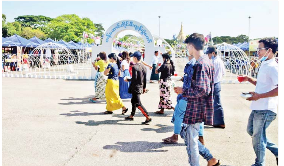
ရန်ကုန်မြို့ ပြည်သူ့ရင်ပြင်ရှိ ဈေးရောင်းပွဲတော်လာ ပြည်သူများဖြင့် စည်ကားလျက်ရှိသည်ကို တွေ့ရစဉ်။