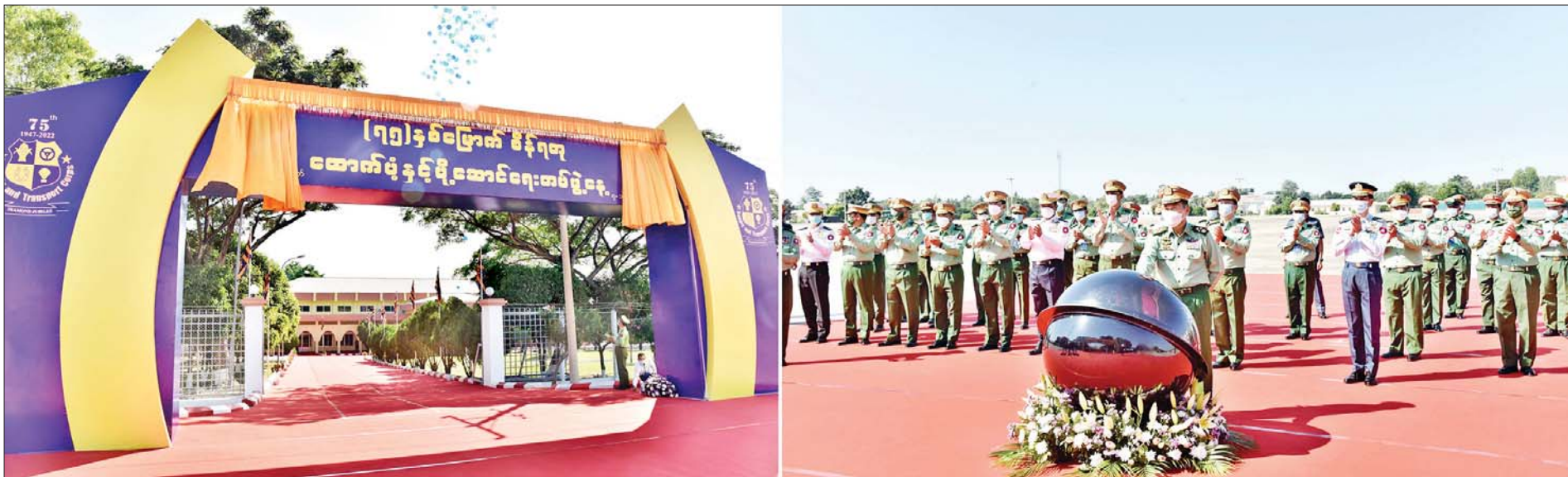
နိုင်ငံတော်စီမံအုပ်ချုပ်ရေးကောင်စီ ဒုတိယဥက္ကဋ္ဌ ဒုတိယတပ်မတော်ကာကွယ်ရေးဦးစီးချုပ် ကာကွယ်ရေးဦးစီးချုပ် (ကြည်း) ဒုတိယဗိုလ်ချုပ်မှူးကြီးစိုးဝင်း (၇၅)နှစ်မြောက် စိန်ရတုထောက်ပံ့နှင့်ပို့ဆောင်ရေး တပ်ဖွဲ့နေ့ဆိုင်းဘုတ်ကို စက်ခလုတ်နှိပ်ဖွင့်လှစ်ပေးစဉ်။

★ ကျောပုံးမှ ကောင်စီအဖွဲ့ဝင်များ၊ ကာကွယ်ရေးဦးစီးချုပ်ရုံးမှ တပ်မတော်အရာရှိကြီးများ၊ နေပြည်တော်တိုင်း စစ်ဌာနချုပ် တိုင်းမှူး၊ အငြိမ်းစားထောက်ပံ့နှင့် ပို့ဆောင်ရေးတပ်ဖွဲ့ဝင် အရာရှိကြီးများ၊ ထောက်ပံ့ နှင့်ပို့ဆောင်ရေးတပ်ဖွဲ့ဝင်များနှင့် ဖိတ်ကြားထား သူများ တက်ရောက်ကြသည်။ ဦးစွာ ကာကွယ်ရေးဦးစီးချုပ်ရုံး(ကြည်း)မှ စစ်ထောက်ချုပ် ဒုတိယဗိုလ်ချုပ်ကြီးကျော်စွာလင်း၊ ထောက်ပံ့နှင့် ပို့ဆောင်ရေးညွှန်ကြားရေးမှူး ဗိုလ်ချုပ် ဝင်းမြတ်နှင့် တိုင်းမှူး ဗိုလ်ချုပ်ဇော်ဟိန်းတို့က (၇၅)နှစ်မြောက်စိန်ရတု ထောက်ပံ့နှင့်ပို့ဆောင်ရေး