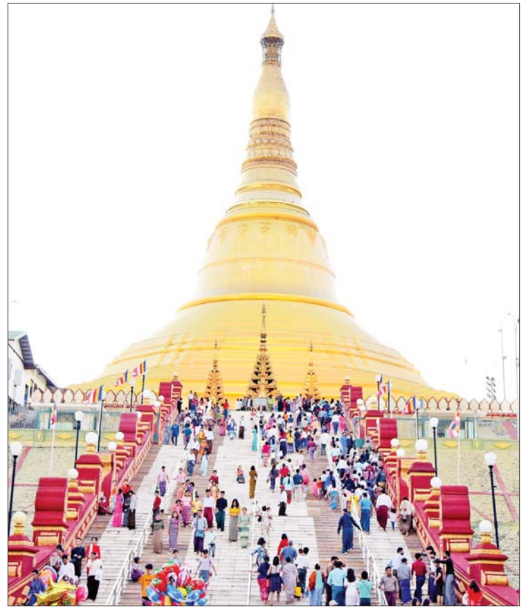
ဥပုတသန္တိစေတီတော်မြတ်ကြီး၌ ဘုရားဖူးလာရောက်ကြသူများဖြင့် စည်ကားလျက်ရှိသည်ကို တွေ့ရစဉ်။