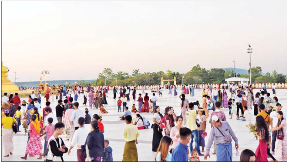
တန်ဆောင်မုန်းလပြည့်နေ့တွင် ဥပ္ပါတသန္တိစေတီတော်မြတ်ကြီး ရင်ပြင်တော်၌ ဘုရားဖူးလာပြည်သူများဖြင့် စည်ကားလျက်ရှိသည်ကို တွေ့ရစဉ်။ သတင်းစဉ်