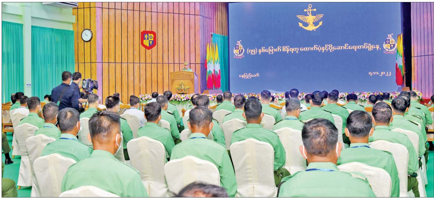
နိုင်ငံတော်စီမံအုပ်ချုပ်ရေးကောင်စီ ဒုတိယဥက္ကဋ္ဌ ဒုတိယဝန်ကြီးချုပ် ဒုတိယဗိုလ်ချုပ်မှူးကြီးစိုးဝင်း(၇၅)နှစ်မြောက် စိန်ရတု ထောက်ပံ့နှင့်ပို့ဆောင်ရေးတပ်ဖွဲ့နေ့ အခမ်းအနားတွင် ဂုဏ်ပြုအမှာစကားပြောကြားစဉ်။

နေပြည်တော် နိုဝင်ဘာ ၇ (၇၅)နှစ်မြောက်စိန်ရတုထောက်ပံ့နှင့် ပို့ဆောင်ရေးတပ်ဖွဲ့နေ့ အခမ်းအနားကို ယနေ့နံနက်ပိုင်းတွင် နေပြည်တော် စစ်ကြောရေးနှင့် တည်ခိုးရေးစခန်းရှိ ဆင်ဖြူရှင်ခန်းမ၌ ကျင်းပရာ နိုင်ငံတော် စီမံအုပ်ချုပ်ရေးကောင်စီ ဒုတိယဥက္ကဋ္ဌ ဒုတိယတပ်မတော်ကာကွယ်ရေးဦးစီးချုပ် ကာကွယ်ရေးဦးစီးချုပ်(ကြည်း) ဒုတိယ ဗိုလ်ချုပ်မှူးကြီးစိုးဝင်း တက်ရောက် ချီးမြှင့်သည်။ တက်ရောက် အဆိုပါ (၇၅)နှစ်မြောက် စိန်ရတု ထောက်ပံ့နှင့် ပို့ဆောင်ရေးတပ်ဖွဲ့နေ့ အခမ်းအနားသို့ နိုင်ငံတော်စီမံအုပ်ချုပ် ရေးကောင်စီဒုတိယဥက္ကဋ္ဌ ဒုတိယ တပ်မတော် ကာကွယ်ရေးဦးစီးချုပ် ကာကွယ်ရေးဦးစီးချုပ်(ကြည်း)နှင့်အတူ နိုင်ငံတော် စီမံအုပ်ချုပ်ရေးကောင်စီ အတွင်းရေးမှူး၊ နိုင်ငံတော်စီမံအုပ်ချုပ်ရေး စာမျက်နှာ ၄ ကော်လံ ၁ သို့ ။