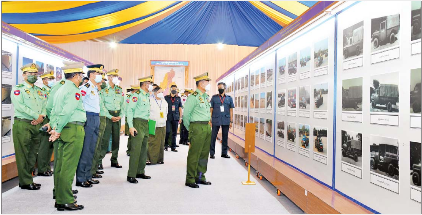
နိုင်ငံတော်စီမံအုပ်ချုပ်ရေးကောင်စီ ဒုတိယဥက္ကဋ္ဌ ဒုတိယတပ်မတော်ကာကွယ်ရေးဦးစီးချုပ် ကာကွယ်ရေးဦးစီးချုပ် (ကြည်း) ဒုတိယဗိုလ်ချုပ်မှူးကြီးစိုးဝင်း (၇၅)နှစ်မြောက် စိန်ရတုထောက်ပံ့နှင့်ပို့ဆောင်ရေးတပ်ဖွဲ့ နေ့ အထိမ်းအမှတ်ပြခန်းအတွင်း လှည့်လည်ကြည့်ရှုစဉ်။

ထောက်ပံ့နှင့်ပို့ဆောင်ရေးတပ်ဖွဲ့၏ အဓိက လုပ်ငန်းများထဲတွင် “ဝန်တင်တိရစ္ဆာန်မွေးမြူ