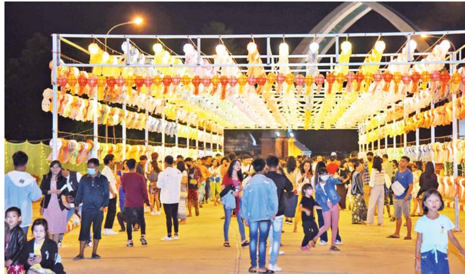
နေပြည်တော် ရေပန်းဥယျာဉ်၌ လာရောက်လည်ပတ်ကြသူများဖြင့် စည်ကားလျက်ရှိသည်ကို တွေ့ရစဉ်။