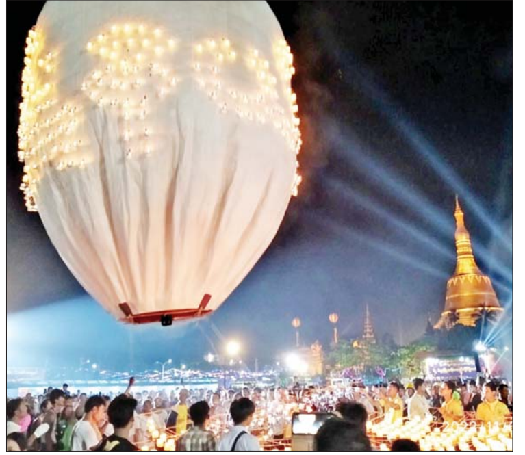
ပဲခူးမြို့ တန်ဆောင်တိုင်မီးထွန်းပွဲတော်တွင် ပျော်ရွှင်စွာဆင်နွှဲနေကြသူများကို တွေ့ရစဉ်။

* ရှေးဦးမှ ဆောင်ရွက်ကြပြီး ဘုရား၊ စေတီ၊ ပုထိုးများ၌လည်း စိတ်အေးချမ်းသာစွာ ဖူးမြော်ကြည်ညိုခြင်းများကို ပြုလုပ်ကြသည်။