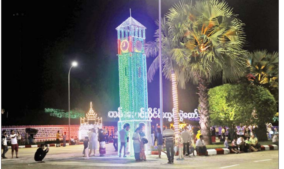
မန္တလေးမြို့ ရတနာပုံဥယျာဉ်အတွင်း၌ ရောင်စုံမီးအလှများဖြင့် မီးထွန်းပွဲတော်ကို သာယာလှပစွာ ပြုလုပ်ထားသည်ကို တွေ့ရစဉ်။