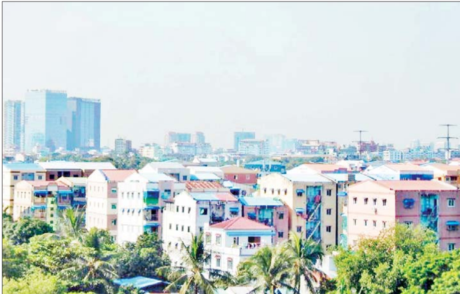
ရန်ကုန်မြို့ရှိအထပ်မြင့်အဆောက်အအုံများကို တွေ့ရစဉ်။

လက်ရှိ မြန်မာနိုင်ငံအိမ်ခြံမြေလုပ်ငန်းဖွံ့ဖြိုး တိုးတက်ရေးအသင်းက သင်တန်းသားဦးရေ စုစုပေါင်း ၃၀၀၀ နီးပါးမွေးထုတ်ပေးနိုင်ခဲ့ပြီဖြစ်သည်။ အသင်း မဝင်ရသေးသော အိမ်ခြံမြေအကျိုးဆောင်များအနေ ဖြင့်လည်း အသင်းဝင်အဖြစ်ဆောင်ရွက်နိုင်ကြမည် ဖြစ်ပြီး အသင်းဝင်ဖြစ်ပါက အိမ်ခြံမြေပညာပေး သင်တန်းများ တက်ရောက်နိုင်ကြမည်ဖြစ်ကာ သင်တန်းများကို စဉ်ဆက်မပြတ်အခမဲ့လှစ်ပို့ ချပေးသွားမည်ဖြစ်ကြောင်း မြန်မာနိုင်ငံအိမ်ခြံမြေ လုပ်ငန်း ဖွံ့ဖြိုးတိုးတက်ရေးအသင်း(MRPDA) ဥက္ကဋ္ဌ ဦးအောင်ထွန်းထံမှသိရသည်။ သတင်း - ပွင့်သစ္စာ