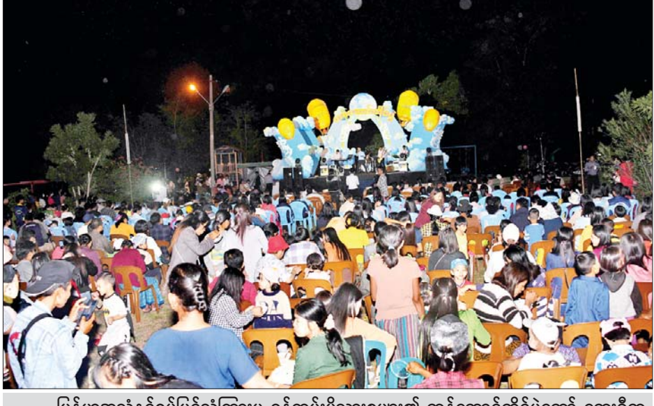
မြန်မာ့အသံနှင့်ရုပ်မြင်သံကြားမှ ဝန်ထမ်းမိသားစုများ၏ တန်ဆောင်တိုင်ပွဲတော် တေးဂီတဖျော်ဖြေပွဲတွင် ပျော်ရွှင်စွာဆင်နွှဲနေကြစဉ်။