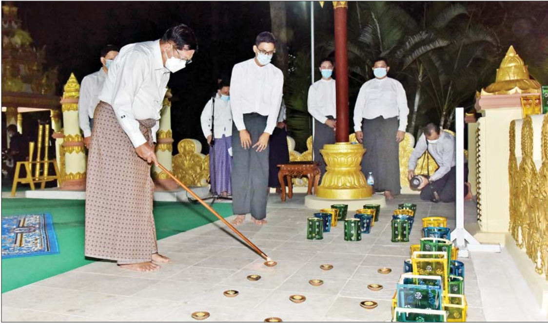
နိုင်ငံတော်စီမံအုပ်ချုပ်ရေးကောင်စီဥက္ကဋ္ဌ နိုင်ငံတော်ဝန်ကြီးချုပ် ဗိုလ်ချုပ်မှူးကြီးမင်းအောင်လှိုင် နေပြည်တော်ကောင်စီ နယ်မြေ ဇေယျာသီရိမြို့နယ်အတွင်းရှိ ရွှေဘုန်းပွင့်စေတီတော်မြတ်ကြီးအား ဆီမီးထွန်းညှိပူဇော်စဉ်။