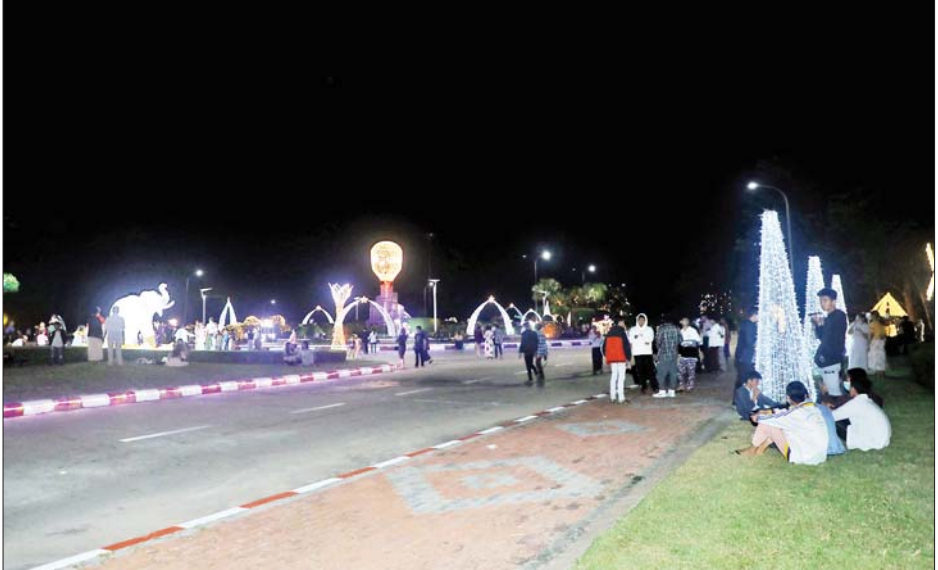
ကာကွယ်ရေးဦးစီးချုပ်ရုံး(ကြည်း)ဝင်းအတွင်း၌ ရောင်စုံမီးအလှများဖြင့် မီးထွန်းပွဲတော်ကို သာယာလှပစွာ ပြုလုပ်ထားသည်ကို တွေ့ရစဉ်။

အများပြည်သူများ အနေဖြင့် စိတ်ဝင်တစား လာရောက်ကြည့်ရှုခဲ့ကြပြီး အမှတ်တရဓာတ်ပုံရိုက်ခြင်းများ ပြုလုပ်ခဲ့ကြကာ တန်ဆောင်မုန်းလပြည့်နေ့ အခါသမယကို နိုင်ငံတစ်ဝန်းလုံးတွင် ပျော်ရွှင်ကြည်နူးစွာ ဆင်နွှဲခဲ့ကြကြောင်း သိရသည်။ သတင်းစဉ်