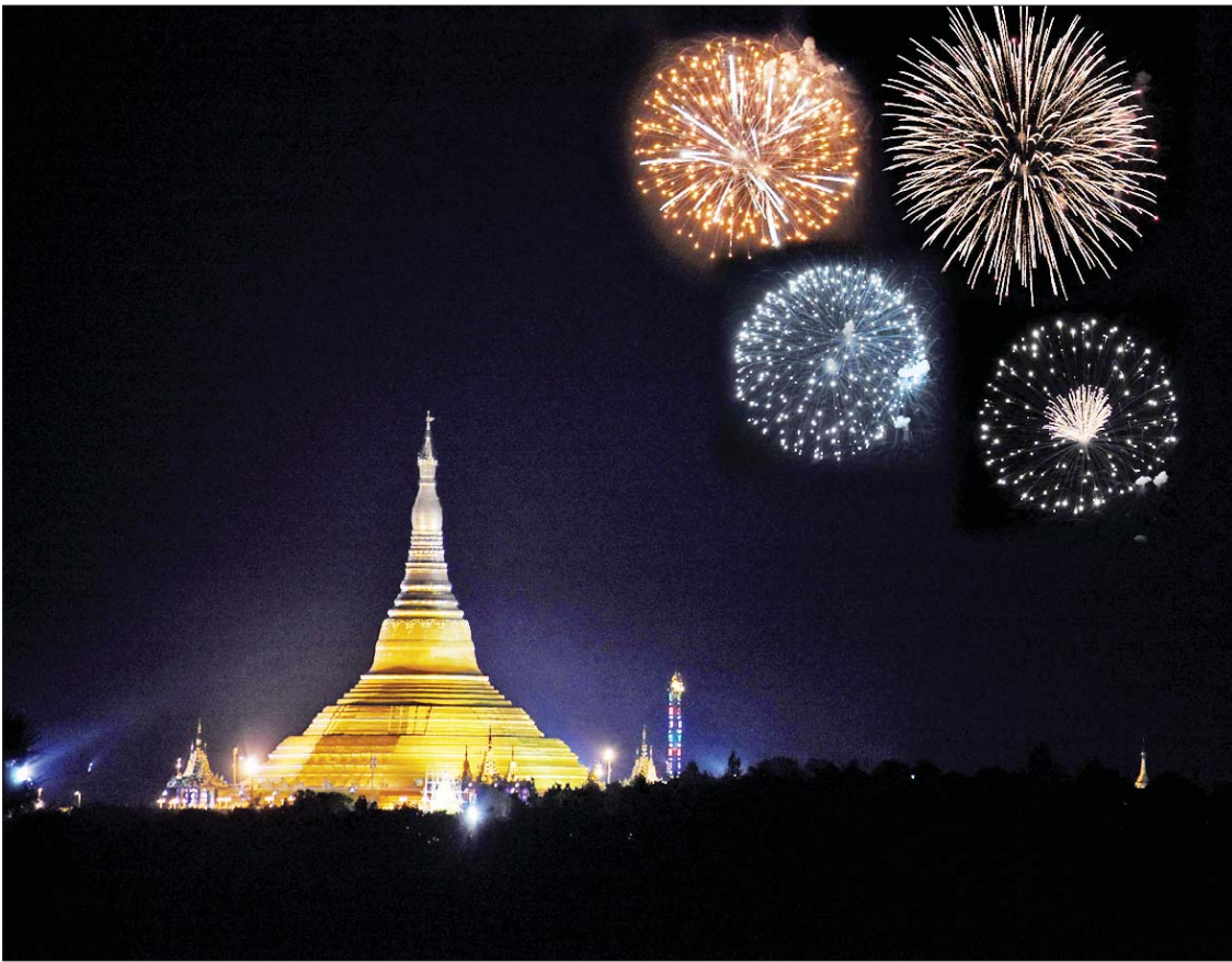
ဥပုတသန္တိစေတီတော်မြတ်ကြီးအနီးရှိ တပေါင်းကွင်း၌ မီးရှူး၊ မီးပန်းများ ပစ်ဖောက်စဉ်။