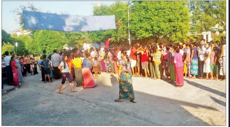
တန်ဆောင်မုန်းလပြည့်နေ့တွင် နေပြည်တော် ဇေယျာသီရိမြို့နယ် ခရေပင်လမ်း၌ နေပြည်တော် သတင်းစာတိုက်မှ ဝန်ထမ်းမိသားစုများ နိဗ္ဗာန်ဈေးပွဲတော်ကို ပျော်ရွှင်စွာဆင်နွှဲကြစဉ်။ ကောင်းမြတ်ကျော်