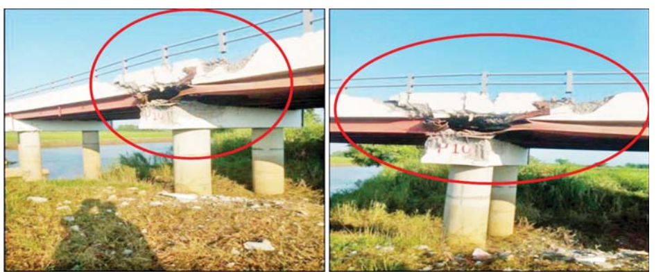
ချောမွေ့စေရန် ဆောက်လုပ်ထားသည့် သံကူကွန်ကရစ်ချောင်းကူးတံတားကို မိုင်းထောင်ဖောက်ခွဲပျက်ဆီးခဲ့သူ အကြမ်းဖက်သမားများအား ဖော်ထုတ်ဖမ်းဆီးအရေးယူနိုင်ရေး လုံခြုံရေးတပ်ဖွဲ့ဝင်များက ဆက်လက်ဆောင်ရွက်လျက်ရှိကြောင်း သိရသည်။ သတင်းစဉ်

အဖွဲ့(စိစစ်ဆဲ)က မိုင်းထောင်ဖောက်ခွဲပျက်ဆီးသွားခဲ့ကြောင်း သတင်းအရ လုံခြုံရေးတပ်ဖွဲ့ဝင်များက သွားရောက်စစ်ဆေးခဲ့ရာ အဆိုပါတံတားတွင် မိုင်းပေါက်ကွဲမှုကြောင့် ကျောက်တန်းကျေးရွာဘက်ခြမ်းမှ တံတားပေ ၆၀ ခန့်တွင် ဝဲဘက်ကြမ်းခင်းလေးပေပတ်လည်ခန့်၊ တံတားလက်ရန်းတိုင်သုံးတိုင်နှင့် တံတားထောက်တိုင်အမှတ် P-10 အပေါ်ရှိ သံပေါင်ပျက်စီးနေသည်ကို တွေ့ရှိရပြီး မော်တော်ယာဉ် ဖြတ်သန်းသွားလာမှုများ ပြတ်တောက်မှုမရှိကြောင်းနှင့် တာဝန်ရှိသူများက တံတားကို ပြန်လည်ပြုပြင်ခြင်းများ ဆောင်ရွက်လျက်ရှိကြောင်း သိရသည်။ ထိုသို့ အများပြည်သူများသွားလာရေး အဆင်ပြေ