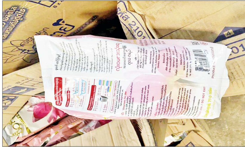
အကောက်ခွန်ဦးစီးဌာနမှ မြဝတီ-ဘားအံ-ရန်ကုန်ကားလမ်း ပဲခူးစက်မှုဇုန်ရှေ့၌ သိမ်းဆည်းရမိမှု မှတ်တမ်းဓာတ်ပုံ။

နေပြည်တော် နိုဝင်ဘာ ၆ တရားမဝင် ကုန်သွယ်မှုတိုက်ဖျက်ရေးဦးဆောင်ကော်မတီ၏ ကြီးကြပ်ကွပ်ကဲမှုဖြင့် တရားမဝင် ကုန်သွယ်မှုများကို ဥပဒေနှင့်အညီ ထိရောက်စွာ တားဆီးရေးအဖွဲ့အစည်းများ ဆောင်ရွက်လျက်ရှိရာတွင် နိုဝင်ဘာ ၂ ရက်တွင် အကောက်ခွန်ဦးစီးဌာန၏ စီမံခန့်ခွဲမှုဖြင့် တာဝန်ကျစစ်ဆေးရေးအဖွဲ့က မြဝတီ - ဘားအံ - ရန်ကုန်ကားလမ်း ပဲခူးစက်မှုဇုန်ရှေ့၌ စစ်ဆေးမှုများဆောင်ရွက်ခဲ့ရာ မော်တော်ယာဉ်တစ်စီးပေါ်မှ သွင်းကုန်ကြေညာလွှာ (ID) တွင် ကြေညာထားသည်ထက် ပိုမိုပါရှိလာသော တိရစ္ဆာန်အစာ ၄၀၀၀ ကီလိုဂရမ်နှင့် သွင်းကုန်ကြေညာလွှာ (ID) တွင် ကြေညာထားခြင်းမရှိသော အဝတ်လျှော်ဆပ်ပြာမှုန့် ၁၀၃၇၀ ကီလိုဂရမ် (ခန့်မှန်းတန်ဖိုးငွေကျပ် ၁၂၀၇၀၈၀၀) ကို လည်းကောင်း၊ အဆိုပါပစ္စည်းများ တင်ဆောင်လာသော မော်တော်ယာဉ်တစ်စီးနှင့် နောက်တွဲယာဉ်တစ်စီး (ခန့်မှန်းတန်ဖိုးငွေကျပ် ၅၀၀၀၀၀၀) ကို လည်းကောင်း၊ စုစုပေါင်းခန့်မှန်းတန်ဖိုးငွေကျပ် ၆၂၀၇၀၈၀၀ ကို သိမ်းဆည်းရမိခဲ့ပြီး အကောက်ခွန်လုပ်ထုံးလုပ်နည်းနှင့်အညီ အရေးယူဆောင်ရွက်လျက်ရှိပါသည်။ အလားတူ နိုဝင်ဘာ ၅ ရက်တွင် ရှမ်းပြည်နယ် တရားမဝင်ကုန်သွယ်မှုတိုက်ဖျက်ရေးအဖွဲ့၏ စီမံခန့်ခွဲမှုဖြင့် ကျိုင်းတုံမြို့နယ် နောင်နှစ်ပူးပေါင်းစစ်ဆေးရေးဂိတ်၌ တာဝန်ကျပူးပေါင်းစစ်ဆေးရေးအဖွဲ့က စစ်ဆေးမှုများဆောင်ရွက်ခဲ့ရာ တာချီလိတ်မြို့မှ တောင်ကြီးမြို့သို့ မောင်းနှင်