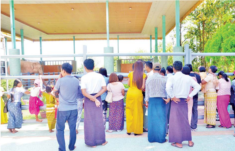
တန်ဆောင်မုန်းလဆန်းအဖိတ်နေ့တွင် ရဋ္ဌနန္ဒက ဆင်ဖြူတော်လေးအပါအဝင် အခြားဆင်ဖြူတော်များနှင့် အဖော်ဆင်များအား အစာလာရောက်ကျွေးမွေးကြသူများကို တွေ့ရစဉ်။