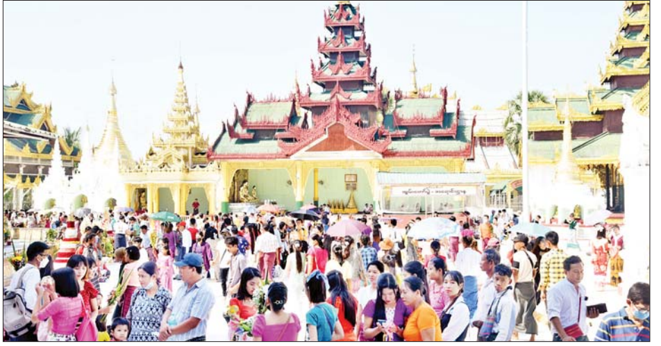
တန်ဆောင်မုန်းလဆန်းအဖိတ်နေ့တွင် ရန်ကုန်မြို့ ရွှေတိဂုံစေတီတော်၌ ဘုရားဖူးလာပြည်သူများဖြင့် စည်ကားများပြားလျက်ရှိသည်ကို တွေ့ရစဉ်။