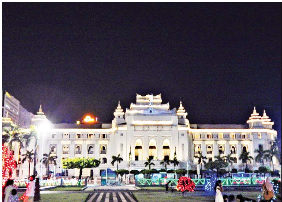
ရုံးပိတ်ရက် တန်ဆောင်တိုင်ကာလဖြစ်သော နိုဝင်ဘာ ၆ ရက်ညပိုင်းက ရန်ကုန်မြို့ ကျောက်တံတား မြို့နယ် မဟာဗန္ဓုလလမ်းရှိ ရန်ကုန်မြို့တော်ခန်းမအား အလှူမီးများ ဆင်ယင်ထွန်းညှိထားစဉ်။ ပွင့်သစ္စာ