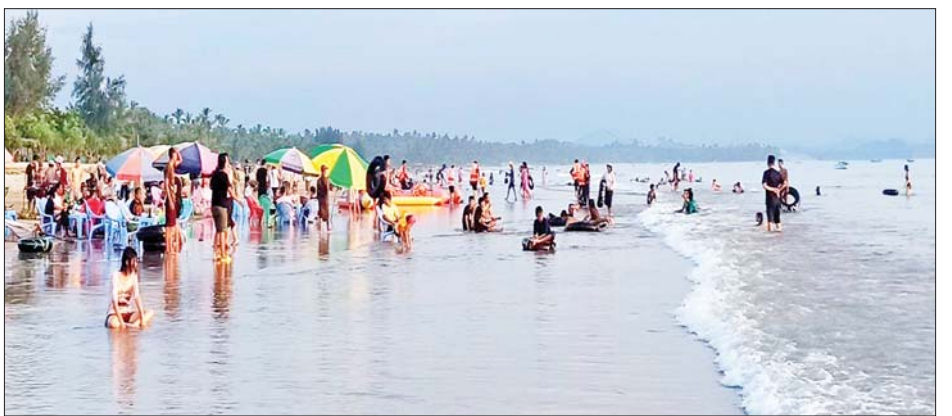
တန်ဆောင်မုန်းလဆန်းအဖိတ်နေ့တွင် ပုသိမ်မြို့ ချောင်းသာကမ်းခြေနှင့် ငွေဆောင်ကမ်းခြေတို့၌ လာရောက်အပန်းဖြေသူများဖြင့် စည်ကားများပြားလျက်ရှိသည်ကို တွေ့ရစဉ်။