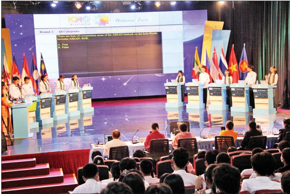
ဇွန် ၁ ရက်က မြန်မာ့အသံနှင့် ရုပ်မြင်သံကြားတွင် ကျင်းပခဲ့သည့် ဆန်ခါတင်အဆင့် ကျောင်းသား ကျောင်းသူ ၁၀ ဦးတို့ ပါဝင်ယှဉ်ပြိုင်နေစဉ်။

အဆိုပါ ပြိုင်ပွဲတွင် ကျောင်းသား ကျောင်းသူ ငါးဦးအား အသိုက်အဝန်းမထူပြင် (၃)ရပ်ဖြစ်သည့် အာဆီယံနိုင်ငံရေးနှင့် လုံခြုံရေးဆိုင်ရာ အသိုက် အဝန်း(APSC)၊ အာဆီယံစီးပွားရေးဆိုင်ရာ အသိုက် အဝန်း(AEC)နှင့် အာဆီယံလူမှုရေး-ယဉ်ကျေးမှု ဆိုင်ရာ အသိုက်အဝန်း(ASCC) မထူပြင်တို့၏ တာဝန်ခံ ဝန်ကြီးဌာနများမှ ဘာသာရပ်ဆိုင်ရာ ကျွမ်းကျင်သူ အဆင့်မြင့်အရာရှိကြီးများ၊ ရန်ကုန်ပညာရေး တက္ကသိုလ် အင်္ဂလိပ်စာဌာနနှင့် ရန်ကုန်တက္ကသိုလ် နိုင်ငံတကာဆက်ဆံရေးဌာနတို့မှ ကျွမ်းကျင်ပညာရှင် များဖြင့် အွန်လိုင်းမှတစ်ဆင့် လေ့ကျင့်သင်ကြားမှု များ၊ စစ်ဆေးမှုများ ဆောင်ရွက်ခဲ့ကြပြီး အကဲဖြတ်ခိုင် အဖွဲ့က နိုင်ငံကိုယ်စားပြု ပြိုင်ပွဲတွင် ကျောင်းသား