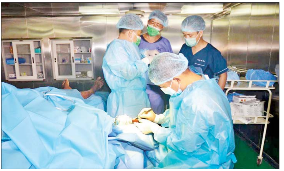
ECG ဖြင့် နှလုံးစစ်သပ်လူနာ ၃၉ ဦးနှင့် ဓာတ်ခွဲ ကုသပေးခြင်းများ ဆောင်ရွက်ပေးနိုင်ခဲ့ကြောင်း စစ်သပ်လူနာ ၂၂ ဦးတို့ကို ရောဂါရှာဖွေစစ်သပ် သိရသည်။ သတင်းစဉ်

ထို့အပြင် ဓာတ်မှန်ရိုက် လူနာ ၁၁ ဦး၊ အာထရာဆောင်းဖြင့် စစ်သပ်စစ်ဆေးလူနာ ၂၀၊