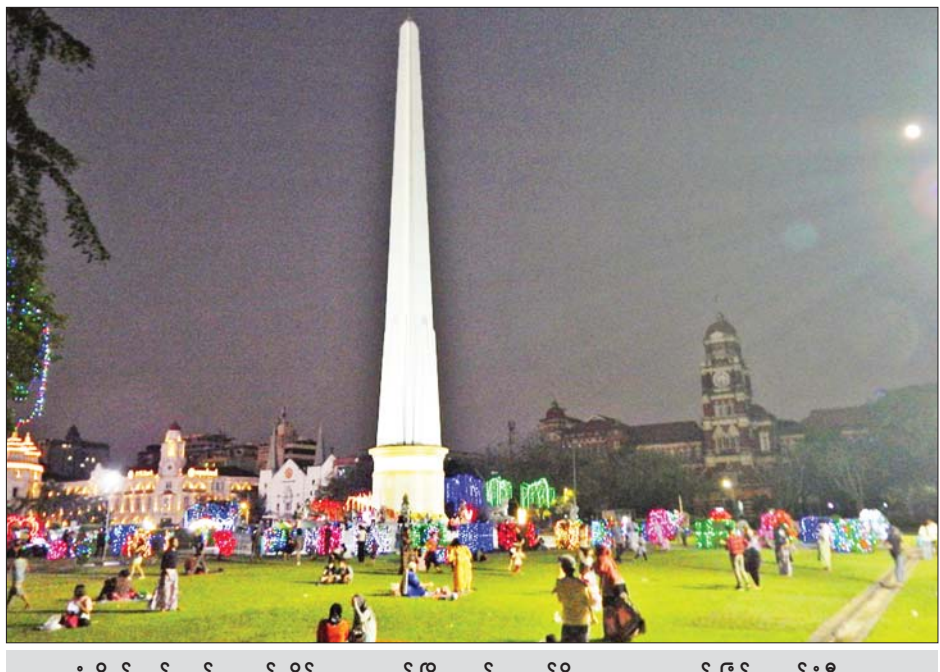
ရုံးပိတ်ရက် တန်ဆောင်တိုင်ကာလတွင် မြို့လယ်ကောင်ရှိ မဟာဗန္ဓုလလမ်းခြေ၌ ရောင်စုံမီးအလှူများ ထွန်းညှိထားရာ လာရောက်အပ်နှံဖြေအနားယူကြသူများဖြင့် စည်ကားနေသည်ကို နိုဝင်ဘာ ၆ ရက်ညပိုင်းက တွေ့ရစဉ်။ စိုးမြင့်အောင်