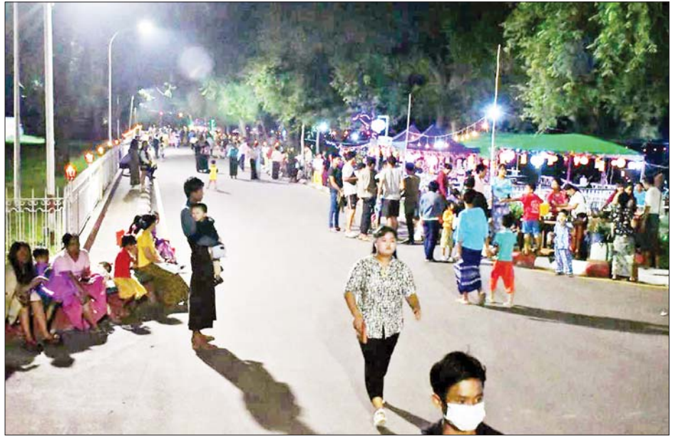
တန်ဆောင်မုန်းလဆန်းအဖိတ်နေ့တွင် မန္တလေးမြို့၌ ပြည်သူများဖြင့် စည်ကားများပြားလျက်ရှိသည်ကို တွေ့ရစဉ်။