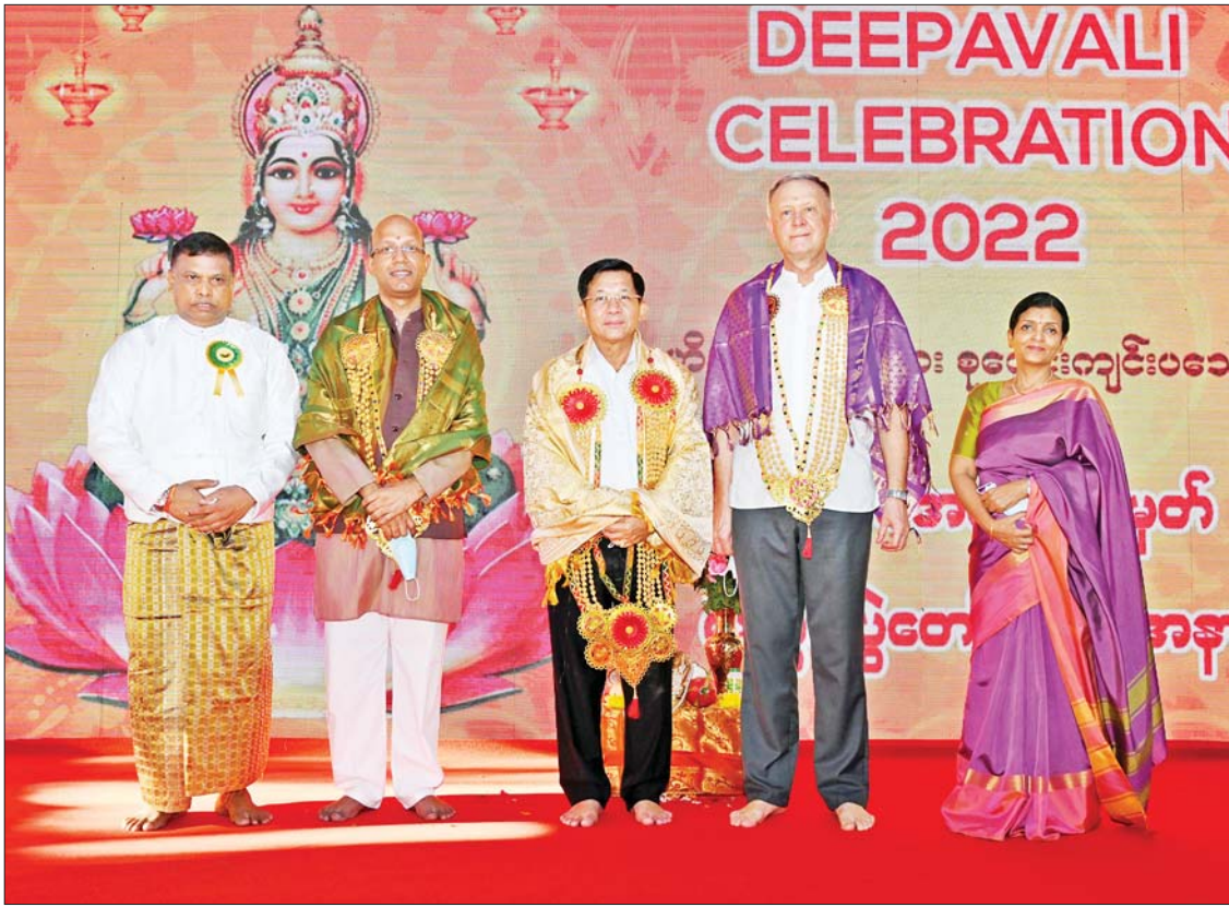
နိုင်ငံတော်စီမံအုပ်ချုပ်ရေးကောင်စီဥက္ကဋ္ဌ နိုင်ငံတော်ဝန်ကြီးချုပ် ဗိုလ်ချုပ်မှူးကြီးမင်းအောင်လှိုင်၊ မြန်မာနိုင်ငံဆိုင်ရာ အိန္ဒိယနိုင်ငံသံအမတ်ကြီးနှင့်ဇနီး၊ ရှာဖွေဖက်ဒရေရှင်းနိုင်ငံ သံအမတ်ကြီး၊ ဟိန္ဒူရိုးရာ ဒီပေါလီပွဲတော်ကျင်းပရေးကော်မတီ ဥက္ကဋ္ဌ ဦးဇော်ဇော်နိုင်တို့ စုပေါင်းမှတ်တမ်းတင်ဓာတ်ပုံရိုက်ကြစဉ်။

ထို့ကြောင့် ကိုးကွယ်ယုံကြည်မှု ဆိုင်ရာ အဓိကဘာသာကြီး လေးဘာသာ ရှိသည့်အနက် ဘာသာအသီးသီးတို့၏ ဘာသာရေးအခမ်းအနားများ ဆောင်ရွက် ကြရာတွင် နိုင်ငံတော်အစိုးရအနေဖြင့် လိုအပ်သည့် အကူအညီ အထောက်အပံ့