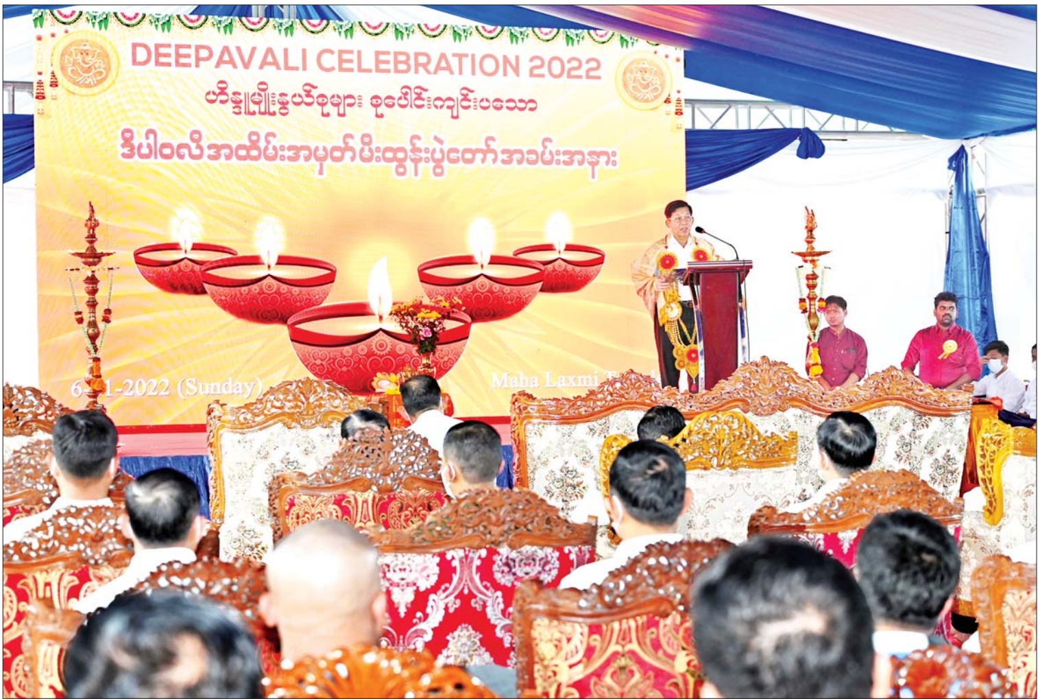
နိုင်ငံတော်စီမံအုပ်ချုပ်ရေးကောင်စီဥက္ကဋ္ဌ နိုင်ငံတော်ဝန်ကြီးချုပ် ဗိုလ်ချုပ်မှူးကြီးမင်းအောင်လှိုင် ဟိန္ဒူရိုးရာ ဒီပါဝလီမီးထွန်းပွဲတော်သို့ တက်ရောက်ချီးမြှင့်ခြင်းနှင့် ပတ်သက်၍ ပြောကြားစဉ်။

ကပ်လှူပူဇော် ဦးစွာ နိုင်ငံတော်စီမံအုပ်ချုပ်ရေး ကောင်စီဥက္ကဋ္ဌ နိုင်ငံတော်ဝန်ကြီးချုပ်နှင့် အဖွဲ့ဝင်များအား ဟိန္ဒူရိုးရာ ဒီပါဝလီပွဲတော် ကျင်းပရေးကော်မတီဥက္ကဋ္ဌ ဦးဇော်ဇော်နိုင် နှင့် တာဝန်ရှိသူများက ကြိုဆိုနှုတ်ဆက် ကြသည်။ ယင်းနောက် နိုင်ငံတော်စီမံ အုပ်ချုပ်ရေးကောင်စီဥက္ကဋ္ဌ နိုင်ငံတော် ဝန်ကြီးချုပ်နှင့် အဖွဲ့ဝင်များသည် ဘုရား ကျောင်းအတွင်း မဟာဗောဓိညောင်ပင်ရှိ ဗုဒ္ဓရုပ်ပွားတော်မြတ်အား ပန်း၊ ရေချမ်း၊ ဆီမီးတို့ဖြင့် ကပ်လှူပူဇော်သည်။ ထို့နောက် သျှိုမဟာလက်ချမ်း မယ်တော် ကြီးရုပ်တုအား ဟိန္ဒူရိုးရာအစဉ်အလာနှင့် အညီ ပူဇော်ကြသည်။ ဆက်လက်ပြီး အခမ်းအနားအစီအစဉ် အရ ဟိန္ဒူရိုးရာအစဉ်အလာများနှင့်အညီ ပူဇော်ကန်တော့ခြင်းများ ဆောင်ရွက်ကြ သည်။ ယင်းနောက် နိုင်ငံတော်စီမံအုပ်ချုပ် ရေးကောင်စီဥက္ကဋ္ဌ နိုင်ငံတော်ဝန်ကြီးချုပ်၊ မြန်မာနိုင်ငံဆိုင်ရာ အိန္ဒိယနိုင်ငံသံအမတ် ကြီးနှင့် ရှုရှားဖက်ဒရေးရှင်းနိုင်ငံသံအမတ် ကြီးတို့အား ပွဲတော်ကျင်းပရေးကော်မတီ ဥက္ကဋ္ဌ ဦးဇော်ဇော်နိုင်က ဟိန္ဒူရိုးရာ ထုံးတမ်းစဉ်လာများအရ ရိုးရာပန်းကုံး