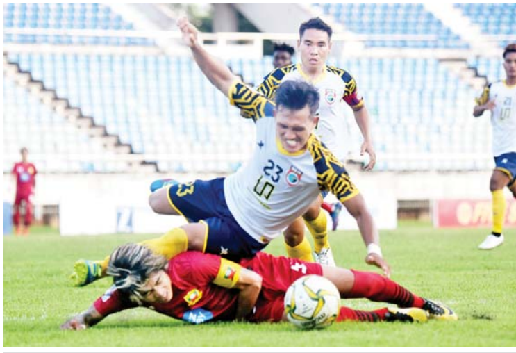
ရှမ်းယူနိုက်တက်အသင်းနှင့် GFA အသင်းတို့ ယှဉ်ပြိုင်ကစားကြစဉ်။

ရန်ကုန် နိုဝင်ဘာ ၆ ၂၀၂၂ ရာသီ MNL အမှတ်ပေးပြိုင်ပွဲ ပွဲစဉ်(၁၂)မှ ရွှေဆိုင်းထားသော GFA အသင်းနှင့် ရှမ်းယူနိုက်တက်အသင်းပွဲကို နိုဝင်ဘာ ၆ ရက်က သုဝဏ္ဏကွင်း၌ ကျင်းပရာ ရှမ်းယူနိုက်တက်အသင်းက နှစ်ဂိုး-ဂိုးမရှိဖြင့် အနိုင်ရခဲ့သည်။ ရှမ်းယူနိုက်တက်အသင်းသည် ယခုပွဲမတိုင်မီ ချန်ပီယံဖြစ်သွားသောကြောင့် GFA အသင်းကစားသမားများက ရှမ်းယူနိုက်တက်အသင်း ကွင်းအတွင်း ဝင်ရောက်လာချိန်တွင် လက်ခုပ်တီး၍ ဂုဏ်ပြုကြိုဆိုခဲ့ကြသည်။