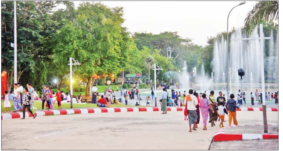
တန်ဆောင်မုန်းလဆန်းအဖိတ်နေ့တွင် နေပြည်တော်ရေပန်းဥယျာဉ်၌ လာရောက်အပန်းဖြေသူများဖြင့် စည်ကားများပြားလျက်ရှိသည်ကို တွေ့ရစဉ်။