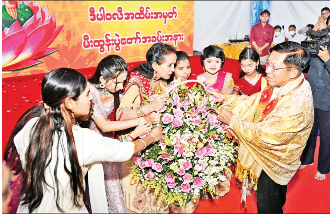
နိုင်ငံတော်စီမံအုပ်ချုပ်ရေးကောင်စီဥက္ကဋ္ဌ နိုင်ငံတော်ဝန်ကြီးချုပ် ဗိုလ်ချုပ်မှူးကြီးမင်းအောင်လှိုင် ဟိန္ဒူရိုးရာယဉ်ကျေးမှု အဖွဲ့များအား အမှတ်တရဂုဏ်ပြုပန်းခြင်း ပေးအပ်ချီးမြှင့်စဉ်။

ထို့နောက် နိုင်ငံတော်စီမံအုပ်ချုပ်ရေး ကောင်စီဥက္ကဋ္ဌ နိုင်ငံတော်ဝန်ကြီးချုပ်နှင့် အခမ်းအနား တက်ရောက်လာကြသူများ အား ဟိန္ဒူရိုးရာယဉ်ကျေးမှုအကပဒေသာ များဖြင့် သီဆိုကပြပျော်ဖြေကြသည်။ ဖျော်ဖြေမှုအပြီးတွင် နိုင်ငံတော်စီမံ အုပ်ချုပ်ရေးကောင်စီဥက္ကဋ္ဌ နိုင်ငံတော် ဝန်ကြီးချုပ်က ဟိန္ဒူရိုးရာယဉ်ကျေးမှု အဖွဲ့များအား အမှတ်တရဂုဏ်ပြုပန်းခြင်း ပေးအပ်ချီးမြှင့်ခဲ့ကြောင်း သိရသည်။