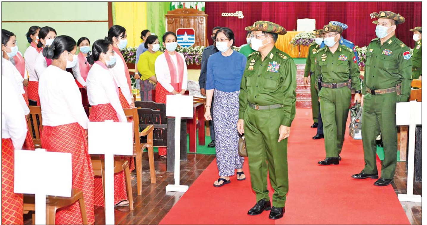
နိုင်ငံတော်စီမံအုပ်ချုပ်ရေးကောင်စီဥက္ကဋ္ဌ တပ်မတော်ကာကွယ်ရေးဦးစီးချုပ် ဗိုလ်ချုပ်မှူးကြီးမင်းအောင်လှိုင် ကမ်းရိုးတန်းဒေသတိုင်းစစ်ဌာနချုပ် ထားဝယ်တပ်နယ်မှ အရာရှိ၊ စစ်သည်၊ မိသားစုများအား ရင်းရင်းနှီးနှီးဆက်စဉ်။

တွေ့ဆုံပွဲအပြီးတွင် နိုင်ငံတော်စီမံအုပ်ချုပ်ရေးကောင်စီဥက္ကဋ္ဌ တပ်မတော်ကာကွယ်ရေးဦးစီးချုပ်နှင့် အဖွဲ့ဝင်များသည် တက်ရောက်လာကြသည့် အရာရှိ၊ စစ်သည်၊ မိသားစုများအား ရင်းရင်းနှီးနှီး