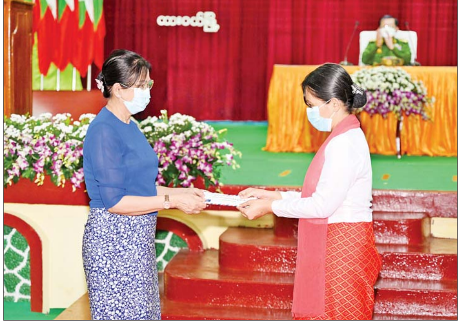
နိုင်ငံတော်စီမံအုပ်ချုပ်ရေးကောင်စီဥက္ကဋ္ဌ တပ်မတော်ကာကွယ်ရေးဦးစီးချုပ် ဗိုလ်ချုပ်မှူးကြီးမင်းအောင်လှိုင်၏ဇနီး ဒေါ်ကြူကြူလှ ထားဝယ်တပ်နယ် မိခင်နှင့်ကလေး စောင့်ရှောက်ရေးအသင်းအတွက် ချီးမြှင့်ငွေများကို ပေးအပ်ရာ နယ်မြေခံတပ်မဌာနချုပ်မှူး၏ ဇနီးက လက်ခံရယူစဉ်။

မာရဇိန် ဗုဒ္ဓရုပ်ပွားတော်မြတ်ကြီးအား ဖူးမြော်ကြည့်ပါကာ ပန်း၊ ရေချမ်း၊ ဆီမီးကပ်လှူပူဇော်သည်။ ယင်းနောက် ရုပ်ပွားတော်မြတ်ကြီးအား လက်ယာရစ်လှည့်လည်ပူဇော်ပြီး ဧည့်သည်တော်မှတ်တမ်းစာအုပ်တွင် လက်မှတ်ရေးထိုးသည်။ ထို့နောက် နိုင်ငံတော်စီမံအုပ်ချုပ်ရေးကောင်စီဥက္ကဋ္ဌ တပ်မတော်ကာကွယ်ရေး ဦးစီးချုပ်နှင့် ဇနီးတို့က ဘုရားကြီးအတွက် ဘက်စုံအလှူငွေများကို ပေးအပ်လှူဒါန်းရာ ဂေါပကအဖွဲ့ဝင်များက လက်ခံရယူခဲ့ကြကြောင်း သိရသည်။ သတင်းစဉ်