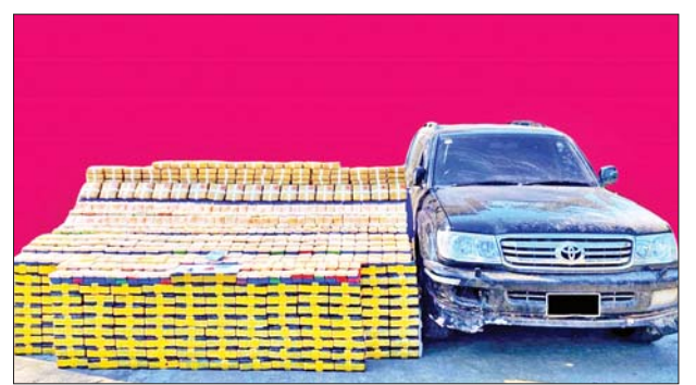
သိမ်းဆည်းရမိသည့် မူးယစ်ဆေးဝါးများအား တွေ့ရစဉ်။

ဒသမ ၀၀၂ ကီလိုနှင့် ဘိန်းဖြူ သုည ဒသမ ၀၀၃ ကီလိုတို့ကို လည်းကောင်း။ အလားတူ နိုဝင်ဘာ ၂ ရက် မွန်းလွဲ ၂ နာရီတွင် မူးယစ်ဆေးဝါး တားဆီးနှိမ်နင်းရေးရဲတပ်ဖွဲ့မှ တပ်ဖွဲ့ဝင်များပါဝင်သော ပူးပေါင်းအဖွဲ့ သည် ဆီဆိုင်မြို့နယ် ပါလောပါကယ်ကျေးရွာအုပ်စု တောင်တီကျေးရွာ နေ ထွက်ရွှေ၏နေအိမ်သို့ ဝင်ရောက်ရှာဖွေရာ စိတ်ကြွရူးသွပ်ဆေးပြား ၃၆၀၀၀ ကိုလည်းကောင်း၊ ထို့အတူ နိုဝင်ဘာ ၃ ရက် နံနက် ၈ နာရီခွဲ တွင် လုံခြုံရေးတပ်ဖွဲ့ဝင်များပါဝင်သော ပူးပေါင်းအဖွဲ့သည် နောင်ချို မြို့နယ် ကုန်းစံကျေးရွာအုပ်စု ဂုတ်ထိပ်ကျေးရွာအနီးတွင် ယာဉ်မောင်း (စိစစ်ဆဲ) မောင်းနှင်လာသည့် LANDCRUISER အမျိုးအစားမော်တော် ယာဉ်အား စစ်ဆေးရန်ရပ်တန့်ခိုင်းစဉ် မောင်းနှင်ထွက်ပြေးသဖြင့် လိုက်လံဖမ်းဆီးရာ ကုန်းစံကျေးရွာအုပ်စု နားမွန်ကျေးရွာအနီးအရောက် ၌ ယာဉ်အား လမ်းဘေးမြောင်းအတွင်း တိမ်းမှောက်နေသည်ကို တွေ့ရှိ