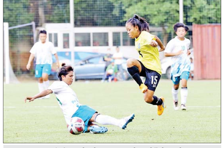
တနင်္သာရီအသင်းနှင့် YREO အသင်း ယှဉ်ပြိုင်နေစဉ်။