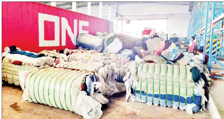
မြန်မာစက်မှုဆိပ်ကမ်း ကုန်သေတ္တာစစ်ဆေးရေးစခန်း၌ သိမ်းဆည်းရမိမှု။

တရားမဝင် ကုန်သွယ်မှုတိုက်ဖျက် ရေးဦးဆောင်ကော်မတီ၏ ကြီးကြပ် ကွပ်ကဲမှုဖြင့် တရားမဝင် ကုန်သွယ်မှု များကို ဥပဒေနှင့်အညီ ထိရောက်စွာ တားဆီးအရေးယူနိုင်ရေး ဆောင်ရွက် လျက်ရှိရာ နိုဝင်ဘာ ၂ ရက်တွင် ရန်ကုန် အပြည်ပြည်ဆိုင်ရာ ဆိပ်ကမ်းများ၏ တရားမဝင်ကုန်သွယ်မှု တိုက်ဖျက်ရေး အထူးအဖွဲ့ဦးဆောင်သော ပူးပေါင်း စစ်ဆေးရေးအဖွဲ့က စစ်ဆေးမှုများ ဆောင်ရွက်ခဲ့ရာ ထီးတန်းဆိပ်ကမ်း ကုန်သေတ္တာ စစ်ဆေးရေးစခန်း၌ ကုန်သေတ္တာတစ်လုံးအတွင်းမှ သွင်းကုန် ကြေညာလွှာ(ID)တွင် ကြေညာထားခြင်း မရှိသည့် မီးကြိုးခွေ ကီလိုဂရမ် ၁၄၄၀ (ခန့်မှန်းတန်ဖိုးငွေကျပ် ၂၅၀၀၀၀၀)ကို လည်းကောင်း၊ အေးရှားဝေါလ်ကုန် သေတ္တာစစ်ဆေးရေးစခန်း၌ ကုန်သေတ္တာ တစ်လုံးအတွင်းမှ သွင်းကုန်ကြေညာလွှာ (ID)တွင် ကြေညာထားခြင်းမရှိသည့် Remote Control Toy Car ၄၉၆ ခုနှင့် Remote Control Drone ၆၄ ခု (ခန့်မှန်း တန်ဖိုးငွေကျပ် ၅၁၂၀၀၀၀)ကို လည်း ကောင်း စုစုပေါင်း (ခန့်မှန်းတန်ဖိုးငွေကျပ် ၂၇၆၂၀၀၀၀)ကို သိမ်းဆည်းရမိခဲ့ပြီး