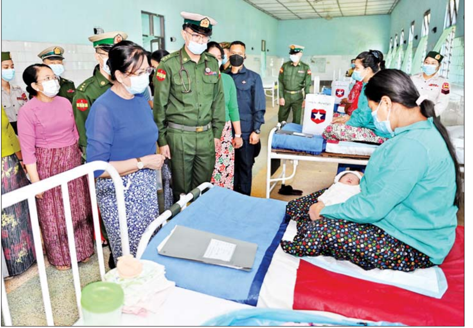
နိုင်ငံတော်စီမံအုပ်ချုပ်ရေးကောင်စီဥက္ကဋ္ဌ တပ်မတော်ကာကွယ်ရေးဦးစီးချုပ် ဗိုလ်ချုပ်မှူးကြီးမင်းအောင်လှိုင်၏ဇနီး ဒေါ်ကြူကြူလှ ထားဝယ်မြို့ရှိ နယ်မြေခံတပ်မတော်ဆေးရုံ၌ တက်ရောက်ဆေးကုသမှုခံယူနေသူတစ်ဦးအား ရင်းရင်းနှီးနှီး မေးမြန်းအားပေးစကားပြောကြားစဉ်။