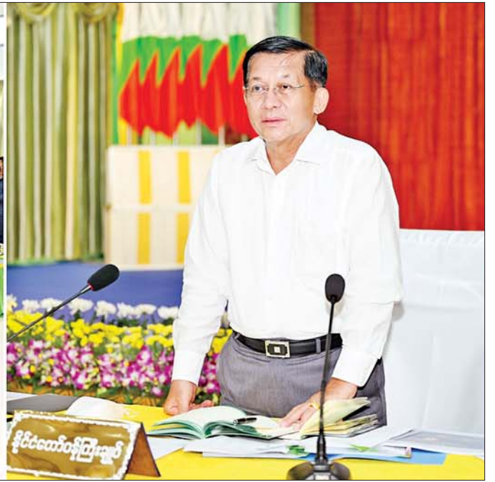
နိုင်ငံတော်စီမံအုပ်ချုပ်ရေးကောင်စီဥက္ကဋ္ဌ နိုင်ငံတော်ဝန်ကြီးချုပ် ဗိုလ်ချုပ်မှူးကြီးမင်းအောင်လှိုင် တနင်္သာရီတိုင်းဒေသကြီး ထားဝယ်ခရိုင်အတွင်းရှိ အသေးစား၊ အငယ်စားနှင့်အလတ်စား စီးပွားရေး(MSME) လုပ်ငန်းရှင်များအား ထားဝယ်မြို့နယ်ခန်းမ၌ တွေ့ဆုံ၍ စီးပွားရေးလုပ်ငန်းများ ဖွံ့ဖြိုးတိုးတက်ရေးအတွက် ဆွေးနွေးပြောကြားစဉ်။