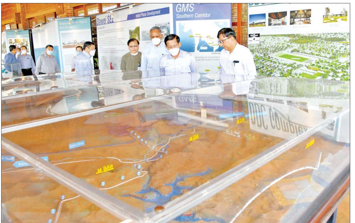
နိုင်ငံတော်စီမံအုပ်ချုပ်ရေးကောင်စီဥက္ကဋ္ဌ နိုင်ငံတော်ဝန်ကြီးချုပ် ဗိုလ်ချုပ်မှူးကြီးမင်းအောင်လှိုင် ထားဝယ်အထူးစီးပွားရေးဇုန်နှင့် ရေနက်ဆိပ်ကမ်းစီမံကိန်း အကွက်ချပုံစံငယ်အား ကြည့်ရှုစဉ်။

ထားဝယ်အထူးစီးပွားရေးဇုန်စီမံကိန်း စတင်အကောင်အထည်ဖော် ဆောင်ရွက်ခဲ့မှု အကြောင်းအမျိုးမျိုးကြောင့် လုပ်ငန်းဆောင်ရွက်မှုများတိုးတက်ရန် နှောင့်နှေးကြန့်ကြာခဲ့ရမှု၊ စီးပွားရေးဇုန် နယ်နိမိတ်အတွင်း တည်ဆောက်ပြီး၊ တည်ဆောက်ဆဲနှင့် တည်ဆောက်ရန်ကျန် ဆိပ်ခံတံတားများ၊ စက်ရုံများ၊ အဆောက်အအုံများ ဆောင်ရွက်ထားရှိမှု စီမံကိန်းလုပ်ငန်းများ ဆက်လက်အကောင်အထည်ဖော်ရန် လိုအပ်ချက်များနှင့် ဆက်လက်ဆောင်ရွက်သွားမည့် အခြေအနေများကို ရှင်းလင်းတင်ပြကြသည်။