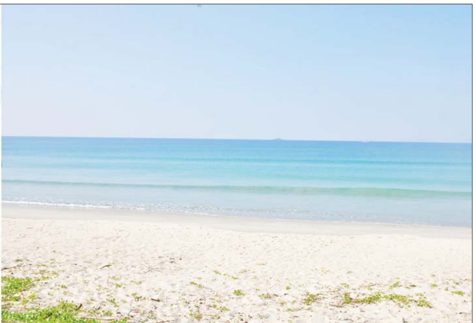
နိုင်ငံတော်စီမံအုပ်ချုပ်ရေးကောင်စီဥက္ကဋ္ဌ နိုင်ငံတော်ဝန်ကြီးချုပ် ဗိုလ်ချုပ်မှူးကြီးမင်းအောင်လှိုင် ထားဝယ်အထူးစီးပွားရေးဇုန်စီမံကိန်းနှင့် ရေနက်ဆိပ်ကမ်းလျာထားသည့်နေရာများကို ကြည့်ရှုစစ်ဆေးစဉ်။