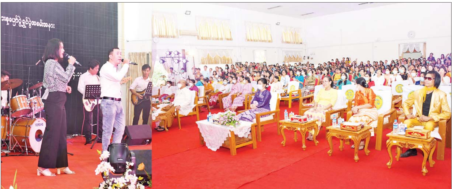
ပြည်ထောင်စုစာရင်းစစ်ချုပ်ရုံး၌ နိုင်ငံကျော်အဆိုတော်များနှင့် မြန်မာ့အသံမှတေးသံရင်များက တေးသီချင်းများဖြင့် ဖျော်ဖြေတင်ဆက်စဉ်။

နေပြည်တော် နိုဝင်ဘာ ၄ နိုင်ငံတော်အစိုးရ၏ ယန္တရား ကောင်းမွန်စွာ လည်ပတ်နိုင်ရေး အတွက် ကျရာကဏ္ဍမှ တာဝန်သိ စိတ်ဖြင့် ဆောင်ရွက်နေကြသည့် ဝန်ထမ်းများကို စိတ်လက်ပေါ့ပါး စွာ အပန်းပြေပျော်ရွှင်မှုရရှိစေရန် ရည်ရွယ်ချက်ဖြင့် စိတ်ဓာတ်ပိုင်း ဆိုင်ရာ အားပေးမြှင့်တင်မှုတစ်ခု အဖြစ် တန်ဆောင်တိုင်ကာလနှင့် တိုက်ဆိုင်ကာ ပြန်ကြားရေးဝန်ကြီး ဌာန မြန်မာ့အသံနှင့်ရုပ်မြင် သံကြားမှခေတ်ပေါ်တေးဂီတအဖွဲ့ နှင့်အတူ နိုင်ငံကျော်တေးသံရင် များ၊ မြန်မာ့အသံမှ တေးသံရင် များက နေပြည်တော်ရှိ ဝန်ကြီး ဌာနများသို့ လှည့်လည်ဖျော်ဖြေ လျက်ရှိသည်။