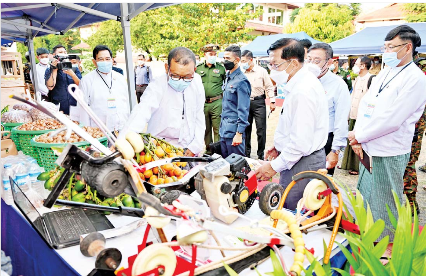
နိုင်ငံတော်စီမံအုပ်ချုပ်ရေးကောင်စီဥက္ကဋ္ဌ နိုင်ငံတော်ဝန်ကြီးချုပ် ဗိုလ်ချုပ်မှူးကြီးမင်းအောင်လှိုင် ထုတ်ကုန်ပစ္စည်းများ ခင်းကျင်းပြသထားရှိမှုကို လေ့လာကြည့်ရှုစဉ်။

အုန်းစိုက်ပျိုးမှုများဆောင်ရွက်ပြီး အုန်းထွက်ပစ္စည်း များကို အဆင့်မီထုတ်လုပ်၍ ရနိုင်ကြောင်း၊ ထို့ကြောင့် ဒေသမှထွက်ရှိသည့် စိုက်ပျိုးမွေးမြူရေး ကုန်ကြမ်းများကို အသုံးပြုပြီး ကုန်ထုတ်လုပ်မှု လုပ်ငန်းများကို အောင်မြင်အောင် ဆောင်ရွက်ကြစေ လိုကြောင်း။