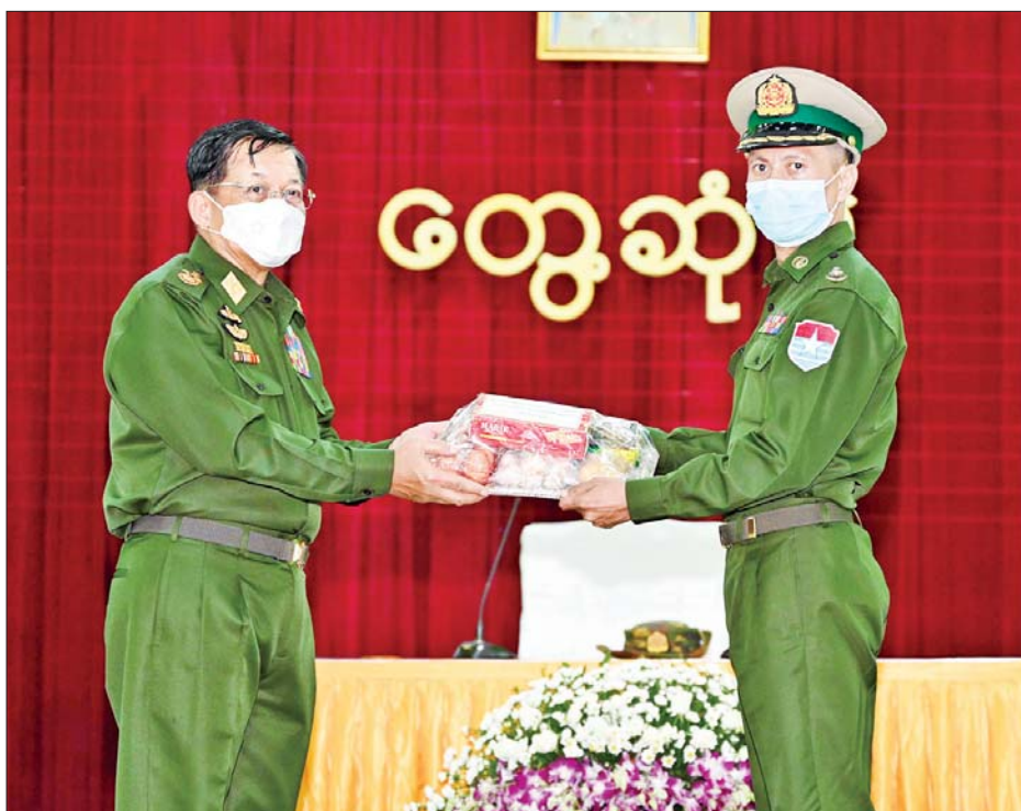
နိုင်ငံတော်စီမံအုပ်ချုပ်ရေးကောင်စီဥက္ကဋ္ဌ တပ်မတော်ကာကွယ်ရေးဦးစီးချုပ် ဗိုလ်ချုပ်မှူးကြီး မင်းအောင်လှိုင်က အရာရှိ၊ စစ်သည်၊ မိသားစုများအတွက် စားသောက်ဖွယ်ရာပစ္စည်းများကို ပေးအပ်ရာ ကမ်းရိုးတန်းဒေသတိုင်းစစ်ဌာနချုပ် ထားဝယ်တပ်နယ်မှ တာဝန်ရှိသူတစ်ဦးက လက်ခံရယူစဉ်။

ထို့နောက် နိုင်ငံတော်စီမံအုပ်ချုပ်ရေးကောင်စီ ဥက္ကဋ္ဌ တပ်မတော်ကာကွယ်ရေးဦးစီးချုပ်က ဆက်လက်ပြောကြားရာတွင် တပ်မတော်၏ အဓိက တာဝန်သည် နိုင်ငံတော်ကာကွယ်ရေးတာဝန်များကို ထမ်းဆောင်ရန်ဖြစ်ကြောင်း၊ သို့သော်လည်း လက်ရှိ