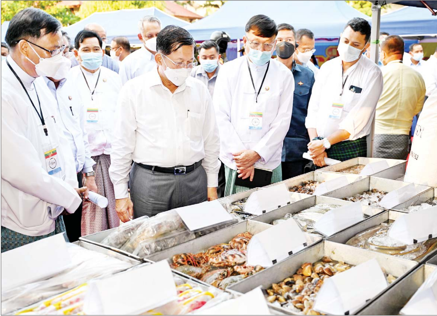
နိုင်ငံတော်စီမံအုပ်ချုပ်ရေးကောင်စီဥက္ကဋ္ဌ နိုင်ငံတော်ဝန်ကြီးချုပ် ဗိုလ်ချုပ်မှူးကြီးမင်းအောင်လှိုင် ထုတ်ကုန်ပစ္စည်းများ ခင်းကျင်းပြသထားရှိမှုကို လေ့လာကြည့်ရှုစဉ်။

နေပြည်တော် နိုဝင်ဘာ ၄ နိုင်ငံတော်စီမံအုပ်ချုပ်ရေးကောင်စီ ဥက္ကဋ္ဌ နိုင်ငံတော်ဝန်ကြီးချုပ် ဗိုလ်ချုပ်မှူးကြီးမင်းအောင်လှိုင်သည် ယနေ့ မွန်းလွဲပိုင်းတွင် တနင်္သာရီတိုင်းဒေသကြီး ထားဝယ်ခရိုင်အတွင်းရှိ အသေးစား၊ အငယ်စားနှင့် အလတ်စား စီးပွားရေး (MSME)လုပ်ငန်းရှင်များအား ထားဝယ်မြို့ မြို့နယ်ခန်းမ၌ တွေ့ဆုံ၍ စီးပွားရေးလုပ်ငန်းများ ဖွံ့ဖြိုးတိုးတက်ရေးအတွက် ဆွေးနွေးပြောကြားသည်။