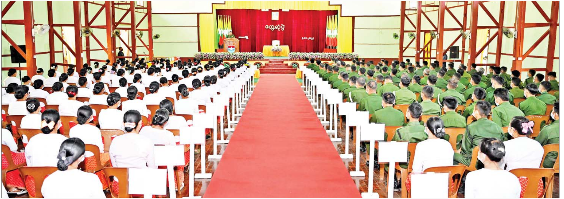
နိုင်ငံတော်စီမံအုပ်ချုပ်ရေးကောင်စီဥက္ကဋ္ဌ တပ်မတော်ကာကွယ်ရေးဦးစီးချုပ် ဗိုလ်ချုပ်မှူးကြီးမင်းအောင်လှိုင် ကမ်းရိုးတန်းဒေသတိုင်းစစ်ဌာနချုပ် ထားဝယ်တပ်နယ်မှ အရာရှိ၊ စစ်သည် မိသားစုများအား တွေ့ဆုံအမှာစကားပြောကြားစဉ်။