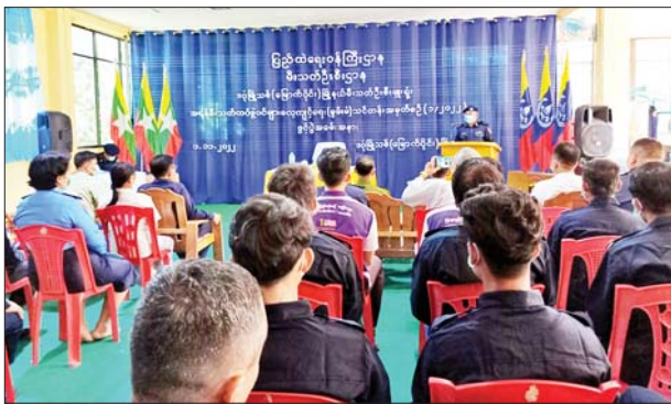
ကြောင်း၊ သင်တန်းမှပို့ချသည့် ဘာသာရပ်များဖြင့် မိမိရပ်ရွာအကျိုးပြုသည့်အကျိုးပြုလုပ်ငန်းများကို ဆတတ်ထမ်းပိုး ဆောင်ရွက်သွား

ရှေးဦးစွာ ဒဂုံမြို့သစ်(မြောက်ပိုင်း)မြို့နယ် မြို့နယ်စီမံအုပ်ချုပ်ရေးအဖွဲ့ အဖွဲ့ဝင်(၁) ဗိုလ်မှူးကျော်သူက အရန်မီးသတ်တပ်ဖွဲ့ဝင်များအနေဖြင့် မီးသတ်တပ်ဖွဲ့၏ ရည်မှန်းချက်တာဝန်များဖြစ်သည့် မီးဘေးလုံခြုံရေး၊ သဘာဝဘေးအန္တရာယ်ကာကွယ်ရေး၊ ရှာဖွေကယ်ဆယ်ရေး၊ ပြည်သူ့အကျိုးပြုဆောင်ရွက်ရေးလုပ်ငန်းများ၊ မီးသတ်တပ်ဖွဲ့ဥပဒေ၊ နည်းဥပဒေများအား ကျွမ်းကျင်တတ်မြောက်စေရန်အတွက် သင်တန်းမှစာတွေ့လက်တွေ့ပို့ချသည့် သင်ခန်းစာများကို ကြိုးစားသင်ယူကြစေလို