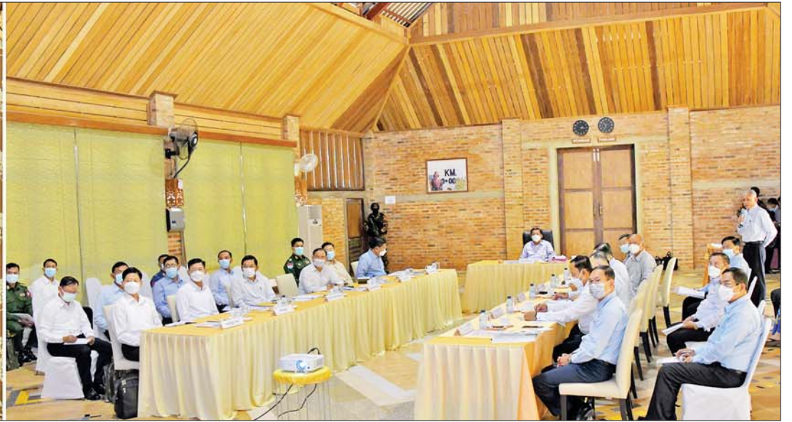
နိုင်ငံတော်စီမံအုပ်ချုပ်ရေးကောင်စီဥက္ကဋ္ဌ နိုင်ငံတော်ဝန်ကြီးချုပ် ဗိုလ်ချုပ်မှူးကြီးမင်းအောင်လှိုင်အား ထားဝယ်အထူးစီးပွားရေးဇုန်နှင့် ရေနက်ဆိပ်ကမ်းစီမံကိန်းရှင်းလင်းဆောင်၌ တာဝန်ရှိသူတစ်ဦးက ရှင်းလင်းတင်ပြစဉ်။