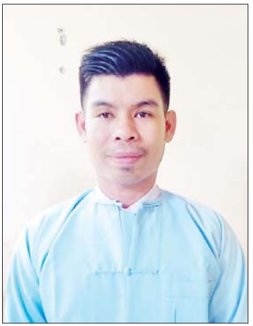
နွေကံ့ကော်(မြို့လှ)

လူငယ်စာပေပတ်သက်ပြီးအကြောင်းအရာ မထူးဆန်းပေမယ့် ကျွန်ုပ်တော်ဖြတ်သန်းခဲ့တဲ့ ဘဝအမှန်ကိုပဲ အရိုးရှင်းဆုံးနဲ့ စာဖတ်သူတိုင်း စိတ်ပါဝင်စားမှုရှိအောင်ရေးသားတင်ပြခဲ့တာပါ။ စာဖတ်သူတိုင်း ဆိုတဲ့နေရာမှာ အဓိကကတော့ လူငယ်တွေပေါ့။ ဘဝလမ်းကို လျှောက်လှမ်းတဲ့နေရာမှာ လူတိုင်းဟာ သူ့ဟာနဲ့သူ မတူညီတဲ့အခက်အခဲ၊ အဆင်မပြေမှုများစုံနဲ့ ချိတ်ကပ်နေရတာကို