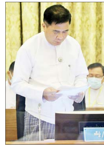
ပြည်ထောင်စုဝန်ကြီး ဒေါက်တာ မျိုးသိန်းကျော် ရှင်းလင်းတင်ပြစဉ်။