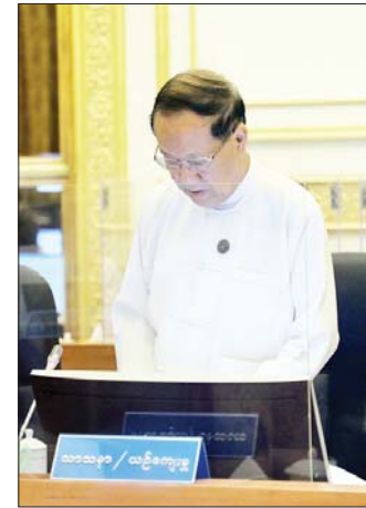
ပြည်ထောင်စုဝန်ကြီး ဦးကိုကို ရှင်းလင်းတင်ပြစဉ်။

တွင်းမှထွက်ရှိသည့် စိုက်ပျိုးမွေးမြူရေးကုန်ကြမ်း များနှင့် သဘာဝသယံဇာတကုန်ကြမ်းများကို အသုံး ပြုမည်ဆိုပါက နိုင်ငံခြားငွေကြေးသုံးစွဲမှုများကိုပါ သက်သာစေမည်ဖြစ်ကြောင်း၊ အချက်အချာကျသည့် ဒေသများတွင် ထုတ်ကုန်များ ထုတ်လုပ်နိုင်ရေး စက်မှုကုန်ထုတ်လုပ်ငန်းများကို အားပေးဆောင်ရွက် ရန်လိုကြောင်း။