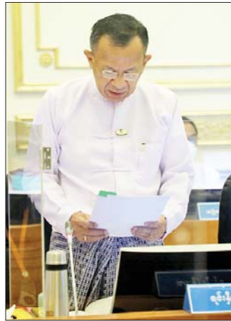
ပြည်ထောင်စုဝန်ကြီး ဒေါက်တာ ကံဇော် ရှင်းလင်းတင်ပြစဉ်။