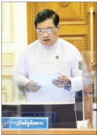
ပြည်ထောင်စုဝန်ကြီး ဦးသောင်းဟန် ရှင်းလင်းတင်ပြစဉ်။

မိမိတို့နိုင်ငံ၌ သစ်တောဖုံးလွှမ်းမှုရာခိုင်နှုန်း များ တဖြည်းဖြည်းကျဆင်းလာကြောင်း၊ တရား မဝင်သစ်ထုတ်လုပ်မှုများ ပိုမိုများပြားလျက်ရှိသည် ကို တွေ့ရှိရကြောင်း၊ သစ်တောများပြန်လည် ထိန်းသိမ်းဆောင်ရွက်ရန်လိုကြောင်း၊ မိမိတို့နိုင်ငံတွင် ဝါးတောများစွာရှိကြောင်း၊ ဝါးများကို အသုံးပြု၍ စက္ကူများကိုထုတ်လုပ်နိုင်မည်ဆိုပါက များစွာအကျိုး ရှိမည်ဖြစ်ကြောင်း၊ ပြည်နယ်နှင့် တိုင်းများအလိုက် ဝါးထုတ်လုပ်ရေးနှင့်ပတ်သက်၍ စနစ်တကျဖြင့် ဆောင်ရွက်ကြစေလိုကြောင်း၊ သစ်တောများ