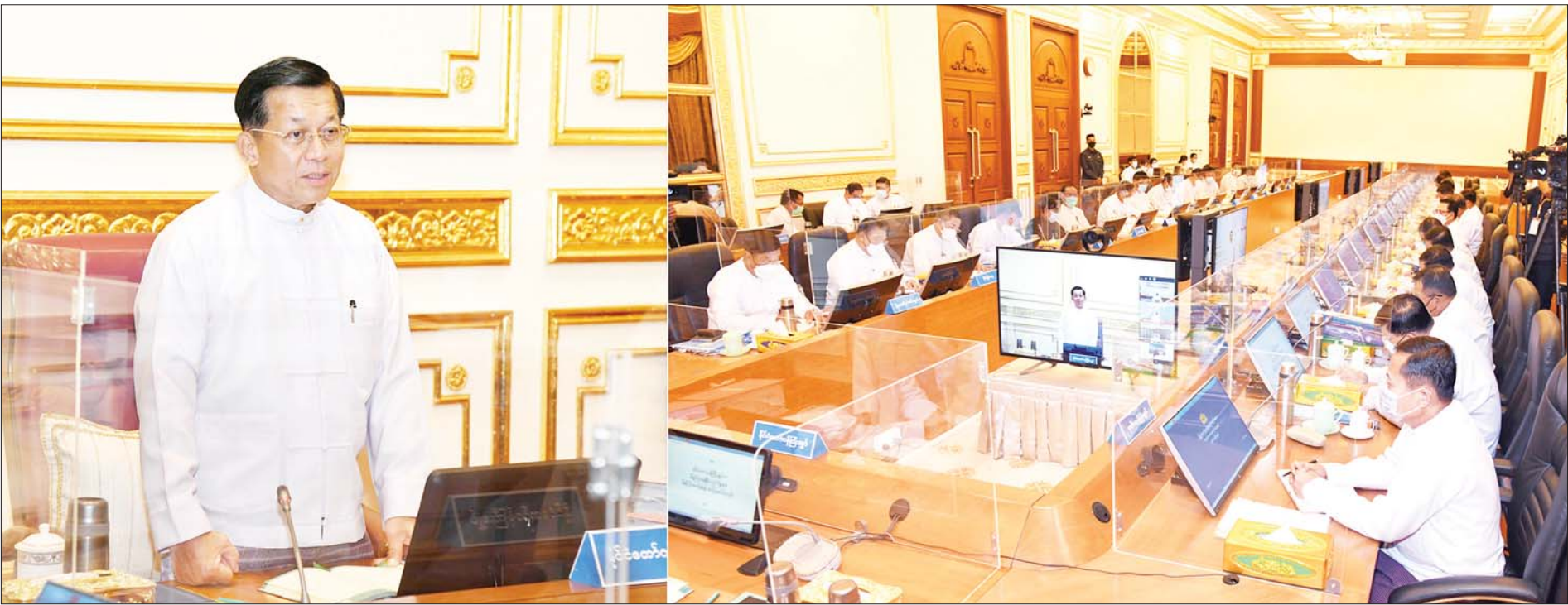
နိုင်ငံတော်စီမံအုပ်ချုပ်ရေးကောင်စီဥက္ကဋ္ဌ နိုင်ငံတော်ဝန်ကြီးချုပ် ဗိုလ်ချုပ်မှူးကြီးမင်းအောင်လှိုင် ပြည်ထောင်စုအစိုးရအဖွဲ့အစည်းအဝေး အမှတ်စဉ်(၈/၂၀၂၂)တွင် အမှာစကားပြောကြားစဉ်။