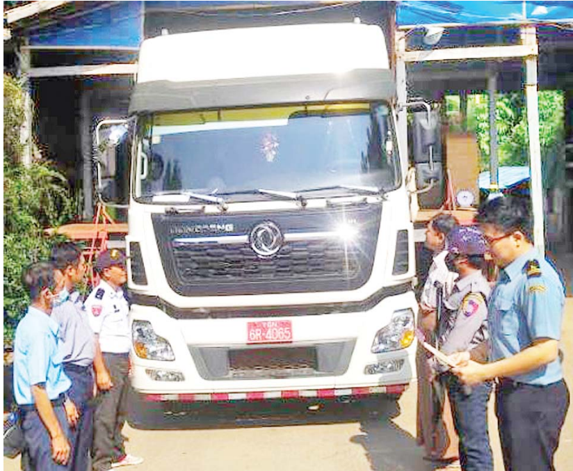
မွန်ပြည်နယ် မရမ်းချောင်မြို့နယ်စစ်ဆေးရေးစခန်း၌ တရားမဝင်ပစ္စည်းများ တင်ဆောင်လာသော မော်တော်ယာဉ်အား ဖမ်းဆီးရမိစဉ်။

ထို့အတူ အောက်တိုဘာ ၃၁ ရက်တွင် ရန်ကုန်အပြည်ပြည်ဆိုင်ရာ လေဆိပ် တရားမဝင် ကုန်သွယ်မှုတိုက်ဖျက်ရေး အဖွဲ့