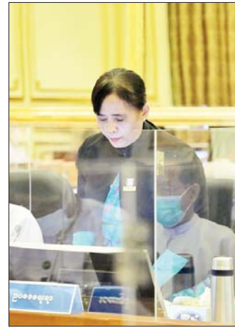
ပြည်ထောင်စုဝန်ကြီး ဒေါက်တာ သီတာဦး ရှင်းလင်းတင်ပြစဉ်။