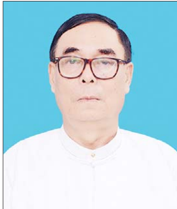
စိုးတင့်(ဧရာဝတီ)

စာရေးသူအမည်- စိုးတင့်(ဧရာဝတီ) စာအုပ်အမည်-ဖိုးထောင်ဇာတ်လမ်းစုံ ဘာသာရပ်-စာပဒေသာ