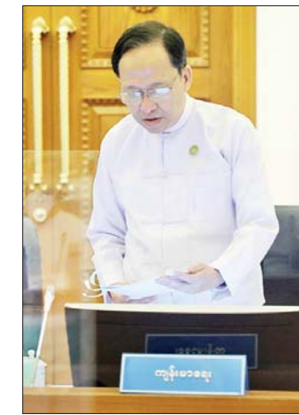
ပြည်ထောင်စုဝန်ကြီး ဒေါက်တာ သက်ခိုင်ဝင်း ရှင်းလင်းတင်ပြစဉ်။

ပြန်လည်ဖုံးလွှမ်းရေးအတွက်လည်း ဆောင်ရွက်ကြ ရန်လိုကြောင်း၊ သစ်တောများ ပြန်လည်စိုက်ပျိုးရေး အတွက် လာမည့်မိုးရာသီမှစ၍ အမျိုးသားရေးရည်မှန်း ချက်အဖြစ် စီမံချက်ချမှတ်ဆောင်ရွက်ကြရန် လိုကြောင်း၊ ပြည်တွင်း၌ စက္ကူများလုံလောက်စွာ ထုတ်လုပ်နိုင်ရေးအတွက် နိုင်ငံတော်မှဆောင်ရွက် ရန်လိုအပ်သကဲ့သို့ ပုဂ္ဂလိကနှင့် ပြည်ပရင်းနှီးမြှုပ်နှံမှု များကိုလည်း ဖိတ်ခေါ်ဆောင်ရွက်ရန် လိုအပ် ကြောင်း။