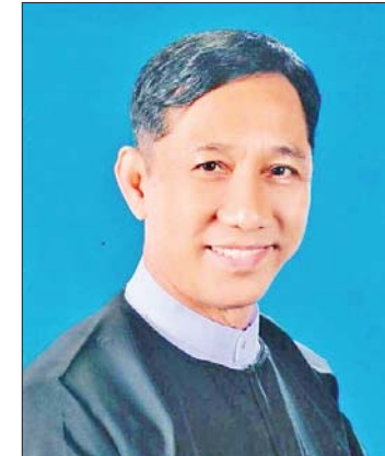
အကြီးကိုကို(ကသာ)

ဒီနေ့ နိုင်ငံတော်တာဝန်ရှိသူတွေဟာ ကဏ္ဍစုံမှာ ထူးချွန်ခဲ့သူ၊ ပြည်သူ့အကျိုး အားတက်သရော ဆောင်ရွက်ခဲ့သူတွေကို ပိုမိုအားပေးပံ့ပိုးနေတယ်ဆိုတာ သမိုင်း ပြန်ကြည့်ရင် အသိသာကြီးပါ။ ဒီထဲမှာ စာပေဆုလည်းပါတယ်။ ခေတ်အဆက် ဆက် စာပေဆုရခဲ့တဲ့အထဲမှာ အမျိုးသား စာပေဆုရ ခုနှစ်ကြိမ်ရသူရှိတယ်။ သိပ်အားကျတယ်။ အခု စာတွေရေးနေ တယ်ဆိုတာက ဆုရအောင်ရေးတာတော့ မဟုတ်ပါဘူး။ ဆုရပြီလို့ TV သတင်းမှာ ကြားလိုက်တဲ့အချိန်မှာတော့ ကိုယ် အား ထုတ်ရေးသားခဲ့တဲ့စာအုပ် မြန်မာလို ရေးတုန်းက အမျိုးသားစာပေဆုမရခဲ့ ပေမယ့် အခု အင်္ဂလိပ်လို ဘာသာပြန်ရေး