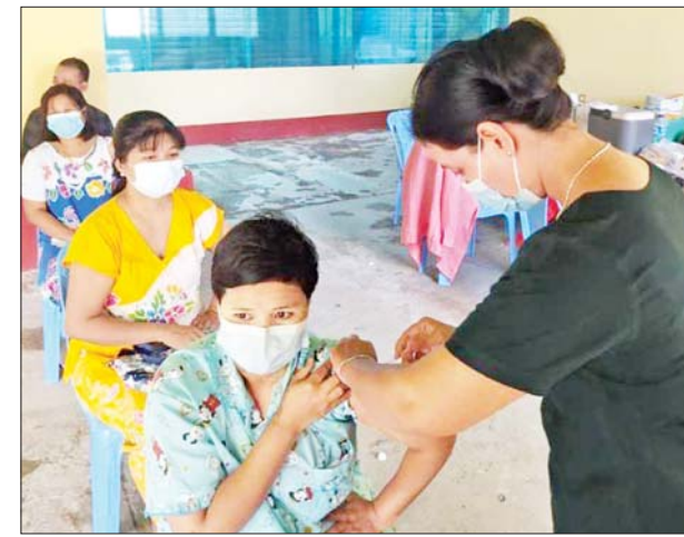
ဟင်္သာတမြို့၌ ဒေသခံပြည်သူများအား ကိုဗစ် -၁၉ ရောဂါ ကာကွယ်ဆေး ထိုးနှံပေးစဉ်။