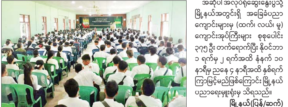
စာသင်ကျောင်းများ ဖွံ့ဖြိုး တိုးတက်မှုသည် ကျောင်းအုပ်ကြီး များ၏ စီမံခန့်ခွဲမှုများက အဓိက ကျသည့်အတွက် အလုပ်တာဝန် များနှင့် စည်းကမ်းများကို တန်ဖိုး ထားလိုက်နာကာ ဆရာကျင့်ဝတ် များနှင့်အညီ အနာဂတ်လမ်းပြ သူများဖြစ်အောင် ကြိုးစားဆောင် ရွက်ကြရမည်ဖြစ်ကြောင်း ပြော ကြားသည်။ အဆိုပါ အလုပ်ရုံဆွေးနွေးပွဲသို့ မြို့နယ်အတွင်းရှိ အခြေခံပညာ ကျောင်းများမှ (ထက်၊ လယ်၊ မူ) ကျောင်းအုပ်ကြီးများ စုစုပေါင်း ၃၇၅ ဦး တက်ရောက်ပြီး နိုဝင်ဘာ ၁ ရက်မှ ၂ ရက်အထိ နံနက် ၁၀ နာရီမှ ညနေ ၄ နာရီအထိ နှစ်ရက် ကြာမြင့်မည်ဖြစ်ကြောင်း မြို့နယ် ပညာရေးမှူးရုံးမှ သိရသည်။ မြို့နယ်(ပြန်/ဆက်)

ငပုတော နိုဝင်ဘာ ၁ ဧရာဝတီ တိုင်းဒေသကြီး ငပုတောမြို့နယ်၌ အခြေခံပညာ ဦးစီးဌာန၏ ကြီးကြပ်မှုဖြင့် အခြေခံပညာ အထက်တန်း၊ အလယ်တန်း၊ မူလတန်းကျောင်း များမှ ကျောင်းအုပ်ကြီးများ၏ စွမ်းဆောင်ရည် မြင့်မားရေး အလုပ်ရုံဆွေးနွေးပွဲ အခမ်းအနား ကို ယနေ့ နံနက် ၉ နာရီတွင်