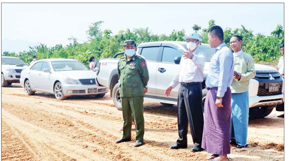
နေရာများကို သွားရောက်ကြည့်ရှု နှင့်အဖွဲ့သည် တောင်ကလေး နေမှုကို လိုက်လံကြည့်ရှု စစ်ဆေးပြီး လိုအပ်သည်များ စစ်ဆေးပြီး လိုအပ်သည်များ လမ်းဖော်ခြင်းနှင့် ရေမြောင်း မှာကြားခဲ့ကြောင်း သိရသည်။ ထို့နောက်ပြည်နယ်ဝန်ကြီးချုပ် တူးခြင်း လုပ်ငန်းဆောင်ရွက် သတင်းစဉ်

တိုးချဲ့ကွက်သစ်ရှိ မဟော်သမာ ပညာရေးကျောင်းဆောင် တည် ဆောက်ရေးလုပ်ငန်းခွင်၌ ယာယီ သီတင်းသုံးနေထိုင်တော်မူသော ဇွဲကပင်တောင်ဆရာတော် ဘဒ္ဓန္တ ကဝိဇောအား သွားရောက်ဖူးမြော် ကြည့်ညိ၍ လှူဖွယ်ဝတ္ထုပစ္စည်း များနှင့် နဝကမ္မအလှူတော်ငွေ များ ဆက်ကပ်လှူဒါန်းကြ သည်။ စစ်ဆေး ဆက်လက်၍ ပြည်နယ်ဝန်ကြီး ချုပ်နှင့်အဖွဲ့သည် ဘားအံမြို့နယ် တောင်ကလေးတိုးချဲ့ ကွက်သစ်၌ စံဖန်၊ ကော့ဘီးလာ၊ ကော့သလဲ ကျေးရွာဈေး(တောင်ပိုင်းဈေး)၊ ဘောလုံးကွင်း၊ ယာဉ်ရပ်နားစခန်း၊ ပန်းခြံတည်ဆောက်မည့် မြေ