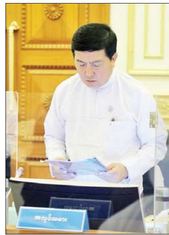
ပြည်ထောင်စုဝန်ကြီး ဒေါက်တာ ပွင့်ဆန်း ရှင်းလင်းတင်ပြစဉ်။