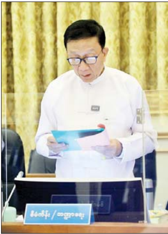
ပြည်ထောင်စုဝန်ကြီး ဦးဝင်းရှိန် ရှင်းလင်းတင်ပြစဉ်။

MSME လုပ်ငန်းများ၏ ၉၉ ရာခိုင်နှုန်းခန့်သည် ပြည်တွင်းကုန်ထုတ်လုပ်မှုကို အဓိကထားဆောင်ရွက် ကြခြင်းဖြစ်ကြောင်း၊ ပြည်တွင်းမှထွက်ရှိသည့် ကုန်ကြမ်းများဖြင့် ကုန်ထုတ်လုပ်မှုကို ဆောင်ရွက် ခြင်းသည် ပိုမိုအကျိုးရှိစေကြောင်း၊ MSME လုပ်ငန်း အတွက် အဓိကလိုအပ်ချက်လေးခုရှိပြီး ၎င်းတို့မှာ ကုန်ကြမ်း၊ ရင်းနှီးမြှုပ်နှံမှု၊ သွင်းအားစုနှင့် လူသား အရင်းအမြစ်များလိုအပ်ကြောင်း၊ ကုန်ထုတ်လုပ်မှု အတွက် ကုန်ကြမ်းလိုအပ်မှုမရှိစေရန် ပြည်ပမှ ကုန်ကြမ်းများဝယ်ယူခြင်းထက် ပြည်တွင်းနှင့် ဒေသ