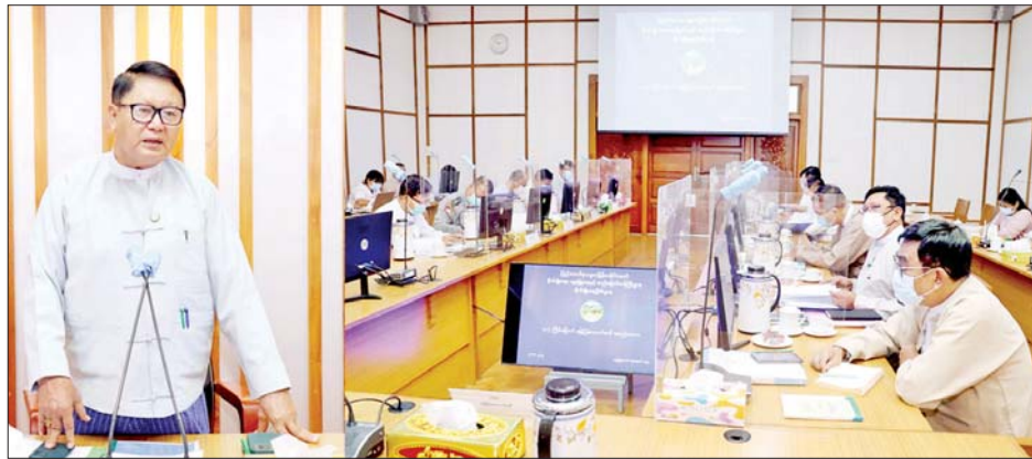
ဒေါက်တာအောင်ကြီးနှင့် ကော်မတီဝင်များ စုံညီစွာ တက်ရောက်ကြသည်။ အစည်းအဝေးတွင် ဒုတိယဝန်ကြီးက နိုင်ငံတကာ တွင် ဓာတ်မြေဩဇာဈေးနှုန်းများ ကြီးမြင့်လာမှု ကြောင့် ပြည်တွင်းသုံးစွဲသူ တောင်သူများအနေဖြင့် လည်း ဓာတ်မြေဩဇာသုံးစွဲမှုလျှော့ချပြီး သဘာဝ မြေဩဇာနှင့် တွဲဖက်သုံးစွဲမှု များပြားလာကြသည် နှင့်အမျှ သဘာဝမြေဩဇာ ထုတ်လုပ်ရောင်းချမှုများ လည်း တိုးပွားလာလျက်ရှိကြောင်း၊ ဈေးကွက် လိုအပ်ချက်အရ သဘာဝမြေဩဇာကို စီးပွားဖြစ်

နေပြည်တော် အောက်တိုဘာ ၂၈ မြေဩဇာများကို တင်သွင်း ထုတ်လုပ် ဖြန့်ချိ နိုင်ရေးအတွက် မြေဩဇာနည်းပညာကော်မတီက စစ်ဆေးအတည်ပြုတင်ပြလာသည့် လုပ်ငန်းများ အပေါ် မြေဩဇာကော်မတီက တည်ဆဲမြေဩဇာ ဥပဒေ၊ စည်းမျဉ်း၊ စည်းကမ်းများနှင့်အညီ စိစစ်ပြီး မှတ်ပုံတင်ထုတ်ပေးခြင်းလုပ်ငန်းများကို ဆောင်ရွက် ပေးလျက်ရှိရာ မြေဩဇာကော်မတီ၏ (၃၆)ကြိမ် မြောက် အစည်းအဝေးပြီးဆုံးချိန်အထိ မြေဩဇာ မှတ်ပုံတင် ၉၅၀၀ ကျော်ကို ခွင့်ပြုပေးခဲ့ပြီးဖြစ် ကြောင်း သိရသည်။ မြေဩဇာကော်မတီ၏ (၃၇)ကြိမ်မြောက် အစည်းအဝေးကို ယနေ့ နံနက်ပိုင်းက စိုက်ပျိုးရေး၊ မွေးမြူရေးနှင့်ဆည်မြောင်းဝန်ကြီးဌာန ပြည်ထောင်စု ဝန်ကြီးရုံး အစည်းအဝေးခန်းမ၌ ကျင်းပရာ အစည်း အဝေးသို့ မြေဩဇာကော်မတီဥက္ကဋ္ဌ ဒုတိယဝန်ကြီး