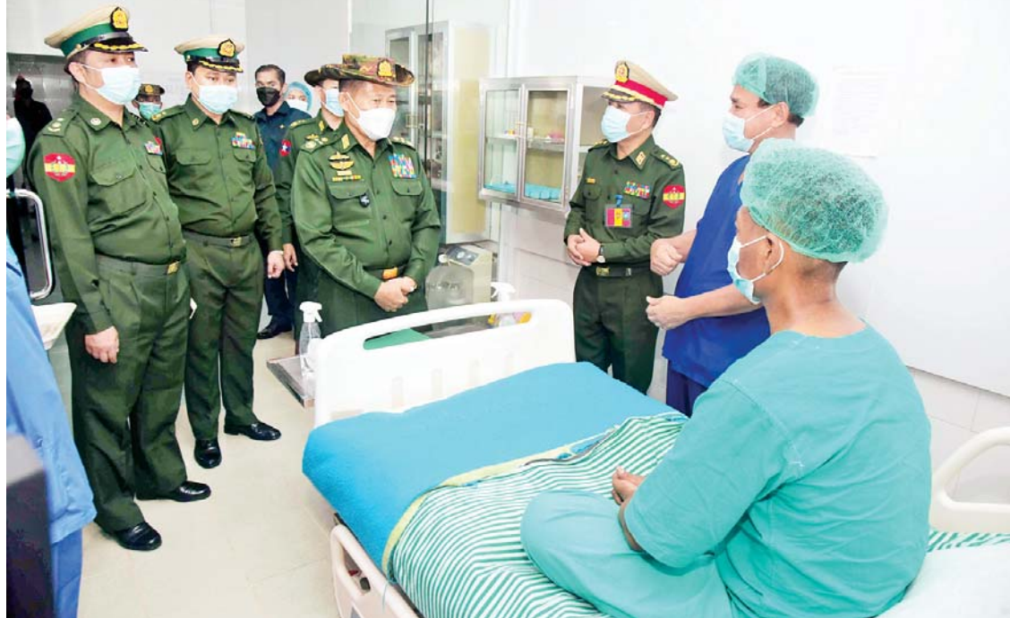
နိုင်ငံတော်စီမံအုပ်ချုပ်ရေးကောင်စီ ဒုတိယဥက္ကဋ္ဌ ဒုတိယတပ်မတော်ကာကွယ်ရေးဦးစီးချုပ် ကာကွယ်ရေးဦးစီးချုပ် (ကြည်း) ဒုတိယဗိုလ်ချုပ်မှူးကြီး စိုးဝင်း မင်္ဂလာဒုံမြို့နယ်ရှိ တပ်မတော်အသည်းအထူးကုဆေးရုံကြီးတွင် တပ်မတော်၌ ပထမဆုံးအကြိမ်အဖြစ် အသည်းအစားထိုးခွဲစိတ်ကုသမှုခံယူခဲ့သည့် လူနာတစ်ဦးအား ကြည့်ရှုအားပေးစကားပြောကြားစဉ်။

နိုင်ငံတော်စီမံအုပ်ချုပ်ရေးကောင်စီ ဒုတိယဥက္ကဋ္ဌ ဒုတိယ တပ်မတော်ကာကွယ်ရေးဦးစီးချုပ် ကာကွယ်ရေးဦးစီးချုပ် (ကြည်း) ဒုတိယဗိုလ်ချုပ်မှူးကြီး စိုးဝင်း မင်္ဂလာဒုံမြို့နယ်ရှိ တပ်မတော် အရိုးရောဂါအထူးကုဆေးရုံကြီး (ခုတင်-၅၀၀)၌ တက်ရောက်ဆေး ကုသမှုခံယူနေသူတစ်ဦးအား မေးမြန်းအားပေးစကားပြောကြားစဉ်။