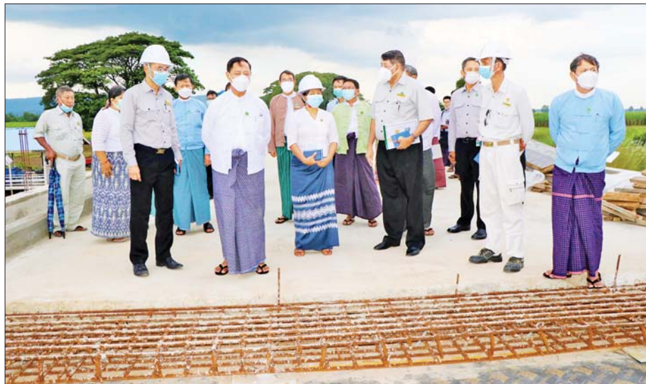
ကြည့်ရှုစစ်ဆေးပြီး ပြည်ထောင်စုဝန်ကြီးက လုပ်ငန်းများသတ်မှတ်ကာလအတွင်း အရည်အသွေးပြည့်မီစွာ အချိန်မီပြီးစီးရေး ဆွေးနွေးမှာကြားသည်။ ဆက်လက်၍ ပြည်ထောင်စုဝန်ကြီးနှင့်အဖွဲ့သည် ကျေးလက်လမ်းဖွံ့ဖြိုးရေးဦးစီးဌာနက ၂၀၂၂-၂၀၂၃ ဘဏ္ဍာနှစ်တွင် နေပြည်တော်ကောင်စီ ငွေလုံးငွေရင်းရန်ပုံငွေဖြင့် အကောင်အထည်ဖော် ဆောင်ရွက်လျက်ရှိသော အရှည် ၆ ဒသမ ၆၃ ဖာလုံရှိ

နေပြည်တော် အောက်တိုဘာ ၂၈ သမဝါယမနှင့် ကျေးလက်ဖွံ့ဖြိုးရေးဝန်ကြီးဌာန ပြည်ထောင်စုဝန်ကြီး ဦးလှမိုးသည် ယနေ့ မွန်းလွဲပိုင်း က နေပြည်တော်ကောင်စီနယ်မြေ ပုဗ္ဗသီရိမြို့နယ် အတွင်း ကျေးလက်နေပြည်သူများ လူမှုစီးပွားဘဝ ဖွံ့ဖြိုးတိုးတက်ရေးအတွက် အကောင်အထည်ဖော် ဆောင်ရွက်လျက်ရှိသော ကျေးရွာချင်းဆက်လမ်းနှင့် တံတားတည်ဆောက်နေမှု အခြေအနေများကို ကွင်းဆင်းကြည့်ရှုစစ်ဆေးသည်။