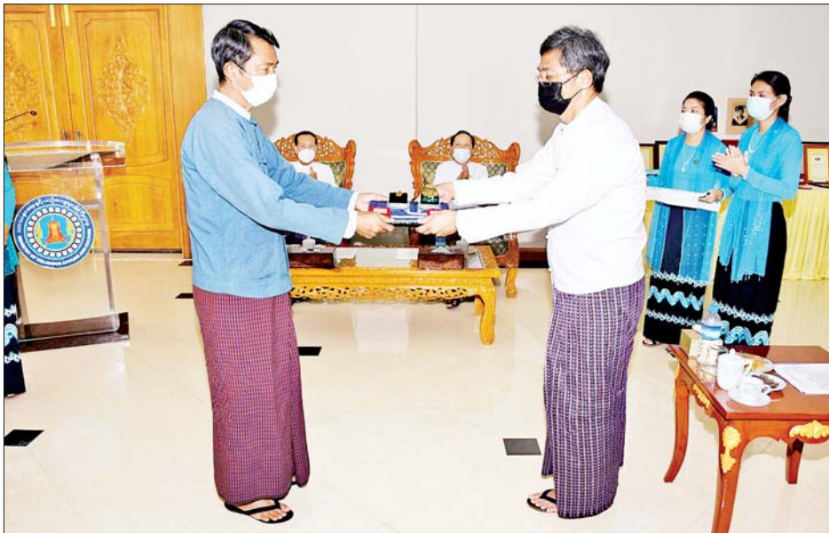
ပြည်ထောင်စုဝန်ကြီးဒေါက်တာသန်းထွန်း၊ ဒုတိယ ဝန်ကြီး ဒေါက်တာမိုးဇော်ထွန်း၊ ညွှန်ကြားရေးမှူးချုပ် များနှင့် သာသနာရေးနှင့် ယဉ်ကျေးမှုဝန်ကြီးဌာနမှ တာဝန်ရှိသူများ တက်ရောက်ကြကြောင်း သိရ သည်။ အဆင့်မြင့်သိပ္ပံနှင့်နည်းပညာဦးစီးဌာန သတင်းစဉ်

ကြောင်းနှင့် ဆရာမကြီးရရှိခဲ့သည့် ဆုတံဆိပ်များ၊ ဂုဏ်ပြုလက်မှတ်များစွာရှိသည့်အနက်မှ အချို့ကို ယခုကဲ့သို့ အမျိုးသားပြတိုက် (နေပြည်တော်)သို့ လှူဒါန်းပေးသည့်အတွက်လည်း လွန်စွာကျေးဇူးတင် ဂုဏ်ယူဝမ်းမြောက်မိပါကြောင်း ပြောကြားသည်။ အခမ်းအနားသို့ ကျန်းမာရေးဝန်ကြီးဌာန သတင်းစဉ်