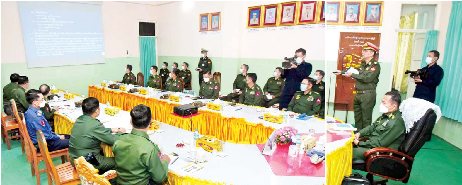
နိုင်ငံတော်စီမံအုပ်ချုပ်ရေးကောင်စီ ဒုတိယဥက္ကဋ္ဌ ဒုတိယတပ်မတော်ကာကွယ်ရေးဦးစီးချုပ် ကာကွယ်ရေးဦးစီးချုပ် (ကြည်း) ဒုတိယဗိုလ်ချုပ်မှူးကြီး စိုးဝင်းအား မင်္ဂလာဒုံမြို့နယ်ရှိ တပ်မတော်အရိုးရောဂါအထူးကုဆေးရုံကြီး (ခုတင်-၅၀၀) အစည်းအဝေးခန်းမ၌ တာဝန်ရှိသူတစ်ဦးက ရှင်းလင်းတင်ပြစဉ်။

ထို့နောက် နိုင်ငံတော်စီမံ အုပ်ချုပ်ရေးကောင်စီ ဒုတိယ ဥက္ကဋ္ဌ ဒုတိယတပ်မတော်ကာကွယ် ရေးဦးစီးချုပ် ကာကွယ်ရေးဦးစီးချုပ် (ကြည်း) နှင့် အဖွဲ့ဝင်များသည် တပ်မတော် အသင်းအထူးကု ဆေးရုံသို့ သွားရောက်၍ (၇၅) နှစ်မြောက် စိန်ရတုဆေးဝန်ထမ်း တပ်ဖွဲ့နေ့ကို ဂုဏ်ပြုကြိုဆိုသော အားဖြင့် စက်တင်ဘာ ၂၇ ရက်နှင့် ၂၈ ရက်တွင် တပ်မတော်၌ ပထမဆုံး