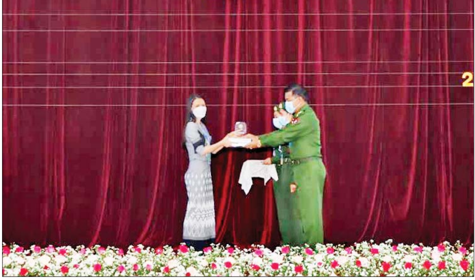
စာတမ်းဖတ်ကြားခြင်းနှင့် ဆွေးနွေးအကြံပြုခြင်းများ လုပ်ဆောင်ပေးခဲ့ကြသည့် ပါမောက္ခချုပ်များ၊ ပါမောက္ခများနှင့် စာတမ်းရှင်များကို ဂုဏ်ပြုသော အားဖြင့် နိုင်ငံတော်စီမံအုပ်ချုပ်ရေးကောင်စီဥက္ကဋ္ဌ တပ်မတော်ကာကွယ်ရေးဦးစီးချုပ် ဗိုလ်ချုပ်မှူးကြီး မင်းအောင်လှိုင်က ပေးပို့သော ဂုဏ်ပြုလက်ဆောင် များကို ညှိနှိုင်းကွပ်ကဲရေးမှူး (ကြည်း၊ ရေ၊ လေ) ဗိုလ်ချုပ်ကြီး မောင်မောင်အေးက ပေးအပ်ချီးမြှင့် သည်။ ထို့နောက် ညှိနှိုင်းကွပ်ကဲရေးမှူး (ကြည်း၊ ရေ၊ လေ) ဗိုလ်ချုပ်ကြီး မောင်မောင်အေးက အမှာစကား ပြောကြားပြီး သိပ္ပံနှင့် နည်းပညာဆိုင်ရာဖွံ့ဖြိုးတိုးတက် ရေးကွန်ဖရင့် (၂၀၂၂) ကို အောင်မြင်စွာကျင်းပပြီးစီး ခဲ့ကြောင်း သိရသည်။ သတင်းစဉ်

Speaker များ၊ အရပ်ဘက်တက္ကသိုလ်များမှ ပါမောက္ခချုပ်များနှင့် ပါမောက္ခများက ဗီဒီယို ကွန်ဖရင့်ဖြင့် တက်ရောက်ကြသည်။ နှစ်ရက်တာ ကွန်ဖရင့်ကျင်းပစဉ်ကာလအတွင်း ဖိတ်ကြားထားသော ပါမောက္ခများ၏ စာတမ်း လေးစောင် အပါအဝင် စုစုပေါင်း သုတေသနစာတမ်း ၁၂၃ စောင် ဖတ်ကြားနိုင်ခဲ့ပြီး ပိုစတာ ၂၃ စောင်ကို ပြသနိုင်ခဲ့သည်။ သိပ္ပံနှင့်နည်းပညာဆိုင်ရာ ဖွံ့ဖြိုးတိုးတက်ရေး ကွန်ဖရင့်(၂၀၂၂)တွင် အကောင်းဆုံးစာတမ်းဆု ခုနစ်ဆုနှင့် အကောင်းဆုံးပိုစတာဆု နှစ်ဆု ပေးအပ် ချီးမြှင့်ခဲ့ရာ တပ်မတော်နည်းပညာတက္ကသိုလ် ကျောင်းအုပ်ကြီး၊ စစ်တက္ကသိုလ် ကျောင်းအုပ်ကြီးနှင့် ညှိနှိုင်းကွပ်ကဲရေးမှူး (ကြည်း၊ ရေ၊ လေ) တို့က ပေးအပ်ချီးမြှင့်ခဲ့သည်။ သိပ္ပံနှင့်နည်းပညာဆိုင်ရာ ဖွံ့ဖြိုးတိုးတက်ရေး ကွန်ဖရင့် အောင်မြင်စွာကျင်းပနိုင်ရေးအတွက် အရပ်ဘက်တက္ကသိုလ်များမှ တက်ရောက်ပြီး