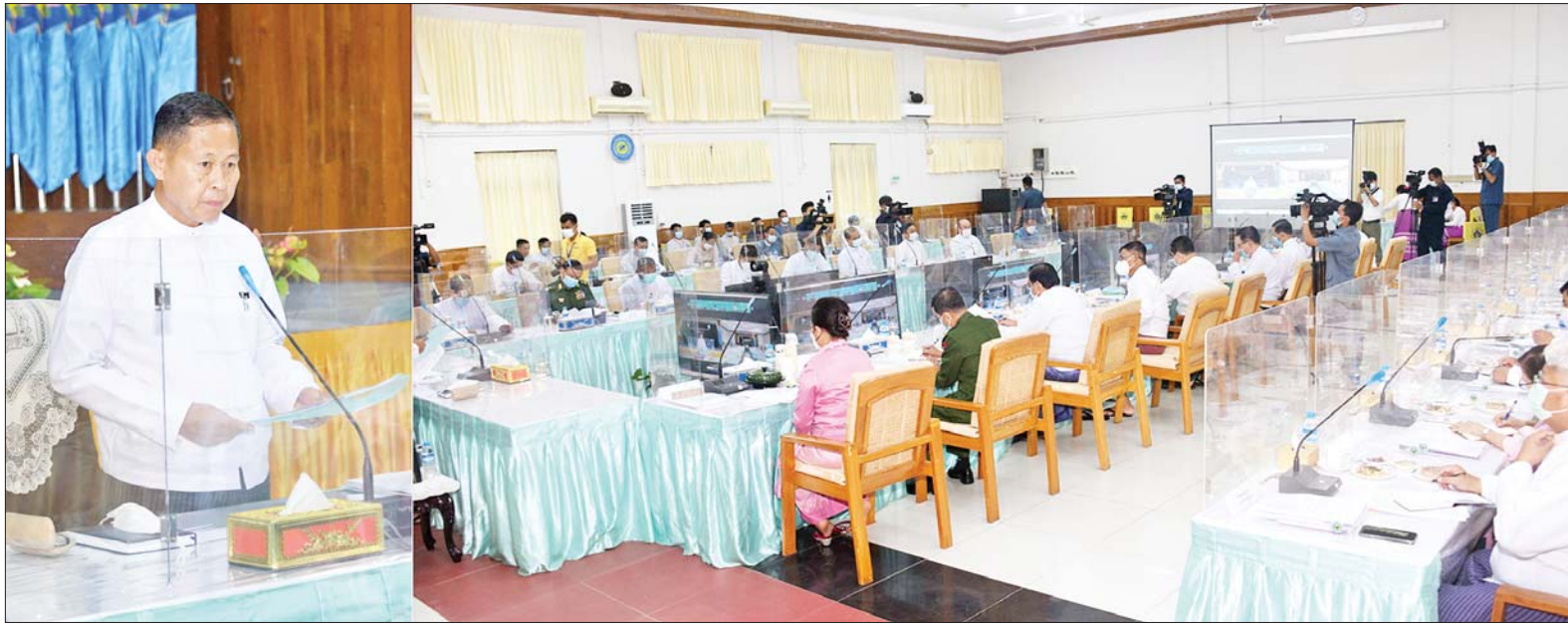
နိုင်ငံတော်စီမံအုပ်ချုပ်ရေးကောင်စီဒုတိယဥက္ကဋ္ဌ ဒုတိယဝန်ကြီးချုပ် ဒုတိယဗိုလ်ချုပ်မှူးကြီးစိုးဝင်း မသန်စွမ်းသူများ၏ အခွင့်အရေးများဆိုင်ရာ အမျိုးသားကော်မတီ အစည်းအဝေးတွင် အမှာစကားပြောကြားစဉ်။

မသန်စွမ်းသူများ၏ အခွင့်အရေးများဆိုင်ရာ အမျိုးသားကော်မတီအစည်းအဝေး(၂/၂၀၂၂)ကို ယနေ့မွန်းလွဲ ၂ နာရီတွင် နေပြည်တော်ရှိ လူမှုဝန်ထမ်း၊ ကယ်ဆယ်ရေးနှင့် ပြန်လည်နေရာချထားရေးဝန်ကြီးဌာန စုပေါင်းအစည်းအဝေးခန်းမ၌ ကျင်းပရာ မသန်စွမ်းသူများ၏ အခွင့်အရေးများဆိုင်ရာ အမျိုးသားကော်မတီဥက္ကဋ္ဌ နိုင်ငံတော်စီမံအုပ်ချုပ်ရေးကောင်စီဒုတိယဥက္ကဋ္ဌ ဒုတိယဝန်ကြီးချုပ် ဒုတိယဗိုလ်ချုပ်မှူးကြီးစိုးဝင်း တက်ရောက်အမှာစကား ပြောကြားသည်။