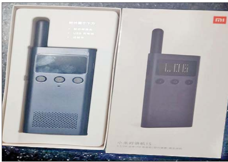
ရန်ကုန်အပြည်ပြည်ဆိုင်ရာလေဆိပ် လေဆိပ်ကုန်လှောင်ရုံ၌ သိမ်းဆည်းရမိမှု။

နေပြည်တော် အောက်တိုဘာ ၂၅ တရားမဝင် ကုန်သွယ်မှုတိုက်ဖျက်ရေးဦးဆောင်ကော်မတီ၏ ကြီးကြပ်ကွပ်ကဲမှုဖြင့် တရားမဝင်ကုန်သွယ်မှုများကို ဥပဒေနှင့်အညီ ထိရောက်စွာ တားဆီးအရေးယူနိုင်ရေး ဆောင်ရွက်လျက်ရှိရာ နေပြည်တော်ကောင်စီနယ်မြေ တရားမဝင်ကုန်သွယ်မှုတိုက်ဖျက်ရေးအထူးအဖွဲ့၏ စီမံခန့်ခွဲမှုဖြင့် သစ်တောဦးစီးဌာန ဦးဆောင်သော ပူးပေါင်းအဖွဲ့က စစ်ဆေးမှုများ ဆောင်ရွက်ခဲ့ရာ အောက်တိုဘာ ၂၀ ရက်မှ ၂၃ ရက်အတွင်း ပျဉ်းမနားမြို့နယ်၊ လယ်ဝေးမြို့နယ်နှင့် ဥတ္တရသီရိမြို့နယ်တို့တွင် တရားမဝင် သစ်မျိုးစုံ ၈ ဒဿမ ၅၃၆၂ တန်(ခန့်မှန်းတန်ဖိုးငွေကျပ် ၃၉၃၈၄၀) ကို သိမ်းဆည်းရမိခဲ့ပြီး သစ်တောဥပဒေနှင့်အညီ အရေးယူဆောင်ရွက်လျက်ရှိသည်။