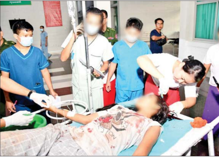
NUG၊ CRPH တို့၏လက်ဝေခံ PDF အမည်ခံ အကြမ်းဖက်သမားများ၏ မတရားအနိုင်ကျင့် ဖမ်းဆီးချုပ်နှောင်ထားသူများအား လုံခြုံရေးတပ်ဖွဲ့ဝင်များက ကောင်းမွန်စွာ ပြန်လည်ကယ်တင်နိုင်ခဲ့ပြီး ဆေးရုံသို့ ပို့ဆောင်ပေးစဉ်။