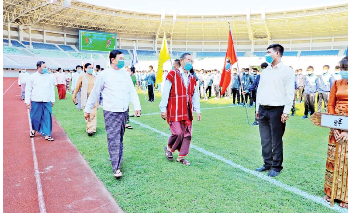
နိုင်ငံတော်စီမံအုပ်ချုပ်ရေးကောင်စီအဖွဲ့ဝင်များနှင့် ပြည်ထောင်စုဝန်ကြီးများ ပြိုင်ပွဲဝင်အားကစားအသင်းများအား လိုက်လံနှုတ်ဆက်ကြစဉ်။

ဘက်လိုက်မှုကင်းရှင်းပြီး သတ်မှတ်ထား သည့် ဥပဒေစည်းမျဉ်း/စည်းကမ်းများ နှင့်အညီ တရားမျှတမှန်ကန်စွာ ဆုံးဖြတ် ဆောင်ရွက်သွားရန်လိုကြောင်း၊ ယခု ပြိုင်ပွဲမှတစ်ဆင့် ထူးချွန်ထက်မြက်ပြီး နိုင်ငံတော်မှ အားထားရသော ဘောလုံး အားကစားသမားကောင်းများ ပေါ်ထွက် လာအောင် ယှဉ်ပြိုင်ကစားသွားကြရန် တိုက်တွန်းမှာကြားလိုကြောင်း ပြောကြား သည်။