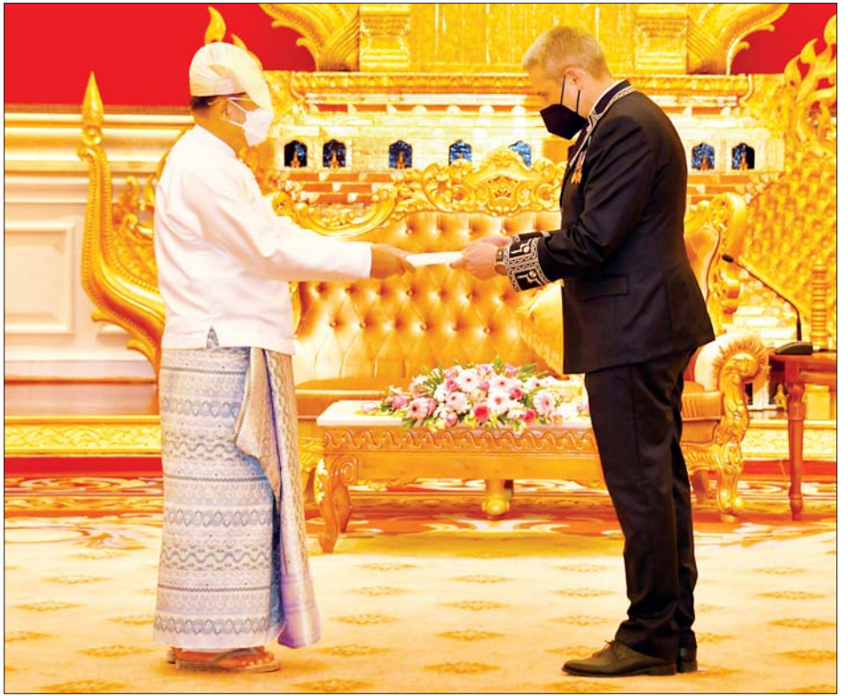
နိုင်ငံတော်စီမံအုပ်ချုပ်ရေးကောင်စီဥက္ကဋ္ဌ နိုင်ငံတော်ဝန်ကြီးချုပ် ဗိုလ်ချုပ်မှူးကြီးမင်းအောင်လှိုင်ထံ မြန်မာနိုင်ငံဆိုင်ရာ ဘယ်လာရုစ်နိုင်ငံ သံအမတ်ကြီး H.E. Mr. Uladzimir Baravikou က ၎င်း၏ သံအမတ် ခန့်အပ်လွှာကို ပေးအပ်စဉ်။

ဆောင်ရွက်ရေးနှင့် ကာကွယ်ရေးဆိုင်ရာ ဆက်လက် ပူးပေါင်းဆောင်ရွက်ရေးကိစ္စရပ်များကို ရင်းရင်းနှီးနှီး ဆွေးနွေးခဲ့ကြသည်။ တွေ့ဆုံပွဲအပြီးတွင် နိုင်ငံတော်စီမံအုပ်ချုပ်ရေး ကောင်စီဥက္ကဋ္ဌ နိုင်ငံတော်ဝန်ကြီးချုပ်နှင့် မြန်မာနိုင်ငံ ဆိုင်ရာ ဘယ်လာရုစ်နိုင်ငံ သံအမတ်ကြီးတို့သည် စုပေါင်းမှတ်တမ်းတင် ဓာတ်ပုံရိုက်ကြသည်။ အဆိုပါ သံအမတ်ခန့်အပ်လွှာပေးအပ်ပွဲသို့ ကောင်စီတွဲဖက်အတွင်းရေးမှူး ဒုတိယဗိုလ်ချုပ်ကြီး ရဲဝင်းဦး၊ နိုင်ငံခြားရေးဝန်ကြီးဌာန ပြည်ထောင်စု ဝန်ကြီး ဦးဝဏ္ဏမောင်လွင်နှင့် သံတမန်ရေးရာဦးစီး ဌာန ညွှန်ကြားရေးမှူးချုပ် ဦးဝဏ္ဏဟန်တို့ တက်ရောက်ခဲ့ကြကြောင်း သိရသည်။ သတင်းစဉ်