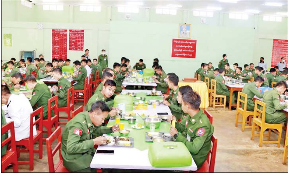
အရာရှိ၊ စစ်သည်၊ မိသားစုများကို ရင်းရင်းနှီးနှီး တွေ့ဆုံဆက်ဆံပြီး ဂုဏ်ပြုစားပွဲများပြုလုပ်၍ တက်ရောက်အားပေးကာ အရာရှိ၊ စစ်သည်၊ မိသားစုများနှင့်အတူတကွ နေ့လယ်စာသုံးဆောင်ခဲ့ကြောင်း သိရသည်။ သတင်းစဉ်

ထိုသို့ ဆောင်ရွက်လျက်ရှိရာ ယနေ့တွင် အလယ်ပိုင်းတိုင်းစစ်ဌာနချုပ်နှင့် တောင်ပိုင်းတိုင်းစစ်ဌာနချုပ်တို့မှ တိုင်းမှူးနှင့် တာဝန်ရှိသူများက သက်ဆိုင်ရာ ကွပ်ကဲမှုအောက်ရှိ တပ်ရင်း/တပ်ဖွဲ့များနှင့် နယ်မြေခံသင်တန်းကျောင်းများသို့ သွားရောက်၍ အရာရှိ၊ စစ်သည်၊ မိသားစုများအား ရင်းရင်းနှီးနှီး တွေ့ဆုံဆက်ဆံပြီး ဂုဏ်ပြုစားပွဲများ ပြုလုပ်ပေး၍ တက်ရောက်အားပေးကာ အရာရှိ၊ စစ်သည်၊ မိသားစုများနှင့် အတူတကွ လက်ရည်တစ်ပြင်တည်း နေ့လယ်စာသုံးဆောင်ခဲ့ကြသည်။ အလားတူ တိုင်းစစ်ဌာနချုပ်များအလိုက် တပ်နယ်အသီးသီးမှ တပ်မတော်အရာရှိကြီးများက လည်း ၎င်းတို့၏ ကွပ်ကဲမှုများအလိုက် တပ်ရင်း/တပ်ဖွဲ့များနှင့် နယ်မြေခံသင်တန်းကျောင်းများမှ