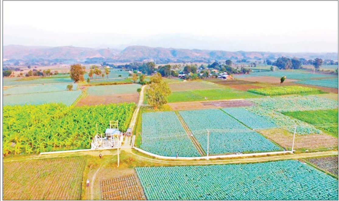
နွယ်ရစ်ကျေးရွာအုပ်စု နွယ်ရစ်ကျေးရွာ စက်ရေတွင်းမှ ဆောင်းသီးနှံများစိုက်ပျိုးထားမှုကို တွေ့ရစဉ်။

ထိုအခြေအနေကို ကျော်လွှားသွားနိုင်ရန် ဆည်မြောင်းနှင့် ရေအသုံးချမှုစီမံခန့်ခွဲရေးဦးစီးဌာနသည် သဘာဝပတ်ဝန်းကျင်နှင့် ရေအရင်းအမြစ်ကို ထိခိုက်မှုမရှိစေဘဲ မြေအောက်ရေဖော်ထုတ်သုံးစွဲခြင်းဖြင့် စိုက်ပျိုးရေး၊ မွေးမြူရေးအတွက် ရေရရှိရေးကို ကြိုးပမ်းဖော်ဆောင်လာရသည်။