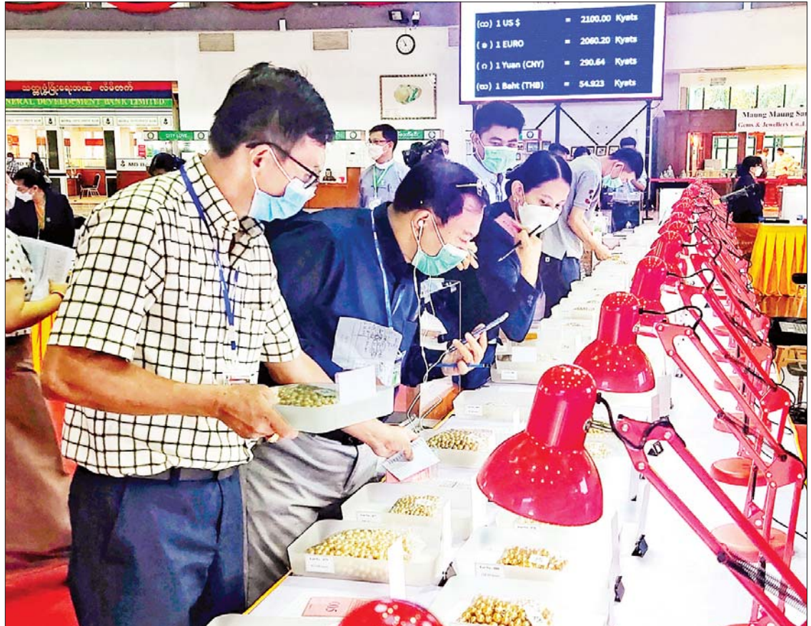
ပြည်တွင်း၊ ပြည်ပရတနာကုန်သည်များ မဏိရတနာကျောက်စိမ်းခန်းမအတွင်း ခင်းကျင်းပြသထားသည့် ပုလဲအတွဲများ ကို စိတ်ကြိုက်လေ့လာကြည့်ရှုကြစဉ်။

နေပြည်တော် အောက်တိုဘာ ၂၀ ၂၀၂၂ ခုနှစ် နှစ်လယ် မြန်မာ့ ကျောက်မျက်ရတနာပြပွဲ ဒုတိယနေ့ကို နေပြည်တော်ရှိ မဏိရတနာကျောက်စိမ်း ခန်းမ၌ ဆက်လက်ကျင်းပသည်။ စိတ်ကြိုက်လေ့လာကြည့်ရှု နံနက်ပိုင်းမှစတင်၍ ပြည်တွင်း၊ ပြည်ပ ရတနာကုန်သည်များသည် မဏိရတနာ ကျောက်စိမ်းခန်းမအတွင်း ခင်းကျင်းပြသထားသည့် ပုလဲအတွဲများ၊ ကျောက်စိမ်းအတွဲများ၊ ကျောက်မျက် အတွဲများနှင့် ခန်းမအပြင်ဘက် သတ်မှတ်နေရာများအလိုက် ခင်းကျင်း ပြသထားသည့် ကျောက်စိမ်းအရိုင်းတွဲ များကို စိတ်ကြိုက်လေ့လာကြည့်ရှုကြ သည်။ ယနေ့ပြပွဲတွင် ရောင်းချမည့် ပုလဲ အတွဲအမှတ်(၁)မှ အတွဲအမှတ်(၂၀၀) အထိ ပုလဲအတွဲများကို ပြည်တွင်း၊ ပြည်ပ ရတနာကုန်သည်များက ကြည့်ရှုစစ်ဆေး ကြပြီး ဈေးနှုန်းတင်သွင်းလွှာများကို တင်ဒါပုံးများအတွင်းသို့ ထည့်သွင်းကြ သည်။ ထို့နောက် ပြပွဲတွင် ရောင်းချမည့် ပုလဲအတွဲပေါင်း ၄၀၀ အနက်မှ စာမျက်နှာ ၁၁ ကော်လံ ၁ သို့ ✨