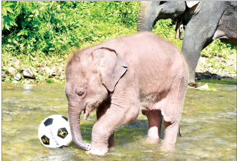
၂၃-၇-၂၀၂၂ ရက်နေ့က ရခိုင်ပြည်နယ် တောင်ကုတ်မြို့နယ် မြန်မာ့သစ်လုပ်ငန်းဆင်ပိုင်းမှ မိခင်ဆင်မကြီး ဇာနန်းလှကမွေးဖွားခဲ့သည့် ဆင်ဖြူတော် (အထီးလေး)ကိုတွေ့ရစဉ်။

ထူးခြားရတနာဖြစ်တဲ့ အကြောင်းရင်းခံများစွာကို ဆက်လက် ရေးဖွဲ့လိုပါတယ်။ ဗုဒ္ဓဝင်ထဲက “ဝေဿန္တရာမင်းကြီး” ရဲ့ အကြောင်း ပါ။ မင်းကြီးဟာ “ပစ္စယ” အမည်တွင်ခေါ်တဲ့ ဆင်ဖြူတော်ကို အလှူခံ လာတဲ့ ကလိင်္ဂရာဇ်တိုင်းသားတို့နယ်မြေမှာ ရာသီဥတုမမှန်ကန်မှု ကြောင့် အစာရေစာငတ်မွတ်ခေါင်းပါးလျက်ရှိရာ အလှူခံလာသူ ပုဏ္ဏား ကိုယ်စားလှယ်တို့ထံ ပေးဆပ်လှူဒါန်းခဲ့မှုပါ။ မင်းကြီးကို အမတ်တွေနဲ့တကွ မင်းတိုင်ပင်ခံတို့ရဲ့ ကန့်ကွက်မှုကြောင့် ထီးနန်း စွန့်ခွာပြီး မြိုင်ရပ်ကိုနှင်ခြင်းခံခဲ့ရတဲ့ ဘုရားအလောင်းတော်ရဲ့ဘဝ ဗုဒ္ဓဝင် ဖြစ်စဉ်အမှန်ပါ။ ဆင်ဖြူတော်ရဲ့တန်ဖိုးကို မခန့်မှန်းနိုင်လောက် တဲ့အထိ ထူးခြားစွာရှိနေပြီး ဘုရားအလောင်းရဲ့ ပေးဆပ်ပံ့ပိုးမှုကို ကြက်သီးထမျှ စာမျက်နှာ ၇ သို့*