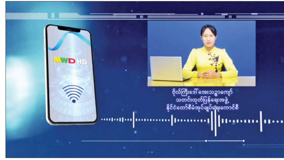
ဗိုလ်ကြီးဒေါ်အေးသညာကျော် သတင်းထုတ်ပြန်ပေးအဖွဲ့ နိုင်ငံတော်စီမံအုပ်ချုပ်ရေးကောင်စီ ၁၃ ဦးပါ။ ဒီလိုဖြစ်ပွားခဲ့တာကို အမည်ပျက်စာရင်း ကြေညာခံထားရတဲ့ မိဒီယာတချို့က မိုင်းပေါက်ကွဲမှု ဖြစ်စဉ်အပြီးမှာ လုံခြုံရေးတပ်ဖွဲ့ဝင်တွေက ပစ်ခတ်လို့ ပြည်သူတွေသေဆုံးခဲ့ရတယ်ဆိုပြီး မဟုတ်မမှန် ထုတ်လွှင့်နေတာတွေ ရှိပါတယ်။ ဒါနဲ့ ပတ်သက်ပြီးပြောရမယ်ဆိုရင် အခုသေဆုံးသွားတဲ့ ဝန်ထမ်းတွေ၊ ပြည်သူတွေရဲ့ ရင်ခွဲစစ်ဆေးချက် အဖြေက ဒါဟာ လက်နက်ငယ်ဝင်ဖောက်တဲ့ ဒဏ်ရာကြောင့် သေဆုံးခဲ့သူတစ်ဦး တစ်ယောက်မှ မရှိဘဲနဲ့ မိုင်းပေါက်ကွဲချိန်မှာ ဒီမိုင်းစတွေထိမှန်လို့

နေပြည်တော် အောက်တိုဘာ ၂၀ မေး။ အင်းစိန်ထောင်မှာ မိုင်းပေါက်ကွဲမှုဖြစ်စဉ် ဖြစ်ပွားခဲ့တယ်လို့သိရပါတယ်။ အခုလို မိုင်းပေါက်ကွဲမှုဖြစ်စဉ်ကြောင့် ဝန်ထမ်းအချို့ ဒဏ်ရာရ သေဆုံးခဲ့တာတွေရှိခဲ့ပြီးတော့မှ အရပ်သားပြည်သူတချို့လည်း သေဆုံးခဲ့ရတယ်လို့လည်း သိခဲ့ရပါတယ်။ အဲဒီလို သေဆုံးခဲ့မှုအပေါ်မှာ တချို့ မိဒီယာတွေက လုံခြုံရေးတပ်ဖွဲ့ဝင်တွေက ပစ်ခတ်လို့ ထောင်ဝင်စာလာတွေတဲ့ အရပ်သားပြည်သူတွေ သေပါတယ်ဆိုပြီးတော့ ဖော်ပြနေတာတွေကို တွေ့ရပါတယ်။ ဒါနဲ့ပတ်သက်ပြီးတော့ ဖြစ်စဉ်အမှန်ကို ဖြေကြားပေးစေလိုပါတယ်။ ဖြေ။ ဟုတ်ကဲ့ပါ အောက်တိုဘာ ၁၉ ရက် နံနက် ၉ နာရီ မိနစ် ၄၀ လောက်မှာ အင်းစိန်ပဟိုအကျဉ်းထောင်ရဲ့ ထောင်ဝင်စာလက်ခံတဲ့ နေရာမှာ မိုင်းပေါက်ကွဲမှုဖြစ်စဉ် ဖြစ်ပွားခဲ့ပါတယ်။ ဒီဖြစ်စဉ်ကြောင့် ဝန်ထမ်းသုံးဦး ကလေးအပါအဝင် အရပ်သားပြည်သူ ငါးဦး သေဆုံးခဲ့ပါတယ်။ ဒဏ်ရာရတာကတော့ ဝန်ထမ်းငါးဦးနဲ့ အရပ်သားပြည်သူ