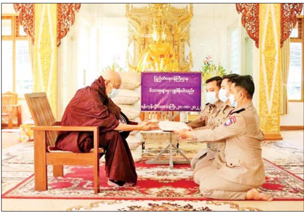
ဓမ္မဝိဟာရကျောင်းတိုက်၊ ဧရာဝတီတိုင်းဒေသကြီး ပုသိမ်မြို့နယ်ရှိ အောင်မြေသာကျောင်းတိုက်တို့သို့ ဆန်ကြာဆံများကိုလည်းကောင်း ဆရာတော်၊ သံဃာတော်များအတွက် တာဝန်ရှိသူများက သွားရောက် ဆက်ကပ်လှူဒါန်းခဲ့ကြကြောင်း သိရသည်။

ထိုသို့ ဆောင်ရွက်လျက်ရှိရာ ယနေ့တွင် နေပြည်တော်ကောင်စီ နယ်မြေ ပုဗ္ဗသီရိမြို့နယ်ရှိ အောင်စည်သာကျောင်းတိုက်၊ စစ်ကိုင်း တိုင်းဒေသကြီး စစ်ကိုင်းမြို့နယ်ရှိ ဇိနောဒယပရိယတ္တိစာသင်တိုက်၊ မွန်ပြည်နယ် မော်လမြိုင်မြို့နယ်ရှိ ရိုးကျောင်းဟောင်းကျောင်းတိုက်၊ ရန်ကုန်တိုင်းဒေသကြီး လှိုင်မြို့နယ်ရှိ ဇေယျဝတီပရိယတ္တိစာသင်တိုက်၊ လှိုင်သာယာ(အရှေ့ပိုင်း)မြို့နယ်ရှိ ဥက္ကံသာရာမရွှေကျောင်းတိုက်နှင့် သာကေတမြို့နယ်ရှိ တိပိဋကလာလင်္ကာရကျောင်းတိုက်တို့သို့ ဆွမ်းဆန်တော်များကိုလည်းကောင်း၊ မကွေးတိုင်းဒေသကြီး မကွေး မြို့နယ်ရှိ မဟာဓမ္မိကာရာမကျောင်းတိုက်၊ မန္တလေးတိုင်းဒေသကြီး ချမ်းမြသာစည်မြို့နယ်ရှိ မဟာဝိဇယရသီစလေကျောင်းတိုက်၊ အမရပူရ မြို့နယ်ရှိ မကျည်းတောကျောင်းတိုက်နှင့် အောင်မြေသာစံမြို့နယ်ရှိ နေထွက်ဂူကျောင်းတိုက်၊ ရှမ်းပြည်နယ် တောင်ကြီးမြို့နယ်ရှိ