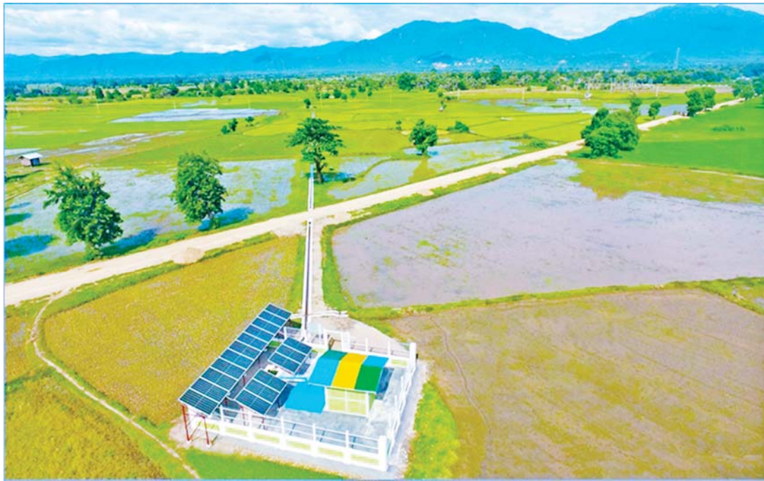
ရှောက်ကုန်းကျေးရွာအုပ်စု ပုဏ္ဏမာစက်ရေတွင်း Solar တပ်ဆင်၍ စိုက်ပျိုးရေးပေးဝေမှုကို တွေ့ရစဉ်။

ဆင်သေဆည်မှ အဓိကဖြန့်ဝေ တပ်ကုန်းမြို့နယ်အတွင်းရှိ ကျေးရွာများသည် စိုက်ပျိုးရေးကို အဓိကအားထားလုပ်ဆောင်ကြပြီး စိုက်ပျိုးမြေများအတွက် စိုက်ပျိုးရေးကို ဆင်သေဆည်မှ အဓိကဖြန့်ဝေပေးလျက်ရှိသည်။ ထိုသို့တောင်သူများ၏ စိုက်ပျိုးမြေများထံ အကျိုးပြုဆောင်ရွက်ပေးလျက်ရှိရာ ရာသီဥတုပြောင်းလဲမှု ဖြစ်စဉ်များကြောင့် မိုးရွာသွန်းမှုနည်း၍ မိုးရေချိန်လျော့နည်းပြီး ဆည်ရေအဝင်နည်းသည့်နှစ်များတွင် ရေပေးမြောင်းအဖျားပိုင်းရှိ ဆည်ရေသောက် ဧကများအတွက် စိုက်ပျိုးရေး လုံလောက်ရန် လိုအပ်ပေသည်။