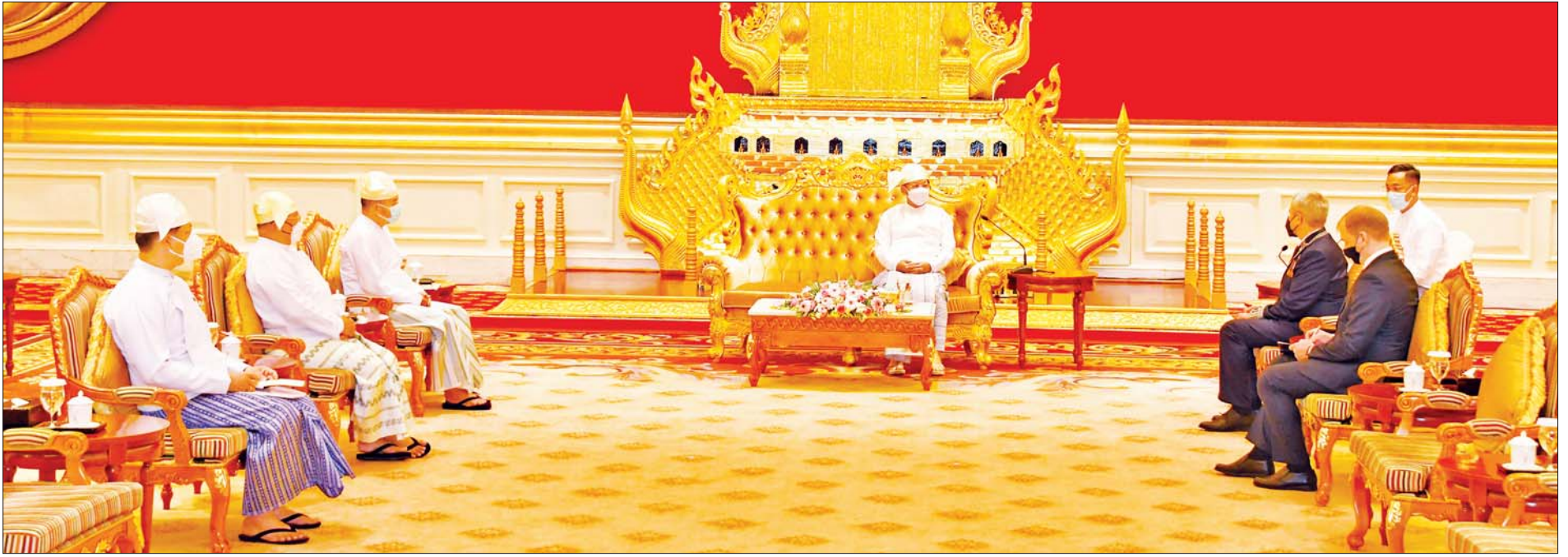
နိုင်ငံတော်စီမံအုပ်ချုပ်ရေးကောင်စီဥက္ကဋ္ဌ နိုင်ငံတော်ဝန်ကြီးချုပ် ဗိုလ်ချုပ်မှူးကြီးမင်းအောင်လှိုင်နှင့် မြန်မာနိုင်ငံဆိုင်ရာ ဘယ်လာရုစ်နိုင်ငံ သံအမတ်ကြီး H.E. Mr. Uladzimir Baravikou တို့ ရင်းရင်းနှီးနှီး တွေ့ဆုံဆွေးနွေးစဉ်။