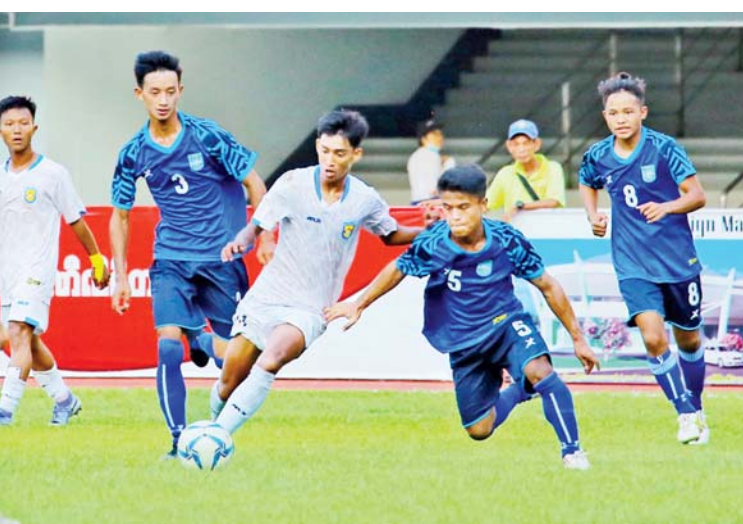
နိုင်ငံတော်စီမံအုပ်ချုပ်ရေးကောင်စီအဖွဲ့ဝင်များနှင့် ပြည်ထောင်စုဝန်ကြီးများ ၂၀၂၂ ခုနှစ် ပြည်နယ်နှင့် တိုင်းဒေသကြီး အသက်(၁၆)နှစ်အောက် (အမျိုးသား) ဘောလုံးပြိုင်ပွဲတွင် မန္တလေးတိုင်းဒေသကြီးအသင်းနှင့် ကချင်ပြည်နယ်အသင်း ယှဉ်ပြိုင်ကစားနေမှုကို ကြည့်ရှုအားပေးစဉ်။

ဘောလုံးအဖွဲ့ချုပ်မှ တာဝန်ရှိသူများ၊ ပြည်ထောင်စုနယ်မြေ နေပြည်တော်ရှိ အခြေခံပညာအထက်တန်းကျောင်းများမှ ကျောင်းသား ကျောင်းသူများ၊ ပြိုင်ပွဲဝင် အသင်းများမှ အုပ်ချုပ်သူ/နည်းပြများနှင့် အားကစားသမားများ တက်ရောက် ကြသည်။