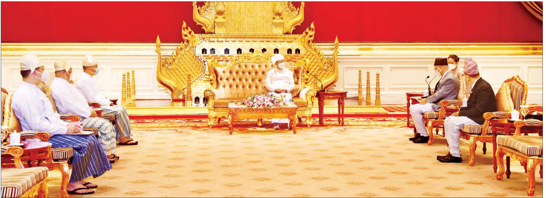
နိုင်ငံတော်စီမံအုပ်ချုပ်ရေးကောင်စီဥက္ကဋ္ဌ နိုင်ငံတော်ဝန်ကြီးချုပ် ဗိုလ်ချုပ်မှူးကြီးမင်းအောင်လှိုင်နှင့် မြန်မာနိုင်ငံဆိုင်ရာ နီပေါနိုင်ငံ သံအမတ်ကြီး H.E. Mr. Harishchandra Ghimire တို့ ရင်းရင်းနှီးနှီး တွေ့ဆုံဆွေးနွေးစဉ်။

★ ရှေ့ဖုံးမှ တွေ့ဆုံပွဲအပြီးတွင် နိုင်ငံတော်စီမံအုပ်ချုပ်ရေးကောင်စီဥက္ကဋ္ဌ နိုင်ငံတော်ဝန်ကြီးချုပ်နှင့် မြန်မာနိုင်ငံ ဆိုင်ရာ နီပေါနိုင်ငံသံအမတ်ကြီးတို့သည် စုပေါင်းမှတ်တမ်းတင်ဓာတ်ပုံရိုက်ကြသည်။