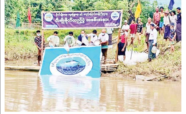
ပြည်ပအလင်းရောင်ကို အသုံးချပါ။ မလိုအပ်သော အိမ်တွင်းလျှပ်စစ်မီးများကို လျှော့သုံးပါ

ဘီးလင်း အောက်တိုဘာ ၂၀ မွန်ပြည်နယ်ငါးလုပ်ငန်းဦးစီးဌာနက ကြီးကြပ်၍ ဘီးလင်းမြို့နယ် ငါးလုပ်ငန်းဦးစီးဌာနက သဘာဝမြစ်ချောင်းများအတွင်း ငါးသယ်ဇာတများ ရေရှည်တည်တံ့စေရေးနှင့် ကျေးလက်နေပြည်သူများ ငါးရိက္ခာပိုမိုရရှိစားသုံးနိုင်ရေးအတွက် ဘီးလင်းမြို့နယ် ပေါက်တောကျေးရွာ ဇုတ်သုတ်ချောင်းအတွင်း ငါးမျိုးစိုက်ထည့်ခြင်း အခမ်းအနားကို အောက်တိုဘာ ၁၈ ရက် နံနက် ၈ နာရီခွဲက အဆိုပါကျေးရွာ၌ ကျင်းပခဲ့သည်။ ငါးမျိုးစိုက်ထည့်ပွဲအခမ်းအနားသို့ ဘီးလင်းမြို့နယ် ငါးမျိုးစိုက်ထည့်ခြင်းကြီးကြပ်ကွပ်ကဲရေးကော်မတီဥက္ကဋ္ဌနှင့် အဖွဲ့ဝင်များ၊ မြို့နယ်အဆင့်ဌာနဆိုင်ရာတာဝန်ရှိသူများ တက်ရောက်ကြပြီး သထုံငါးလုပ်ငန်းစခန်းမှ သားဖောက်ထုတ်လုပ်သော နှစ်လက်မအရွယ် ငါးမြစ်ချင်း၊ ရွှေပါငါးကြင်းနှင့် ငါးခုံးမကြီးငါးသားပေါက်ကောင်ရေတစ်သိန်းကို မျိုးစိုက်ထည့်ပေးခဲ့ကြောင်း သိရသည်။ သတင်းစဉ်