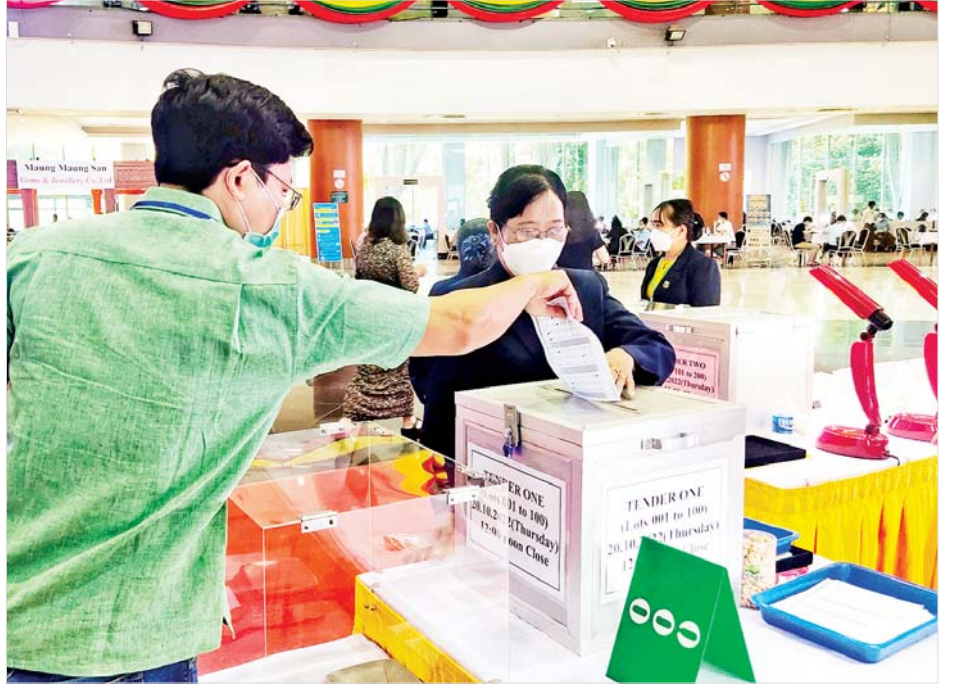
ပြည်တွင်း၊ ပြည်ပရတနာကုန်သည်များက ပုလဲအတွဲ ဈေးနှုန်းတင်သွင်းလွှာများကို တင်ဒါပုံများ အတွင်းသို့ ထည့်သွင်းကြစဉ်။

★ ကျော့ဖုံးမှ ပုလဲအတွဲအမှတ် (၁) မှ အတွဲအမှတ် (၂၀၀) အထိ တင်သွင်း ထားသော ဈေးနှုန်းတင်သွင်းလွှာများကို တာဝန်ရှိသူများက တင်ဒါအမှတ် (၁) ကို မွန်းလွဲ ၁ နာရီနှင့် တင်ဒါအမှတ် (၂) ကို ညနေ ၅ နာရီတွင် ဖွင့်ဖောက် စစ်ဆေးကာ ပုလဲအတွဲပေါင်း ၁၈၉ တွဲ ရောင်းချရ ကြောင်း ကြေညာသည်။ ပြည်ပတတ်ယနေ့တွင် ပုလဲအတွဲပေါင်း ၄၀၀ အနက်မှ ကျန်ရှိသည့် ပုလဲအတွဲအမှတ် (၂၀၁) မှ