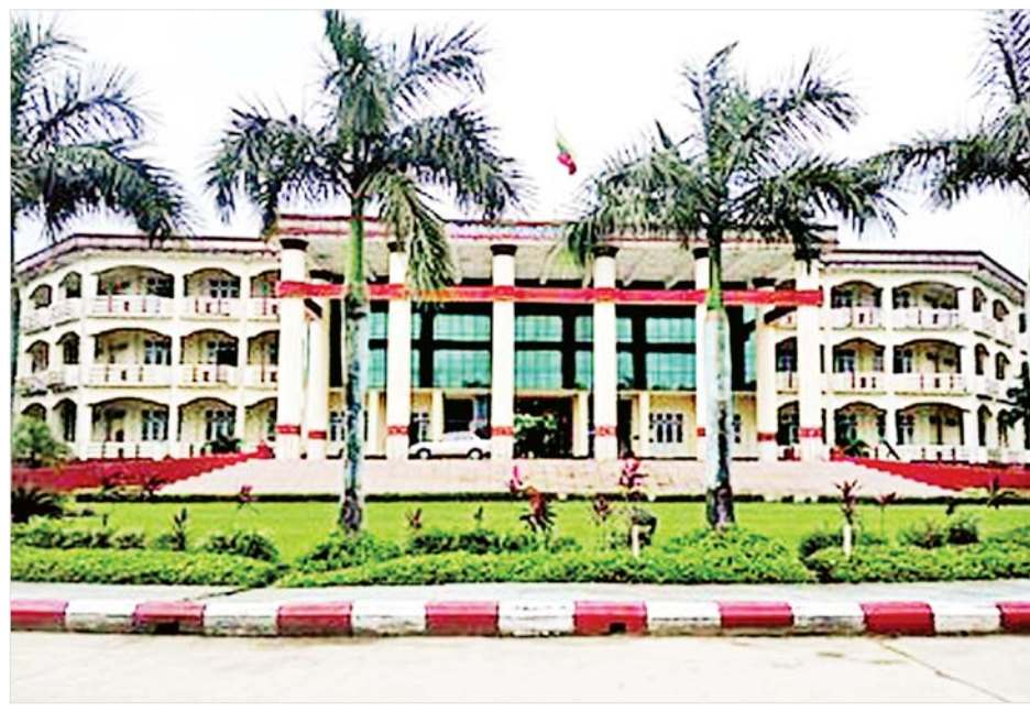
ရန်ကုန်တိုင်းဒေသကြီး ဒဂုံမြို့သစ် (ဆိပ်ကမ်း) မြို့နယ်တွင် ဖွင့်လှစ်ထားသည့် ပြည်ထောင်စု တိုင်းရင်းသားလူငယ်များ စွမ်းရည်ဖွံ့ဖြိုးရေးဒီဂရီကောလိပ်(ရန်ကုန်) ကိုတွေ့ရစဉ်။

★ စာမျက်နှာ ၁၀ မှ တိုင်းရင်းသားအသီးသီး၏ ဘာသာစကား၊ ရိုးရာဓလေ့စရိုက်များအား သင်ကြားဖလှယ်ခွင့်ရ ပို၍ထူးခြားသည်က ဤကျောင်းတော်များတွင် တိုင်းရင်းသားအသီးသီး၏ ဘာသာစကား၊ ရိုးရာ ဓလေ့စရိုက်များအား သင်ကြားဖလှယ်ခွင့် ရရှိကြ ခြင်းဖြစ်သည်။ မည်သည့်တိုင်းရင်းသား တိုင်းရင်း သူဖြစ်စေ နှစ်သက်ရာတိုင်းရင်းသားဘာသာစကား သင်ယူနိုင်သည်။ ဓလေ့စရိုက်များ လေ့လာနိုင် သည်။ ရိုးရာဝတ်စုံများ လဲလှယ်ကာ ဓာတ်ပုံရိုက်ကြ သည်။ ရိုးရာမုန့်များ တစ်လှည့်စီပြုလုပ်၍ မြိန်ရေ ရက်ရေစားကြသည်။ သူတို့တစ်တွေသည် ပြည်ထောင်စုသားဖြစ်ကြ၍ ဂုဏ်ယူဝင့်ကြား ကြသည်။ သူတို့တစ်တွေသည် မြန်မာနိုင်ငံသား ဖြစ်၍ ဂုဏ်ယူဝင့်ကြားကြသည်။ “စည်းလုံးခြင်း သည် အင်အား” ဟူသည့် ဖွံ့ဖြိုးရေးတက္ကသိုလ်၏ ဆောင်ပုဒ်ဖြစ်သည်။ သံယောဇဉ်တရားက စည်းလုံး ညီညွတ်ရေးကို အလိုအလျောက်ရရှိစေသည်။ စာမေးပွဲများပြီး၍ ကျောင်းပိတ်ရက်၊ အိမ်ပြန် ကြသောအခါ ကျောင်းသား ကျောင်းသူများက မိမိတို့ဒေသ၏ အထိမ်းအမှတ်တစ်ခုခုယူဆောင် လာကြသည်။ တူရိယာပစ္စည်းတစ်မျိုးမျိုး၊ ဒေသ ထွက် အထိမ်းအမှတ်တစ်ခုခုသည်တို့ကို ဖွံ့ဖြိုး ရေးတက္ကသိုလ်၏ ပြတိုက်တွင် စုစည်းထားရှိသည် ကို တွေ့နိုင်ပါသည်။ ဤကျောင်းတော်များတွင် ပြည်ထောင်စု စိတ်ဓာတ်ဘာသာရပ်၊ တိုင်းရင်းသားစည်းလုံး ညီညွတ်ရေးဘာသာရပ်၊ ဖွံ့ဖြိုးရေးဘာသာရပ်များ သင်ကြားကြရသည်။ သို့သော် စည်းလုံးညီညွတ် ရေးဟု အတင်းတိုက်တွန်းနေစရာမလို၊ နှစ်ကာလ များစွာ အတူတူနေထိုင် အတူတူရှင်သန်ခဲ့ကြသော ဤကျောင်းတော်သူ ကျောင်းတော်သားများ၏ သံယောဇဉ်အား စာသင်နှစ်ပြီးဆုံး၍ ကျောင်းဆင်း ချိန်တွင် ထင်ထင်ရှားရှားတွေ့နိုင်ပါသည်။