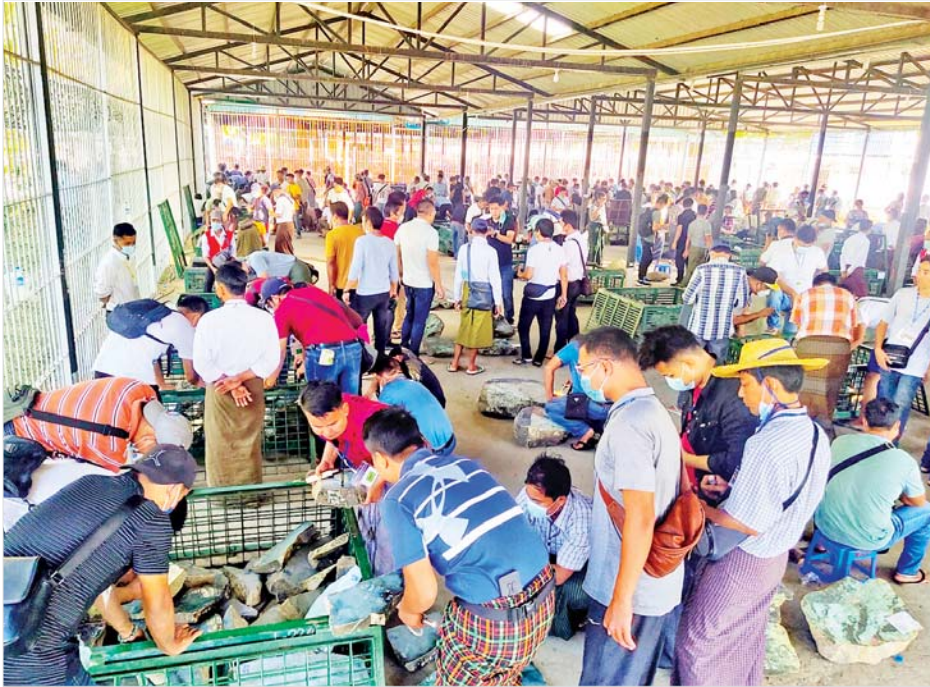
ပြည်တွင်း၊ ပြည်ပရတနာကုန်သည်များက သတ်မှတ်နေရာများအလိုက် ခင်းကျင်းပြသထားသည့် ကျောက်စိမ်းအရိုင်းတွဲများကို စိတ်ကြိုက်လေ့လာကြည့်ရှုကြစဉ်။