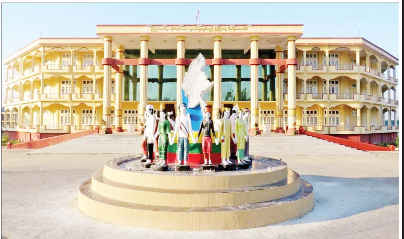
စစ်ကိုင်းမြို့နယ် အုန်းတောကျေးရွာအုပ်စုတွင် ပြောင်းရွှေ့ဖွင့်လှစ်ခဲ့သည့် ပြည်ထောင်စုတိုင်းရင်းသားလူငယ်များ စွမ်းရည်ဖွံ့ဖြိုးရေးဒီဂရီကောလိပ် (စစ်ကိုင်း) ကိုတွေ့ရစဉ်။

နယ်စပ်ရေးရာဝန်ကြီးဌာနသည် နယ်စပ်ဒေသနှင့်တိုင်းရင်းသားလူမျိုးများ ဖွံ့ဖြိုးတိုးတက်ရေးဦးစီးဌာနနှင့် ပညာရေးနှင့်လေ့ကျင့်ရေးဦးစီးဌာနဟူ၍ ဌာနကြီးနှစ်ခုဖြင့် ဖွဲ့စည်းထားပါသည်။ ဝန်ကြီးဌာန၏ ဦးတည်ချက် (၈) ရပ်တွင် “နယ်စပ်ဒေသမှ တိုင်းရင်းသားလူငယ်များအား အခြေခံနှင့် အဆင့်မြင့် အသက်မွေးဝမ်းကျောင်းပညာရပ်များ သင်ကြားလေ့ကျင့်ပေးရန်” ဟူသော ဦးတည်ချက်နှင့်အညီ အခြေခံပညာရပ်များအတွက် နယ်စပ်ဒေသတိုင်းရင်းသားလူငယ်များ ဖွံ့ဖြိုးရေးသင်တန်းကျောင်း ၄၄ ကျောင်း၊ အသက်မွေးဝမ်းကျောင်းပညာရပ်များအတွက် နယ်စပ်ဒေသတိုင်းရင်းသားလူငယ်များ ကိုးကျောင်း၊ အမျိုးသမီးအိမ်တွင်းမှု သက်မွေးလုပ်ငန်းပညာသင်တန်းကျောင်း ၄၆ ကျောင်း၊ အဆင့်မြင့်ပညာရပ်များအတွက် ပြည်ထောင်စုတိုင်းရင်းသားလူမျိုးများ ဖွံ့ဖြိုးရေးတက္ကသိုလ် (စစ်ကိုင်း) နှင့် ပြည်ထောင်စုတိုင်းရင်းသားလူငယ်များ စွမ်းရည်ဖွံ့ဖြိုးရေးဒီဂရီကောလိပ် (ရန်ကုန်နှင့် စစ်ကိုင်း) တို့ကို တည်ထောင်ဖွင့်လှစ်ထားပါသည်။