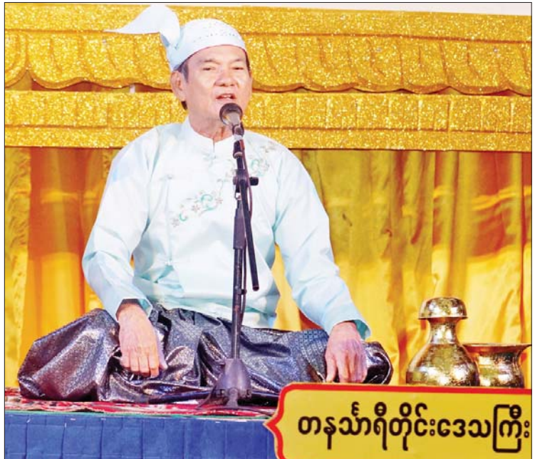
ကွက်စိပ်ပြိုင်ပွဲ ဝါသနာရှင်အဆင့်(ပထမတန်း) အမျိုးသားပြိုင်ပွဲတွင် တနင်္သာရီတိုင်းဒေသကြီးမှ ပြိုင်ပွဲဝင်တစ်ဦး “မဟော်သဓာဇာတ်တော်ကြီး” ခေါင်းစဉ်ဖြင့် ယှဉ်ပြိုင်စဉ်။

ယနေ့ပြိုင်ပွဲများ ကျင်းပရာ နေရာအသီးသီးသို့ ပြည်ထောင်စုအဆင့်ပုဂ္ဂိုလ်များ၊ ဒုတိယဝန်ကြီးများ၊ တိုင်းဒေသကြီးနှင့် ပြည်နယ်များမှ တိုင်းရင်းသားလူမျိုးရေးရာဝန်ကြီးများ၊ လူမှုရေးဝန်ကြီးများနှင့် တာဝန်ရှိသူများ လာရောက်ကြည့်ရှုအားပေးခဲ့ကြသည်။