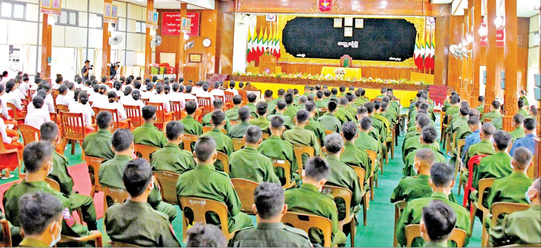
နိုင်ငံတော်စီမံအုပ်ချုပ်ရေးကောင်စီဥက္ကဋ္ဌ တပ်မတော်ကာကွယ်ရေးဦးစီးချုပ် ဗိုလ်ချုပ်မှူးကြီးမင်းအောင်လှိုင် အရှေ့တောင်တိုင်းစစ်ဌာနချုပ် မော်လမြိုင်တပ်နယ်မှ အရာရှိ၊ စစ်သည်၊ မိသားစုများအား တွေ့ဆုံအမှာစကားပြောကြားစဉ်။

တစ်ဦးချင်း အားထည့်ဆောင်ရွက်ခြင်းနှင့် စုစည်းညီညွတ်သည့်အားဖြင့် ဆောင်ရွက်ခြင်းသည် တပ်တွင်းစည်းလုံးညီညွတ်မှုကို ပိုမိုအောင်မြင်စေမည်၊ တိုင်းပြည်တည်ဆောက်ရေးလုပ်ငန်းများတွင် တပ်မတော်၏ စုစည်းညီညွတ်သည့်အားကို အသုံးပြုတည်ဆောက် ခေါင်းဆောင်မှုမှန်ကန်ပြီး တပ်မတော်အတွင်း စည်းလုံးညီညွတ်မှုရှိနေသည့် ကာလတစ်လျှောက်လုံး တိုင်းပြည်ကိုဖြိုခွဲ၍ ရနိုင်မည်မဟုတ်