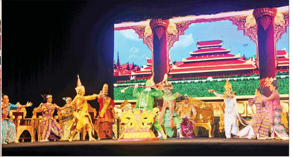
(၂၃) ကြိမ်မြောက် မြန်မာ့ရိုးရာယဉ်ကျေးမှု အဆို၊ အက၊ အရေး၊ အတီး ပြိုင်ပွဲ ကျင်းပရေး ဦးစီးကော်မတီနာယက နိုင်ငံတော်စီမံအုပ်ချုပ်ရေးကောင်စီ ဒုတိယဥက္ကဋ္ဌ ဒုတိယဝန်ကြီးချုပ် ဒုတိယ ဗိုလ်ချုပ်မှူးကြီး စိုးဝင်း သာသနာရေးနှင့် ယဉ်ကျေးမှုဝန်ကြီးဌာနရှိ လေ့ကျင့်ရေးဇာတ်ရုံ၌ ကျင်းပသည့် “ရာမာယဏ” ဇာတ်တော်ကြီးပြိုင်ပွဲအား ကြည့်ရှုအားပေးစဉ်။