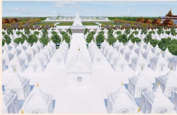
ကျောက်စာရုံစေတီ(၁၂ x ၁၂x ၁၈)ပေ ၁ ဆူ တန်ဖိုး- ၂၇၉ သိန်း