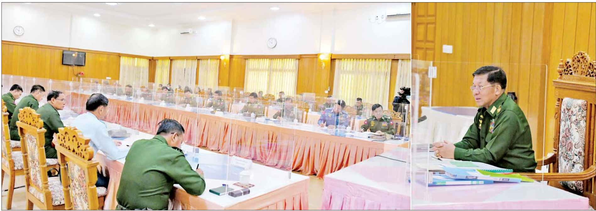
နိုင်ငံတော်စီမံအုပ်ချုပ်ရေးကောင်စီဥက္ကဋ္ဌ တပ်မတော်ကာကွယ်ရေးဦးစီးချုပ် ဗိုလ်ချုပ်မှူးကြီးမင်းအောင်လှိုင် ပြင်ဦးလွင်တပ်နယ်ရှိ စစ်တက္ကသိုလ်၊ တပ်မတော်နည်းပညာတက္ကသိုလ်နှင့် လေ့ကျင့်ရေးကျောင်းများ၏ လေ့ကျင့်ရေးဆိုင်ရာညှိနှိုင်းအစည်းအဝေးတွင် အမှာစကားပြောကြားစဉ်။

နေပြည်တော် အောက်တိုဘာ ၁၆ ပြင်ဦးလွင်တပ်နယ်ရှိ စစ်တက္ကသိုလ်၊ တပ်မတော် နည်းပညာတက္ကသိုလ်နှင့် လေ့ကျင့်ရေးကျောင်း များ၏ လေ့ကျင့်ရေးဆိုင်ရာညှိနှိုင်းအစည်းအဝေးကို ယနေ့မွန်းလွဲပိုင်းတွင် ပြင်ဦးလွင်မြို့ရှိ တပ်မတော် ဧည့်ဂေဟာ အစည်းအဝေးခန်းမ၌ ကျင်းပပြုလုပ်ရာ နိုင်ငံတော်စီမံအုပ်ချုပ်ရေးကောင်စီဥက္ကဋ္ဌ တပ်မတော် ကာကွယ်ရေးဦးစီးချုပ် ဗိုလ်ချုပ်မှူးကြီး မင်းအောင်လှိုင် တက်ရောက်၍ လိုအပ်သည်များ လမ်းညွှန်မှာကြား သည်။