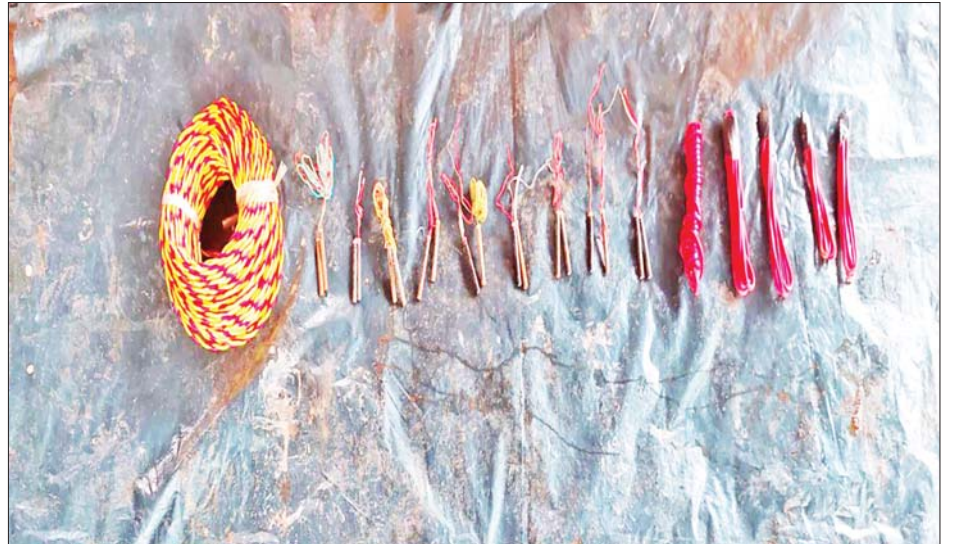
ဖာပွန်မြို့နှင့် ကမမောင်းမြို့သွား ကားလမ်းတစ်လျှောက်မှ ငါးဂါလန်ပုံးဖြင့်ပြုလုပ်ထားသည့် ဒေသန္တရလက်လုပ် ဆွဲမိုင်း ၂၃ လုံးနှင့် ဆက်စပ်ပစ္စည်းများကို တွေ့ရစဉ်။

နေပြည်တော် အောက်တိုဘာ ၁၆ NUG နှင့် PDF အမည်ခံ အကြမ်းဖက်သမားများ သည် အေးချမ်းစွာနေထိုင်လျက်ရှိသည့် ပြည်သူလူထု များနှင့် တရားဥပဒေစိုးမိုးရေးအတွက် ဆောင်ရွက် နေသည့် အုပ်ချုပ်ရေးတာဝန်ရှိသူများ ထိခိုက်ဒဏ်ရာ ရရှိစေရန်နှင့် လမ်းပန်းဆက်သွယ်မှုများ လုံခြုံ ချောမွေ့မှုမရှိစေရေး ရည်ရွယ်ချက်ဖြင့် အများ ပြည်သူအသုံးပြုသည့် လမ်းကြောင်းများတွင် မိုင်းထောင်ခြင်း၊ ပစ်ခတ်တိုက်ခိုက်ခြင်းများ အကြမ်း ဖက်ဖောက်ခွဲရေးလုပ်ရပ်များ လုပ်ဆောင်လျက်ရှိသည်။