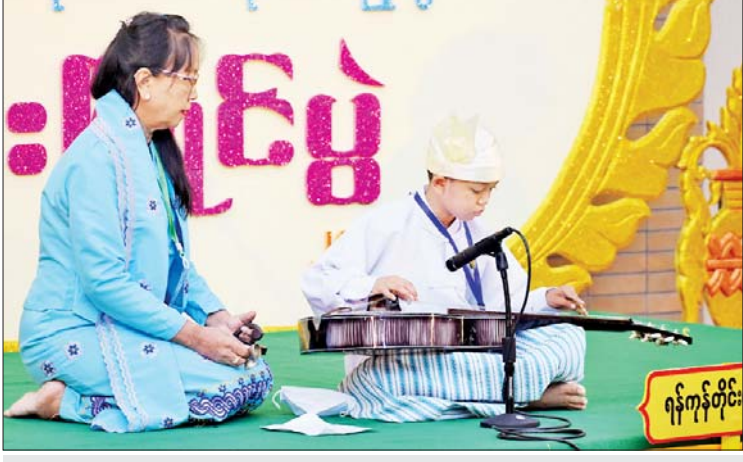
ဂီတာပြိုင်ပွဲ အခြေခံပညာအဆင့်(အသက် ၁၀ နှစ်မှ ၁၅ နှစ်အတွင်း) အမျိုးသား ပြိုင်ပွဲတွင် ရန်ကုန်တိုင်းဒေသကြီးမှ ပြိုင်ပွဲဝင်တစ်ဦးက “မှန်ရဝေ” (ပတ်ပျိုး)ဖြင့် တီးခတ်ယှဉ်ပြိုင်စဉ်။

ရုပ်စုံသဘင်အဖွဲ့လိုက် ဝါသနာရှင်အဆင့် (ပထမတန်း)ပြိုင်ပွဲတွင် ပဲခူးတိုင်းဒေသ ကြီး ကိုယ်စားပြု မိုးပြည့်မြင့်မိုရ်ရုပ်စုံ သဘင်အဖွဲ့က မြန်မာ့ရိုးရာယဉ်ကျေးမှု အမွေအနှစ်များကို ဖော်ကျူးသည့် အက အလှများ၊ စကားပြောများဖြင့် တင်ဆက်