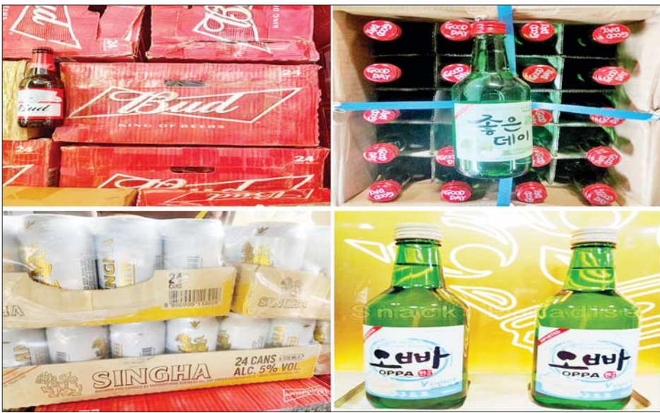
မန္တလေးတိုင်းဒေသကြီး၌ ဖမ်းဆီးရမိမှု။

နေပြည်တော် အောက်တိုဘာ ၁၆ တရားမဝင် ကုန်သွယ်မှု တိုက်ဖျက်ရေးဦးဆောင်ကော်မတီ ၏ ကြီးကြပ်ကွပ်ကဲမှုဖြင့် တရားမဝင် ကုန်သွယ်မှုများကို ဥပဒေနှင့်အညီ ထိရောက်စွာ တားဆီး အရေးယူနိုင်ရေး ဆောင်ရွက်လျက်ရှိရာ အောက်တိုဘာ ၁၂ ရက်တွင် ဧရာဝတီတိုင်းဒေသကြီး တရားမဝင်ကုန်သွယ်မှု တိုက်ဖျက်ရေး အထူးအဖွဲ့၏ စီမံခန့်ခွဲမှုဖြင့် တိုင်းဒေသကြီး သစ်တောဦးစီးဌာန ဦးဆောင်သော ပူးပေါင်းစစ်ဆေးရေးအဖွဲ့က သတင်းအရ စစ်ဆေးမှုများ ဆောင်ရွက်ခဲ့ရာ ဟင်္သာတခရိုင် ကြိုင်ခင်းမြို့နယ် ထိန်ပင်မြေခင်း ကျေးရွာရှိ နေအိမ်တစ်အိမ်၏ ခြံဝင်းအတွင်း၌ တရားမဝင် ကျွန်းသစ် သုည ဒသမ ၉၀၈၈ တန် (ခန့်မှန်းတန်ဖိုး ငွေကျပ် ၅၉၉၈၀၀)ကို သိမ်းဆည်းရမိခဲ့ပြီး သစ်တောဥပဒေနှင့်အညီ အရေးယူ ဆောင်ရွက်လျက်ရှိသည်။ အလားတူ အောက်တိုဘာ ၁၄ ရက်တွင် မန္တလေးတိုင်းဒေသကြီး တရားမဝင်ကုန်သွယ်မှု တိုက်ဖျက်ရေး အထူးအဖွဲ့၏ စီမံခန့်ခွဲမှုဖြင့် စစ်ဆေးမှုများ ဆောင်ရွက်ခဲ့ရာ ချမ်းမြသာစည်မြို့နယ် ကန် သာယာရပ်ကွက်ရှိ ခိုင်ခိုင်တစ်လုံး အတွင်း၌ တရားဝင်စာရွက် စာတမ်း အထောက်အထား တင်ပြနိုင်ခြင်းမရှိသော BUD BEER၊ MUHAK SOJU နှင့် SPY WINE များ (ခန့်မှန်းတန်ဖိုးငွေကျပ် ၅၀၅၂၉၄၄၀)ကို လည်းကောင်း၊ ချမ်းအေးသာစံမြို့နယ် ဟေမာ ဇလရပ်ကွက်ရှိ နေအိမ်အတွင်း၌ တရားဝင် စာရွက်စာတမ်း အထောက်အထား တင်ပြနိုင်ခြင်း မရှိသော DUNFIFE Blended Scotch Whisky နှင့် Fortant De