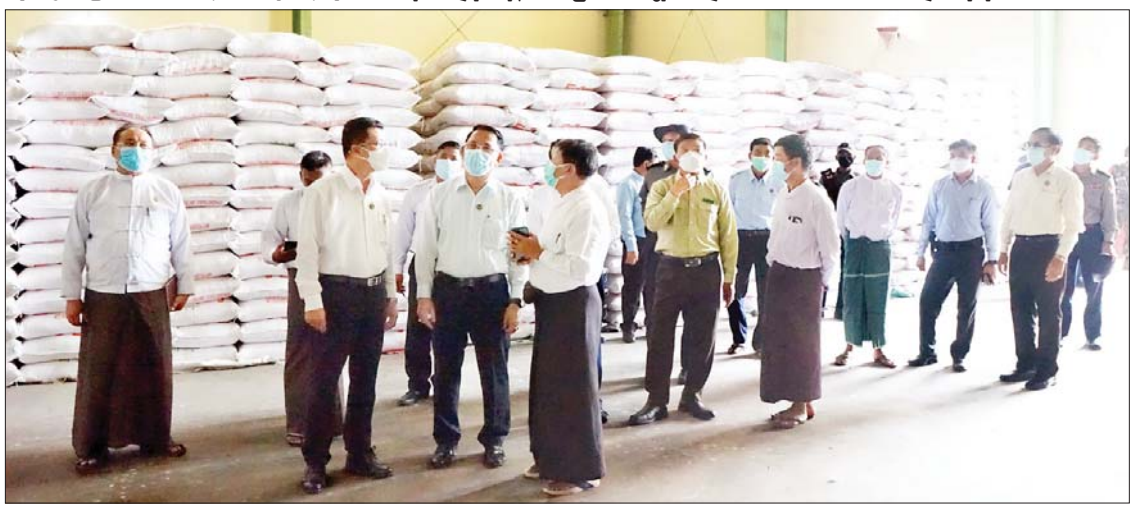
ပြည်ထောင်စုဝန်ကြီး ဦးမောင်မောင်အုန်းနှင့် တိုင်းဒေသကြီး ဝန်ကြီးချုပ် ဦးတင်မောင်ဝင်းတို့ မြောင်းမြမြို့ စက်မှုဇုန်ရှိ ခိုင်ဖြိုးကျော်ပုဂ္ဂလိကဆန်စက်အတွင်း လှည့်လည်ကြည့်ရှုကြစဉ်။

ဝေဖြိုးထွန်း ဆန်စက်ခြောက်လုံး၊ ဆန်ကွဲမှ ထုတ်လုပ်သော ကပ်စေးနဲ သကြားရည် စက်ရုံ နှစ်ရုံ၊ မနောသုနှင့် မြသီတာ ပေါင်းဆန်စက်ရုံ နှစ်ရုံ၊ ကွမ်းသီးပေါင်းစက်ရုံ တစ်ရုံနှင့် ကွန်ကရစ်တိုင်လုပ်ငန်းစက်ရုံတို့ စုဖွဲ့တည်ဆောက်၍ လုပ်ငန်းများ ဆောင်ရွက်နေခြင်းဖြစ်သည်။