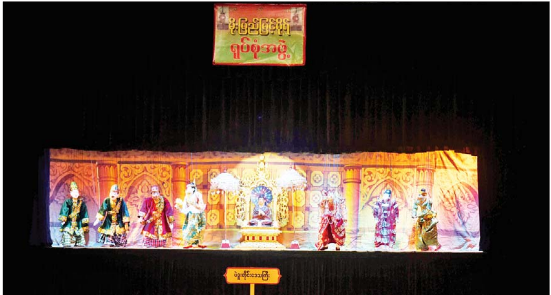
ရုပ်စုံသဘင် အဖွဲ့လိုက် ဝါသနာရှင်အဆင့်(ပထမတန်း)ပြိုင်ပွဲတွင် ပဲခူးတိုင်းဒေသကြီး ကိုယ်စားပြု မိုးပြည့်မြင့်မိုရ်ရုပ်စုံသဘင်အဖွဲ့ ယှဉ်ပြိုင်စဉ်။

ပဲခူးတိုင်းဒေသကြီးတို့မှ ပြိုင်ပွဲဝင်များက “တောနှင့်တောင်စွယ်” (ယိုးဒယား) ဖြင့်လည်းကောင်း၊ ရန်ကုန်တိုင်းဒေသကြီးနှင့် မန္တလေးတိုင်းဒေသကြီးတို့မှ ပြိုင်ပွဲဝင်များက “စန္ဒကိန္နရီ”(ကာလပေါ) ဖြင့်လည်းကောင်း၊ ဝါသနာရှင်အဆင့် (ဒုတိယတန်း) အမျိုးသမီးပြိုင်ပွဲတွင်