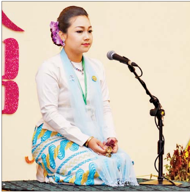
အမျိုးဂုဏ်၊ ဇာတိဂုဏ်ဖြင့်တင်ရေးတေးသီချင်း အဆိုပြိုင်ပွဲ ဝါသနာရှင်အဆင့်(ဒုတိယတန်း) အမျိုးသမီးပြိုင်ပွဲတွင် ဧရာဝတီတိုင်း ဒေသကြီးမှ ပြိုင်ပွဲဝင်တစ်ဦး “ကောင်းစားတော့မည်” သီချင်းဖြင့် ယှဉ်ပြိုင်စဉ်။