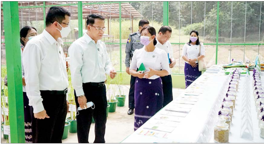
ပြည်ထောင်စုဝန်ကြီး ဦးမောင်မောင်အုန်းနှင့် တိုင်းဒေသကြီး ဝန်ကြီးချုပ် ဦးတင်မောင်ဝင်း မြောင်းမြမြို့ ဒေသသုတေသနဗဟိုဌာန၌ မျိုးစေ့ထုတ်လုပ်ထားမှုကို ကြည့်ရှုစဉ်။

ပုသိမ် အောက်တိုဘာ ၁၆ ပြည်ထောင်စုဝန်ကြီးဌာနပြည်ထောင်စုဝန်ကြီး ဦးမောင်မောင်အုန်းနှင့် ရောဂါတိုင်းဒေသကြီး ဝန်ကြီးချုပ် ဦးတင်မောင်ဝင်းတို့သည် ယနေ့တွင် ကျရောက်သော ကမ္ဘာ့စားနပ်ရိက္ခာနေ့ကို ဂုဏ်ပြုသောအားဖြင့် ရောဂါတိုင်းဒေသကြီးအတွင်းရှိ စိုက်ပျိုးမွေးမြူရေး အခြေခံစားသောက်ကုန် ထုတ်လုပ်မှုများကို ကြည့်ရှုပြီး နိုင်ငံတော်ဝန်ကြီးချုပ်၏ လမ်းညွှန်ချက်အရ အသေးစား၊ အငယ်စားနှင့် အလတ်စားစက်မှုလုပ်ငန်း (MSME) များကို ကြည့်ရှုအားပေးကြသည်။