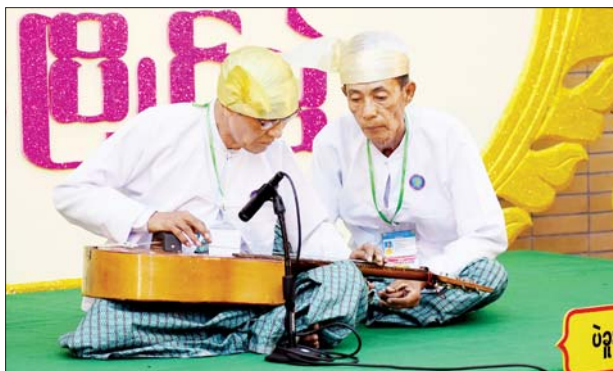
ဂီတာပြိုင်ပွဲတွင် ပဲခူးတိုင်းဒေသကြီးမှ ပြိုင်ပွဲဝင်တစ်ဦး တီးခတ် ယှဉ်ပြိုင်စဉ်။