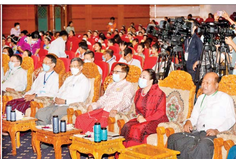
နိုင်ငံတော်စီမံအုပ်ချုပ်ရေးကောင်စီအဖွဲ့ဝင် ဒေါက်တာဗညားအောင်မိုး နေပြည်တော်ရှိ မြန်မာအပြည်ပြည်ဆိုင်ရာကွန်ဗင်းရှင်းဗဟိုဌာန(၂) Plenary Hall ၌ ကျင်းပသည့် မွန်တိုင်းရင်းသားရိုးရာ အကပြိုင်ပွဲ ပြိုင်ပွဲဝင်အဖွဲ့များ၏ ယှဉ်ပြိုင်နေမှုများကို ကြည့်ရှုအားပေးစဉ်။

ကပြယှဉ်ပြိုင် အဆိုပါပြိုင်ပွဲတွင် အလွတ်တန်း အဆင့် တိုင်းဒေသကြီးနှင့် ပြည်နယ်များမှ ပြိုင်ပွဲဝင် အက အဖွဲ့များက ဟင်္သာတို့ရဲ့ပျော်ရာမြေ သီချင်းနောက်ခံဖြင့် လှပတင့်တယ် ကျက်သရေရှိလှသည့် မွန် တိုင်းရင်းသားရိုးရာ ကကြိုး၊ ကကွက်များကို ညီညာလှပ ကျွမ်းကျင်ပိုင်နိုင်စွာ ကပြယှဉ်ပြိုင် ကြသည်။