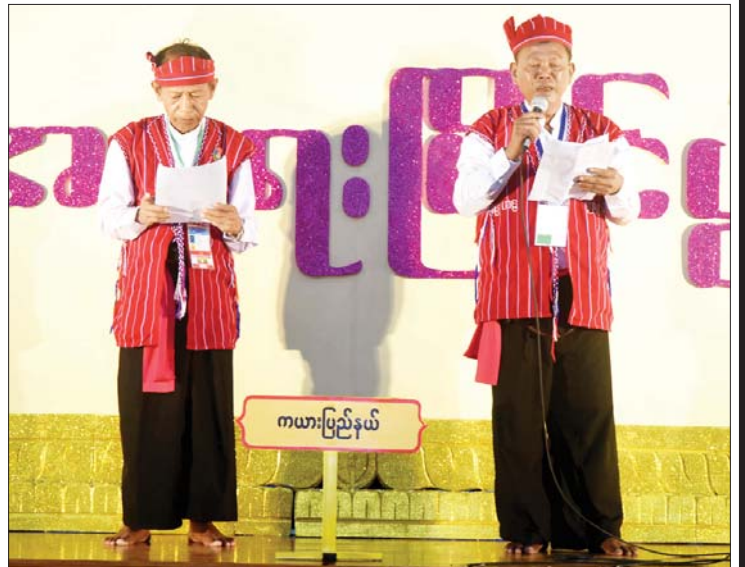
ဝါသနာရှင်အဆင့် (ပထမတန်း)အရေးပြိုင်ပွဲတွင် ကယားပြည်နယ်မှ ပြိုင်ပွဲ ဝင်များ “ထိန်းသိမ်းစို့လေ ရိုးရာအမွေ” ခေါင်းစဉ်ဖြင့် ယှဉ်ပြိုင်စဉ်။