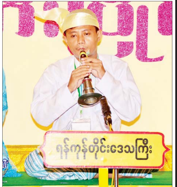
နဲ့ပြိုင်ပွဲ ဝါသနာရှင်အဆင့် (ပထမတန်း)အမျိုးသားပြိုင်ပွဲတွင် ရန်ကုန်တိုင်းဒေသကြီးမှ ပြိုင်ပွဲဝင်တစ်ဦး “ကြဲကြဲဖန်ဖန်” (ယိုးဒယား)ဖြင့် တီးမှုတ်ယှဉ်ပြိုင်စဉ်။