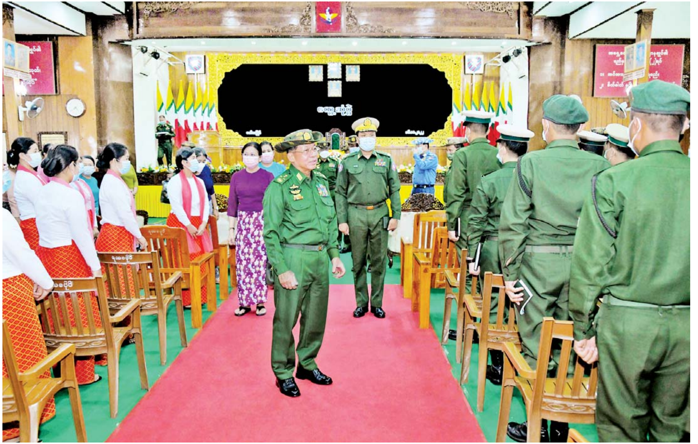
နိုင်ငံတော်စီမံအုပ်ချုပ်ရေးကောင်စီဥက္ကဋ္ဌ တပ်မတော်ကာကွယ်ရေးဦးစီးချုပ် ဗိုလ်ချုပ်မှူးကြီးမင်းအောင်လှိုင် အရှေ့တောင်တိုင်းစစ်ဌာနချုပ် မော်လမြိုင်တပ်နယ်မှ အရာရှိ စစ်သည်၊ မိသားစုများအား ရင်းရင်းနှီးနှီးနှုတ်ဆက်စဉ်။

စိတ်ဓာတ်ပိုင်းဆိုင်ရာနှင့် ပတ်သက်၍ တပ်တွင်း စည်းလုံးညီညွတ်ရေးနှင့် သက်သာချောင်ချိရေးလုပ်ငန်းများ ကောင်းမွန်အောင်မြင်ပါက စိတ်ဓာတ်