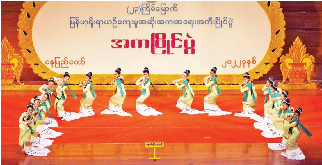
မွန်တိုင်းရင်းသားရိုးရာအက အလွတ်တန်းပြိုင်ပွဲတွင် ဧရာဝတီတိုင်းဒေသကြီးမှ မနန်းအိမြတ်ထက်နှင့်အဖွဲ့ ကပြ ယှဉ်ပြိုင်စဉ်။