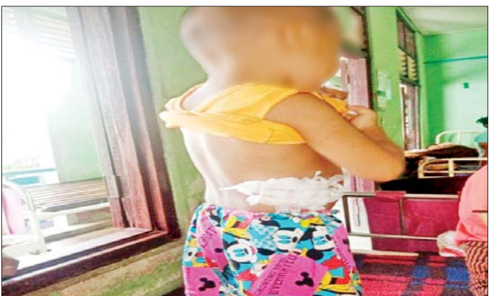
အသက်လေးနှစ်အရွယ်ကလေးငယ်တစ်ဦး ထိခိုက်ဒဏ်ရာရရှိမှုကို တွေ့ရစဉ်။

ကလေးငယ်တစ်ဦးစွဲထိမှန် ဖြစ်စဉ်မှာ ပခုက္ကူမြို့နယ် ဘုန်းကံကျေးရွာ အတွင်းသို့ ယနေ့နံနက် ၉ နာရီခွဲခန့်တွင် PDF အမည်ခံ အကြမ်းဖက်သမားများက Drone ယာဉ် တစ်စီးအသုံးပြု၍ လက်လုပ်ပုံးနှစ်လုံး ရမ်းသန်း ဖြုတ်ချတိုက်ခိုက်ခဲ့ကြောင်း၊ ထိုသို့တိုက်ခိုက်ခြင်း ကြောင့် ဘုန်းကံကျေးရွာအလယ်တန်းကျောင်း အတွင်း ကျရောက်ပေါက်ကွဲခဲ့ပြီး အလျားပေ ၁၂၀၊ အနံပေ ၆၀ ရှိ စာသင်ဆောင်၏ မျက်နှာကြက်နှင့်