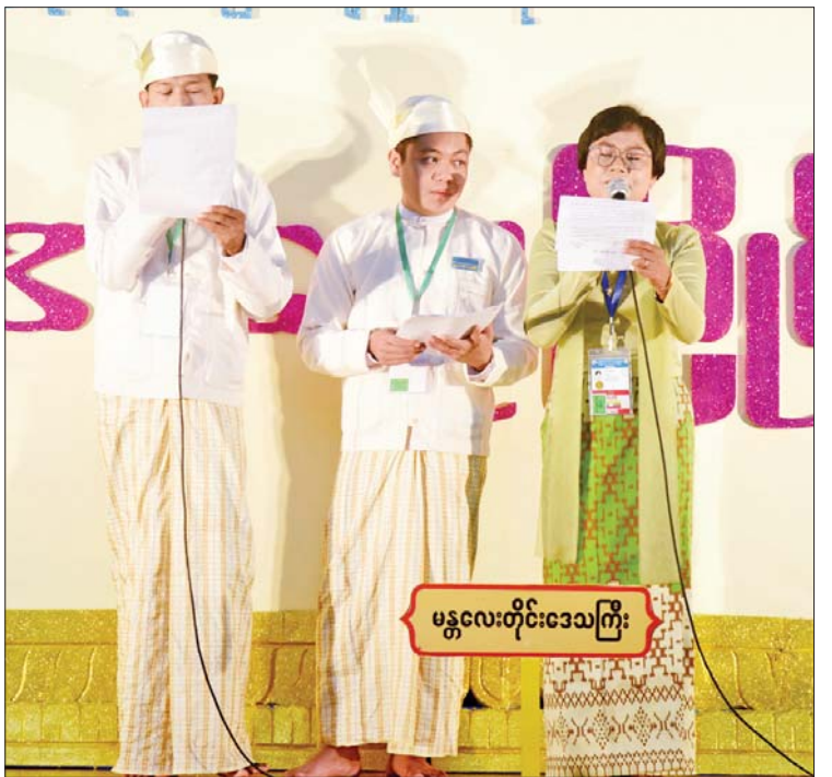
အရေးပြိုင်ပွဲ ဝါသနာရှင်အဆင့် (ပထမတန်း)ပြိုင်ပွဲတွင် မန္တလေးတိုင်းဒေသကြီး ပြိုင်ပွဲဝင်များ “ထိန်းသိမ်းစိုလေ ရိုးရာအမွေ” ခေါင်းစဉ်ဖြင့် ယှဉ်ပြိုင်စဉ်။

(ပတ်ပျိုး)ဖြင့် လည်းကောင်း၊ စစ်ကိုင်းတိုင်းဒေသကြီးမှ ပြိုင်ပွဲ ဝင်က “ဟေမဝန်ချာ”(ဘွဲ့)ဖြင့် လည်းကောင်း၊ ဝါသနာရှင်အဆင့် (ဒုတိယတန်း) အမျိုးသားပြိုင်ပွဲတွင် မန္တလေးတိုင်းဒေသကြီး၊ ပဲခူးတိုင်းဒေသကြီးနှင့် ချင်းပြည်နယ်တို့မှ ပြိုင်ပွဲဝင်များက “လေပြည်ဆော်သွင်း