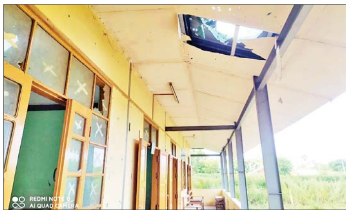
ပခုက္ကူမြို့နယ် ဘုန်းကံကျေးရွာ စာသင်ကျောင်း ထိခိုက်ပျက်စီးမှုကို တွေ့ရစဉ်။

နေပြည်တော် အောက်တိုဘာ ၁၆ မကွေးတိုင်းဒေသကြီး ပခုက္ကူမြို့နယ် ဘုန်းကံကျေးရွာအတွင်းသို့ ယနေ့နံနက်ပိုင်းတွင် PDF အမည်ခံ အကြမ်းဖက်သမားများက Drone ယာဉ် အသုံးပြု၍ လက်လုပ်ပုံးများ ရမ်းသန်းဖြုတ်ချ တိုက်ခိုက်ခဲ့ခြင်းကြောင့် အပြစ်မဲ့ပြည်သူ အသက် လေးနှစ်အရွယ်ကလေးငယ်တစ်ဦး ထိခိုက်ဒဏ်ရာရရှိခဲ့ ကြောင်း သိရသည်။