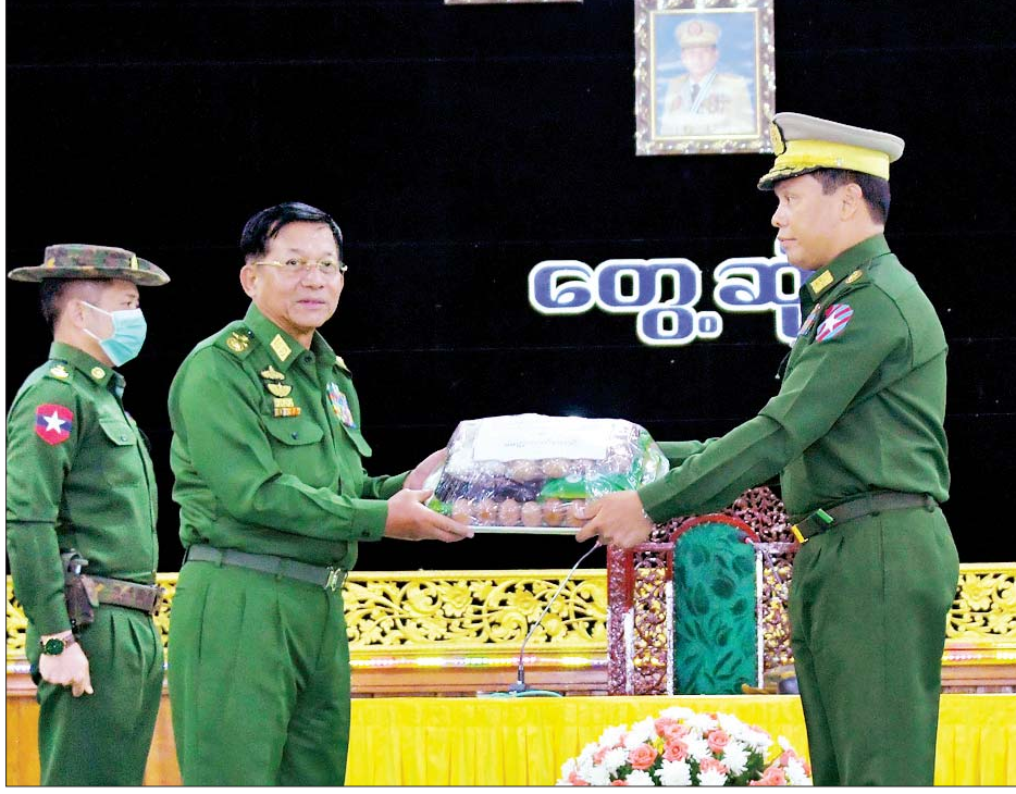
နိုင်ငံတော်စီမံအုပ်ချုပ်ရေးကောင်စီဥက္ကဋ္ဌ တပ်မတော်ကာကွယ်ရေးဦးစီးချုပ် ဗိုလ်ချုပ်မှူးကြီး မင်းအောင်လှိုင်က အရှေ့တောင်တိုင်းစစ်ဌာနချုပ် မော်လမြိုင်တပ်နယ်မှ အရာရှိ၊ စစ်သည်၊ မိသားစုများ အတွက် စားသောက်ဖွယ်ရာပစ္စည်းများကို ပေးအပ်ရာ တိုင်းမှူးက လက်ခံရယူစဉ်။

တပ်တွင်းစည်းလုံးညီညွတ်ရေးကို အောင်မြင်စွာ တည်ဆောက်