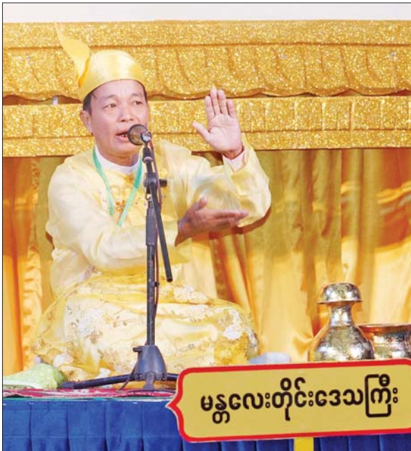
ကွက်စိပ်ပြိုင်ပွဲ ဝါသနာရှင်အဆင့်(ပထမတန်း) အမျိုးသား ပြိုင်ပွဲတွင် မန္တလေးတိုင်းဒေသကြီးမှ ပြိုင်ပွဲဝင်တစ်ဦး “မဟော် သဓာဇာတ်တော်ကြီး” ခေါင်းစဉ်ဖြင့် ယှဉ်ပြိုင်စဉ်။