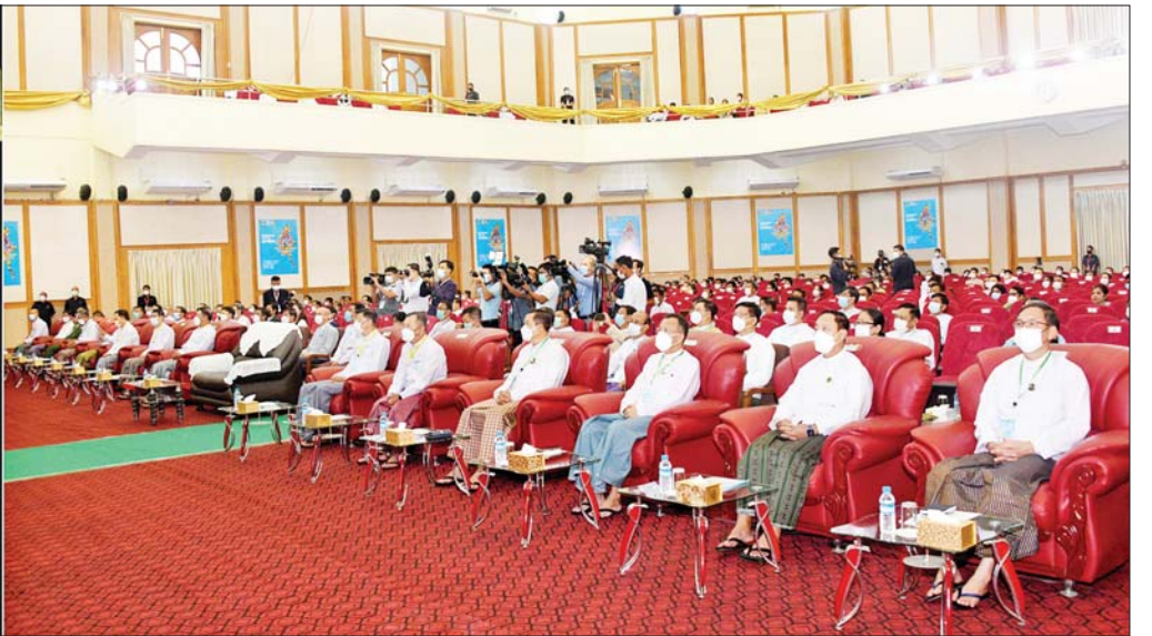
နိုင်ငံတော်စီမံအုပ်ချုပ်ရေးကောင်စီ ဒုတိယဥက္ကဋ္ဌ ဒုတိယဝန်ကြီးချုပ် ဒုတိယဗိုလ်ချုပ်မှူးကြီးစိုးဝင်း ၂၀၂၂ ခုနှစ် ကမ္ဘာ့စားနပ်ရိက္ခာနေ့ အခမ်းအနားတွင် အမှာစကားပြောကြားစဉ်။

စားနပ်ရိက္ခာချို့တဲ့သူဦးရေမြင့်တက်လာ ကမ္ဘာပေါ်၌ အစာရေစာလုံလောက်စွာ စားသုံးနိုင်ခြင်းမရှိသူဦးရေသည် မြင့်တက်နေဆဲဖြစ်ကြောင်း၊ ၂၀၂၁ ခုနှစ်တွင် စားနပ်ရိက္ခာမဖူလုံသူ လူဦးရေ ၈၂၈ သန်း ကျော်ရှိကြောင်းနှင့် ပြီးခဲ့သည့် နှစ်နှစ်အတွင်း စားနပ်ရိက္ခာချို့တဲ့သူဦးရေ ၁၃၅ သန်းမှ ၁၉၃ သန်းအထိ မြင့်တက်လာခဲ့ကြောင်းကို ကမ္ဘာ့စားနပ်ရိက္ခာနှင့် စိုက်ပျိုးရေးအဖွဲ့ကြီးက ထုတ်ပြန်ထားကြောင်း။ ထို့ပြင် ယနေ့ တစ်ကမ္ဘာလုံးရင်ဆိုင်