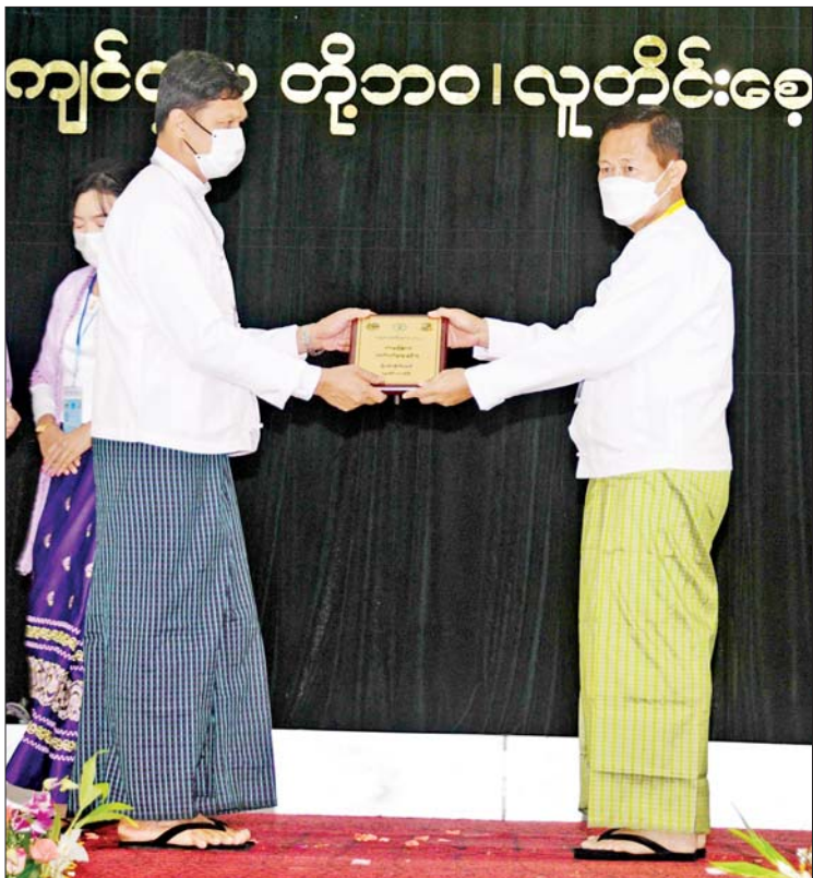
နိုင်ငံတော်စီမံအုပ်ချုပ်ရေးကောင်စီ ဒုတိယဥက္ကဋ္ဌ ဒုတိယဝန်ကြီးချုပ် ဒုတိယဗိုလ်ချုပ်မှူးကြီးစိုးဝင်း မွေးမြူရေးကဏ္ဍဆိုင်ရာ ထူးချွန်ဆုရရှိသူ တစ်ဦးအား ဆုပေးအပ်ချီးမြှင့်စဉ်။

ထိုသို့ ဆောင်ရွက်နိုင်ခဲ့ခြင်းသည် စိုက်ပျိုးမွေးမြူထုတ်လုပ်သူ တောင်သူလယ်သမားကြီးများနှင့် ထုတ်လုပ်မှုလုပ်ငန်းစဉ်တစ်လျှောက် ပါဝင်သူများ၏ လက်မလျှော့တမ်း ကြိုးပမ်းမှုများကြောင့်