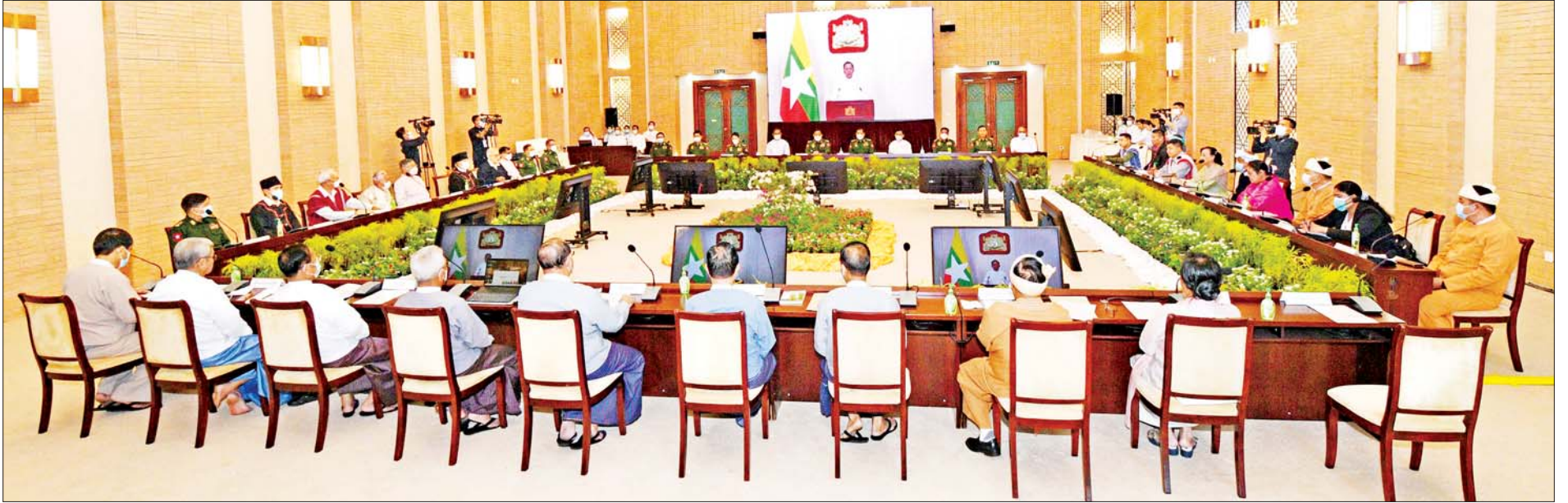
တစ်နိုင်ငံလုံး ပစ်ခတ်တိုက်ခိုက်မှုရပ်စဲရေးသဘောတူစာချုပ်(NCA) လက်မှတ်ရေးထိုးခြင်း (၇)နှစ်မြောက်နှစ်ပတ်လည်နေ့ တွေ့ဆုံပွဲအခမ်းအနားတွင် နိုင်ငံတော်စီမံအုပ်ချုပ်ရေးကောင်စီဥက္ကဋ္ဌ နိုင်ငံတော်ဝန်ကြီးချုပ် အမျိုးသားစည်းလုံးညီညွတ်ရေးနှင့် ငြိမ်းချမ်းရေးဖော်ဆောင်မှုဗဟိုကော်မတီဥက္ကဋ္ဌ တပ်မတော်ကာကွယ်ရေးဦးစီးချုပ် ဗိုလ်ချုပ်မှူးကြီးမင်းအောင်လှိုင်က Video Message ပေးပို့၍ မိန့်ခွန်းပြောကြားစဉ်။