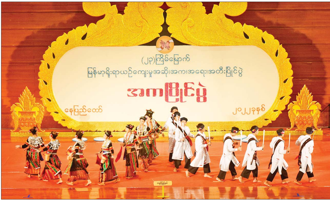
တိုင်းရင်းသားရိုးရာ/ ကျေးလက်ရိုးရာအကပြိုင်ပွဲတွင် ကချင်ပြည်နယ်မှ လာချီဒီရိုးရာအကအဖွဲ့ ယှဉ်ပြိုင်စဉ်။

ဒိုမင်းပြိုင်ပွဲကို မြန်မာအပြည်ပြည်ဆိုင်ရာ ကွန်ဗင်းရှင်းဗဟိုဌာန (၂) News Briefing Room ဌာန ကျင်းပရာ ဝါသနာရှင်အဆင့် (ပထမတန်း) အမျိုးသားပြိုင်ပွဲတွင် ပဲခူးတိုင်းဒေသကြီးနှင့် ဧရာဝတီတိုင်းဒေသကြီးတို့မှ ပြိုင်ပွဲဝင်များက “ထွန်းလင်းလျှိုလက်” (ပတ်ပျိုး) ဖြင့်လည်းကောင်း၊ ရန်ကုန်တိုင်းဒေသကြီးနှင့် မန္တလေးတိုင်းဒေသကြီးတို့မှ ပြိုင်ပွဲဝင်များက “ဒီပါမြေ” (ပတ်ပျိုး) ဖြင့်လည်းကောင်း၊ ဝါသနာရှင်အဆင့် (ပထမတန်း) အမျိုးသမီးပြိုင်ပွဲတွင် ပဲခူးတိုင်းဒေသကြီးမှ ပြိုင်ပွဲဝင်က “ဒီပါမြေ” (ပတ်ပျိုး) ဖြင့်လည်းကောင်း၊ ရန်ကုန်တိုင်းဒေသကြီးမှ ပြိုင်ပွဲဝင်က “ဟေမဝန်ချာ” (ဘွဲ့) ဖြင့်လည်းကောင်း၊ အခြေခံပညာအဆင့် (အသက် ၁၀ နှစ်မှ ၁၅ နှစ်အတွင်း) အမျိုးသားပြိုင်ပွဲတွင် ရန်ကုန်တိုင်းဒေသကြီးမှ ပြိုင်ပွဲဝင်က “မှန်ညောင်သဏ္ဍာ” (ဘွဲ့) ဖြင့်လည်းကောင်း၊ ပဲခူးတိုင်းဒေသကြီးမှ ပြိုင်ပွဲဝင်က “သီလာမြေယံ” (ကြိုး) ဖြင့်လည်းကောင်း၊ အခြေခံပညာအဆင့် (အသက် ၁၀ နှစ်မှ ၁၅ နှစ်အတွင်း) အမျိုးသမီးပြိုင်ပွဲတွင် ရန်ကုန်တိုင်းဒေသ