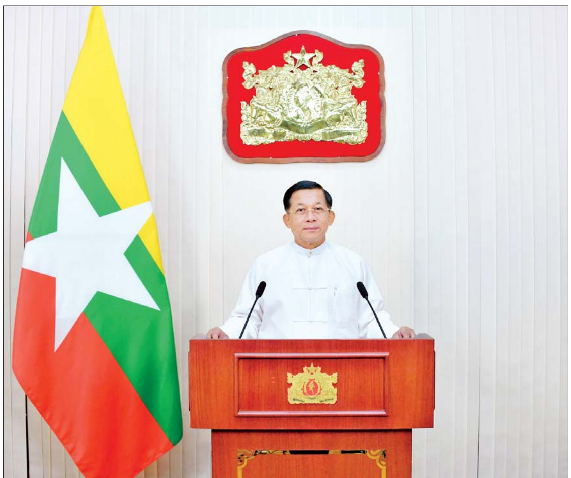
ပြည်ထောင်စုသမ္မတမြန်မာနိုင်ငံတော်အစိုးရ နိုင်ငံတော်စီမံအုပ်ချုပ်ရေးကောင်စီဥက္ကဋ္ဌ နိုင်ငံတော်ဝန်ကြီးချုပ် အမျိုးသား စည်းလုံးညီညွတ်ရေးနှင့် ငြိမ်းချမ်းရေးဖော်ဆောင်မှုဗဟိုကော်မတီဥက္ကဋ္ဌ တပ်မတော်ကာကွယ်ရေးဦးစီးချုပ် ဗိုလ်ချုပ်မှူးကြီး မင်းအောင်လှိုင် တစ်နိုင်ငံလုံးပစ်ခတ်တိုက်ခိုက်မှုရပ်စဲရေးသဘောတူစာချုပ်(NCA)ချုပ်ဆိုခြင်း (၇)နှစ်မြောက် နှစ်ပတ်လည်နေ့ တွင် မိန့်ခွန်းပြောကြားစဉ်။

ချစ်ခင်လေးစားအပ်ပါသော ပြည်ထောင်စုဖွားတိုင်းရင်းသား ညီအစ်ကိုမောင်နှမများခင်ဗျာ- ဒီကနေ့ဟာ ပြည်ထောင်စုသမ္မတ မြန်မာနိုင်ငံတော်အစိုးရနဲ့ တိုင်းရင်းသား လက်နက်ကိုင်အဖွဲ့အစည်းတွေအကြား ချုပ်ဆိုတဲ့ တစ်နိုင်ငံလုံး ပစ်ခတ် တိုက်ခိုက်မှုရပ်စဲရေး သဘောတူစာချုပ် (NCA)ကို ချုပ်ဆိုခဲ့တာ (၇)နှစ်ပြည့် မြောက်တဲ့နေ့ ဖြစ်ပါတယ်။ ယနေ့ ကျရောက်တဲ့ တစ်နိုင်ငံလုံး ပစ်ခတ် တိုက်ခိုက်မှုရပ်စဲရေး သဘောတူစာချုပ် (NCA) လက်မှတ်ရေးထိုးခြင်း (၇)နှစ် ပြည့်နှစ်ပတ်လည်နေ့မှာ တိုင်းရင်းသား ညီအစ်ကို မောင်နှမများအားလုံး စိတ်၏ချမ်းသာခြင်း၊ ကိုယ်၏ကျန်းမာ ခြင်းနဲ့ပြည့်စုံပြီး အားလုံးလိုလား တောင့်တနေကြတဲ့ ငြိမ်းချမ်းရေးရဲ့ အကျိုးကို ထာဝစဉ်ရှေးရှုဆောင်ရွက်နိုင် ကြပါစေကြောင်း ဆုတောင်းမေတ္တာ ပို့သရင်း နှုတ်ခွန်းဆက်သအပ်ပါတယ်။ ယနေ့ကျွန်တော်တို့နိုင်ငံရဲ့ အခြေခံ နဲ့ အဓိကအကျဆုံး ပကတိလိုအပ်ချက် ဟာ တိုင်းပြည်တည်ငြိမ်အေးချမ်းရေး ပဲဖြစ်ပါတယ်။ အတိတ်သမိုင်းအရ ကျွန်တော်တို့ တိုင်းရင်းသားတွေနဲ့ ဖွဲ့စည်းတည်ထောင်ထားတဲ့ ကျွန်တော် တို့ရဲ့ ပြည်ထောင်စုနိုင်ငံတော်ကြီးဟာ စာမျက်နှာ ၃ ကော်လံ ၁ သို့ ။