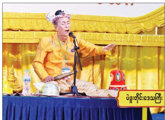
ကွက်စိပ်ပြိုင်ပွဲ ဝါသနာရှင်အဆင့်(ပထမတန်း)အမျိုးသား ပြိုင်ပွဲတွင် ပဲခူးတိုင်းဒေသကြီးမှ ပြိုင်ပွဲဝင်တစ်ဦး ယှဉ်ပြိုင်စဉ်။

ဇာတ်တော်ကြီးပြိုင်ပွဲကို သာသနာရေးနှင့် ယဉ်ကျေးမှု ဝန်ကြီးဌာနရှိ လေ့ကျင့်ရေးဇာတ်ရုံ၌ ကျင်းပရာ “ရာမာယဏ” ဇာတ်တော်ကြီး ဝါသနာရှင်အဆင့် (ပထမတန်း) ပြိုင်ပွဲတွင် ပဲခူးတိုင်းဒေသကြီးကိုယ်စားပြု ဇာတ်တော်ကြီးအဖွဲ့က မူရင်းရာမာယဏဇာတ်တော်ကြီး၏ တီးလုံးတီးချက်များကို မြန်မာ့ဇာတ်သဘင်၏ ဆို ငို ပြော ပညာရပ်များ၊ အကအလှများနှင့် အနုပညာရသမြောက်ပေါင်းစပ်ပြီး ယှဉ်ပြိုင်ကြ