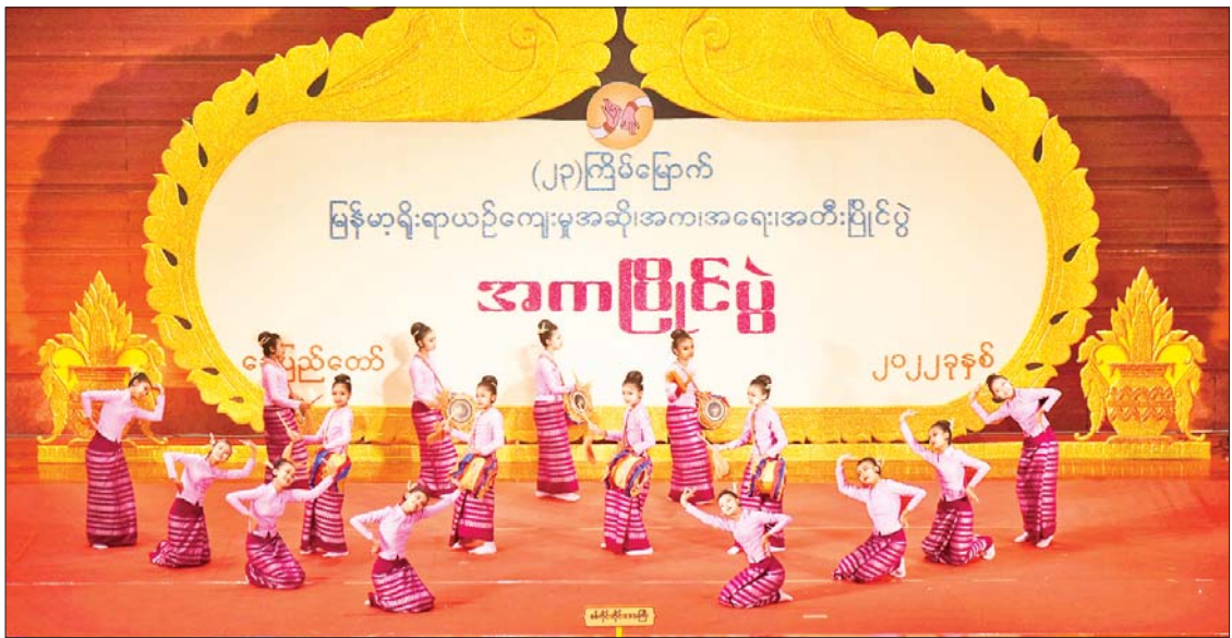
တိုင်းရင်းသားရိုးရာ/ ကျေးလက်ရိုးရာအကပြိုင်ပွဲတွင် စစ်ကိုင်းတိုင်းဒေသကြီးမှ မိုးဇာမြောအကအဖွဲ့ ယှဉ်ပြိုင်စဉ်။

မန္တလေးတိုင်းဒေသကြီး၊ ဧရာဝတီတိုင်းဒေသကြီးနှင့် ရန်ကုန်တိုင်းဒေသကြီးတို့မှ ပြိုင်ပွဲဝင် အဖွဲ့များကလည်းကောင်း၊ ဝါသနာရှင်အဆင့် (ဒုတိယတန်း) ပြိုင်ပွဲတွင် စစ်ကိုင်းတိုင်းဒေသကြီး၊ မန္တလေးတိုင်းဒေသကြီး၊ ရန်ကုန်တိုင်းဒေသကြီး၊ ဧရာဝတီတိုင်းဒေသကြီး၊ တနင်္သာရီတိုင်းဒေသကြီး၊ ပဲခူးတိုင်းဒေသကြီးနှင့် ချင်းပြည်နယ်တို့မှ ပြိုင်ပွဲဝင်အဖွဲ့များက