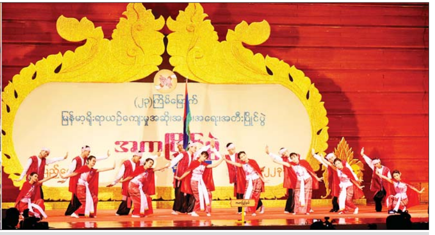
နိုင်ငံတော်စီမံအုပ်ချုပ်ရေးကောင်စီအဖွဲ့ဝင် စောဒန်နီယယ်နှင့် ဒေါက်တာဗညားအောင်မိုး နေပြည်တော်ရှိ မြန်မာအပြည်ပြည်ဆိုင်ရာ ကွန်ဗင်းရှင်းဗဟိုဌာန (J) Plenary Hall ၌ ကျင်းပသည့် တိုင်းရင်းသားရိုးရာ/ကျေးလက်ရိုးရာ အကပြိုင်ပွဲ ပြိုင်ပွဲဝင်အဖွဲ့များ၏ ယှဉ်ပြိုင်နေမှုများကို ကြည့်ရှုအားပေးစဉ်။

သရုပ်ဖော် ကပြယှဉ်ပြိုင် အဆိုပါ ပြိုင်ပွဲတွင် အလွတ် တန်းအဆင့် တိုင်းဒေသကြီးနှင့် ပြည်နယ်များမှ ပြိုင်ပွဲဝင်အက အဖွဲ့များက အဖွဲ့လိုက် တိုင်းရင်း သားနှင့် ကျေးလက်ရိုးရာဝတ်စုံ များဝတ်ဆင်၍ မိမိတို့၏ယဉ်ကျေးမှု