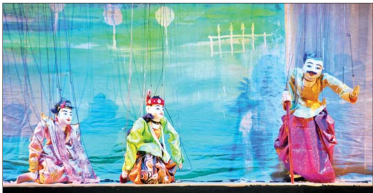
“ငါးပါးအက္ခရာ” ဇာတ်တော်ကြီး ရုပ်စုံသဘင်အဖွဲ့လိုက် ဝါသနာရှင်အဆင့် (ပထမတန်း) ပြိုင်ပွဲတွင် ဧရာဝတီတိုင်းဒေသကြီး ကိုယ်စားပြု ရုပ်စုံသဘင်အဖွဲ့ ယှဉ်ပြိုင်စဉ်။

ယှဉ်ပြိုင်ကြသည်။ ရုပ်စုံသဘင် အဖွဲ့လိုက်ပြိုင်ပွဲကို သာသနာရေးနှင့် ယဉ်ကျေးမှုဝန်ကြီးဌာန ရှိ ယဉ်ကျေးမှုရတနာခန်းမ၌ ကျင်းပရာ “ငါးပါးအက္ခရာ” ဇာတ်တော်ကြီး ရုပ်စုံသဘင်အဖွဲ့လိုက် ဝါသနာရှင်အဆင့် (ပထမတန်း) ပြိုင်ပွဲတွင် ဧရာဝတီတိုင်းဒေသကြီး ကိုယ်စားပြု ရုပ်စုံသဘင်အဖွဲ့က မြန်မာ့ရိုးရာယဉ်ကျေးမှု အမွေအနှစ်များကို ဖော်ကျူးသည့် အကအလှများ၊ စကားပြောများဖြင့် တင်ဆက်ကပြ ယှဉ်ပြိုင်ကြသည်။ ဇာတ်တော်ကြီးပြိုင်ပွဲကို သာသနာရေးနှင့် ယဉ်ကျေးမှုဝန်ကြီးဌာနရှိ လေ့ကျင့်ရေး ဇာတ်ရုံ၌ ကျင်းပရာ “ရာမာယဏ” ဇာတ်တော်ကြီး ဝါသနာရှင်အဆင့်