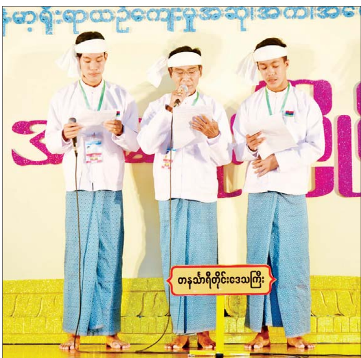
အရေးပြိုင်ပွဲ အဆင့်မြင့်ပညာအဆင့်ပြိုင်ပွဲတွင် တနင်္သာရီတိုင်းဒေသကြီးမှ ပြိုင်ပွဲဝင်များ ယှဉ်ပြိုင်ကြစဉ်။

(ပထမတန်း) ပြိုင်ပွဲတွင် ပဲခူးတိုင်းဒေသကြီး ကိုယ်စားပြုဇာတ်တော်ကြီးအဖွဲ့က မူရင်း ရာမာယဏဇာတ်တော်ကြီး၏ တီးလုံးတီးချက်များကို မြန်မာ့ဇာတ်သဘင်၏ ဆို ငို ပြော ပညာရပ်များ၊ အကအလှများနှင့် အနုပညာ ရသမြောက်ပေါင်းစပ်ပြီး ယှဉ်ပြိုင်ကြသည်။ အရေးပြိုင်ပွဲကို သာသနာရေးနှင့် ယဉ်ကျေးမှုဝန်ကြီးဌာနရှိ ယဉ်ကျေးမှု ရတနာခန်းမ၌ကျင်းပရာ အဆင့်မြင့် ပညာအဆင့်ပြိုင်ပွဲတွင် ကယားပြည်နယ်၊ မန္တလေးတိုင်းဒေသကြီး၊ တနင်္သာရီတိုင်းဒေသကြီး၊ ရန်ကုန်တိုင်းဒေသကြီး၊ ပဲခူးတိုင်းဒေသကြီး၊ ရခိုင်ပြည်နယ်၊ ဧရာဝတီ