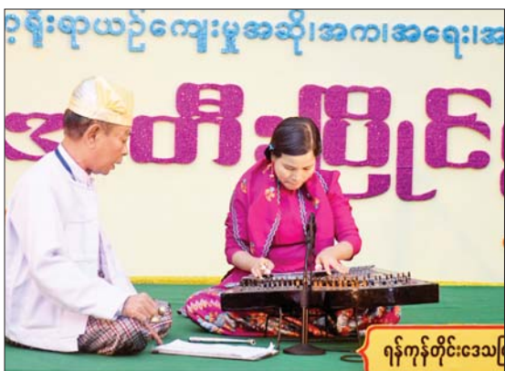
ခုံမင်းပြိုင်ပွဲ ဝါသနာရှင်အဆင့်(ပထမတန်း) အမျိုးသမီး ပြိုင်ပွဲတွင် ရန်ကုန်တိုင်းဒေသကြီးမှ ပြိုင်ပွဲဝင်တစ်ဦး ယှဉ်ပြိုင်စဉ်။

လည်းကောင်း၊ အဆင့်မြင့်ပညာ အဆင့် ပြိုင်ပွဲတွင် ရန်ကုန်တိုင်းဒေသကြီးနှင့် မန္တလေးတိုင်းဒေသကြီးတို့မှ ပြိုင်ပွဲဝင်အဖွဲ့များကလည်းကောင်း မြိုင်မြိုင် ဆိုင်ဆိုင် တီးခတ်ယှဉ်ပြိုင်ကြသည်။ စာမျက်နှာ ၁၁ သို့ ၀