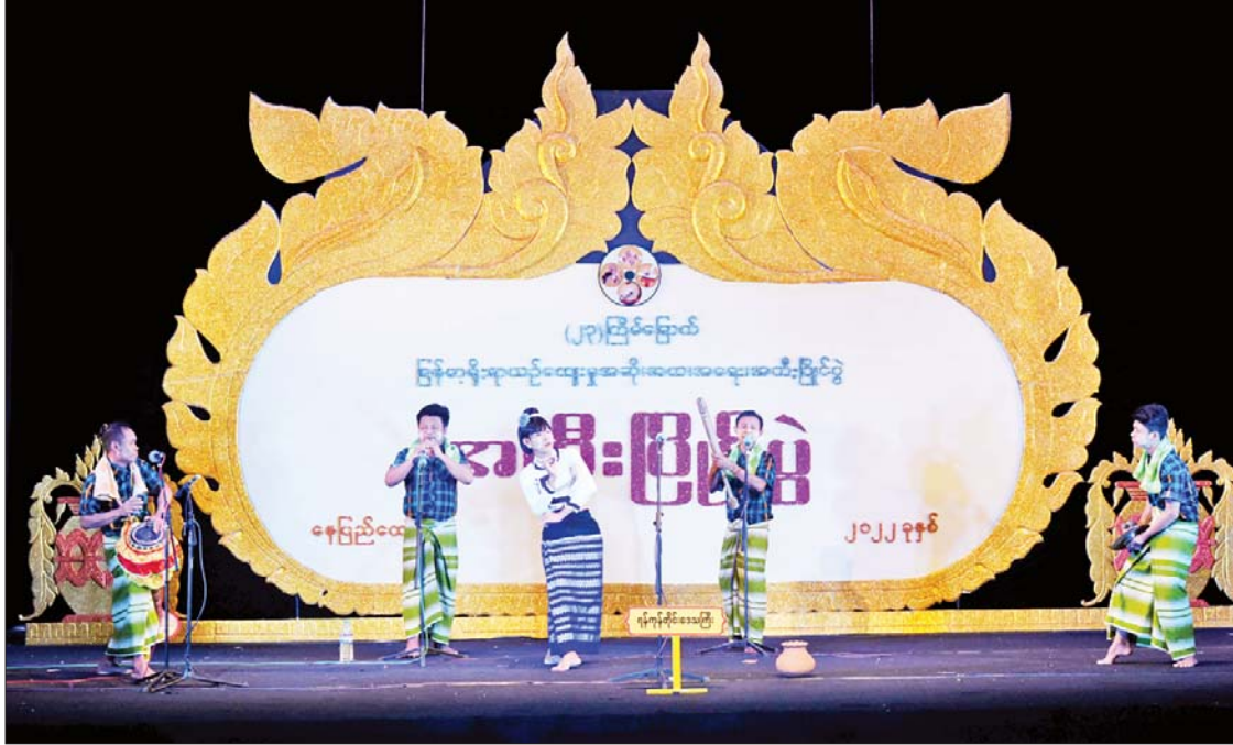
အိုးစည်ပြိုင်ပွဲ ဝါသနာရှင်အဆင့် (ဒုတိယတန်း) ပြိုင်ပွဲတွင် ရန်ကုန်တိုင်းဒေသကြီးမှ ပြိုင်ပွဲဝင်အဖွဲ့ ယှဉ်ပြိုင်စဉ်။