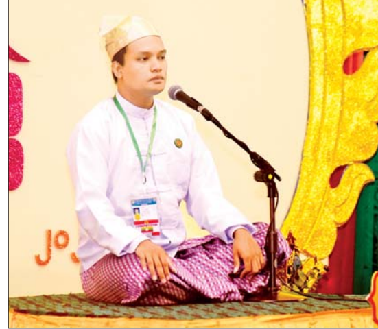
အမျိုးဂုဏ်၊ ဇာတိဂုဏ်မြှင့်တင်ရေး တေးသီချင်းအဆိုပြိုင်ပွဲ ဝါသနာရှင်အဆင့် (ဒုတိယတန်း) အမျိုးသားပြိုင်ပွဲတွင် ရန်ကုန်တိုင်းဒေသကြီးမှ ပြိုင်ပွဲဝင်တစ်ဦး ယှဉ်ပြိုင်စဉ်။

ကြီးမှ ပြိုင်ပွဲဝင်က “သီလာမြေယံ” (ကြိုး) ဖြင့်လည်းကောင်း၊ မန္တလေးတိုင်းဒေသကြီးမှ ပြိုင်ပွဲဝင်က “မှန်ညောင်သဏ္ဍာ” (ဘွဲ့) ဖြင့်လည်းကောင်း၊ ဝါသနာရှင်အဆင့် (ဒုတိယတန်း) အမျိုးသားပြိုင်ပွဲတွင် မွန်ပြည်နယ်၊ ရန်ကုန်တိုင်းဒေသကြီးနှင့်