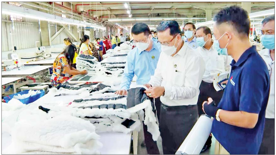
ပြည်ထောင်စုဝန်ကြီး ဦးမောင်မောင်အုန်း၊ တိုင်းဒေသကြီးဝန်ကြီးချုပ် ဦးတင်မောင်ဝင်းနှင့် တာဝန်ရှိသူများ ပုသိမ် စက်မှုမြို့တော်စီမံကိန်းရှိ Vent Dest Pathein Co.,Ltd. အထည်ချုပ်စက်ရုံတွင် လှည့်လည်ကြည့်ရှုစဉ်။

ပုသိမ် အောက်တိုဘာ ၁၅ ပြန်ကြားရေး ဝန်ကြီးဌာန ပြည်ထောင်စုဝန်ကြီး ဦးမောင်မောင်အုန်း သည် ဧရာဝတီတိုင်းဒေသကြီးဝန်ကြီးချုပ် ဦးတင်မောင်ဝင်းနှင့်အတူ ယနေ့နံနက် ပိုင်းတွင် ဧရာဝတီတိုင်းဒေသကြီး ပန်းတနော်မြို့နယ် လူထုအခြေပြု ဗဟိုဌာန ဆောက်လုပ်မှုကို ကြည့်ရှု စစ်ဆေးပြီး ကျောင်းကုန်းမြို့နယ်တွင် မိုးစပါးစံကွက်ရိတ်သိမ်းမှုနှင့် နိုင်ငံတော် ဝန်ကြီးချုပ်၏ လမ်းညွှန်ချက်အရ ပုသိမ် စက်မှုမြို့တော်စီမံကိန်းရှိ အသေးစား၊ အငယ်စားနှင့် အလတ်စား စက်မှုလုပ်ငန်း (MSME)များအား သွားရောက်ကြည့်ရှု အားပေးကြသည်။