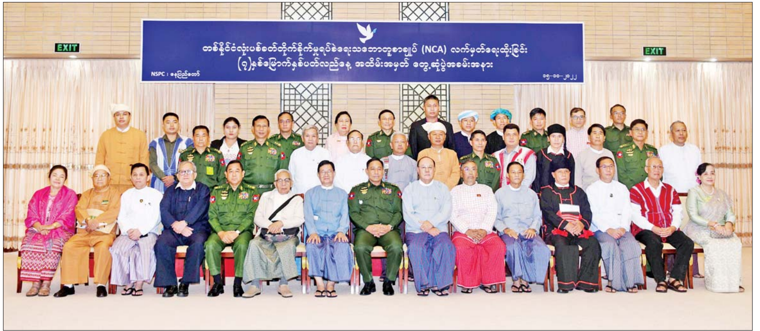
တစ်နိုင်ငံလုံးပစ်ခတ်တိုက်ခိုက်မှုရပ်စဲရေးသဘောတူစာချုပ်(NCA) လက်မှတ်ရေးထိုးခြင်း (၇)နှစ်မြောက်နှစ်ပတ်လည်နေ့ တွေ့ဆုံပွဲအခမ်းအနားသို့ တက်ရောက် ကြသူများ စုပေါင်းမှတ်တမ်းတင်ဓာတ်ပုံရိုက်ကြစဉ်။

တွေ့ဆုံပွဲ အခမ်းအနားသို့ နိုင်ငံတော် စီမံအုပ်ချုပ်ရေးကောင်စီ အဖွဲ့ဝင်၊ ပြည်ထောင်စုအစိုးရအဖွဲ့ရုံး ဝန်ကြီးဌာန ပြည်ထောင်စုဝန်ကြီး၊ အမျိုးသားစည်းလုံး ညီညွတ်ရေးနှင့် ငြိမ်းချမ်းရေးဖော်ဆောင်မှု ညှိနှိုင်းရေးကော်မတီဥက္ကဋ္ဌ ဒုတိယ ဗိုလ်ချုပ်ကြီးရာပြည့်နှင့် ကော်မတီဝင် ပြည်ထောင်စုဝန်ကြီး၊ ဒုတိယဝန်ကြီးများ၊ ကော်မတီဝင်များ၊ ငြိမ်းချမ်းရေးလုပ်ငန်း စဉ်အစမှ NCA စာချုပ်ဖြစ်ပေါ်လာသည် အထိ ကိုယ်တိုင်ပါဝင်ကြိုးပမ်းဆောင်ရွက် ခဲ့ကြသည့် အစိုးရ၊ လွှတ်တော်၊ တပ်မတော်၊ တိုင်းရင်းသားလက်နက်ကိုင် အဖွဲ့အစည်း နှင့် နိုင်ငံရေးပါတီတို့မှ အထူးအသိအကျဉ်း တော်များ၊ NCA လက်မှတ်ရေးထိုးထား သော တိုင်းရင်းသားလက်နက်ကိုင်အဖွဲ့ အစည်းများဖြစ်ကြသည့် ရခိုင်ပြည် လွတ်မြောက်ရေးပါတီ(ALP)၊ ဒီမိုကရေစီ အကျိုးပြုကရင်တပ်မတော်(DKBA)၊ ကရင် အမျိုးသားအစည်းအရုံး ကရင်အမျိုးသား လွတ်မြောက်ရေးတပ်မတော်-ငြိမ်းချမ်းရေး ကောင်စီ (KNU/KNLA-PC)၊ လားဟူ ဒီမိုကရက်တစ်အစည်းအရုံး (LDU)၊ မွန်ပြည်သစ်ပါတီ(NMSP)၊ ပအိုဝ်း အမျိုးသားလွတ်မြောက်ရေးအဖွဲ့ချုပ် (PNLO)နှင့် သျှမ်းပြည်ပြန်လည်ထူထောင် ရေးကောင်စီ(RCSS)တို့မှ ဥက္ကဋ္ဌ၊ ဒုတိယဥက္ကဋ္ဌများ၊ အတွင်းရေးမှူးများ၊ ဗဟိုအလုပ်အမှုဆောင်ကော်မတီဝင်များ နှင့် ဗဟိုကော်မတီဝင်များ တက်ရောက်