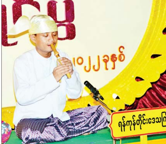
ပလ္လေပြိုင်ပွဲ ဝါသနာရှင်အဆင့် (ပထမတန်း) အမျိုးသားပြိုင်ပွဲတွင် ရန်ကုန်တိုင်းဒေသကြီးမှ ပြိုင်ပွဲဝင်တစ်ဦး ယှဉ်ပြိုင်စဉ်။

တိုင်းဒေသကြီးတို့မှ ပြိုင်ပွဲဝင်များက “မြန်ခန်းကျွန်းတွင်း” (ကြိုး) ဖြင့်လည်းကောင်း တီးမှုတ်ယှဉ်ပြိုင်ကြသည်။ ကွက်စိပ်ပြိုင်ပွဲကို အမျိုးသားစာကြည့်တိုက် (နေပြည်တော်) ရှိ ဝန်ဇင်းမင်းရာဇာခန်းမ၌ကျင်းပရာ ဝါသနာရှင်အဆင့် (ပထမတန်း) အမျိုးသားပြိုင်ပွဲတွင် ချင်းပြည်နယ်၊ ပဲခူးတိုင်းဒေသကြီး၊ ကရင်ပြည်နယ်၊ ဧရာဝတီတိုင်းဒေသကြီး၊ မွန်ပြည်နယ်၊ မကွေးတိုင်းဒေသကြီးနှင့် ရန်ကုန်တိုင်းဒေသကြီးတို့မှ ပြိုင်ပွဲဝင်များက “မဟော်သဓာဇာတ်တော်ကြီး” ခေါင်းစဉ်ဖြင့် ဇာတ်တော်ကြီး၏ အနှစ်သာရနှင့် ဦးတည်ချက်ပေါ်လွင်အောင် နှုတ်မှုစွမ်းရည် ပြသဟောပြော ယှဉ်ပြိုင်ကြသည်။ ယနေ့ပြိုင်ပွဲများ ကျင်းပရာ နေရာအသီးသီးသို့ ပြည်ထောင်စုအဆင့်ပုဂ္ဂိုလ်များ၊ ဒုတိယဝန်ကြီးများ၊ တိုင်းဒေသကြီးနှင့် ပြည်နယ်များမှ တိုင်းရင်းသားရေးရာဝန်ကြီးများ၊ လူမှုရေးဝန်ကြီးများနှင့် တာဝန်ရှိသူများ လာရောက်ကြည့်ရှုအားပေးခဲ့ကြသည်။ ယနေ့ခေတ်တွင် IT နည်းပညာ ဖွံ့ဖြိုးတိုးတက်လာသည်နှင့်အမျှ အနောက်တိုင်း