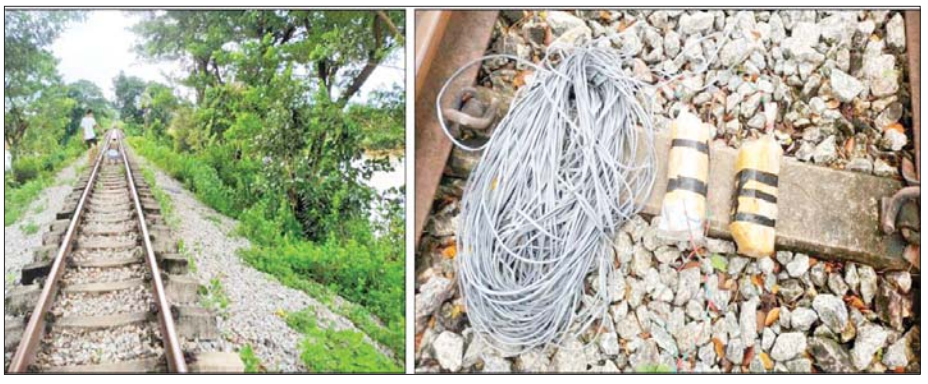
၂၀၂၂ ခုနှစ် ဩဂုတ်လ ၂ ရက်တွင် NUG၊ CRPH၊ PDF အမည်ခံ အကြမ်းဖက်သမားများက ဘီးလင်းမြို့နယ် တောင်စွန်းကျေးရွာ သဲဖြူချောင်းတံတားအနီး ရန်ကုန်-မော်လမြိုင်သွား မီးရထားလမ်း မိုင်တိုင်အမှတ်(၁၁၀/၃ နှင့် ၄)အကြား လက်လုပ်မိုင်းထောင်ထားစဉ်။