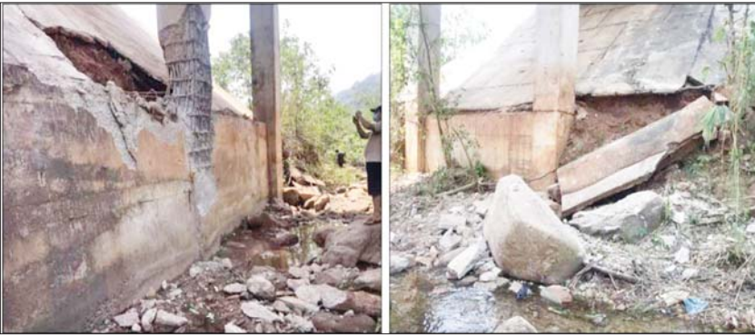
၂၀၂၂ ခုနှစ် မတ်လ ၁၃ ရက်တွင် NUG၊ CRPH၊ PDF အမည်ခံ အကြမ်းဖက်သမား များက ကော့ကရိတ်-မြဝတီ သွား အာရှလမ်းမကြီးရှိ တံတားအမှတ် (၅/၉၁)အား မိုင်းခွဲဖျက်ဆီးထားစဉ်။