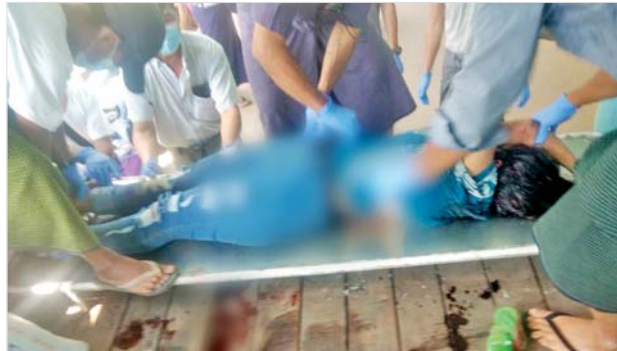
KNLA တပ်မဟာ(၁) နှင့် NUG ၊ CRPH တို့၏လက်ဝေခံ PDF အမည်ခံ အကြမ်းဖက်သမားများက လက်နက်ကြီး၊ လက်နက်ငယ်များဖြင့် အကြောင်းမဲ့ ရက်စက်မိုက်မဲစွာ လာရောက်ပစ်ခတ်ခြင်းကြောင့် သေဆုံးခဲ့သည့် ဘုရားဖူးပြည်သူများကို တွေ့ရစဉ်။