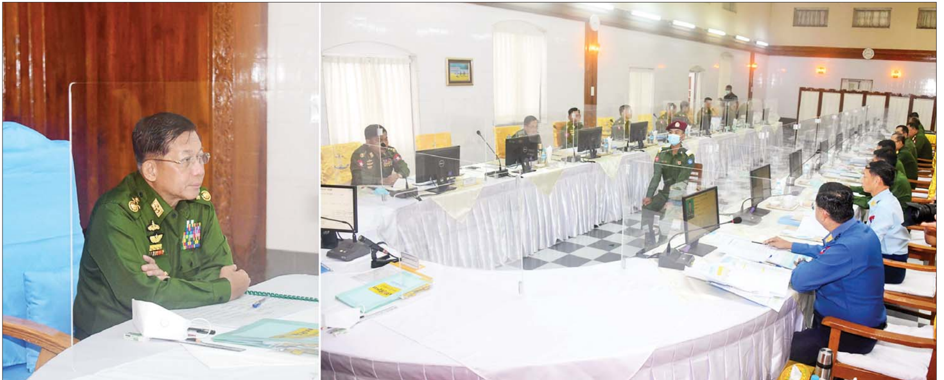
နိုင်ငံတော်စီမံအုပ်ချုပ်ရေးကောင်စီဥက္ကဋ္ဌ တပ်မတော်ကာကွယ်ရေးဦးစီးချုပ် ဗိုလ်ချုပ်မှူးကြီးမင်းအောင်လှိုင် စစ်တက္ကသိုလ် ဗိုလ်လောင်းသင်တန်း အမှတ်စဉ်(၆၅) စစ်လက်ရုံးရွေးချယ်ပွဲသို့ တက်ရောက် စိစစ်ရွေးချယ်ပေးစဉ်။