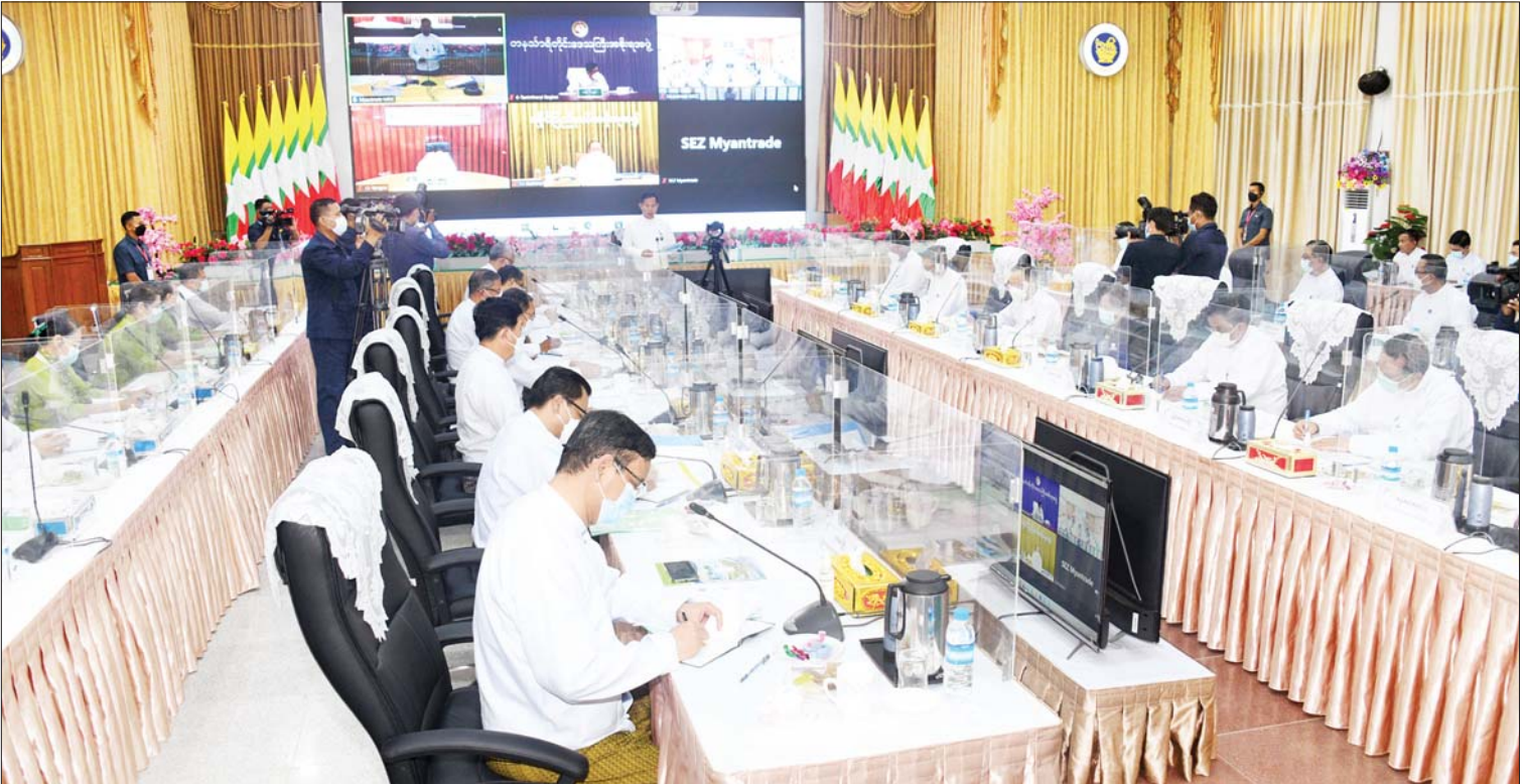
နိုင်ငံတော်စီမံအုပ်ချုပ်ရေးကောင်စီဒုတိယဥက္ကဋ္ဌ ဒုတိယဝန်ကြီးချုပ် ဒုတိယဗိုလ်ချုပ်မှူးကြီးစိုးဝင်း မြန်မာအထူးစီးပွားရေးဇုန်ဆိုင်ရာ ဗဟိုအဖွဲ့အစည်းအဝေး(၁/၂၀၂၂) တွင် အမှာစကားပြောကြားစဉ်။

နေပြည်တော် အောက်တိုဘာ ၁၂ မြန်မာ အထူးစီးပွားရေးဇုန်ဆိုင်ရာ ဗဟိုအဖွဲ့အစည်းအဝေး (၁/၂၀၂၂) ကို ယနေ့မွန်းလွဲ ၁ နာရီခွဲတွင် နေပြည်တော်ရှိ စီးပွားရေးနှင့် ကူးသန်းရောင်းဝယ်ရေး ဝန်ကြီးဌာန အစည်းအဝေးခန်းမ၌ ကျင်းပရာ မြန်မာအထူးစီးပွားရေးဇုန် ဆိုင်ရာဗဟိုအဖွဲ့ဥက္ကဋ္ဌ နိုင်ငံတော်စီမံ အုပ်ချုပ်ရေးကောင်စီ ဒုတိယဥက္ကဋ္ဌ ဒုတိယဝန်ကြီးချုပ် ဒုတိယဗိုလ်ချုပ်မှူး ကြီးစိုးဝင်း တက်ရောက်အမှာစကား ပြောကြားသည်။