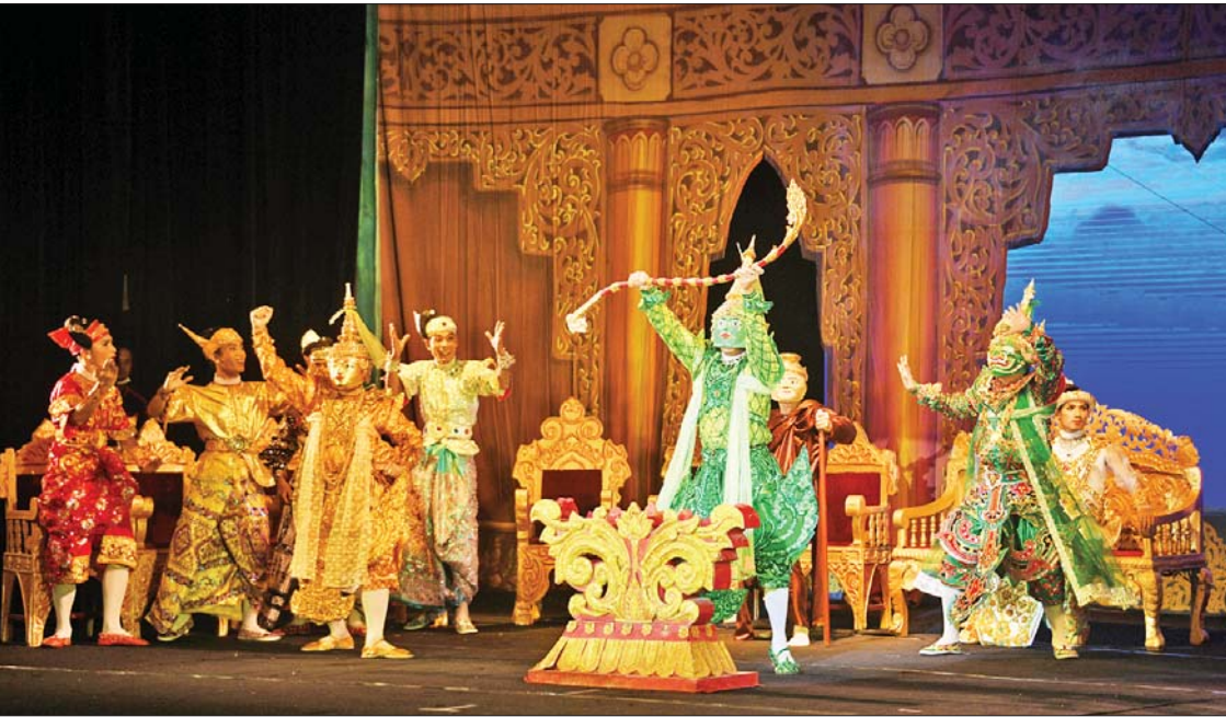
အကပြိုင်ပွဲ ရာမာယဏဇာတ်တော်ကြီး ဝါသနာရှင်အဆင့် (ပထမတန်း)ပြိုင်ပွဲတွင် ရန်ကုန်တိုင်းဒေသကြီးကိုယ်စားပြု သီရိရာမဇာတ်တော်ကြီးအဖွဲ့ ယှဉ်ပြိုင်စဉ်။

ထူးကဲစွာယှဉ်ပြိုင် ယခုနှစ်ကျင်းပသည့် အဆို၊ အက၊ အရေး၊ အတီးပြိုင်ပွဲကြီးတွင် မြန်မာတို့၏ ကိုယ်ပိုင်အဖိုးတန်ယဉ်ကျေးမှုရတနာများ ဖြစ်သည့် သီချင်းကြီး၊ သီချင်းခံ၊ အဆို၊ အတီးပြိုင်ပွဲများ၊ ကိုယ်ပိုင်အနုပညာ စစ်စစ်ဖြစ်သည့် မြန်မာ့ဆိုင်းဝိုင်းကြီး အပါအဝင် မြန်မာ့တူရိယာပစ္စည်း တီးခတ် မှုပြိုင်ပွဲများ၊ ကမ္ဘာသုံးတူရိယာများဖြစ် သည့် စန္ဒရား၊ ဒုံမင်း၊ မယ်ဒလင်၊ တယော၊ ဂီတာ အစရှိသည့်တူရိယာများကို မြန်မာသံ မြန်မာဟန်ဖြင့် ယှဉ်ပြိုင်တီးခတ်မည့် ပြိုင်ပွဲများ၊ ခေါင်း၊ ခါး၊ ခြေ၊ လက်အချိုး အဆစ်များနှင့် ငြိမ့်ညောင်းစွာ ကပြကြ မည့် အကပြိုင်ပွဲများ၊ မြန်မာအက အခြေခံဖြစ်သည့် ကဗျာလွတ်အကပြိုင်ပွဲ များ၊ နှုတ်မှုစွမ်းရည်ပြကွက်စိပ် ပြိုင်ပွဲများ၊ ကမ္ဘာက အလေးအနက်ထားရသည့် မြန်မာ့ရုပ်သေးကြီးဆွဲပညာ ပြိုင်ပွဲများ အပြင် အာရှတိုက်၏ ဒေသတွင်းနိုင်ငံများ က အမြတ်တနိုးတန်ဖိုးထားကြသည့် ရာမာယဏပြိုင်ပွဲကြီးကိုလည်း မူရင်း ရာမာယဏဇာတ်တော်ကြီး၏ တီးလုံး တီးချက် အကအလှများအပြင် မြန်မာ့ ဇာတ်သဘင်၏ ဆို ဝို ပြော ပညာရပ်များ နှင့်ပေါင်းစပ်၍ ထူးကဲစွာယှဉ်ပြိုင်လျက် ရှိပြီး ခေတ်အလျောက်ပေါ်ထွန်းလာခဲ့ သည့် ရသမြောက် ခေတ်ဟောင်းတေး/ ကာလပေါ်တေးများအပြင် အမျိုးဂုဏ်၊ ဇာတ်ဂုဏ်မြှင့်တင်ရေး တေးသီချင်းများ ကိုလည်း ခေတ်နားနှင့်ယှဉ်ပါးသည့် ခေတ်လူငယ်များ သီဆိုယှဉ်ပြိုင်နိုင်ကြရန် ထည့်သွင်းစီစဉ်ထားကြောင်း သိရသည်။ ယနေ့တွင် “မဟာဂီတ” တေးသီချင်း အဆိုပြိုင်ပွဲကို မြန်မာအပြည်ပြည်ဆိုင်ရာ ကွန်ဗင်းရှင်းဗဟိုဌာန(၂) Banquet Hall ၌ကျင်းပရာ ဝါသနာရှင်အဆင့် (ပထမ တန်း) အမျိုးသမီးပြိုင်ပွဲတွင် မန္တလေး တိုင်းဒေသကြီးမှ ပြိုင်ပွဲဝင်က “မင်းခမ်း