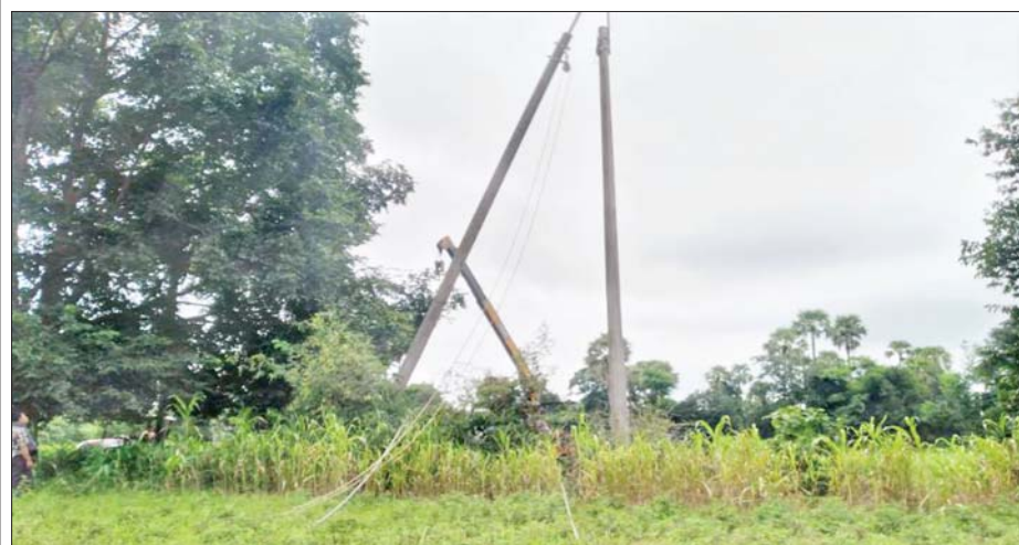
၆၆ ကေစီ ကျွန်းချောင်း-မြိုင်(၂) ဓာတ်အားလိုင်း တိုင်အမှတ်(၄၂၇) အား ဖျက်ဆီးထားမှုကို တွေ့ရစဉ်။