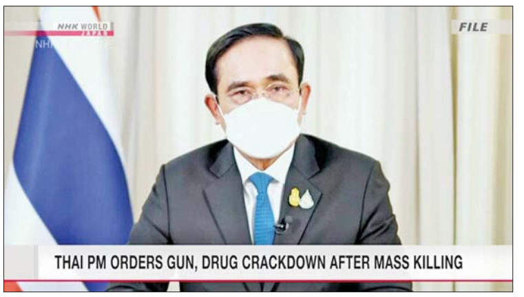
အဖွဲ့အစည်းအဝေးကို ဝန်ကြီးချုပ်က သိရသည်။ ကိုးကား- အင်န်အိတ်ချီကေ ယမန်နေ့တွင် ကျင်းပခဲ့ခြင်းဖြစ်ကြောင်း ဘာသာပြန်- အောင်ကျော်ကျော်

ခဲ့သည့် သေနတ်ကို တရားဝင်ဝယ်ယူထား ခြင်းဖြစ်ကြောင်း စုံစမ်းစစ်ဆေးသူများက ဆိုသည်။ ၂၀၁၇ ခုနှစ်အတွင်း ကောက်ယူထား သည့် ဆွစ်ဇာလန်နိုင်ငံ အခြေစိုက် လက်နက်ငယ်စစ်တမ်းအရ ထိုင်းနိုင်ငံ၌ သေနတ်ကိုင်ဆောင်ထားသည့် ပြည်သူ အရေအတွက် ၁၀ သန်းကျော်ရှိပြီး အရှေ့ တောင်အာရှနိုင်ငံများအနက် သေနတ် ကိုင်ဆောင်ထားသည့် ပြည်သူအရေ အတွက် အများဆုံးဖြစ်သည်။ မူးယစ်ဆေးဝါးနှင့် သေနတ်ထိန်းချုပ် ရေးအစီအမံများ ဆောင်ရွက်ရန် အစိုးရ