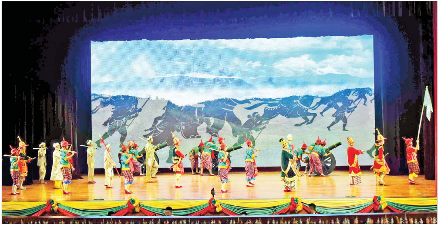
‘အသက်ထက်မြတ်သော ဂုဏ်သိက္ခာ’ ဆို ခို ပြော ဇာတ်တော်ကြီးကို နေပြည်တော်ရှိ ဇေယျာသီရိဗိမာန်သဘင်ဆောင်၌ စက်တင်ဘာ ၂၅ ရက်က တင်ဆက်ကပြဖျော်ဖြေစဉ်။

ငြိမ်းချမ်းရေးနှင့် တေးဂီတအနုပညာ စာရေးသူသည် ၂၀၂၂ ခုနှစ် (၂၃) ကြိမ်မြောက် မြန်မာ့ရိုးရာယဉ်ကျေးမှု အဆို၊ အက၊ အရေး၊ အတီး ပြိုင်ပွဲကြီး၏ ဦးတည်ချက်လေးရပ်၌ “ထာဝရ ငြိမ်းချမ်းရေးကို ဖော်ဆောင်ရာတွင် ယဉ်ကျေးမှု ကဏ္ဍမှအထောက်အကူပြုရေး”ဟူသော ဦးတည်ချက် ကို အထူးဂရုပြုမိပါသည်။