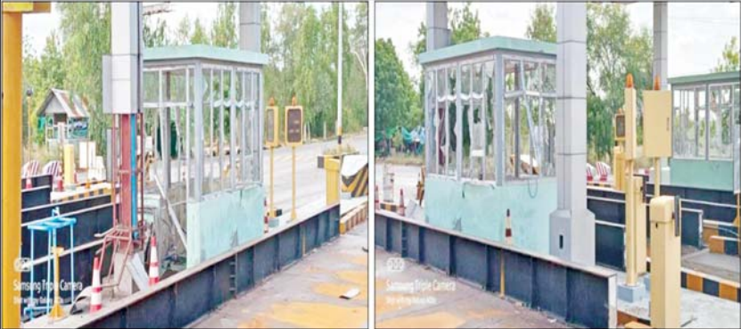
၂၀၂၂ ခုနှစ် ဇူလိုင်လ ၉ ရက်တွင် NUG၊ CRPH၊ PDF အမည်ခံအကြမ်းဖက်သမား များက မန္တလေး-မုံရွာ ကားလမ်းမပေါ်ရှိ မြင်းမူမြို့ ဝင် တိုးဂိတ်အား လက်လုပ် မိုင်း ဖောက်ခွဲထားစဉ်။