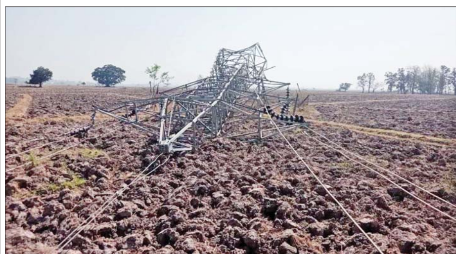
၁၃၂ ကေစီ ဘီလူးချောင်း(၂)- တီကျစ်ဓာတ်အားလိုင်းအား ဖျက်ဆီးထားမှုကို တွေ့ရစဉ်။