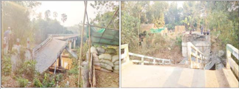
၂၀၂၂ ခုနှစ် မတ်လ ၃ ရက်တွင် NUG၊ CRPH၊ PDF အမည်ခံအကြမ်းဖက်သမား များက ပဲခူးတိုင်းဒေသကြီး ရွှေကျင်မြို့နယ်ရှိ ဝင်းကံ တံတားအား မိုင်းခွဲဖျက်ဆီး ထားစဉ်။