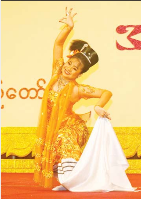
အကပြိုင်ပွဲ အခြေခံပညာအဆင့် (အသက် ၁၅ နှစ်မှ ၂၀ နှစ်အတွင်း) အမျိုးသမီးပြိုင်ပွဲတွင် တနင်္သာရီ တိုင်းဒေသကြီးမှ ပြိုင်ပွဲဝင်တစ်ဦး ယှဉ်ပြိုင်စဉ်။