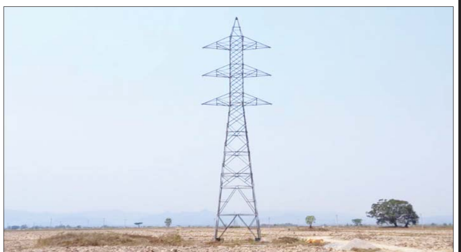
၁၃၂ ကေစီ ဘီလူးချောင်း(၂)- တီကျစ်ဓာတ်အားလိုင်းအား ပြန်လည်ပြုပြင်ပြီးစီးမှုကို တွေ့ရစဉ်။