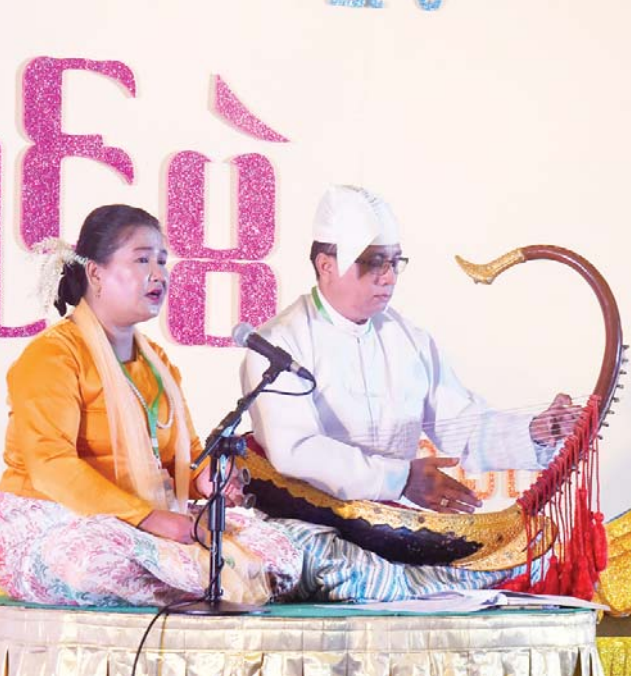
မဟာဂီတတေးသီချင်းအဆိုပြိုင်ပွဲ ဝါသနာရှင်အဆင့် (ပထမတန်း) အမျိုးသမီးပြိုင်ပွဲတွင် ရခိုင်ပြည်နယ်မှပြိုင်ပွဲဝင်တစ်ဦးယှဉ်ပြိုင်စဉ်။

တိုင်းဒေသကြီးတို့မှ ပြိုင်ပွဲဝင်များက “မိုးရေစက်ကလေးဥပမာတင်” သီချင်း ဖြင့် လည်းကောင်း၊ မွန်ပြည်နယ်နှင့် ရန်ကုန်တိုင်းဒေသကြီးတို့မှ ပြိုင်ပွဲဝင်များ က “ဂီတပရိယာယ်” သီချင်းဖြင့် လည်း ကောင်း၊ စစ်ကိုင်းတိုင်းဒေသကြီး၊ တနင်္သာရီတိုင်းဒေသကြီးနှင့် မန္တလေး တိုင်းဒေသကြီးတို့မှ ပြိုင်ပွဲဝင်များက “ဗုဒ္ဓ သာသနံစိရံတိဋ္ဌတု” သီချင်းဖြင့် လည်း ကောင်း ဖော်ကျူးသီဆိုယှဉ်ပြိုင်ကြသည်။ အကပြိုင်ပွဲကို သာသနာရေးနှင့် ယဉ်ကျေးမှုဝန်ကြီးဌာနရှိ ယဉ်ကျေးမှု ရတနာခန်းမ လေ့ကျင့်ရေးဇာတ်ရုံနှင့် မြန်မာအပြည်ပြည်ဆိုင်ရာ ကွန်ဗင်းရှင်း ဗဟိုဌာန(၂) Plenary Hall တို့၌ ကျင်းပရာ ရုပ်စုံသဘင်အဖွဲ့လိုက် ဝါသနာရှင်အဆင့် (ပထမတန်း)ပြိုင်ပွဲတွင် ရန်ကုန်တိုင်း ဒေသကြီးကိုယ်စားပြု တော်ဝင်ရုပ်စုံ အမြင့်သဘင်အဖွဲ့က “ငါးပါဒအက္ခရာ” ဇာတ်တော်ကြီးဖြင့် လည်းကောင်း၊ “ရာမာယဏ”ဇာတ်တော်ကြီး ဝါသနာရှင် အဆင့် (ပထမတန်း) ပြိုင်ပွဲတွင် ရန်ကုန် တိုင်းဒေသကြီး ကိုယ်စားပြု သီရိရာမ ဇာတ်တော်ကြီးအဖွဲ့က လည်းကောင်း၊ အဆင့်မြင့်ပညာအဆင့်(အမျိုးသား)ပြိုင်ပွဲ တွင် ကချင်ပြည်နယ်၊ ကရင်ပြည်နယ်၊