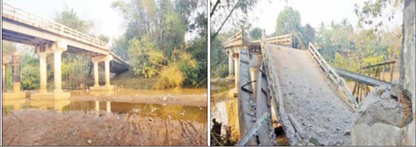
၂၀၂၂ ခုနှစ် မတ်လ ၁၃ ရက်တွင် NUG၊ CRPH၊ PDF အမည်ခံ အကြမ်းဖက်သမား များက ကော့ကရိတ်-မြဝတီ သွား အာရှလမ်းမကြီးရှိ တံတားအမှတ် (၅/၉၁)အား မိုင်းခွဲဖျက်ဆီးထားစဉ်။