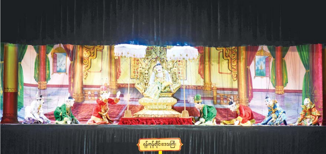
ရန်ကုန်တိုင်းဒေသကြီး