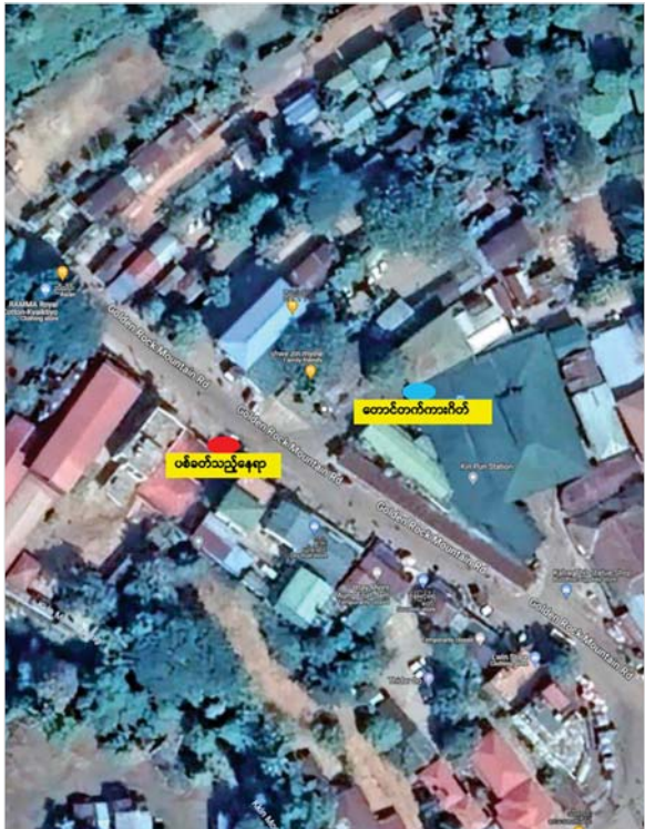
KNLA တပ်မဟာ(၁) နှင့် NUG ၊ CRPH တို့၏လက်ဝေခံ PDF အမည်ခံ အကြမ်းဖက်သမားများက ကျိုက်ထီးရိုးဘုရား ကင်မွန်းချောင်းတောင်တက်ကားဂိတ်အား လက်နက်ကြီး၊ လက်နက်ငယ်များဖြင့် အကြောင်းမဲ့ ရက်စက်မိုက်မဲစွာ လာရောက်ပစ်ခတ်သည့် နေရာပြပုံ။