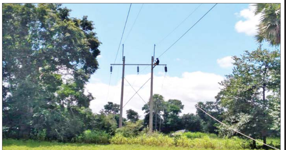
၆၆ ကေစီ ကျွန်းချောင်း-မြိုင်(၂) ဓာတ်အားလိုင်း တိုင်အမှတ်(၄၂၇) အား ပြန်လည်ပြုပြင်ပြီးစီးမှုကို တွေ့ရစဉ်။