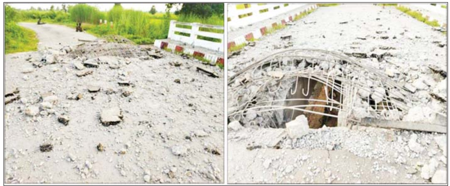
၂၀၂၂ ခုနှစ် ဇူလိုင်လ ၂၇ ရက်တွင် NUG၊ CRPH၊ PDF အမည်ခံ အကြမ်းဖက်သမားများက ကျောက်ကြီးမြို့နယ် ကျောက်ပြာကျေးရွာရှိ ကျောက်ကြီး-မုန်းကားလမ်းမိုင်တိုင်(၄၆/၂)တံတား အမှတ်(၁/၄၇) အား မိုင်းခွဲဖျက်ဆီးထားစဉ်။