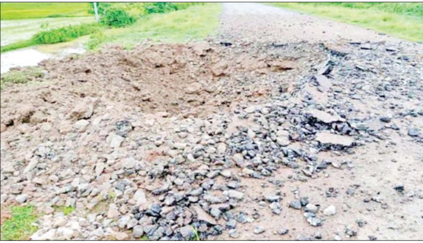
၂၀၂၂ ခုနှစ် ဇူလိုင်လ ၁ ရက်တွင် NUG၊ CRPH၊ PDF အမည်ခံအကြမ်းဖက်သမား များက ကျောက်ကြီးမြို့ နယ် ကျောက်ကြီး-နတ်သံ ကွင်း ကားလမ်းမိုင်တိုင် (၁၄၂/၁၄၃)ကြား ကားလမ်း အား မိုင်းထောင်ဖောက်ခွဲ ထားစဉ်။

နိုင်ငံတော်အစိုးရအနေဖြင့် ဒေသဖွံ့ဖြိုးတိုးတက်ရေး၊ လမ်းပန်းဆက်သွယ် လွယ်ကူ ချောမွေ့စေရေးဆောင်ရွက်နေမှုများအပေါ် PDF အမည်ခံ အကြမ်းဖက်သမားများက ယခုကဲ့သို့ လမ်း၊ တံတားများအား မိုင်းထောင်ဖောက်ခွဲ၊ မီးရှို့ဖျက်ဆီးခြင်းများ လုပ်ဆောင်နေမှုအပေါ် ပြည်သူလူထုတစ်ရပ်လုံးအနေဖြင့် ပူးပေါင်း ကာကွယ်သွား ကြပါရန်နှင့် အကြမ်းဖက်သမားများ၏ လှုပ်ရှားမှုသတင်းများရရှိပါက နီးစပ်ရာ လုံခြုံရေးတပ်ဖွဲ့ဝင်များထံသို့ လျှို့ဝှက်စွာ ဆက်သွယ် သတင်းပေးပို့ကာ အကြမ်းဖက် သမားများ ရပ်တည်မှုမရှိနိုင်အောင် ဝိုင်းဝန်းပူးပေါင်းဆောင်ရွက်သွားကြပါရန် မေတ္တာရပ်ခံ သတင်းထုတ်ပြန်အပ်ပါသည်။