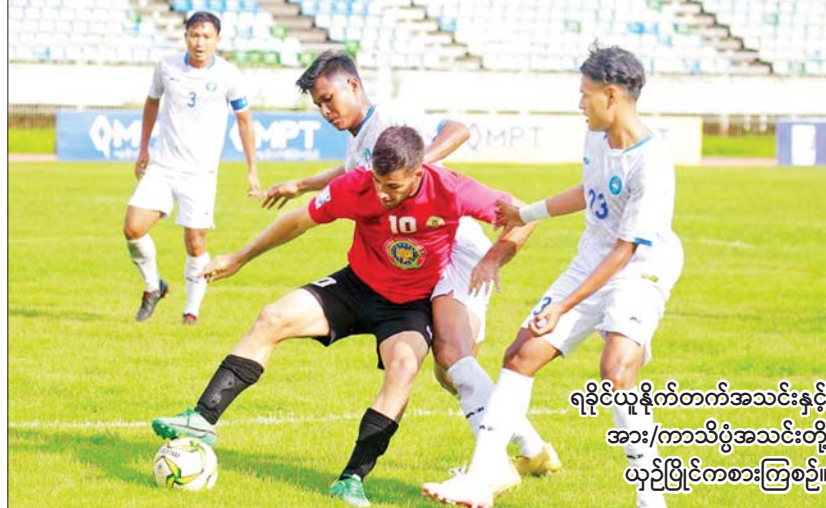
ရခိုင်ယူနိုက်တက်အသင်းနှင့် အား/ကာသိပွဲအသင်းတို့ ယှဉ်ပြိုင်ကစားကြစဉ်။

ရန်ကုန် အောက်တိုဘာ ၉ ၂၀၂၂ ရာသီ MNL အမှတ်ပေးပြိုင်ပွဲ ပွဲစဉ်(၁၅) ဒုတိယနေ့ကို အောက်တိုဘာ ၉ ရက် က ဆက်လက်ကျင်းပရာ အား/ကာသိပွဲအသင်း က ရခိုင်ယူနိုက်တက်အသင်းကို လေးဂိုး-တစ်ဂိုးဖြင့် အနိုင်ရရှိခဲ့သည်။ အား/ကာသိပွဲအသင်းသည် နိုင်ပွဲ ပျောက်ဆုံးမှုကို အဆုံးသတ်နိုင်ခဲ့ပြီး ရခိုင် အသင်းကို နှစ်ကျော့စလုံး အနိုင်ကစားနိုင်ခဲ့ သည်။ ရခိုင်ယူနိုက်တက်အသင်းသည် ယခု ရာသီတွင် နိုင်ပွဲနှင့် ရမှတ်လုံးဝမရရှိသေးဘဲ ဇယားအောက်ဆုံးရောက်ရှိနေကာ တန်းဆင်း ရရန် နီးစပ်နေပြီဖြစ်သည်။ စာမျက်နှာ ၂၈ ကော်လံ ၁ သို့ ❖