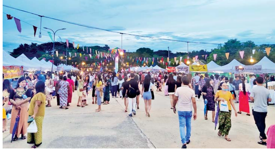
နေပြည်တော် ရေပန်းဥယျာဉ်အတွင်းရှိ ညဈေးတန်းတွင် သီတင်းကျွတ်လပြည့်နေ့က စည်ကား လျက်ရှိသည်ကို တွေ့ရစဉ်။

“သီတင်းကျွတ်လပြည့်နေ့က ဗုဒ္ဓ ဘာသာဝင်တို့ရဲ့ နေ့ထူးနေ့မြတ်ဖြစ်တဲ့ အတွက်ကြောင့် သူငယ်ချင်းတွေနဲ့အတူ ဥပုသ်သီလဆောက်တော် မြတ် ကြီးကို လာရောက်ဖူးမြော်တာပါ။ ညပိုင်းမှာ