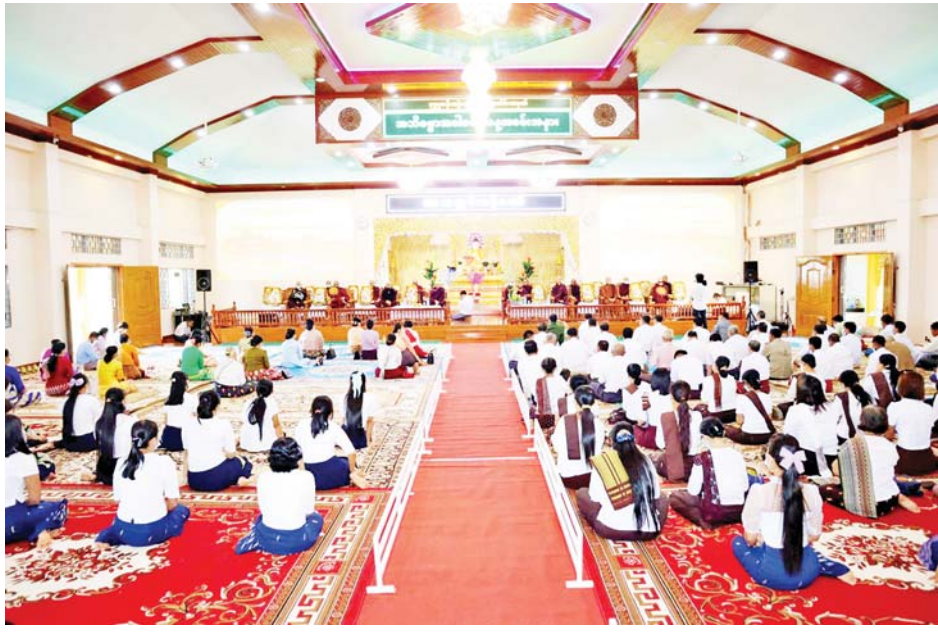
ကျိုက္ခမိရေလယ် ဆံတော်ရှင်မြတ်ဘုရားကြီး ဘဏ္ဍာတော်ထိန်း ဂေါပကအဖွဲ့မှ တာဝန်ရှိသူများနှင့် တွေ့ဆုံရာ ဂေါပကအဖွဲ့မှ တာဝန်ရှိသူများက ဘုရားကြီး ဘက်စုံမွမ်းမံ ဆောင်ရွက်ထားရှိမှု၊ ဘုရားဖူးများ တည်းခိုနေထိုင်ရေး စီစဉ်ဆောင်ရွက်မှုအခြေအနေ

နေပြည်တော် အောက်တိုဘာ ၉ သီတင်းကျွတ်လပြည့် အခါသမယတွင် မွန်ပြည်နယ်အတွင်းရှိ တန်ခိုးကြီးဘုရားများ၊ စေတီများ၌ အနယ်နယ်အရပ်ရပ်မှ ဘုရားဖူးလာ ပြည်သူများဖြင့် စည်ကားလျက်ရှိရာ ယနေ့ နံနက် ပိုင်းက သီတင်းကျွတ်လပြည့်အဘိဓမ္မာအခါတော်နေ့ အခမ်းအနားကို ကျိုက္ခမိရေလယ် ဆံတော်ရှင်မြတ် ဘုရားကြီး သာသနာ့ဗိမာန်တော်ခန်းမဆောင်၌ ကျင်းပသည်။ အခမ်းအနားသို့ ပြည်နယ်ဝန်ကြီးချုပ် ဦးဇော်လင်းထွန်းနှင့် ဇနီး၊ ပြည်နယ်ဝန်ကြီးများ တက်ရောက် ဖူးမြော်ကြည်ညိုကြပြီး ကျိုက္ခမိမြို့ အဘိဓမ္မာအသင်းမှ မျှော်ချင့်ပဏ္ဏ ကန်တော့လွှာဖြင့် ရွတ်ဆိုပူဇော်ခြင်း၊ အေးရိပ်သာ မန္တလေးကျောင်း တိုက်ဆရာတော်ထံမှ ရှစ်ပါးသီလခံယူဆောက်တည်ခြင်း၊ မေတ္တာသုတ် ပရိတ်တော် နာယူကြည်ညိုခြင်း၊ ပန်း၊ ဆီမီး၊ ရေချမ်းနှင့် ရွှေသင်္ကန်းများ ကပ်လှူ ပူဇော်၍ အလှူငွေများ ပေးအပ်ခြင်းတို့ ဆောင်ရွက် ကြကာ လှူဒါန်းမှုအစုစုအတွက် ရေစက်သွန်းချ အမျှပေးဝေကြကြောင်း သိရသည်။ ယင်းနောက် ပြည်နယ်ဝန်ကြီးချုပ်သည်