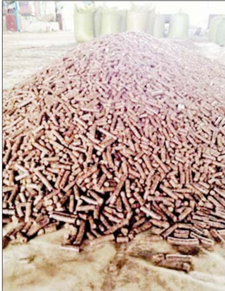
ကုန်ချောလောင်စာတောင့် (Wood Pellet)

Wood Pellet ဆိုသည်မှာ သစ်သားကို အချင်းငါး မီလီမီတာ၊ အရှည် ငါး မီလီမီတာအရွယ်ထိ သစ်သားစဖတ် (Wood Flakes) များအဖြစ် ကြိတ်ခြေထုခဲ့ပြီး ရေငွေ့ပါဝင်မှု ၇ ဒသမ ၈ ရာခိုင်နှုန်းအခြေခံ၍ စက်ဖြင့် ဖိညှစ်ထားသော လောင်စာတောင့်ဖြစ်ပါသည်။ မည်သည့်သစ်ကုန်ကြမ်းအမျိုးအစားအရွယ်အစားကိုမဆို သုံးစွဲနိုင်ပါသည်။ သစ်ပျော့သစ်မျိုးများကို ပိုမိုနှစ်သက်ကြပြီး သစ်ပျော့သစ်မာ ရောနှော၍လည်း အသုံးပြုကြပါသည်။ Wood Pellet ထုတ်လုပ်မှု နည်းစဉ်အရ သစ်ကုန်ကြမ်းများအား သေးငယ်သော အရွယ်အစားဖြစ်အောင် ကြိတ်ခြေထုခွဲ (Defibrate) ပြုလုပ်၍ ယင်းတို့ကို ဖိအားဖြင့် ကျစ်လျစ်စေပြီး အတောင့်ဖြစ်အောင် ညှစ်ထုတ်ခြင်းဖြစ်ပါသည်။ ယင်းသို့ အပူဖြင့် ဖိညှစ်စဉ် ပြိုကွဲနေသော သစ်စသစ်မျှင်များအတွင်းရှိ လစ်ဂနင် (Lignin) ခြပ်ပေါင်းများအချင်းချင်း အပူကြောင့် ပေါင်းစည်းကာ သစ်စသစ်မျှင်များကို ကော်အဖြစ် တွဲစပ်ပေးခြင်းဖြစ်ပါသည်။ ထို့ကြောင့် Wood Pellet ထုတ်လုပ်မှု