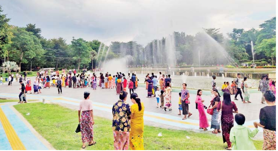
နေပြည်တော် ရေပန်းဥယျာဉ်အတွင်း သီတင်းကျွတ်လပြည့်နေ့က စည်ကားလျက်ရှိသည်ကို တွေ့ရစဉ်။