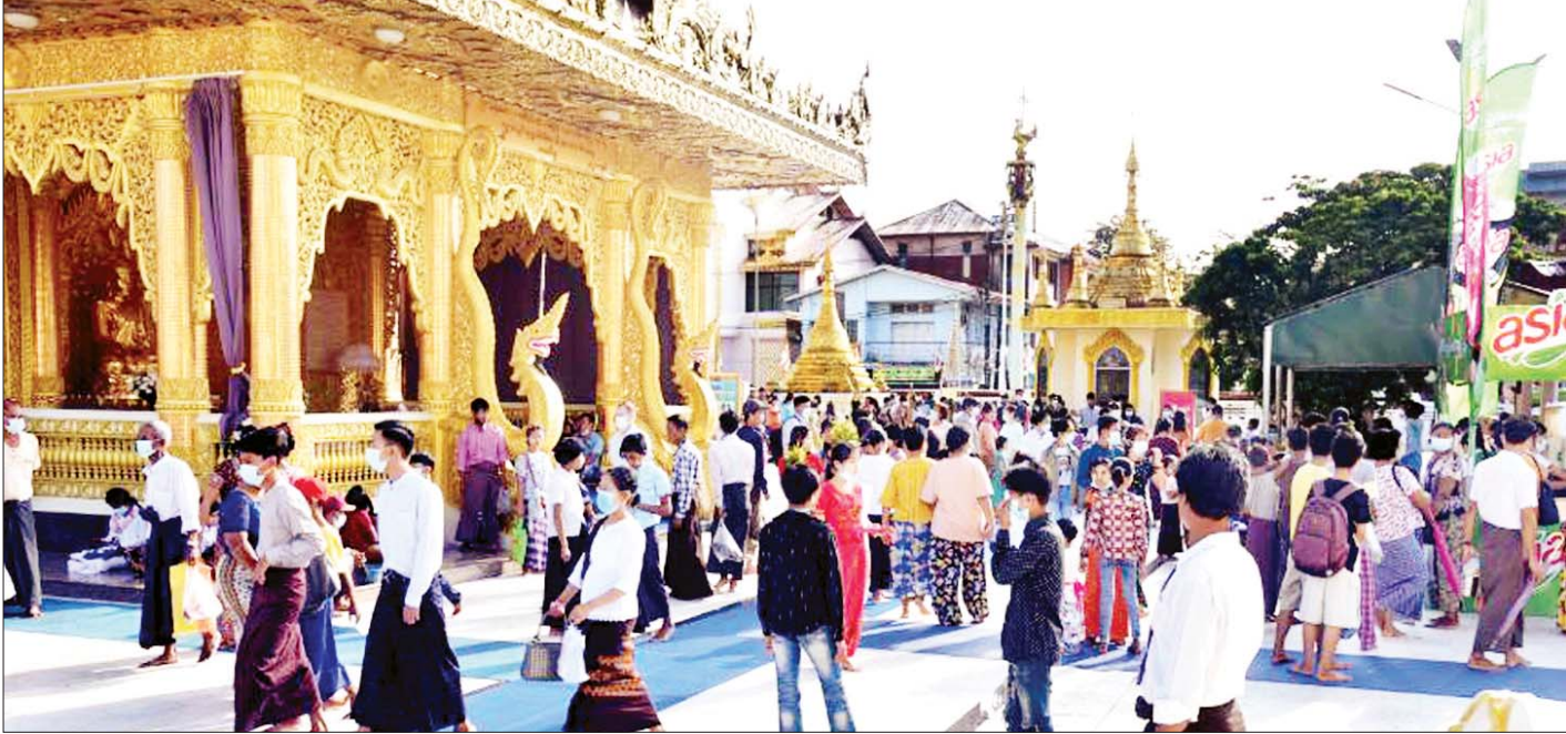
သီတင်းကျွတ်လပြည့်နေ့တွင် ဗိုလ်တထောင်ကျိုက်ဒေးအပ်ဆံတော်ဦးစေတီတော်၌ ဘုရားဖူးလာပြည်သူများဖြင့် စည်ကားများပြားလျက်ရှိသည်ကို တွေ့ရစဉ်။

သတင်း - ဇော်မင်းလတ်(MNA)၊ ကျော်စိုးဝင်း