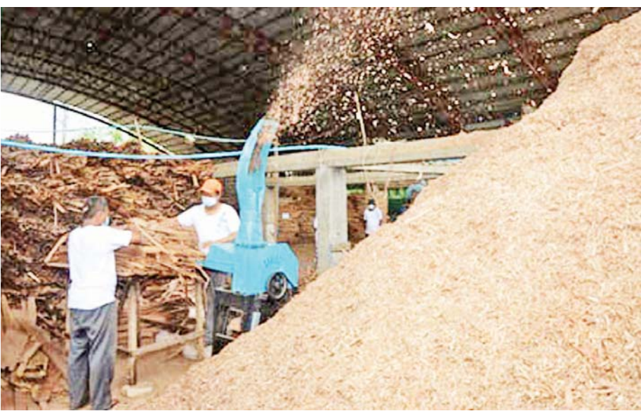
သစ်ပါးလွှာဘေးထွက်အမှိုက်(ပထမအဆင့်ကုန်ကြမ်း)များကို ကြိတ်ခြေစက်ဖြင့် Wood Flake (ဒုတိယအဆင့်ကုန်ကြမ်း)ပြုလုပ်နေစဉ်။

သစ်တောသယံဇာတများသည် နိုင်ငံတော်နှင့် နိုင်ငံသားတို့၏ လူမှုစီးပွားဖွံ့ဖြိုးတိုးတက်ရေး အတွက်သာမက နိုင်ငံတစ်ဝန်း ရေမြေသာသာဝ တိုးတက်ကောင်းမွန်ရေးနှင့် ပတ်ဝန်းကျင်ထိန်းသိမ်း ကာကွယ်ရေးအတွက် အရေးပါသော သဘာဝအရင်း အမြစ်များဖြစ်သည်။ ပညာရှင်များ၏အဆိုအရ သစ်တောသစ်ပင်များသည် လွန်ခဲ့သော နှစ်သန်း ပေါင်းများစွာ ကြာမြင့်ခဲ့ပြီဖြစ်သော ကမ္ဘာတည်ဦး ကာလမှစ၍ သက်ရှိဇီဝရုပ်များနှင့်အတူ အပြန် အလှန်အကျိုးပြုပြီး ဖြစ်ထွန်းပေါ်ပေါက်လာခဲ့ ကြောင်း တွေ့ရသည်။ ယေဘုယျအားဖြင့် သစ်ပင် များသည် လူသားအပါအဝင် သက်ရှိသတ္တဝါများ အတွက် အစာအာဟာရအခြေခံအဖြစ်လည်းကောင်း၊ ထိုသက်ရှိသတ္တဝါများ အသက်ရှင်သန်နေစဉ် စွန့်ပစ်သည့် အညစ်အကြေးများနှင့် သေဆုံး ပြီးနောက် ကျန်ရှိသည့် ဇီဝရုပ်ကြွင်းများသည် သစ်ပင် အတွက် အစာအာဟာရအဖြစ်လည်းကောင်း အပြန် အလှန် အသိပညာပြုကြသည်။ သစ်ပင်များ အားလုံး နီးပါးသည် လေထဲမှ ကာဗွန်ဒိုင်အောက်ဆိုက်ကို စုပ်ယူပြီး လေထဲသို့ အောက်ဆီဂျင်ဓာတ်ငွေ့ကို ထုတ်လွှတ်သည်။ အပြန်အလှန်အားဖြင့် လူသား အပါအဝင် သက်ရှိများမှာ လေထဲမှအောက်ဆီဂျင်ကို ရယူပြီး လေထဲသို့ ကာဗွန်ဒိုင်အောက်ဆိုက်ကို ထုတ်လွှတ်သည်။ ဤကား သစ်တောသစ်ပင်များနှင့် သက်ရှိသတ္တဝါတို့အကြား အပြန်အလှန် အကျိုးပြုမှု ကို လေ့လာတွေ့ရှိရသော အထင်ရှားဆုံးနှင့် အရေး ပါဆုံး သဘာဝပတ်ဝန်းကျင်ဖြစ်သည်။