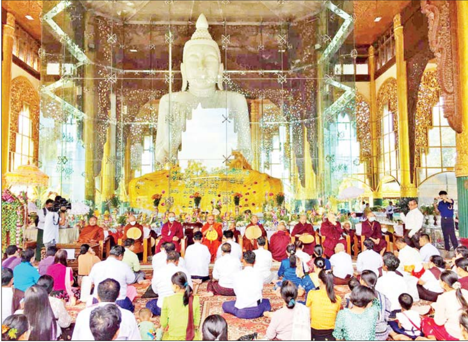
မင်းဓမ္မကုန်းတော်ရှိ လောကချမ်းသာ အဘယလာဘမုနိဗုဒ္ဓရုပ်ပွားတော်မြတ်ကြီး၌ သီတင်းကျွတ်လပြည့်(အဘိဓမ္မာအခါတော်နေ့)အခမ်းအနား ကျင်းပစဉ်။