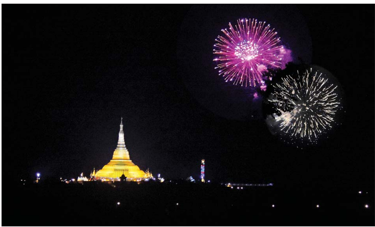
၁၃၈၄ ခုနှစ် သီတင်းကျွတ်လပြည့်(အဘိဓမ္မာအခါတော်နေ့)တွင် နေပြည်တော် ဥပုတသန္တိစေတီတော်မြတ်ကြီးအနီးရှိ တပေါင်းကွင်း၌ Firework အမျိုးအစား မီးရှူးမီးပန်းများ ပစ်ဖောက်သည်ကို တွေ့ရစဉ်။