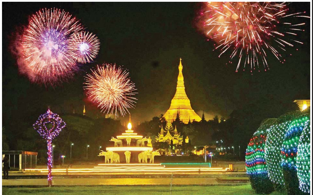
ရန်ကုန်မြို့လေးဆူဓာတ်ပုံ ရွှေတိဂုံစေတီတော် အနောက်ဘက်မှန် ပြည်သူ့ဥယျာဉ်နှင့် ပြည်သူ့ရင်ပြင်၌ ၁၃၈၄ ခုနှစ် သီတင်းကျွတ်လပြည့်ည က ဈေးရောင်းပွဲတော် လာရောက်ကြသော ပြည်သူများ စိတ်အပန်းပြေစေရန်နှင့် ရွှေတိဂုံစေတီတော်ကြီးအား ရောင်စုံမီးရှူး မီးပန်းများဖြင့် ထွန်းညှိပူဇော်နေမှုကို မြင်တွေ့ရစဉ်။

မိုးနဲ အောက်တိုဘာ ၉ ရှမ်းပြည်နယ် (တောင်ပိုင်း) နမ့်စန်ခရိုင် မိုးနဲမြို့နယ်တွင် မြို့နယ်လုံးဆိုင်ရာ သံဃာအပါး ၆၀၀ ကျော်အား သံဃာဒါန မြို့လုံးကျွတ် ဆွမ်းဆန်စိမ်းလောင်းလှူပွဲကို နမ့်စန်-မိုးနဲ-မိုင်းတုံ-မိုင်းဆတ် ပြည်ထောင်စုလမ်း မိုးနဲလမ်းပိုင်း မြို့တွင်းလမ်းတစ်လျှောက်၌ ယနေ့ နံနက် ၆ နာရီက စည်ကားသိုက်မြိုက်စွာ ကျင်းပခဲ့သည်။ ယင်းသို့လောင်းလှူရာတွင် ဗုဒ္ဓရုပ်ပွားတော်အား ရှေးဆုံးမှ ပင့်ဆောင်၍ ပရိတ်ရွတ်ဖတ်ပူဇော်ခြင်း၊ ပင့်သံဃာ ဆရာတော်အရှင် သူမြတ်အပါး ၆၀၀ ကျော်ဖြင့် မိုးနဲမြို့ နာဟောင်ရပ်ကွက် ရွှေကျောင်းတော် ဘုန်းတော်ကြီးကျောင်းမှစတင်ကာ ပြည်ထောင်စုလမ်း တစ်လျှောက် ကြွရောက်တော်မူခဲ့ပြီး မြို့နယ်အဆင့် ဌာနဆိုင်ရာများ၊ မြို့သူ မြို့သားများ၊ ဈေးသူ ဈေးသားများနှင့် စေတနာရှင် အလှူရှင် များက ဆွမ်းဆန်တော်၊ ကြက်သွန်နှင့် ဆပ်ပြာအပြင် လှူဖွယ်ဝတ္ထု ပစ္စည်းမျိုးစုံကို မြို့လုံးကျွတ်စည်ကားသိုက်မြိုက်စွာ လောင်းလှူ ပူဇော်ကြသည်။ မြို့နယ်လုံးကျွတ်ဆွမ်းဆန်စိမ်း လောင်းလှူပူဇော်ပွဲတွင် ဆရာတော်အရှင်သူမြတ်များ အေးချမ်းစွာ အလှူခံကြရောက်တော်မူနိုင်ရန် ဌာနဆိုင်ရာများနှင့် လူမှုရေးအဖွဲ့အစည်းများက ပိုင်းဝန်းကုသိုလ်ပြု လိုက်ပါကူညီ ဆောင်ရွက်ပေးခဲ့ကြောင်း သိရသည်။ မျိုးညွန့်ရွှေ(မိုးနဲ)