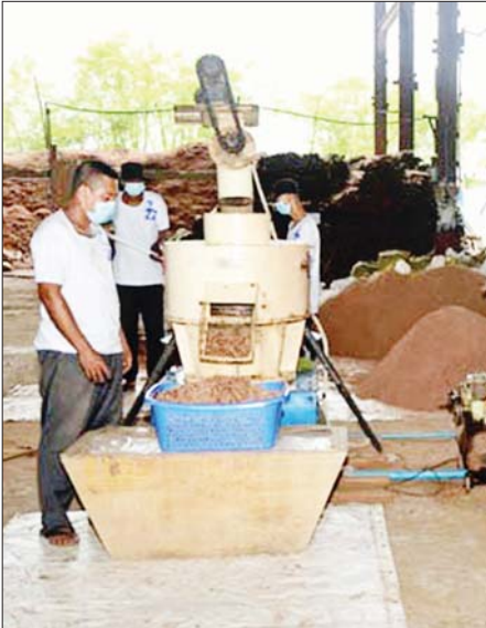
လောင်စာတောင့် (Wood Pellet) ပြုလုပ်နေစဉ်။

သစ်ကုန်ကြမ်းများကို အသုံးပြု၍ လူသုံးကုန်ပစ္စည်းအမျိုးမျိုးကို ထုတ်လုပ်ရာတွင် အခြေခံအကျဆုံးထုတ်ကုန်မှာ သစ်ခွဲသားဖြစ်ပါသည်။ ရှေးအခါက တောတွင်းမှ ခုတ်လှဲထုတ်လုပ်ရရှိသော သစ်လုံးကုန်ကြမ်းများအား လက်အားဖြင့် ဖြစ်စေ၊ စက်အားဖြင့်ဖြစ်စေ ခွဲစိတ်ဖြတ်တောက်ပြီး လူသားတို့၏ နေရေးလိုအပ်ချက် ဖြည့်ဆည်းရန် သစ်ခွဲသားအရွယ်အစားအမျိုးမျိုးကို ထုတ်လုပ်အသုံးပြုခဲ့ကြပါသည်။ ယင်းသို့ ခွဲစိတ်ထုတ်လုပ်ရာတွင် အသုံးပြုကုန်ကြမ်းပမာဏအပေါ်မူတည်၍ သစ်ခွဲသားပမာဏအများဆုံးရရှိအောင် ဦးတည်ဆောင်ရွက်ကြပါသည်။ အဆောက်အအုံအသုံးအရွယ်အစားများကို ဦးတည်ခွဲစိတ်ထုတ်လုပ်ကြပြီး သစ်ကုန်ကြမ်း၏ ကျန်အစိတ်အပိုင်းများ (Milling Residues) ကို လောင်စာနှင့် အခြားနေရာများတွင် အသုံးပြုကြပါသည်။ သစ်ခွဲသားများ၏ တန်ဖိုးတက်ချက်ရာတွင် အသုံးပြုကုန်ကြမ်း တန်ဖိုးအပေါ်အခြေခံ၍ ခွဲသားထွက်ရှိမှုရာခိုင်နှုန်းအရ တန်ဖိုးသင့်ထွက်ချက်