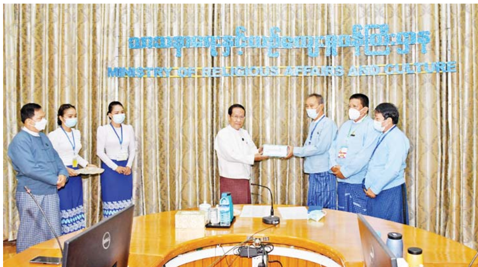
အခမ်းအနားတွင် ပြည်ထောင်စုဝန်ကြီးဦးကိုကိုက ယခုကဲ့သို့ ပွင့်လင်းရာသီကာလ၌ သဘင်အနုပညာရှင်များအနေဖြင့် ကပ်ရောဂါဘေးဆိုးကြီးအကြားမှ ရုန်းကန်လှုပ်ရှားရန် ကြိုးပမ်းရင်းဖြင့် ယခုကဲ့သို့ ကြုံတွေ့သွားရခြင်းအတွက် များစွာစိတ်မကောင်းဖြစ်ရကြောင်း၊ သဘင်အစည်းအရုံးမှ တာဝန်ရှိသူများအနေဖြင့် သတင်းရလျှင်ရချင်း ကူညီဆောင်ရွက်သင့်သည်များကို ငွေအား၊ လူအားဖြင့် အချိန်နှင့်တစ်ပြေးညီ ဆောင်ရွက်ခဲ့ခြင်းအတွက် အသိအမှတ်ပြုလေးစားကြောင်း၊ သာသနာရေးနှင့်

အခမ်းအနားသို့ ဒုတိယဝန်ကြီး ဒေါက်တာမိုးဇော်ထွန်း၊ အနုပညာဦးစီးဌာန ညွှန်ကြားရေးမှူးချုပ် ဦးညွန့်ဝင်း၊ ဒုတိယအမြဲတမ်းအတွင်းဝန် ဦးလှိုင်ဝင်း၊ မောင်နှင့် ဌာနဆိုင်ရာတာဝန်ရှိသူများ၊ အနုပညာရှင်ဝန်ထမ်းများ၊ မြန်မာနိုင်ငံသဘင်အစည်းအရုံး(ဗဟို) ဥက္ကဋ္ဌ ဦးစိန်မြအောင်၊ အတွင်းရေးမှူး ဦးနေဝင်းနှင့် ဗဟိုအမှုဆောင်အဖွဲ့ဝင်များ တက်ရောက်ကြသည်။