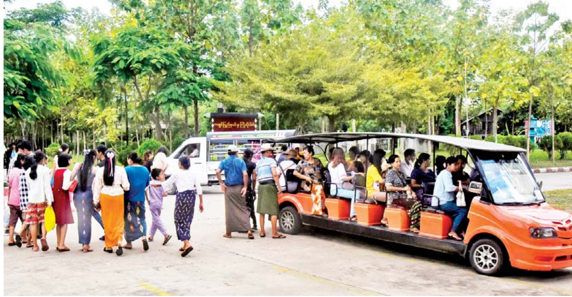
နေပြည်တော် အမျိုးသားအထိမ်းအမှတ်ဥယျာဉ်၌ အပန်းဖြေကြသူများဖြင့် စည်ကားလျက်ရှိသည်ကို တွေ့ရစဉ်။

ရှိ ဥပုသ်သီလဆောက်တော်မြတ်ကြီး၊ ဗုဒ္ဓဂါယာ (နေပြည်တော်)၊ မဟာ သကျရံသီရိတော်မူ ရုပ်ရှင်တော် မြတ်ကြီး၊ ရန်အောင်မြင်ရွှေလက်လှ စေတီတော်၊ ဓာတုစယဓာတ်ပေါင်းစု