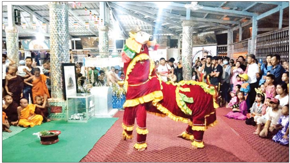
သီတင်းကျွတ်လပြည့်(အဘိဓမ္မာအခါတော်နေ့)တွင် နမ္မတူမြို့နယ် တောင်ပေါ်ဘုရား၌ ဆီမီးဆက်ကပ် လှူဒါန်းသူများ၊ တိုးနရားအကဖြင့် မြတ်စွာဘုရားရှင်အား ပူဇော်ကန်တော့နေမှုများဖြင့် စည်ကားလျက် ရှိသည်ကို တွေ့ရစဉ်။ လူမော်(ပြန်/ဆက်)