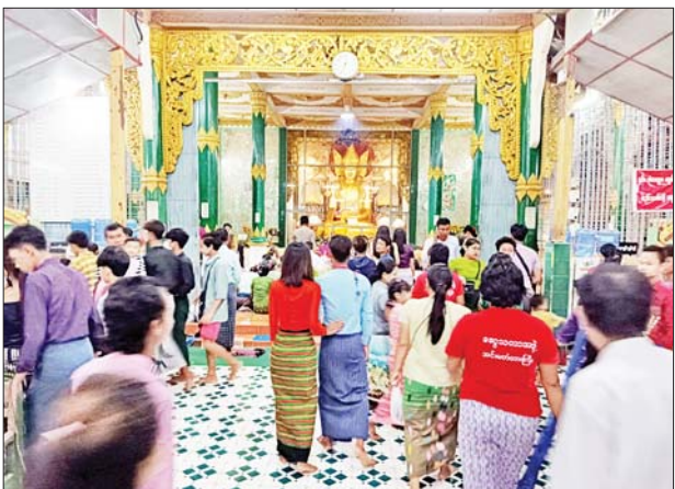
ပြည်သူများဖြင့် အေးချမ်းပျော်ရွှင် ရှိကြောင်း သိရသည်။ စွာ ကုသိုလ်ယူ စည်ကားလျက် ခရိုင်(ပြန်/ဆက်)

မအူပင် အောက်တိုဘာ ၉ ရောဝတီ တိုင်းဒေသကြီး မအူပင်မြို့ရှိ မြို့၏ကျက်သရေ ဆောင် ရွှေဘုန်းမြင့်စေတီတော် မြတ်ကြီး၊ မြို့ဦးပေါ်တော်မူစေတီ တော်မြတ်ကြီး၊ စိမ်းမြကန်သာ စေတီတော်မြတ်ကြီးနှင့် ဘုရား၊ ကျောင်း၊ ကန်၊ စေတီ၊ ပုထိုးများ တွင် ယနေ့ သီတင်းကျွတ်လပြည့် (အဘိဓမ္မာအခါတော်နေ့) တွင် ပန်း၊ ရေချမ်း၊ ဆီမီးကပ်လှူပူဇော် သူ၊ ကျွေးမွေးလှူဒါန်းသူ၊ ဥပုသ်သီလ ဆောက်တည် ကုသိုလ်ပြုသူနှင့် ဘုရားဖူးလာ