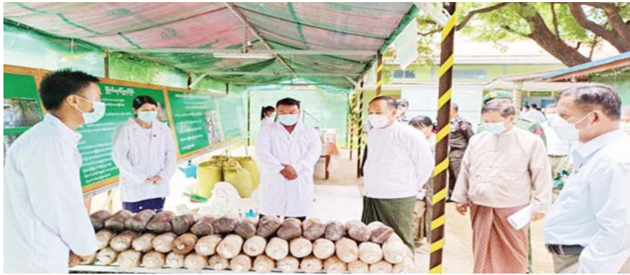
စစ်ကိုင်းတိုင်းဒေသကြီး စိုက်ပျိုးရေးဦးစီးဌာန၏ မိုစိုက်ပျိုးထုတ်လုပ်မှုပြခန်းများအား စစ်ကိုင်းတိုင်း ဒေသကြီး ဝန်ကြီးချုပ် ဦးမြတ်ကျော်နှင့်အဖွဲ့ ကြည့်ရှုစစ်ဆေးစဉ်။

စစ်ကိုင်းတိုင်းဒေသကြီး အစိုးရအဖွဲ့အနေဖြင့် လည်း ဒေသခံပြည်သူများ၏ မိသားစုများအတွက် ပိုမိုကောင်းမွန်သော အသက်မွေးဝမ်းကျောင်း အလုပ်အကိုင်အခွင့်အလမ်းများ ရရှိစေရေးနှင့် ရေရှည်တည်မြဲစေမည့် အလုပ်အကိုင် အခွင့်အလမ်း များရရှိစေရန် ဆောင်ရွက်ပေးခြင်းနှင့် ဒေသ ထွက်ကုန်များကို တန်ဖိုးမြှင့်ပစ္စည်း ထုတ်လုပ်နိုင် ရေးနည်းပညာပေးခြင်း စသည့်လုပ်ငန်းများကို အကောင်အထည်ဖော် ဆောင်ရွက်ပေးလျက်ရှိရာ