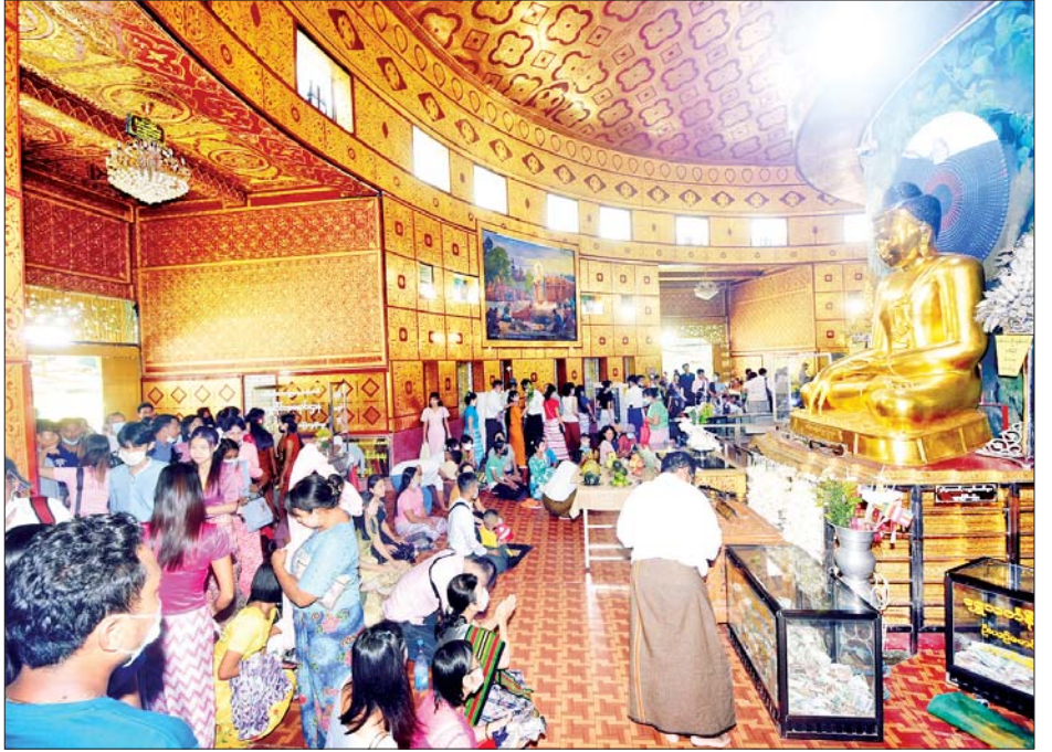
သီတင်းကျွတ်လပြည့်နေ့တွင် သီရိမင်္ဂလာကမ္ဘာအေးစေတီတော်၌ ဘုရားဖူးလာပြည်သူများဖြင့် စည်ကားများပြားလျက်ရှိသည်ကို တွေ့ရစဉ်။

ဇရိုးဖုံးမှ ရွှေတိဂုံစေတီတော် ဘဏ္ဍာတော်ထိန်းဂေါပကအဖွဲ့က ကြီးမှူးကျင်းပသည့် ၁၃၈၄ ခုနှစ် သီတင်းကျွတ်လပြည့်(အဘိဓမ္မာအခါတော်နေ့)နှင့် ဆွမ်းသိမ်းသီလခံယူပွဲအောင်ပွဲအခမ်းအနားကို ယနေ့နံနက်ပိုင်းတွင် ရွှေတိဂုံစေတီတော်တောင်ဘက်မုခ်ရှိ ရှေးဟောင်းဗုဒ္ဓရုပ်ပွားတော်များတန်ဆောင်း၌ ကျင်းပရာ ဂေါပကအဖွဲ့ဝင်များ၊ ဘာသာရေးဝတ်အသင်းအဖွဲ့များနှင့် ဝန်ထမ်းများက အရုဏ်တက်ချိန်တွင် ရွှေတိဂုံစေတီတော်မြတ်ကြီးနှင့် ဗုဒ္ဓရုပ်ပွားတော်များအား ဆွမ်း၊ ဆီမီး၊ ပန်း၊ ရေချမ်းနှင့် သစ်သီးဆွမ်းများ ဆက်ကပ်လှူဒါန်းကြသည်။ ထို့နောက် ဂေါပကအဖွဲ့ဝင်များ၊ ဘာသာရေးဝတ်အသင်းအဖွဲ့များနှင့် ဝန်ထမ်းများက ဝါဆိုဘုရားရှိခိုးခြင်း၊ စိန်ရောင်ခြည်ဘုရားပင့်ဂါထာဖြင့် ဘုရားရှင်ကို ပင့်လျှောက်ထားခြင်း၊ စေတီတော်မြတ်ကြီးအား မြတ်ဘုရားရွှေတိဂုံဂါထာဖြင့် ရှိခိုးပူဇော်ခြင်း၊ ပရိသတ်အပေါင်းတို့က နဝင်္ဂသီလခံယူဆောက်တည်ခြင်း၊ ဆုတောင်းအမျှဝေသာဓုခေါ်ဆိုခြင်း စသည့်အစီအစဉ်အတိုင်း ဆောင်ရွက်ကြသည်။ ယင်းနောက် အဘိဓမ္မာအခါတော်နေ့နှင့် ဆွမ်းသိမ်းသီလခံယူပွဲ အောင်ပွဲအခမ်းအနားကို ဆက်လက်ကျင်းပရာ ရွှေတိဂုံစေတီတော် ဘဏ္ဍာတော်ထိန်းဂေါပကအဖွဲ့၏ ဩဝါဒါစရိယဆရာတော်ကြီးများနှင့် ပင့်သံဃာတော်များ ကြွရောက်တော်မူကြပြီး ရန်ကုန်တိုင်းဒေသကြီး ဝန်ကြီးချုပ် ဦးစိုးသိန်းနှင့် တိုင်းဒေသကြီးဝန်ကြီးများ၊ ဂေါပကအဖွဲ့ဝင်များ၊ ဘာသာရေးဝတ်အသင်းအဖွဲ့များနှင့်