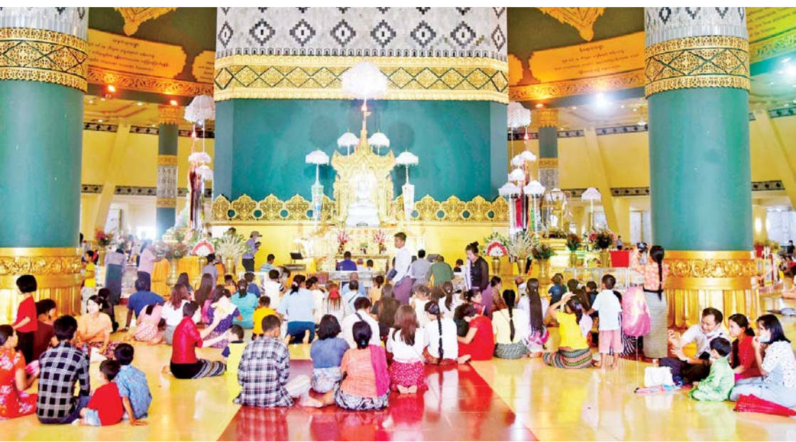
သီတင်းကျွတ်လပြည့်နေ့ (အဘိဓမ္မာအခါတော်နေ့)တွင် ဥပုသ်သီလဆောက်တော်မြတ်ကြီး၌ ကုသိုလ်ဒါနပြုကြသူများဖြင့် စည်ကားလျက်ရှိသည်ကို တွေ့ရစဉ်။

စေတီတော်၊ ထာဝရငြိမ်းချမ်းရေးစေတီ၊ လှေခွင်းတောင် တန်ခိုးကြီးဘုရား၊ ကိုးနဝင်းစေတီတော်၊ ဆုတောင်းပြည့် လောကမာရဇိန်စေတီတော်၊ သံသရာငြိမ်း အေးစေတီတော်၊ ဘုရားကိုးဆူ၊ ကိုးခန်း ကြီးဘုရား၊ လောကရန် နိမိစေတီ၊ ဖောင်တော်ချက်မစေတီ၊ လက်လုပ် တောင်စေတီ၊ မြို့ပေါ်ရပ်ကွက်များရှိ