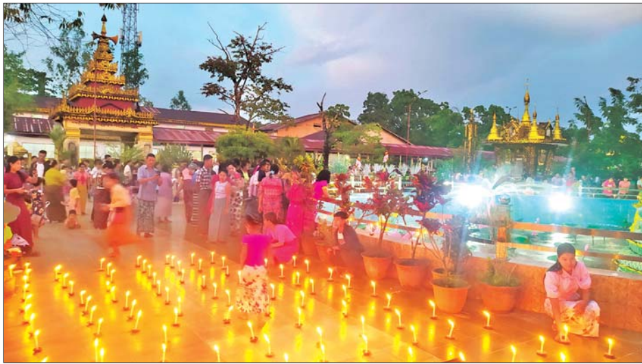
သီတင်းကျွတ်လပြည့်(အဘိဓမ္မာအခါတော်နေ့)တွင် ဘိုကလေးမြို့ ရန်ပြေမာန်ပြေအောင်စကြာ စေတီတော်၌ ဆီမီးတစ်ထောင် ပူဇော်ထားစဉ်။ မိုးစက်(ဘိုကလေး)