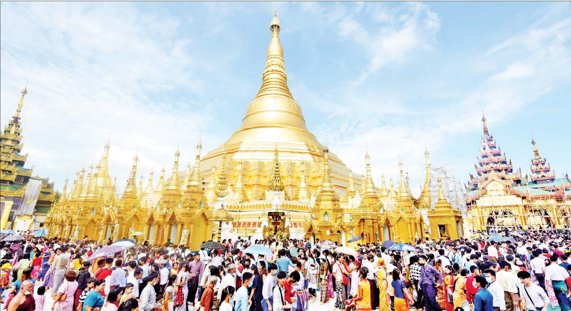
သီတင်းကျွတ်လပြည့်နေ့ ရွှေတိဂုံစေတီတော်မြတ်ကြီး၌ ဘုရားဖူးလာပြည်သူများဖြင့် စည်ကားများပြားလျက်ရှိသည်ကို တွေ့ရစဉ်။