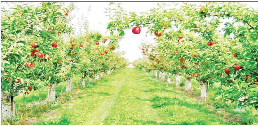
ချင်းပြည်နယ်(တောင်ပိုင်း)၌ တိုးချဲ့စိုက်ပျိုးလာသော ပန်းသီးစိုက်ခင်းများ။

ချင်းပြည်နယ်သည် မြန်မာနိုင်ငံ၏အနောက်မြောက်ဘက်တွင်တည်ရှိပြီး ခရိုင်ခြောက်ခုရှိပါသည်။ မြို့နယ်ကိုးမြို့နယ်ဖြင့် ဖွဲ့စည်းထားကာ ၂၀၁၄ ခုနှစ် သန်းခေါင်စာရင်းအရ လူဦးရေ သုည ၃၅၄ သန်းကျော် နေထိုင်လျက်ရှိပါသည်။ တောင်ပေါ်ဒေသ ဖြစ်သဖြင့် ချမ်းအေးသောရာသီဥတုရှိပြီး အပူဆုံး သောလမှာ ဧပြီလနှင့်မေလဖြစ်ကာ ပျမ်းမျှအပူချိန်မှာ ၆၀ ဒီဂရီဖာရင်ဟိုက်မှ ၇၀ ဒီဂရီဖာရင်ဟိုက်သာရှိပါသည်။ အအေးဆုံးကာလများတွင် အပူချိန်မှာ ၃၉ ဒီဂရီဖာရင်ဟိုက်မှ ရေခဲမှတ်အောက်အထိ ကျဆင်း တတ်ပါသည်။ ပျမ်းမျှမိုးရေချိန်မှာ ၈၀ မှ ၁၀၀ လက်မ အတွင်းရှိပြီး အထူးသဖြင့် တောင်ပိုင်းဒေသများတွင် မိုးပိုများပါသည်။