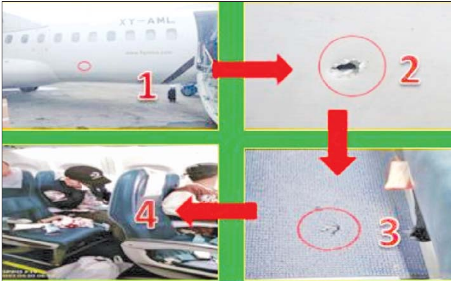
KNPP ၊ PDF အကြမ်းဖက်သမားများက ပြည်သူများစီးနင်းလိုက်ပါလာသည့် အရပ်ဘက်လေယာဉ်အား အကြမ်းဖက်ပစ်ခတ်တိုက်ခိုက်မှု။

ဒါ့အပြင် နိုင်ငံတကာဥပဒေ လုပ်ထုံးလုပ်နည်းတွေနဲ့အညီ အရေးယူဆောင်ရွက်နိုင်ရေး UNCTED၊ INTERPOL၊ ASEANPOL အပါအဝင် နိုင်ငံတကာအကြမ်းဖက်မှု တန်ပြန်တိုက်ဖျက်ရေးအဖွဲ့အစည်းတွေကို သက်သေအထောက်အထားတွေခိုင်လုံစွာနဲ့ လစဉ်ပေးပို့ အသိပေးလျက်ရှိပါတယ်။ ဒီလိုပေးပို့တိုင်ကြားမှုတွေကြောင့် အကြမ်းဖက်မှုကို အမှန်တကယ်ချုပ်ငြိမ်းစေလိုတဲ့ နိုင်ငံတွေနဲ့အဖွဲ့အစည်းတွေက ပူးပေါင်းဆောင်ရွက်လာတာကို တွေ့ရပါတယ်။