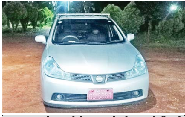
၂၀၂၂ ခုနှစ် အောက်တိုဘာ ၂ ရက်တွင် ကျောက်မဲမြို့နယ် Oriental တိုးဂိတ်၌ သိမ်းဆည်းရမိသည့် အကြမ်းဖက်သင်တန်း တက်ရောက်မည့် တရားခံများ စီးနင်းလာသည့် မော်တော်ယာဉ်၏ မှတ်တမ်းဓာတ်ပုံ။

၂၀၂၂ ခုနှစ် အောက်တိုဘာ ၂ ရက်တွင် ကျောက်မဲမြို့နယ် ရပ်ကွက်(၈)ကားဝင်း၌ ဖမ်းဆီးရမိသည့် အကြမ်းဖက်ဖောက်ခွဲရေးသင်တန်း တက်ရောက်သူများအား ချိတ်ဆက်ပို့ဆောင်ပေးမည့် တရားခံ၏ မှတ်တမ်းဓာတ်ပုံ။ ၂၀၂၂ ခုနှစ် အောက်တိုဘာ ၂ ရက်တွင် ကျောက်မဲမြို့နယ် ရပ်ကွက်(၈)ကားဝင်း၌ ဖမ်းဆီးရမိသည့် အကြမ်းဖက်ဖောက်ခွဲရေးသင်တန်း တက်ရောက်သူများအား ချိတ်ဆက်ပို့ဆောင်ပေးမည့် တရားခံ၏ မှတ်တမ်းဓာတ်ပုံ။ သတင်းစဉ်