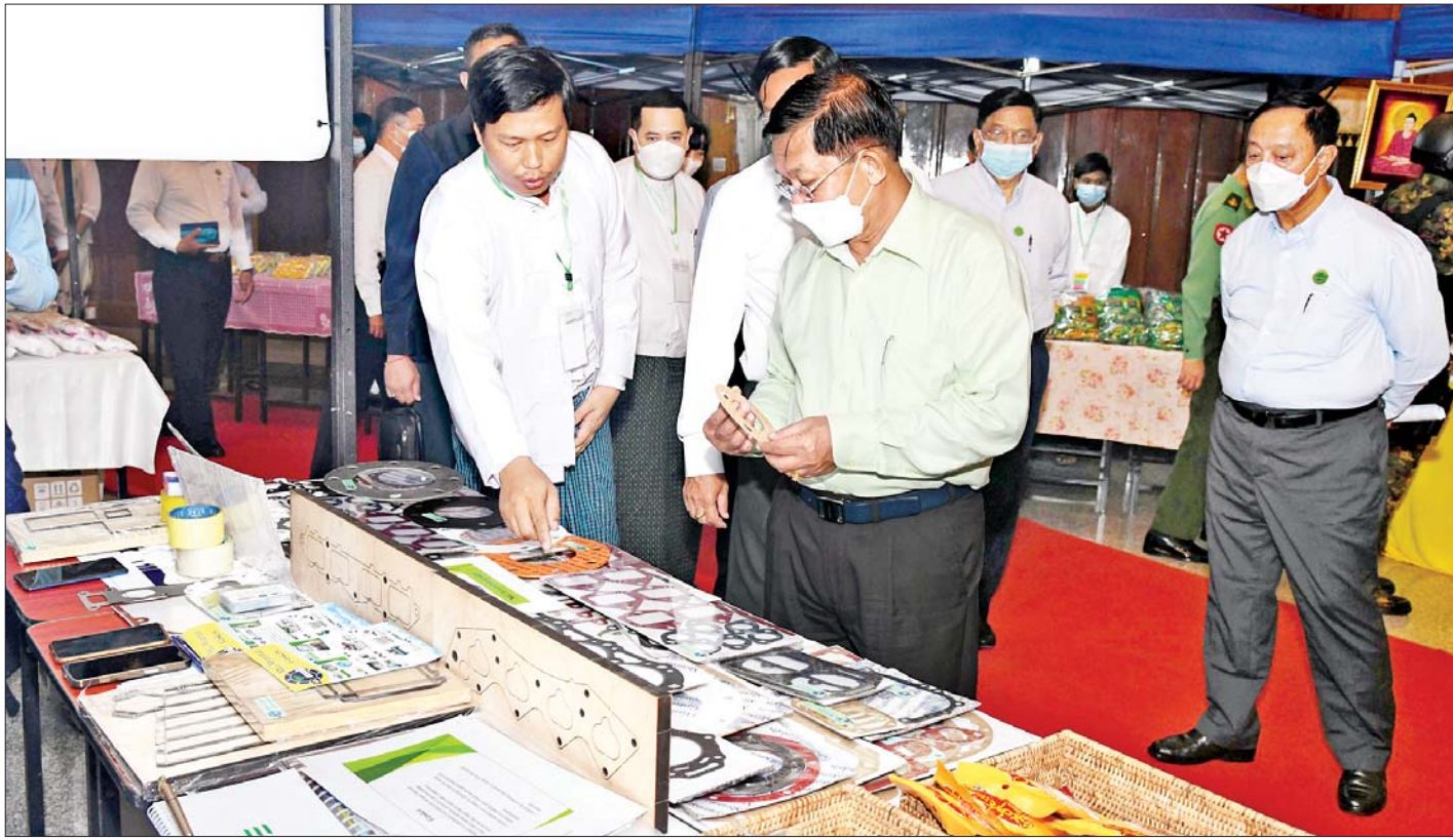
နိုင်ငံတော်စီမံအုပ်ချုပ်ရေးကောင်စီဥက္ကဋ္ဌ နိုင်ငံတော်ဝန်ကြီးချုပ် ဗိုလ်ချုပ်မှူးကြီးမင်းအောင်လှိုင်နှင့် အဖွဲ့ဝင်များ ခင်းကျင်းပြသထားသည့် စက်မှုလက်မှု ကုန်ပစ္စည်းများကို ကြည့်ရှုလေ့လာစဉ်။

အသေးစားနှင့် အငယ်စား စက်မှုလုပ်ငန်းများ သည် ပြည်တွင်းလိုအပ်ချက်ကို ဖြည့်ဆည်းပေးနိုင်ရန် အဓိကရည်ရွယ်ဆောင်ရွက်ခြင်းဖြစ်ကြောင်း၊ ပြည်ပ ပို့ကုန် အခွင့်အလမ်းရရှိရေးအတွက် ဆောင်ရွက်နိုင် မည့် နည်းလမ်းများကို ဆက်လက်ဆွေးနွေးသွားမည် ဖြစ်ကြောင်း၊ ကိုဗစ်ကာလ ချေးငွေများ နိုင်ငံတော်သို့ ပြန်လည်ပေးဆပ်ရန် အခက်အခဲများ ဖြစ်ပေါ်နေမှု အတွက် ကာလတစ်ခု သတ်မှတ်ဆောင်ရွက်ပေးမည် ဖြစ်ပြီး ရင်းနှီးမြုပ်နှံငွေများ ရရှိရေးအတွက်လည်း ဆောင်ရွက်ပေးသွားမည်ဖြစ်ကြောင်း၊ သို့သော်လည်း နိုင်ငံတော်အနေဖြင့် စီးပွားရေးလုပ်ငန်းများ ဖွံ့ဖြိုး တိုးတက်စေရေးအတွက် ရင်းနှီးမြုပ်နှံနိုင်ရန် ငွေကြေး များ ထုတ်ချေးပေးထားခြင်းဖြစ်သဖြင့် အမှန်တကယ် အောင်မြင်အောင် ဆောင်ရွက်ကြစေလိုပြီး ပြန်လည် ပေးဆပ်ရမည့် ကာလအတွင်း ပြည့်မီအောင် ပြန်လည် ပေးသွင်းနိုင်ရေး ဆောင်ရွက်ကြရန်လိုကြောင်း၊ နိုင်ငံတော်သို့ ပေးသွင်းရမည့် အခွန်အခများကိုလည်း အပြည့်အဝပေးသွင်းရန်လိုကြောင်း၊ လာမည့်ဘတ်ဂျက် ကာလများတွင် နိုင်ငံစီးပွား ဖွံ့ဖြိုးတိုးတက်ရေးရန်ပုံငွေ အတွက် ထည့်သွင်းလျာထားဆောင်ရွက်သွားမည်ဖြစ် ကြောင်း၊ နိုင်ငံတော်မှ ရရှိရန်ကျန်ရှိသည့် ချေးငွေများ ပြန်လည်ရရှိမည်ဆိုပါက ချေးငွေများကို ပိုမိုပြည့်ဝစွာ ထပ်မံထုတ်ချေးပေးနိုင်မည်ဖြစ်ကြောင်း၊ နိုင်ငံတော် အနေဖြင့် ပြည်တွင်းလည်ပတ် သုံးစွဲငွေများရှိပြီး ဖြစ်ပြီး စီးပွားရေးလုပ်ငန်းများအတွက် လိုအပ်သည့် ချေးငွေများကိုလည်း အတတ်နိုင်ဆုံးထုတ်ပေးသွား မည်ဖြစ်ကြောင်း။