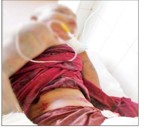
အကြမ်းဖက်သမားများ ပစ်ခတ်မှုကြောင့် သံဃာတော်တစ်ပါး ဒဏ်ရာရရှိမှုမှတ်တမ်းဓာတ်ပုံ။

နေပြည်တော် အောက်တိုဘာ ၃ စစ်ကိုင်းတိုင်းဒေသကြီး မုံရွာမြို့ နန္ဒဝန်ရပ်ကွက် အတွင်း PDF အမည်ခံ အကြမ်းဖက်သမားများက လက်နက်ငယ်များဖြင့် ရမ်းသန်းပစ်ခတ်ခဲ့ခြင်းကြောင့် သံဃာတော်တစ်ပါး ထိခိုက်ဒဏ်ရာရရှိခဲ့ကာ အမျိုးသားနှစ်ဦးသေဆုံးခဲ့ပြီး တစ်ဦးထိခိုက်ဒဏ်ရာရရှိခဲ့သည်။ ဖြစ်စဉ်မှာ ယနေ့ညနေပိုင်းတွင် မုံရွာမြို့အတွင်း တည်ငြိမ်အေးချမ်းရေး၊ လုံခြုံရေးတို့အတွက် လုံခြုံရေးတပ်ဖွဲ့ဝင်များက လှည့်ကင်းတာဝန်