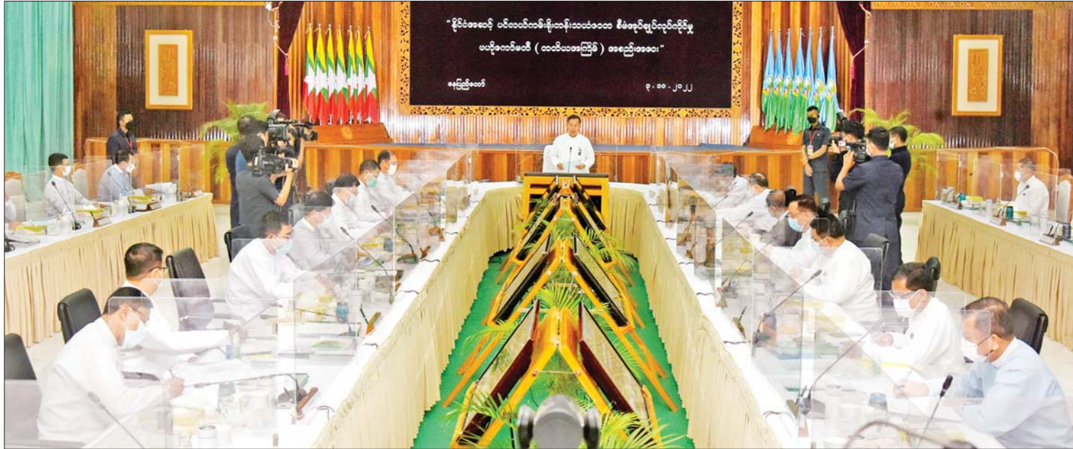
နိုင်ငံတော်စီမံအုပ်ချုပ်ရေးကောင်စီဒုတိယဥက္ကဋ္ဌ ဒုတိယဝန်ကြီးချုပ် ဒုတိယဗိုလ်ချုပ်မှူးကြီးစိုးဝင်း နိုင်ငံအဆင့် ပင်လယ်ကမ်းရိုးတန်းသယံဇာတစီမံအုပ်ချုပ်လုပ်ကိုင်မှု ဗဟိုကော်မတီ (တတိယအကြိမ်)အစည်းအဝေးတွင် အမှာစကားပြောကြားစဉ်။

နေပြည်တော် အောက်တိုဘာ ၃ နိုင်ငံအဆင့်ပင်လယ်ကမ်းရိုးတန်း သယံဇာတစီမံအုပ်ချုပ်လုပ်ကိုင်မှု ဗဟို ကော်မတီ၏ တတိယအကြိမ်အစည်း အဝေးကို ယနေ့မနက် ၉ နာရီတွင် နေပြည်တော်ရှိ သယံဇာတနှင့်သဘာဝ ပတ်ဝန်းကျင်ထိန်းသိမ်းရေးဝန်ကြီးဌာန သစ်တောဦးစီးဌာန အင်ကြင်းခန်းမ၌ ကျင်းပရာ နိုင်ငံအဆင့်ပင်လယ် ကမ်းရိုးတန်း သယံဇာတစီမံအုပ်ချုပ် လုပ်ကိုင်မှုဗဟိုကော်မတီဥက္ကဋ္ဌ နိုင်ငံတော် စီမံအုပ်ချုပ်ရေးကောင်စီ ဒုတိယဥက္ကဋ္ဌ ဒုတိယဝန်ကြီးချုပ် ဒုတိယဗိုလ်ချုပ် မျိုးကြီးစိုးဝင်း တက်ရောက်အမှာစကား ပြောကြားသည်။ အစည်းအဝေးသို့ ဗဟိုကော်မတီဝင် ပြည်ထောင်စုဝန်ကြီး ဦးခင်မောင်ရှိ၊ ဒုတိယဝန်ကြီးများ၊ အမြဲတမ်းအတွင်းဝန် များ၊ စာမျက်နှာ ၆ ကော်လံ ၁ သို့ ။