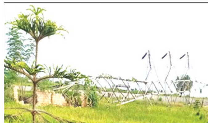
PDF အကြမ်းဖက်သမားများက မိုင်းထောင်ဖောက်ခွဲ ဖျက်ဆီးမှုကြောင့် ဓာတ်အားပေးတာဝါတိုင် အမှတ် ၁၃၀ ပျက်စီးနေမှု။

ဒါကြောင့် ဒီအဓိပ္ပာယ်ဖွင့်ဆိုချက်တွေကို ခြုံငုံလေ့လာကြည့်မယ်ဆိုရင် နိုင်ငံရေးပြဿနာကို နိုင်ငံရေးအရ အဖြေမရှာဘဲ လက်နက်ကိုင်မဟုတ်တဲ့ အဖြစ်မဲ့ပြည်သူတွေကို ပစ်မှတ်ထားပြီး အကြောက်