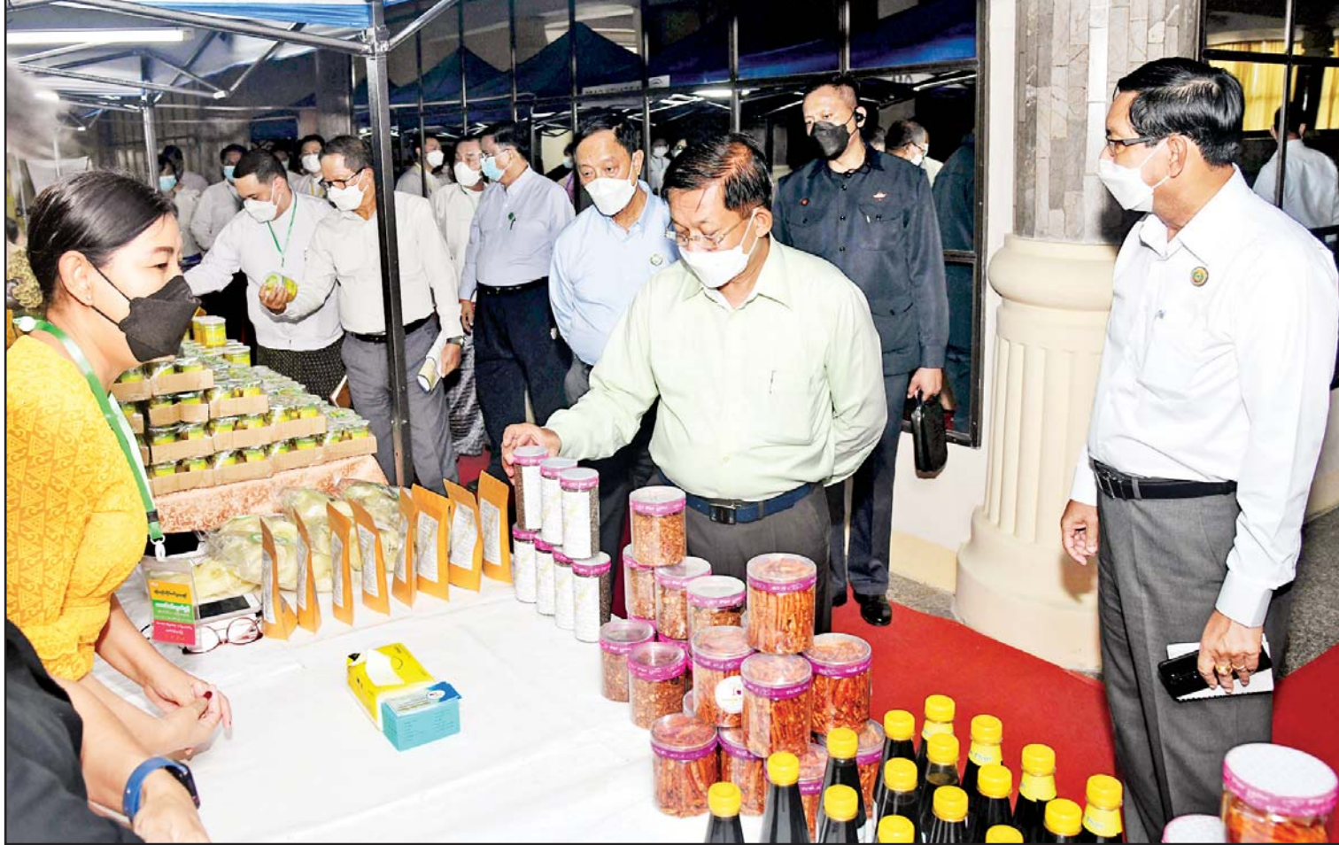
နိုင်ငံတော်စီမံအုပ်ချုပ်ရေးကောင်စီဥက္ကဋ္ဌ နိုင်ငံတော်ဝန်ကြီးချုပ် ဗိုလ်ချုပ်မှူးကြီးမင်းအောင်လှိုင်နှင့် အဖွဲ့ဝင်များ ခင်းကျင်းပြသထားသည့် စားသောက်ကုန်ပစ္စည်းများကို ကြည့်ရှုလေ့လာစဉ်။

နေပြည်တော် အောက်တိုဘာ ၃ နိုင်ငံတော်စီမံအုပ်ချုပ်ရေးကောင်စီ ဥက္ကဋ္ဌ နိုင်ငံတော်ဝန်ကြီးချုပ် ဗိုလ်ချုပ် မှူးကြီးမင်းအောင်လှိုင်သည် ယနေ့နံနက် ပိုင်းတွင် ပြည်ထောင်စုသမ္မတမြန်မာနိုင်ငံ ကုန်သည်များနှင့် စက်မှုလုပ်ငန်းများ ရှင်များအသင်းချုပ်(UMFCCI)နှင့် ရန်ကုန် တိုင်းဒေသကြီးအတွင်းရှိ အသေးစား၊ အငယ်စားနှင့် အလတ်စား စီးပွားရေး (MSME)လုပ်ငန်းရှင်များအား ရန်ကုန်မြို့ ရှိ ဇေယျာသီရိဗိမာန် ဧည့်ခန်းမဆောင်၌ တွေ့ဆုံ၍ စီးပွားရေးလုပ်ငန်းများ ဖွံ့ဖြိုး တိုးတက်ရေးအတွက် ဆွေးနွေးပြောကြား သည်။