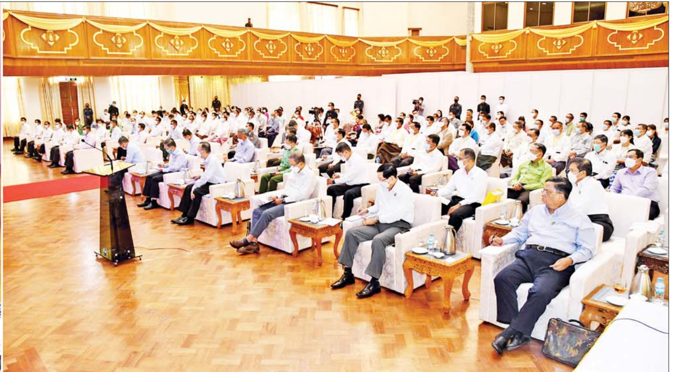
နိုင်ငံတော်စီမံအုပ်ချုပ်ရေးကောင်စီဥက္ကဋ္ဌ နိုင်ငံတော်ဝန်ကြီးချုပ် ဗိုလ်ချုပ်မှူးကြီးမင်းအောင်လှိုင် ပြည်ထောင်စုသမ္မတမြန်မာနိုင်ငံ ကုန်သည်များနှင့် စက်မှုလက်မှုလုပ်ငန်းရှင်များအသင်းချုပ်(UMFCCI)နှင့် ရန်ကုန်တိုင်းဒေသကြီးအတွင်းရှိ အသေးစား၊ အငယ်စားနှင့် အလတ်စား စီးပွားရေး(MSME)လုပ်ငန်းရှင်များအား တွေ့ဆုံ၍ စီးပွားရေးလုပ်ငန်းများ ဖွံ့ဖြိုးတိုးတက်ရေးအတွက် ဆွေးနွေးပြောကြားစဉ်။

☆ ရှေးဖွဲ့မှ ရန်ကုန်တိုင်းစစ်ဌာနချုပ်တိုင်းမှူးနှင့် တာဝန်ရှိသူများ၊ တိုင်းဒေသကြီးအစိုးရအဖွဲ့ဝင်များ၊ ပြည်ထောင်စုသမ္မတမြန်မာနိုင်ငံ ကုန်သည်များနှင့် စက်မှုလက်မှုလုပ်ငန်းရှင်များအသင်းချုပ်(UMFCCI)နှင့် ညီနောင်အသင်းများ၊ ရန်ကုန်တိုင်းဒေသကြီးအတွင်းရှိ အသေးစား၊ အငယ်စားနှင့် အလတ်စား စီးပွားရေး(MSME)လုပ်ငန်းရှင်များ တက်ရောက်ကြသည်။