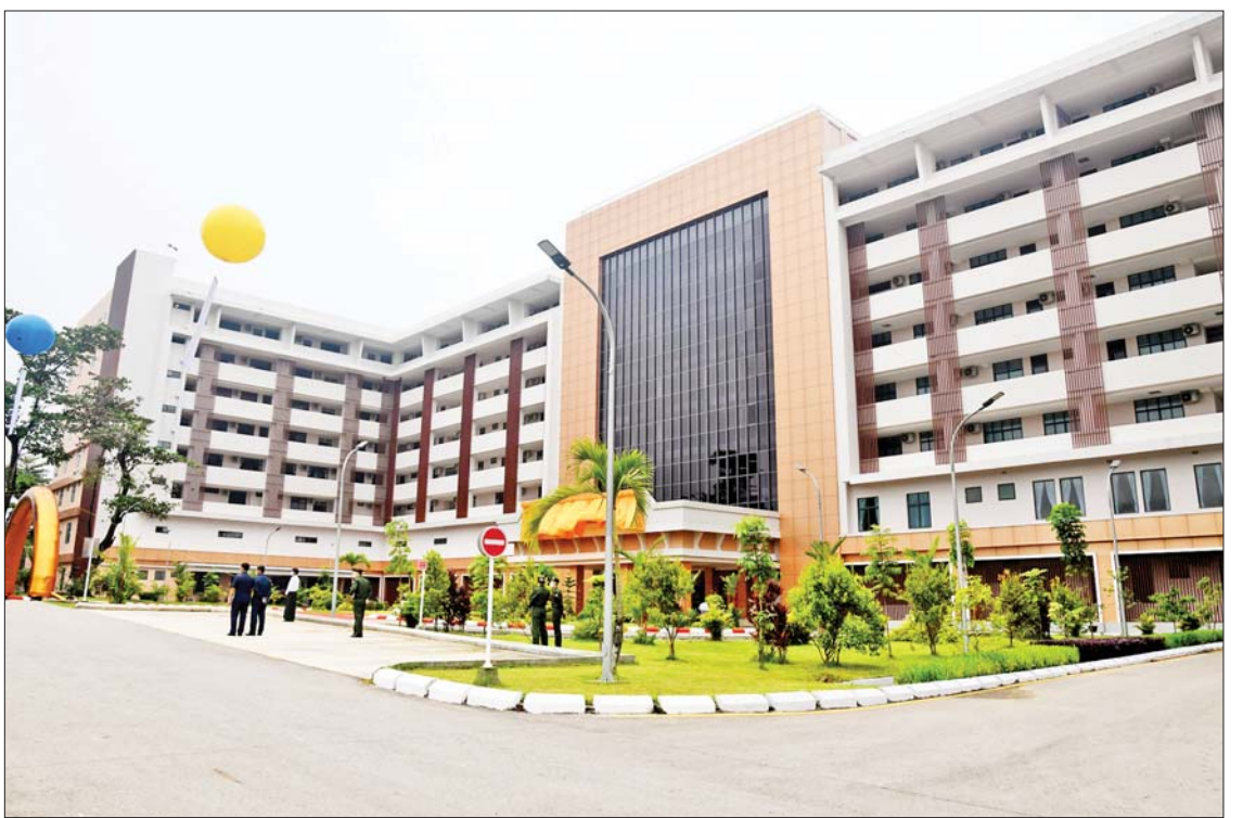
(၇၅)နှစ်မြောက် စိန်ရတုဆေးတပ်ဖွဲ့နေ့အထိမ်းအမှတ်အဖြစ် ဖွင့်လှစ်သည့် အမှတ်(၁)တပ်မတော်ဆေးရုံကြီး (ခုတင်-၁၀၀၀)၊ အဆင့်မြင့် (၈)ထပ်ဆေးရုံအဆောက်အအုံသစ်၊ အထူးကုသမှုစင်တာကို တွေ့ရစဉ်။

ယင်းနောက် ဆေးဝန်ထမ်းညွှန်ကြား ရေးမှူးဗိုလ်ချုပ်ကိုလိုက်က ဆေးဝန်ထမ်း တပ်ဖွဲ့သမိုင်းအကျဉ်းချုပ်ကို ရှင်းလင်း တင်ပြပြီး (၇၅)နှစ်မြောက် စိန်ရတု ဆေးတပ်ဖွဲ့နေ့အထိမ်းအမှတ် မှတ်တမ်း Documentary Video ကို ပြသသည်။ ထို့နောက် (၇၅)နှစ်မြောက် စိန်ရတု ဆေးတပ်ဖွဲ့နေ့ ဂုဏ်ပြုသီချင်းဖြင့် ဆေး ဝန်ထမ်းတပ်ဖွဲ့ဝင်များက ဖျော်ဖြေ တင်ဆက်သည်။ ယင်းနောက် နိုင်ငံတော် စီမံအုပ်ချုပ်ရေးကောင်စီဥက္ကဋ္ဌ တပ်မတော် ကာကွယ်ရေးဦးစီးချုပ်ထံ ဆေးဝန်ထမ်း ညွှန်ကြားရေးမှူးက (၇၅)နှစ်မြောက် စိန်ရတုဆေးတပ်ဖွဲ့နေ့ အထိမ်းအမှတ် လက်ဆောင်ကို ဂါရဝပြုပေးအပ်သည်။ ထို့နောက် နိုင်ငံတော်စီမံအုပ်ချုပ်ရေး ကောင်စီဥက္ကဋ္ဌ တပ်မတော်ကာကွယ်ရေး ဦးစီးချုပ်က တက်ရောက်လာကြသည့် အငြိမ်းစားဆေးဝန်ထမ်းတပ်ဖွဲ့ဝင် အရာရှိ ကြီးများအား ရင်းရင်းနှီးနှီးနှုတ်ဆက် စကားပြောကြားပြီး တက်ရောက်လာ ကြသူများနှင့်အတူ (၇၅)နှစ်မြောက် စိန်ရတုဆေးတပ်ဖွဲ့နေ့ အထိမ်းအမှတ် ပြခန်းအတွင်း လှည့်လည်ကြည့်ရှုလေ့လာ ကြသည်။ ထို့ပြင် ယနေ့နံနက်ပိုင်းတွင်လည်း နိုင်ငံတော်စီမံအုပ်ချုပ်ရေးကောင်စီ ဥက္ကဋ္ဌ