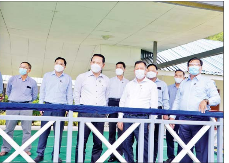
ပြည်ထောင်စုဝန်ကြီး ဦးမောင်မောင်အုန်း၊ လျှပ်စစ်စွမ်းအားဝန်ကြီးဌာန ပြည်ထောင်စုဝန်ကြီး ဦးသောင်းဟန်၊ မန္တလေးတိုင်းဒေသကြီးဝန်ကြီးချုပ် ဦးမောင်ကိုနှင့် မန္တလေးစက်မှုဇုန်မှလုပ်ငန်းရှင်များ ရဲရွာရေအားလျှပ်စစ်ဓာတ်အားပေးစက်ရုံတွင် ကြည့်ရှုလေ့လာစဉ်။

လျှပ်စစ်ဓာတ်အားရရှိရေး ရေးဦးစွာ ပြည်ထောင်စုဝန်ကြီး များ၊ မန္တလေးတိုင်းဒေသကြီး ဝန်ကြီးချုပ်နှင့် မန္တလေးစက်မှုဇုန် မှ လုပ်ငန်းရှင်များသည် နံနက်ပိုင်း တွင် တောင်တော်ကွင်း နေရောင် ခြည်စွမ်းအင်သုံး ဓာတ်အား ထုတ်လုပ်ရေးစက်ရုံသို့ ရောက်ရှိ ကြရာ ရှင်းလင်းဆောင်၌ လျှပ်စစ် စွမ်းအားဝန်ကြီးဌာန ပြည်ထောင်စု ဝန်ကြီးက နိုင်ငံတော်ဝန်ကြီးချုပ် အနေဖြင့် နိုင်ငံစီးပွားဖွံ့ဖြိုး တိုးတက်စေရန်အတွက် အသေး စား၊ အငယ်စားနှင့် အလတ်စား စက်မှုလုပ်ငန်း (MSME) များကို အားပေး ဆောင်ရွက်လျက်ရှိရာ စက်မှုဇုန်များအတွက် အရေးကြီး သောလျှပ်စစ်ဓာတ်အားရရှိရေးကို မိမိတို့ဝန်ကြီးဌာန အနေဖြင့် ကြိုးပမ်း ထုတ်လုပ်ပေးလျက်ရှိ ကြောင်း၊ စက်မှုဇုန်များ လိုအပ် ချက်အတိုင်း လျှပ်စစ်ဓာတ်အား အပြည့်အဝရရှိရန်မှာ ကန့်သတ် ချက်များ ရှိနိုင်သဖြင့် ပုဂ္ဂလိက ပိုင်းမှ လျှပ်စစ်ဓာတ်အား ထုတ်လုပ်မှုနှင့် နေရောင်ခြည် စွမ်းအင်သုံး ဓာတ်အားထုတ်လုပ် မှုတို့ကို လေ့လာသိရှိပြီး ပါဝင် ဆောင်ရွက် နိုင်ရန်အတွက် မန္တလေးတိုင်းဒေသကြီး ဝန်ကြီး ချုပ်နှင့်ညှိနှိုင်း၍ ယခုလိုစီစဉ် ဆောင်ရွက်ခြင်း ဖြစ်ကြောင်း၊ စက်မှုဇုန်တွင် စုပေါင်း၍ဖြစ်စေ၊ တစ်ဦးချင်းဖြစ်စေ အခြေအနေ အပေါ်မူတည်ပြီး နေရောင်ခြည်