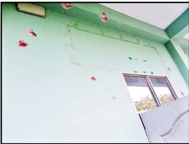
မြင်းခြံမြို့နယ် မြောက်ကျွန်းကျေးရွာရှိ အခြေခံပညာအထက်တန်းကျောင်းခွဲအား အကြမ်းဖက်သမားများ၏ ပစ်ခတ်မှုကြောင့် ပျက်စီးခဲ့မှုကိုတွေ့ရစဉ်။