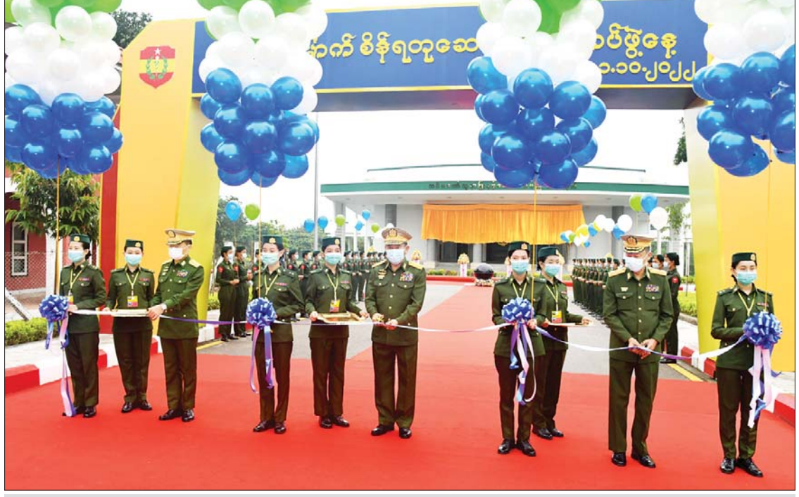
ကာကွယ်ရေးဦးစီးချုပ်ရုံး(ကြည်း)မှ ဒုတိယဗိုလ်ချုပ်ကြီး သက်ပုံ၊ စစ်ထောက်ချုပ် ဒုတိယဗိုလ်ချုပ်ကြီး ကျော်စွာလင်းနှင့် တိုင်းမှူးဗိုလ်ချုပ် ညွှန်ကြားရေးမှူးရုံး (၇၅)နှစ်မြောက် စိန်ရတုဆေးဝန်ထမ်းတပ်ဖွဲ့နေ့အခမ်းအနားကို ဖဲကြိုးဖြတ်ဖွင့်လှစ်ပေးကြစဉ်။

ဝမ်းမြောက်ဖွယ်ရာ မြင်တွေ့ရမည်ဖြစ်ပါကြောင်း၊ ထို့အပြင် မကြာသေးမီက မြန်မာ့တပ်မတော် ဆေးဝန်ထမ်းတပ်ဖွဲ့၏ သမိုင်းမှတ်တိုင်တစ်ခုအနေဖြင့် ပထမဆုံးအကြိမ် အသည်းအစားထိုးကုသမှုကို အောင်မြင်စွာ ဆောင်ရွက်နိုင်ခဲ့သည်ကို တွေ့ရှိရသည့်အတွက် လွန်စွာဂုဏ်ယူဝမ်းမြောက်ကြောင်း မှတ်တမ်းတင်ပြောကြားလိုပါကြောင်း။ မရှိသလောက်ဖြစ်နေ ထိုကဲ့သို့ ဆောင်ရွက်ပေးနိုင်ခဲ့သည့်အတွက် ယခုအခါတွင် ကျန်းမာရေးစောင့်ရှောက်မှုနှင့် ပတ်သက်ပါက တပ်မတော်အနေဖြင့် လက်လှမ်းမမီသည့် ဒေသ၊ လက်လှမ်းမမီသည့် ကုသမှုအမျိုးအစားများ မရှိသလောက်ဖြစ်နေပြီဟု ဆိုရမည်ဖြစ်ပါကြောင်း၊ ထိုကဲ့သို့ ဆောင်ရွက်နိုင်ခြင်းသည် ဆေးဝန်ထမ်းတပ်ဖွဲ့ဝင်များ၏ ကြိုးပမ်းအားထုတ်မှု၊ လက်ဆင့်ကမ်း ပညာအမွေများပေးခဲ့ကြသည့် ဆေးပညာရှင်ကြီးများ၏ ကျေးဇူးများကြောင့်ပင်ဖြစ်ပါကြောင်း၊ ထို့အတွက် ဂုဏ်ယူဝမ်းမြောက် ကျေးဇူးတင်ရှိပါကြောင်း၊ ဆေးဝန်ထမ်းတပ်ဖွဲ့အနေဖြင့် ထိုကဲ့သို့ ကျန်းမာရေးစောင့်ရှောက်မှုပေးနိုင်ရေးအတွက် လိုအပ်သည့် ဆရာဝန်၊ သူနာပြုများ မွေးထုတ်နိုင်ရေးကိုလည်း လွတ်လပ်ရေးရပြီးစကာလကပင် ကြိုးပမ်းခဲ့သည်ကို တွေ့ရပါကြောင်း၊ အထင်ရှားဆုံးမှာ တပ်မတော်တစ်ရပ်လုံး၌ရှိသည့် ဆေးဝန်ထမ်းတပ်ဖွဲ့ဝင်များ၏ လေ့ကျင့်သင်ကြားမှုများကို ဆောင်ရွက်နိုင်ရေးအတွက် ၁၉၅၂ ခုနှစ်တွင် ဆေးဘက်ဌာနချုပ်နှင့် လေ့ကျင့်ရေးတပ်ကို ဖွင့်လှစ်ပေးနိုင်ခဲ့ပါကြောင်း၊ ထိုတပ်သည် နောင်အခါတွင် ဗဟိုဆေးတပ်အမည်ဖြင့် တပ်မတော်ဆေးဝန်ထမ်းတပ်ဖွဲ့ဝင်များ၏ လေ့ကျင့်ရေးကို နှစ်ပေါင်းများစွာ ဆောင်ရွက်ပေးခဲ့ပြီး ၂၀၁၅ ခုနှစ်၌ တပ်မတော်ဆေးဘက်ဆိုင်ရာ ပညာသင်ကျောင်းအနေဖြင့် ပြောင်းလဲဖွဲ့စည်းပေးခဲ့ပြီးဖြစ်သည်ကို တွေ့ရမည်ဖြစ်ပါကြောင်း။ စာမျက်နှာ ၄ သို့ ☆