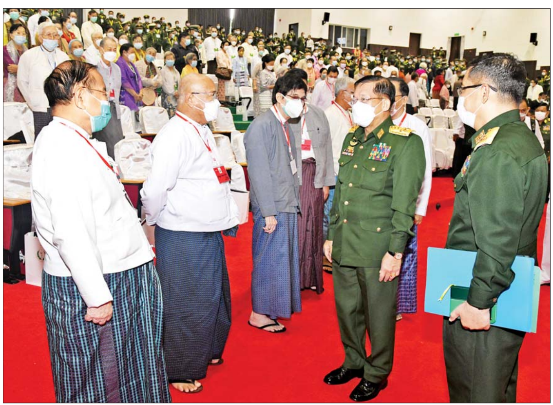
နိုင်ငံတော်စီမံအုပ်ချုပ်ရေးကောင်စီဥက္ကဋ္ဌ တပ်မတော်ကာကွယ်ရေးဦးစီးချုပ် ဗိုလ်ချုပ်မှူးကြီးမင်းအောင်လှိုင် (၇၅) နှစ်မြောက် စိန်ရတုဆေးတပ်ဖွဲ့ နေ့ အခမ်းအနားသို့ တက်ရောက်လာကြသည့် အငြိမ်းစားဆေးဝန်ထမ်းတပ်ဖွဲ့ဝင် အရာရှိကြီးများအား ရင်းရင်းနှီးနှီး နှုတ်ဆက်စကား ပြောကြားစဉ်။

ရေးစောင့်ရှောက်မှုပေးသည့် အခါတွင် သာမန်အချိန်များ၌သာမက သဘာဝဘေးအန္တရာယ်ကျရောက်သည့်အချိန်များ၌လည်း ရှေ့တန်းမှပါဝင်ခဲ့ကြသည်ကို တွေ့ရမည်ဖြစ်ပါကြောင်း၊ အထူးသဖြင့် နာဂစ်နှင့် ဂီရီဆိုင်ကလုန်းမုန်တိုင်း တိုက်ခတ်ပြီးသည့်နောက် ပြည်သူများ၏ ပြန်လည်ထူထောင်ရေးလုပ်ငန်းစဉ်များ၊ တာလေလျင်နှင့် မိုးသည်းထန်မှုကြောင့် ရေဘေးကြုံတွေ့ရသည့် ဒေသခံများကို လည်း ဆေးဝန်ထမ်းတပ်ဖွဲ့ဝင်များသည် “စေတနာ အကြင်နာ ဘေးကင်းကွာ” ဟူသည့် ဆောင်ပုဒ်နှင့်အညီ ကျန်းမာရေး