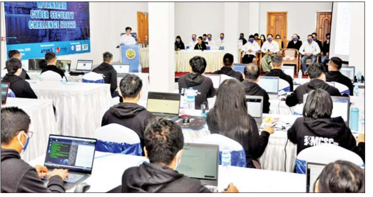
ငါးသိန်း၊ ဒုတိယဆု ငွေကျပ် ၁၀ သိန်းနှင့် ခွဲကြောင်း သိရသည်။ တတိယဆု ငွေကျပ်ခုနစ်သိန်း ချီးမြှင့် သတင်းစဉ်

ဝင်ရောက်ယှဉ်ပြိုင် အဆိုပါပြိုင်ပွဲကို အသင်းကိုးသင်းမှ ပြိုင်ပွဲဝင် ၂၇ ဦး ဝင်ရောက်ယှဉ်ပြိုင်ခဲ့ပြီး နံနက် ၁၀ နာရီမှ ညနေ ၄ နာရီခွဲအထိ ကျင်းပသည်။ ပြိုင်ပွဲတွင် ပထမဆုကို S1gma Be@0n Teamကလည်းကောင်း၊ ဒုတိယဆုကို Team r00Tကလည်းကောင်း၊ တတိယဆုကို NYTe@M ကလည်း ကောင်းရရှိကာ ပထမဆု ငွေကျပ် ၁၅ သိန်း နှင့် ထပ်ဆောင်းချီးမြှင့် ဆုငွေကျပ်