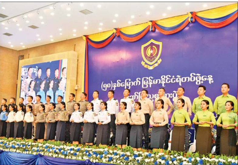
နိုင်ငံတော်စီမံအုပ်ချုပ်ရေးကောင်စီ ဒုတိယဥက္ကဋ္ဌ ဒုတိယဝန်ကြီးချုပ် ဒုတိယဗိုလ်ချုပ်မှူးကြီးစိုးဝင်း အခမ်းအနားတက်ရောက်လာကြသူများနှင့်အတူ (၅၈)နှစ်မြောက် မြန်မာနိုင်ငံ ရဲတပ်ဖွဲ့နေ့အထိမ်းအမှတ် ဂုဏ်ပြုညစာစားပွဲအခမ်းအနားတွင် မြန်မာနိုင်ငံရဲတပ်ဖွဲ့ ရဲတီးဝိုင်းနှင့် ဖျော်ဖြေရေးဌာနခွဲမှ တပ်ဖွဲ့ဝင်များက တေးသံသာများဖြင့် သီဆို ဖျော်ဖြေမှုအား ကြည့်ရှုအားပေးကြစဉ်။

ညွှန်ကြားမှုဌာနဆိုင်ရာ အကြီးအကဲများ၊ အမျိုးသမီးရေးရာ နှင့် ဆက်စပ်အဖွဲ့အစည်းများ၊ မြန်မာနိုင်ငံရဲတပ်ဖွဲ့ ရဲချုပ်နှင့် ရဲတပ်ဖွဲ့ဝင်များ၊ အငြိမ်းစားရဲအရာ ရှိကြီးများ၊ အနုပညာရှင်များ၊ သတင်းမီဒီယာများနှင့် တာဝန်ရှိ သူများနှင့်အတူ ဂုဏ်ပြုညစာကို