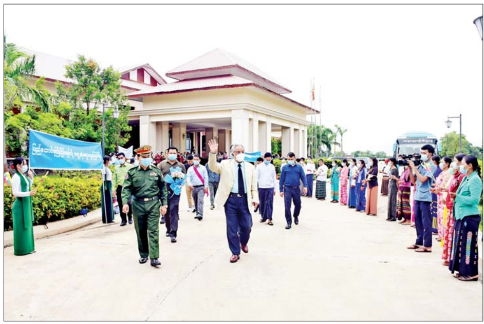
“ဝ”ပြည်သွေးစည်းညီညွတ်ရေးပါတီ (UWSP) ဒုတိယဥက္ကဋ္ဌ ဦးလော့ယာကု ဦးဆောင်သည့် ငြိမ်းချမ်းရေးကိုယ်စားလှယ်အဖွဲ့ နေပြည်တော်မှ ပြန်လည်ထွက်ခွာစဉ်။