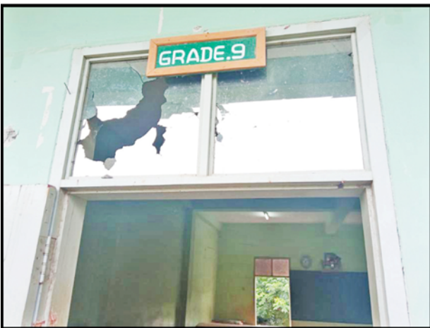
မြင်းခြံမြို့နယ် မြောက်ကျွန်းကျေးရွာရှိ အခြေခံပညာအထက်တန်းကျောင်းခွဲအား အကြမ်းဖက်သမားများ၏ ပစ်ခတ်မှုကြောင့် ပျက်စီးခဲ့မှုကိုတွေ့ရစဉ်။