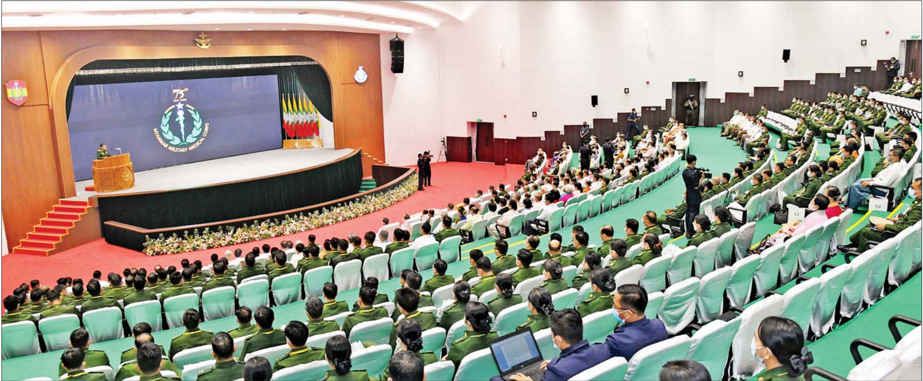
နိုင်ငံတော်စီမံအုပ်ချုပ်ရေးကောင်စီဥက္ကဋ္ဌ တပ်မတော်ကာကွယ်ရေးဦးစီးချုပ် ဗိုလ်ချုပ်မှူးကြီးမင်းအောင်လှိုင် (၇၅)နှစ်မြောက် စိန်ရတုဆေးတပ်ဖွဲ့နေ့ အခမ်းအနားတွင် ဂုဏ်ပြုအမှာစကားပြောကြားစဉ်။