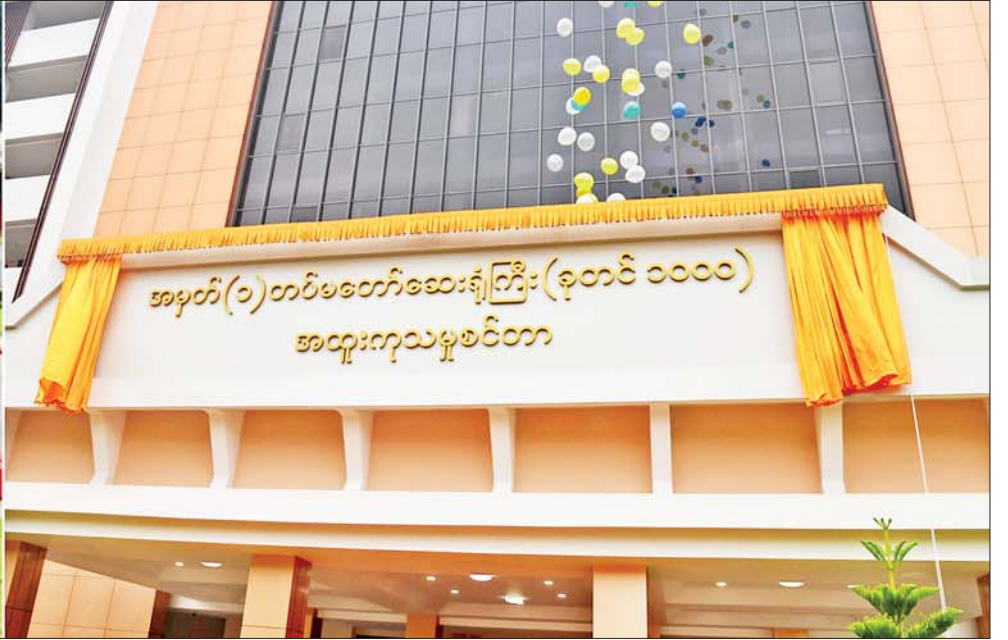
နိုင်ငံတော်စီမံအုပ်ချုပ်ရေးကောင်စီဥက္ကဋ္ဌ တပ်မတော်ကာကွယ်ရေးဦးစီးချုပ် ဗိုလ်ချုပ်မှူးကြီးမင်းအောင်လှိုင် (၇၅)နှစ်မြောက် စိန်ရတုဆေးတပ်ဖွဲ့ နေ့ အထိမ်းအမှတ်အဖြစ် ဖွင့်လှစ်သည့် အမှတ်(၁) တပ်မတော် ဆေးရုံကြီး(ခုတင်-၁၀၀၀)၊ အဆင့်မြင့် ရှစ်ထပ်ဆေးရုံအဆောက်အအုံအသစ် အထူးကုသမှုစင်တာ ဆိုင်းဘုတ်ကို စက်ခလုတ်နှိပ်ဖွင့်လှစ်ပေးစဉ်။