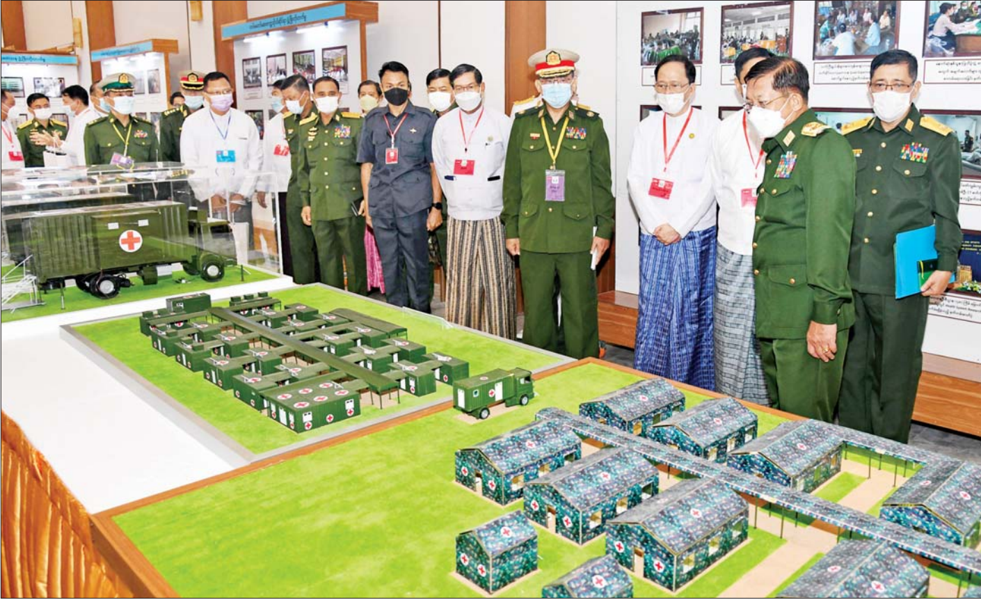
နိုင်ငံတော်စီမံအုပ်ချုပ်ရေးကောင်စီဥက္ကဋ္ဌ တပ်မတော်ကာကွယ်ရေးဦးစီးချုပ် ဗိုလ်ချုပ်မှူးကြီးမင်းအောင်လှိုင်နှင့် တက်ရောက်လာကြသူများက (၇၅)နှစ်မြောက် စိန်ရတုဆေးတပ်ဖွဲ့နေ့ အထိမ်းအမှတ်ပြခန်းအတွင်း ကြည့်ရှုလေ့လာစဉ်။

☆ ဆေးဝန်ထမ်း တပ်ဖွဲ့ဝင်များသည် လွတ်လပ်ရေးကြိုးပမ်းမှုကာလများတွင် စွမ်းစွမ်းတမ်းတမ်း ဆောင်ရွက်ခဲ့ကြသည့် နည်းတူ လွတ်လပ်ရေးရပြီး ကာလများတွင်လည်း တိုင်းပြည်တာဝန်ကို ကျရာကဏ္ဍမှ ထမ်းဆောင်ခဲ့ကြသည်ကို သမိုင်းတစ်လျှောက် သာဓကများစွာ တွေ့မြင်ကြရမည် ☆ တပ်မတော်၏ စစ်ဆင်ရေးများဖြစ်သည့် အင်းစိန်တိုက်ပွဲ၊ တရုတ်ဖြူကျူးကျော်မှုမှစ၍ စစ်ဆင်ရေးများအထိ တိုက်ပွဲပေါင်း၊ စစ်ဆင်ရေးပေါင်းများစွာ၌လည်း ဆေးဝန်ထမ်းတပ်ဖွဲ့ဝင်များသည် စွမ်းစွမ်းတမ်းတမ်းကျေပွန်စွာ တာဝန်ထမ်းဆောင်ခဲ့ကြသည်ကို မြင်တွေ့ခဲ့ကြရမည်ဖြစ်