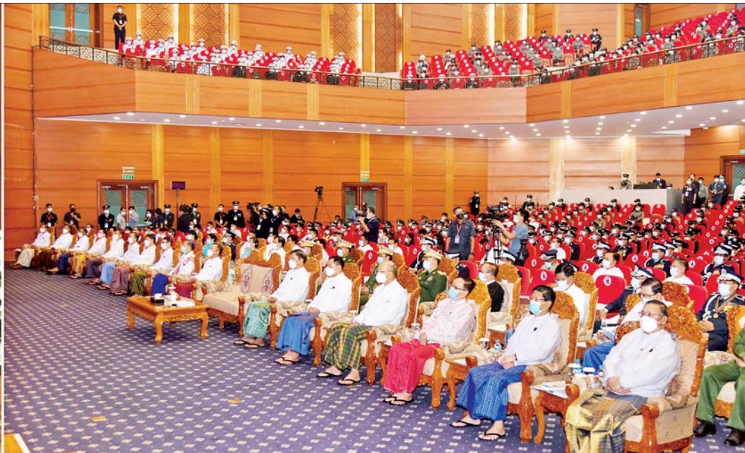
နိုင်ငံတော်စီမံအုပ်ချုပ်ရေးကောင်စီ ဒုတိယဥက္ကဋ္ဌ ဒုတိယဝန်ကြီးချုပ် ဒုတိယဗိုလ်ချုပ်မှူးကြီးစိုးဝင်း (၅၈)နှစ်မြောက် မြန်မာနိုင်ငံရဲတပ်ဖွဲ့နေ့အခမ်းအနားတွင် အမှာစကား ပြောကြားစဉ်။

နေပြည်တော် အောက်တိုဘာ ၁ (၅၈)နှစ်မြောက် မြန်မာနိုင်ငံ ရဲတပ်ဖွဲ့နေ့ အခမ်းအနားကို ယနေ့ နံနက် ၉ နာရီတွင် နေပြည်တော်ရှိ မြန်မာအပြည်ပြည်ဆိုင်ရာကွန်ဗင်းရှင်း ဗဟိုဌာန-၂ (MICC-2)၌ ကျင်းပရာ နိုင်ငံတော်စီမံအုပ်ချုပ်ရေးကောင်စီ ဒုတိယဥက္ကဋ္ဌ ဒုတိယဝန်ကြီးချုပ် ဒုတိယဗိုလ်ချုပ်မှူးကြီးစိုးဝင်း တက်ရောက် အမှာစကားပြောကြားသည်။ တက်ရောက် အခမ်းအနားသို့ နိုင်ငံတော် စီမံအုပ်ချုပ်ရေးကောင်စီဝင်များ၊ နိုင်ငံတော်ဖွဲ့စည်းပုံအခြေခံဥပဒေ ဆိုင်ရာဆိုင်ရာဥက္ကဋ္ဌ၊ ပြည်ထောင်စု ရွေးကောက်ပွဲကော်မရှင် ဥက္ကဋ္ဌ၊ ပြည်ထောင်စု ဝန်ကြီးများ၊ ပြည်ထောင်စုအဆင့် ပုဂ္ဂိုလ်များ၊ စာမျက်နှာ ၇ ကော်လံ ၁ သို့ ။