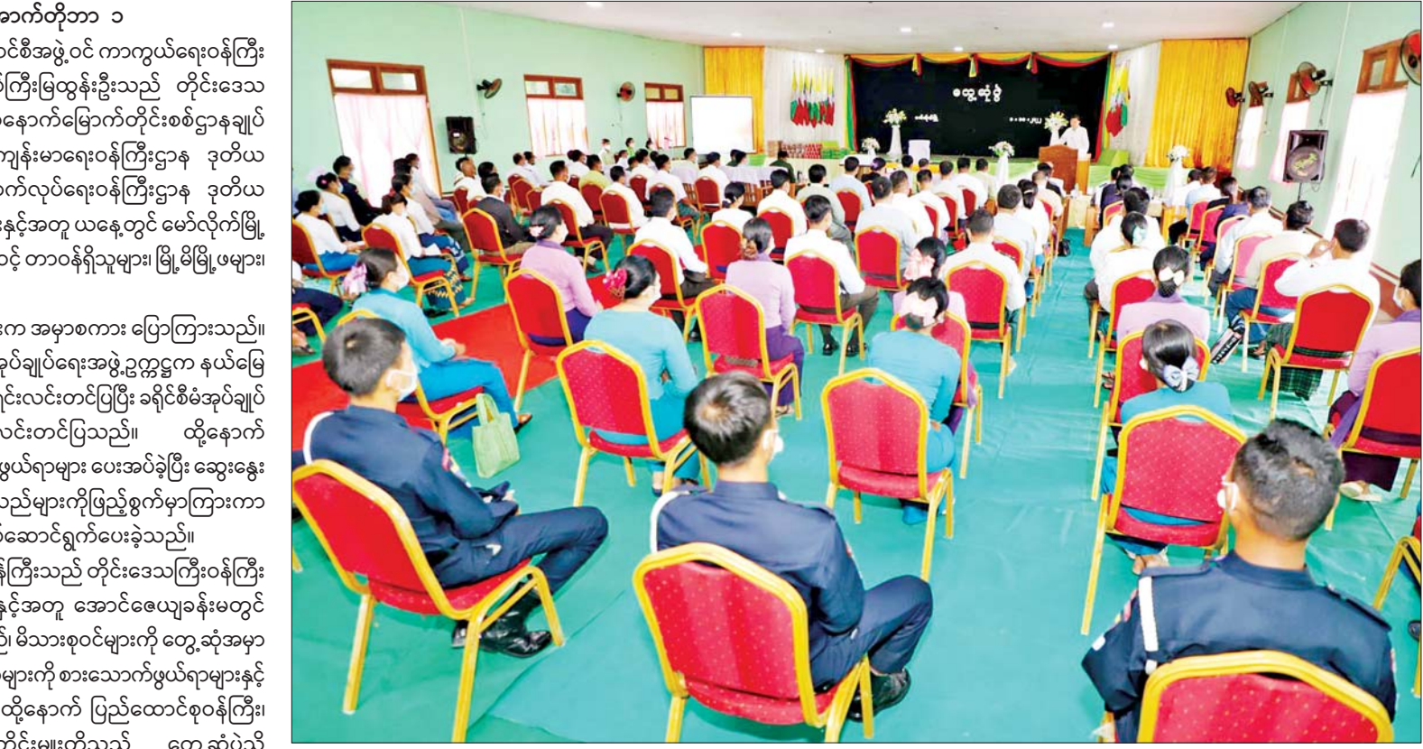
ပြည်ထောင်စုဝန်ကြီး ဗိုလ်ချုပ်ကြီးမြထွန်းဦး မော်လိုက်မြို့၊ မြို့တော်ခန်းမ၌ ခရိုင်နှင့် မြို့နယ်အဆင့် တာဝန်ရှိသူများ၊ မြို့မိမြို့ဖများ၊ ဒေသခံများနှင့် တွေ့ဆုံအမှာစကားပြောကြားစဉ်။

နေပြည်တော် အောက်တိုဘာ ၁ နိုင်ငံတော်စီမံအုပ်ချုပ်ရေးကောင်စီအဖွဲ့ဝင် ကာကွယ်ရေးဝန်ကြီး ဌာန ပြည်ထောင်စုဝန်ကြီး ဗိုလ်ချုပ်ကြီးမြထွန်းဦးသည် တိုင်းဒေသ ကြီးဝန်ကြီးချုပ် ဦးမြတ်ကျော်၊ အနောက်မြောက်တိုင်းစစ်ဌာနချုပ် တိုင်းမှူး ဗိုလ်မှူးချုပ်သန်းထိုက်၊ ကျန်းမာရေးဝန်ကြီးဌာန ဒုတိယ ဝန်ကြီး ဒေါက်တာအေးထွန်း၊ ဆောက်လုပ်ရေးဝန်ကြီးဌာန ဒုတိယ ဝန်ကြီး ဦးဝင်းဖေနှင့် တာဝန်ရှိသူများနှင့်အတူ ယနေ့တွင် မော်လိုက်မြို့၊ မြို့တော်ခန်းမ၌ ခရိုင်နှင့် မြို့နယ်အဆင့် တာဝန်ရှိသူများ၊ မြို့မိမြို့ဖများ၊ ဒေသခံများနှင့် တွေ့ဆုံသည်။ ရှေးဦးစွာ ပြည်ထောင်စုဝန်ကြီးက အမှာစကား ပြောကြားသည်။ ယင်းနောက် မော်လိုက်မြို့နယ်စီမံအုပ်ချုပ်ရေးအဖွဲ့ဥက္ကဋ္ဌက နယ်မြေ ဖွံ့ဖြိုးတိုးတက်မှုအခြေအနေများကို ရှင်းလင်းတင်ပြပြီး ခရိုင်စီမံအုပ်ချုပ် ရေးအဖွဲ့ဥက္ကဋ္ဌက ဖြည့်စွက်ရှင်းလင်းတင်ပြသည်။ ထို့နောက် ပြည်ထောင်စုဝန်ကြီးက စားသောက်ဖွယ်ရာများ ပေးအပ်ခဲ့ပြီး ဆွေးနွေး တင်ပြချက်များအပေါ် လိုအပ်သည်များကိုဖြည့်စွက်မှာကြားကာ တာဝန်ရှိသူများနှင့် ညှိနှိုင်းပေါင်းစပ်ဆောင်ရွက်ပေးခဲ့သည်။ ဆက်လက်ပြီး ပြည်ထောင်စုဝန်ကြီးသည် တိုင်းဒေသကြီးဝန်ကြီး ချုပ်၊ တိုင်းမှူးနှင့် တာဝန်ရှိသူများနှင့်အတူ အောင်ဇေယျခန်းမတွင် မော်လိုက်တပ်နယ်မှ အရာရှိ၊ စစ်သည်၊ မိသားစုဝင်များကို တွေ့ဆုံအမှာ စကားပြောကြားပြီး တပ်နယ်မိသားစုများကို စားသောက်ဖွယ်ရာများနှင့် ထောက်ပံ့ငွေများ ပေးအပ်ခဲ့သည်။ ထို့နောက် ပြည်ထောင်စုဝန်ကြီး၊ တိုင်းဒေသကြီးဝန်ကြီးချုပ်နှင့် တိုင်းမှူးတို့သည် တွေ့ဆုံပွဲသို့ တက်ရောက်လာသော အရာရှိ၊ စစ်သည်၊ မိသားစုဝင်များအား ရင်းရင်း နှီးနှီး လိုက်လံနှုတ်ဆက်ခဲ့ကြောင်း သတင်းရရှိသည်။ သတင်းစဉ်