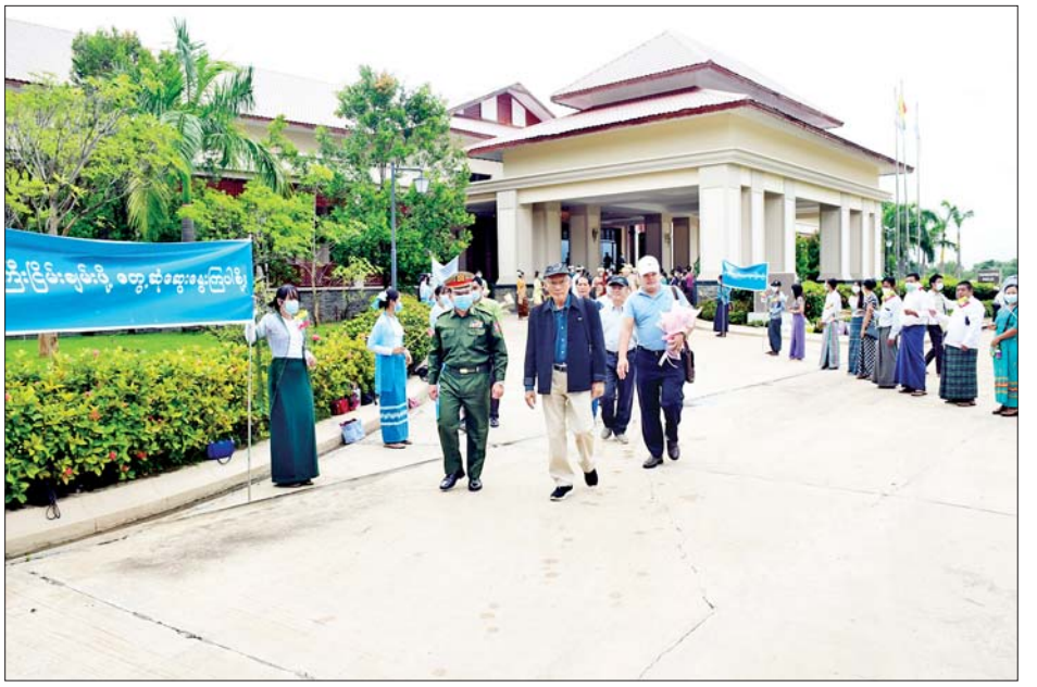
ရှမ်းပြည်တိုးတက်ရေးပါတီ (SSPP) ဒုတိယဥက္ကဋ္ဌ (၂) စစ်ခွန်ဆိုင် ဦးဆောင်သည့် ငြိမ်းချမ်းရေးကိုယ်စားလှယ်အဖွဲ့ နေပြည်တော်မှ ပြန်လည်ထွက်ခွာစဉ်။