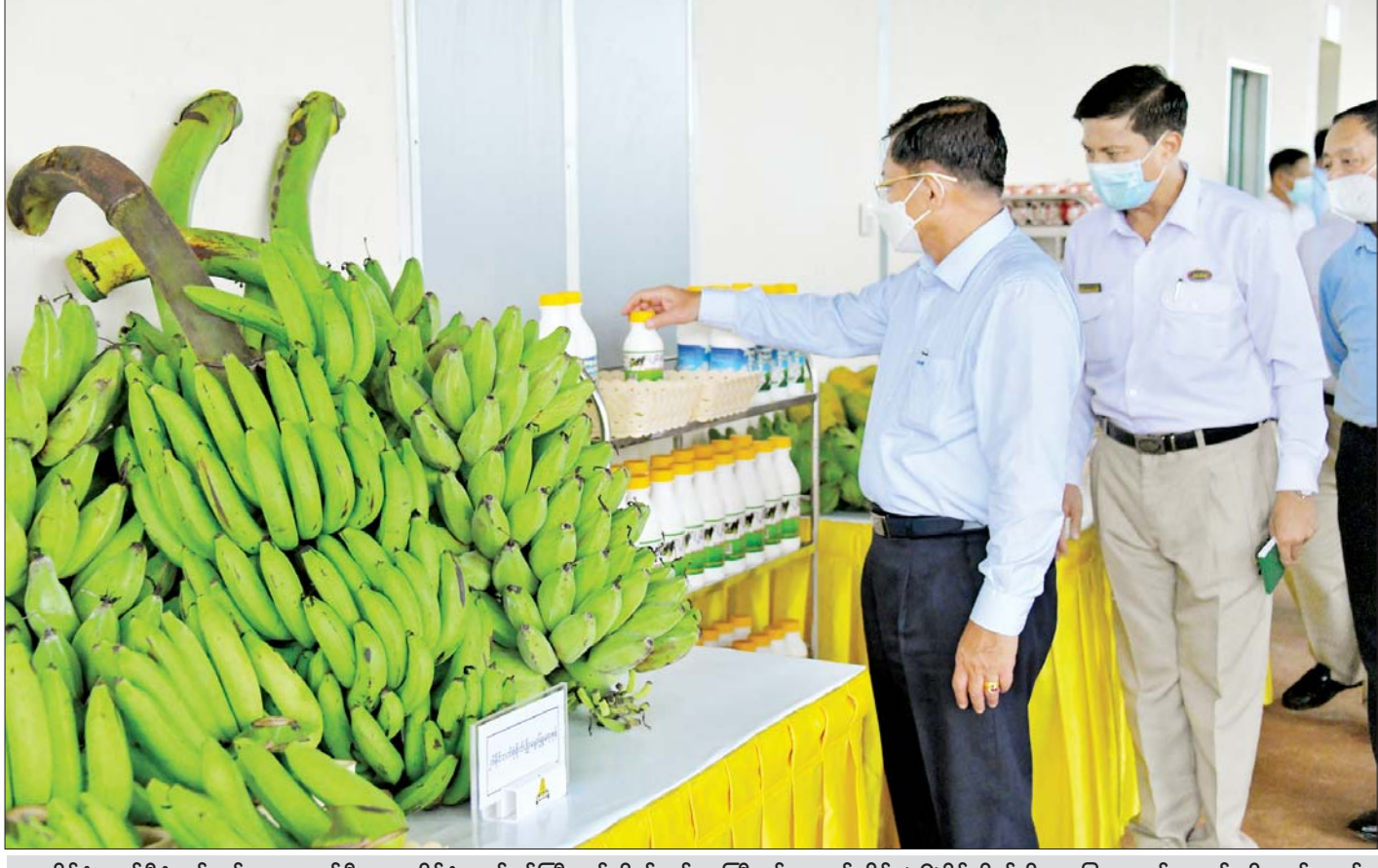
နိုင်ငံတော်စီမံအုပ်ချုပ်ရေးကောင်စီဥက္ကဋ္ဌ နိုင်ငံတော်ဝန်ကြီးချုပ် ဗိုလ်ချုပ်မှူးကြီးမင်းအောင်လှိုင် (၂၆)မိုင် စိုက်ပျိုးမွေးမြူရေးဇုန်အတွင်း နို့ထွက်ပစ္စည်း ထုတ်လုပ်နေမှုများ၊ စိုက်ပျိုးမွေးမြူရေးလုပ်ငန်းများ အကောင်အထည်ဖော် ဆောင်ရွက်ထားရှိမှုအခြေအနေများကို ကြည့်ရှုစစ်ဆေးစဉ်။

ရွက်ခွဲမှု၊ နို့စားနွား၊ အသားတိုးနွား၊ ဒေသနွား မွေးမြူ ထားရှိမှုနှင့် နွားစာမြက်စိုက်ခင်းများ စိုက်ပျိုးထားရှိ မှု၊ ကျောက်စိမ်းဖိကြမ်းငှက်ပျောစိုက်ပျိုးထားရှိမှု၊ အရိပ်ရလေကာပင် မန်ဂျန်ရှား စိုက်ပျိုးထားရှိမှု၊ ရော်ဘာပင်များ စိုက်ပျိုးထားရှိမှုနှင့် အရွယ်ရောက်ပြီး ရော်ဘာပင်များအား ၂၀၂၁-၂၀၂၂ အစေးခြစ်ရာသီတွင် စမ်းသပ်အစေးခြစ်ဆောင်ရွက်ခဲ့သည့် အခြေအနေ များ၊ သီလဝါဘက်စုံစိုက်ပျိုးမွေးမြူရေးဇုန်အတွင်း ကာကီကင်းဘဲ၊ ဒေသဥစားဘဲများ မွေးမြူထားရှိမှု၊ ငါးမျိုးစုံမွေးမြူထားရှိမှု အခြေအနေများ၊ မွေးမြူရေး ဇုန်များ၌ အစာစပ်လုပ်ငန်းနှင့် အစာတောင့်စက်များ ထုတ်လုပ်လျက်ရှိမှု၊ နို့ထွက်ပစ္စည်းများ ထုတ်လုပ် ရောင်းချလျက်ရှိမှု၊ နိုင်ငံတော်စီမံအုပ်ချုပ်ရေး ကောင်စီဥက္ကဋ္ဌ နိုင်ငံတော်ဝန်ကြီးချုပ်၏ လမ်းညွှန် မှာကြားချက်နှင့်အညီ စိုက်ပျိုးမွေးမြူရေးဇုန်များ အလိုက် ထုတ်ကုန်ပစ္စည်းများကို တပ်မတော်သား မိသားစုဝင်များနှင့် ပြည်သူလူထုသို့ သက်သာသော ဈေးနှုန်းများဖြင့် ရောင်းချပေးနိုင်ရေး ဆောင်ရွက်