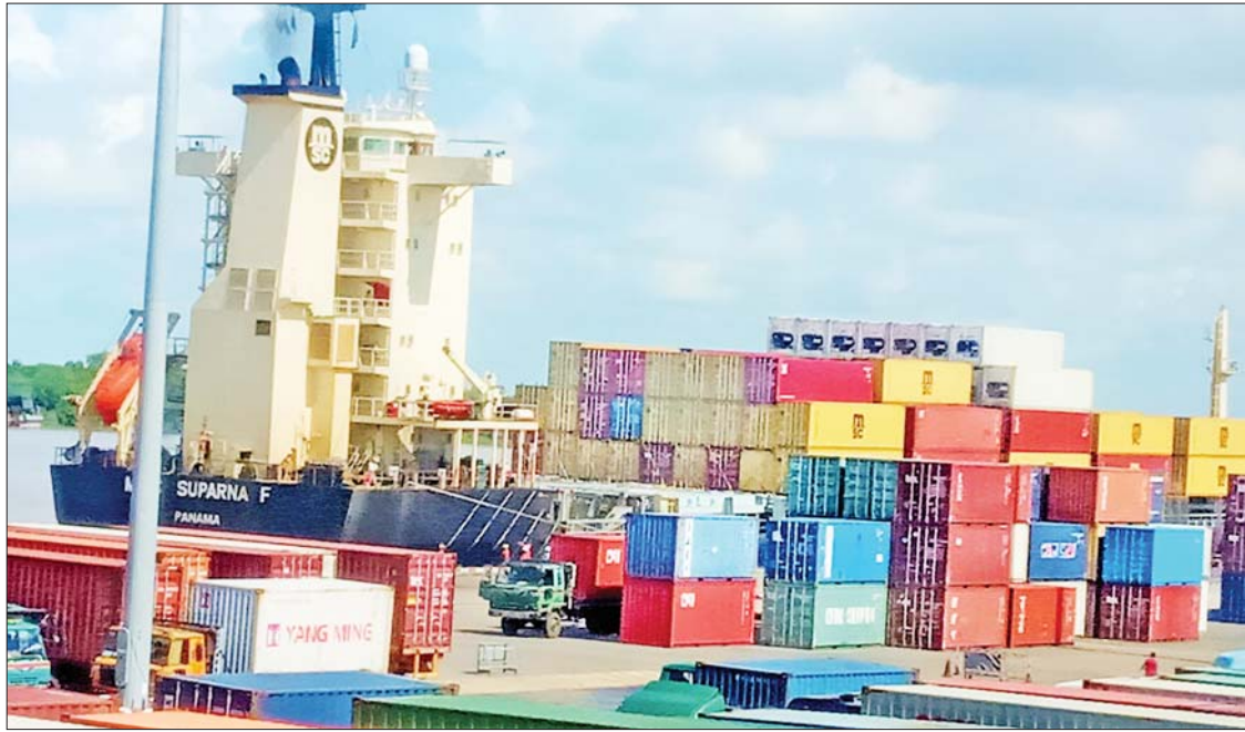
ဖြင့် ဝင်ခွင့်ပြုလျက် အကောက်ခွန်ဦးစီးဌာနမှ စစ်ဆေးပြီးနောက် ကုန်ပစ္စည်းတင်ပို့မှုကို စီမံဆောင်ရွက်လျက်ရှိပြီး Import Cargo ကဏ္ဍတွင် ကုန်သွယ်မှု ချသော ကုန်သွယ်တာဝန်ကို ယာယီစုပုံ၍ Customer များကိုယ်တိုင် စာရက်စာတမ်းဖြင့် အခွန်အခပေးဆောင်ကာ ကုန်သွယ်တာဝန်ကို မြန်ဆန်စွာ ထုတ်ယူနိုင်ရေး ဆောင်ရွက်ပေးလျက်ရှိသည်။ စိုက်ပျိုးရေးနှင့်မွေးမြူရေးထွက်ကုန်များ၊ အထည်အလိပ်ကုန်ချောများ၊ စက်မှုဇုန် ထုတ်ကုန်ချောပစ္စည်းများနှင့်

ရန်ကုန် အောက်တိုဘာ ၁ နိုင်ငံတော်မှ ကုန်သွယ်မှုနှင့်ကုန်စည် စီးဆင်းမှုမှန်ကန်မြန်ဆန်စေရန်၊ ပို့ကုန်များ တိုးမြှင့်တင်ပို့နိုင်ရန်နှင့် ပြည်တွင်း လိုအပ်ချက်အရ သွင်းကုန်များမြန်ဆန်စွာ တင်သွင်းနိုင်ရေးအတွက် မြန်မာ့ဆိပ်ကမ်း အာဏာပိုင်၏ ကြီးကြပ်စီမံပံ့ပိုးမှုဖြင့် ကုန်သွယ်တာဝန်ဆောင်ရွက်ရန် သဘောတူညီချက်ဖြင့် သွင်းကုန်/ပို့ကုန်လုပ်ငန်းရှင်များ ပူးပေါင်းဆောင်ရွက်လျက်ရှိရာ အောက်တိုဘာလတွင် ရန်ကုန်မြို့ဆိပ်ကမ်းငါးခုနှင့် သီလဝါဆိပ်ကမ်းနှစ်ခုတို့၌ ကုန်သွယ်တာဝန်ဆောင်ရွက်ပေးသည့် သဘောတူညီချက်အစဉ် ၅၀ ဆိုက်ကပ်ပြေးဆွဲသွားမည်ဖြစ်ကြောင်း မြန်မာ့ဆိပ်ကမ်းအာဏာပိုင်မှ သိရသည်။