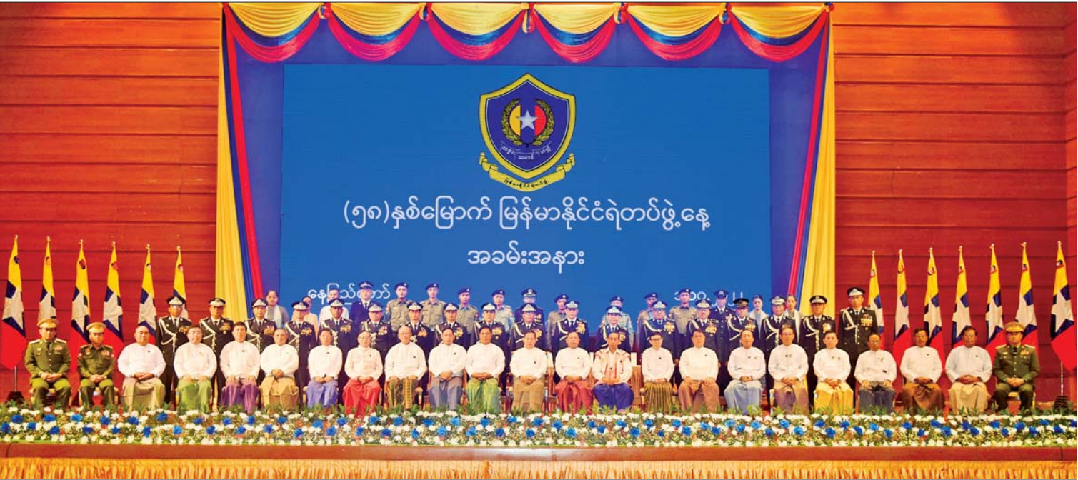
နိုင်ငံတော်စီမံအုပ်ချုပ်ရေးကောင်စီ ဒုတိယဥက္ကဋ္ဌ ဒုတိယဝန်ကြီးချုပ် ဒုတိယဗိုလ်ချုပ်မှူးကြီးစိုးဝင်း (၅၈)နှစ်မြောက် မြန်မာနိုင်ငံရဲတပ်ဖွဲ့နေ့ အခမ်းအနားသို့ တက်ရောက်လာကြသူများနှင့်အတူ စုပေါင်းမှတ်တမ်းတင်ဓာတ်ပုံရိုက်စဉ်။

နိုင်ငံတော်က အသိအမှတ်ပြုချီးမြှင့် သည့်အနေဖြင့် ၂၀၂၂ ခုနှစ် ဇန်နဝါရီ ၄ ရက်(လွတ်လပ်ရေးနေ့)တွင် ရဲဘက်တပ်ဆင် ရရှိသူ ၆၃ ဦး၊ ရဲတပ်ဖွဲ့ဝင်ရရှိသူ ၄၂၆ ဦး၊ ရဲကျော်စွာတပ်ဆင်ရရှိသူ ကိုးဦး၊ ရဲကျော်သူတပ်ဆင်ရရှိသူ သုံးဦး၊ စီမံထူးချွန် တပ်ဆင်(တတိယအဆင့်)ရရှိသူ တစ်ဦး၊ ရဲမှုထမ်းကောင်းတပ်ဆင်ရရှိသူ ၃၄၈ ဦး၊ နိုင်ငံတော်ရဲမှုထမ်းတပ်ဆင်ရရှိသူ ၁၂၂၃ ဦး၊ မြန်မာနိုင်ငံရဲ ပူးတွဲတိုက်ပွဲဝင်တပ်ဆင် ရရှိသူ ၂၄၈၇ ဦး၊ ပြည်သူ့ဝန်ထမ်းကောင်း တပ်ဆင်ရရှိသူ ၄၅ ဦး၊ ပြည်သူ့ဝန်ထမ်း တပ်ဆင်ရရှိသူ ၅၄ ဦး၊ ငြိမ်ဝပ်ပိပြားရေးနှင့်