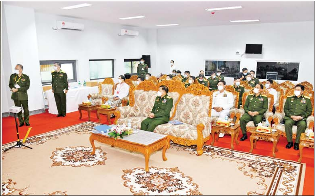
နိုင်ငံတော်စီမံအုပ်ချုပ်ရေးကောင်စီဥက္ကဋ္ဌ တပ်မတော်ကာကွယ်ရေးဦးစီးချုပ် ဗိုလ်ချုပ်မှူးကြီးမင်းအောင်လှိုင်အား အဆင့်မြင့် (၈)ထပ် ဆေးရုံအဆောက်အအုံသစ်၊ အထူးကုသမှုစင်တာ တည်ဆောက်ခြင်းနှင့် ပတ်သက်၍ အမှတ်(၁)တပ်မတော်ဆေးရုံကြီး (ခုတင်-၁၀၀၀)တပ်မမှူးက ရှင်းလင်းတင်ပြစဉ်။