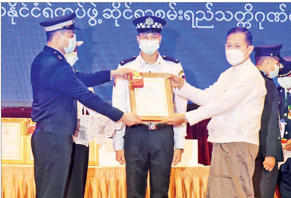
နိုင်ငံတော်စီမံအုပ်ချုပ်ရေးကောင်စီ ဒုတိယဥက္ကဋ္ဌ ဒုတိယဝန်ကြီးချုပ် ဒုတိယဗိုလ်ချုပ်မှူးကြီးစိုးဝင်း စွမ်းရည်သတ္တိဂုဏ်ထူးဆောင်တံဆိပ်ရရှိသူ တပ်ဖွဲ့ဝင်တစ်ဦးအား ဂုဏ်ထူးဆောင်ဆု ပေးအပ်ချီးမြှင့်စဉ်။

လူကုန်ကူးမှုနှင့် ပတ်သက်၍ မြန်မာနိုင်ငံသည် လူကုန်ကူးမှုတိုက်ဖျက်ရေးကို