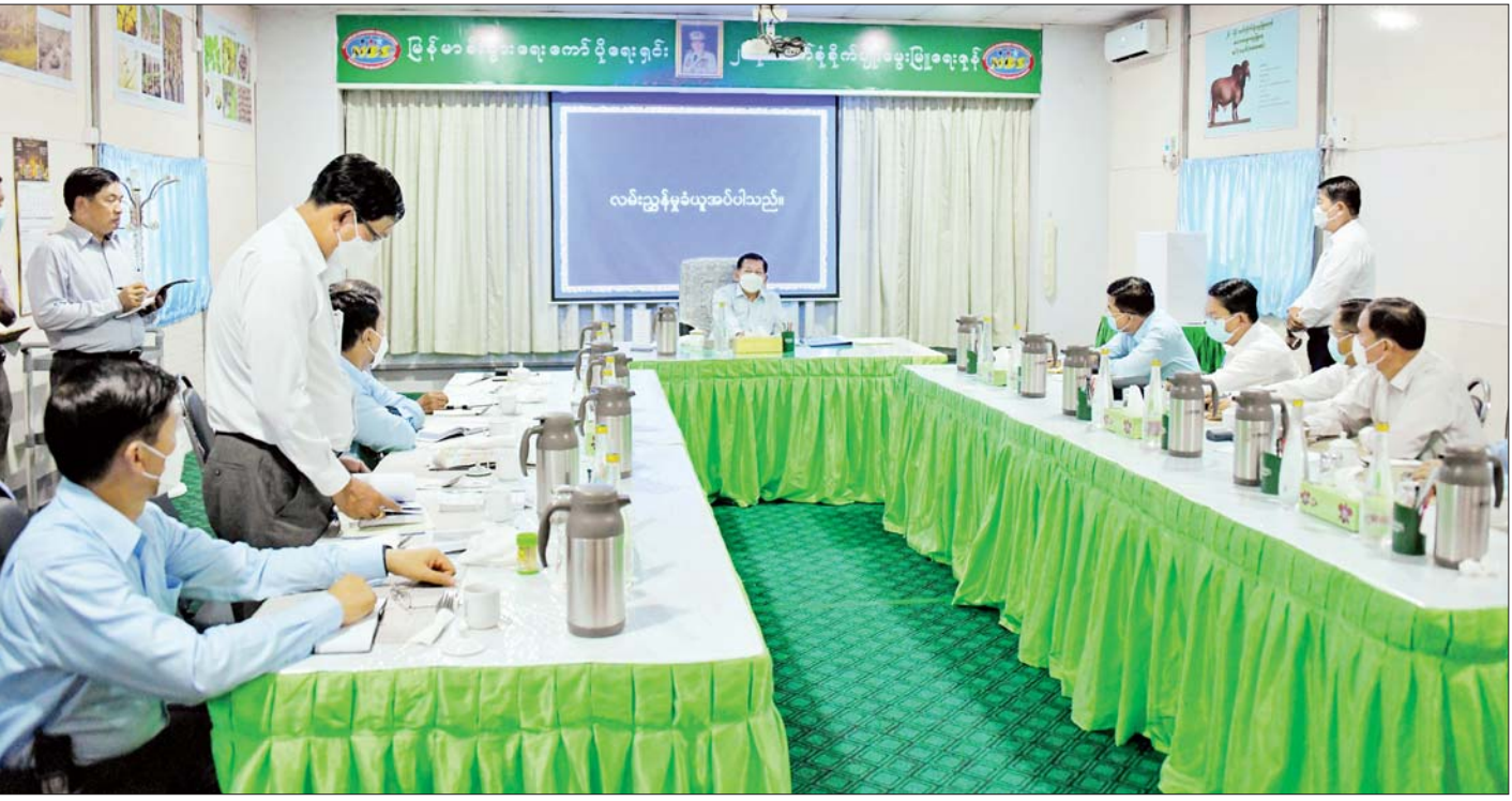
နိုင်ငံတော်စီမံအုပ်ချုပ်ရေးကောင်စီဥက္ကဋ္ဌ နိုင်ငံတော်ဝန်ကြီးချုပ် ဗိုလ်ချုပ်မှူးကြီးမင်းအောင်လှိုင်အား တာဝန်ရှိသူတစ်ဦးက ရှင်းလင်းတင်ပြစဉ်။

ဦးစွာ မြန်မာစီးပွားရေးကော်ပိုရေးရှင်းဥက္ကဋ္ဌ ဒုတိယဗိုလ်ချုပ်ကြီးညိုစော၊ ဒုတိယဦးဆောင် ညွှန်ကြားရေးမှူး ဦးဟန်ဇော်တို့က (၂၆)မိုင် ဘက်စုံ စိုက်ပျိုးမွေးမြူရေးဇုန်နှင့် သီလဝါဘက်စုံစိုက်ပျိုး မွေးမြူရေးဇုန်တို့စတင်အကောင်အထည်ဖော်ဆောင်