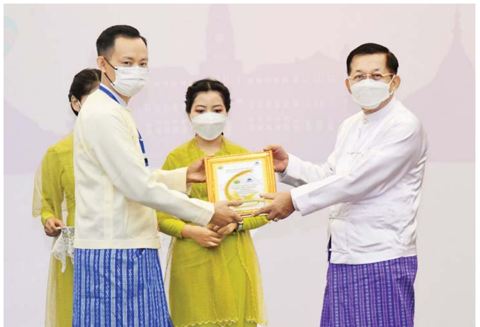
နိုင်ငံတော်စီမံအုပ်ချုပ်ရေးကောင်စီဥက္ကဋ္ဌ နိုင်ငံတော်ဝန်ကြီးချုပ် ဗိုလ်ချုပ်မှူးကြီးမင်းအောင်လှိုင် ကမ္ဘာခရီးသွားလုပ်ငန်းနေ့အထိမ်းအမှတ်ပြိုင်ပွဲတွင် ဆုရသူတစ်ဦးအား ဆုချီးမြှင့်စဉ်။

ပြည့်စုံအောင် ဆောင်ရွက်ပေးကြ ရမည်ဖြစ်ပါကြောင်း။ ခရီးသွားလုပ်ငန်း၏ သဘော သဘာဝအရ လုပ်ငန်းနယ်ပယ် ပေါင်းစုံတွင် အကျိုးဖြစ်ထွန်းစေပါ ကြောင်း၊ မြို့ပြနှင့် ကျေးလက် ဒေသများတွင်ရှိသည့် အမျိုးသမီး များ၊ လူငယ်များနှင့်ကျေးလက်နေ ပြည်သူများကို အလုပ်အကိုင် အခွင့်အလမ်းများ ရရှိစေနိုင်သည့် အပြင် မိမိတို့တိုင်းရင်းသားလူမျိုး များ၏ ရိုးရာဓလေ့များ၊ ယဉ်ကျေး မှုအမွေအနှစ်များ၊ သဘာဝအရင်း အမြစ်များနှင့် အလှအပများကို ဖွင့်လှစ်ပြသနိုင်သည့် အခွင့်အလမ်း များလည်း ရရှိစေမည်ဖြစ်ပါ ကြောင်း၊ ထို့ကြောင့်မြန်မာနိုင်ငံ၏ ခရီးသွားလုပ်ငန်းကဏ္ဍကို ပိုမို ကောင်းမွန်စေရေး စီမံခန့်ခွဲပေး နိုင်ရန်အတွက် တာဝန်သိပြီး ရေရှည် ဖွံ့ဖြိုးတိုးတက်ရေးကို ဦးတည် ဆောင်ရွက်ပေးနိုင်ရန် အတွက် အစိုးရနှင့် ပုဂ္ဂလိကကဏ္ဍ မှ တာဝန်ရှိသူများ အတူတကွ ပူးပေါင်းလုပ်ဆောင်ကြရမည်ဖြစ် ပါကြောင်း။ စာမျက်နှာ ၇ သို့ ၀