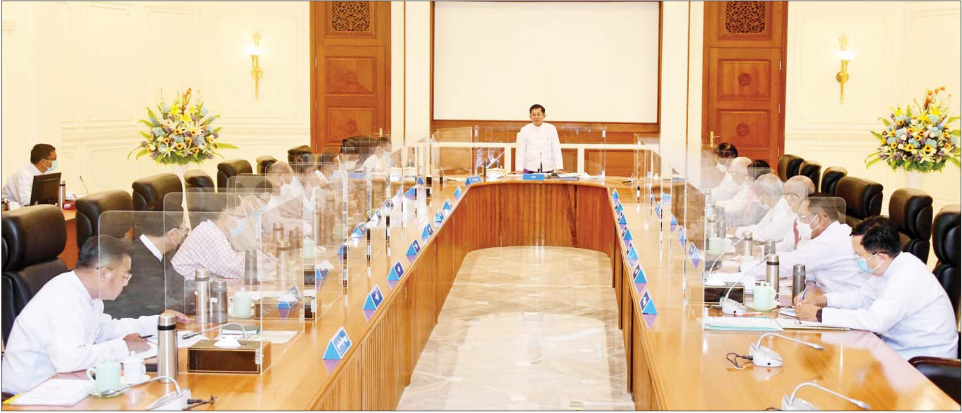
နိုင်ငံတော်စီမံအုပ်ချုပ်ရေးကောင်စီဥက္ကဋ္ဌ နိုင်ငံတော်ဝန်ကြီးချုပ် ဗိုလ်ချုပ်မှူးကြီးမင်းအောင်လှိုင် နိုင်ငံတော်စီမံအုပ်ချုပ်ရေးကောင်စီ အစည်းအဝေးတွင် အမှာစကားပြောကြားစဉ်။

နေပြည်တော် စက်တင်ဘာ ၂၇ နိုင်ငံတော်စီမံအုပ်ချုပ်ရေးကောင်စီ အစည်းအဝေး (၈/၂၀၂၂) ကို ယနေ့မနက်လွဲပိုင်းတွင် နေပြည်တော်ရှိ နိုင်ငံတော် စီမံအုပ်ချုပ်ရေးကောင်စီဥက္ကဋ္ဌရုံး အစည်းအဝေးခန်းမ၌ ကျင်းပ ပြုလုပ်ရာ နိုင်ငံတော်စီမံအုပ်ချုပ်ရေးကောင်စီဥက္ကဋ္ဌ နိုင်ငံတော် ဝန်ကြီးချုပ် ဗိုလ်ချုပ်မှူးကြီးမင်းအောင်လှိုင် တက်ရောက် အမှာစကားပြောကြားသည်။ အစည်းအဝေးသို့ နိုင်ငံတော်စီမံအုပ်ချုပ်ရေးကောင်စီ ဒုတိယဥက္ကဋ္ဌ ဒုတိယဝန်ကြီးချုပ် ဒုတိယဗိုလ်ချုပ်မှူးကြီးစိုးဝင်း၊