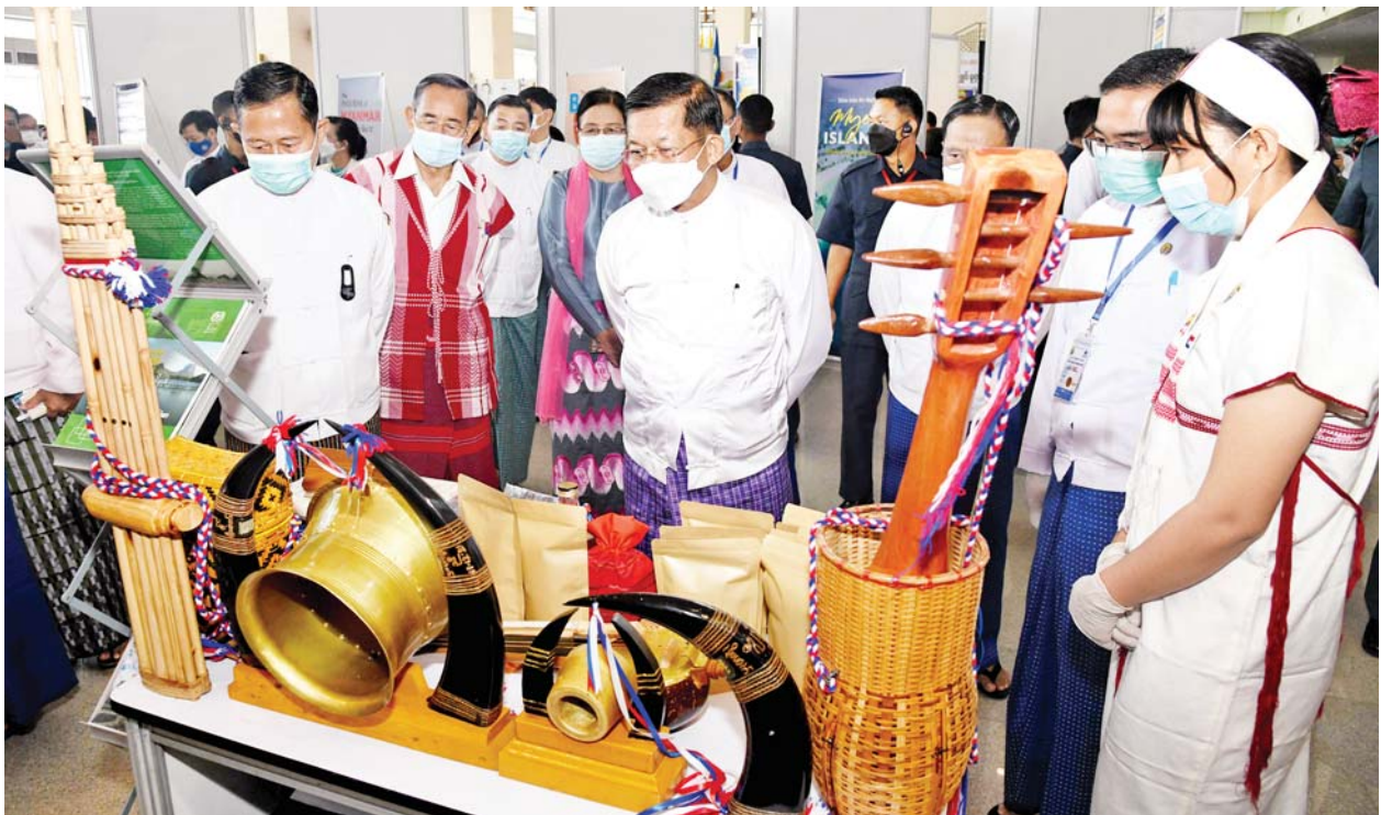
နိုင်ငံတော်စီမံအုပ်ချုပ်ရေးကောင်စီဥက္ကဋ္ဌ နိုင်ငံတော်ဝန်ကြီးချုပ် ဗိုလ်ချုပ်မှူးကြီးမင်းအောင်လှိုင်၊ နိုင်ငံတော်စီမံအုပ်ချုပ်ရေးကောင်စီ ဒုတိယဥက္ကဋ္ဌ ဒုတိယဝန်ကြီးချုပ် ဒုတိယဗိုလ်ချုပ်မှူးကြီးစိုးဝင်းနှင့် အဖွဲ့ဝင်များ ၂၀၂၂ ခုနှစ် ကမ္ဘာခရီးသွားလုပ်ငန်းနေ့အထိမ်းအမှတ် ပြခန်းများတွင် လှည့်လည်ကြည့်ရှုစဉ်။

ပြန်လည်ဖွင့်လှစ် ယခုအခါ ကမ္ဘာလုံးဆိုင်ရာ ကပ်ရောဂါ ဖြစ်ပွားမှုများကို အတိုင်းအတာ တစ်ခုအထိ ထိန်းချုပ်နိုင်ပြီ ဖြစ်သည့်အတွက် မိမိတို့မြန်မာနိုင်ငံ အပါအဝင် နိုင်ငံပေါင်း ၁၀၀ ကျော်သည် ခရီးသွားလုပ်ငန်းများကို ပြန်လည် ဖွင့်လှစ်ခဲ့ပြီးဖြစ်သည်ဟု သိရှိရပါ ကြောင်း၊ ယခုကဲ့သို့ပြန်လည် ဖွင့်လှစ်သည့်နေရာတွင် ခရီးသွား ဧည့်သည်များ၏ ပြည်ဝင်ခွင့် ဆိုင်ရာ လုပ်ထုံးလုပ်နည်းများမှာ နိုင်ငံတစ်ခုနှင့်တစ်ခု ကွဲပြားမှု များရှိနေသေးသည်ကို တွေ့မြင် ကြရမည်ဖြစ်ပါကြောင်း၊ ယခုကဲ့ သို့ ဖွင့်လှစ်ပေးခဲ့သည့်အတွက် ကမ္ဘာအနှံ့ ၂၀၂၂ ခုနှစ် ဇန်နဝါရီလ မှမေလအထိ ကမ္ဘာလှည့်ခရီးသည် သန်း ၂၅၀ ကျော် လှည့်လည် ဝင်ရောက်ခဲ့ပြီး ယမန်နှစ်က