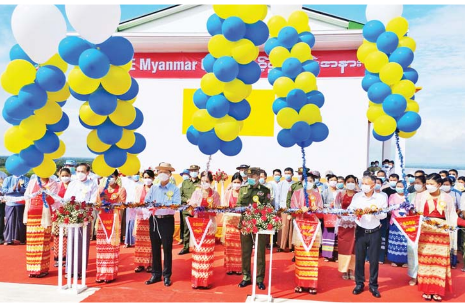
စပါးခွဲသမားက မြေပဲခွဲများကိုလည်း လောင်စာတောင့် MSME ကို ကိုယ့်တိုင်းဒေသကြီးတွင်ရှိသည့် ကုန်ကြမ်း အဖြစ် ရောအသုံးချရကြောင်းကို သိရကြောင်း၊ များဖြင့်လုပ်မှသာ ရေရှည်ဖွံ့ဖြိုးတိုးတက်မည်ဖြစ်

မြောင်းမြ စက်တင်ဘာ ၂၇ စပါးခွဲမှ လောင်စာစွမ်းအင်ဖြင့် လျှပ်စစ် ဓာတ်အားရရှိအောင် ထုတ်နိုင်ပြီဖြစ်၍ တိုင်းဒေသ ကြီးအတွင်းရှိ ကျေးရွာများ လျှပ်စစ်လိုအပ်မှုကို ဖြည့်ဆည်းပေးနိုင်ကြောင်း မြောင်းမြမြို့နယ် ပိုးလောင်းကျေးရွာအုပ်စု ညောင်ချောင်းလေး ကျေးရွာ၌ ယနေ့နံနက် ၉ နာရီက ကျင်းပသည့် SSBE Myanmar Group Co. Ltd ၏ စပါးခွဲလောင်စာတောင့် စက်ရုံဖွင့်ပွဲအခမ်းအနားတွင် ဧရာဝတီတိုင်းဒေသကြီး ဝန်ကြီးချုပ် ဦးတင်မောင်ဝင်းက ပြောကြားသည်။ ဆက်လက်၍ ဧရာဝတီတိုင်းဒေသကြီး ဝန်ကြီး ချုပ်က ဧရာဝတီတိုင်းဒေသကြီးတွင် နွေစပါး၊ မိုးစပါး ဧက ငါးသန်းကျော်ရှိရာ စပါးတင်းသိန်းပေါင်း လေးထောင်ကျော်ထွက်ပြီး စပါးခွဲများတောင်လိုပုံ နေကြောင်း၊ ဘယ်မှမသုံးဘဲ ထားစရာလည်း မရှိ၍ မီးရှို့ရသည်များရှိကြောင်း၊ ယခု စပါးခွဲများကို အကျိုး ရှိအောင် အသုံးချရရှိပြီဖြစ်ကြောင်း၊ တကယ်အသုံးချ နိုင်အောင် အကောင်အထည်ဖော်နိုင်ရန်လိုကြောင်း၊