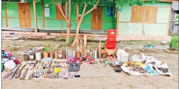
မုံရွာမြို့နယ် စည်သာကျေးရွာ စာသင်ကျောင်းအတွင်းမှ လက်နက်၊ ခဲယမ်းနှင့် ဆက်စပ်ပစ္စည်းများ သိမ်းဆည်းရမိမှု မှတ်တမ်းဓာတ်ပုံများ။