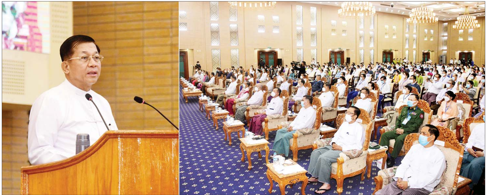
နိုင်ငံတော်စီမံအုပ်ချုပ်ရေးကောင်စီဥက္ကဋ္ဌ နိုင်ငံတော်ဝန်ကြီးချုပ် ဗိုလ်ချုပ်မှူးကြီး မင်းအောင်လှိုင် ၂၀၂၂ ခုနှစ် ကမ္ဘာ့ခရီးသွားလုပ်ငန်းနေ့ အထိမ်းအမှတ်အခမ်းအနားတွင် အမှာစကားပြောကြားစဉ်။

၂၀၂၂ ခုနှစ် ကမ္ဘာ့ခရီးသွားလုပ်ငန်းနေ့အထိမ်းအမှတ်အခမ်းအနားကို ယနေ့နံနက်ပိုင်းတွင် နေပြည်တော်ရှိ မြန်မာအပြည်ပြည်ဆိုင်ရာကွန်ဗင်းရှင်း (ဗဟိုဌာန-၂)၌ ကျင်းပပြုလုပ်ရာ နိုင်ငံတော်စီမံအုပ်ချုပ်ရေးကောင်စီဥက္ကဋ္ဌ နိုင်ငံတော်ဝန်ကြီးချုပ် ဗိုလ်ချုပ်မှူးကြီးမင်းအောင်လှိုင် တက်ရောက်အမှာစကား ပြောကြားသည်။