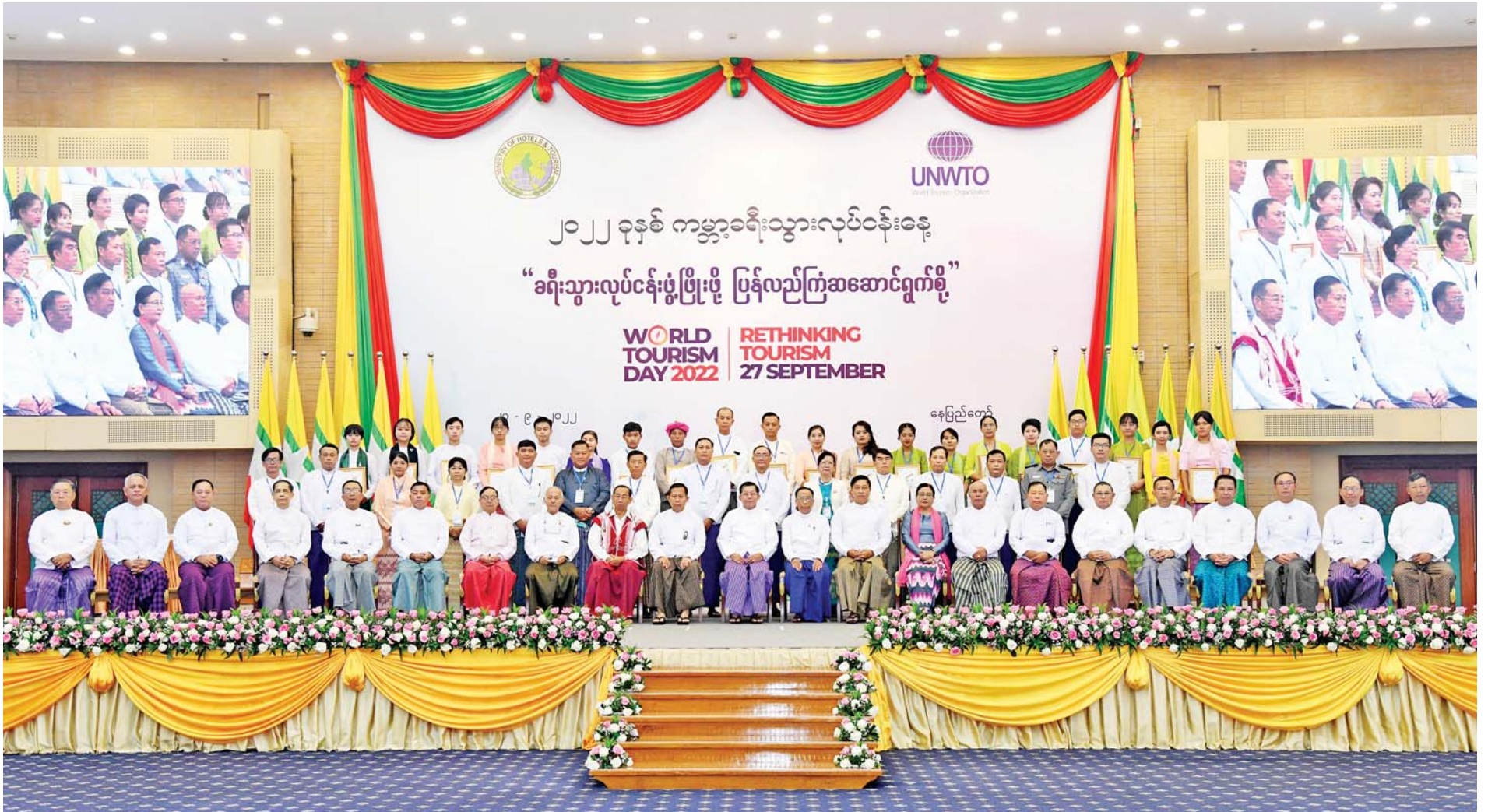
နိုင်ငံတော်စီမံအုပ်ချုပ်ရေးကောင်စီဥက္ကဋ္ဌ နိုင်ငံတော်ဝန်ကြီးချုပ် ဗိုလ်ချုပ်မှူးကြီးမင်းအောင်လှိုင်၊ နိုင်ငံတော်စီမံအုပ်ချုပ်ရေးကောင်စီဒုတိယဥက္ကဋ္ဌ ဒုတိယဝန်ကြီးချုပ် ဒုတိယဗိုလ်ချုပ်မှူးကြီး စိုးဝင်းနှင့် အဖွဲ့ဝင်များ၊ ကမ္ဘာ့ခရီးသွားလုပ်ငန်းနေ့အထိမ်းအမှတ်ပြိုင်ပွဲများတွင် ဆုရသူများနှင့်အတူ မှတ်တမ်းတင်ဓာတ်ပုံ ရိုက်စဉ်။

○ စာမျက်နှာ ၆ မှ အားလုံးသိရှိကြသည့်အတိုင်း မြန်မာနိုင်ငံအနေဖြင့် ခရီးသွားလုပ်ငန်းကို လုပ်ကိုင်ဆောင်ရွက်ရန်အတွက် အရင်းအမြစ်များစွာ ပိုင်ဆိုင်ထားသည့် နိုင်ငံဖြစ်ပါကြောင်း၊ တောင်ပေါ်၊ မြေပြန့်၊ ကမ်းရိုးတန်း၊ မြစ်ဝကျွန်းပေါ်၊ ပင်လယ်ကမ်းခြေများ စသည့်မတူကွဲပြား ထူးခြားလှပသည့် သဘာဝရောင်စုံများ၊ သမိုင်းဝင်ရေးဟောင်းယဉ်ကျေးမှု အမွေအနှစ်များ၊ အရောင်အသွေး စုံလင်သည့် တိုင်းရင်းသားလူမျိုးများ၏ ရိုးရာဓလေ့များနှင့် လူနေမှုဘဝပုံစံများသည် ကမ္ဘာ့လှည့်ခရီးသည်များကို ဆွဲဆောင်နိုင်သည့်အရာများ ဖြစ်ကြပါကြောင်း။ ကဏ္ဍစုံဖွံ့ဖြိုးတိုးတက်ရေး တစ်ချိန်တည်းတွင် ခရီးသွားလုပ်ငန်းအနေဖြင့် တည်းခိုနေထိုင်ရေးနှင့် ဧည့်ဝတ်ကျောပွန်ရေး ကဏ္ဍအပြင် ကျန်းမာရေးကဏ္ဍ၊ သယ်ယူပို့ဆောင်ရေး ကဏ္ဍ၊ စွမ်းအင်ကဏ္ဍ၊ လမ်းတံတားကဏ္ဍ၊ စည်ပင်သာယာလှပရေးကဏ္ဍ၊ မြို့ပြနှင့် ကျေးလက်ဒေသဖွံ့ဖြိုးရေး ကဏ္ဍ၊ အသေးစားအလတ်စား စီးပွားရေးလုပ်ငန်းများနှင့် ရင်းနှီးမြှုပ်နှံမှုကဏ္ဍ စသည့်ကဏ္ဍစုံဖွံ့ဖြိုးတိုးတက်ရေးကို ချိတ်ဆက်ဖန်တီးပေးနိုင်သည့် လုပ်ငန်းတစ်ခုဖြစ်သဖြင့် တန်းတူညီမျှပြီး အားလုံးပါဝင်ဆောင်ရွက်နိုင်ရန် အထောက်အကူပြုသည့် လုပ်ငန်းတစ်ရပ်လည်း ဖြစ်သည်ဟုဆိုနိုင်ပါကြောင်း၊ အဆိုပါလုပ်ငန်းများကို စနစ်တကျ စုပေါင်းဆောင်ရွက်