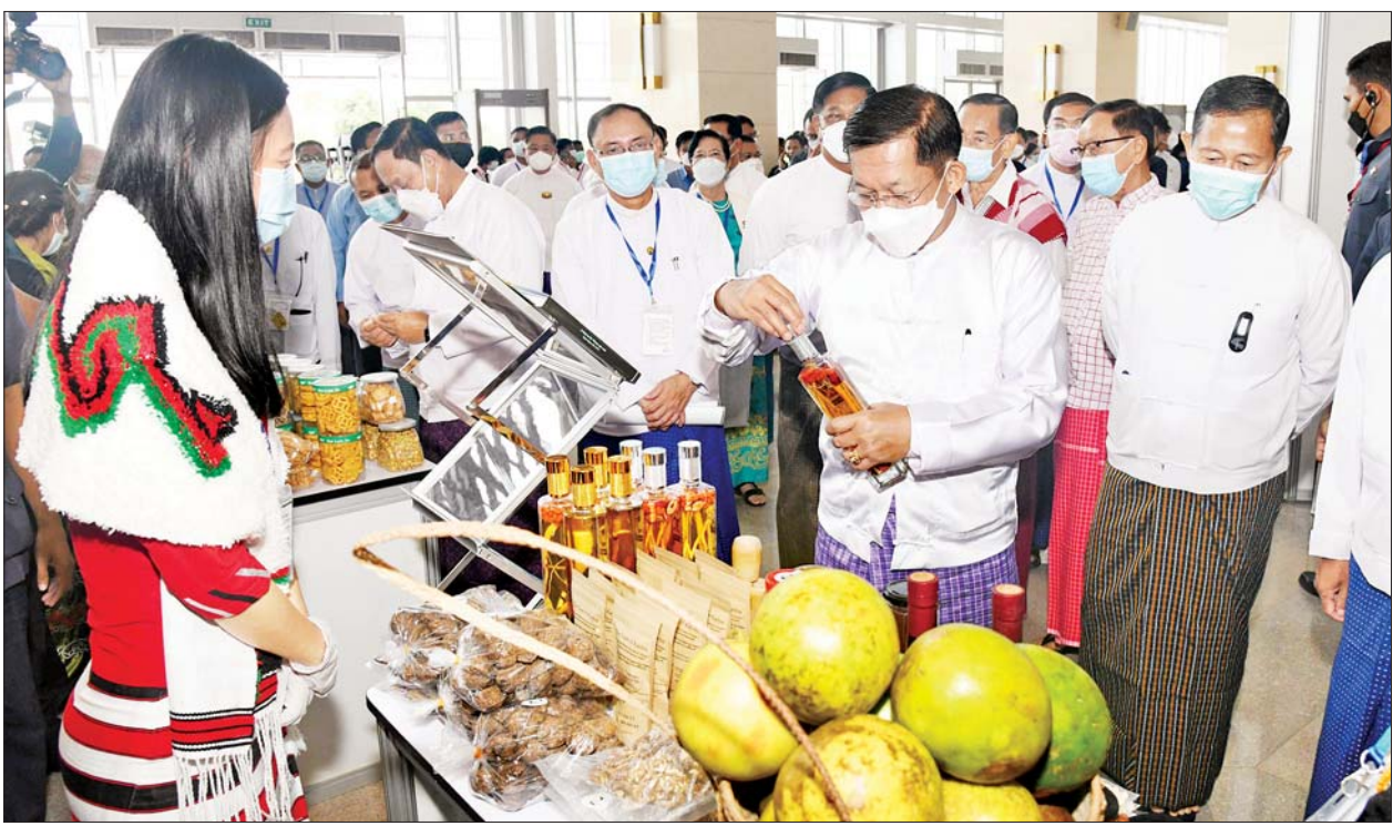
နိုင်ငံတော်စီမံအုပ်ချုပ်ရေးကောင်စီဥက္ကဋ္ဌ နိုင်ငံတော်ဝန်ကြီးချုပ် ဗိုလ်ချုပ်မှူးကြီးမင်းအောင်လှိုင်၊ နိုင်ငံတော်စီမံအုပ်ချုပ်ရေးကောင်စီဒုတိယဥက္ကဋ္ဌ ဒုတိယဝန်ကြီးချုပ် ဒုတိယဗိုလ်ချုပ်မှူးကြီး စိုးဝင်းနှင့် အဖွဲ့ဝင်များ ၂၀၂၂ ခုနှစ် ကမ္ဘာ့ခရီးသွားလုပ်ငန်းနေ့အထိမ်းအမှတ်ပြခန်းများတွင် လှည့်လည်ကြည့်ရှုစဉ်။

အဖွင့်အမှာစကားပြောကြားဦးစွာ နိုင်ငံတော်စီမံအုပ်ချုပ်ရေးကောင်စီဥက္ကဋ္ဌ နိုင်ငံတော်ဝန်ကြီးချုပ် ဗိုလ်ချုပ်မှူးကြီးမင်းအောင်လှိုင်က အဖွင့်အမှာစကားပြောကြားရာတွင် ကမ္ဘာ့နိုင်ငံများ၌ တာဝန်ယူမှုရှိပြီး ရေရှည်တည်တံ့ခိုင်မြဲသည့် ခရီးသွားလုပ်ငန်း ဖွံ့ဖြိုးတိုးတက်ရေးနှင့် ကမ္ဘာလုံးအတိုင်းအတာဖြင့် ကျယ်ကျယ်ပြန့်ပြန့် သွားလာလည်ပတ်နိုင်ရေးတို့ကို မြှင့်တင်ဆောင်ရွက်နိုင်စေရန် ကမ္ဘာ့ခရီးသွားလုပ်ငန်းအဖွဲ့ချုပ်ကို ၁၉၄၆ ခုနှစ်က စတင်ဖွဲ့စည်းထားခဲ့ပါ