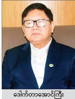
ဒေါက်တာအောင်ကြီး

ရုရှားဖက်ဒရေးရှင်းနိုင်ငံ ဖက်ဒရယ်ငါးလုပ်ငန်း အေဂျင်စီ၏အကြီးအကဲ Mr.Ilya Shestakov ၏ ဖိတ်ကြားမှုဖြင့် မြန်မာနိုင်ငံမှ စိုက်ပျိုးရေး၊ မွေးမြူရေး နှင့် ဆည်မြောင်းဝန်ကြီးဌာန ဒုတိယဝန်ကြီး ဒေါက်တာအောင်ကြီးဦးဆောင်သော မြန်မာကိုယ်စား လှယ်အဖွဲ့သည် စက်တင်ဘာ ၂၁ ရက်မှ ၂၃ ရက် အထိ စီနီပီတာစဘတ်မြို့ St.Petersburg Exhibition and Convention Center ၌ ကျင်းပခဲ့သော Global Fisheries Fourm and Seafood Expo Russia ဖိုရမ်ဖြစ်သည့် (၅)ကြိမ်မြောက် အပြည်ပြည်ဆိုင်ရာ ငါးလုပ်ငန်းဖိုရမ်နှင့် ဆက်စပ်လုပ်ငန်းများဆိုင်ရာ ရေလုပ်ငန်းကုန်စည်ပြပွဲသို့ တက်ရောက်ခဲ့သည်။