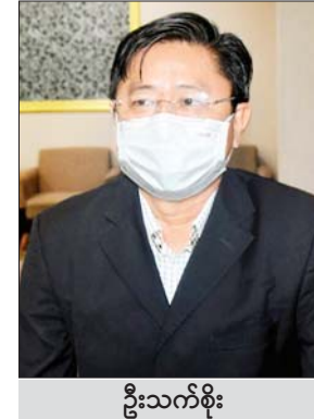
ဦးသက်စိုး

ထိုသို့တက်ရောက်ရာတွင် မြန်မာ့ရေထွက်ကုန် များ တန်ဖိုးမြှင့်ထုတ်လုပ်နိုင်ရန်၊ ပင်လယ်ပြင် ငါး/ ပုစွန်ဖမ်းဆီးရာတွင် Deep Sea ၌ ကမ္ဘာ့နိုင်ငံများနှင့် ရင်ပေါင်တန်း ဖမ်းဆီးနိုင်မည့် နည်းပညာပိုင်းဆိုင်ရာ နှင့် မြန်မာနိုင်ငံတွင် မွေးမြူထုတ်လုပ်မှု အောင်မြင် လျက်ရှိသည့် ရေငန်ပုစွန်ဖြူကို ရုရှားနိုင်ငံသို့ တင်ပို့ နိုင်ရေးအပေါ်အစဉ် စိုက်ပျိုးရေး၊ မွေးမြူရေးနှင့် ရေထွက်ကုန်ကဏ္ဍဆိုင်ရာ ပြည်ပပို့ကုန်တိုးမြှင့်တင်ပို့ နိုင်ရေး နိုင်ငံတော်အတွက် စီးပွားရေးအခွင့်အလမ်း များစွာ သယ်ဆောင်လာခဲ့သော ဒုတိယဝန်ကြီးနှင့် အဖွဲ့အား ရေထွက်ကုန်ကဏ္ဍဖွံ့ဖြိုးမှုဆိုင်ရာနှင့် စပ်လျဉ်း၍ တွေ့ဆုံမေးမြန်းခဲ့သည်များကို ဖော်ပြ လိုက်ပါသည်။