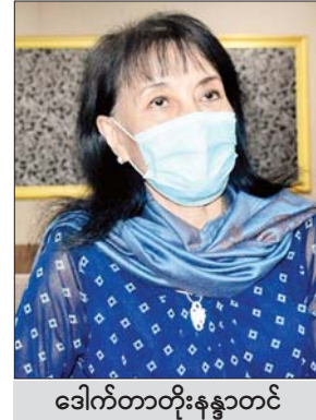
ဒေါက်တာတိုးနန္ဒာတင်