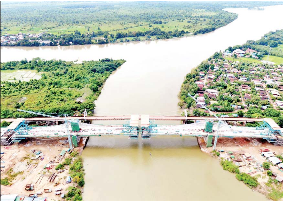
ဂျိုင်း(ကော့ကရိတ်)တံတား တည်ဆောက်ပြီးစီးမှုကို တွေ့ရစဉ်။