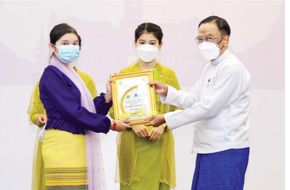
ပြည်ထောင်စုဝန်ကြီး ဒေါက်တာဌေးအောင် ကမ္ဘာခရီးသွားလုပ်ငန်းနေ့အထိမ်းအမှတ်ပြိုင်ပွဲတွင် ဆုရသူတစ်ဦးအား ဆုချီးမြှင့်စဉ်။