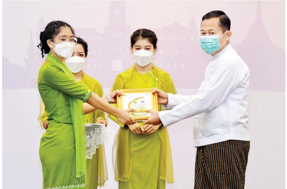
နိုင်ငံတော်စီမံအုပ်ချုပ်ရေးကောင်စီဒုတိယဥက္ကဋ္ဌ ဒုတိယဝန်ကြီးချုပ် ဒုတိယဗိုလ်ချုပ်မှူးကြီး စိုးဝင်း ကမ္ဘာခရီးသွားလုပ်ငန်းနေ့အထိမ်းအမှတ်ပြိုင်ပွဲတွင် ဆုရသူတစ်ဦးအား ဆုချီးမြှင့်စဉ်။