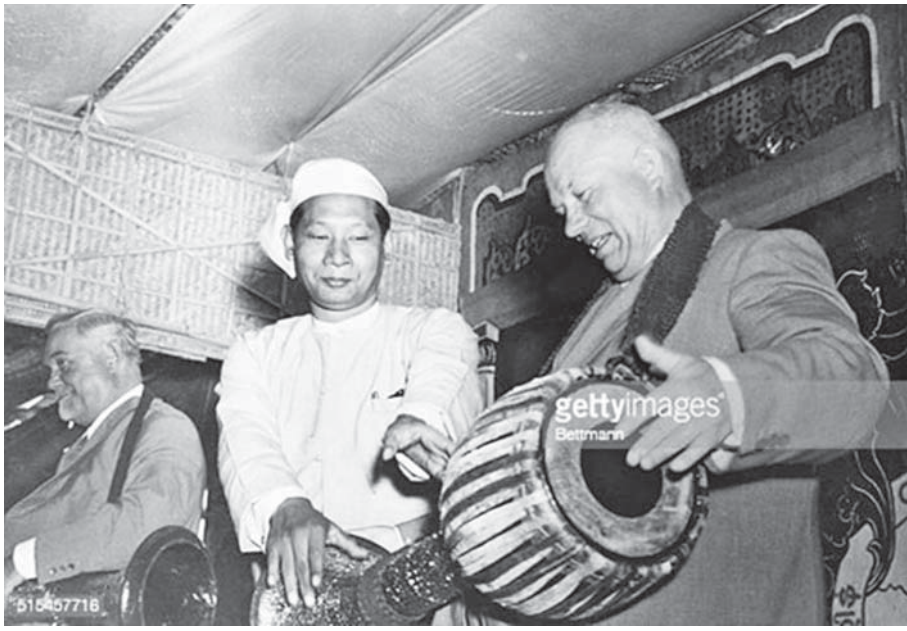
မြန်မာ့ယဉ်ကျေးမှုကို ချစ်မြတ်နိုးသော ရုရှား(ယခင်ဆိုဗီယက်)ခေါင်းဆောင် ခရူးရှက်။