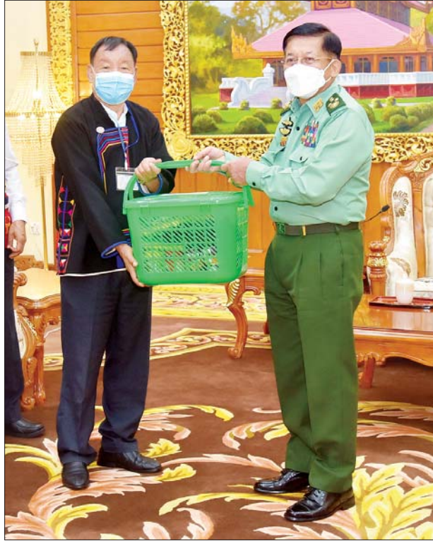
နိုင်ငံတော်စီမံအုပ်ချုပ်ရေးကောင်စီဥက္ကဋ္ဌ တပ်မတော်ကာကွယ်ရေးဦးစီးချုပ် ဗိုလ်ချုပ်မှူးကြီးမင်းအောင်လှိုင်က အမျိုးသားဒီမိုကရက်တစ်မဟာမိတ်အဖွဲ့ (NDAA) ဒုတိယဥက္ကဋ္ဌ ဦးစန်ပေအား အမှတ်တရလက်ဆောင်ပစ္စည်းများ ပေးအပ်စဉ်။