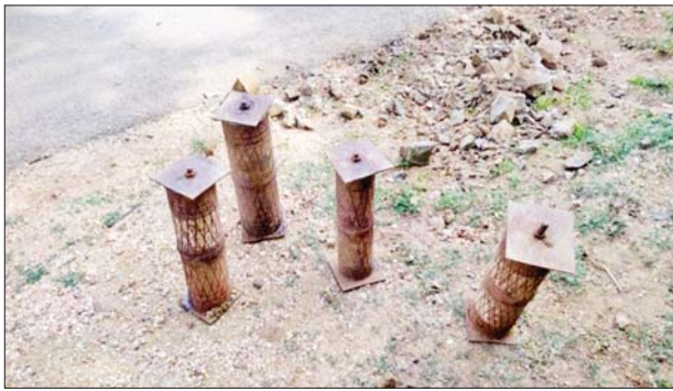
ကားစလစ်အိုးဖြင့် ပြုလုပ်ထားသော လက်လုပ်ဒေသန္တရ ဆွဲမိုင်းများ။