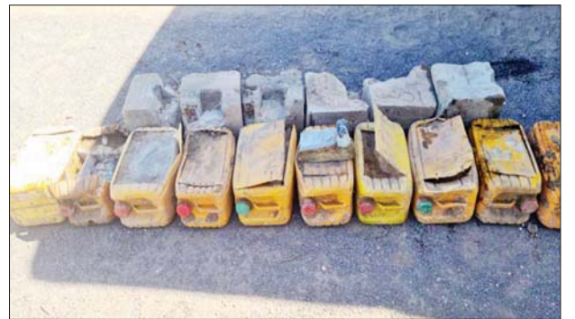
ငါးဂါလန်ဆုံးပုံးများဖြင့် ပြုလုပ်ထားသည့် ဒေသန္တရလက်လုပ် မိုင်းများ။

စလစ် အိုးဖြင့် ပြုလုပ် ထားသော လက်လုပ် ဒေသန္တရ ရီမုတ်မိုင်းနှင့် ရှေ့ထွက် ရီမုတ်မိုင်းများ။