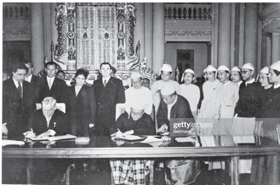
၁၉၅၅ ခုနှစ်တွင် မြန်မာနိုင်ငံဝန်ကြီးချုပ်နှင့် ရုရှားနိုင်ငံ(ယခင်ဆိုဗီယက်)ခေါင်းဆောင်တို့ နိုင်ငံတည်ဆောက်ရေးလုပ်ငန်းများအတွက် လက်မှတ်ရေးထိုးစဉ်။

မြန်မာနိုင်ငံဟာ ၁၉၄၈ ခုနှစ် ဇန်နဝါရီလ ၄ ရက်နေ့ လွတ်လပ်ရေးရရှိပြီး တစ်လကျော်ကြာတဲ့ ဖေဖော်ဝါရီလ ၁၈ ရက်နေ့မှာ ယခုရုရှား ဖက်ဒရေးရှင်းနိုင်ငံ(ယခင် ဆိုဗီယက်ပြည်ထောင်စု)နဲ့ နှစ်နိုင်ငံသံတမန်ဆက်ဆံရေးကို စတင်ထူထောင်ခဲ့ပါတယ်။ မြန်မာနိုင်ငံလွတ်လပ်ရေးတွေ့စစ်ဘေးစစ်ဒဏ်ကြောင့် ပျက်စီးခဲ့တဲ့အခြေအနေတွေနဲ့ လွတ်လပ်ရေးနဲ့အတူ ပေါ်ပေါက်လာတဲ့ ပြည်တွင်းလက်နက်ကိုင် သောင်းကျန်းမှုတွေကြောင့် ပျက်စီးနေတဲ့တိုင်းပြည်ကို ပြန်လည်ထူထောင်ဖို့ ကြိုးပမ်းအားထုတ်ရာမှာ ဓနအင်အားနဲ့ လူသားအရင်းအမြစ်အလုံအလောက်မရှိလို့ မိတ်ဆွေနိုင်ငံတွေရဲ့ အကူအညီတွေနဲ့ ပြန်လည်ထူထောင်ရေးတွေ၊ တည်ဆောက်ရေးတွေကို ပြုလုပ်ခဲ့ရပါတယ်။