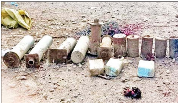
ကားစလစ်အိုးဖြင့် ပြုလုပ်ထားသော လက်လုပ်ဒေသန္တရ ဆွဲမိုင်းများ။