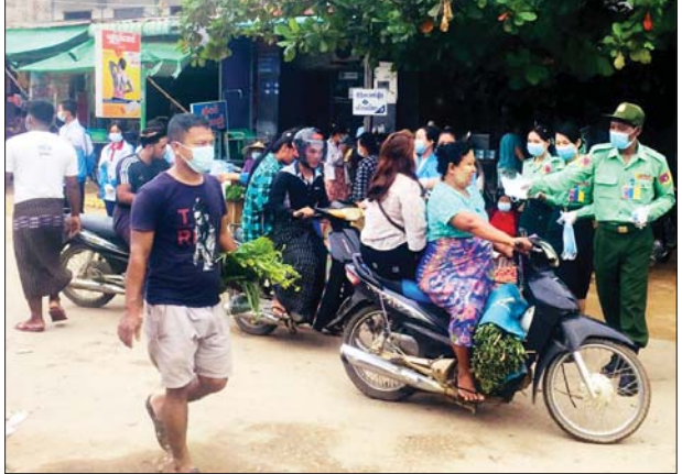
နေပြည်တော် တပ်ကုန်းမြို့နယ်၌ နှာခေါင်းစည်းများပေးဝေစဉ်။

ထိန်းချုပ် ကာကွယ်ရာတွင် အထောက်အကူ ဖြစ်စေရန် အတွက် နှာခေါင်းစည်းများကို ပြည်သူများ လက်ဝယ်အရောက် တိုင်းစစ်ဌာနချုပ် အသီးသီးမှ တာဝန်ရှိသူများက အခမဲ့ပေးဝေ လှူဒါန်းလျက်ရှိရာ ယနေ့တွင် နေပြည်တော် ကောင်စီနယ်မြေ အတွင်းရှိ မြို့နယ်ရှစ်မြို့နယ်၊ ရှမ်းပြည်နယ် (တောင်ပိုင်း) ဒိုလမ်မြို့၊ ရန်ကုန်တိုင်းဒေသကြီး၊ ခရိုင်များအတွင်းရှိ မြို့နယ် ၄၅ မြို့နယ်၊ ဧရာဝတီတိုင်းဒေသကြီး ကန်ကြီးထောင့်မြို့၊ ဖျာပုံမြို့၊ ရခိုင်ပြည်နယ် အမ်းမြို့နယ်နှင့် မန္တလေးတိုင်း ဒေသကြီးအတွင်း ရှိ မြို့နယ်သုံးမြို့နယ်တို့ရှိ စာသင်ကျောင်းများ၊ ဈေးများ၊ လမ်းများ၊ မြို့အဝင်ဂိတ်များနှင့် လူစည် ကားရာနေရာများတွင် နယ်မြေခံ တပ်မတော်သားများ က ဌာနဆိုင်ရာဝန်ထမ်းများ၊ တာဝန်ရှိသူများ၊ ပရဟိတအဖွဲ့ များနှင့်ပူးပေါင်း၍ ကိုဗစ်-၁၉ ရောဂါ ကာကွယ်ရေးအတွက် အသိပညာပေး ဆောင်ရွက်ခြင်း၊ နှာခေါင်းစည်းများ တပ်ဆင်ပြီး သွားလာကြရန် လှုံ့ဆော်ခြင်းနှင့် နှာခေါင်းစည်းများအား ဒေသခံ ပြည်သူများ လက်ဝယ်အရောက် အခမဲ့ ပေးဝေလှူဒါန်းခဲ့ကြ ကြောင်း သိရသည်။ သတင်းစဉ်