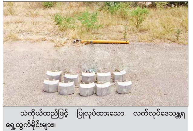
သံကိုယ်ထည်ဖြင့် ပြုလုပ်ထားသော လက်လုပ်ဒေသန္တရ ရှေ့ထွက်မိုင်းများ။

■ စစ်ကိုင်းတိုင်းဒေသကြီးမှ ကြီးမားစွာလုပ်ဆောင်ရန် စီစဉ်လျက်ရှိကြောင်း အကြမ်းဖက်လုပ်ရပ်များကို လက်မခံသည့် ဒေသခံပြည်သူတချို့၏ သတင်းပေးမှုအရ လုံခြုံရေးတပ်ဖွဲ့ဝင်များက အဆိုပါ ကားစလစ်မကြီးတစ်လျှောက် စက်တင်ဘာ ၂၁ ရက်မှ ၂၅ ရက်အတွင်း မိုင်းရှင်းလင်းရေးလုပ်ငန်းများဆောင်ရွက်ခဲ့ရာ ကားစလစ်/ယာ တစ်လျှောက်