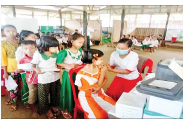
စစ်တွေမြို့နယ်ရှိ ကျောင်းသား ကျောင်းသူများအား ကိုဗစ်-၁၉ ရောဂါကာကွယ်ဆေးထိုးနှံပေးစဉ်။

နေပြည်တော် စက်တင်ဘာ ၂၆ တိုင်းဒေသကြီးနှင့် ပြည်နယ် အသီးသီးတို့၌ ကာကွယ်ဆေး ထိုးနှံခြင်းကို ဆောင်ရွက်လျက်ရှိ ရာ ယနေ့တွင် ရန်ကုန်တိုင်း ဒေသကြီး တာမွေမြို့နယ်နှင့် ရန်ကင်းမြို့နယ်၌ ဒေသခံ ပြည်သူ ၃၆၂ ဦး၊ ဧရာဝတီတိုင်း ဒေသကြီးအတွင်းရှိ မြို့နယ် ၂၆ မြို့နယ်၌ ဒေသခံပြည်သူ ၂၃၀၂ ဦး၊ ရခိုင်ပြည်နယ်နှင့် ချင်းပြည်နယ်အတွင်းရှိ မြို့နယ် ၅ ခုနှင့် မန္တလေးတိုင်းဒေသ ကြီးအတွင်းရှိ ခရိုင်ခုနစ်ခုရှိ၌ ဒေသခံပြည်သူ ၂၁၉၈ ဦးတို့ကို တပ်မတော်မှ ဆေးအဖွဲ့များက ပြည်သူ့ဆေးရုံများမှ ဆရာဝန် များ၊ သက်ဆိုင်ရာ ကျန်းမာရေး ဝန်ထမ်းများ၊ စေတနာ့ဝန်ထမ်း