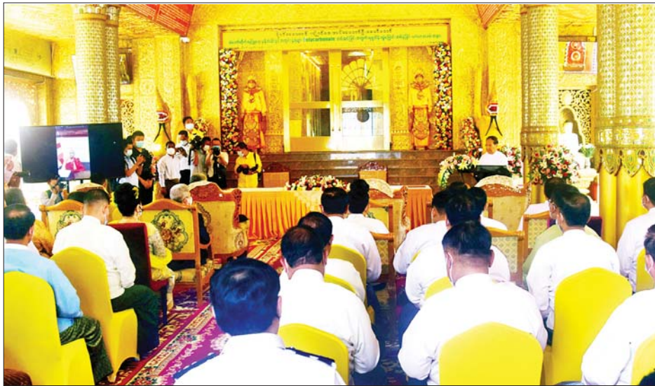
ပြည်ထောင်စုဝန်ကြီး ဦးကိုကို ဗိုလ်တထောင်ကျိုက်ဒေးအပ်ဆံတော်ဦးစေတီတော် ဆံတော်တိုက် ပတ်လည် Polycarbonate တပ်ဆင်လှူဒါန်း လွှဲပြောင်းအပ်နှံပွဲအခမ်းအနားတွင် အမှာစကားပြောကြားစဉ်။

အခမ်းအနားတွင် တရုတ်ပြည်သူ့သမ္မတနိုင်ငံ သံအမတ်ကြီး H.E. Mr.Chen Hai က လှူဒါန်းမှုနှင့် ပတ်သက်၍ တရုတ်-မြန်မာနှစ်နိုင်ငံ ကြာရှည်လှ သည့် ဗုဒ္ဓဘာသာကူးလူးဖလှယ်မှုသည် နှစ်နိုင်ငံ ပထဝီတည်နေရာနီးစပ်ပြီး ပြည်သူများရင်းနှီး ချစ်ကြည်၍ ယဉ်ကျေးမှုတူညီသော အစိတ်အပိုင်း တစ်ခုဖြစ်လာကာ တရုတ်-မြန်မာခေတ်အဆက်ဆက် ချစ်ကြည်ရင်းနှီးသည့်အနှစ်သာရ ဂုဏ်ရောင်ကို တိုးပွားစေကြောင်း၊ ဆံတော်တိုက်တွင် လုံခြုံရေး မှန်များတပ်ဆင်ခြင်းဖြင့် နှစ်နိုင်ငံဗုဒ္ဓရေစက် ဓမ္မ သံယောဇဉ်ကို အမွေဆက်ခံပြန့်ပွားအောင်ဆောင်ရွက် ခြင်းဖြစ်ကြောင်း၊ တရုတ်-မြန်မာ အသိုက်အဝန်း တည်ဆောက်ရေးအတွက် ကြီးမားသောအကျိုး ထမ်းဆောင်မှုအသစ်များ ဆောင်ရွက်သွားနိုင်မည်ဟု ယုံကြည်ပါကြောင်း ပြောကြားသည်။