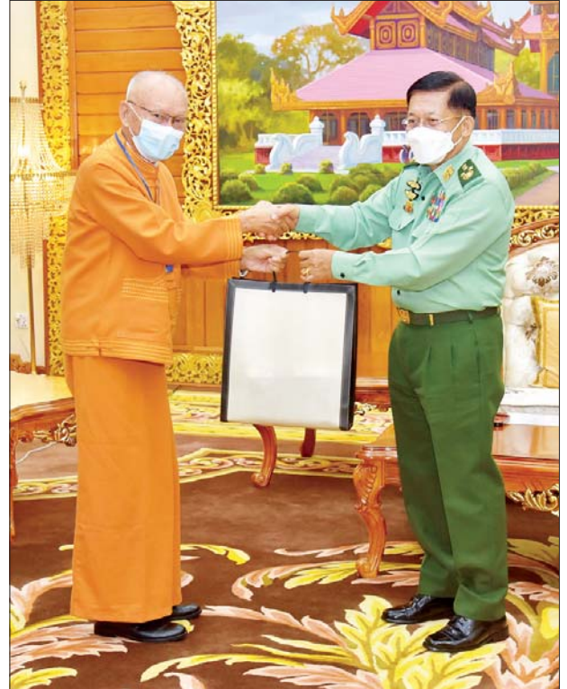
နိုင်ငံတော်စီမံအုပ်ချုပ်ရေးကောင်စီဥက္ကဋ္ဌ တပ်မတော်ကာကွယ်ရေးဦးစီးချုပ် ဗိုလ်ချုပ်မှူးကြီးမင်းအောင်လှိုင်ထံ ရှမ်းပြည်တိုးတက်ရေးပါတီ(SSPP) ဒုတိယဥက္ကဋ္ဌ(၂) စဝ်ခွန်ဆိုင်က ဒေသထွက်လက်ဆောင်ပစ္စည်းများ ပေးအပ်စဉ်။