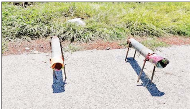
သံပိုက်ဖြင့် ပြုလုပ်ထားသော လက်လုပ်ဒေသန္တရ ဆွဲမိုင်း။