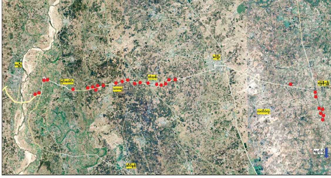
၂၀၂၂ ခုနှစ် စက်တင်ဘာ ၂၁ ရက်မှ ၂၅ ရက်ထိ ရေဦး-ခင်ဦးသွား ကားလမ်းမကြီးနှင့် လမ်း၏ဝဲ/ယာ မိုင်းရှင်းလင်းခြင်းဆောင်ရွက်စဉ် ဖော်ထုတ်ရရှိသည့် NUG နှင့် PDF အမည်ခံ အကြမ်းဖက်အဖွဲ့များထောင်ထားသည့်လက်လုပ်မိုင်းများ ဖော်ထုတ်သိမ်းဆည်းရရှိခဲ့သည့်နေရာပြပုံ

နေပြည်တော် စက်တင်ဘာ ၂၆ NUG နှင့် PDF အမည်ခံ အကြမ်းဖက် သမားများသည် အေးချမ်းစွာနေထိုင်လျက် ရှိသည့် ပြည်သူလူထုများနှင့် တရားဥပဒေ စိုးမိုးရေးအတွက် ဆောင်ရွက်နေသည့် အုပ်ချုပ်ရေးတာဝန်ရှိသူများအား ထိခိုက် ဒဏ်ရာရရှိစေရန်နှင့် လမ်းပန်းဆက်သွယ် မှုများ လုံခြုံချောမွေ့မှုမရှိစေရေး ရည်ရွယ် ချက်များဖြင့် အများပြည်သူ အသုံးပြု သည့် လမ်းကြောင်းများတွင် မိုင်းထောင် ခြင်း၊ ပစ်ခတ်တိုက်ခိုက်ခြင်းများ စသည့် အကြမ်းဖက်ဖောက်ခွဲရေးလုပ်ရပ်များ ပြုလုပ်လျက်ရှိသည်။ ထိုသို့ပြုလုပ်လျက်ရှိရာ စစ်ကိုင်း တိုင်းဒေသကြီးအတွင်းရှိ NUG နှင့် PDF အမည်ခံ အကြမ်းဖက်သမားများအနေဖြင့် ရေဦးမြို့နှင့် ခင်ဦးမြို့သွား ကားလမ်းမ ကြီးတစ်လျှောက် သွားလာလျက်ရှိသည့် ခရီးသွားပြည်သူများနှင့် လုံခြုံရေးတပ်ဖွဲ့ ဝင်များကို အကြောင်းမဲ့ အကြမ်းဖက် မိုင်းထောင်ဖောက်ခွဲ တိုက်ခိုက်ခြင်းများ စာမျက်နှာ ၁၅ ကော်လံ ၁ သို့