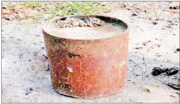
သံကိုယ်ထည်ဖြင့်ပြုလုပ်ထားသော အမြင့် နှစ်ပေ၊ အချင်း နှစ်ပေခန့်ရှိ လက်လုပ်ဒေသန္တရမိုင်း။