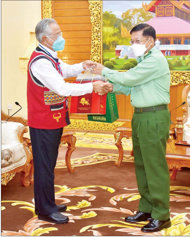
နိုင်ငံတော်စီမံအုပ်ချုပ်ရေးကောင်စီဥက္ကဋ္ဌ တပ်မတော်ကာကွယ်ရေးဦးစီးချုပ် ဗိုလ်ချုပ်မှူးကြီးမင်းအောင်လှိုင်ထံ “ဝ”ပြည်သွေးစည်းညီညွတ်ရေးပါတီ(UWSP) ဒုတိယဥက္ကဋ္ဌ ဦးလော့ယာကုက ဒေသထွက်လက်ဆောင်ပစ္စည်းများ ပေးအပ်စဉ်။