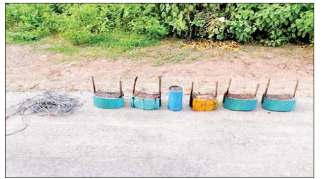
သံကိုယ်ထည်ဖြင့်ပြုလုပ်ထားသည့် လက်လုပ်ဒေသန္တရ ရှေ့ထွက်ဆွဲမိုင်းများ။