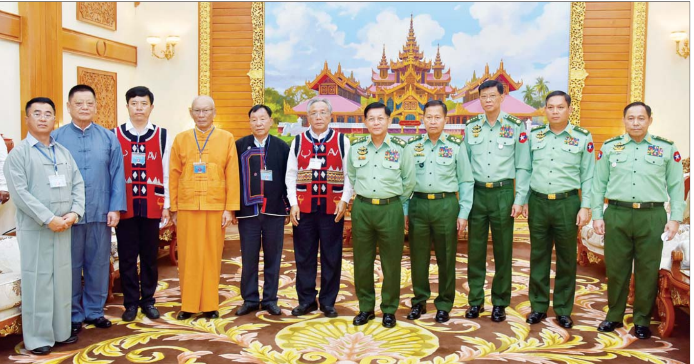
နိုင်ငံတော်စီမံအုပ်ချုပ်ရေးကောင်စီဥက္ကဋ္ဌ တပ်မတော်ကာကွယ်ရေးဦးစီးချုပ် ဗိုလ်ချုပ်မှူးကြီးမင်းအောင်လှိုင်နှင့် “ဝ”ပြည်သွေးစည်းညီညွတ်ရေးပါတီ(UWSP) ဒုတိယဥက္ကဋ္ဌ ဦးလော့ယာကု၊ အမျိုးသားဒီမိုကရက်တစ်မဟာမိတ်အဖွဲ့ (NDAA) ဒုတိယ ဥက္ကဋ္ဌ ဦးစန်ပေနှင့် ရှမ်းပြည်တိုးတက်ရေးပါတီ(SSPP) ဒုတိယဥက္ကဋ္ဌ(၂) စဝ်ခွန်ဆိုင်တို့ အဖွဲ့ဝင်များနှင့်အတူ စုပေါင်းမှတ်တမ်းတင်ဓာတ်ပုံရိုက်စဉ်။

အမြော်အမြင်ကြီးစွာ ကမ်းလှမ်းခဲ့မှု ထို့နောက် “ဝ”ပြည်သွေးစည်းညီညွတ်ရေးပါတီ(UWSP) ဒုတိယဥက္ကဋ္ဌ ဦးလော့ယာကု၊ အမျိုးသားဒီမိုကရက်တစ်မဟာမိတ်အဖွဲ့ (NDAA) ဒုတိယဥက္ကဋ္ဌ ဦးစန်ပေ၊ ရှမ်းပြည်တိုးတက်ရေးပါတီ(SSPP) ဒုတိယဥက္ကဋ္ဌ(၂) စဝ်ခွန်ဆိုင်နှင့် အဖွဲ့ဝင်များက နိုင်ငံတော်စီမံအုပ်ချုပ်ရေးကောင်စီဥက္ကဋ္ဌ တပ်မတော်ကာကွယ်ရေးဦးစီးချုပ်က သဘောထားကြီးစွာဖြင့် နိုင်ငံရေးဆွေးနွေးမှုမှတစ်ဆင့် ပြည်တွင်းငြိမ်းချမ်းရေးနှင့် ဖွံ့ဖြိုးတိုးတက်ရေးဖော်ဆောင်နိုင်ရန် အမြော်အမြင်ကြီးစွာ ကမ်းလှမ်းခဲ့မှုအပေါ် ဝမ်းမြောက်ကြိုဆိုသည့် အခြေအနေများ၊ နိုင်ငံတော်မှ ခွဲမထွက်ဘဲ