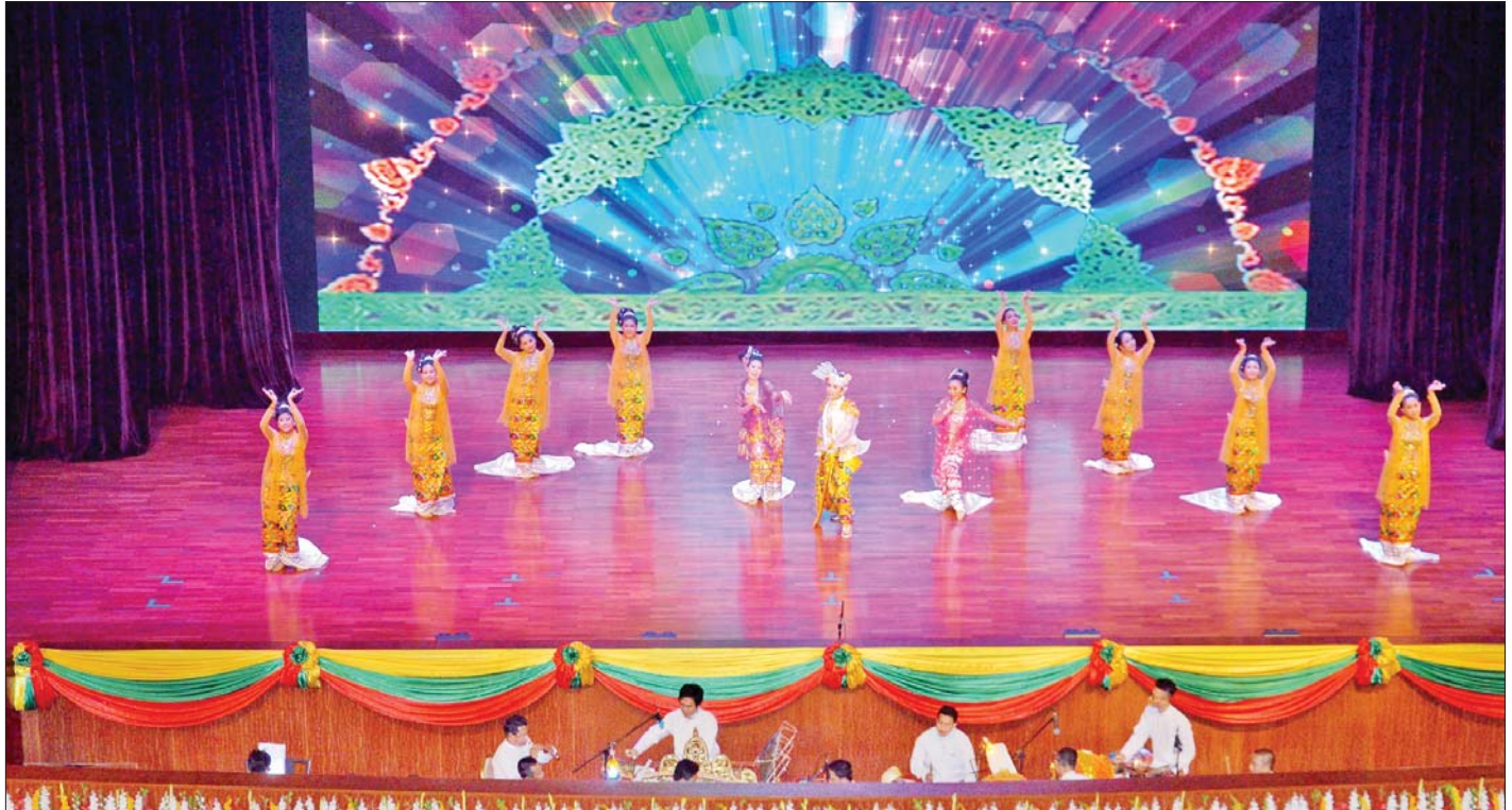
“အသက်ထက်မြတ်သော ဂုဏ်သိက္ခာ” ဆို ငို ပြော ဇာတ်တော်ကြီးကို မြန်မာ့ရိုးရာအစဉ်အလာ သမားစဉ်နှင့်အညီ ကပြဖျော်ဖြေရာတွင် ဘုရားကန်တော့ခန်း၊ ဇာတ်တော်ကြီးသမားစဉ် အပျိုတော်ထွက်ခန်းနှင့် နှစ်ပါးသွားခန်းတို့ဖြင့် စတင်အစပျိုး ကပြဖျော်ဖြေစဉ်။

ဒဏ် အနိမ့်အမြင့် အတက်အကျတွင် လိုက်ပါခဲ့ရသည့် ရာဇဓာတုကလျာ၏ ရင်နှင့်ဖွယ်ရာဖြစ်ရပ်နှင့်အတူ ပဒေသရာဇ်များ၏ အားပြိုင်မှုမှဖြစ်ပေါ်လာသော နိုင်ငံရေး၊ စစ်ရေး အခင်းအကျင်းများကို နောက်ခံ လျက် စစ်ရေးစစ်ရာတွင် ရဲစွမ်းသတ္တိရှိသည်သာမက အနုသုခုမပညာတွင်လည်း လက်ရာပြောင်မြောက်ခဲ့ သည့် နတ်သျှင်နောင်သည် မိမိတို့၏နိုင်ငံအတွင်း ပြဿနာကိုဖြေရှင်းရန် ကြိုးပမ်းရာ၌ တိုင်းတစ်ပါးသား ကို အကြွင်းမဲ့ယုံစား၍ ပူးပေါင်းဆောင်ရွက်မိသဖြင့် မလှပသော သမိုင်းနိဂုံးဖြင့် ဇာတ်သိမ်းရသည်ကို သမိုင်းတစ်ကွေ့၏ သတိမူစရာ သင်ခန်းစာဖြစ်ရပ် တစ်ခုအနေဖြင့် တင်ဆက်ကပြခြင်းဖြစ်သည်။ နိုင်ငံတော်အကြီးအကဲ၏ လမ်းညွှန်ချက်နှင့်အညီ