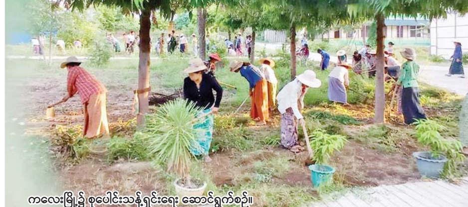
ကလေးမြို့၌ စုပေါင်းသန့်ရှင်းရေး ဆောင်ရွက်စဉ်။

နေပြည်တော် စက်တင်ဘာ ၂၄ ယခုအချိန်အခါတွင် နိုင်ငံတော်စီမံအုပ်ချုပ်ရေး ကောင်စီ၏ ဦးဆောင်မှုနှင့်အတူ နိုင်ငံတစ်ဝန်းလုံး၌ အုပ်ချုပ်ရေးအဖွဲ့အစည်းများ၊ ဒေသခံပြည်သူများ အားလုံးက နိုင်ငံတော်ဖွံ့ဖြိုးတိုးတက်ရေးလုပ်ငန်း များကို ညီညီညွတ်ညွတ်ဖြင့် ဆောင်ရွက်လျက်ရှိကြ ပြီး အပတ်စဉ် စနေနေ့တိုင်းတွင်လည်း မိမိတို့၏ မြို့၊ ရွာဒေသများ သန့်ရှင်းသာယာလှပရေးကို အားတက် သရော ဆောင်ရွက်လျက်ရှိကြသည်။ ထိုသို့ဆောင်ရွက်လျက်ရှိရာ ယနေ့တွင် နေပြည်တော်ကောင်စီနယ်မြေ ဇေယျာသီရိမြို့နယ် အပါအဝင် မြို့နယ်ရှစ်မြို့နယ်တို့၌ လည်းကောင်း၊ ကချင်ပြည်နယ် မြစ်ကြီးနားမြို့နယ် အပါအဝင် မြို့နယ်သုံးမြို့နယ်တို့၌ လည်းကောင်း၊ ရှမ်းပြည်နယ် (မြောက်ပိုင်း) လားရှိုးမြို့နယ်လည်းကောင်း၊ ရှမ်းပြည် နယ် (တောင်ပိုင်း) လင်းခေးမြို့နယ် အပါအဝင် မြို့နယ်သုံးမြို့နယ်တို့၌ လည်းကောင်း၊ ရှမ်းပြည်နယ် (အရှေ့ပိုင်း) ကျိုင်းတုံမြို့နယ်အပါအဝင် မြို့နယ် ခြောက်မြို့နယ်တို့၌လည်းကောင်း၊ တနင်္သာရီတိုင်း