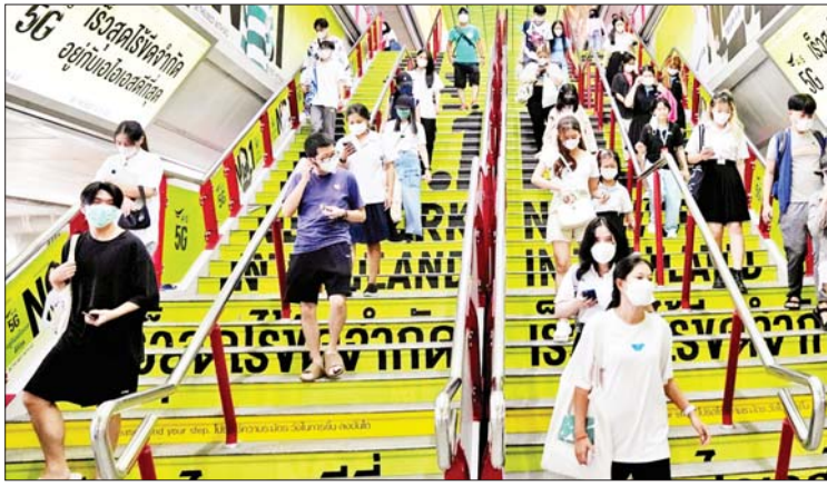
မတွေ့ရှိရသည့်အတွက် အဆိုပါစည်းမျဉ်းများကို ပြန်လည်ရုပ်သိမ်းခြင်းဖြစ်ကြောင်း ထိုင်းကျန်းမာရေးအာဏာပိုင်များက ဆိုသည်။

ဗန်ကောက် စက်တင်ဘာ ၂၄ ထိုင်းနိုင်ငံ၌ အောက်တိုဘာ ၁ ရက်မှ စပြီး ကိုဗစ်-၁၉ ရောဂါ ကာကွယ်ရေးဆိုင်ရာ စည်းမျဉ်းအချို့ကို ပြန်လည်ရုပ်သိမ်းမည်ဖြစ်ကြောင်း ထိုင်းကျန်းမာရေးအာဏာပိုင်များက ယနေ့ပြောကြားသည်။ နိုင်ငံအတွင်း ကိုဗစ်-၁၉ ရောဂါ ကာကွယ်ရေးဆိုင်ရာ စည်းမျဉ်းများကို ၂၀၂၀ ပြည့်နှစ် မတ်လမှစပြီး ချမှတ်ထားကြောင်း သိရသည်။ ကာကွယ်ဆေးထိုးနှံမှုမပြုမီဖြစ်သည့် ပြည်သူ့ဦးရေများပြားလာခြင်းနှင့် ရောဂါပြင်းထန်စွာခံစားရသည့် လူနာများ ထပ်မံ