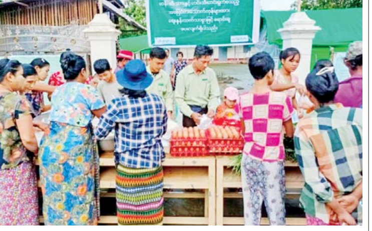
မြို့နယ်ရှိ ရပ်ကွက်များ၊ ကျေးရွာ အုပ်စုများတွင် အခြေခံစားသောက်ကုန် များ ဈေးနှုန်းချိုသာစွာ ရောင်းချခြင်းကို စက်တင်ဘာ ၄ ရက်မှစတင်၍ နေ့စဉ် ဆောင်ရွက်ပေးလျက်ရှိကြောင်း သိရ သည်။ ခရိုင်(ပြန်/ဆက်)

ကျိုပျော် စက်တင်ဘာ ၂၄ ဧရာဝတီတိုင်းဒေသကြီး ကျိုပျော် မြို့နယ် စီမံအုပ်ချုပ်ရေးအဖွဲ့က ထော်ဦး ကျေးရွာရှိ အိမ်ထောင်စု ၁၅၀ အား အခြေခံစားသောက်ကုန်များ ဈေးနှုန်း ချိုသာစွာ ဖြန့်ဖြူးရောင်းချပေးခြင်းကို ယနေ့နံနက် ၇ နာရီခွဲက ကျေးရွာအလယ် တန်းကျောင်းရှေ့၌ ရောင်းချပေးခဲ့ ကြောင်း သိရသည်။ ထိုသို့ ရောင်းချရာတွင် ဆန်တစ်ပြည် လျှင် ငွေကျပ် ၁၀၀၀၊ ကြက်ဥ တစ်လုံး လျှင် ငွေကျပ် ၁၀၀ ဖြင့် တစ်အိမ်ထောင် လျှင် ဆန်နှစ်ပြည်၊ ကြက်ဥလေးလုံးနှင့် ဟင်းသီးဟင်းရွက်သုံးမျိုးတို့ကို ဈေးနှုန်း ချိုသာစွာ ရောင်းချပေးခဲ့သည်။ ကျိုပျော်