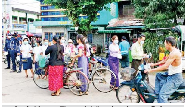
ရန်ကုန်တိုင်းဒေသကြီးအတွင်းရှိ မြို့နယ်များ၌ ဒေသခံပြည်သူများ အား နှာခေါင်းစည်းများ အခမဲ့ပေးဝေလျှော့ဒါန်းစဉ်။

နေပြည်တော် စက်တင်ဘာ ၂၄ တိုင်းဒေသကြီးနှင့် ပြည်နယ် အသီးသီးတို့၌ ကာကွယ်ဆေး ထိုးနှံခြင်းကို ဆောင်ရွက်လျက် ရှိရာ ယနေ့တွင် ဧရာဝတီတိုင်း ဒေသကြီးအတွင်းရှိ မြို့နယ် ၂၆ မြို့နယ်၌ ဒေသခံပြည်သူ ၆၃၀၀၊ ရခိုင်ပြည်နယ်အတွင်းရှိ မြို့နယ် သုံးမြို့နယ်၌ ဒေသခံ ပြည်သူ ၇၆၄ ဦးနှင့် မန္တလေး တိုင်းဒေသကြီးအတွင်းရှိ ခရိုင် ခုနစ်ခု၌ ဒေသခံပြည်သူ ၄၄၀၅ ဦးတို့ကို တပ်မတော်မှ ဆေးအဖွဲ့များက ပြည်သူ့ ဆေးရုံများမှ ဆရာဝန်များ၊ သက်ဆိုင်ရာ ကျန်းမာရေး ဝန်ထမ်းများ၊ စေတနာ့ဝန်ထမ်း များနှင့်ပူးပေါင်း၍ ကိုဗစ်-၁၉ ရောဂါ ကာကွယ်ဆေးထိုးနှံပေး