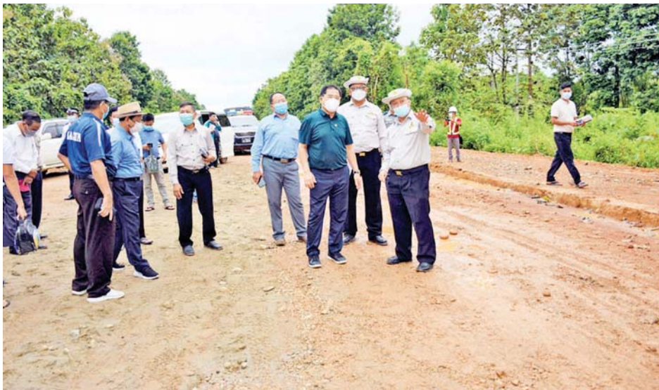
သိပ္ပံကျောင်းနှင့် ဌာနဆိုင်ရာရုံးများပါဝင်လာသည့် အတွက် မော်ဟောင်းကျေးရွာအုပ်စုအတွင်း မြို့ကွက် သစ်ပုံစံဖြင့် ဖွံ့ဖြိုးတိုးတက်လာမည်ဖြစ်၍ ရေရှည် အကျိုးဖြစ်ထွန်းလာစေရေးအတွက် ကျေးလက်ကုန် ထုတ်လမ်းများအပြင်ဈေးနှင့်ကျေးလက်ကျန်းမာရေး ဌာနမြေနေရာများကို လျာထားဆောင်ရွက်နိုင်ရေး ပေါင်းစပ်ညှိနှိုင်း ဆောင်ရွက်ပေးခဲ့ကြောင်း သိရသည်။ (ပြန်/ဆက်)

ကုန်ထုတ်လမ်းများကိုပါ ဆောင်ရွက်ပေးနိုင်ရေး စနစ်တကျ ကွင်းဆင်းတိုင်းတာတင်ပြနိုင်ရေး တာဝန် ရှိသူများနှင့် ပေါင်းစပ်ညှိနှိုင်းဆောင်ရွက်ပေးခဲ့သည်။ ယင်းနောက် ပြည်နယ်ဝန်ကြီးချုပ်သည် အဆိုပါ လမ်းပိုင်းနှင့် တစ်ဆက်တစ်စပ်တည်း မော်ဟောင်း ကျေးရွာအုပ်စုအတွင်းရှိ မြေလွတ်မြေလပ်ဧက ၅၀၀ ပေါ်တွင် အကောင်အထည်ဖော် တည်ဆောက်သွား မည့် အားကစားနှင့် ကာယပညာသိပ္ပံကျောင်း မြေနေရာ၊ မွေးမြူရေးနှင့် ကုသရေးဦးစီးဌာန၏ မွေးမြူရေးသုတေသနနှင့် သရုပ်ပြခြံတည်ဆောက် မည့် မြေနေရာအပါအဝင် ဌာနဆိုင်ရာများ၏ မြေနေ ရာများ သတ်မှတ်ပေးနိုင်ရေး ကြည့်ရှုစစ်ဆေးသည်။ ထို့နောက် ဌာနဆိုင်ရာသတ်မှတ်မြေနေရာ များကို လှည့်လည်ကြည့်ရှုစစ်ဆေးခဲ့ကြပြီး ပြည်နယ် ဝန်ကြီးချုပ်က နန်ပေါင်ရှောင်ကွင်းလမ်း၊ အား/ကာ