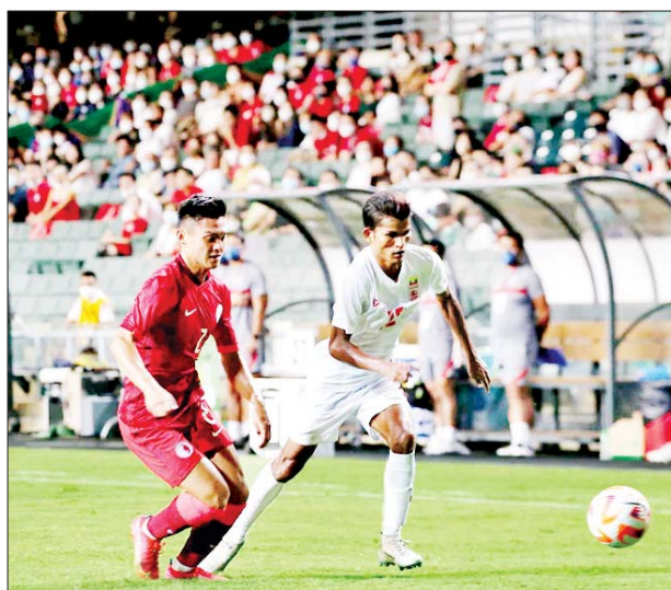
မြန်မာအသင်းနှင့် ဟောင်ကောင်အသင်းတို့ ယှဉ်ပြိုင်ကစားကြစဉ်။

ရန်ကုန် စက်တင်ဘာ ၂၄ မြန်မာ့လက်ရွေးစင်အသင်းနှင့် ဟောင်ကောင်လက်ရွေးစင်အသင်း တို့၏ ဒုတိယခြေစမ်းပွဲကို စက်တင်ဘာ ၂၄ ရက် မြန်မာစံတော်ချိန် ညနေ ၆ နာရီခွဲက ဟောင်ကောင်၌ ကျင်းပရာ ရိုးမရှိသရေကျခဲ့သည်။ မြန်မာ့လက်ရွေးစင်အသင်းသည် ဟောင်ကောင်လက်ရွေးစင် အသင်းနှင့် ပထမခြေစမ်းပွဲတွင် နှစ်ဂိုး-ဂိုးမရှိဖြင့် အရေးနိမ့်ခဲ့သော်လည်း ယခုပွဲတွင် ရိုးမရှိသရေ ကစားနိုင်ခဲ့သည်။ ဂိုးမရှိသရေရလဒ်ဖြင့် ပြီးဆုံး ပထမပိုင်းတွင် အိမ်ရှင်ဟောင်ကောင်အသင်းက ခြေအသာဖြင့် ဖိကစားနိုင်သော်လည်း အဆုံးသတ်အားနည်းခြင်းနှင့် မြန်မာခံစစ် အမှားနည်းခြင်းတို့ကြောင့် ပထမပိုင်းတွင် ရိုးမရှိသရေကျနေသည်။ ဒုတိယပိုင်းတွင် နှစ်သင်းစလုံး ကစားသမားများ အပြောင်းအလဲပြုလုပ် ခဲ့ပြီး မြန်မာအသင်းအနေဖြင့် ပထမပိုင်းထက် တိုက်စစ်ကစားပုံ ပိုမိုကောင်းမွန်လာပြီး ဟောင်ကောင်အသင်းဂိုးပေါက်ကို ခြိမ်းခြောက် နိုင်ခဲ့သည်။ သို့သော် နှစ်သင်းစလုံး ရိုးမသွင်းနိုင်သဖြင့် ရိုးမရှိသရေ ရလဒ်ဖြင့် ပြီးဆုံးခဲ့ခြင်းဖြစ်သည်။ စာမျက်နှာ ၂၄ ကော်လံ ၄ သို့ ❖