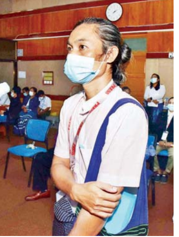
Myanmar National Post မှ အယ်ဒီတာချုပ် နောင်တော်လေး

နေရာဖြစ်ကြောင်း၊ အမှန်တကယ် ရွေးချယ်ရာတွင် ဒုတိယသမ္မတများ အားလုံးအထဲမှ မဲပေးသည့်စနစ်ဖြင့် ရွေးချယ်ခဲ့ကြောင်း၊ ဒုတိယသမ္မတ (၁) ဖြစ်သည့် ဦးမြင့်ဆွေသည် ဒုတိယသမ္မတ (၂) ဖြစ်သွားခဲ့ပါက ပြောစရာဖြစ်လာ နိုင်ကြောင်း၊ ထို့ကြောင့် ယခုလာမည့် ရွေးကောက်ပွဲအပြီးတွင် ယင်းကိစ္စများနှင့် ပတ်သက်ပြီး ပြန်လည်ပြင်ဆင်ပေးရန် အစီအစဉ် ရှိ/ မရှိ သိလိုကြောင်းနှင့် တိုင်းဒေသကြီးနှင့် ပြည်နယ်များတွင်