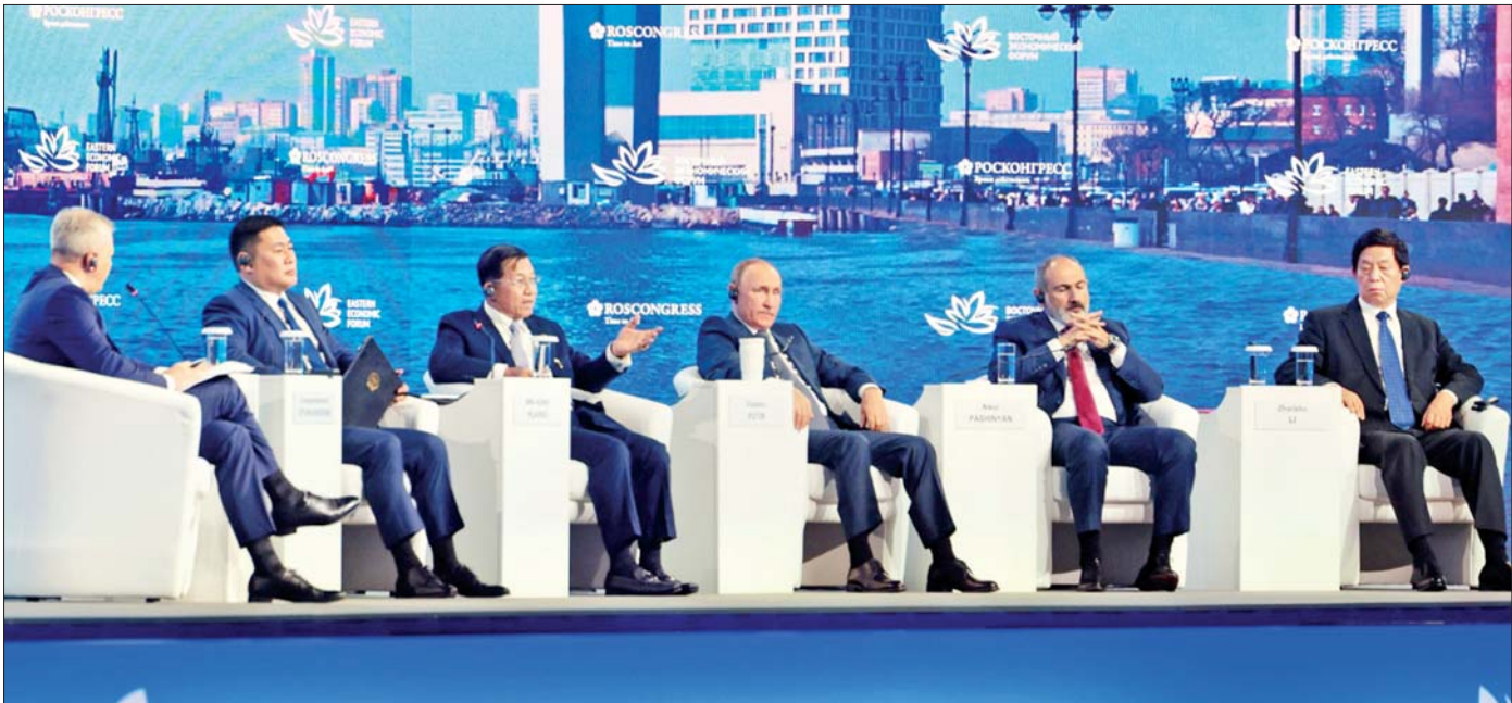
စက်တင်ဘာ ၇ ရက်က (၇)ကြိမ်မြောက် အရှေ့ဖျားစီးပွားရေးဖိုရမ်၏ မျက်နှာစုံညီအစည်းအဝေး Plenary Session ၌ နိုင်ငံတော်စီမံအုပ်ချုပ်ရေးကောင်စီဥက္ကဋ္ဌ နိုင်ငံတော်ဝန်ကြီးချုပ် ဗိုလ်ချုပ်မှူးကြီး မင်းအောင်လှိုင်၏ ဆွေးနွေးမှုနှင့်ပတ်သက်၍ အခမ်းအနားများက သိရှိလိုသည်များကို ပြန်လည်မေးမြန်းဆွေးနွေးပြောကြားခဲ့ရာ နိုင်ငံတော်စီမံအုပ်ချုပ်ရေးကောင်စီဥက္ကဋ္ဌ နိုင်ငံတော်ဝန်ကြီးချုပ်က ပြန်လည်ရှင်းလင်းဆွေးနွေးစဉ်။

နိုင်ငံတစ်ခု၏ စားနပ်ရိက္ခာလုံခြုံရေးကို စဉ်းစားသည့်အခါ အစာရေစာမလုံလောက်မှု