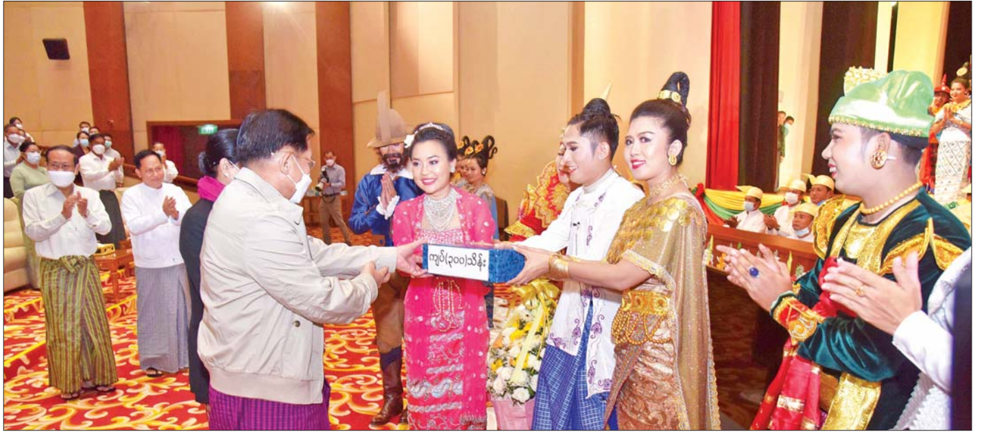
နိုင်ငံတော်စီမံအုပ်ချုပ်ရေးကောင်စီဥက္ကဋ္ဌ နိုင်ငံတော်ဝန်ကြီးချုပ် ဗိုလ်ချုပ်မှူးကြီးမင်းအောင်လှိုင်နှင့် ဇနီး ဒေါ်ကြူကြူလှ “အသက်ထက်မြတ်သော ဂုဏ်သိက္ခာ” ဆို ငို ပြော ဇာတ်တော်ကြီးတွင် ပါဝင်တင်ဆက်ကပြဖျော်ဖြေခဲ့ကြသည့် အနုပညာရှင်များအား ဂုဏ်ပြုဆုငွေပေးအပ်ချီးမြှင့်စဉ်။

ဇာတ်တော်ကြီးကို မြန်မာ့ရိုးရာအစဉ်အလာ သမားစဉ်နှင့်အညီ ကပြဖျော်ဖြေရာတွင် ဘုရား ကန်တော့ခန်း၊ ဇာတ်တော်ကြီးသမားစဉ် အပျိုတော် ထွက်ခန်းနှင့် နှစ်ပါးသွားခန်းတို့ဖြင့် စတင်အစပျိုး ကပြဖျော်ဖြေသည်။ ထို့နောက် ဘုရင့်နောင် မင်းတရားကြီး ထွက်တော်မူကြီးနှင့် ဓာတုကလျာ ဖွားမြင်ခန်း၊ ဝန်မင်းနှစ်ပါး ဇာတ်ပန္နက်ရိုက် ပြည် တည်ခန်း၊ မင်းရဲနန္ဒမိတ်ညီလာခံခန်း၊ နတ်သျှင်နောင် နောက်ကြောင်းပြန်ခန်း၊ နတ်သျှင်နောင်နှင့် ရာဇ ဓာတုကလျာ တွေ့ဆုံခန်း၊ နတ်သျှင်နောင် ကိုယ်လုံ ပညာလေ့ကျင့်ခန်း၊ နတ်သျှင်နောင်မှ ရာဇဓာတု ကလျာအား ချစ်ခွင့်ပန်ခန်း၊ နတ်သျှင်နောင်နှင့် ရာဇဓာတုကလျာ လက်ထပ်မည့်အကြောင်းအား ပြည်သူ့ပြည်သားများ ပြောဆိုခန်း၊ နတ်သျှင်နောင် နှင့် ရာဇဓာတုကလျာ လက်ထပ်ခန်း၊ နတ်သျှင်နောင် နှင့် ရာဇဓာတုကလျာ သစ္စာတိုင်ခန်းနှင့် ခွဲခွာခန်း၊ နတ်သျှင်နောင်မှ အယုဒ္ဓယတပ်များကို တိုက်ခိုက်ရန် ပြင်ဆင်ခန်း၊ နတ်သျှင်နောင် နောက်ကြောင်းပြန်