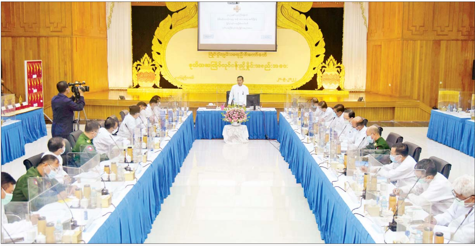
နိုင်ငံတော်စီမံအုပ်ချုပ်ရေးကောင်စီဒုတိယဥက္ကဋ္ဌ ဒုတိယဝန်ကြီးချုပ် ဒုတိယဗိုလ်ချုပ်မှူးကြီးစိုးဝင်း (၂၃)ကြိမ်မြောက် မြန်မာ့ရိုးရာယဉ်ကျေးမှု အဆို၊ အက၊ အရေး၊ အတီးပြိုင်ပွဲကျင်းပရေးဦးစီးကော်မတီ ဒုတိယအကြိမ်လုပ်ငန်းညှိနှိုင်းအစည်းအဝေးတွင် အမှာစကားပြောကြားစဉ်။

နေပြည်တော် စက်တင်ဘာ ၂၀ (၂၃)ကြိမ်မြောက် မြန်မာ့ရိုးရာ ယဉ်ကျေးမှု အဆို၊ အက၊ အရေး၊ အတီးပြိုင်ပွဲ ကျင်းပရေးဦးစီးကော်မတီ၏ ဒုတိယအကြိမ် လုပ်ငန်းညှိနှိုင်း အစည်းအဝေးကို ယနေ့မွန်လွဲ ၂ နာရီတွင် နေပြည်တော်ရှိ သာသနာရေးနှင့် ယဉ်ကျေးမှုဝန်ကြီးဌာန ယဉ်ကျေးမှုရတနာခန်းမ၌ ကိုဗစ်-၁၉ ရောဂါ ကာကွယ် တားဆီးရေးဆိုင်ရာ စည်းကမ်းချက်များနှင့် အညီ ကျင်းပရာ (၂၃)ကြိမ်မြောက် မြန်မာ့ရိုးရာယဉ်ကျေးမှု အဆို၊ အက၊ အရေး၊ အတီးပြိုင်ပွဲ ကျင်းပရေး ဦးစီးကော်မတီ နာယက နိုင်ငံတော်စီမံအုပ်ချုပ်ရေးကောင်စီဒုတိယဥက္ကဋ္ဌ ဒုတိယဝန်ကြီးချုပ် ဒုတိယဗိုလ်ချုပ်မှူးကြီး စိုးဝင်း တက်ရောက်အမှာစကား ပြောကြားသည်။ အစည်းအဝေးသို့ ပြည်ထောင်စုဝန်ကြီးများ၊ ဒုတိယဝန်ကြီးများ၊ စာမျက်နှာ ၃ ကော်လံ ၁ သို့ ။