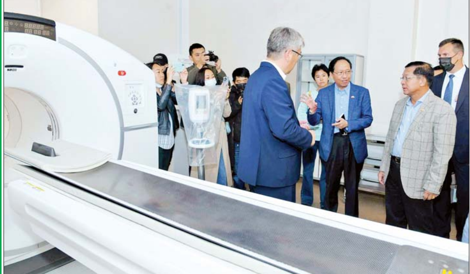
နိုင်ငံတော်စီမံအုပ်ချုပ်ရေးကောင်စီဥက္ကဋ္ဌ နိုင်ငံတော်ဝန်ကြီးချုပ် ဗိုလ်ချုပ်မှူးကြီးမင်းအောင်လှိုင် နျူကလီးယားဆေးဘက်ဆိုင်ရာစင်တာ ကင်ဆာရောဂါကုသမှုဌာနတွင် ကြည့်ရှုလေ့လာစဉ်။

RZD “Russian Railways” မီးရထားလုပ်ငန်းလမ်းခရီးရှိ RZD “Russian Railways” မီးရထားလုပ်ငန်း၏ RZD “International Railways” ကုမ္ပဏီတည်ရှိရာ Ulan-Ude ဘူတာသို့ ရောက်ရှိရာ General Director Mr. Sergey Stolyarov နှင့်အဖွဲ့ဝင်များက ကြိုဆို၍ ဘူတာရုံအတွင်း လိုက်လံရှင်းလင်းပြသသည်။ ရှင်းလင်းတင်ပြမှုတွင် RZD “Russian Railways” ကုမ္ပဏီ၏ လျှပ်စစ်စွမ်းအင်၊ ဒီဇယ်စွမ်းအင်၊ ဓာတ်ငွေ့စွမ်းအင် အသုံးပြုသည့် စက်ခေါင်းများ၊ ကိုယ်ထည်တွဲများထုတ်လုပ်ခြင်းအပါအဝင် နည်းပညာဆိုင်ရာဆောင်ရွက်ထားရှိမှုများ၊ မြန်မာနိုင်ငံနှင့်ပူးပေါင်းဆောင်ရွက်နိုင်မည့်အခြေအနေများကို ထည့်သွင်းရှင်းလင်းသည်။ နိုင်ငံတော်အကြီးအကဲကလည်း ပူးပေါင်းဆောင်ရွက်နိုင်မည့်အခြေအနေနှင့် သိရှိလိုသည့် မေးခွန်းများကို မေးမြန်းသည်။ စာမျက်နှာ ၇ သို့ >>>