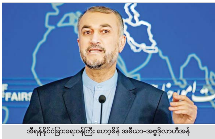
အီရန်နိုင်ငံခြားရေးဝန်ကြီး ဟော့စီန် အမီယာ-အဗ္ဗဒိုလာဟီအန်