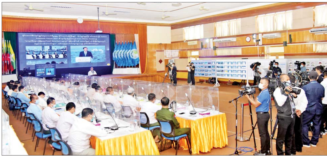
နိုင်ငံတော်စီမံအုပ်ချုပ်ရေးကောင်စီ သတင်းထုတ်ပြန်ရေးအဖွဲ့၏ (၂၀/၂၀၂၂)ကြိမ်မြောက် သတင်းစာရှင်းလင်းပွဲပြုလုပ်စဉ်။

“မြန်မာနိုင်ငံ သည် အရှေ့တောင် အာရှဒေသတွင် ယုံကြည် အားထားရသည့် ကာလရည် မိတ်ဖက်နိုင်ငံဖြစ်၊ မိမိတို့နှစ်နိုင်ငံ၏ ဆက်ဆံရေးနှင့် ပူးပေါင်း ဆောင်ရွက်မှုများသည် အလွန် တိုးတက်ကောင်းမွန် လျက်ရှိ”