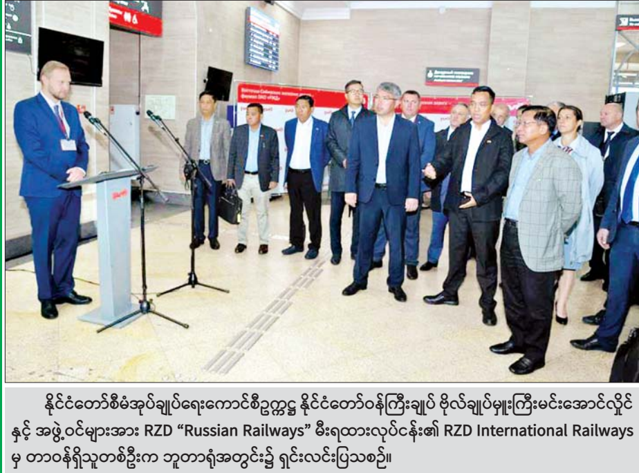
နိုင်ငံတော်စီမံအုပ်ချုပ်ရေးကောင်စီဥက္ကဋ္ဌ နိုင်ငံတော်ဝန်ကြီးချုပ် ဗိုလ်ချုပ်မှူးကြီးမင်းအောင်လှိုင် နှင့် အဖွဲ့ဝင်များအား RZD "Russian Railways" မီးရထားလုပ်ငန်း၏ RZD International Railways မှ တာဝန်ရှိသူတစ်ဦးက ဘူတာရုံအတွင်း၌ ရှင်းလင်းပြသစဉ်။

သတင်းမီဒီယာများထက်တွင် မီးရှူး၊ မီးပန်း ပစ်ဖောက်မှုကို အကြီးအကဲမှ ကြည့်ရှုအားပေးနေ သည့် သတင်းစာသားနှင့် ဓာတ်ပုံကိုသာ မြင်တွေ့နိုင် သည်။ ရုရှား- မြန်မာနှစ်နိုင်ငံ၏ ချစ်ကြည်ရင်းနှီးမှု အပြန်အလှန်လေးစားယုံကြည်မှု၊ နားလည်မှုတို့ကို မမြင်နိုင်။ သို့သော် နှစ်နိုင်ငံလုံးရှိ အကြီးအကဲ များအပါအဝင် အပြုသဘောဆောင်သူတို့ကမူ တီတိကျကျပင် သိမြင်ခံစားနေလိမ့်မည်မှာ မလွဲဟု ယုံကြည်ရေးသားဖော်ပြအပ်ပါသည်။