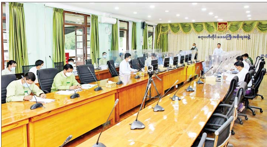
နှင့် ကော်မတီအဖွဲ့ဝင်များ၏ အထွေထွေဆွေးနွေး တင်ပြချက်များအပေါ် ပေါင်းစပ်ညှိနှိုင်းဆောင်ရွက်ပေးခဲ့ကြောင်း သိရသည်။ တိုင်းဒေသကြီး(ပြန်/ဆက်)

ဝန်ကြီးချုပ်ဦးတင်မောင်ဝင်းက “ကိုဗစ်-၁၉ရောဂါ ပြန့်လွှာနေသည့်အတွက် ကိုဗစ်-၁၉ ရောဂါ ကာကွယ်ရေးဆိုင်ရာ စည်းကမ်းများနှင့်အညီ လိုက်နာဆောင်ရွက်ကြရန်လိုကြောင်း၊ တိုင်းဒေသကြီးအတွင်း၌ ကိုဗစ်-၁၉ ရောဂါကာကွယ်ဆေးများ သက်တမ်းမကုန်မီ အချိန်မီထိုးနှံပြီးစီးစေရေး အလေးထားဆောင်ရွက်ပေးလျက်ရှိကြောင်း ပြောကြားသည်။ ဆွေးနွေးတင်ပြ ဆက်လက်၍ တိုင်းဒေသကြီး ပြည်သူ့ကျန်းမာရေးဦးစီးဌာနမှူးက တိုင်းဒေသကြီးအတွင်းရှိ မြို့နယ်များအလိုက် ရောဂါပိုးတွေ့ရှိမှုအခြေအနေများ၊ ဆေးရုံများ၌ ကုသပေးနေမှုအခြေအနေများနှင့် ကာကွယ်ဆေးထိုးနှံပြီးစီးမှုအခြေအနေများအား ဆွေးနွေးတင်ပြသည်။ ယင်းနောက် ခရိုင် ကိုဗစ်-၁၉ ရောဂါ ထိန်းချုပ်ရေးနှင့် အရေးပေါ်တုံ့ပြန်ရေး ကော်မတီဥက္ကဋ္ဌများ