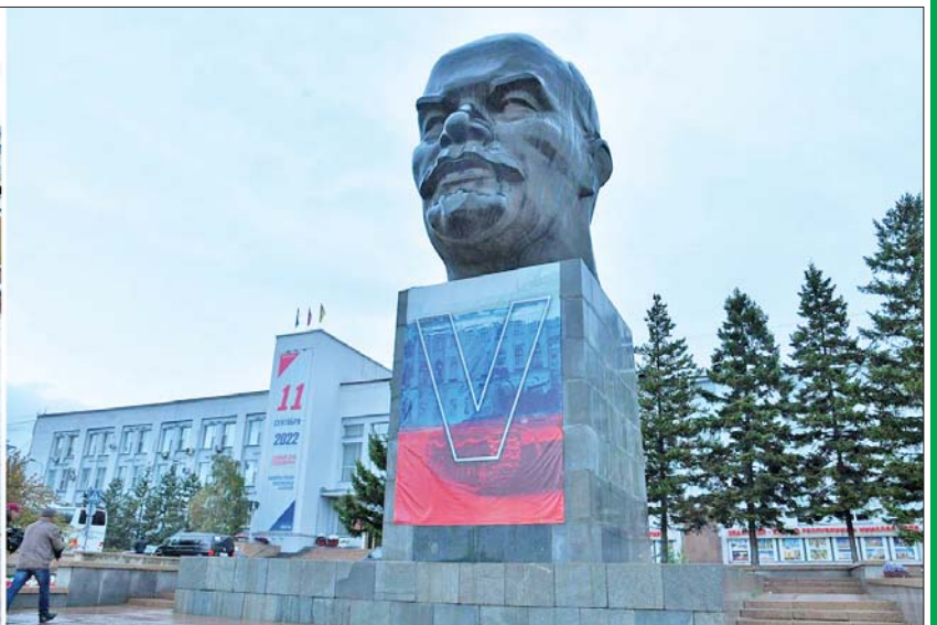
နိုင်ငံတော်စီမံအုပ်ချုပ်ရေးကောင်စီဥက္ကဋ္ဌ နိုင်ငံတော်ဝန်ကြီးချုပ် ဗိုလ်ချုပ်မှူးကြီးမင်းအောင်လှိုင်နှင့် အဖွဲ့ဝင်များ Ulan-Ude မြို့ရှိ ဆိုဗီယက်ရင်ပြင်တွင် ကြည့်ရှုလေ့လာကြစဉ်။

အကြီးအကဲကလည်း မြန်မာ့မီးရထား၏အခြေအနေအပေါ်မူတည်၍ သိရှိလိုသည့် မေးခွန်းများ မေးမြန်းရာ တာဝန်ရှိသူများက ရှင်းလင်းတင်ပြကြသည်။ ရထားပြင်ဆင်ရေးအလုပ်ရုံတွင် လေ့လာမှုအပြီး၌ Ulan-Ude မြို့ ဘူတာရုံမှတစ်ဆင့် Irkutsk မြို့သို့ ရထားဖြင့်သွားရောက်သည်။ သာမန်ခရီးသည်တင်ရထားမဟုတ်ဘဲ ရုရှားဖက်ဒရေးရှင်းနိုင်ငံ၏ သမ္မတပူတင်အပါအဝင် နိုင်ငံအကြီးအကဲများကိုသာ စီစဉ်ပေးသည့်ရထားဖြစ်သည့်အတွက် အဆင့်မြင့်ရထားဖြစ်သည့်အတွက် အဆင့်မြင့်လှ