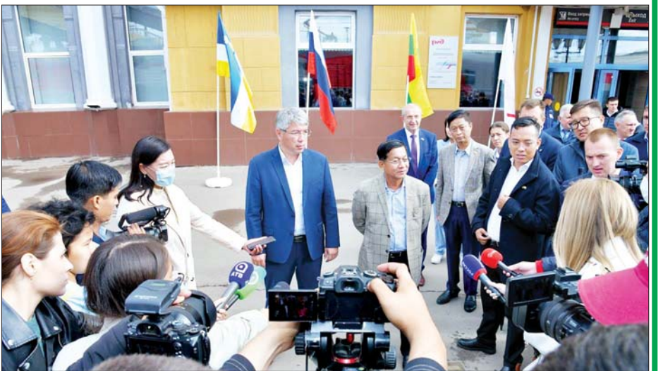
နိုင်ငံတော်စီမံအုပ်ချုပ်ရေးကောင်စီဥက္ကဋ္ဌ နိုင်ငံတော်ဝန်ကြီးချုပ် ဗိုလ်ချုပ်မှူးကြီးမင်းအောင်လှိုင် Republic of Buryatia ပြည်နယ်မှ သတင်းမီဒီယာများ၏ မေးမြန်းမှုများကို ဖြေကြားစဉ်။

မြန်မာနိုင်ငံနှင့် Irkutsk ပြည်နယ်တို့ကြား မဟာဗျူဟာမြောက် စီးပွားရေးဆိုင်ရာ ရင်းနှီးမြှုပ်နှံ မှု၊ ပူးပေါင်းဆောင်ရွက်မှုတို့ကို အောင်မြင်စွာ ဆောင်ရွက်နိုင်မည့် အလားအလာကောင်းများ ရှိနေသည့်အခြေအနေကို ဆွေးနွေးမှုတွင် စီးပွားရေး လုပ်ငန်းရှင်များ စိတ်ဝင်စားမှု ပိုမိုမြင့်လာသည်ကို သတိပြုမိသည်။ စိုက်ပျိုး၊ မွေးမြူရေးလုပ်ငန်းများ လုပ်ကိုင်နိုင်မှုအခြေအနေ၊ မြေပေါ်မြေအောက် သယ်စာတရား ထုတ်လုပ်နိုင်မှု သဘာဝအလှူတရား များပြည့်စုံသည့်နိုင်ငံ ဖြစ်သည့်အတွက် ကမ္ဘာလှည့် ခရီးသွားများနှင့် ခရီးသွားလုပ်ငန်းတိုးတက်ဖွံ့ဖြိုး နိုင်မှု၊ ရင်းနှီးမြှုပ်နှံမှုများကို အောင်မြင်စွာဆောင်ရွက် နိုင်သည့်အခြေအနေ စသည့်အကြောင်းအရာများကို