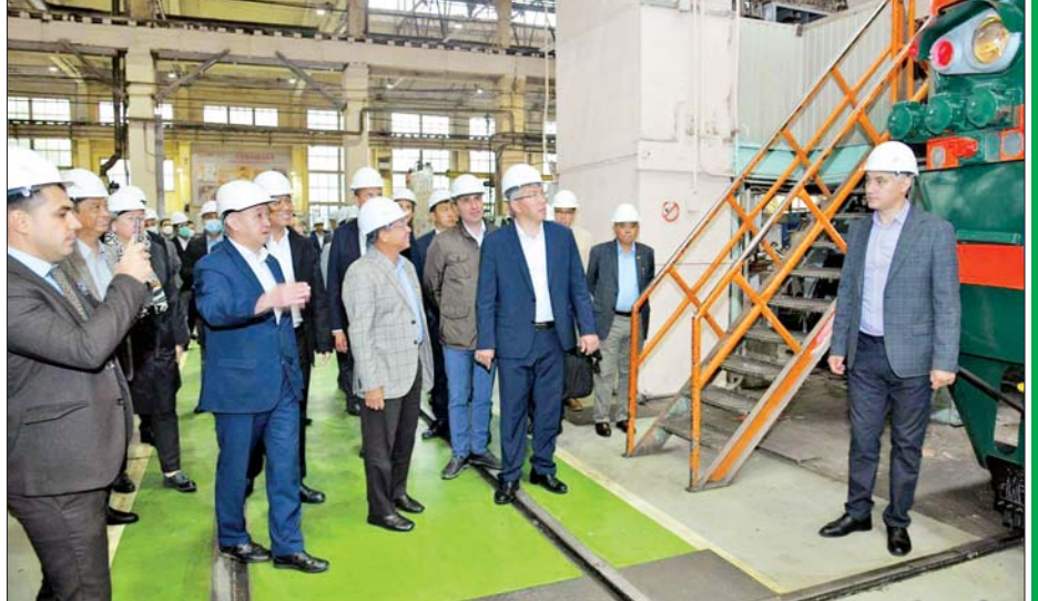
နိုင်ငံတော်စီမံအုပ်ချုပ်ရေးကောင်စီဥက္ကဋ္ဌ နိုင်ငံတော်ဝန်ကြီးချုပ် ဗိုလ်ချုပ်မှူးကြီးမင်းအောင်လှိုင် နှင့်အဖွဲ့ဝင်များ Ulan-Ude မြို့ ရထားစက်ခေါင်းပြင်ဆင်ရေးအလုပ်ရုံတွင် ကြည့်ရှုလေ့လာကြစဉ်။