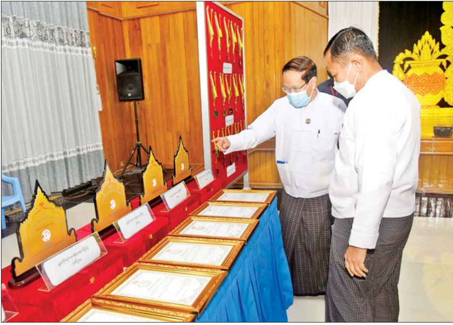
နိုင်ငံတော်စီမံအုပ်ချုပ်ရေးကောင်စီဒုတိယဥက္ကဋ္ဌ ဒုတိယဝန်ကြီးချုပ် ဒုတိယဗိုလ်ချုပ်မှူးကြီးစိုးဝင်း (၂၃)ကြိမ်မြောက် မြန်မာ့ရိုးရာယဉ်ကျေးမှု အဆို၊ အက၊ အရေး၊ အတီး ပြိုင်ပွဲကျင်းပနိုင်ရေး ကြိုတင်ပြင်ဆင်ထားမှုများအား ကြည့်ရှုစစ်ဆေးစဉ်။

အမှာစကားပြောကြား ဦးစွာ နိုင်ငံတော်စီမံအုပ်ချုပ်ရေးကောင်စီ ဒုတိယဥက္ကဋ္ဌ ဒုတိယဝန်ကြီးချုပ်က အမှာစကားပြောကြားရာတွင် ယနေ့မျက်မှောက် ကမ္ဘာတွင် နည်းပညာများနှင့် ရုပ်ဝတ္ထုပစ္စည်းများ အရှိန်အဟုန်ဖြင့် လျင်မြန်စွာ ပြောင်းလဲတိုးတက်နေကြောင်း၊ ထိုအရာများတွင် နယ်စည်းမခြားသော ပွင့်လင်းလွတ်လပ်မှုဆိုသည့် အယူအဆများနှင့်အတူ လူမှုကွန်ရက်ဆိုရှယ်မီဒီယာများသည် အရေးပါသည့် အခန်းကဏ္ဍတစ်ခုဖြစ်လာကြောင်း၊ ထိုလူမှုကွန်ရက်များကို အသုံးပြု၍ ပညာရေးနှင့်ကျန်းမာရေးတို့တွင် ကောင်းသောအကျိုးကို ဆောင်ရွက်နိုင်သကဲ့သို့ မိမိနိုင်ငံ၏ နိုင်ငံရေး၊ စီးပွားရေး၊ လုံခြုံရေးနှင့် လူမှုရေးသာမက ယဉ်ကျေးမှုရေးရာ အခန်းကဏ္ဍများအထိ မှေးမှိန်သေးသိမ်အောင်၊ ညစ်နွမ်းအောင် ဝင်ရောက်ထိုးဖောက်မှုနှောင့်နှေးနိုင်သည့် အကြောင်းခြင်းရာများလည်း ရှိနေကြောင်း။