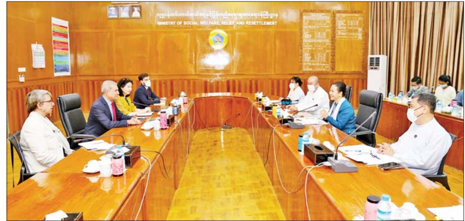
ပြည်ထောင်စုဝန်ကြီး ဒေါက်တာသက်သက်ခိုင် ကုလသမဂ္ဂဒုက္ခသည်များဆိုင်ရာမဟာမင်းကြီးရုံး (UNHCR)၏ အာရှ-ပစိဖိတ် ဒေသဆိုင်ရာ ဗျူရိုညွှန်ကြားရေးမှူး Mr.Indrika Ratwatte ဦးဆောင်သောအဖွဲ့ကို လက်ခံတွေ့ဆုံစဉ်။

စနစ် (Social Management Information System-SMIS) Software စနစ်သစ်အသုံးပြုခြင်းဆိုင်ရာ သင်တန်းဖွင့်ပွဲအခမ်းအနားတွင် ပြည်ထောင်စုဝန်ကြီးက အဖွင့်အမှာစကားပြောကြားရာတွင် ထိုသို့ထည့်သွင်းပြောကြားခဲ့ခြင်းဖြစ်သည်။ ဆက်လက်၍ ပြည်ထောင်စုဝန်ကြီးက လူမှုဝန်ထမ်းဦးစီးဌာနမှ ၂၀၂၂-၂၀၂၃ ဘဏ္ဍာနှစ်အတွင်း အကောင်အထည်ဖော်ဆောင်ရွက်မည့် လူမှုရေးစီမံခန့်ခွဲမှုဆိုင်ရာ သတင်းအချက်အလက် စနစ် (Social Management Information System-SMIS) Software ကို တပ်မတော်ကွန်ပျူတာပညာရှင်များက နည်းပညာပိုင်းဆိုင်ရာ ကူညီမှုများကြောင့် ယနေ့ကဲ့သို့ အကောင်အထည်ဖော် အောင်မြင်ခဲ့ခြင်းဖြစ်ကြောင်း။ SMIS Software ဖြင့် လူမှုဝန်ထမ်းဦးစီးဌာနမှ ဆောင်ရွက်