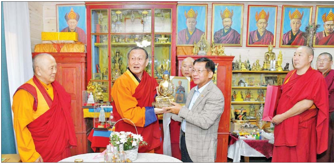
နိုင်ငံတော်စီမံအုပ်ချုပ်ရေးကောင်စီဥက္ကဋ္ဌ နိုင်ငံတော်ဝန်ကြီးချုပ် ဗိုလ်ချုပ်မှူးကြီးမင်းအောင်လှိုင်အား မဟာယာနဗုဒ္ဓဘာသာခေါင်းဆောင်ဆရာတော်ကြီး Damba Bandmaeich Ayusheev က ဓမ္မလက်ဆောင်များ ပြန်လည်ပေးအပ်စဉ်။