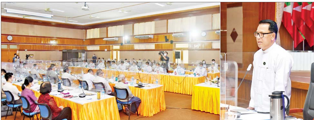
ပြည်ထောင်စုဝန်ကြီး ဦးမောင်မောင်အုန်း ရုပ်သံထုတ်လွှင့်လျက်ရှိသည့် အဖွဲ့အစည်းများမှ တာဝန်ရှိသူများ တွေ့ဆုံပွဲတွင် အမှာစကား ပြောကြားစဉ်။

ယနေ့အချိန်တွင် အချို့မီဒီယာများသည် သတင်းအမှားများ၊ ကောလာဟလများကို ဖြန့်ဝေထုတ်လွှင့်နေသည့်အတွက် ပြည်သူများ ကို ထိခိုက်မှုများစွာဖြစ်ပေါ်စေကြောင်း၊ ထိုသို့သတင်းမှားများ၊ ကောလာ ဟလများကို လူမှုမီဒီယာပလက်ဖောင်းမျိုးစုံမှ ဖြန့်ဝေနေမှုကြောင့်