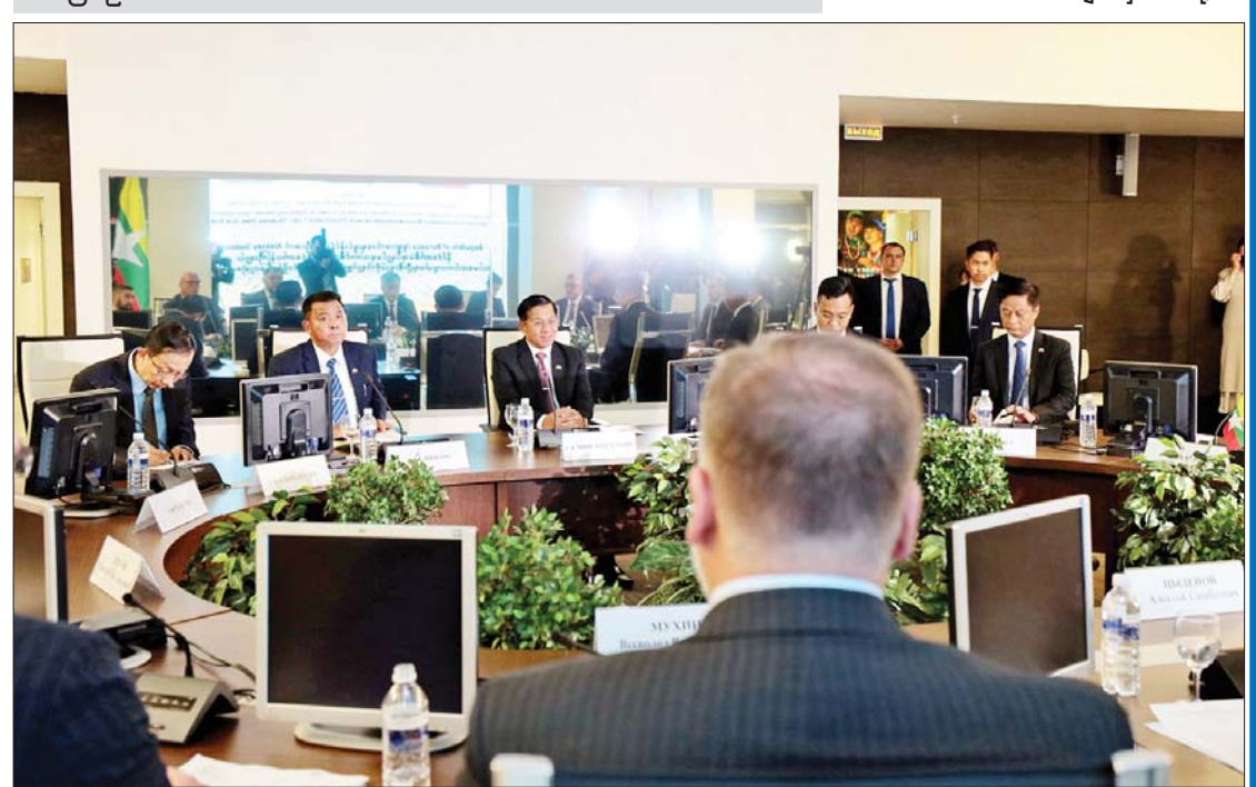
နိုင်ငံတော်စီမံအုပ်ချုပ်ရေးကောင်စီဥက္ကဋ္ဌ နိုင်ငံတော်ဝန်ကြီးချုပ် ဗိုလ်ချုပ်မှူးကြီးမင်းအောင်လှိုင်နှင့် Republic of Buryatia ပြည်နယ်အစိုးရအဖွဲ့အကြီးအကဲ Aleksey Sambuyevich Tsydenov တို့ တွေ့ဆုံဆွေးနွေးစဉ်။

ကမ္ဘာပေါ်ရှိ ကျောက်ဆစ်ရုပ်ပွားတော်များအနက် ဉာဏ်တော်အမြင့်ဆုံးဖြစ်လာမည့် ရုပ်ပွားတော်ကြီး တည်ဆောက်မှုအခြေအနေ၊ ရုပ်ပွားတော်ကြီး တည်ဆောက်ပူဇော်မှုနှင့်အတူ ဗုဒ္ဓဘုရားရှင်၏ နှုတ်ကပိဋ်တော်များအား ကျောက်စာချပ်များတွင် ရေးထိုးပူဇော်နေမှု၊ ရေးထိုးပူဇော်ရာတွင် ပါဠိအက္ခရာ၊ Romanize Language တို့ဖြင့် ခေတ်မီစက်ကိရိယာများ အသုံးပြုရေးထိုးနေမှု၊ ရေးထိုးပြီးစီးချိန်တွင် ကျောက်စာရုံစေတီများဖြင့် တည်ထားပူဇော်ရန် ဆောင်ရွက်နေမှုများကို လျှောက်ထား။