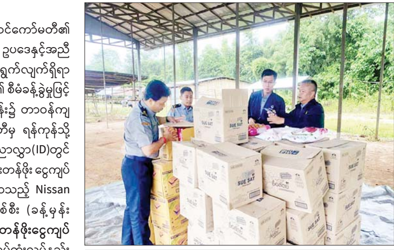
ရှမ်းပြည်နယ်အတွင်း သိမ်းဆည်းရမိမှု။

တန် (ခန့်မှန်းတန်ဖိုးငွေကျပ် ၁၁၄၄၀၉၄) ကို သိမ်းဆည်းရမိခဲ့ပြီး သစ်တောဥပဒေနှင့်အညီ အရေးယူဆောင်ရွက်လျက်ရှိသည်။ ထို့အပြင် စက်တင်ဘာ ၁၉ ရက်တွင် ကရင်ပြည်နယ် ကော့ကရိတ် (တံတားကျိုး) စုပေါင်းစစ်ဆေးရေးစခန်း၌ တာဝန်ကျပူးပေါင်းအဖွဲ့က စစ်ဆေးမှုများဆောင်ရွက်ခဲ့ရာ သွင်းကုန်ကြေညာလွှာ (ID) တွင် ကြေညာထားခြင်းမရှိသည့် လျှပ်စစ်ထမင်းပေါင်းအိုးများ (ခန့်မှန်းတန်ဖိုးငွေကျပ် ၁၉၅၀၀၀၀) ကို သိမ်းဆည်းရမိခဲ့ပြီး အကောက်ခွန် လုပ်ထုံးလုပ်နည်းနှင့်အညီ အရေးယူဆောင်ရွက်လျက်ရှိသည်။ သို့ဖြစ်ပါ၍ စက်တင်ဘာ ၁၇ ရက်၊ ၁၈ ရက်နှင့် ၁၉ ရက်တို့တွင် ဖမ်းဆီးရမိမှုစုစုပေါင်းမှာ အမှုတွဲ ခုနစ်မှု (ခန့်မှန်းတန်ဖိုးငွေကျပ် ၅၇၈၁၀၉၄) ဖြစ်ကြောင်း တရားမဝင်ကုန်သွယ်မှုတိုက်ဖျက်ရေး ဦးဆောင်ကော်မတီမှ သိရသည်။ သတင်းစဉ်