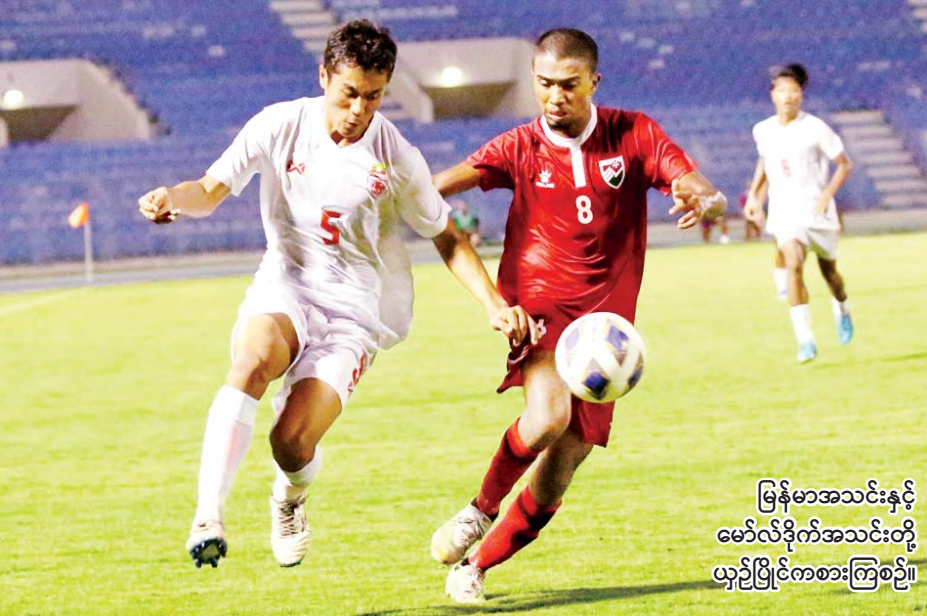
မြန်မာအသင်းနှင့် မော်လဒိုက်အသင်းတို့ ယှဉ်ပြိုင်ကစားကြစဉ်။