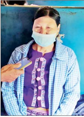
ဒေါ်မြမြဌေး