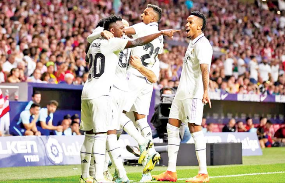
စာမျက်နှာ ၂၂ ကော်လံ ၁ သို့ ၀

အဲဒီပွဲစဉ်မှာ ရီးယဲလ်မက်ဒရစ် အသင်းက ပွဲကစားချိန် ၁၈ မိနစ် မှာ ရီဒရိုဂိုရဲ့ သွင်းဂိုးနဲ့ ၃၆ မိနစ် မှာ ဗယ်လ်ဗာဒီရဲ့ သွင်းဂိုးတွေ ရရှိခဲ့ပြီး အက်သလက်တီကို မက်ဒရစ်အသင်းကတော့ ဒုတိယ ပိုင်း ပွဲကစားချိန် ၈၃ မိနစ်ရောက်မှ မာရီယိုဟာမီဆိုရဲ့ သွင်းဂိုးနဲ့ ချေပဂိုးတစ်ဂိုး ရရှိခဲ့တာဖြစ် ပါတယ်။ ရီးယဲလ်မက်ဒရစ် ကစားသမား ရီဒရိုဂိုဟာ အခုပွဲစဉ် မှာ ဂိုးသွင်းယူနိုင်ခဲ့တာကြောင့် အခုနှစ်ဘောလုံးရာသီ လာလီဂါ ငါးပွဲမှာ သွင်းဂိုးသုံးဂိုးသွင်းယူ ထားသူလည်း ဖြစ်ပါတယ်။