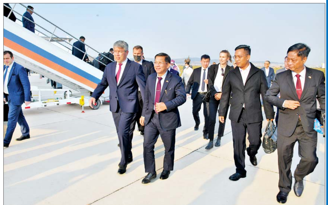
နိုင်ငံတော်စီမံအုပ်ချုပ်ရေးကောင်စီဥက္ကဋ္ဌ နိုင်ငံတော်ဝန်ကြီးချုပ် ဗိုလ်ချုပ်မှူးကြီး မင်းအောင်လှိုင်အား Republic of Buryatia ပြည်နယ် Ulan-Ude မြို့ Baikal လေဆိပ်၌ Republic of Buryatia ပြည်နယ်အစိုးရအဖွဲ့အကြီးအကဲ Aleksey Sambuyevich Tsydenov နှင့် တာဝန်ရှိသူများက ကြိုဆိုနှုတ်ဆက်ကြစဉ်။

မြန်မာနိုင်ငံမှ ပညာသင်များအနေဖြင့် လေ့လာသင်ယူမှုကို ပြုခဲ့ကြပြီးဖြစ်သည်။ မဝေးတော့သည့်ကာလတွင် လက်တွေ့လုပ်ငန်းခွင်နှင့် ပေါင်းစပ်၍ အမိမြန်မာနိုင်ငံအတွက် ရလဒ်ကောင်းများ ယူဆောင်ပေးရမည်ကို အကြီးအကဲအနေဖြင့် ယုံကြည်မှုရှိသည်။ အကြီးအကဲအနေဖြင့် မည်သည်တို့ကို စီမံပေးရမည်၊ မည်သည်တို့ကို ဖြည့်ဆည်းပေးရမည် စသည်တို့အတွက် မေးခွန်းများဖြင့် လေ့လာစူးစမ်းသည်။