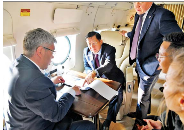
နိုင်ငံတော်စီမံအုပ်ချုပ်ရေးကောင်စီဥက္ကဋ္ဌ နိုင်ငံတော်ဝန်ကြီးချုပ် ဗိုလ်ချုပ်မှူးကြီးမင်းအောင်လှိုင်အား Republic of Buryatia ပြည်နယ်အစိုးရအဖွဲ့အကြီးအကဲ Aleksey Sambuyevich Tsydenov က ၎င်းတို့ပြည်နယ်မှ နောက်ဆုံးအဆင့်မြင့်တင်ထုတ်လုပ်ထားသည့် ရဟတ်ယာဉ်ကို လေဆိပ်၌ လိုက်လံပြသခဲ့ပြီး အတွင်းပိုင်း၊ အပြင်ပိုင်း ပြင်ဆင်ထားရှိမှုနှင့် စွမ်းဆောင်ရည်များကို ရှင်းလင်းတင်ပြစဉ်။

ဖက်ဒရေရှင်းနိုင်ငံအတွင်း သာမက ကမ္ဘာ့အဆင့်ထိ ဗုဒ္ဓသာသနာတော် ထွန်းကားရေး အထောက်အကူပြုမှုကို လည်း အားပါးတရမိန့်သည်။ စေတီကြီးတည်ထားမှုမှာ ရုရှားဖက်ဒရေရှင်းနိုင်ငံတွင် ပထမဆုံးသော ဗုဒ္ဓသာသနာ၏ စေတီပုထိုးဖြစ်သည့်အတွက် ဆရာတော်၏ မျှော်လင့်ချက်၊ မိန့်ကြားချက်မှာ အားရဝမ်းသာဟန် အပြည့်ရှိနေသည်မှာ မထူးဆန်းလှ။