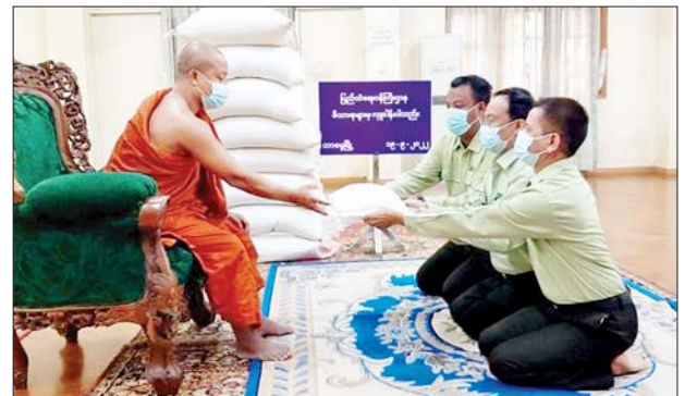
ဆန်ကြာဆံများကိုလည်းကောင်း ဆရာတော်၊ သံဃာတော်များအတွက် တာဝန်ရှိသူများက သွားရောက်ဆက်ကပ်လှူဒါန်းခဲ့ကြကြောင်း သိရ သည်။

ဒေသကြီး တာမွေမြို့နယ်ရှိ အောင်မြေဗောဓိဓမ္မရိပ်သာ အလိုတော် ပြည့်ကျောင်းတိုက်၊ မင်္ဂလာဒုံမြို့နယ်ရှိ ရွှေဘုန်းရိပ်စာသင်တိုက်၊ ရွှေပြည်သာမြို့နယ်ရှိ လိုတရဟာသီတကျောင်းတိုက်နှင့် ဧရာဝတီ တိုင်းဒေသကြီး ပုသိမ်မြို့နယ်ရှိ ရွှေတောင်ပရိယတ္တိစာသင်တိုက်များသို့ ဆွမ်းဆန်တော်များကိုလည်းကောင်း၊ ကရင်ပြည်နယ် ဘားအံမြို့နယ်ရှိ ခေမာရာမကျောင်းတိုက်၊ မန္တလေးတိုင်းဒေသကြီး ချမ်းအေးသာစံ မြို့နယ်ရှိ ဣစ္စာသယကျောင်းတိုက်၊ ပြည်ကြီးတံခွန်မြို့နယ်ရှိ မဟာ ကိုးဆူကျောင်းတိုက်၊ ရခိုင်ပြည်နယ် စစ်တွေမြို့နယ်ရှိ တန်ခိုးပရိယတ္တိ စာသင်တိုက်၊ ရန်ကုန်တိုင်းဒေသကြီး ဗဟန်းမြို့နယ်ရှိ ညောင်တုန်း ကျောင်းတိုက်၊ ရှမ်းပြည်နယ် တောင်ကြီးမြို့နယ်ရှိ အေးမြဂရုဏာ ကျောင်းတိုက်နှင့် လားရှိုးမြို့နယ်ရှိ ဓမ္မရတနာ ကျောင်းတိုက်များသို့