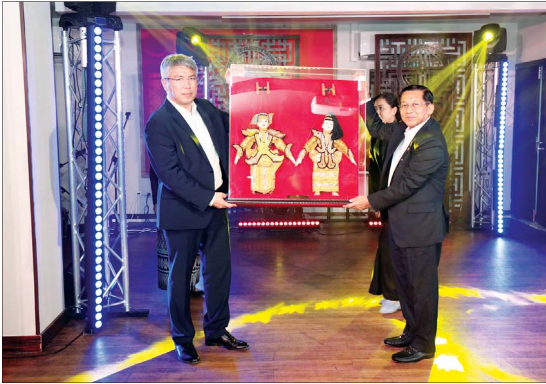
နိုင်ငံတော်စီမံအုပ်ချုပ်ရေးကောင်စီဥက္ကဋ္ဌ နိုင်ငံတော်ဝန်ကြီးချုပ် ဗိုလ်ချုပ်မှူးကြီးမင်းအောင်လှိုင်နှင့် Republic of Buryatia ပြည်နယ်အစိုးရအဖွဲ့အကြီးအကဲ Aleksey Sambuyevich Tsydenov တို့ အမှတ်တရလက်ဆောင်ပစ္စည်းများ အပြန်အလှန်ပေးအပ်စဉ်။

ဆရာ၊ ဒကာသဖွယ်အပြန်အလှန် မိန့်ကြားမှု၊ လျှောက်တင်မှု၏အပြီးတွင် အကြီးအကဲ ခေါင်းဆောင်ဆရာ တော်ကြီးအား ဗုဒ္ဓရုပ်ပွားတော်များ ဆက်ကပ်လှူဒါန်းသည်။ အကြီးအကဲ ဦးဆောင်သည့်အဆင့်မြင့်ကိုယ်စားလှယ် အဖွဲ့၏ စုပေါင်းလှူဒါန်းငွေများကိုလည်း ဆရာတော်ကြီးထံ ဆက်ကပ်လှူဒါန်းရာ ဆရာတော်ကြီးနှင့် သံဃာတော်များက လက်ခံတော်မူပြီးနောက် အားလုံးက သာဓုခေါ်သည်။ ဆရာတော်ကြီးကလည်း တို့နှင့်သည့်မေတ္တာအဖြစ် ဓမ္မလက်ဆောင်များ ပြန်လည်စွန့်ကြဲသည့် အတွက် သာဓုခေါ်ဆိုသံကမမစ်လှ။ တိုင်း တစ်ပါးနယ်မြေ၊ တစ်နည်းအားဖြင့် ဗုဒ္ဓဘာသာကိုးကွယ်မှု နည်းပါးလှသည့်မြေ တွင် သာဓုခေါ်ဆိုသံကား ကြည်နူးဖွယ် ကောင်းလှသည်။ ၁၉၄၅ ခုနှစ်တွင် စတင် တည်ထောင်ခဲ့ပြီး လက်ရှိကာလတွင် ရှေးဟောင်းရေးရှင်းနိုင်ငံမှ ဗုဒ္ဓဘာသာဝင် များ၏ ဌာနချုပ်သဖွယ် တည်ရှိနေသည့် ကျောင်းတော်ကြီးမှ အဆင့်မြင့်ကိုယ်စား လှယ်အဖွဲ့ ပြန်လည်ထွက်ခွာချိန်သည် ညနေပင် အတော်စောင်းလှပြီဖြစ်သည်။