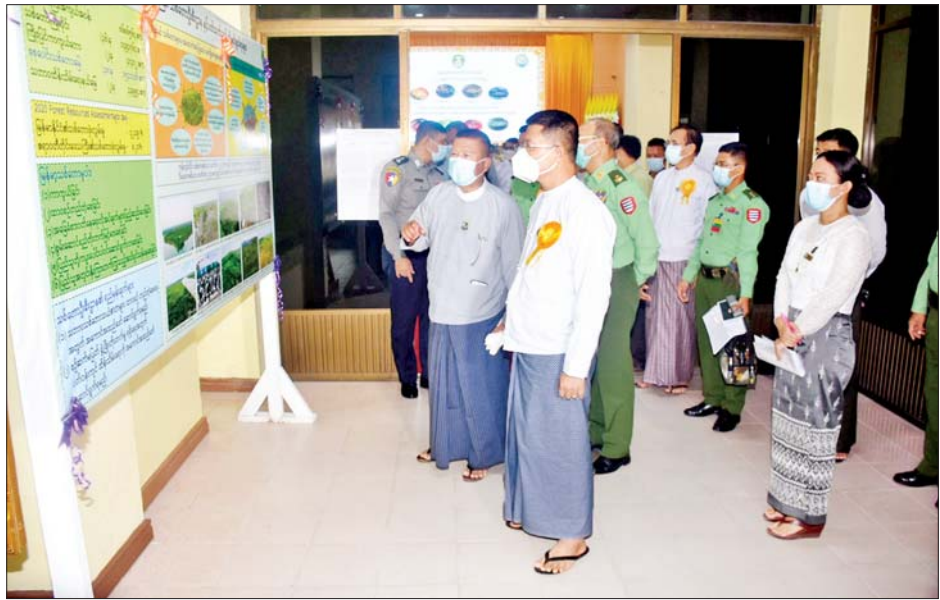
နိမ့် ခြပ်ပစ္စည်းများ အစားထိုးအသုံးပြုခြင်းဖြင့် ပိုမို ခြင်းဖြစ်ကြောင်း၊ ကောင်းမွန်သာယာလှပပြီး အေးမြသည့်ကမ္ဘာကြီးဖြစ်လာစေရန် ရည်ရွယ်ပြုလုပ် သန့်ရှင်းသည့်ကမ္ဘာကြီးကို ပစ္စုပ္ပန်နှင့် အနာဂတ်

ပုသိမ် စက်တင်ဘာ ၁၉ ဧရာဝတီတိုင်းဒေသကြီး ပုသိမ်မြို့ မြို့တော်ခန်းမ၌ ၂၀၂၂ ခုနှစ် ကမ္ဘာ့အိုဇုန်းလွှာထိန်းသိမ်းရေးနေ့အထိမ်းအမှတ်အခမ်းအနားကို ယနေ့နံနက်ပိုင်းက ပြုလုပ်ရာ ဧရာဝတီတိုင်းဒေသကြီးဝန်ကြီးချုပ်ဦးတင်မောင်ဝင်း၊ အနောက်တောင်တိုင်းစစ်ဌာနချုပ်တိုင်းမှူး၊ တိုင်းဒေသကြီးအစိုးရအဖွဲ့ဝင်ဝန်ကြီးများ၊ တိုင်း၊ ခရိုင်၊ မြို့နယ်အဆင့် ဌာနဆိုင်ရာများနှင့် ဖိတ်ကြားသော ဧည့်သည်တော်များ တက်ရောက်ကြသည်။