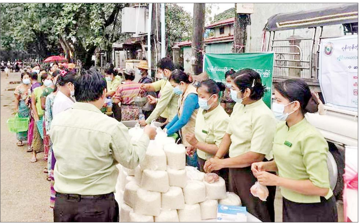
ရန်ကုန်တိုင်းဒေသကြီးအတွင်းရှိ မြို့နယ်များ၌ ဆန်၊ ဆီ၊ ဆား၊ ကြက်ဥ၊ ဟင်းသီးဟင်းရွက်များနှင့် စားသောက်ကုန်ပစ္စည်းများကို သက်သာသောဈေးနှုန်းများဖြင့် ရောင်းချစဉ်။

ဆန်၊ ဆီ၊ ဆား၊ ကြက်ဥ၊ ဟင်းသီးဟင်းရွက်များနှင့် စားသောက်ကုန်ပစ္စည်းများကို သက်သာသောဈေးနှုန်းများဖြင့် ရောင်းချ နေပြည်တော် စက်တင်ဘာ ၁၉ ကိုဗစ်-၁၉ ရောဂါကာကွယ်ရေးလုပ်ငန်း များ ဆောင်ရွက်နေသည့်ကာလအတွင်း ဒေသတွင်းစားနပ်ရိက္ခာဖူလုံရေး၊ စစ်မှုထမ်း ဟောင်းအဖွဲ့ဝင်များ၊ ဌာနဆိုင်ရာဝန်ထမ်းများ နှင့် ဒေသခံပြည်သူများ စားသောက်ရေး အထောက်အကူဖြစ်စေရန် ရည်ရွယ်၍ တိုင်းစစ်ဌာနချုပ်နယ်မြေများရှိ မြို့နယ် အသီးသီး၌ နယ်မြေခွဲတပ်မတော်သားများက တန်ဖိုးသင့်ထမင်းဟင်းများ၊ ဟင်းသီးဟင်းရွက် များနှင့် တပ်မတော်စက်ရုံထုတ် အသား၊ ငါးဘူး များနှင့် စားသောက်ကုန်ပစ္စည်းများကို ရောင်းချ ပေးလျက်ရှိသည်။ ထိုသို့ ရောင်းချပေးလျက်ရှိရာ ယနေ့တွင် ကချင်ပြည်နယ်အတွင်းရှိ မြို့နယ် ရှစ်မြို့နယ်၊ ရှမ်းပြည်နယ်(မြောက်ပိုင်း)အတွင်းရှိ မြို့နယ် ခုနစ်မြို့နယ်၊ ရှမ်းပြည်နယ်(အရှေ့ပိုင်း) ကျိုင်းတုံမြို့နှင့် မိုင်းခတ်မြို့၊ ရန်ကုန်တိုင်း ဒေသကြီး ခရိုင်များအတွင်းရှိ မြို့နယ် ၄၄ မြို့နယ်၊ ရခိုင်ပြည်နယ် စစ်တွေမြို့၊ အမ်းမြို့၊ ဝှမြို့၊ စာမျက်နှာ ၃ ကော်လံ ၄ သို့ *