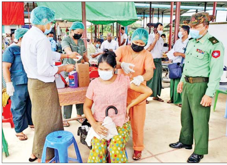
အုတ်တိုင်းမြို့နယ်အတွင်းရှိ ဒေသခံပြည်သူများအား ကိုဗစ်-၁၉ ရောဂါ ကာကွယ်ဆေး ထိုးနှံပေးစဉ်။

နေပြည်တော် စက်တင်ဘာ ၁၉ တိုင်းဒေသကြီးနှင့် ပြည်နယ် အသီးသီးတို့၌ ကာကွယ်ဆေးထိုးနှံခြင်းကို ဆောင်ရွက်လျက်ရှိရာ ယနေ့တွင် ရန်ကင်းတိုင်းဒေသကြီး တာမွေမြို့နယ် နှင့် ရန်ကင်းမြို့နယ်တို့၌ ဒေသခံပြည်သူ ၃၆၅ ဦး၊ ဧရာဝတီတိုင်းဒေသကြီး အတွင်းရှိ မြို့နယ် ၂၆ မြို့နယ်တို့၌ ဒေသခံပြည်သူ ၈၀၀ ဦး၊ ရခိုင်ပြည်နယ် အတွင်းရှိ မြို့နယ် ၁၃ နှင့် ပဲခူးတိုင်း ဒေသခံပြည်သူ ၁၃၈၂ ဦး၊ မန္တလေးတိုင်း ဒေသကြီးအတွင်းရှိ ခရိုင် ၃ နှစ်ခရိုင်တို့၌ ဒေသခံပြည်သူ ၁၄၅၇၀ ဦးနှင့် ပဲခူးတိုင်း ဒေသကြီး တောင်ငူမြို့နယ်နှင့် အုတ်တိုင်း မြို့နယ်တို့၌ ဒေသခံပြည်သူ ၂၃၄ ဦး တို့ကို တပ်မတော်မှဆေးအဖွဲ့များက ပြည်သူ့ဆေးရုံများမှ ဆရာဝန်များ၊ သက်ဆိုင်ရာ ကျန်းမာရေးဝန်ထမ်းများ၊ စေတနာ့ဝန်ထမ်းများနှင့် ပူးပေါင်း၍ ကိုဗစ်-၁၉ ရောဂါကာကွယ်ဆေး ထိုးနှံ ပေးသည်။