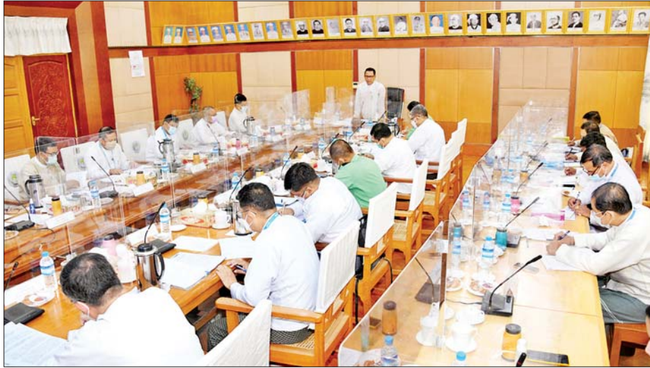
ပြည်ထောင်စုဝန်ကြီး ဦးမောင်မောင်အုန်း အမျိုးသားရုပ်မြင်သံကြားနှင့် အသံထုတ်လွှင့်ခြင်းလုပ်ငန်းများ ဖွံ့ဖြိုးတိုးတက်ရေးအဖွဲ့၏ ပထမအကြိမ်ညှိနှိုင်းအစည်းအဝေးတွင် အမှာစကားပြောကြားစဉ်။

အစည်းအဝေးတွင် အမျိုးသားရုပ်မြင်သံကြားနှင့် အသံထုတ်လွှင့်ခြင်းလုပ်ငန်းများ ဖွံ့ဖြိုးတိုးတက်ရေးအဖွဲ့ ဥက္ကဋ္ဌ ပြည်ထောင်စုဝန်ကြီး ဦးမောင်မောင်အုန်းက ပြန်ကြားရေးဝန်ကြီးဌာနအနေဖြင့် ရုပ်မြင်သံကြားနှင့် အသံထုတ်လွှင့်ခြင်းဆိုင်ရာ ဥပဒေကို ၂၈-၈-၂၀၁၅ ရက်နေ့တွင် ပြည်ထောင်စုလွှတ်တော် ဥပဒေအမှတ် ၅၃ ဖြင့်လည်းကောင်း၊ ရုပ်မြင်သံကြားနှင့် အသံထုတ်လွှင့်ခြင်းဆိုင်ရာဥပဒေကို ပြင်ဆင်သည့် ဥပဒေကို ၂၁-၆-၂၀၁၈ ရက်နေ့တွင် ပြည်ထောင်စုလွှတ်တော် ဥပဒေအမှတ် ၁၉ ဖြင့်လည်းကောင်း၊ နည်းဥပဒေများကို ပြန်ကြားရေးဝန်ကြီးဌာန၏ ၂၀-၁၀-၂၀၂၀ ရက်စွဲပါ အမိန့်ကြော်ငြာစာအမှတ် ၁၀၄/၂၀၂၀ ဖြင့်လည်းကောင်း၊ ဒုတိယအကြိမ်ပြင်ဆင်သည့် ဥပဒေကို ၁-၁၁-၂၀၂၁ ရက်နေ့တွင် နိုင်ငံတော်စီမံအုပ်ချုပ်ရေးကောင်စီ ဥပဒေအမှတ် ၆၃/၂၀၂၁ ဖြင့်လည်းကောင်း ထုတ်ပြန်ခဲ့ပြီးဖြစ်ပါကြောင်း၊ နည်းဥပဒေများကို ပြင်ဆင်သည့် နည်းဥပဒေများအား ထုတ်ပြန်ရေးနှင့်