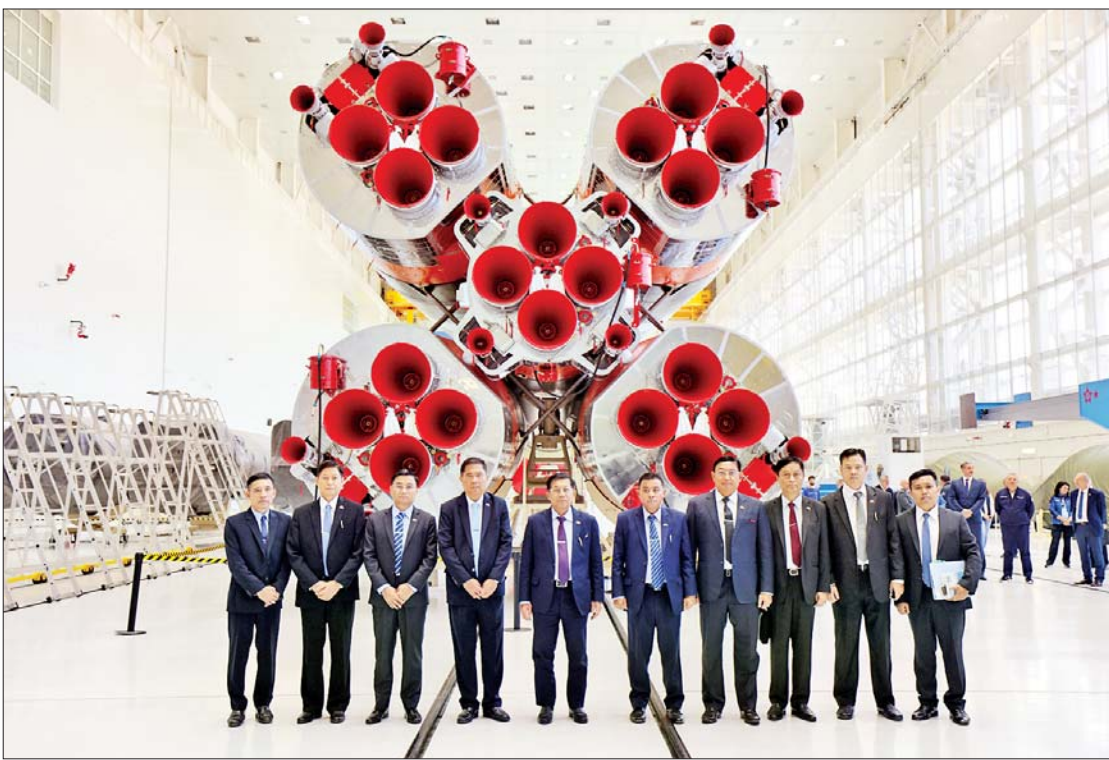
နိုင်ငံတော်စီမံအုပ်ချုပ်ရေးကောင်စီဥက္ကဋ္ဌ နိုင်ငံတော်ဝန်ကြီးချုပ် ဗိုလ်ချုပ်မှူးကြီး မင်းအောင်လှိုင်နှင့်အဖွဲ့ဝင်များ Rocket တပ်ဆင်ရေး အလုပ်ရုံအတွင်းရှိ Soyuz-2 ဒုံးပျံရှေ့တွင် အမှတ်တရ စုပေါင်းဓာတ်ပုံရိုက်စဉ်။

နိုင်ငံတော်စီမံအုပ်ချုပ်ရေးကောင်စီ ဥက္ကဋ္ဌ နိုင်ငံတော်ဝန်ကြီးချုပ် ဗိုလ်ချုပ်မှူးကြီး မင်းအောင်လှိုင် ဦးဆောင်သည့် မြန်မာအဆင့်မြင့် ကိုယ်စားလှယ်အဖွဲ့၏ ယာဉ်တန်းသည် လုံခြုံရေးယာဉ်တန်းများ ခြံရံ၍ ရုရှားဖက်ဒရေးရှင်းနိုင်ငံ ဗလာဒီဗော့စတော့ခါမြို့ အပြည်ပြည်ဆိုင်ရာ လေဆိပ်သို့ ဦးတည်ထွက်ခွာလျက်ရှိသည်။ စတင်ရောက်ရှိသည်မှ စက်တင်ဘာ ၉ ရက် နံနက်ပိုင်းအထိ ခေတ္တတည်းခိုနေထိုင်ခဲ့သည့် ဗလာဒီဗော့စတော့ခါမြို့ Far Eastern Federal University (FEFU) တက္ကသိုလ်ကြီးမှာ ခန့်ထည်စွာဖြင့် ကျန်ရစ်သည်။ စက်တင်ဘာ ၉ ရက် နံနက်ပိုင်းတွင် အဆင့်မြင့်ကိုယ်စားလှယ်အဖွဲ့ စတင်သွားရောက်မည့်နေရာမှာ ရုရှားဖက်ဒရေးရှင်းနိုင်ငံ၏ Amur ပြည်နယ် Blagoveshchensk မြို့သို့ ဖြစ်သည်။