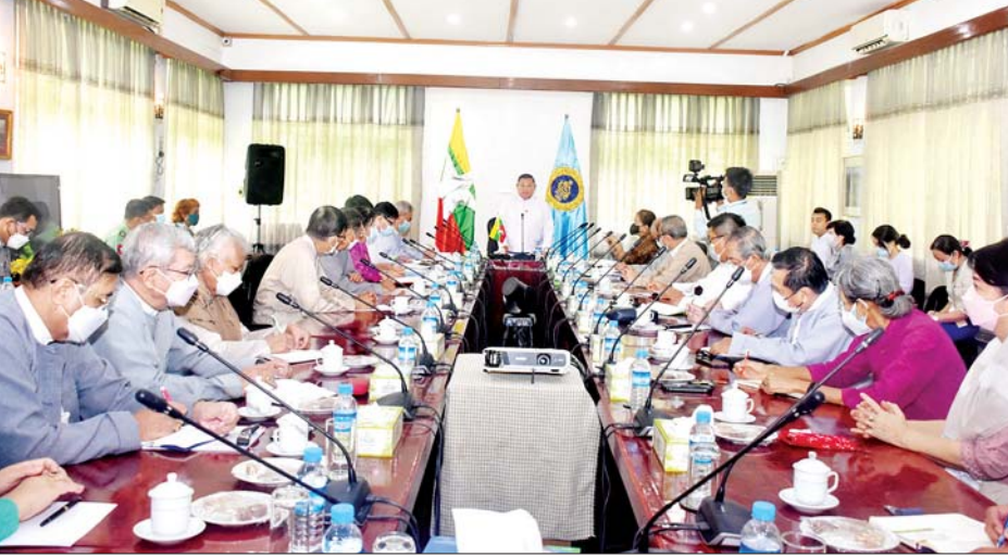
ပေးအဖွဲ့နှင့် အမှုဆောင်အဖွဲ့ဝင်များအနေဖြင့် လုပ်ငန်းတာဝန်အသီးသီးကို အောင်မြင်စွာအကောင် အထည်ဖော်ဆောင်ရွက်နိုင်ရေးအတွက် ပေါင်းစပ် ညှိနှိုင်းပေးပြီး မိမိနိုင်ငံ၏အချုပ်အခြာအာဏာနှင့် ပိုင်နက်နယ်မြေတည်တံ့ခိုင်မြဲရေးမှာ အရေးအကြီးဆုံး ဖြစ်ကြောင်းနှင့် မြန်မာနိုင်ငံ မဟာဗျူဟာနှင့် နိုင်ငံတကာလေ့လာရေးအဖွဲ့အနေဖြင့် ပညာရှင် များရှုထောင့်၊ သံတမန်နည်းလမ်းသွယ်-၂ မှ နိုင်ငံ

နေပြည်တော် စက်တင်ဘာ ၁၉ နိုင်ငံခြားရေးဝန်ကြီးဌာန ပြည်ထောင်စုဝန်ကြီး နှင့် မြန်မာနိုင်ငံမဟာဗျူဟာနှင့် နိုင်ငံတကာလေ့လာ ရေးအဖွဲ့မှ ဝါရင့်အကြံပေးအဖွဲ့ဝင်များနှင့် အမှုဆောင် အဖွဲ့ဝင်များ တွေ့ဆုံဆွေးနွေးပွဲအခမ်းအနားကို ယနေ့မနက် ၁၀ နာရီခွဲတွင် နိုင်ငံခြားရေးဝန်ကြီး ဌာန(ရန်ကုန်) မြန်မာနိုင်ငံမဟာဗျူဟာနှင့် နိုင်ငံ တကာလေ့လာရေးအဖွဲ့ရုံး အစည်းအဝေးခန်းမ၌ ကျင်းပသည်။ ရှင်းလင်းဆွေးနွေး ဦးစွာ ပြည်ထောင်စုဝန်ကြီး ဦးဝဏ္ဏမောင်လွင်က နိုင်ငံခြားရေးဝန်ကြီးဌာန၏ လုပ်ငန်းတာဝန်များကို အကောင်အထည်ဖော်ဆောင်ရွက်မှု၊ နိုင်ငံတကာနှင့် ပူးပေါင်းဆောင်ရွက်မှု၊ ကုလသမဂ္ဂ၊ အာဆီယံအဖွဲ့ အပါအဝင် ဒေသတွင်းအဖွဲ့အစည်းများနှင့် လတ်တ လော ပူးပေါင်းဆောင်ရွက်မှုနှင့် စိန်ခေါ်မှုများကို ရှင်းလင်းဆွေးနွေးပြောကြားသည်။ ဆက်လက်၍ ပြည်ထောင်စုဝန်ကြီးက နာယကအဖွဲ့၊ ဝါရင့်အကြံ