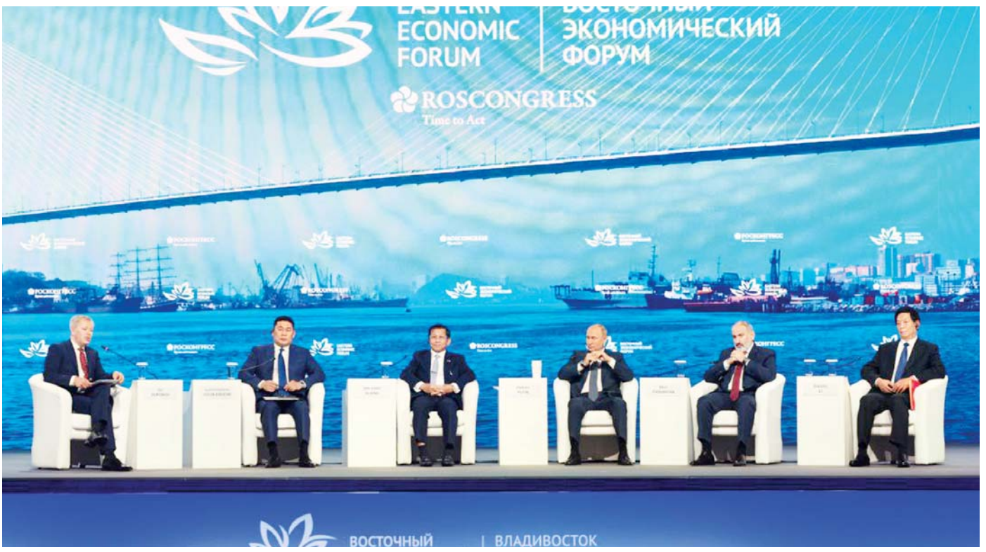
(၇) ကြိမ်မြောက် အရှေ့ပူဇော်ပွဲစီမံကိန်းဖွံ့ဖြိုးရေးဖွဲ့စည်းမှု မျက်နှာစုံညီအစည်းအဝေး Plenary Session ကျင်းပစဉ်။

အာဆီယံ၏ ဗဟိုချက်မကျမှု အာရှ-ပစိဖိတ်ဒေသသည် မျက်မှောက်ကာလ တွင် စဉ်ဆက်မပြတ် ဖွံ့ဖြိုးတိုးတက်လာမှုကြောင့် ရင်းနှီးမြှုပ်နှံရန် သင့်လျော်သည့်ဒေသအဖြစ် တွေ့မြင်ရမှုအခြေအနေ၊ အာဆီယံအဖွဲ့သည်လည်း အာရှ-ပစိဖိတ်ဒေသတွင်း အချက်အချာကျစွာ တည်ရှိ