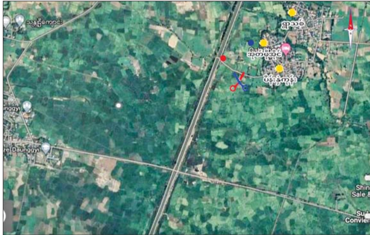
တန့်ဆည်မြို့နယ် အုတ်ဖိုအိုင်ကျေးရွာအနီး လုံခြုံရေးတပ်ဖွဲ့များနှင့် PDF အမည်ခံ အကြမ်းဖက်သမားများ ထိတွေ့မှုဖြစ်စဉ်နေရာပြပုံ

နှင့် PDF အမည်ခံ အကြမ်းဖက်သမားများ ဆေးခန်းအတွင်း သိုဝှက်ထားသည့် လက်လုပ်မိုင်း ၁၆ လုံး၊ ရှေ့တိုက်ပြောင်း ခုနစ်ခု၊ လက်လုပ် DROP BOMB ရှစ်လုံးနှင့် စကားပြောစက်တစ်လုံးတို့ကို သိမ်းဆည်းရမိခဲ့သည်။ ဖြစ်စဉ်တွင် KIA လက်နက်ကိုင်အဖွဲ့ များနှင့် PDF အမည်ခံ အကြမ်းဖက်သမား များက ကျေးရွာသူ ကျေးရွာသားများနှင့် နေအိမ်များကို လူသားတံတိုင်းသဖွယ် အသုံးပြုအကာအကွယ်ယူ ပစ်ခတ်ခဲ့ခြင်း ကြောင့် ဒေသခံအချို့ သေဆုံး၊ ဒဏ်ရာရရှိ ခဲ့သဖြင့် လုံခြုံရေးတပ်ဖွဲ့ဝင်များက လိုအပ် သည့် ဆေးဝါးကုသမှုများ ဆောင်ရွက်ပေး လျက်ရှိပြီး အရေးကြီးလူနာများကို