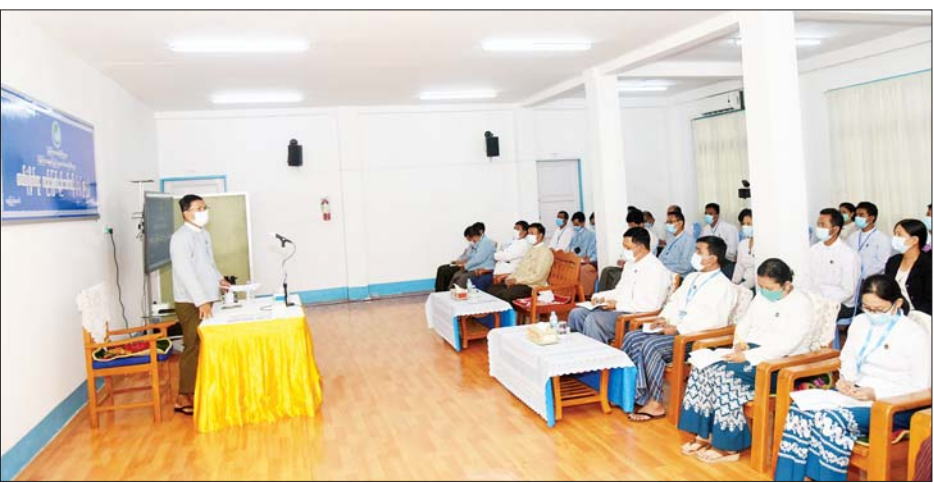
ခေါင်းဆောင်ထံ သင်တန်းဆင်းလက်မှတ်များ လေးအပ်သည်။ ယင်းနောက် ဒုတိယဝန်ကြီးနှင့် တာဝန်ရှိသူများသည် သင်တန်းသားများ ရိုက်ကူးခဲ့သည့် မှတ်တမ်းဓာတ်ပုံများကို ကြည့်ရှုကြသည်။ ယခုဖွင့်လှစ်ခဲ့သည့် ဓာတ်ပုံရိုက်ကူးတည်းဖြတ်နည်းသင်တန်းကို စက်တင်ဘာ ၆ ရက်မှ ၁၆ ရက်အထိ ဖွင့်လှစ်သင်ကြားခဲ့ပြီး နေပြည်တော်ကောင်စီနယ်မြေ တိုင်းဒေသကြီးနှင့် ပြည်နယ်များရှိ ပြန်ကြားရေးနှင့် ပြည်သူ့ဆက်ဆံရေးဦးစီးဌာနမှ အရာထမ်း၊ အမှုထမ်း ၂၀ တက်ရောက်ခဲ့ကြကြောင်း သိရသည်။

ရိုက်ကူးခြင်းတို့ကို သင်ကြားပေးခဲ့သည့်အပြင် သတင်းနှင့်စာနယ်ဇင်းလုပ်ငန်းနှင့် ဦးစီးဌာနနည်းပြများက သတင်း၏ အခြေခံဖွဲ့စည်းတည်ဆောက်ပုံ၊ သတင်းနှင့် သတင်းဆောင်းပါးများ ရေးသားခြင်း၊ အွန်လိုင်းအသုံးပြု၍ သတင်းများ ထုတ်ပြန်ခြင်း၊ သတင်းအပြန်အလှန်စီးဆင်းရေး ဘာသာရပ်များကို သင်ကြားပို့ချပေးခဲ့ကြောင်း။ သင်တန်းသားများအနေဖြင့် ပို့ချလိုက်သည့် ပညာရပ်အပြင် ယခုထက် ဆပွားတိုး၍ တိုးတက်သည့် နည်းပညာများဖြင့် ပိုပြီးကောင်းမွန်အောင် ရိုက်ကူးတင်ဆက်နိုင်ရန်နှင့် သတင်းရေးသားထုတ်ပြန်သည့် နေရာတွင်လည်း သတင်းနှင့်ကိုက်ညီသည့် ဓာတ်ပုံကို အနှစ်သာရမြောက်အောင် ရိုက်ကူးနိုင်ရန် ကြိုးစားကြစေလိုကြောင်း ပြောကြားသည်။ ထို့နောက် ဒုတိယဝန်ကြီးက သင်တန်းသား