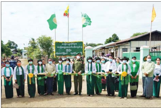
ပညာရေးမှူး ဦးမြင့်ဆွေတို့က ဆက်လက်၍ ကြီးကြားကျေးရွာ အလယ်တန်း ကျောင်းသား ဖဲကြိုးဖြတ်ဖွင့်လှစ်ပေးခဲ့သည်။

ပန်းတောင်း စက်တင်ဘာ ၁၆ ပဲခူးတိုင်းဒေသကြီး ပန်းတောင်း မြို့နယ် ကြီးကြားကျေးရွာအုပ်စု အခြေခံပညာ အထက်တန်း ကျောင်း(ခွဲ)အဆင့်သို့ တိုးမြှင့် ဖွင့်လှစ်ပွဲ အခမ်းအနားကို စက်တင်ဘာ ၁၅ ရက်နံနက်ပိုင်းက အဆိုပါကျောင်း၌ ကျင်းပသည်။ ရှေးဦးစွာ ဥသျှစ်ပင်မြို့စီမံ အုပ်ချုပ်ရေးအဖွဲ့ဥက္ကဋ္ဌ ဦးကျော် ဇင်ဦး၊ အမှတ်(၉) ကာကွယ်ရေး ပစ္စည်းစက်ရုံစက်ရုံမှူး ဗိုလ်မှူးကြီး တင်မောင်ချိုနှင့် ဒုတိယမြို့နယ်