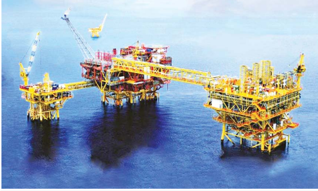
မြန်မာနိုင်ငံ၏ ကမ်းလွန်ရေနံ ရဲတံခွန်သဘာဝဓာတ်ငွေ့စီမံကိန်းကို တွေ့ရစဉ်။

ကုန်သွယ်ရေးအတွက် ဆွေးနွေးပြောကြားမှုတွင် နိုင်ငံတော်နှင့် နိုင်ငံသူ၊ နိုင်ငံသားများ၏ အကျိုးစီးပွားကို ရှေးရှုသည်။ အလားတူ အာမခံချက်အဖြစ် အခွင့်အလမ်းများစွာကို ပေးအပ်နိုင်စွမ်းရှိသည်ဟု တည်ကြည်သောစကားကို ဆိုသည်။ မလိုသူများ၏ နည်းမျိုးစုံသော ထိုးနှက်မှုကြားတွင် အကြီးအကဲက ဖိုရမ်သို့ တက်ရောက်လာသူများကို သက်သေပြု၍ အာမခံစကားဖြင့် ဆိုခြင်းသည်ပင် မြန်မာဟူသော ဂုဏ်ကို မြှင့်တင်နိုင်ခဲ့ခြင်းဟု ဆိုနိုင်သည်။ ဆက်ဆံရေးပိုမိုကောင်းမွန်လာစေရန် ဆက်လက်ဆွေးနွေးမှုတွင် ယခုကျင်းပပြုလုပ်သည့် Eastern Economic Forum- 2022 ၏ ပူးပေါင်းဆောင်ရွက်မှုများသည် ယူရေးရှားဒေသတွင်း နိုင်ငံများနှင့် ဆက်ဆံရေး ပိုမိုကောင်းမွန်လာစေရန် ပံ့ပိုးပေးလျက်ရှိမှု၊ ဒေသတွင်း အပြန်အလှန်ထိတွေ့ ဆက်ဆံဆက်သွယ်မှု ယန္တရားများ ရှိလာစေပြီး နိုင်ငံတကာဆက်ဆံရေးနယ်ပယ်တွင် အရှေ့ပိုင်းဒေသအား အနောက်နိုင်ငံများ၏ လွှမ်းမိုးမှုကို တွန်းလှန်နိုင်မည့်အခြေအနေများကိုလည်း ထည့်သွင်းဆွေးနွေးသည်။ စာမျက်နှာ ၇ သို့ ❖