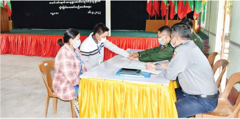
မန္တလေးတိုင်းဒေသကြီးအတွင်း၌ ပြစ်မှုကျူးလွန်ခြင်းမရှိသော PDF သင်တန်းဆင်း အလင်းဝင်ရောက်သူများအား မိဘအုပ်ထိန်းသူများထံ လွှဲပြောင်းပေးအပ်စဉ်။