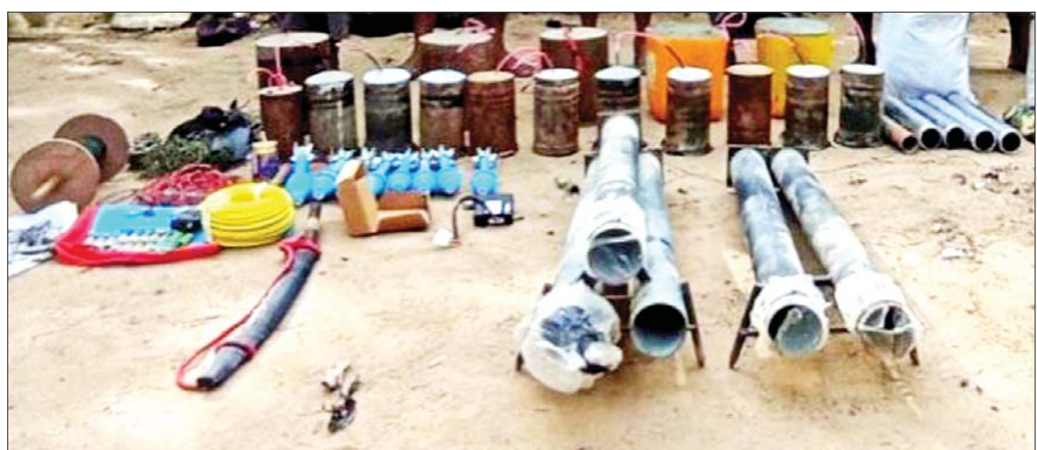
လက်ယက်ကုန်းကျေးရွာအတွင်းမှ သိမ်းဆည်းရမိမှု မှတ်တမ်းဓာတ်ပုံ။