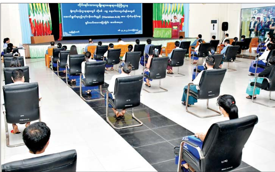
လမ်းညွှန် (Version 4.0) အား ရှင်းလင်းခြင်းအခမ်းအနားကို ယနေ့မွန်းလွဲပိုင်းတွင် တိုင်းရင်းသားလူမျိုးများရေးရာဝန်ကြီးဌာန ပြည်ထောင်စုဝန်ကြီးရုံးအစည်းအဝေးခန်းမ၌ ကျင်းပရာတွင် ပြည်ထောင်စုဝန်ကြီး ဦးစောထွန်းအောင်မြင့်က အထက်ပါအတိုင်း ပြောကြားသည်။

နေပြည်တော် စက်တင်ဘာ ၁၆ အနာဂတ် ကိုရိုနာဗိုင်းရပ်စ်လှိုင်းဂယက်များ ဆက်လက်ဖြစ်ပေါ်လာနိုင်သည့်အတွက် ကမ္ဘာတစ်ဝန်းရှိ အစိုးရများကို ဆက်လက်သတိထားရန် ကမ္ဘာကျန်းမာရေးအဖွဲ့က သတိပေးနေပြီဖြစ်ကြောင်း၊ မိမိတို့နိုင်ငံတွင် ကိုဗစ်-၁၉ မျိုးရိုးဗီဇပြောင်းဖြစ်သည့် အိုမီခရွန်ရောဂါဖြစ်ပွားမှု စတင်လှိုင်းသည် ပြန်လည်ကျဆင်းလာခဲ့ရာမှ ဩဂုတ်လအတွင်းမှ စတင်ပြီး ကိုဗစ်-၁၉ ရောဂါပိုးတွေ့ရှိမှု ပြန်လည်မြင့်တက်လာခဲ့သဖြင့် ဝန်ထမ်းများအနေဖြင့် ကျန်းမာရေးအထူးဂရုပြုကြရန် လိုအပ်ကြောင်း၊ ကျန်းမာရေးသတ်မှတ်ချက်များနှင့်ကိုက်ညီအောင် နေထိုင်ကြရန် ပညာပေးလုပ်ငန်းများကို အရှိန်မြှင့်နေကြသလို လိုက်နာဆောင်ရွက်ကြရန် ကိုဗစ်-၁၉ ရောဂါကာကွယ်ရေးနှင့်စပ်လျဉ်း၍ ပြည်ထောင်စုဝန်ကြီးဦးစောထွန်းအောင်မြင့်က ရှင်းလင်းပြောကြားသည်။