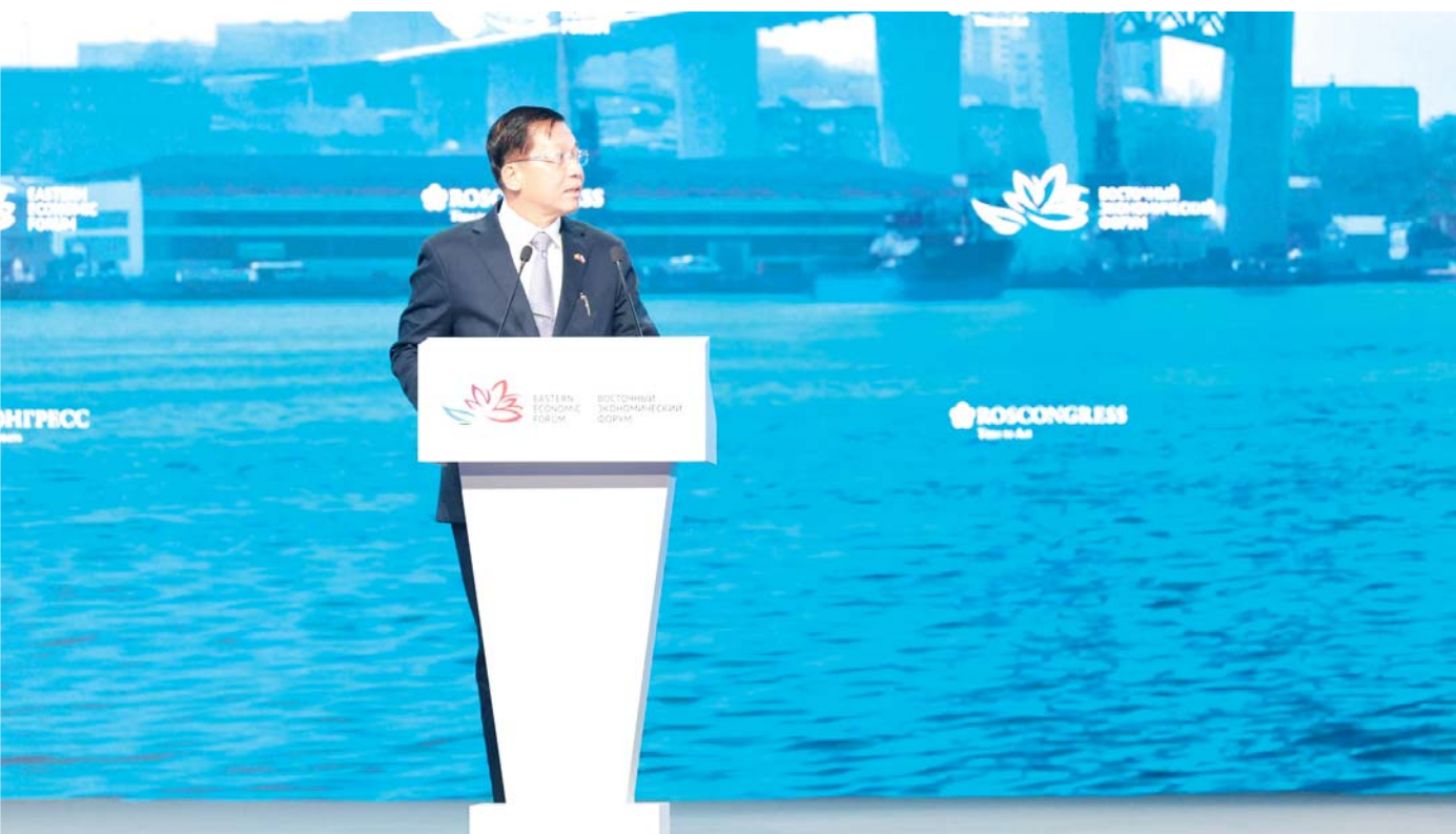
နိုင်ငံတော်စီမံအုပ်ချုပ်ရေးကောင်စီဥက္ကဋ္ဌ နိုင်ငံတော်ဝန်ကြီးချုပ် ဗိုလ်ချုပ်မှူးကြီး မင်းအောင်လှိုင် (၇)ကြိမ်မြောက် အရှေ့ပူးစီးပွားရေးဖိုရမ်၏ မျက်နှာစုံညီအစည်းအဝေး Plenary Session ၌ ဆွေးနွေးစဉ်။

ပေါကြွယ်ဝသည့် နိုင်ငံဖြစ်သည်မှာ ပကတိအရှိတရားဖြစ်သည်။ ကိုယ့်ထီး၊ ကိုယ့်နန်း၊ ကိုယ့်ကြွငန်းနှင့် လွတ်လပ်သည့်နိုင်ငံဖြစ်သည့်အပြင် စီးပွားရေးစနစ်ကိုလည်း ဈေးကွက်စီးပွားရေးစနစ်ဖြင့် ဆောင်ရွက်နေသည်။ ထိုသို့နေထိုင်လုပ်ကိုင်နေသော်လည်း အချို့အနောက်နိုင်ငံကြီးများမှ ၎င်းတို့နှင့် အမြင်မတူရုံ၊ ၎င်းတို့အကျိုးအတွက် ၎င်းတို့ဖြစ်စေလိုသည့် နိုင်ငံရေးအခင်းအကျင်း မဖြစ်ရုံမျှဖြင့် ပိတ်ဆို့ခြင်း၊ တားမြစ်ခြင်းတို့ကို လက်နက်သဖွယ် အသုံးပြုလေ့ရှိသည်။ သို့သော်မြန်မာဟူသော နိုင်ငံသည် ထီးတည်းရပ်တည်သောနိုင်ငံမဟုတ်၊ အမျိုးအဆွေမည်သော မိတ်ဖက်နိုင်ငံများ၊ မိတ်ဆွေမည်သောနိုင်ငံများ များပြားစွာရှိသည်ကို မေ့လျော့နေဟန်ရှိသည်။ မြန်မာနိုင်ငံ၏ မဟာမိတ်သဖွယ်၊ မိတ်ကောင်းဆွေကောင်းသဖွယ် နိုင်ငံများအား ယခုလိုကမ်းလှမ်းမှုအပေါ် မည်သို့ဆိုလေဦးမည်မသိ။ မည်သို့ နှောင့်ယှက်ဖျက်ဆီးဦးမည်ကို မဆိုနိုင်၊ မည်သို့ဆိုစေကာမူ မြန်မာနိုင်ငံသည်ကား မိမိနိုင်ငံအမျိုးသားအကျိုးစီးပွားအတွက် လုပ်ဆောင်သင့်သည်များ လုပ်ဆောင်နေသည်ကို အကြီးအကဲ၏