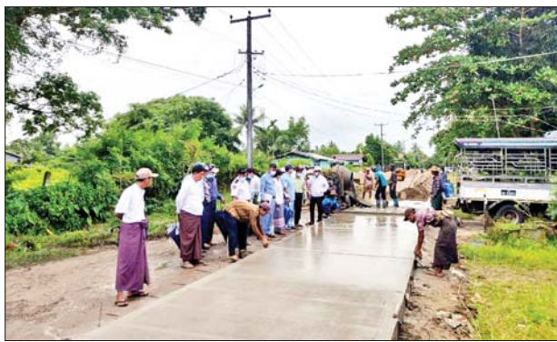
ပြင်အကျယ် ၁၆ ပေနှင့် ဒုခြောက်လက်မဖြင့် နပိုလီယံကုမ္ပဏီက စက်တင်ဘာ ၁၂ ရက်တွင် စတင်ဆောင်ရွက်ခဲ့ခြင်းဖြစ်ကြောင်း သိရသည်။ ၂၀၇