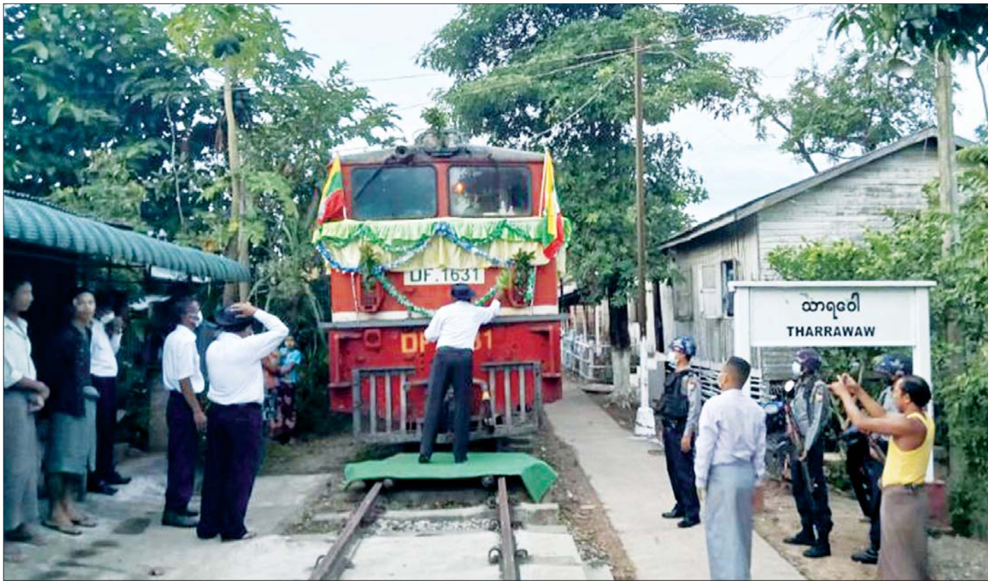
လက်ပံတန်း-သာရဝေါ လော်ကယ်ရထားခရီးစဉ် စတင်ပြေးဆွဲခြင်း ဖွင့်ပွဲအခမ်းအနား ကျင်းပစဉ်။