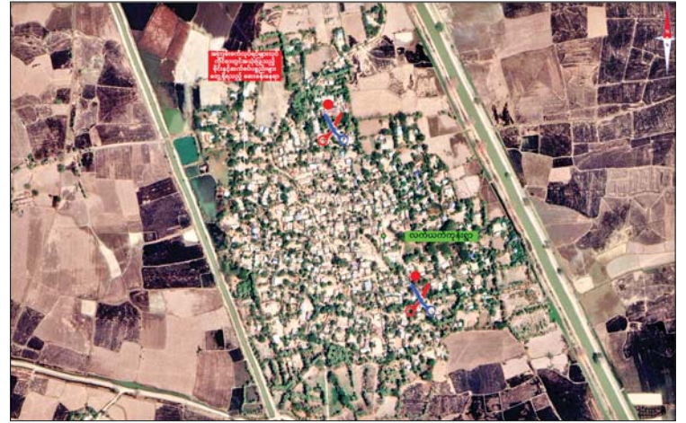
ဒီပဲယင်းမြို့နယ် လက်ယက်ကုန်းကျေးရွာအတွင်း ခိုအောင်းနေထိုင်၍ အဖျက်အမှောင်လုပ်ငန်းများ လုပ်ဆောင်လျက်ရှိသည့် PDF အမည်ခံ အကြမ်းဖက်သမားများနှင့် ထိတွေ့မှုဖြစ်စဉ်နေရာပြပုံ

ထိရောက်စွာ အရေးယူနိုင်ရေး ဆက်လက် ဆောင်ရွက်လျက်ရှိသည်။ အလားတူ စစ်ကိုင်းတိုင်းဒေသကြီး တန့်ဆည်မြို့နယ် အုတ်ဖိုအိုင်ကျေးရွာ အနီးပတ်ဝန်းကျင် အနီးတစ်ဝိုက်တွင် လည်း PDF အမည်ခံ အကြမ်းဖက်သမား များ ခိုအောင်းနေထိုင်လျက်ရှိပြီး အဖျက် အမှောင်လုပ်ငန်းများ လုပ်ဆောင်ကာ ဒေသခံများကို ခြိမ်းခြောက်အကြမ်းဖက် ခြင်း၊ ဆက်ကြေးကောက်ခံခြင်းများ ပြုလုပ်လျက်ရှိကြောင်း အေးချမ်းစွာ နေထိုင်လိုသည့် တာဝန်သိဒေသခံများ၏ သတင်းပေးပို့ချက်အရ လုံခြုံရေး တပ်ဖွဲ့ဝင်များက ယနေ့မှန်းလွဲပိုင်းတွင် သွားရောက်ကင်းလှည့်စစ်ဆေးခြင်းများ