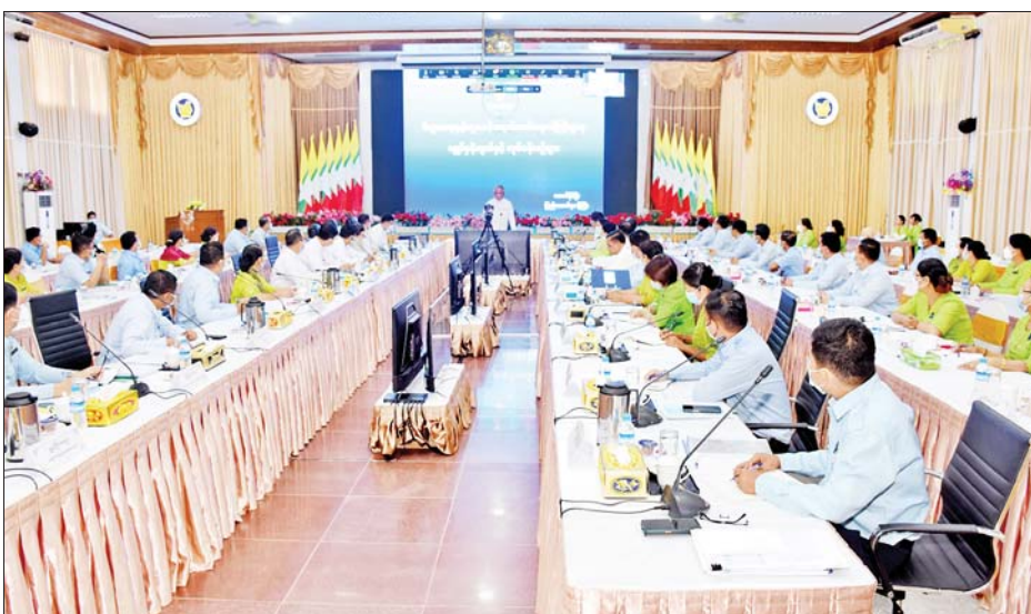
တိုးတက်ရေးအတွက် မောင်းနှင် ခံစားရသော ကုန်သွယ်မှုဖြင့် အား(Engine of Growth) ဖြစ် နိုင်ငံတော် ဖွံ့ဖြိုးတိုးတက်ရေး သည့်အတွက် အားလုံးအကျိုး (Inclusive trade for national development)ကို ဝန်ကြီးဌာန၏ မျှော်မှန်းချက်အဖြစ် ထားရှိပြီး ဆောင်ရွက်ရေးနှင့် ယင်းမျှော်မှန်း တို့ကို ဆွေးနွေးမှာကြားသည်။

နေပြည်တော် စက်တင်ဘာ ၁၄ နိုင်ငံတော် စီမံအုပ်ချုပ်ရေး ကောင်စီဥက္ကဋ္ဌ၏ လမ်းညွှန် မှာကြားချက်များကို ဝန်ထမ်း များသို့ ထပ်ဆင့်ရှင်းလင်းခြင်းကို ယနေ့ နံနက်ပိုင်းတွင် နေပြည် တော်ရှိ စီးပွားရေးနှင့် ကူးသန်း ရောင်းဝယ်ရေး ဝန်ကြီးဌာန၌ ကျင်းပသည်။