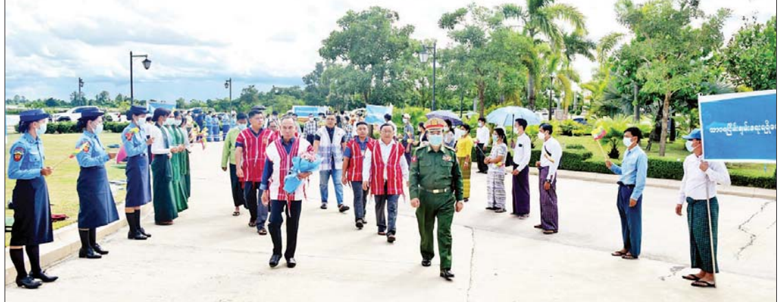
ဒီမိုကရေစီအကျိုးပြု ကရင်တပ်မတော် (DKBA) မှ စစ်ဦးစီးချုပ် စောစတီး ဦးဆောင်သော ကိုယ်စားလှယ်အဖွဲ့အား အမျိုးသားစည်းလုံးညီညွတ်ရေးနှင့် ငြိမ်းချမ်းရေးဖော်ဆောင်မှု ညှိနှိုင်းရေးကော်မတီအဖွဲ့ဝင်နှင့် တာဝန်ရှိသူများက ကြိုဆိုကြစဉ်။