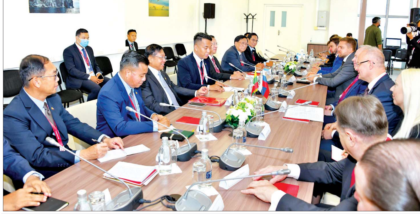
နိုင်ငံတော်စီမံအုပ်ချုပ်ရေးကောင်စီဥက္ကဋ္ဌ နိုင်ငံတော်ဝန်ကြီးချုပ် ဗိုလ်ချုပ်မှူးကြီး မင်းအောင်လှိုင်နှင့် အဖွဲ့ဝင်များ ရုရှားနိုင်ငံပိုင် အဏုမြူကော်ပိုရေးရှင်း Rosatom State Corporations မှ တာဝန်ရှိသူများနှင့် တွေ့ဆုံဆွေးနွေးစဉ်။

ပြည်သူများ၏ လူမှုစီးပွားဘဝတိုးတက်ရန် ရည်ရွယ်ထားသည်ဖြစ်၍ နျူကလီးယား စွမ်းအင်ကို လျှပ်စစ်ဓာတ်အား ထုတ်ယူရေး၊ သိပ္ပံနှင့်သုတေသန လုပ်ငန်းများတွင် အသုံးပြုနိုင်ရေး၊ ဆေးဝါးထုတ်လုပ်ရေး၊ စက်မှုကဏ္ဍနှင့် ကဏ္ဍပေါင်းစုံတွင် အကျိုးရှိစွာ အသုံးချရေးတို့ကို ဆက်လက်ဆွေးနွေးကြသည်။ မြန်မာမှုနယ်ပယ်တွင် သုံးတတ်လျှင်ဆေး၊ မသုံးတတ်လျှင်ဘေးဟူသော ဆိုရိုးစကားရှိသည်။ ဤနျူကလီးယားစွမ်းအင်အတွက် သုံးတတ်အောင် ကြိုတင်ပြင်ဆင်ထားသည်။ ခေတ်၏တိုးတက်မှုနှင့် ရင်ပေါင်တန်း၍ ပညာများကိုဆက်လက်ဆည်းပူးနေသည်။ တတ်ကျွမ်းပြီးလက်တွေ့ ဆောင်ရွက်နေသည့်အဖွဲ့အစည်းနှင့်လည်း ပူးပေါင်းဆောင်ရွက်မည်။ ဘက်စုံသောပြင်ဆင်မှုများ ပြုပြီးဖြစ်သည့်အတွက် ဘေးဖြစ်နိုင်သည်ဆိုသည့်စကားကို ဖယ်ရှား၍ မြန်မာအတွက် ဆေးတစ်ဖုံကို ယူဆောင်လာနိုင်ပြီဟု ယုံကြည်မိသည်။ စာမျက်နှာ ၈ သို့ ❖