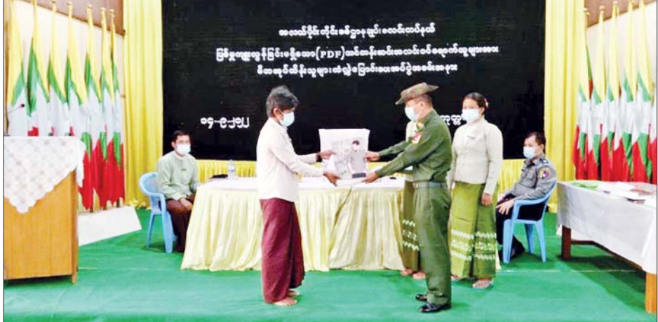
ဥပဒေဘောင်အတွင်း ဝင်ရောက်လာသည့် ပြစ်မှုကျူးလွန်ခြင်းမရှိခဲ့သော မကွေးတိုင်းဒေသကြီး စေတုတ္တရာမြို့နယ်အတွင်းမှ PDF အဖွဲ့ဝင်များအား ထောက်ပံ့ပစ္စည်းများပေးအပ်ပြီး မိဘအုပ်ထိန်းသူများထံ လွှဲပြောင်းပေးအပ်စဉ်။

နေပြည်တော် စက်တင်ဘာ ၁၄ တိုင်းရင်းသားလက်နက်ကိုင် အဖွဲ့နယ်မြေအတွင်း သင်တန်းများ တက်ရောက်ခဲ့ပြီး ပြစ်မှုကျူးလွန်ခြင်းမရှိခဲ့သည့် ဥပဒေဘောင်အတွင်း ဝင်ရောက်လာသော PDF အဖွဲ့ဝင်များကို ပြန်လည်ကြိုဆိုလက်ခံ၍ ၎င်းတို့၏ မိဘအုပ်ထိန်းသူများထံသို့ လွှဲပြောင်းပေးအပ်လျက်ရှိသည်။ ယနေ့နံနက်ပိုင်းတွင် မကွေးတိုင်းဒေသကြီး စေတုတ္တရာမြို့နယ် စီမံအုပ်ချုပ်ရေးအဖွဲ့ရုံးအစည်းအဝေးခန်းမနှင့် ပဲခူးတိုင်းဒေသကြီး ပြည်မြို့ရှိ နယ်မြေခံတပ်ရင်းခန်းမတို့၌ ပြန်လည်ကြိုဆိုလက်ခံခြင်း အခမ်းအနားများကို ပြုလုပ်ကြရာ သက်ဆိုင်ရာ တိုင်းစစ်ဌာနချုပ်များမှ တာဝန်ရှိသူများ၊ ခရိုင်/မြို့နယ် စီမံအုပ်ချုပ်ရေးအဖွဲ့ဝင်များ၊ ဌာနဆိုင်ရာ တာဝန်ရှိသူများ၊ ဥပဒေဘောင်အတွင်း ဝင်ရောက်လာသူများနှင့် ၎င်းတို့၏ မိဘအုပ်ထိန်းသူများ တက်ရောက်ကြသည်။ ဦးစွာ တာဝန်ရှိသူများက နယ်မြေဒေသတည်ငြိမ်အေးချမ်းရေးနှင့် တရားဥပဒေဆိုင်ရာ ပုဒ်မ