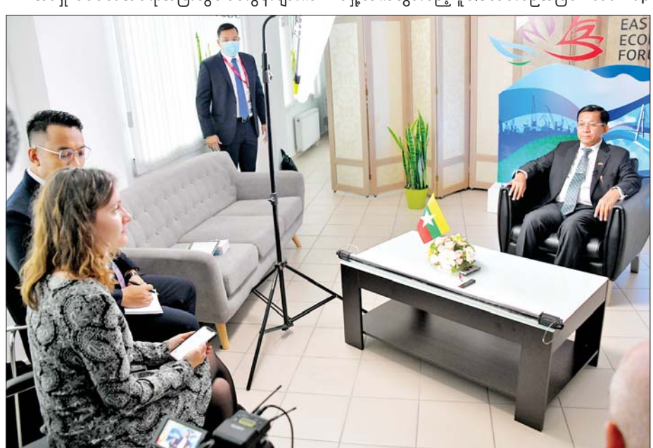
နိုင်ငံတော်စီမံအုပ်ချုပ်ရေးကောင်စီဥက္ကဋ္ဌ နိုင်ငံတော်ဝန်ကြီးချုပ် ဗိုလ်ချုပ်မှူးကြီးမင်းအောင်လှိုင် ရုရှားဖက်ဒရယ်ဒီမိုကရေစီနိုင်ငံ Rossiya Segodnya သတင်းအေဂျင်စီ RIA သတင်းဌာန၏ တွေ့ဆုံ မေးမြန်းမှုများအား လက်ခံဖြေကြားစဉ်။

နိုင်ငံတော်စီမံအုပ်ချုပ်ရေးကောင်စီအနေဖြင့် ရှေ့ဆက်သွားမည့် မူဝါဒလမ်းစဉ်အဖြစ် Road Map