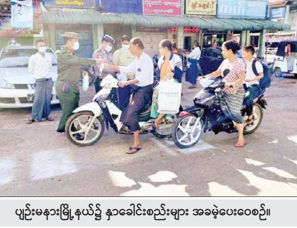
ပျဉ်းမနားမြို့နယ်၌ နှာခေါင်းစည်းများ အခမဲ့ပေးဝေစဉ်။

ယင်းသို့ ဆောင်ရွက်ပေးနေမှု များကို သက်ဆိုင်ရာ တိုင်းဒေသ ကြီးနှင့် ပြည်နယ်များမှ တာဝန် ရှိသူများက သွားရောက်ကြည့်ရှု အားပေးပြီး လိုအပ်သည်များ ညှိနှိုင်းဆောင်ရွက်ပေးကြသည်။ ထို့ပြင် ကိုဗစ်-၁၉ ရောဂါ ထိန်းချုပ် ကာကွယ်ရာတွင် အထောက်အကူ ဖြစ်စေရန် အတွက် နှာခေါင်းစည်းများကို ပြည်သူများ လက်ဝယ်အရောက် တိုင်းစစ်ဌာနချုပ် အသီးသီးမှ တာဝန်ရှိသူများက အခမဲ့ပေးဝေ လှူဒါန်းလျက်ရှိရာ ယနေ့တွင် နေပြည်တော်ကောင်စီ နယ်မြေ အတွင်းရှိ မြို့နယ်ရစ်မြို့နယ်၊ ရန်ကုန်တိုင်းဒေသကြီး ခရိုင်များ အတွင်းရှိ မြို့နယ် ၄၅ မြို့နယ်၊ ဧရာဝတီတိုင်းဒေသကြီး ပုသိမ်မြို့ နှင့် ပန်းတနော်မြို့တို့ရှိ ဈေးများ၊ လမ်းများ၊ မြို့အဝင်ဂိတ်များနှင့် လူစည်ကားရာ နေရာများတွင် နယ်မြေခံ တပ်မတော်သားများက နှာခေါင်းစည်းများကို ဒေသခံ ဌာနဆိုင်ရာဝန်ထမ်းများ၊ တာဝန် ရှိသူများ၊ ပရဟိတအဖွဲ့များနှင့် ပူးပေါင်း၍ ကိုဗစ်-၁၉ ရောဂါ ကာကွယ်ရေးအတွက် အသိပညာ ပေး ဆောင်ရွက်ခြင်း၊ ဈေးဝယ် စင်တာများ၊ ဆိပ်ကမ်းများနှင့် လူသွားလူလာ များပြားသည့် နေရာများတွင် LED ကြော်ငြာ ဘုတ်များဖြင့် ကိုဗစ်-၁၉ ရောဂါ နှင့် ပတ်သက်၍ အသိပညာပေး ခြင်း၊ နှာခေါင်းစည်းတပ်ဆင်၍ သွားလာကြရန် လှုံ့ဆော်ခြင်းနှင့် နှာခေါင်းစည်းများကို ဒေသခံ ပြည်သူများ လက်ဝယ်အရောက် အခမဲ့ ပေးဝေလှူဒါန်းခဲ့ကြ ကြောင်း သိရသည်။ သတင်းစဉ်