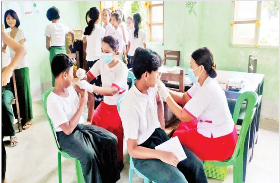
ပုဏ္ဏားကျွန်းမြို့နယ်အတွင်းရှိ ကျောင်းသား ကျောင်းသူများအား ကိုဗစ် -၁၉ ရောဂါကာကွယ်ဆေး ထိုးနှံပေးစဉ်။

အတွင်းရှိ ခရိုင်ခုနစ် ခရိုင်၌ ဒေသခံပြည်သူ ၁၃၅၀၆ ဦးနှင့် ပဲခူးတိုင်းဒေသကြီး တောင်ငူမြို့၌ ဒေသခံပြည်သူ ၁၀၈ ဦးတို့ကို တပ်မတော်မှ ဆေးအဖွဲ့များက ပြည်သူ့ဆေးရုံများမှ ဆရာဝန်များ၊ သက်ဆိုင်ရာ ကျန်းမာရေးဝန်ထမ်း များ၊ စေတနာ့ဝန်ထမ်းများနှင့် ပူးပေါင်း၍ ကိုဗစ်-၁၉ ရောဂါ ကာကွယ်ဆေး ထိုးနှံပေးခြင်းများ ဆောင်ရွက်ပေးသည်။ ထို့နဲ့ပေးလျက်ရှိ ထို့အတူ ကျောင်းသား ကျောင်းသူများကိုလည်း ကိုဗစ်- ၁၉ ရောဂါ ကာကွယ်ဆေးများ ထိုးနှံပေးလျက်ရှိရာ ယနေ့တွင် ဧရာဝတီတိုင်းဒေသကြီးအတွင်းရှိ မြို့နယ် ၂၆ မြို့နယ်၌ ကျောင်းသား ကျောင်းသူ ၂၇၀၁ ဦး၊ ရခိုင် ပြည်နယ်အတွင်းရှိ မြို့နယ် ၁၆ မြို့နယ်၌ ကျောင်းသား ကျောင်းသူ ၃၂၁၈ ဦးနှင့် မန္တလေး တိုင်းဒေသကြီးအတွင်းရှိ ခရိုင် ခုနစ်ခရိုင်၌ ကျောင်းသား ကျောင်းသူ ၈၈၈ ဦး တို့ကို တပ်မတော်မှ ဆေးအဖွဲ့များက ပြည်သူ့ဆေးရုံများမှ ဆရာဝန် များ၊ သက်ဆိုင်ရာ ကျန်းမာရေး ဝန်ထမ်းများ၊ စေတနာ့ဝန်ထမ်း များနှင့်ပူးပေါင်း၍ ကိုဗစ်-၁၉ ရောဂါ ကာကွယ်ဆေး ထိုးနှံပေး ခြင်းများ ဆောင်ရွက်ပေးသည်။