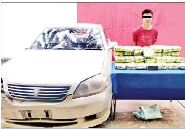
စိုင်းဆိုင်လူအား သိမ်းဆည်းရမိသည့် အိုက်စစ်(မက်သ်အဖက် တမင်း)များနှင့်အတူ တွေ့ရစဉ်။

နေပြည်တော် စက်တင်ဘာ ၁၄ ရှမ်းပြည်နယ် (အရှေ့ပိုင်း) တာချီလိတ်မြို့နယ်တွင် ငွေကျပ် သိန်း ၄၀၀၀ တန်ဖိုးရှိ အိုက်စစ် (မက်သ်အဖက်တမင်း) ကီလို ၅၀ သိမ်းဆည်းရမိခဲ့ကြောင်း မြန်မာ နိုင်ငံရဲတပ်ဖွဲ့မှ သိရသည်။