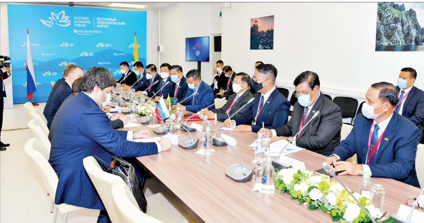
နိုင်ငံတော်စီမံအုပ်ချုပ်ရေးကောင်စီဥက္ကဋ္ဌ နိုင်ငံတော်ဝန်ကြီးချုပ် ဗိုလ်ချုပ်မှူးကြီးမင်းအောင်လှိုင် ရုရှားဖက်ဒရယ်ဒီမိုကရေစီနိုင်ငံသမ္မတ၏ အကြံပေးနှင့် ဖိုရမ်မြန်မာမြောက်ရေးကော်မတီအထူးအတွင်းရေးမှူး Mr. Anton Kobayakov နှင့် တွေ့ဆုံဆွေးနွေးစဉ်။

၂၀၂၂ ခုနှစ် စက်တင်ဘာလ ၆ ရက်နေ့ ရာသီဥတု သာယာလျက်ရှိသည်။ မြန်မာအဆင့်မြင့်ကိုယ်စား လှယ်အဖွဲ့ရောက်ရှိ တည်းခိုလျက်ရှိသည့် Far Federal University (FEFU) ၏ ဧည့်ခန်းတစ်ခု အတွင်း သတင်းဌာနကြီးနှစ်ခုမှ ဝန်ထမ်းများ အပြေးအလွှားပင် အလုပ်များနေသည်။ Rossiya Segodnya သတင်းအေဂျင်စီ၊ RIA သတင်းဌာန ဟူသော နာမည်ကြီးမီဒီယာများပီပီ တစ်ခဏအတွင်း လိုအပ်သည့် ပြင်ဆင်မှုများပြုသည်။ ချိန်းဆိုထား သည့်အချိန်၊ ချိန်းဆိုထားသည့်နေရာသို့ နိုင်ငံတော် စီမံအုပ်ချုပ်ရေးကောင်စီဥက္ကဋ္ဌ နိုင်ငံတော်ဝန်ကြီးချုပ် ရောက်ရှိစဉ်တွင် သူတို့၏ တွေ့ဆုံမေးမြန်းမှုကို စသည်။