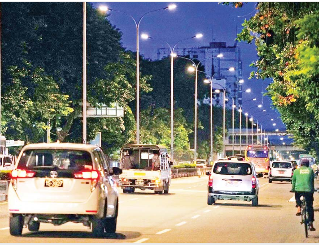
ရန်ကုန်မြို့ ပြည်လမ်းမကြီးတစ်လျှောက် ခေတ်မီလျှပ်စစ်မီးတိုင်များ တိုးချဲ့စိုက်ထူ၍ လျှပ်စစ်မီးများ ထွန်းညှိထားမှုကို တွေ့ရစဉ်။

ရန်ကုန် စက်တင်ဘာ ၁၄ ရန်ကုန်မြို့ ပြည်လမ်းမကြီးတစ်လျှောက် အဆင့်မြှင့်တင်ခြင်းလုပ်ငန်းများကို ၂၀၂၁ ခုနှစ် နိုဝင်ဘာလမှစတင်၍ အကောင် အထည်ဖော်ဆောင်ရွက်ခဲ့ရာ ယခုအခါ လုပ်ငန်းများ ရာနှုန်းပြည့်ပြီးစီးကာ လမ်းလယ်နေရာများတွင် ခေတ်မီလျှပ်စစ် မီးတိုင်များ တိုးချဲ့စိုက်ထူပြီး လျှပ်စစ်မီး များ ထွန်းညှိထားမှုကြောင့် ယခင်ထက် ပင် ပိုမို၍လှပလာသည်ကို မြင်တွေ့ရမည် ဖြစ်သည်။