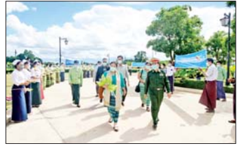
စာမျက်နှာ » ၅

တိုင်းရင်းသားလက်နက်ကိုင် အဖွဲ့အစည်းများမှ ခေါင်းဆောင် များ ငြိမ်းချမ်းရေးဆွေးနွေးရန် နေပြည်တော်သို့ ရောက်ရှိ