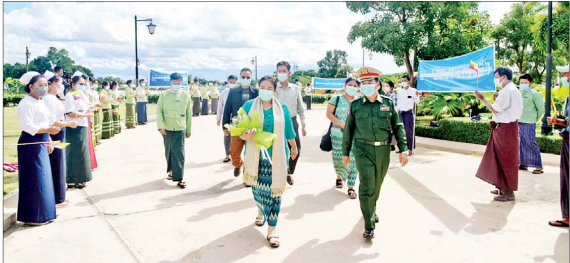
ကရင်အမျိုးသားအစည်းအရုံး/ ကရင်အမျိုးသားလွတ်မြောက်ရေး တပ်မတော်- ငြိမ်းချမ်းရေးကောင်စီ (KNU/KNLA-PC) မှ ဒုတိယဥက္ကဋ္ဌ ဒေါက်တာနော်ကပေါ်ထူး ဦးဆောင်သော ကိုယ်စားလှယ်အဖွဲ့အား အမျိုးသားစည်းလုံးညီညွတ်ရေးနှင့် ငြိမ်းချမ်းရေးဖော်ဆောင်မှု ညှိနှိုင်းရေးကော်မတီအဖွဲ့ဝင်နှင့် တာဝန်ရှိသူများက ကြိုဆိုကြစဉ်။

ယာဉ်များဖြင့် ရောက်ရှိကြရာ အမျိုးသားစည်းလုံးညီညွတ်ရေးနှင့် ငြိမ်းချမ်းရေး ဖော်ဆောင်မှု ညှိနှိုင်းရေး ကော်မတီအဖွဲ့ဝင်နှင့် တာဝန်ရှိသူများ၊ သာသနာရေးနှင့် ယဉ်ကျေးမှုဝန်ကြီးဌာန အနုပညာ ဦးစီးဌာနမှ တိုင်းရင်းသား တိုင်းရင်းသူများ၊ ဌာနဆိုင်ရာဝန်ထမ်းများ၊ ငြိမ်းချမ်းရေးကို လိုလားသည့် ဒေသခံပြည်သူများက ထာဝငြိမ်းချမ်းရေး ရရှိရေးသည် ပြည်သူတစ်ရပ်လုံး၏ ဆန္ဒအစစ်အမှန် ဖြစ်သည်၊ ငြိမ်းချမ်းရေးရရှိရေးသည် နိုင်ငံသားအားလုံး၏ ဆန္ဒအမှန်ဖြစ်သည်၊ ပြည်ထောင်စုကြီးငြိမ်းချမ်းဖို့ တွေ့ဆုံဆွေးနွေးကြပါစို့၊ တိုင်းရင်းသားတွေစည်းလုံးမှ ငြိမ်းချမ်းတည်ငြိမ်အေးချမ်းစသည့် စာသားပါဆိုင်းဘုတ်များ ကိုင်ဆောင်၍ လည်းကောင်း၊ နိုင်ငံတော် အလံငယ်များ ကိုင်ဆောင်၍ လည်းကောင်း ကြိုဆိုခဲ့ကြသည်။