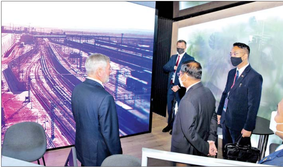
နိုင်ငံတော်စီမံအုပ်ချုပ်ရေးကောင်စီဥက္ကဋ္ဌ နိုင်ငံတော်ဝန်ကြီးချုပ် ဗိုလ်ချုပ်မှူးကြီးမင်းအောင်လှိုင် Eastern Economic Forum-2022 ရှိ Exhibition အတွင်း ခင်းကျင်းပြသထားသည့် ပြခန်းများအား ကြည့်ရှုလေ့လာစဉ်။

Forum အတွင်း ဦးစွာရောက်ရှိသည်က RZD Russian Railways ကုမ္ပဏီဖြစ်သည်။ ပြခန်းမှ တာဝန်ရှိသူများက ကြိုဆိုပြီးနောက် မီးရထားလမ်းကြောင်းများနှင့်ပတ်သက်သည့် နည်းပညာရပ်များ၊ ဝန်ဆောင်မှုပေးနိုင်မှုအခြေအနေများကို ရှင်းလင်းတင်ပြကြသည်။ မိမိတို့နိုင်ငံအတွက်ဆိုလျှင် ဘာတွေလိုအပ်မည်လဲဟု တွေးလေ့ရှိသူပီပီ အကြီးအကဲထံတွင် မေးခွန်းများက မနည်းလှ။ ပြခန်းတာဝန်ရှိသူများကလည်း စိတ်ရှည်လက်ရှည်ဖြင့် ရှင်းလင်းတင်ပြသည်။ RZD Russian Railways ပြခန်းအပြီးတွင် လျှပ်စစ်ဓာတ်အားထုတ်လုပ်ရေး Rus Hydro Hydroelectric Power Generation Company ပြခန်းကို ရောက်ရှိလေ့လာသည်။ လူတို့၏ စား၊ ဝတ်၊ နေရေးဟူသော အဓိကအရေးအရာများအတွက် လျှပ်စစ်သည် မရှိမဖြစ်လိုအပ်သည့် ခေတ်ကာလတွင် လျှပ်စစ်ဓာတ်အား ထုတ်ယူရေးသည် အရေးကြီးသည့် အခန်းကဏ္ဍတွင် ပါဝင်လျက်ရှိသည်။