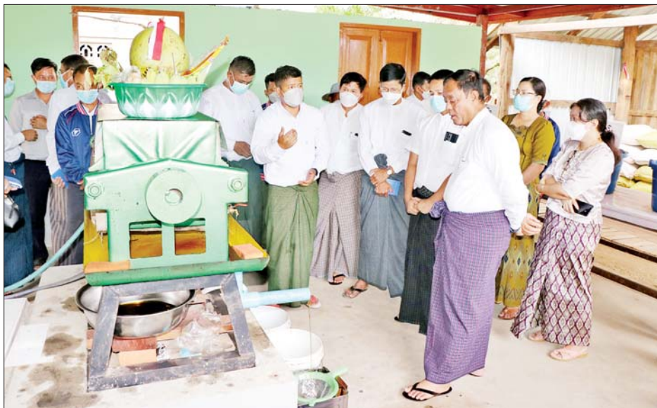
က နိုင်ငံတော်မှ ဆီထွက်သီးနှံများ တိုးချဲ့စိုက်ပျိုး ထုတ်လုပ်နိုင်ရေး မူဝါဒများချမှတ်ပြီး အကောင် အထည်ဖော် ဆောင်ရွက်နေကြောင်း၊ စားအုန်းဆီ သွင်းကုန် အစားထိုးနိုင်ရန် ရည်ရွယ်ဆောင်ရွက် ခြင်းဖြစ်ကြောင်း၊ စဉ်ဆက်မပြတ်လည်ပတ်နိုင်ရေး အတွက် လိုအပ်သော အဓိကကုန်ကြမ်းများဖြစ်သည့်

ထိုသို့ လုပ်ငန်းဆောင်ရွက်နေမှုများကို သမဝါယမနှင့် ကျေးလက်ဖွံ့ဖြိုးရေးဝန်ကြီးဌာန ပြည်ထောင်စုဝန်ကြီး ဦးလှမိုးသည် ယနေ့ မွန်းလွဲပိုင်း က ဒုတိယဝန်ကြီး ဦးမြင့်စိုး၊ အမြဲတမ်းအတွင်းဝန်၊ ညွှန်ကြားရေးမှူးချုပ်များ၊ သက်ဆိုင်ရာတာဝန်ရှိသူ များနှင့်အတူ သွားရောက်ကြည့်ရှုစစ်ဆေးသည်။ ထိုသို့ကြည့်ရှုစစ်ဆေးစဉ် ပြည်ထောင်စုဝန်ကြီး