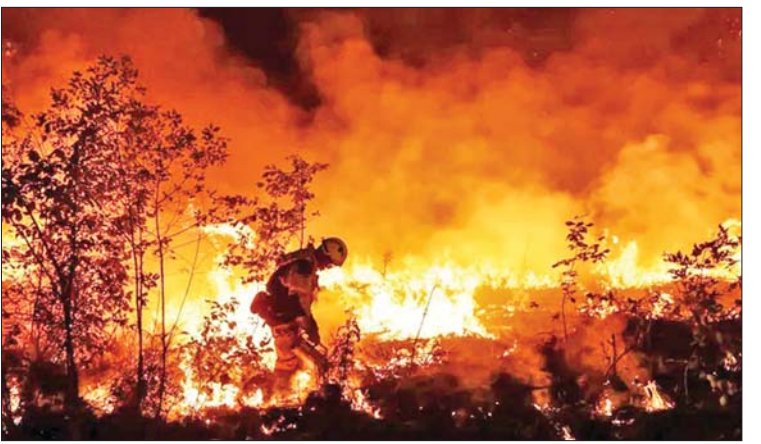
ပြင်သစ်နိုင်ငံ၌ ယခုနှစ်ရာသီကာလ အတွင်း ခြောက်သွေ့သော ရာသီဥတုနှင့် အပူလှိုင်းများ ဖြစ်ပေါ်ခဲ့ခြင်းကြောင့် ဂျီရွန်ဒီစီရင်စုအတွင်း မြေဟက်တာ ၃၀၀၀ ကျော် တောမီးလောင်ကျွမ်းမှု ဖြစ်ပွားခဲ့ကြောင်း ဒေသတွင်းမီဒီယာများက သတင်းထုတ်ပြန်ခဲ့သည်။ ကိုးကား - ဆင်ဟွာ ဘာသာပြန် - အလင်းသစ်

တောမီးလောင်ကျွမ်းမှုကို ငြိမ်းသတ်ရန် ဂျီရွန်ဒီစီရင်စုနှင့် အခြားသော မီးသတ်ဌာနများမှ မီးသတ်သမား ၉၀၀ ကျော်သည်လည်း စုရုံးရောက်ရှိကာ ငြိမ်းသတ်နေပြီဖြစ်ကြောင်း သိရသည်။ ထို့ပြင် အရေးပေါ် ကူညီကယ်ဆယ်ရေးများ ဆောင်ရွက်ရန် နီးစပ်ရာနယ်မြေများအား တောင်းဆိုထားကြောင်း ဂျီရွန်ဒီစီရင်စု အစိုးရက ပြောကြားသည်။