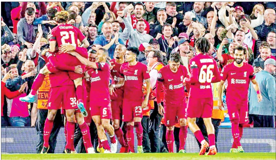
လီဗာပူးအသင်း ကစားသမားများ ဂိုးသွင်းပြီး အောင်ပွဲခံနေစဉ်။