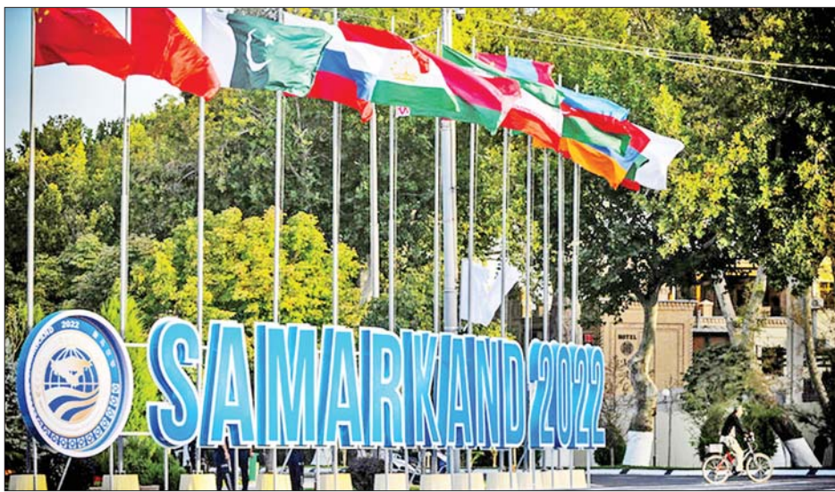
အီရန်နိုင်ငံသည် လက်ရှိတွင် အမေရိကန်နိုင်ငံ ပါဝင်လာခြင်းဖြစ်ကြောင်း နိုင်ငံရေးစောင့်ကြည့်က ချမှတ်ထားသည့် စီးပွားရေးပိတ်ဆို့မှုများကို လေ့လာသူများက ဆိုသည်။ အီရန်နိုင်ငံ၏ နျူကလီးယားဖွံ့ဖြိုးတိုးတက်မှုနှင့် စီးပွားရေးဆိုင်ရာ ပူးပေါင်းဆောင်ရွက်မှုတွင် ဆိုင်ရာ လုပ်ငန်းစဉ်များကြောင့် အမေရိကန်နိုင်ငံက