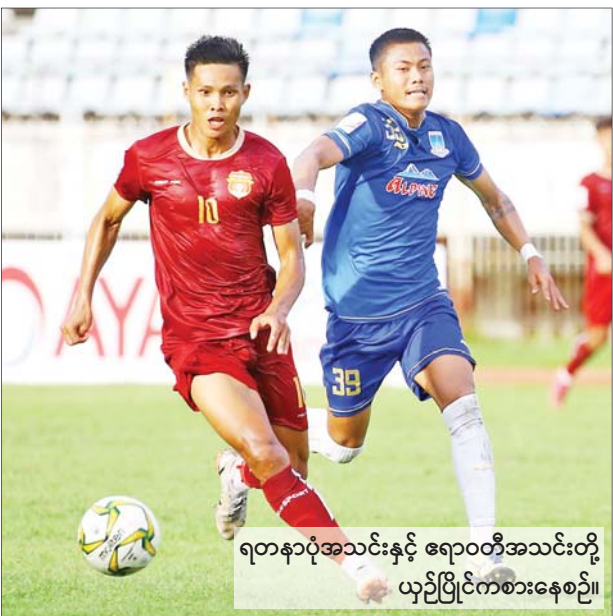
ရတနာပုံအသင်းနှင့် ဧရာဝတီအသင်းတို့ ယှဉ်ပြိုင်ကစားနေစဉ်။

ချန်ပီယံလိဂ်အုပ်စုဆင့်ပွဲစဉ်(၂)အဖြစ် စက်တင်ဘာ ၁၃ ရက်ညပိုင်းက ယှဉ်ပြိုင်ကစားခဲ့တဲ့ ပွဲစဉ်တွေထဲမှာ အိမ်ကွင်းမှာ ယှဉ်ပြိုင်ကစားခဲ့ရတဲ့ ဘိုင်ယန်မြူးနစ်အသင်းနဲ့ လီဗာပူးအသင်းတို့ နိုင်ပွဲကိုယ်စီရရှိခဲ့ကြပြီး အဝေးကွင်းကို သွားရောက်ကစားခဲ့ရတဲ့ အက်သလက်တီကိုမက်ဒရစ်အသင်းနဲ့ စပါးအသင်းတို့ ရှုံးပွဲကြုံတွေ့ခဲ့ရတာဖြစ်ပါတယ်။ စာမျက်နှာ ၁၄ ကော်လံ ၁ သို့ ၀