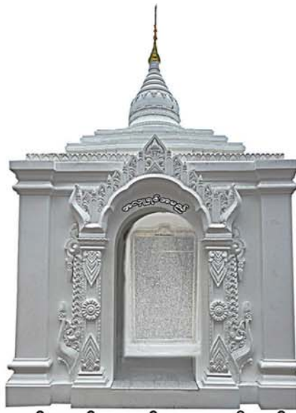
ပိဋကတ်ကျောက်စာဓမ္မစေတီတော်