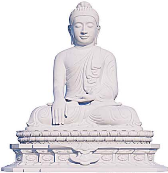
မာရဝိဇယဗုဒ္ဓရုပ်ပွားတော်မြတ်ကြီး