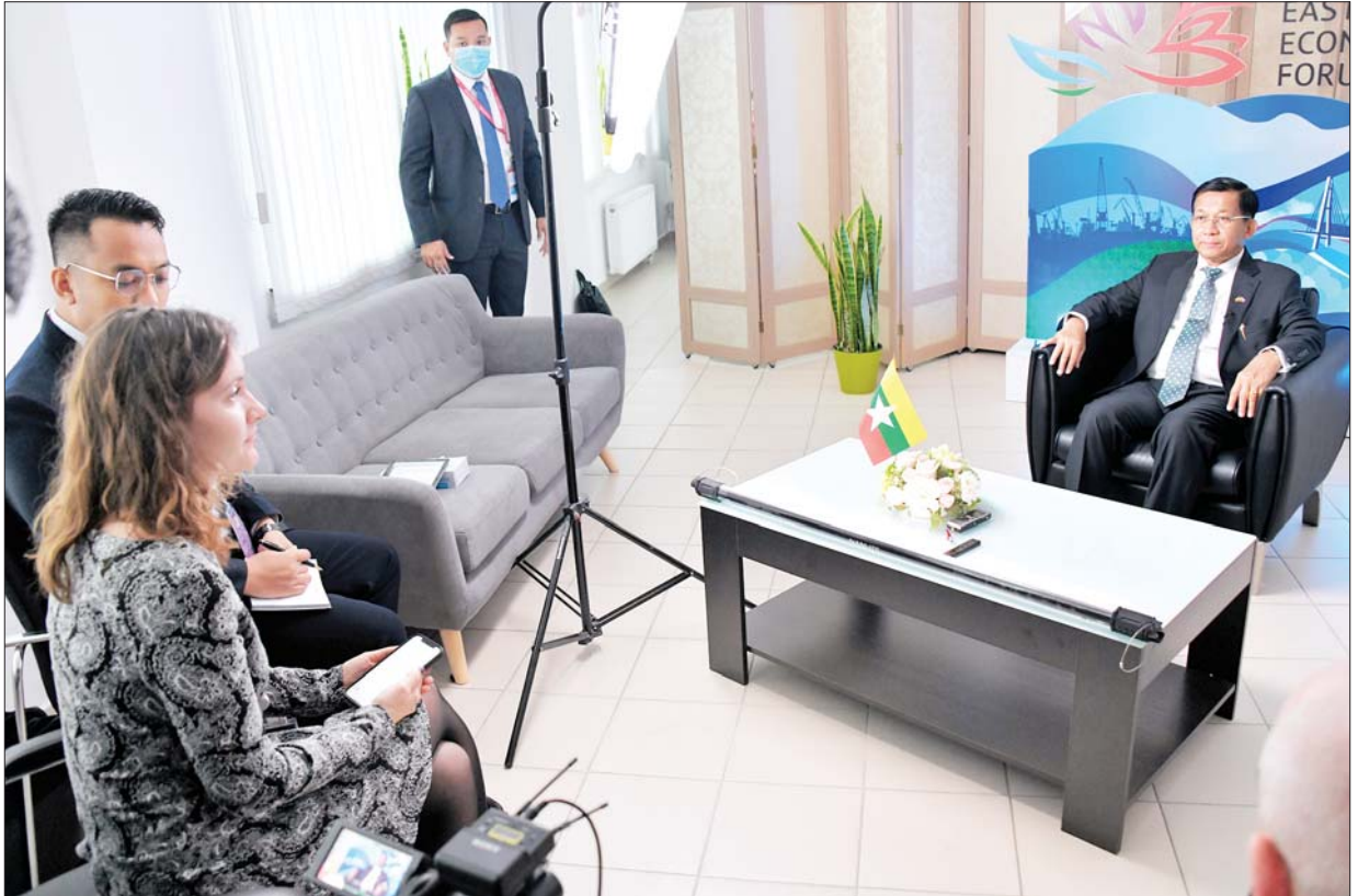
နိုင်ငံတော်စီမံအုပ်ချုပ်ရေးကောင်စီဥက္ကဋ္ဌ နိုင်ငံတော်ဝန်ကြီးချုပ် ဗိုလ်ချုပ်မှူးကြီးမင်းအောင်လှိုင် ရုရှားဖက်ဒရေးရှင်းနိုင်ငံ Rossiya Segodnya သတင်းအေဂျင်စီ RIA သတင်းဌာန၏ တွေ့ဆုံမေးမြန်းမှုများအား လက်ခံဖြေကြားစဉ်။

ဖြေ။ ။ ပြီးခဲ့တဲ့လ အမေရိကန်နဲ့ ထိုင်ဝမ်ဆက်ဆံရေးဖြစ်ပေါ်မှုအပေါ်မှာ ပြန်လည်သုံးသပ်ကြည့်မယ်ဆိုရင် တရုတ်နိုင်ငံရဲ့ One China Policy ကို များစွာ ထိရောက်စေခဲ့တယ်ဆိုတာ သွားတွေ့ပါတယ်။ One China Policy ဟာ တရုတ်နိုင်ငံရော အမေရိကန်နိုင်ငံရော လက်ခံထားတဲ့ မူဝါဒဖြစ်ပါတယ်။ တစ်ဖန်နောက်ဆက်တွဲအမေရိက တာဝန်ရှိပုဂ္ဂိုလ်တွေ ထိုင်ဝမ်ကို ဆက်တိုက်သွားခြင်းဟာလည်း မီးလောင်ရာလေပင့် ဖြစ်စေခဲ့တာကို ကျွန်တော်တို့တွေ ခွဲရပါတယ်။ ကျွန်တော်တို့ ဒါလည်းအထူးဂရုစိုက်ရမယ့်ကိစ္စဖြစ်ပါတယ်။ အဲဒီတော့ မကျေနပ်ချက်ရှိတဲ့တိုင်းပြည် စိုးရိမ်ပူပန်ရတဲ့တိုင်းပြည်ကတော့ သူတို့ရဲ့ မကျေနပ်ချက် စိုးရိမ်ပူပန်မှုတွေကိုလည်း ပြုလာမှာပဲဖြစ်ပါတယ်။ အဲဒီပြဿနာကတော့ တည်ငြိမ်အေးချမ်းမှုနဲ့ တည်ငြိမ်အေးချမ်းမှုကိုတော့ အထောက်အကူပြုလိမ့်မယ်လို့ ကျွန်တော်မထင်ဘူး။ ကျွန်တော်တို့ သတိပြုရမှာပဲ ဖြစ်ပါတယ်။ အဲဒီတော့ အဲဒီလိုပြဿနာဖြစ်ပြီးတော့ နောက်ပိုင်းမှာ အမေရိကန်နိုင်ငံက ထိုင်ဝမ်ကို စစ်လက်နက်ပစ္စည်း ထောက်ပံ့ပေးတာတွေ၊ ရောင်းချပေးတာတွေ ကျွန်တော်တို့တွေ့ပါတယ်။ အမေရိကန်ရဲ့ အဓိကစီးပွားရေးလုပ်ငန်းထဲမှာ စစ်လက်နက်ပစ္စည်းထုတ်လုပ်ရောင်းချတဲ့ စီးပွားရေး လုပ်ငန်းတစ်ခုလည်းပါပါတယ်။ ပြီးခဲ့တဲ့ ယူကရိန်းဖြစ်စဉ်တွေကို ပြန်ကြည့်မယ်ဆိုရင်လည်း အလားတူစွာပဲ ကျွန်တော်တို့တွေ့ရတယ်။ ပြဿနာကိုပဲ နယ်နယ်ရရဖန်တီးတတ်တယ်။ ပြီးတော့မှ လက်နက်ခဲယမ်းမီးကျောက်တွေ ထောက်ပံ့တယ်။ အရန်ထားရှိတဲ့ လက်နက်