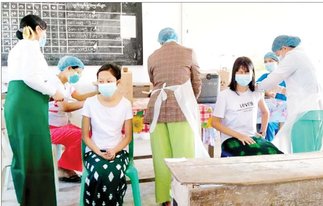
ရခိုင်ပြည်နယ် မြောက်ဦးမြို့နယ်၌ ကျောင်းသား ကျောင်းသူများအား ကိုဗစ်-၁၉ ရောဂါကာကွယ်ဆေးထိုးနှံပေးစဉ်။

နေပြည်တော် စက်တင်ဘာ ၁၂ တိုင်းဒေသကြီးနှင့် ပြည်နယ်အသီးသီး တို့၌ သံဃာတော်များ၊ သာသနာ့နွယ်ဝင် သီလရှင်များ၊ ဘာသာရေးခေါင်းဆောင် များ အပါအဝင် လူမျိုးမရွေး ဘာသာမရွေး ဒေသခံပြည်သူများ၊ အကျဉ်းသား အကျဉ်းသူများ၊ မသန်စွမ်းသူများ၊ တိုင်းရင်းသားလက်နက်ကိုင်အဖွဲ့များ၊ နာတာရှည်ရောဂါအခံရှိသူများ၊ ကယ်ဆယ် ရေးစခန်းများ၊ ယာယီတိုက်ပွဲရှောင်စခန်း များအတွင်းရှိ ပြည်သူများ၊ အသက် ငါးနှစ်မှ (၁၂)နှစ်အထက် အခြေခံပညာ မူလတန်း၊ အလယ်တန်းနှင့် အထက်တန်း အဆင့် ကျောင်းသား ကျောင်းသူများ စသည့် ဦးတည်အုပ်စုများ သတ်မှတ်၍ တပ်မတော်မှ ဆေးအဖွဲ့များ၊ ပြည်သူ့ ဆေးရုံများမှ ဆရာဝန်များ၊ သူနာပြုများ၊ ကျန်းမာရေးဝန်ထမ်းများနှင့် စေတနာ့ ဝန်ထမ်းများက ကာကွယ်ဆေးထိုးခြင်း လုပ်ငန်းများကို ဆောင်ရွက်ပေးလျက် ရှိသည်။ စာမျက်နှာ ၄ ကော်လံ ၁ သို့