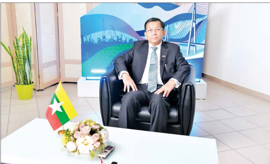
မေး။ ။ မြန်မာနိုင်ငံ စီးပွားရေးအခြေအနေနဲ့ပတ်သက်ပြီး ကိုဗစ်- ၁၉ ကူးစက်ရောဂါဒဏ်ခံရပြီးနောက်ပိုင်းမှာလည်း နိုင်ငံ တော်တော်များများဟာ စီးပွားရေး အားနည်းနေတာ ရှိပါတယ်။ လက်ရှိမြန်မာနိုင်ငံရဲ့ စီးပွားရေးအခြေအနေအတွင်းမှာ ရွေးကောက်ပွဲ ပြန်လည်ကျင်းပဖို့ ဖြစ်နိုင်မလား၊ သင့်တော်မလား။

ဖြေ။ ။ ကိုဗစ်-၁၉ ကပ်ရောဂါကြောင့် စီးပွားရေးကျဆင်းခဲ့တာတော့ မှန်ပါတယ်။ ကိုဗစ်-၁၉ ဖြစ်တာ ၂၀၂၀ ပြည့်နှစ် မတ်လမှာ မြန်မာနိုင်ငံမှာ စတင်တွေ့တာပေါ့။ အဲဒီမတိုင်ခင် စီးပွားရေးကျဆင်းနေတယ် ဆိုတဲ့ ကိန်းဂဏန်းတွေနဲ့ ဖော်ပြနေတော့၊ အဲဒီအရှိန်ကြောင့် ကိုဗစ်- ၁၉ ဖြစ်တဲ့အချိန်ပိုဆိုးခဲ့တယ်။ ဒုတိယကတော့ ဆူပူအကြမ်းဖက်မှု တွေဖြစ်လာတာကြောင့် စီးပွားရေးမလည်ပတ်နိုင်တဲ့အတွက် ကျဆင်း ခဲ့တာတွေရှိပါတယ်။ သို့သော်လည်းပဲ အခု ကိုဗစ်-၁၉ ရောဂါကို ထိန်းချုပ်နိုင်တဲ့ အခြေအနေကို ရောက်လာနိုင်တယ်။ ဆူပူအကြမ်းဖက် မှုတွေကိုလည်း တော်တော်ကို ထိန်းချုပ်နိုင်တဲ့ အခြေအနေကို ရောက်လာပါပြီ။ ဒါကြောင့် စီးပွားရေးက တည်ငြိမ်စပြုလာနိုင်ပြီလို့ ပြောနိုင်ပါတယ်။ ကျွန်တော်တို့ အစိုးရအနေနဲ့ စီးပွားရေး ပြန်လည် ဦးမော့လာအောင် ကြိုးစားဆောင်ရွက်နေပါတယ်။ အဲဒီတော့ နိုင်ငံရေးနဲ့ စီးပွားရေး ဆက်စပ်နေပါတယ်။ စီးပွားရေးကျဆင်းမယ်ဆိုရင် နိုင်ငံရေးက နည်းနည်းမတည်မငြိမ်ဖြစ်တတ်တဲ့ သဘောသဘာဝ ရှိပါတယ်။ ဒါကြောင့် ကျွန်တော်တို့က စီးပွားရေးကောင်းမွန်အောင် ပြန်လုပ်နေပါတယ်။ ရွေးကောက်ပွဲနဲ့ပတ်သက်ပြီးတော့ ကျွန်တော်တို့ နိုင်ငံမှာ ၂၀၁၀ ပြည့်နှစ်မှာ ပထမအကြိမ်၊ ၂၀၁၅ ခုနှစ်မှာ ဒုတိယ အကြိမ်၊ ၂၀၂၀ ပြည့်နှစ်မှာ တတိယအကြိမ် ပြုလုပ်ခဲ့ပါတယ်။ ပထမ အကြိမ်လုပ်တဲ့အချိန်မှာ မြို့နယ်ပေါင်း ၃၃၀ အနက် ၃၂၅ မြို့နယ် ပြုလုပ်နိုင်တယ်။ ဒုတိယအကြိမ်လုပ်တဲ့အချိန်မှာ မြို့နယ်ပေါင်း ၃၃၀ အနက် ၃၂၃ မြို့နယ် ပြုလုပ်နိုင်တယ်။ တတိယအကြိမ်လုပ်တဲ့အချိန်မှာ မြို့နယ်ပေါင်း ၃၃၀ အနက် ၃၁၅ မြို့နယ်သာ ရွေးကောက်ပွဲလုပ်နိုင်ခဲ့ တယ်။ ဒီမိုကရေစီမှာ ရွေးကောက်ပွဲက သိပ်အရေးကြီးပါတယ်။