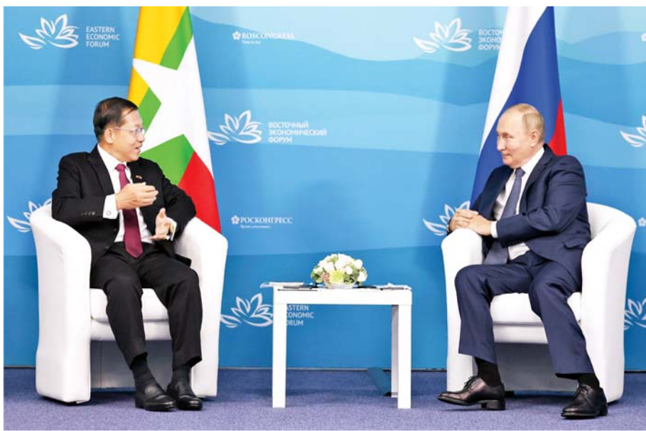
နိုင်ငံတော်စီမံအုပ်ချုပ်ရေးကောင်စီဥက္ကဋ္ဌ နိုင်ငံတော်ဝန်ကြီးချုပ် ဗိုလ်ချုပ်မှူးကြီးမင်းအောင်လှိုင် ရုရှားဖက်ဒရေးရှင်းနိုင်ငံသမ္မတ H.E. Vladimir Vladimirovich Putin နှင့် တွေ့ဆုံဆွေးနွေးစဉ်။

အိမ်ရှင်နိုင်ငံခေါင်းဆောင် Mr. Putin ၏ ကနဦး စကားတွင် ရုရှား-မြန်မာနှစ်နိုင်ငံ၏ ၂၀၂၃ ခုနှစ် တွင် ပြည့်မြောက်မည့် သံတမန်ဆက်ဆံရေး ထူထောင်မှု (၇၅) နှစ်မြောက် အခမ်းအနားကို ဂုဏ်ပြုဆောင်ရွက်မည်ဖြစ်ကြောင်းဖြင့် စသည်။ ကမ္ဘာ့နှစ်သက်မတ်ချက်များအရ(၇၅)နှစ်မြောက် ကို စိန်ရတုဟု သတ်မှတ်သည်။ စိန်ဟူသည်က ကမ္ဘာတွင် မာဂုဏ်အမြင့်ဆုံး၊ တန်ဖိုးအမြင့်ဆုံးသော ရတနာဟုသိထားရသည်မို့ အတိတ်အရ၊ နိမိတ်