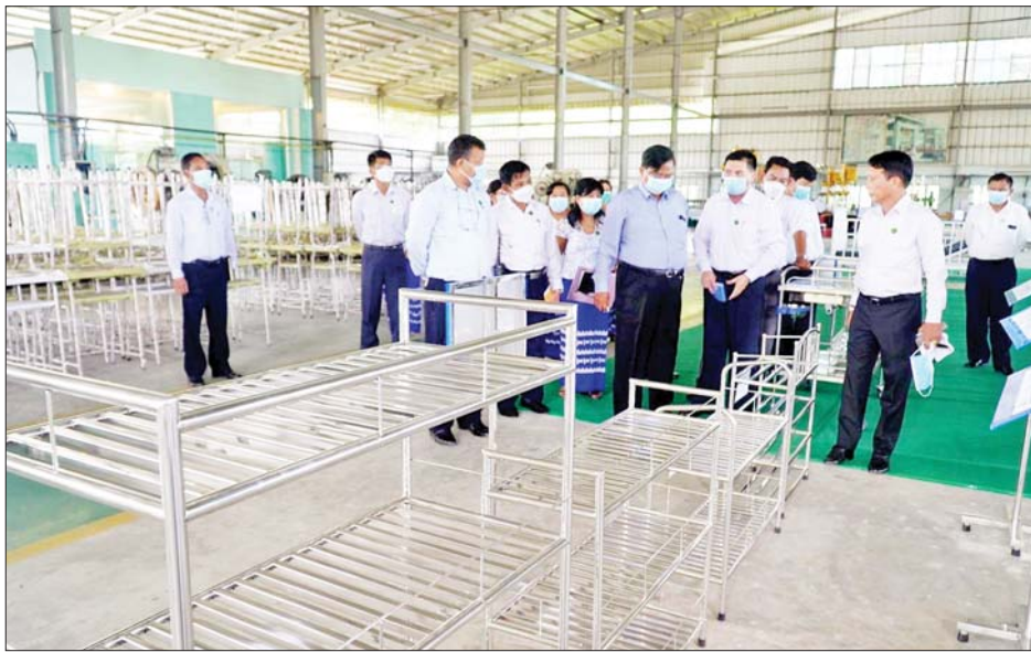
ပြည်ထောင်စုဝန်ကြီး ဒေါက်တာချာလီသန်း အိမ်သုံးပစ္စည်းစက်ရုံ (မင်းစု)တွင် ကြည့်ရှုစစ်ဆေးစဉ်။

နေပြည်တော် စက်တင်ဘာ ၁၂ မန္တလေးတိုင်းဒေသကြီး ကျောက်ဆည်စက်မှု နယ်မြေရှိ ပလတ်စတစ်စက်ရုံ(ကျောက်ဆည်)ကို ထုတ်လုပ်မှုလုပ်ငန်းများ ရပ်ဆိုင်းထားခဲ့ရသဖြင့် ပုဂ္ဂလိကနှင့် ပူးပေါင်းဆောင်ရွက်နိုင်ရန်အတွက် စက်မှုဝန်ကြီးဌာန ပြည်ထောင်စုဝန်ကြီး ဒေါက်တာ ချာလီသန်းသည် ယမန်နေ့က သွားရောက်ကြည့်ရှု စစ်ဆေးသည်။