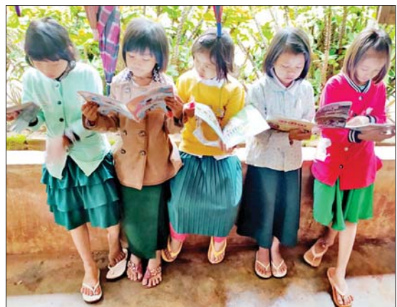
စာကြည့်တိုက်စနစ်ဖြင့် စာအုပ်များငှားရမ်းပေးခြင်း၊ ဖတ်ရှုပြီး စာအုပ်များ ပြန်လည်သိမ်းဆည်းခြင်း၊ အသစ်ထပ်မံ ငှားရမ်းဖတ်ရှုနိုင်ရန် ဆောင်ရွက်ပေးခြင်းနှင့် စာငှားအသင်းဝင်ကတ်များကို အခမဲ့ပြုလုပ်ပေးလျက်ရှိကြောင်း သိရသည်။

မိုးနဲ စက်တင်ဘာ ၁၂ ရှမ်းပြည်နယ်(တောင်ပိုင်း) မိုးနဲမြို့နယ် ပြန်ကြားရေးနှင့် ပြည်သူ့ဆက်ဆံရေးဦးစီးဌာနမှ ဝန်ထမ်းများက ကျောင်းသားလူငယ်၊ လူရွယ်များ ပြင်ပစာပေဗဟုသုတရရှိစေရန် စာဖတ်ရိုက်မြှင့်တင်နိုင်ရန်ရည်ရွယ်ပြီး ယနေ့ နံနက် ၁၀ နာရီတွင် ရွှေလျားစာကြည့်တိုက်စနစ်ဖြင့် ဥယျာဉ် အခြေခံပညာမူလတန်းကျောင်းသို့ သွားရောက်၍ စာအုပ်များ အခမဲ့ငှားရမ်းပေးခြင်းကို ဆောင်ရွက်ကြသည်။