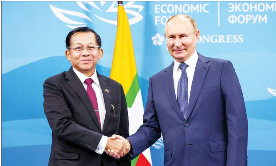
နိုင်ငံတော်စီမံအုပ်ချုပ်ရေးကောင်စီဥက္ကဋ္ဌ နိုင်ငံတော်ဝန်ကြီးချုပ် ဗိုလ်ချုပ်မှူးကြီးမင်းအောင်လှိုင်နှင့် ရုရှားဖက်ဒရေးရှင်းနိုင်ငံသမ္မတ H.E. Vladimir Vladimirovich Putin တို့ ခင်မင်ရင်းနှီးစွာ နှုတ်ဆက်ကြစဉ်။

ဤခရီးနီးသလားဆိုလျှင် နီးသည်ဟု ဝင့်ဝင့်ကြားကြား ဆိုနိုင်မည့်အနေအထား မြန်မာနိုင်ငံငြိမ်းချမ်းရေး၊ ကာကွယ်ရေး နယ်ပယ်၊ နည်းပညာဆိုင်ရာနယ်ပယ်များတွင် ပူးပေါင်းဆောင်ရွက်သွားရန် ကိစ္စများကိုလည်း ကျယ်ကျယ်ပြန့်ပြန့် ဆွေးနွေးသည်။ မြန်မာ့ တပ်မတော်အတွက် (ကြည်း၊ ရေ၊ လေ)နယ်ပယ်စုံ ကိစ္စရပ်များကို ကျယ်ကျယ်ပြန့်ပြန့် ဆွေးနွေး ခြင်းဖြစ်၍ အချိန်အတန်အသင့်တော့ကြာသည်။ ခေတ်မီမျိုးချစ်တပ်မတော်ဟု မြန်မာ့တပ်မတော် ကို ညွှန်းလေ့ရှိသည်။ အမျိုးချစ်သည်စိတ်ကမူ တပ်မတော်၏ရိုရင်းစွဲ။ အတန်ငယ်မျှဖြည့်စွက်ရန် ကျန်နေသည်က ခေတ်မီဟူသောစကားလုံးအတွက် သာ။ ယခုထိုစကားလုံးအတွက် တစ်လှမ်းမကသော ခြေလှမ်းများကို လှမ်းနေသည်။ ရှေ့သို့ချီနေသည်။ ဤခရီးနီးသလားဆိုလျှင် နီးသည်ဟု ဝင့်ဝင့် ကြားကြားဆိုနိုင်မည့် အနေအထားပင်ဖြစ်သည်။ နိုင်ငံအကြီးအကဲ၏ ပြန်လည်ဆွေးနွေးမှု သည်လည်း တက်တက်ကြွကြွရှိလှသည်။ လက်ရှိ တာဝန်ယူထားသည့်ကာလတွင် မကြာတော့သည့်