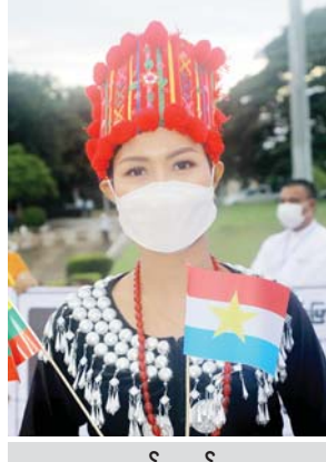
မထက်ထက်ဝေ