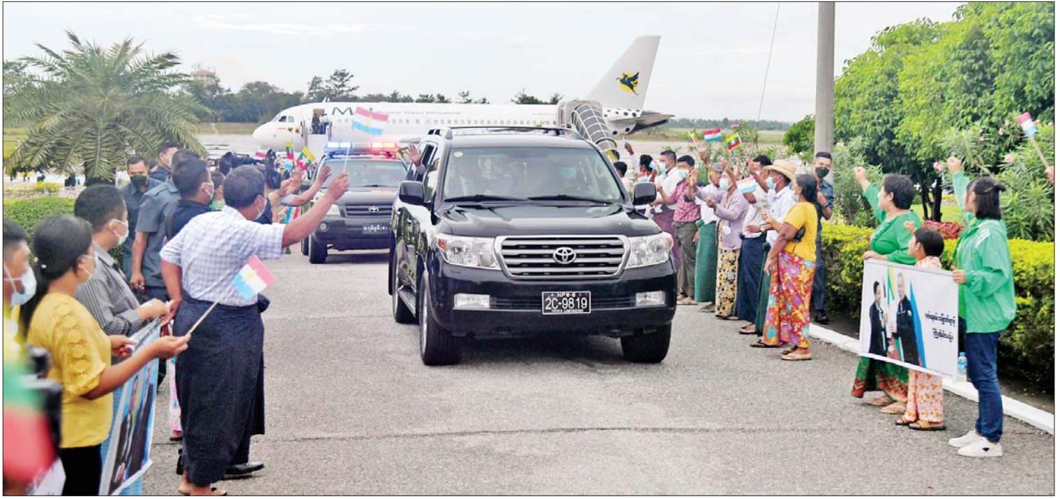
နိုင်ငံတော်စီမံအုပ်ချုပ်ရေးကောင်စီဥက္ကဋ္ဌ နိုင်ငံတော်ဝန်ကြီးချုပ် ဗိုလ်ချုပ်မှူးကြီးမင်းအောင်လှိုင် ဦးဆောင်သည့် မြန်မာအဆင့်မြင့်ကိုယ်စားလှယ်အဖွဲ့အား နေပြည်တော်တပ်မတော်လေဆိပ်တွင် ပြည်သူများက သောင်းသောင်းဖြူဖြူကြိုဆိုကြစဉ်။

ရုရှားနိုင်ငံမှ ပြန်လည်ရောက်ရှိလာသော နိုင်ငံတော်စီမံအုပ်ချုပ်ရေး ကောင်စီဥက္ကဋ္ဌ နိုင်ငံတော်ဝန်ကြီးချုပ် ဗိုလ်ချုပ်မှူးကြီး မင်းအောင်လှိုင် ဦးဆောင်သည့် မြန်မာအဆင့်မြင့် ကိုယ်စားလှယ်အဖွဲ့အား ကောင်စီ ဒုတိယဥက္ကဋ္ဌ ဒုတိယဝန်ကြီးချုပ် ဒုတိယ ဗိုလ်ချုပ်မှူးကြီးစိုးဝင်း၊ ကောင်စီဝင် များ၊ မြန်မာနိုင်ငံဆိုင်ရာ ရုရှား ဖက်ဒရေးရှင်း နိုင်ငံသံရုံးမှ သံရုံးဒုတိယ အကြီးအကဲ Mr. Pavel A. KLABUKOVI စစ်သံမှူး Colonel Sergei KURCHENKO နှင့် တာဝန်ရှိသူများက နေပြည်တော် တပ်မတော်လေဆိပ်၌ ကြိုဆိုနှုတ်ဆက် ကြစဉ်။