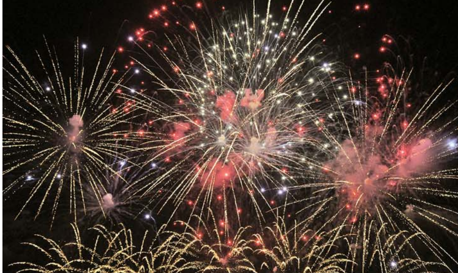
နိုင်ငံတော်စီမံအုပ်ချုပ်ရေးကောင်စီဥက္ကဋ္ဌ နိုင်ငံတော်ဝန်ကြီးချုပ် ဗိုလ်ချုပ်မှူးကြီးမင်းအောင်လှိုင်နှင့် အဖွဲ့ဝင်များ၊ Irkutsk ပြည်နယ်အစိုးရအဖွဲ့အကြီးအကဲ Mr. Igor Ivanovich Kobzev တို့ Irkutsk ပြည်နယ်တည်ထောင်မှု ၈၅ နှစ်ပြည့် အထိမ်းအမှတ်အဖြစ် မီးရှူးမီးပန်းများ ပစ်ဖောက်ဂုဏ်ပြုမှုကို ဒေသခံပြည်သူများနှင့်အတူ ကြည့်ရှုအားပေးစဉ်။

ထိုနေ့က နိုင်ငံတော်စီမံအုပ်ချုပ်ရေးကောင်စီဥက္ကဋ္ဌ နိုင်ငံတော်ဝန်ကြီးချုပ်နှင့် အဖွဲ့ဝင်များသည် Irkutsk ပြည်နယ်အစိုးရအဖွဲ့ရုံးအနီးရှိ ဒုတိယကမ္ဘာစစ်အတွင်း အသက်စွန့်ခဲ့ကြရသည့် ဆိုဗီယက်ပြည်ထောင်စုမှ စစ်သည်တော်များအား ဂုဏ်ပြုသောအားဖြင့် ထွန်းညှိထားသည့် မငြိမ်းသောမီး (Memorial Eternal Flame) နေရာသို့ ရောက်ရှိကြပြီး တိုင်းပြည်အတွက် အသက်ပေးလှူခဲ့ကြသည့် စစ်သည်များအား ဂုဏ်ပြုသောအားဖြင့် ဂုဏ်ပြုပန်းခွေချ အလေးပြုကြသည်။