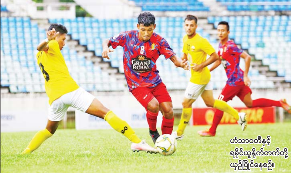
ဟံသာဝတီနှင့် ရခိုင်ယူနိုက်တက်တို့ ယှဉ်ပြိုင်နေစဉ်။

ရေကြည်မြို့နယ်၌ အခြေခံစားသောက်ကုန်များ ဈေးနှုန်းသက်သာစွာဖြင့် ရောင်းချ ရေကြည် စက်တင်ဘာ ၁၁ ဧရာဝတီတိုင်းဒေသကြီး ကျုံ့ပျော်ခရိုင် ရေကြည်မြို့နယ်တွင် ပြည်သူများ စားဝတ်နေရေး တစ်ဖက်တစ်လမ်းမှ အဆင်ပြေစေရန်အတွက် ဆန်၊ ဆီနှင့် အခြေခံစားသောက်ကုန်များအား ဈေးနှုန်းသက်သာစွာဖြင့် ဖြန့်ဖြူးရောင်းချပေးခြင်းကို ယနေ့နံနက် ၈ နာရီက ဆရာစံရပ်ကွက် အုပ်ချုပ်ရေးမှူးရုံးရှေ့ ဆောင်ရွက်ပေးခဲ့ကြောင်း သိရသည်။ စာမျက်နှာ ၁၆ ကော်လံ ၃ သို့ ❖