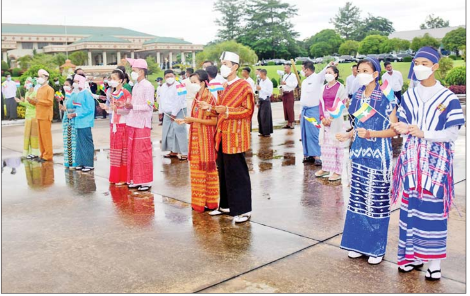
နိုင်ငံတော်စီမံအုပ်ချုပ်ရေးကောင်စီဥက္ကဋ္ဌ နိုင်ငံတော်ဝန်ကြီးချုပ် ဗိုလ်ချုပ်မှူးကြီးမင်းအောင်လှိုင် ဦးဆောင်သည့် မြန်မာအဆင့်မြင့်ကိုယ်စားလှယ်အဖွဲ့အား နေပြည်တော်တပ်မတော်လေဆိပ်တွင် ပြည်သူများက သောင်းသောင်းဖြူဖြူကြိုဆိုကြစဉ်။