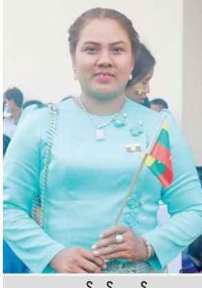
မရည်မွန်သက်