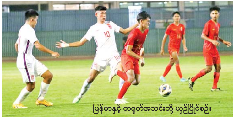
မြန်မာနှင့် တရုတ်အသင်းတို့ ယှဉ်ပြိုင်စဉ်။

ရန်ကုန် စက်တင်ဘာ ၁၁ ၂၀၂၃ အာရှဖလား ယူ-၂၀ ခြေစစ်ပွဲ အုပ်စု (က) ပထမနေ့အဖြစ် မြန်မာအသင်းနှင့် တရုတ်အသင်းတို့ မြန်မာစံတော်ချိန် စက်တင်ဘာ ၁၁ ရက် နံနက် ၁ နာရီက ဆော်ဒီ အာရေဗျနိုင်ငံ၌ ယှဉ်ပြိုင်ကစားရာ တရုတ်အသင်းက သုံးဂိုး-တစ်ဂိုးဖြင့် အနိုင်ရခဲ့သည်။