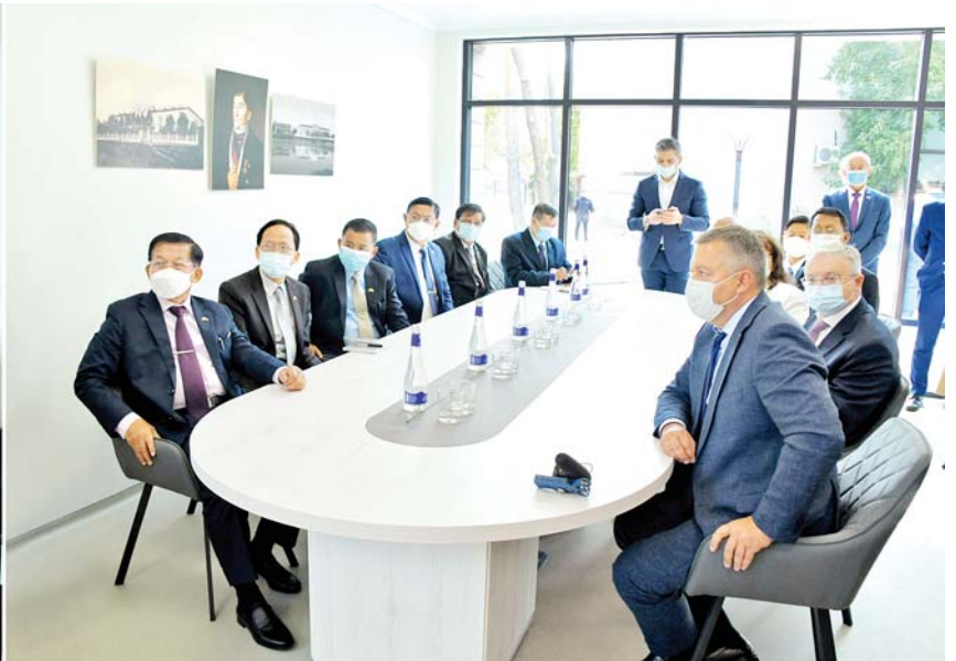
နိုင်ငံတော်စီမံအုပ်ချုပ်ရေးကောင်စီဥက္ကဋ္ဌ နိုင်ငံတော်ဝန်ကြီးချုပ် ဗိုလ်ချုပ်မှူးကြီးမင်းအောင်လှိုင်နှင့် အဖွဲ့ဝင်များအား Irkutsk Regional Children's Clinical Hospital မှ တာဝန်ရှိသူတစ်ဦးက ရှင်းလင်းတင်ပြစဉ်။

ဝင်စားစေပြီး လွယ်ကူရှင်းလင်းစွာဖြင့် ဘာသာရပ်ပိုင်းဆိုင်ရာများကို နားလည်တတ်ကျွမ်းမှုရှိအောင် သင်ကြားပေးနေသည့် အခြေအနေများ၊ စာကြည့်တိုက်များ၊ ကလေးအားကစားကွင်းများကို စိတ်ပါ ဝင်စားစွာဖြင့် လိုက်လံကြည့်ရှုလေ့လာခဲ့ကြရာ ကျောင်းအုပ်ကြီးက ရှင်းလင်းပြသသည်။ ရှင်းလင်း တင်ပြမှုများအပေါ် နိုင်ငံတော်စီမံ အုပ်ချုပ်ရေးကောင်စီဥက္ကဋ္ဌ နိုင်ငံတော်ဝန်ကြီးချုပ်က ပညာရည်အဆင့်မြင့်တင်ရေးဆိုင်ရာများတွင် ပူးပေါင်းဆောင်ရွက်နိုင်မည့် အခြေအနေများနှင့် အခြားသိရှိလိုသည်များကို ပြန်လည်မေးမြန်းဆွေးနွေးသည်။ ယင်းနောက် နိုင်ငံတော်စီမံအုပ်ချုပ်ရေးကောင်စီဥက္ကဋ္ဌ နိုင်ငံတော်ဝန်ကြီးချုပ်နှင့် အဖွဲ့ဝင်များသည် Irkutsk ပြည်နယ်အစိုးရအဖွဲ့အကြီးအကဲ၊ ကျောင်းအုပ်ကြီး၊ အဖွဲ့ဝင်များနှင့်အတူ စုပေါင်းမှတ်တမ်းတင် ဓာတ်ပုံရိုက်ခဲ့ကြောင်း သိရသည်။