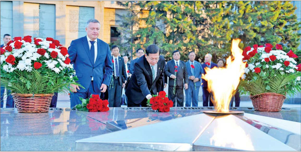
နိုင်ငံတော်စီမံအုပ်ချုပ်ရေးကောင်စီဥက္ကဋ္ဌ နိုင်ငံတော်ဝန်ကြီးချုပ် ဗိုလ်ချုပ်မှူးကြီးမင်းအောင်လှိုင်နှင့် အဖွဲ့ဝင်များ Irkutsk ပြည်နယ်အစိုးရအဖွဲ့ရုံးအနီးရှိ ဒုတိယကမ္ဘာစစ်အတွင်း အသက်စွန့်ခဲ့ကြရသည့် ဆိုဗီယက်ပြည်ထောင်စုမှ စစ်သည်တော်များအား ဂုဏ်ပြုသောအားဖြင့် ထွန်းညှိထားသည့် မငြိမ်းသောမီးနေရာ၌ တိုင်းပြည်အတွက် အသက်ပေးလှူခဲ့ကြသည့် စစ်သည်များအား ဂုဏ်ပြုပန်းခွေချ အလေးပြုကြစဉ်။

တက်ရောက် အဆိုပါ တွေ့ဆုံဆွေးနွေးပွဲသို့ နိုင်ငံတော်စီမံအုပ်ချုပ်ရေးကောင်စီ ဥက္ကဋ္ဌ နိုင်ငံတော်ဝန်ကြီးချုပ်နှင့် အတူ ခရီးစဉ်တွင် လိုက်ပါလာသည့် နိုင်ငံတော်အဆင့်၊ ပြည်ထောင်စုအဆင့် ပုဂ္ဂိုလ်များ၊ တပ်မတော်အရာရှိကြီးများ၊ ရုရှားနိုင်ငံဆိုင်ရာ မြန်မာနိုင်ငံသံအမတ်ကြီး ဦးလွင်ဦးနှင့် မြန်မာစစ်သံ (ကြည်း၊ ရေ၊ လေ) ဗိုလ်မှူးချုပ် မိုးကျော်တို့ တက်ရောက်ကြပြီး Irkutsk ပြည်နယ်အစိုးရအဖွဲ့ အကြီးအကဲနှင့်အတူ Irkutsk ပြည်နယ်ရှိ ရုရှားဖက်ဒရေးရှင်းနိုင်ငံ နိုင်ငံခြားရေးဝန်ကြီးဌာနမှ နယ်မြေဆိုင်ရာ အကြီးအကဲ