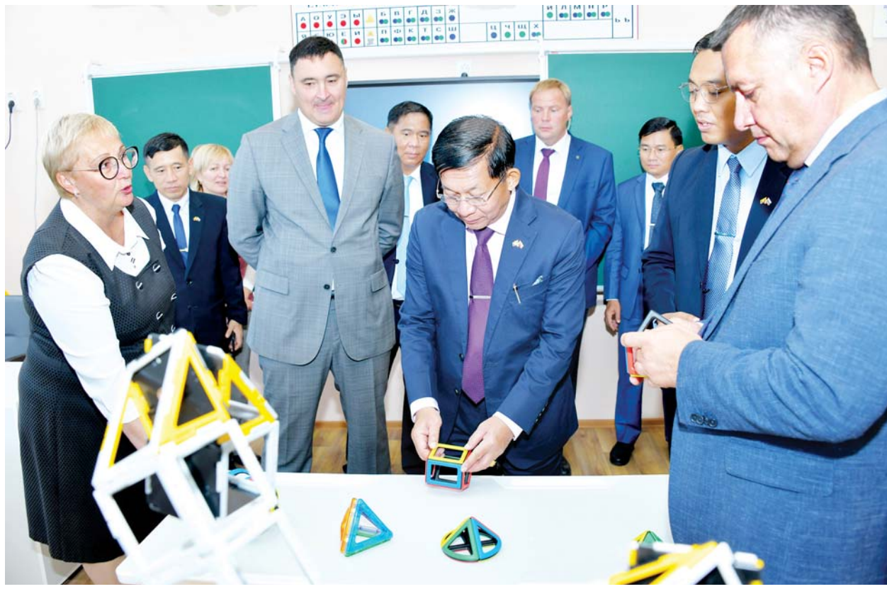
နိုင်ငံတော်စီမံအုပ်ချုပ်ရေးကောင်စီဥက္ကဋ္ဌ နိုင်ငံတော်ဝန်ကြီးချုပ် ဗိုလ်ချုပ်မှူးကြီးမင်းအောင်လှိုင်နှင့် အဖွဲ့ဝင်များ အမှတ်(၁၄) အခြေခံပညာအလယ်တန်းကျောင်း MBOU Zakharovkaya Secondary School Moscow တွင် ကြည့်ရှုလေ့လာကြစဉ်။

★ ကျန်းမာရေး စောင့်ရှောက်မှုဆိုင်ရာများတွင် ပူးပေါင်းဆောင်ရွက်နိုင်မည့် အခြေအနေများနှင့် အခြားသိရှိလိုသည်များ ပြန်လည်မေးမြန်းဆွေးနွေး ★ မူလတန်းကျောင်းသူ ကျောင်းသားများကို ပညာသင်ကြားပေးနေမှုစနစ်များ၊ အဆင့်မြင့်သင်ကြားမှု၊ သင်ယူမှုအထောက်အကူပြု နည်းပညာသုံး၍ ကလေးငယ်များကို စိတ်ပါဝင်စားစေပြီး လွယ်ကူရှင်းလင်းစွာဖြင့် ဘာသာရပ်ပိုင်းဆိုင်ရာများကို နားလည်တတ်ကျွမ်းမှုရှိအောင် သင်ကြားပေးနေသည့် အခြေအနေများ၊ စာကြည့်တိုက်များ၊ ကလေးအားကစားကွင်းများကို စိတ်ပါဝင်စားစွာဖြင့် လိုက်လံကြည့်ရှုလေ့လာ