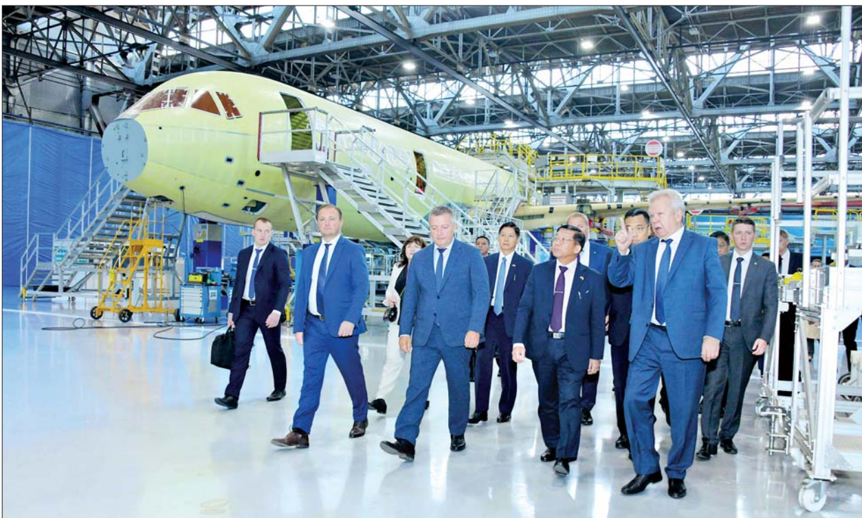
နိုင်ငံတော်စီမံအုပ်ချုပ်ရေးကောင်စီဥက္ကဋ္ဌ နိုင်ငံတော်ဝန်ကြီးချုပ် ဗိုလ်ချုပ်မှူးကြီးမင်းအောင်လှိုင်နှင့် အဖွဲ့ဝင်များ Irkutsk မြို့ရှိ လေယာဉ် ထုတ်လုပ်ရေးစက်ရုံ Irkutsk Aviation Plant အတွင်း ကြည့်ရှုလေ့လာစဉ်။

နှုတ်ဆက်ကြသည်။ ထို့နောက် အလုပ်ရုံအတွင်း MC-21 300 ခရီး သည်တင် လေယာဉ်ကြီးများ ထုတ်လုပ်ရန်အတွက် အစိတ် အပိုင်းတစ်ခုချင်းစီအလိုက် sector များခွဲကာ Robotic System များ၊ Automatic Machine များဖြင့် တပ်ဆင်နေမှုများ၊ ထိုမှတစ်ဆင့် လေယာဉ် ကိုယ်ထည်ပိုင်း၊ တောင်ပံပိုင်း၊ အင်ဂျင်ပိုင်းများကို အဆင့်ဆင့် တပ်ဆင်တွဲဆက်နေမှု များ၊ စက်ခေါင်းခန်းအတွင်း ထိန်းချုပ်မှု System များ၊ အတွင်း ပိုင်း အပြင်အဆင်များကို အဆင့် မြင့်တင် ဆောင်ရွက်ထားရှိမှုများ၊ လေယာဉ်ထုတ်လုပ်နေမှု အခြေ အနေများနှင့် လေယာဉ်၏