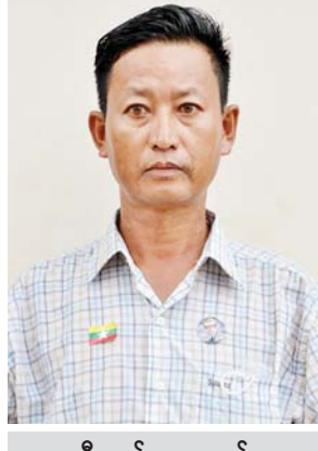
ဦးဇော်တူးအောင်

ကျွန်မအနေနဲ့ကျေးဇူးတင်ပါတယ်။ ရုရှား-မြန်မာ ချစ်ကြည်ရေးအခွန်ရည်တည်တံ့ခိုင်မြဲပါစေ၊ နိုင်ငံတော်ဝန်ကြီးချုပ် ဗိုလ်ချုပ်မှူးကြီးမင်းအောင်လှိုင် ကျန်းမာပါစေ။ ဦးဇော်တူးအောင်