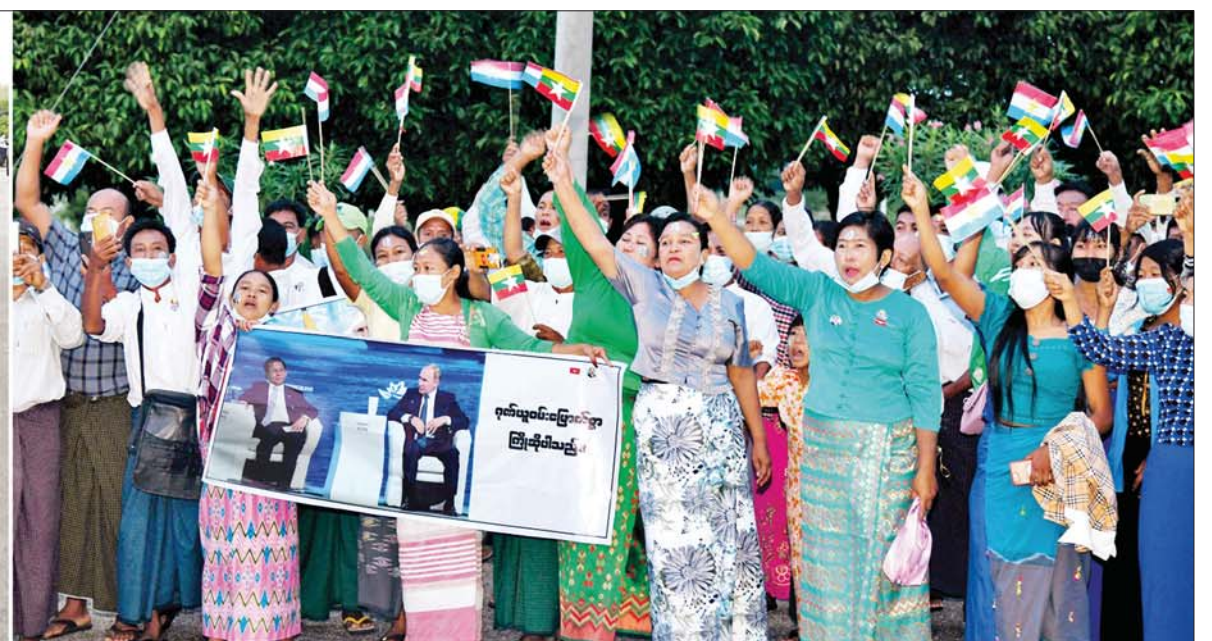
နိုင်ငံတော်စီမံအုပ်ချုပ်ရေးကောင်စီဥက္ကဋ္ဌ နိုင်ငံတော်ဝန်ကြီးချုပ် ဗိုလ်ချုပ်မှူးကြီးမင်းအောင်လှိုင် ဦးဆောင်သည့် မြန်မာအဆင့်မြင့်ကိုယ်စားလှယ်အဖွဲ့အား နေပြည်တော်တပ်မတော်လေဆိပ်မှ ထွက်ခွာလာသည့်လမ်းတစ်လျှောက် ပြည်သူများက သောင်းသောင်းဖြဖြဂုဏ်ပြုကြိုဆိုကြသည်။