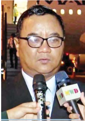
ဗိုလ်ချုပ်စော်မင်းထွန်း

ရုရှားခရီးစဉ်အတွင်း (၇)ကြိမ်မြောက် အရှေ့ဖျားစီးပွားရေးဖိုရမ်သို့ တက်ရောက်ခြင်း၊ ရုရှားဖက်ဒရေးရှင်းနိုင်ငံ အစိုးရအဖွဲ့တာဝန်ရှိသူများနှင့် တွေ့ဆုံဆွေးနွေးခြင်း၊ ရုရှားဖက်ဒရေးရှင်းနိုင်ငံရှိ အထင်ကရနေရာများ၊ တက္ကသိုလ်များနှင့် စက်ရုံ၊ အလုပ်ရုံများသို့ သွားရောက်လေ့လာခဲ့ခြင်းနှင့် ခရီးစဉ်တွင် လိုက်ပါလာသည့် ပြည်ထောင်စုဝန်ကြီးများ၊ ဒုတိယဝန်ကြီးများနှင့် တာဝန်ရှိသူများသည် သက်ဆိုင်ရာကဏ္ဍများအလိုက် အလုပ်သဘောဆိုင်ရာ တွေ့ဆုံဆွေးနွေးခြင်းများကို ဆောင်ရွက်ခဲ့ကြပြီး နှစ်နိုင်ငံအစိုးရနှင့် ပြည်သူများအကြား ချစ်ကြည်ရေး၊ စီးပွားရေးနှင့် ကဏ္ဍပေါင်းစုံတွင် ပူးပေါင်းဆောင်ရွက်မှုများ ပိုမိုတိုးတက်ခိုင်မာအောင် ဆောင်ရွက်ခဲ့ကြသည့် နိုင်ငံတော်စီမံအုပ်ချုပ်ရေးကောင်စီဥက္ကဋ္ဌ နိုင်ငံတော်ဝန်ကြီးချုပ် ဗိုလ်ချုပ်မှူးကြီးမင်းအောင်လှိုင်နှင့် အကြီးအကဲများသည် စက်တင်ဘာ ၁၁ ရက် ညနေပိုင်းတွင် နေပြည်တော်လေဆိပ်သို့ ပြန်လည်ရောက်ရှိလာကြသည်။ ထိုသို့ပြန်လည်ရောက်ရှိလာကြသည့် နိုင်ငံတော်စီမံအုပ်ချုပ်ရေးကောင်စီဥက္ကဋ္ဌ နိုင်ငံတော်ဝန်ကြီးချုပ် ဗိုလ်ချုပ်မှူးကြီးမင်းအောင်လှိုင်နှင့် အကြီးအကဲများကို ဒေသခံပြည်သူများက ကြိုဆိုကြသည်။ အဆိုပါခရီးစဉ်တွင် လိုက်ပါခဲ့သော တာဝန်ရှိသူနှင့် လာရောက်ကြိုဆိုကြသူများ၏စကားသံများကိုမျှဝေပေးလိုက်ရပါသည်။