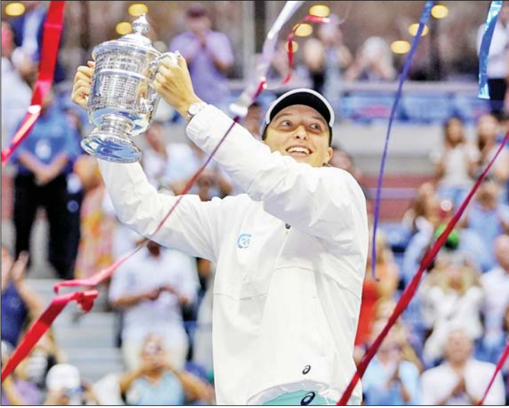
ပိုလန်တင်းနစ်မယ် ဆွီယာတက်ခ် အမေရိကန်အိုးပင်း တင်းနစ် ဆုဖလားနှင့် အတူ အောင်ပွဲခံနေစဉ်။