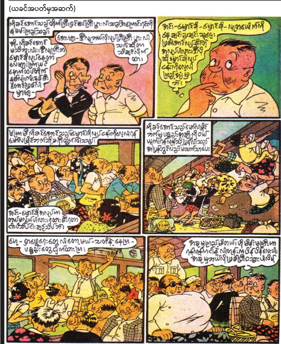
ဆရာကြီးသန်းကြွယ်၏ ကာတွန်းလက်ရာများကို မူရင်းအတိုင်း ဖော်ပြပါသည်။ (ယခင်အပတ်မှအဆက်)

ဆရာကြီးမင်းယုဝေ၏ လက်ရွေးစင်ပုံပြင်ပေါင်းချုပ်စာအုပ်မှ ပုံပြင်ကို စာရေးသူမိသားစု၏ ခွင့်ပြုချက်ဖြင့် ကူးယူဖော်ပြပါသည်။