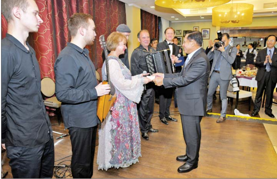
နိုင်ငံတော်စီမံအုပ်ချုပ်ရေးကောင်စီဥက္ကဋ္ဌ နိုင်ငံတော်ဝန်ကြီးချုပ် ဗိုလ်ချုပ်မှူးကြီးမင်းအောင်လှိုင် ရိုးရာတေးသီချင်း၊ အကအလှများဖြင့် သီဆိုဖျော်ဖြေတင်ဆက်ခဲ့ကြသည့် အနုပညာရှင်အဖွဲ့အား ဂုဏ်ပြုချီးမြှင့်ငွေများ ပေးအပ်စဉ်။

ပြည်နယ်အစိုးရအဖွဲ့အကြီးအကဲတို့သည် အမှတ်တရလက်ဆောင်ပစ္စည်းများ အပြန်အလှန်ပေးအပ်ကြပြီး တက်ရောက်လာကြသူများနှင့်အတူ အမှတ်တရ စုပေါင်းဓာတ်ပုံရိုက်ခဲ့ကြသည်။ ဂုဏ်ပြုပန်းခွေချအလေးပြုထိုနေ့က နိုင်ငံတော်စီမံအုပ်ချုပ်ရေးကောင်စီဥက္ကဋ္ဌ နိုင်ငံတော်ဝန်ကြီးချုပ်နှင့် အဖွဲ့ဝင်များသည် Irkutsk ပြည်နယ်အစိုးရအဖွဲ့ရုံးအနီးရှိ ဒုတိယကမ္ဘာစစ်အတွင်း အသက်စွန့်ခဲ့ကြရသည့် ဆိုဗီယက်ပြည်ထောင်စုမှ စစ်သည်တော်များအား ဂုဏ်ပြုသောအားဖြင့် ထွန်းညှိထားသည့် မငြိမ်းသောမီး (Memorial Eternal Flame) နေရာသို့ ရောက်ရှိကြပြီး တိုင်းပြည်အတွက် အသက်ပေးလှူခဲ့ကြသည့် စစ်သည်များအား ဂုဏ်ပြုသောအားဖြင့် ဂုဏ်ပြုပန်းခွေချ အလေးပြုကြသည်။