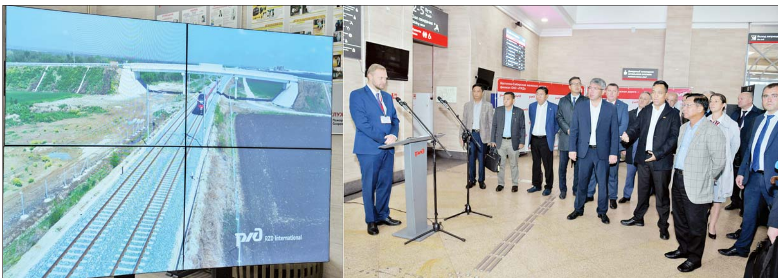
နိုင်ငံတော်စီမံအုပ်ချုပ်ရေးကောင်စီဥက္ကဋ္ဌ နိုင်ငံတော်ဝန်ကြီးချုပ် ဗိုလ်ချုပ်မှူးကြီးမင်းအောင်လှိုင်နှင့် အဖွဲ့ဝင်များအား RZD “Russian Railways” မီးရထားလုပ်ငန်း၏ RZD International Railways မှ တာဝန်ရှိသူတစ်ဦးက ဘူတာရုံအတွင်း၌ ရှင်းလင်းပြသစဉ်။

ရှင်းလင်းပြသ ဦးစွာ နိုင်ငံတော်စီမံအုပ်ချုပ်ရေး ကောင်စီဥက္ကဋ္ဌ နိုင်ငံတော် ဝန်ကြီးချုပ်နှင့် အဖွဲ့ဝင်များသည် Ulan-Ude မြို့ရှိ Trans-Siberian မီးရထားလမ်းနှင့် Trans- Mongolian မီးရထားလမ်း တစ်လျှောက် အဓိကကျပြီး အရေးပါသည့် ဘူတာရုံတစ်ခု ဖြစ်သည့် Ulan-Ude ဘူတာရုံသို့ ရောက်ရှိကြရာ RZD “Russian Railways” မီးရထားလုပ်ငန်း၏ RZD International Railways မှ General Director Mr.Sergey Stolyarov နှင့် အဖွဲ့ဝင်များက