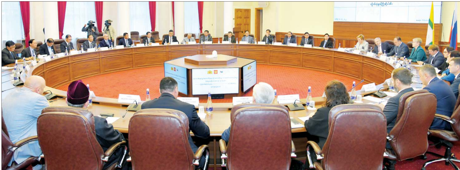
နိုင်ငံတော်စီမံအုပ်ချုပ်ရေးကောင်စီဥက္ကဋ္ဌ နိုင်ငံတော်ဝန်ကြီးချုပ် ဗိုလ်ချုပ်မှူးကြီးမင်းအောင်လှိုင် Irkutsk ပြည်နယ်အစိုးရအဖွဲ့အကြီးအကဲ Mr. Igor Ivanovich Kobzevနှင့် Irkutsk ပြည်နယ်အစိုးရအဖွဲ့ရုံးတွင် တွေ့ဆုံဆွေးနွေးစဉ်။

ထို့နောက် နိုင်ငံတော်စီမံ အုပ်ချုပ်ရေးကောင်စီ ဥက္ကဋ္ဌ နိုင်ငံတော်ဝန်ကြီးချုပ်နှင့် အဖွဲ့ဝင် များသည် မွန်ဂိုလှိုင်တွင် Irkutsk မြို့ Passazhirskiy ဘူတာရုံသို့ ရောက်ရှိကြရာ Irkutsk ပြည်နယ် စာမျက်နှာ ၇ သို့ >>>