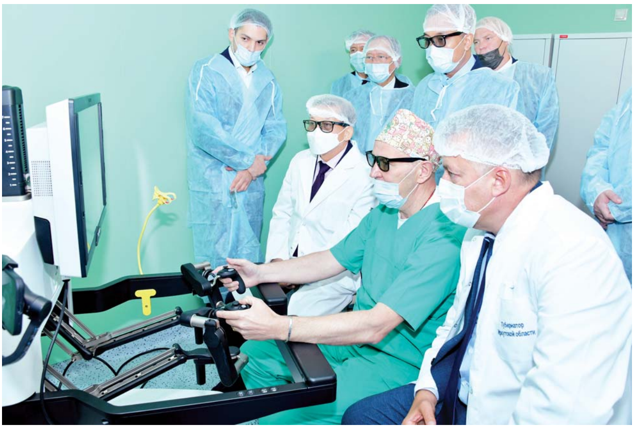
နိုင်ငံတော်စီမံအုပ်ချုပ်ရေးကောင်စီဥက္ကဋ္ဌ နိုင်ငံတော်ဝန်ကြီးချုပ် ဗိုလ်ချုပ်မှူးကြီးမင်းအောင်လှိုင်နှင့် အဖွဲ့ဝင်များအား Irkutsk Regional Children's Clinical Hospital မှ တာဝန်ရှိသူတစ်ဦးက စမ်းသပ်ခွဲစိတ်ကုသမှုတစ်ခုကို သရုပ်ပြခွဲစိတ်ပြသစဉ်။

ဝင်စားစေပြီး လွယ်ကူရှင်းလင်းစွာဖြင့် ဘာသာရပ်ပိုင်းဆိုင်ရာများကို နားလည်တတ်ကျွမ်းမှုရှိအောင် သင်ကြားပေးနေသည့် အခြေအနေများ၊ စာကြည့်တိုက်များ၊ ကလေးအားကစားကွင်းများကို စိတ်ပါ ဝင်စားစွာဖြင့် လိုက်လံကြည့်ရှုလေ့လာခဲ့ကြရာ ကျောင်းအုပ်ကြီးက ရှင်းလင်းပြသသည်။ ရှင်းလင်း တင်ပြမှုများအပေါ် နိုင်ငံတော်စီမံ အုပ်ချုပ်ရေးကောင်စီဥက္ကဋ္ဌ နိုင်ငံတော်ဝန်ကြီးချုပ်က ပညာရည်အဆင့်မြင့်တင်ရေးဆိုင်ရာများတွင် ပူးပေါင်းဆောင်ရွက်နိုင်မည့် အခြေအနေများနှင့် အခြားသိရှိလိုသည်များကို ပြန်လည်မေးမြန်းဆွေးနွေးသည်။ ယင်းနောက် နိုင်ငံတော်စီမံအုပ်ချုပ်ရေးကောင်စီဥက္ကဋ္ဌ နိုင်ငံတော်ဝန်ကြီးချုပ်နှင့် အဖွဲ့ဝင်များသည် Irkutsk ပြည်နယ်အစိုးရအဖွဲ့အကြီးအကဲ၊ ကျောင်းအုပ်ကြီး၊ အဖွဲ့ဝင်များနှင့်အတူ စုပေါင်းမှတ်တမ်းတင် ဓာတ်ပုံရိုက်ခဲ့ကြောင်း သိရသည်။