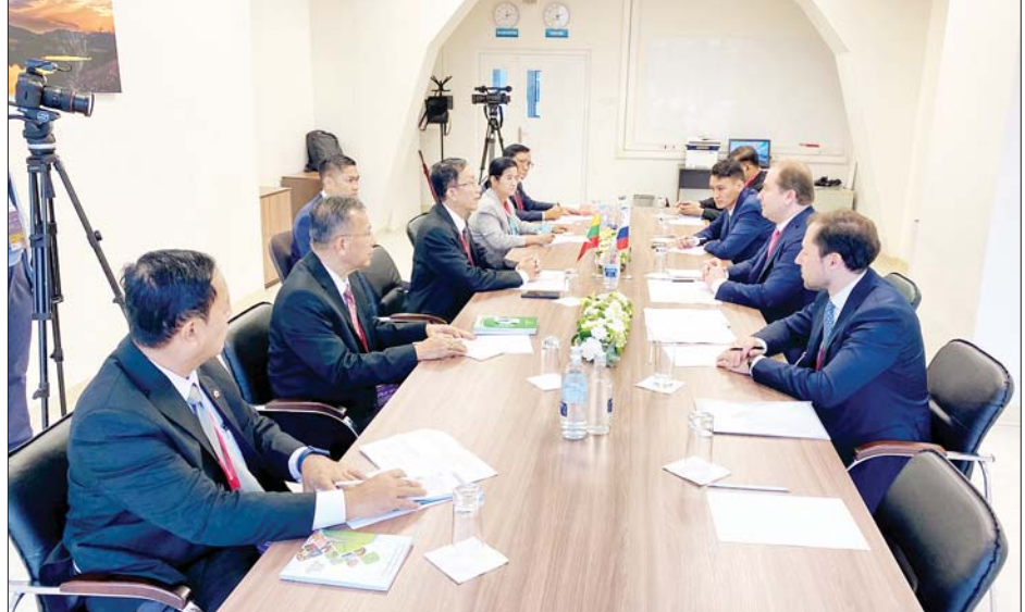
ပြည်ထောင်စုဝန်ကြီးများဖြစ်ကြသည့် ဦးဝင်းရှိန်၊ ဒေါက်တာကံဇော်၊ ဦးလှမိုး၊ မြန်မာနိုင်ငံ ဗဟိုဘဏ် ဥက္ကဋ္ဌ ဒေါ်သန်းသန်းဆွေနှင့် ဒုတိယဝန်ကြီး ဦးကျော်မျိုးထွဋ်တို့ ရုရှားဖက်ဒရေးရှင်းနိုင်ငံ ဖွံ့ဖြိုးတိုးတက်ရေး ဆိုင်ရာ ပြည်နယ်များ ပူးပေါင်းဆောင်ရွက်မှုအဖွဲ့ အမှုဆောင်အရာရှိချုပ်နှင့် ရုရှား-အာဆီယံစီးပွားရေး ကောင်စီဥက္ကဋ္ဌ Mr. Ivan Polyakov ဦးဆောင်သောအဖွဲ့နှင့် တွေ့ဆုံဆွေးနွေးစဉ်။