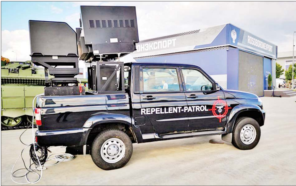
Repellent-Patrol ရွေ့လျားအိလက်ထရွန်နစ်စစ်ဆင်ရေးစနစ်။