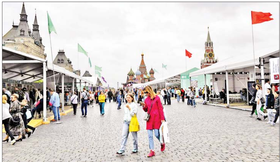
၂၀၂၂ ခုနှစ် ဇွန် ၃ ရက်က ရုရှားနိုင်ငံ မော်စကိုမြို့ရှိ ရင်ပြင်နီဗ် ကျင်းပသော စာအုပ်ပွဲတော်သို့ တက်ရောက်လာသူများကို တွေ့ရစဉ်။