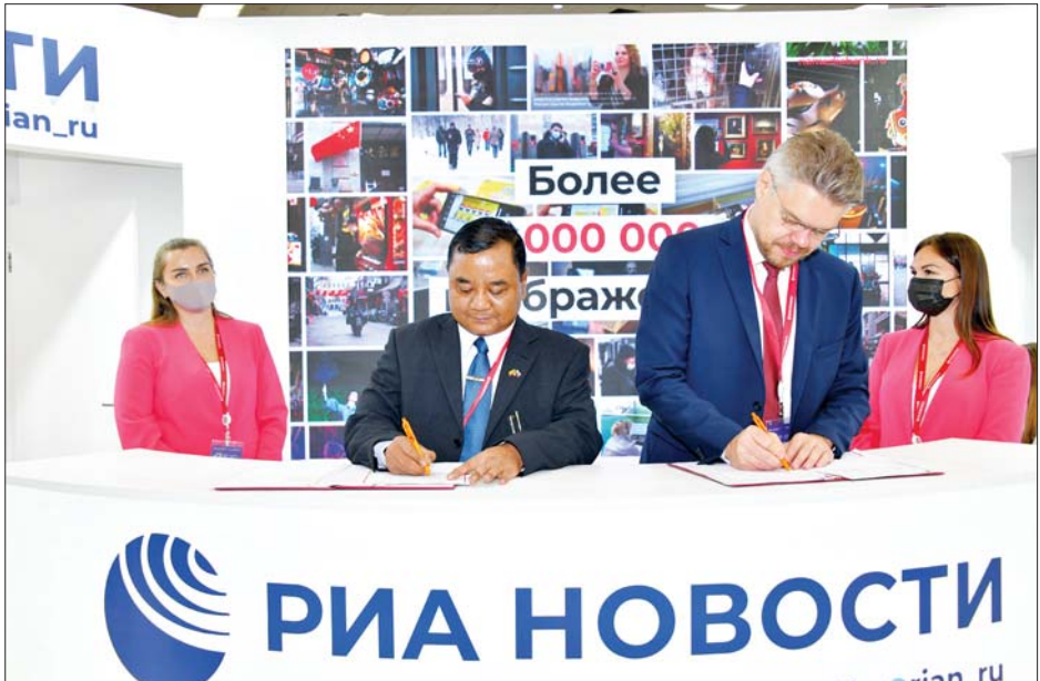
ဒုတိယဝန်ကြီး ဗိုလ်ချုပ်ဇော်မင်းထွန်း ရုရှားဖက်ဒရေးရှင်းနိုင်ငံပိုင် Sputnik news agency နှင့် မြဝတီရုပ်မြင်သံကြားတို့အကြား နှစ်ဖက်သဘောတူညီမှုဆိုင်ရာ စာချုပ်လွှာတစ်ရပ်ကို အတည်ပြုလက်မှတ် ရေးထိုးစဉ်။

ရေးစနစ်တွင် တွေ့ကြုံရသော အခက်အခဲများ၊ ထိုအခက်အခဲများ ကျော်ဖြတ်ရန် ကြိုးပမ်းမှုများ၊ နိုင်ငံအချင်းချင်းပူးပေါင်းဆောင်ရွက်ခြင်းဖြင့် ရရှိနိုင် မည့် အခွင့်အလမ်းများ၊ တိုးတက်လာသော နည်းပညာများကိုသုံး၍ ရောဂါရှာဖွေရေး၊ ကင်ဆာ ရောဂါများကုသရေး၊ ကူးစက်မြန်ရောဂါများ ထိန်းချုပ်ရေးနှင့် အဆိုပါနည်းပညာများ ဖွံ့ဖြိုးဆဲ နိုင်ငံများကို မျှဝေနိုင်မည့် အစီအစဉ်များနှင့် ပတ်သက်၍လည်းကောင်း၊ သိပ္ပံနှင့်နည်းပညာဝန်ကြီး ဌာန ပြည်ထောင်စုဝန်ကြီး ဒေါက်တာမျိုးသိန်းကျော် သည် Eastern Economic Forum-2022 ၏ Strategic Technical Alliance တွင် ပါဝင်တက်ရောက် ခဲ့ပြီး ကိုဗစ်-၁၉ အလွန်ကာလ ပညာရေးဆိုင်ရာ ပြုပြင်ပြောင်းလဲသင့်သည့် အချက်များကိုလည်း ကောင်း ဆွေးနွေးခဲ့ကြသည်။ အတည်ပြုလက်မှတ်ရေးထိုး ထိုပြင် ပြန်ကြားရေးဝန်ကြီးဌာန ဒုတိယဝန်ကြီး ဗိုလ်ချုပ်ဇော်မင်းထွန်းသည် ရုရှားဖက်ဒရေးရှင်းနိုင်ငံ ပိုင် Sputnik news agency နှင့် မြဝတီရုပ်မြင်သံကြား တို့အကြား နှစ်ဖက်သဘောတူညီမှုဆိုင်ရာ စာချုပ်လွှာ