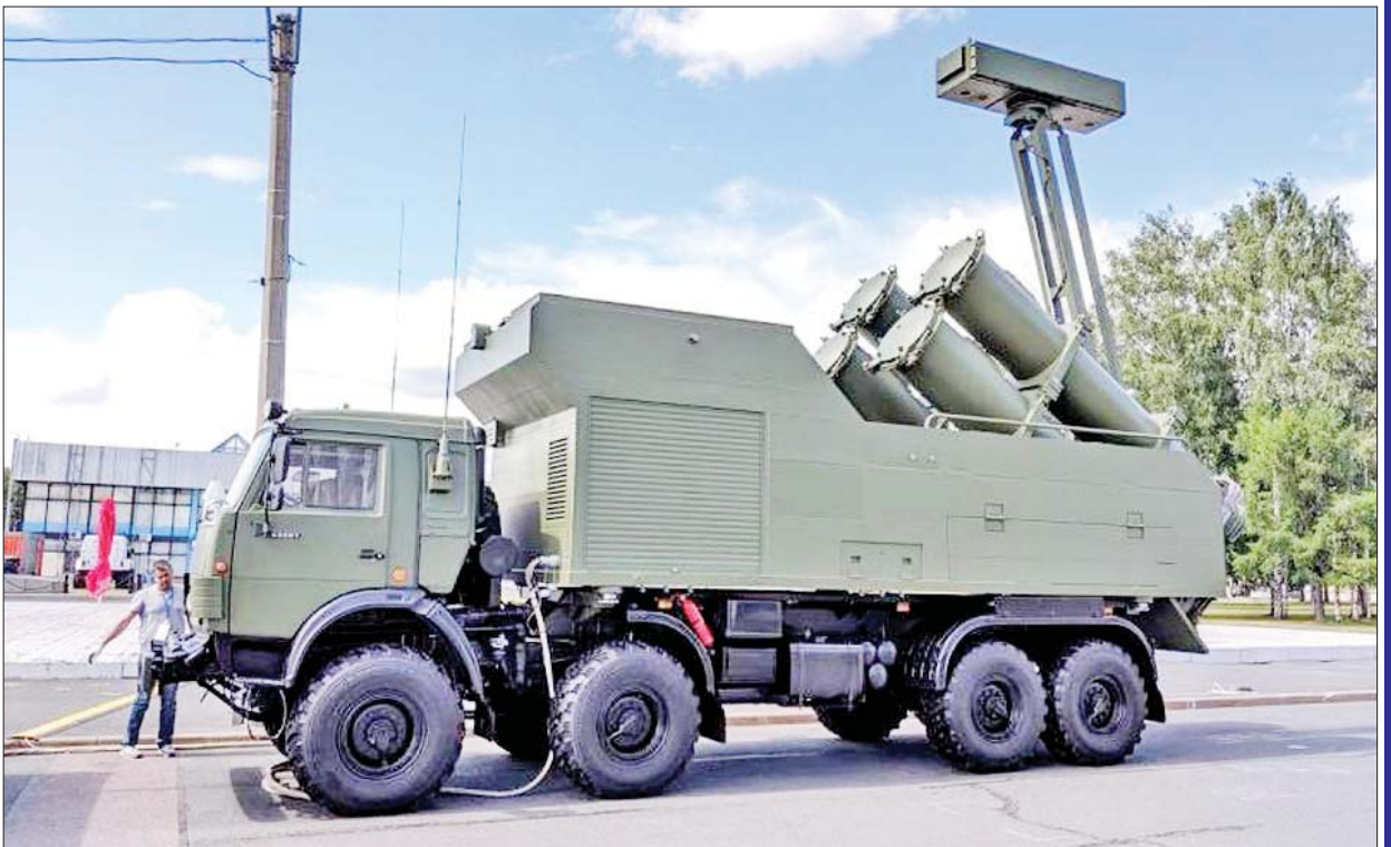
Rubezh-ME ကမ်းရိုးတန်းကာကွယ်ရေး ခိုးကျည်စနစ်။

High Precision Systems ကုမ္ပဏီက မြေပြင်နဲ့ ဝေဟင်ပစ်မှတ်တွေကို တိုက်ခိုက်နိုင်ရေးအတွက်ရည်ရွယ်ပြီး လှိုင်းနှုန်းဖိဖျက်မှုကို ခံနိုင်ရည်ရှိတဲ့ လေဆာအလင်းတန်းထိန်းချုပ်ရေးစနစ်ပါ ရွေ့လျားနေ့/ည တိကျပုံထိန်းတာဝေးပစ်ခိုးကျည်စနစ်ဖြစ်တဲ့ Kornet-EM ကို ထုတ်ဖော်ပြသခဲ့ပါတယ်။ ထိရောက်မှုအကွာအဝေးက ၁၀ ကီလို