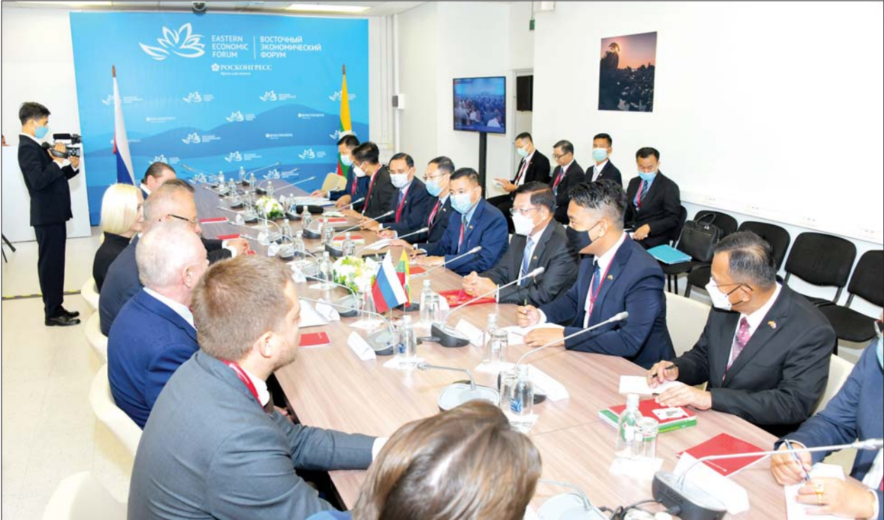
နိုင်ငံတော်စီမံအုပ်ချုပ်ရေးကောင်စီဥက္ကဋ္ဌ နိုင်ငံတော်ဝန်ကြီးချုပ် ဗိုလ်ချုပ်မှူးကြီးမင်းအောင်လှိုင် ရုရှားဖက်ဒရေးရှင်းနိုင်ငံသမ္မတ၏ အကြံပေးနှင့် ဖိုရမ်ဖြစ်မြောက်ရေးကော်မတီအထူးအတွင်းရေးမှူး Mr. Anton Kobayakov နှင့် တွေ့ဆုံဆွေးနွေးစဉ်။

ထိုသို့တွေ့ဆုံရာတွင် (၇) ကြိမ်မြောက် အရှေ့ပူးစီးပွားရေးဖိုရမ် (The 7th Eastern Economic Forum-2022)ကို တက်ရောက်နိုင်ရေး ဖိတ်ကြားခဲ့သည့် အခြေအနေများနှင့် ဧည့်ဝတ်ကျေပွန်မှုများအတွက် ကျေးဇူးတင်ရှိသည့်အခြေအနေများ၊ လာမည့်နှစ်တွင် ရုရှားဖက်ဒရေးရှင်းနိုင်ငံနှင့် မြန်မာနိုင်ငံအကြား သံတမန်ဆက်ဆံမှု ၇၅ နှစ်ပြည့်မြောက် မည်ဖြစ်ပြီး တစ်နိုင်ငံနှင့်တစ်နိုင်ငံအကြား၊ တပ်မတော်နှစ်ရပ်အကြား မိတ်ဆွေကောင်းပီသစွာဖြင့် ဆက်ဆံရေးကောင်းများကို တည်ဆောက်နိုင်ခဲ့သည့် အခြေအနေများ၊ စစ်ဘက်နည်းပညာ ပူးပေါင်းဆောင်ရွက်မှု ကဏ္ဍတွင် အောင်မြင်စွာဆောင်ရွက်နိုင်ခဲ့သကဲ့သို့ အရပ်ဘက်ဆက်ဆံရေး၊ စီးပွားရေးဆိုင်ရာ ပူးပေါင်းဆောင်ရွက်မှု မြှင့်တင်ရေးကဏ္ဍတို့တွင်လည်း ခိုင်မာသည့် ဆက်ဆံရေးသမိုင်းကောင်းကို တည်ဆောက်နိုင်ခဲ့သည့် အခြေအနေများ၊ ရုရှား-မြန်မာ မိတ်ဆွေညီအစ်ကိုနိုင်ငံနှစ်ခုအကြား