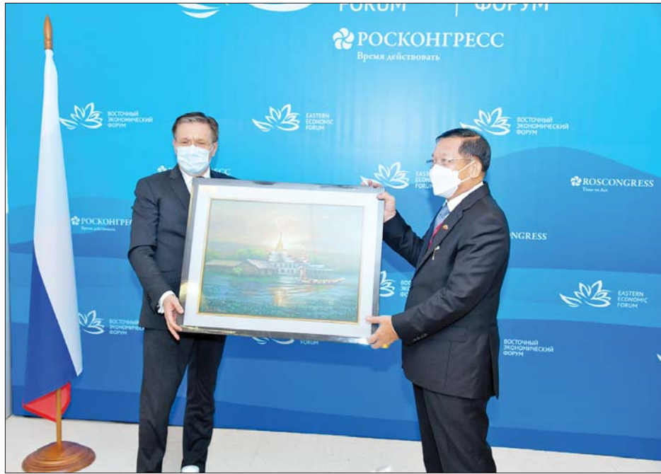
နိုင်ငံတော်စီမံအုပ်ချုပ်ရေးကောင်စီဥက္ကဋ္ဌ နိုင်ငံတော်ဝန်ကြီးချုပ် ဗိုလ်ချုပ်မှူးကြီးမင်းအောင်လှိုင် Rosatom State Corporations ၏ အမှုဆောင်အရာရှိချုပ်ကို အမှတ်တရလက်ဆောင်ပစ္စည်း ပေးအပ်စဉ်။