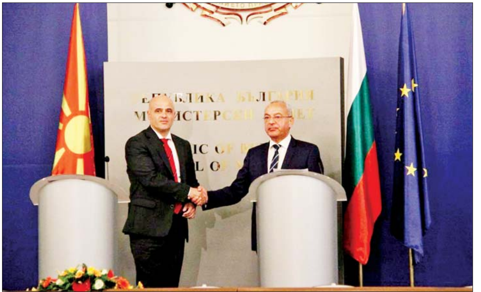
ဘူလ်ဂေးရီးယားနိုင်ငံ အိမ်စောင့်အစိုးရဝန်ကြီးချုပ် ဂါလက်ဘ်ဒိုနက်ဗ်နှင့် မြောက်မက်ဆီဒိုးနီးယားနိုင်ငံ ဝန်ကြီးချုပ် ဒီမီတာကိုဗာချက်စကီးတို့ စက်တင်ဘာ ၅ ရက်က ဆိုဖီယာမြို့၌ တွေ့ဆုံစဉ်။

အဆိုပါ နှစ်နိုင်ငံအကြား သဘောတူညီချက်သည် ဘူလ်ဂေးရီးယားနိုင်ငံသို့ တစ်ရက်ကြာအလည်အပတ် ခရီးသွားရောက်ခဲ့သော မြောက်မက်ဆီဒိုးနီးယားနိုင်ငံဝန်ကြီးချုပ် ဒီမီတာကိုဗာချက်စကီးနှင့် ဘူလ်ဂေးရီးယား အိမ်စောင့်အစိုးရ ဝန်ကြီးချုပ် ဂါလက်ဘ်ဒိုနက်ဗ်တို့ တွေ့ဆုံမှုအပြီး ထွက်ပေါ်လာခဲ့ခြင်းဖြစ်သည်။ ဘူလ်ဂေးရီးယားနိုင်ငံသည် မြောက်မက်ဆီဒိုးနီးယားနိုင်ငံ၏ နျူကလီးယားစွမ်းအင်စက်ရုံက ထုတ်လုပ်သည့် လျှပ်စစ်ဓာတ်အားရရှိရေးအတွက် စွမ်းအင်အဓိကထောက်ပံ့သည့် နိုင်ငံတစ်ခုဖြစ်ကြောင်းလည်း သိရသည်။ ကိုးကား - ဆင်ဟွာ ဘာသာပြန် - အလင်းသစ်