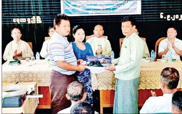
ရှေးဦးစွာ မြို့နယ်စီမံအုပ်ချုပ်ရေးအဖွဲ့ ဒုတိယမြို့နယ်အုပ်ချုပ်

ရေတာရှည် စက်တင်ဘာ ၆ ပဲခူးတိုင်းဒေသကြီး ရေတာရှည်မြို့နယ် ကျေးလက်ဒေသဖွံ့ဖြိုးတိုးတက်ရေးဦးစီးဌာန၏ ၂၀၂၂-၂၀၂၃ ဘဏ္ဍာနှစ် ခွင့်ပြုရန်ပုံငွေဖြင့် အသက်မွေးဝမ်းကျောင်းအထောက်အကူပြု သံပန်းသံဂဟေဆက်သင်တန်း အမှတ်စဉ် ၂/၂၀၂၂ ဖွင့်ပွဲအခမ်းအနားကို ယနေ့နံနက်ပိုင်းက မြို့နယ်ကျေးလက်ဒေသဖွံ့ဖြိုးတိုးတက်ရေးဦးစီးဌာနရုံး အစည်းအဝေးခန်းမ၌ ပြုလုပ်ခဲ့သည်။