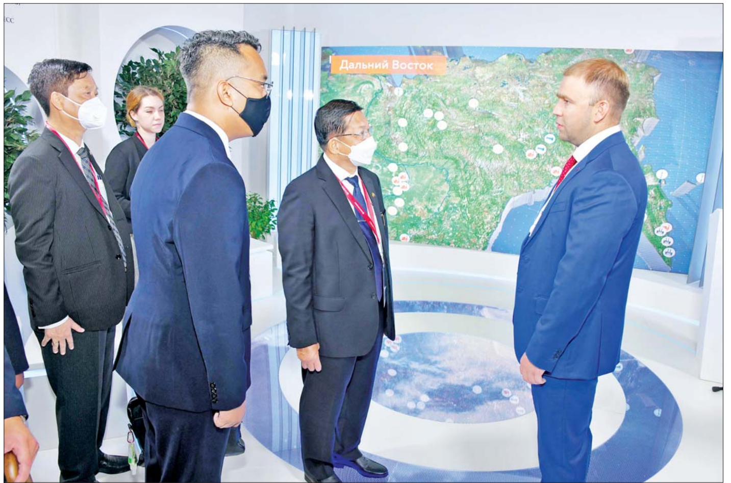
နိုင်ငံတော်စီမံအုပ်ချုပ်ရေးကောင်စီဥက္ကဋ္ဌ နိုင်ငံတော်ဝန်ကြီးချုပ် ဗိုလ်ချုပ်မှူးကြီးမင်းအောင်လှိုင် Eastern Economic Forum-2022 ရှိ Exhibition အတွင်း ခင်းကျင်းပြသထားသည့် ပြခန်းများအား ကြည့်ရှုလေ့လာစဉ်။

ယင်းနောက် လျှပ်စစ်ဓာတ်အားထုတ်လုပ်ရေး Rus Hydro Hydroelectric power generation company ပြခန်း၊ ငွေကြေးရင်းနှီးမြှုပ်နှံမှုဆိုင်ရာ VEB.RF Investment company ပြခန်း၊ Aeroflot Airline ပြခန်းတို့သို့ ရောက်ရှိလေ့လာခဲ့ရာ ပြခန်းများအလိုက် တာဝန်ခံများက လုပ်ငန်းဆောင်ရွက်နိုင်မှုအခြေအနေများနှင့် ပူးပေါင်းဆောင်ရွက်နိုင်မည့်အခြေအနေများကို ရှင်းလင်း