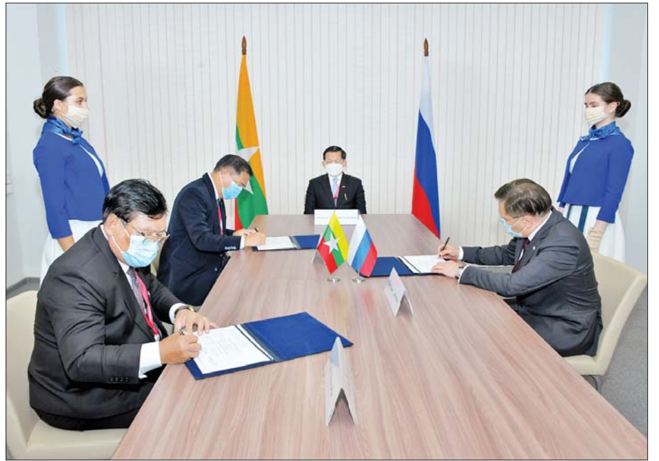
Rosatom State Corporations ၏ အမှုဆောင်အရာရှိချုပ် Mr. Alexey Evgenievich Likhachev ပြည်ထောင်စုဝန်ကြီး ဒေါက်တာမျိုးသိန်းကျော်၊ ပြည်ထောင်စုဝန်ကြီး ဦးသောင်းဟန်တို့ နားလည်မှုစာချုပ်လွှာများ လက်မှတ်ရေးထိုးကြစဉ်။

တင်ပြကြသည်။ ရှင်းလင်းတင်ပြမှုများအပေါ် နိုင်ငံတော်စီမံအုပ်ချုပ်ရေးကောင်စီ ဥက္ကဋ္ဌ နိုင်ငံတော်ဝန်ကြီးချုပ်နှင့် အဖွဲ့ဝင်များက သိရှိလိုသည်များ ပြန်လည်မေးမြန်းဆွေးနွေးခဲ့ကြသည်။ ထို့နောက် မွန်းလွဲပိုင်းတွင် နိုင်ငံတော်စီမံအုပ်ချုပ်ရေးကောင်စီဥက္ကဋ္ဌ နိုင်ငံတော်ဝန်ကြီးချုပ်နှင့် အဖွဲ့ဝင်များသည် ရုရှားနိုင်ငံပိုင် အဏုမြူကော်ပိုရေးရှင်း Rosatom State Corporations ၏ အမှုဆောင်အရာရှိချုပ် Mr. Alexey Evgenievich Likhachev ဦးဆောင်သည့်အဖွဲ့ဝင်များအား FEFU Campus အတွင်းတွေ့ဆုံ၍ နျူကလီးယားစွမ်းအင်နည်းပညာ ပူးပေါင်းဆောင်ရွက်မှုနယ်ပယ်များတွင် အတွေ့