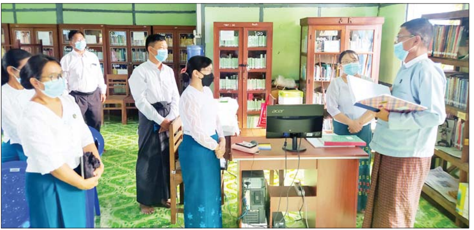
ဒုတိယဝန်ကြီးဦးရဲတင့် ပြန်ကြားရေးနှင့် ပြည်သူ့ဆက်ဆံရေးဦးစီးဌာန ပြည်ခရိုင်ရုံး၏ ပြည်သူ့ စာကြည့်တိုက်ကို ကြည့်ရှုစစ်ဆေးစဉ်။

ပြီး ဝန်ထမ်းများနှင့် တွေ့ဆုံသည်။ မွန်းလွဲပိုင်းတွင် ပြည်ခရိုင် ပြန်ကြားရေးနှင့် ပြည်သူ့ဆက်ဆံ ရေးဦးစီးဌာနရုံး၌ ခရိုင်ဦးစီးမှူးနှင့် ဝန်ထမ်းများ၊ မြန်မာ့ရုပ်မြင် သံကြား ထပ်ဆင့်လွှင့်စက်ရုံများ ၏ ပြည်ဇန်နယ်တာဝန်ခံ၊ ပေါက် ခေါင်း၊ ရွှေတောင်၊ ပန်းတောင်၊ သဲကုန်းနှင့် ပေါင်းတည်မြို့နယ် တို့မှ မြို့နယ် ပြန်/ဆက်ဦးစီးမှူး များအား တွေ့ဆုံ၍ လုပ်ငန်း ဆိုင်ရာများနှင့် ဝန်ထမ်းရေးရာ ကိစ္စရပ်များကို မှာကြားသည်။ ယင်းနောက် ပြည်မြို့ရှိ မြန်မာ့ ရုပ်မြင်သံကြား ထပ်ဆင့်လွှင့် စက်ရုံကို ကြည့်ရှုစစ်ဆေးပြီး