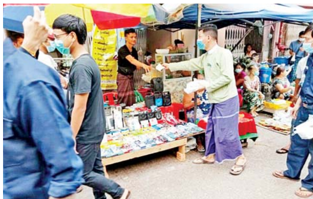
မရှိပါက တစ်ခါသုံးနှာခေါင်းစည်းများကို အခမဲ့ဖြန့်ဝေပေးခဲ့ကြသည်။ ထို့အပြင် နေအိမ်ပြင်ပသို့ ထွက်ခွာသွားလာရာတွင်လည်း နှာခေါင်းစည်း မဖြစ်မနေတပ်ဆင်သွားလာစေရေး အသိပညာပေး ဆောင်ရွက်ခဲ့ကြောင်း သိရသည်။ မြို့နယ်(ပြန်/ဆက်)