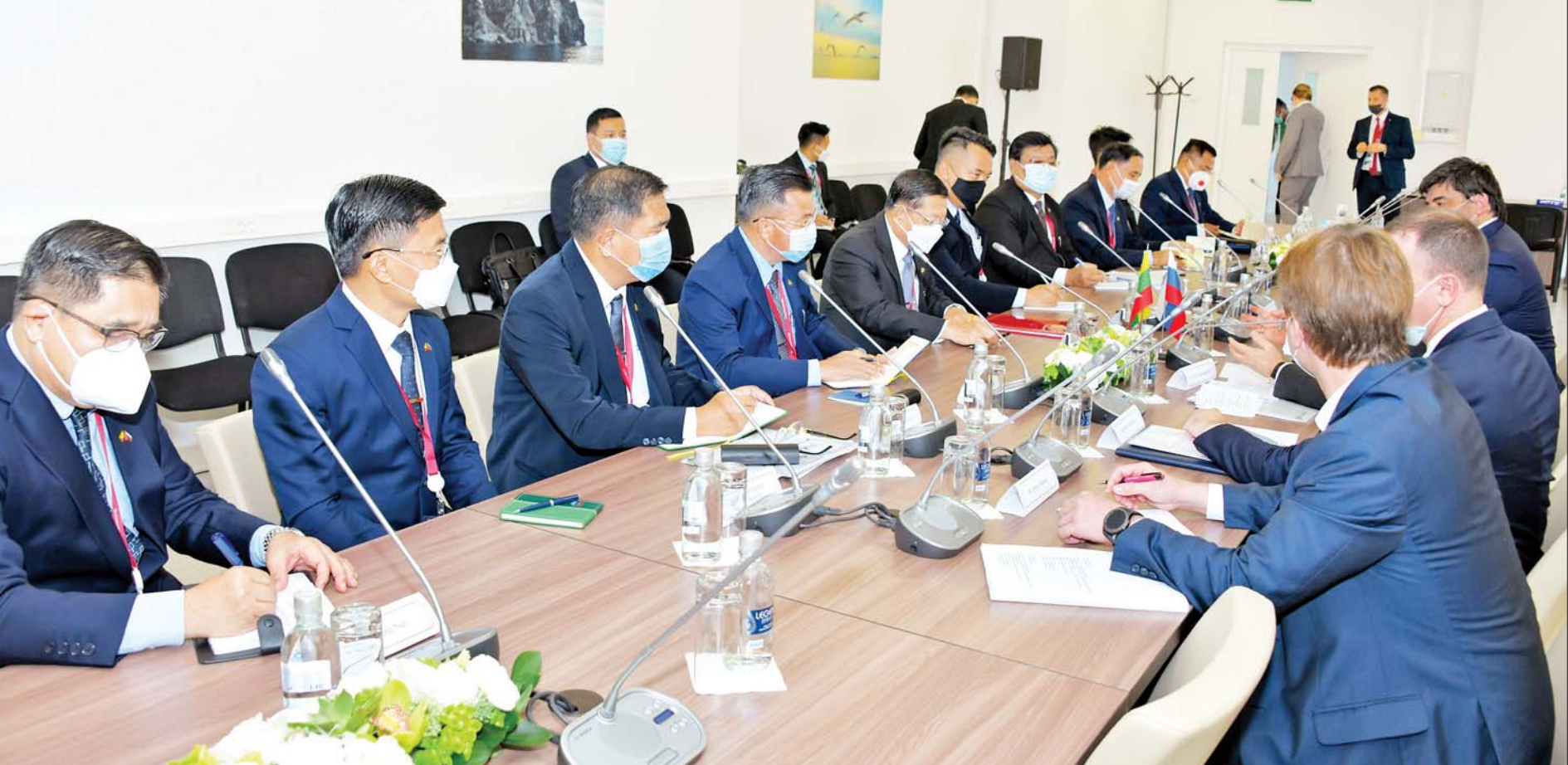
နိုင်ငံတော်စီမံအုပ်ချုပ်ရေးကောင်စီဥက္ကဋ္ဌ နိုင်ငံတော်ဝန်ကြီးချုပ် ဗိုလ်ချုပ်မှူးကြီး မင်းအောင်လှိုင်နှင့် အဖွဲ့ဝင်များ ရုရှားနိုင်ငံပိုင် အဏုမြူကော်ပိုရေးရှင်း Rosatom State Corporations မှ တာဝန်ရှိသူများနှင့် တွေ့ဆုံဆွေးနွေးစဉ်။

နေပြည်တော် စက်တင်ဘာ ၆ (၇)ကြိမ်မြောက် အရှေ့ပွားစီးပွားရေးဖိုရမ်(The 7th Eastern Economic Forum-2022)ကို ရုရှားဖက်ဒရေရှင်းနိုင်ငံ ဗလာဒီဗော့စတော့ခ်မြို့ Far Eastern Federal University(FEFU)၌ စက်တင်ဘာ ၅ ရက် တွင် စတင်ဖွင့်လှစ်ခဲ့ပြီး တွေ့ဆုံဆွေးနွေးမှုများ၊ နားလည်မှုစာချွန်လွှာရေးထိုးပွဲများ၊ တွေ့ဆုံမေးမြန်းမှုများကို ဆောင်ရွက်လျက်ရှိကြပြီး ကဏ္ဍပေါင်းစုံအလိုက် ပြခန်းများလည်း ခင်းကျင်းပြသထားသည်။ စာမျက်နှာ ၃ ကော်လံ ၁ သို့ ၁