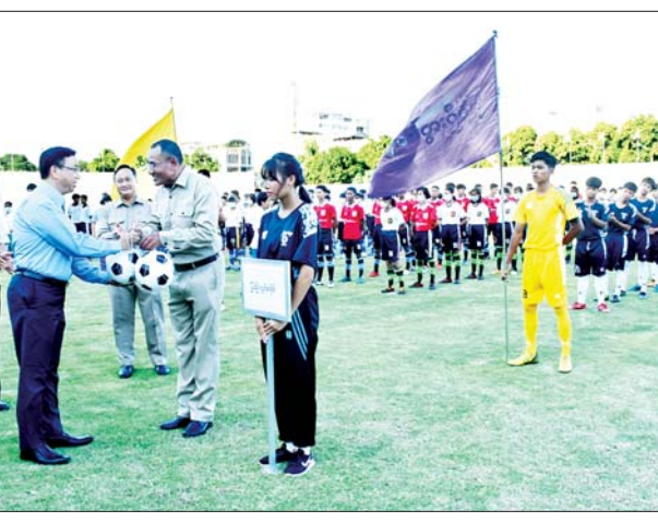
၈ ရက်အထိ အုပ်စု လေးအုပ်စုဖြင့် လည်းကောင်း ယှဉ်ပြိုင်ကစားသွား အောင်မြေမန္တလာအားကစားကွင်းတွင် မည်ဖြစ်ကြောင်း သိရသည်။ သတင်းစဉ်

တာဝန်ရှိသူများ၊ ဖိတ်ကြားထားသူများ တက်ရောက်ကြသည်။ ဖွင့်ပွဲအခမ်းအနားတွင် လူမှုရေးရာ ဝန်ကြီးဦးယဉ်ထွေးက အဖွင့်အမှာစကား ပြောကြားပြီးနောက် ပြိုင်ပွဲဝင်အားကစား သမားများက အားကစားသစ္စာအဓိဋ္ဌာန် ရွတ်ဆိုကြကာ ဝန်ကြီးနှင့်တာဝန်ရှိသူ များက အားကစားသမားများအား လိုက်လံနှုတ်ဆက်၍ အားကစားပစ္စည်း များပေးအပ်ပြီး ရမည်းသင်းခရိုင်နှင့် မိတ္ထီလာခရိုင်အသင်းတို့ ယှဉ်ပြိုင် ကစားနေမှုကို အားပေးကြည့်ရှုကြရာ မိတ္ထီလာခရိုင်အသင်းက ရမည်းသင်းခရိုင် အသင်းကို တစ်ဂိုး-ဂိုးမရှိဖြင့် အနိုင်ရခဲ့ သည်။ ၂၀၂၂ ခုနှစ် မန္တလေးတိုင်းဒေသကြီး လူငယ်ရေးရာကော်မတီ ဥက္ကဋ္ဌဖလား ခရိုင်ပေါင်းစုံ အသက်(၁၆)နှစ်အောက် (အမျိုးသား) ဘောလုံးပြိုင်ပွဲကို စက်တင်ဘာ ၂ ရက်မှ ၇ ရက်အထိ အုပ်စု လေးအုပ်စုဖြင့် ရွှေမန်းတောင် အားကစားကွင်းတွင် လည်းကောင်း၊ အသက်(၁၈)နှစ်အောက် (အမျိုးသမီး) ဘောလုံးပြိုင်ပွဲကို စက်တင်ဘာ ၃ မှ