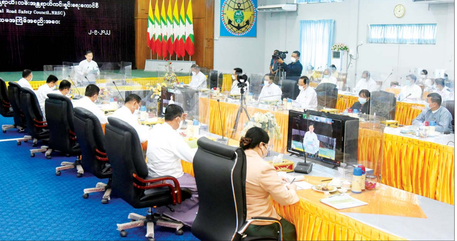
နိုင်ငံတော်စီမံအုပ်ချုပ်ရေးကောင်စီဒုတိယဥက္ကဋ္ဌ ဒုတိယဝန်ကြီးချုပ် ဒုတိယဗိုလ်ချုပ်မှူးကြီး စိုးဝင်း အမျိုးသားယာဉ်အန္တရာယ်၊ လမ်းအန္တရာယ်ကင်းရှင်းရေးကောင်စီ ပထမအကြိမ် အစည်းအဝေးတွင် အမှာစကားပြောကြားစဉ်။