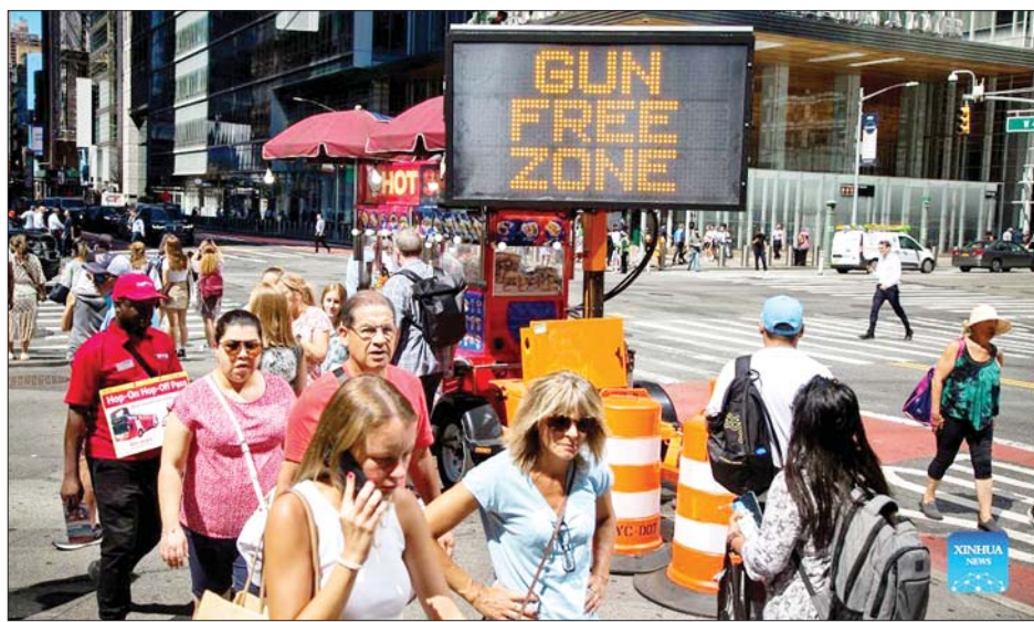
ဇန် ဖြစ်သည့်အတွက် လိုင်စင်ရသေ့နက်ကိုင်ဆောင်သူများသည် ဥပဒေအရ အထူးခွင့်ပြုချက်မရရှိဘဲ သေ့နက်ကင်းစင်ဇန်များအတွင်းသို့ ဝင်ရောက်ခွင့် မပြုသည့် ဆိုင်းဘုတ်ပုံစံတရားများကို ပြည်နယ်အနှံ့အပြားတွင် လိုက်လံကပ်ထားမည်ဖြစ်ကြောင်း နယူးယောက်မြို့တော်ဝန် အီရစ်အဒက်မန်စ်က ဆိုသည်။ မေလအတွင်းက ဘက်ဖ်လိုပြည်နယ်၌ ဖြစ်ပွားခဲ့သည့် လူအများအပြားသေဆုံးခဲ့သည့် သေ့နက်ပစ်ခတ်မှုကို တုံ့ပြန်သည့်အနေဖြင့် နယူးယောက်

ဝါရှင်တန် စက်တင်ဘာ ၂ အမေရိကန်နိုင်ငံတရားရုံးချုပ်က ရာစုနှစ်တစ်ခုကြာ ဆွေးနွေးလျက်ရှိသည့် လက်နက်သယ်ဆောင်မှု ဥပဒေကို ဇွန်လအတွင်းက ဖျက်သိမ်းခဲ့ပြီးနောက် နယူးယောက်ပြည်နယ်အတွင်းရှိ အများပြည်သူဆိုင်ရာနေရာများ၌ လက်နက်ကိုင်ဆောင်သွားလာခွင့် ပိတ်ပင်တားမြစ်သည့်ဥပဒေကို စတင်ကျင့်သုံးခဲ့ကြောင်း ယမန်နေ့သတင်းများအရ သိရသည်။