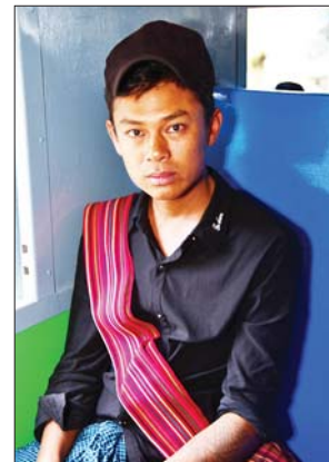
ကိုဇာနည်