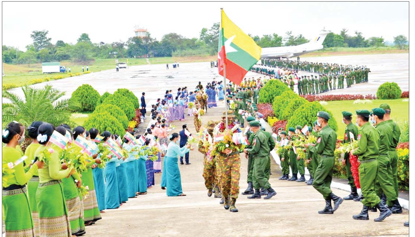
ရုရှားဖက်ဒရေးရှင်းနိုင်ငံ မော်စကိုမြို့တွင် ကျင်းပသည့် International Army Games-2022 ပြိုင်ပွဲသို့ ဝင်ရောက်ယှဉ်ပြိုင်ခဲ့ကြသော မြန်မာ့တပ်မတော်ကိုယ်စားလှယ်အဖွဲ့အား နေပြည်တော်လေဆိပ်၌ ကြိုဆိုကြစဉ်။