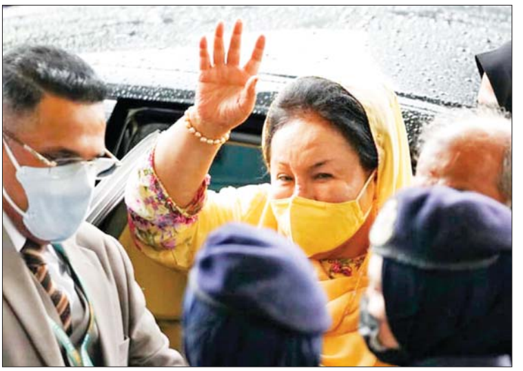
မှာကြားထားကြောင်း ရိုဗ်မက်ရှ်မန်ဆာက ဆိုသည်။ သို့သော် ၎င်းအနေဖြင့် ပိုက်ဆံ ရရှိဖို့ မည်သူတစ်ဦးတစ်ယောက် ကိုမျှ မတောင်းဆိုဖူးကြောင်းကိုလည်း

၂၀၁၇ ခုနှစ် စက်တင်ဘာလအထိ လာဘ်ငွေများ လက်ခံရယူခဲ့ကြောင်း လည်း စွပ်စွဲခံခဲ့ရသည်။ အဆိုပါစွဲချက်များတွင် အပြစ်ရှိကြောင်း တွေ့ရှိရသည့်အတွက် ထောင်ဒဏ် ၁၀ နှစ်နှင့် ဒဏ်ကြေးငွေ ပေးဆောင်ရန် စီရင်ချက် ချမှတ်ခဲ့ခြင်းဖြစ်ကြောင်း တရားရုံးချုပ် တရားသူကြီး မိုဟာမက် ဇိုင်နီမာဇေလန်က ဆိုသည်။