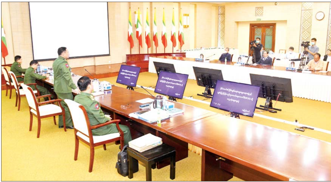
နိုင်ငံတော်၏ ငြိမ်းချမ်းရေးဆွေးနွေးရေးအဖွဲ့နှင့် သျှမ်းပြည်ပြန်လည်ထူထောင်ရေးကောင်စီ (RCSS) ဥက္ကဋ္ဌ ဦးဆောင်သော ငြိမ်းချမ်းရေးကိုယ်စားလှယ်အဖွဲ့တို့ တတိယနေ့ တွေ့ဆုံဆွေးနွေးပွဲ။