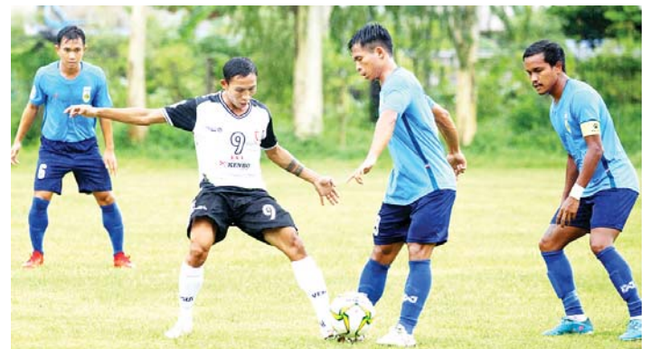
ယောမြေအသင်းနှင့် တက္ကသိုလ်အသင်း ယှဉ်ပြိုင်စဉ်။

တက္ကသိုလ်အသင်းသည် ပွဲအစ ၂ မိနစ်မှာပင် မြင့်နိုင်သူ၏ဂိုးဖြင့် ဦးဆောင်နိုင်ခဲ့ပြီး စောစီးစွာ ဂိုးရခဲ့သဖြင့် ပွဲကိုထိန်းချုပ်နိုင်ခဲ့သည်။ ၁၇ မိနစ်တွင် တက္ကသိုလ်အသင်း ဒုတိယဂိုးထပ်ရခဲ့ပြီး ကောင်းသက်နိုင်က သွင်းယူခဲ့ကာ ပထမပိုင်းအပြီးတွင် တက္ကသိုလ်အသင်းက နှစ်ဂိုးအသာဖြင့် ဦးဆောင်နေသည်။ ဒုတိယပိုင်းတွင် ယောမြေအသင်း ချေပဂိုးပြန်ရရန် ကြိုးပမ်းသော်လည်း ချေပဂိုးရရှိအောင် စွမ်းဆောင်နိုင်ခြင်းမရှိဘဲ ပွဲပြီးခါနီးတွင် သိန်းထက်အောင်က တက္ကသိုလ်အသင်း