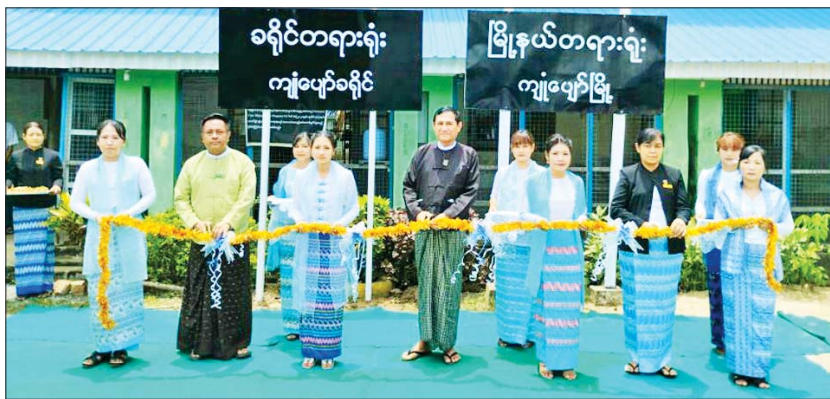
အမွှေးနံ့သာရည်များဖြင့် ပတ်ဖျန်းပေးကြ စစ်ဆေးကြသည်။ တရားရုံးသစ်ဖွင့်ပွဲသို့ တိုင်းဒေသကြီးနှင့် ခရိုင်အဆင့် ဌာနဆိုင်ရာတာဝန်ရှိသူများ၊ မြို့နယ်စီမံအုပ်ချုပ်ရေးအဖွဲ့ဝင်များ၊ မြို့နယ် တရားသူကြီးနှင့်ဝန်ထမ်းများ တက်ရောက်ခဲ့ကြကြောင်း သိရသည်။ ခရိုင်(ပြန်/ဆက်)

ကျယ်ပျော် စက်တင်ဘာ ၁ ဧရာဝတီတိုင်းဒေသကြီး ကျယ်ပျော်ခရိုင်၏ ခရိုင်တရားရုံးသစ်ဖွင့်ပွဲကို ယနေ့ နံနက် ၁၁ နာရီခွဲက ခရိုင်တရားရုံးသစ်တည်ရှိရာ ကျယ်ပျော်မြို့ အောင်ဆန်းရပ်ကွက် ဗိုလ်ချုပ်လမ်း၌ကျင်းပရာ ဧရာဝတီတိုင်းဒေသကြီး တရားလွှတ်တော် တရားသူကြီးချုပ်နှင့် တာဝန်ရှိသူများက တက်ရောက်ဖွင့်လှစ်ပေးခဲ့ကြကြောင်း သိရသည်။ ရှေးဦးစွာ ခရိုင်တရားရုံးသစ်ကို ဧရာဝတီတိုင်းဒေသကြီး တရားလွှတ်တော် တရားသူကြီးချုပ် ဦးဝင်းမြင့်၊ တိုင်းဒေသကြီးတရားရေးဦးစီးမှူး ဒေါ်ထွေးထွေး၊ ကျယ်ပျော်ခရိုင်အုပ်ချုပ်ရေးမှူး ဦးအောင်နိုင်ဦးတို့က ဖဲကြိုးဖြတ်ဖွင့်လှစ်ပေးကြပြီး တရားသူကြီးချုပ်နှင့် တာဝန်ရှိသူများ၊ ခရိုင်တရားသူကြီးဦးအောင်နေလင်းတို့က ခရိုင်ရုံးဆိုင်းဘုတ်ကို