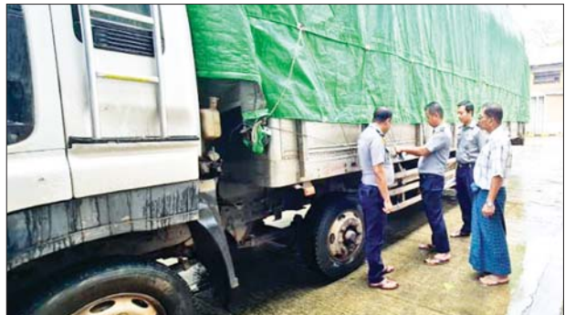
မွန်ပြည်နယ် မရမ်းချောင်း အမြဲတမ်းစစ်ဆေးရေးစခန်း၌ သိမ်းဆည်းရမိမှု မှတ်တမ်းဓာတ်ပုံ။