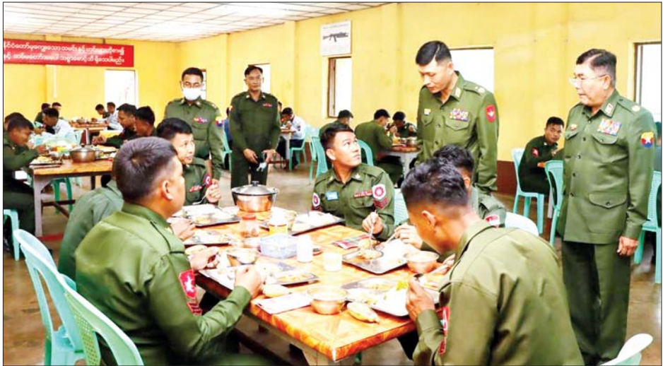
တပ်ဖွဲ့များနှင့် နယ်မြေခံသင်တန်းကျောင်းများမှ အရာရှိ၊ စစ်သည်၊ မိသားစုများကို ရင်းရင်းနှီးနှီး တွေ့ဆုံဆက်ဆံပြီး ဂုဏ်ပြုစားပွဲများ ပြုလုပ်၍ တက်ရောက်အားပေးကာ အရာရှိ၊ စစ်သည်၊ မိသားစုများနှင့် အတူတကွ နေ့လယ်စာသုံးဆောင်ခဲ့ကြောင်း သိရသည်။ သတင်းစဉ်

ထိုသို့ ဆောင်ရွက်လျက်ရှိရာ ယနေ့တွင် အလယ်ပိုင်းတိုင်းစစ်ဌာနချုပ်နှင့် တောင်ပိုင်းတိုင်းစစ်ဌာနချုပ်တို့မှ ဒုတိယတိုင်းမှူးနှင့် တာဝန်ရှိသူများက သက်ဆိုင်ရာ ကွပ်ကဲမှုအောက်ရှိ တပ်ရင်း/တပ်ဖွဲ့များနှင့် နယ်မြေခံသင်တန်းကျောင်းများသို့ သွားရောက်၍ အရာရှိ၊ စစ်သည်၊ မိသားစုများကို ရင်းရင်းနှီးနှီး တွေ့ဆုံဆက်ဆံပြီး ဂုဏ်ပြုစားပွဲများ ပြုလုပ်ပေး၍ တက်ရောက်အားပေးကာ အရာရှိ၊ စစ်သည်၊ မိသားစုများနှင့် အတူတကွ လက်ရည်တစ်ပြင်တည်း နေ့လယ်စာသုံးဆောင်ကြသည်။ အလားတူ တိုင်းစစ်ဌာနချုပ်များအလိုက် တပ်နယ်အသီးသီးမှ တပ်မတော်အရာရှိကြီးများက လည်း ၎င်းတို့၏ ကွပ်ကဲမှုများအလိုက် တပ်ရင်း/