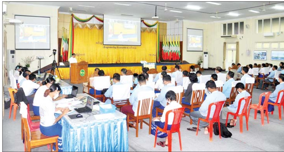
Management System ဆိုင်ရာ သင်တန်းနှစ်ကြိမ်ကို သိပ္ပံနှင့်နည်းပညာဝန်ကြီးဌာနနှင့် ပူးပေါင်း၍ ဖွင့်လှစ်ခဲ့ကြောင်း၊ အင်ဂျင်နီယာပညာရှင်များအနေဖြင့် သင်တန်းမှပိုမိုသည့် သင်ခန်းစာများကို စနစ်တကျ လေ့လာမှတ်သားပြီး လက်တွေ့နယ်ပယ်တွင် အကျိုး

ဆက်လက်၍ ပြည်ထောင်စုဝန်ကြီးက သတ်မှတ်ချက်များ၊ Guideline များကို သိရှိနားလည်ပြီး လက်တွေ့ကျင့်သုံးနိုင်မည့် ISO 9004:2018 Quality