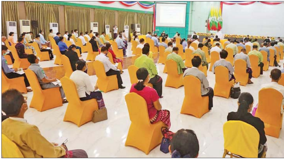
ဘားအံ ဩဂုတ် ၃၁ ကရင်ပြည်နယ်အတွင်း လုံခြုံရေးဆိုင်ရာကိစ္စရပ်များ၊ ဒေသဖွံ့ဖြိုးရေးဆိုင်ရာများနှင့် ပြည်သူ့အကျိုးပြု