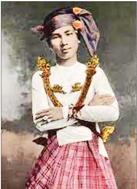
ဇာတ်မင်းသားကြီးဦးဖိုးစိန်

ဇာတ်သဘင် ဇာတ်သဘင်ကတော့ အပျိုတော်ခန်း၊ သစ္စာ ထားခန်း၊ တိုင်းပြည်တည်ခန်းကအစပြုပြီး ဇာတ်ထုပ်ခင်းကြတယ်။ ဇာတ်ထုပ်ခင်းတဲ့အခါမှာ ရှေးကတော့ လူသဘော လူမနော အရပ်ရပ်က ကောင်းနိုးရာရာ၊ သိဖွယ်၊ မှတ်ဖွယ်၊ နာယူဖွယ်ရာ