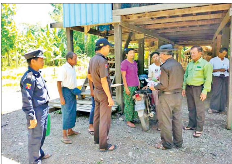
၌ စာသင်ကြားနေမှုအား ကြည့်ရှုအားပေး ပေးခဲ့ကြကြောင်း သိရသည်။ မြို့နယ်(ပြန်/ဆက်)

ထို့အပြင် ဆင်းရဲနွမ်းပါးသက်ကြီးဘိုးဘွားများအား စားဝတ်နေရေးအဆင်ပြေစေရန် အခြေခံစားသောက်ကုန်ဆန်ခြောက်အိတ် ထောက်ပံ့ပေးအပ်ခြင်း၊ ကျေးလက်နေပြည်သူများအား မြို့နယ်ကျန်းမာရေးဦးစီးဌာနမှ တာဝန်ရှိသူများက ဆေးကုသပေးခြင်းနှင့် ကိုဗစ်-၁၉ ရောဂါကာကွယ်ဆေးထိုးနှံရန် ကျန်ရှိနေသော ကျေးရွာနေပြည်သူများအား ကာကွယ်ဆေး ထိုးနှံပေးခြင်းနှင့် အိမ်ထောင်စုလူဦးရေစာရင်းနှင့် နိုင်ငံသားစိစစ်ရေးကတ်ပြားများ တိုက်ဆိုင်စစ်ဆေးခြင်း၊ လျှပ်စစ်မီးကြိုး၊ မီးခလုတ်များနှင့် မီးဘေးအန္တရာယ်ကြိုတင်ကာကွယ်ရေးလုပ်ငန်းများစစ်ဆေးပြီး ကိုင်းသာကျေးရွာ အခြေခံပညာ မူလတန်းကျောင်း