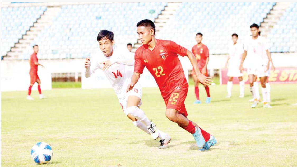
မြန်မာ ယူ-၁၉ အသင်းနှင့် တိုင်းဒေသကြီး/ပြည်နယ် ယူ-၁၉ အသင်းတို့ ယှဉ်ပြိုင်ကစားကြစဉ်။

ခြေစမ်းပွဲတွင် မြန်မာ ယူ-၁၉ အသင်း နှစ်ပွဲစလုံးအနိုင်ရ ရန်ကုန် ဩဂုတ် ၃၁ အာရှဖလား ယူ-၂၀ ခြေစစ်ပွဲအတွက် လေ့ကျင့်ပြင်ဆင်နေသည့် မြန်မာ ယူ-၁၉ အသင်းနှင့် ကျင်းပပြီးစီးခဲ့သည့် ၂၀၂၂ တိုင်းဒေသကြီးနှင့် ပြည်နယ် ယူ-၁၉ ဘောလုံးပြိုင်ပွဲမှ ခြေစမ်းပြိုင်သည့် ကစားသမားများဖြင့် ဖွဲ့စည်းထားသည့် တိုင်းဒေသကြီး/ပြည်နယ် ယူ-၁၉ အသင်းတို့၏ ဒုတိယခြေစမ်းပွဲကို ဩဂုတ် ၃၁ ရက်က သုဝဏ္ဏဘောလုံးကွင်း၌ ကျင်းပရာ မြန်မာ ယူ-၁၉ လက်ရွေးစင်အသင်းက သုံးဂိုး-တစ်ဂိုးဖြင့် အနိုင်ရရှိသည်။ မြန်မာ ယူ-၁၉ လက်ရွေးစင်အသင်းနှင့် တိုင်းဒေသကြီး/ပြည်နယ် ယူ-၁၉ အသင်းတို့သည် ဩဂုတ် ၂၉ ရက်တွင် ပထမခြေစမ်းပွဲကစားပြီးနောက် ယနေ့တွင် ဒုတိယခြေစမ်းပွဲကစားခြင်းဖြစ်ပြီး စာမျက်နှာ ၁၁ ကော်လံ ၁ သို့ ❖