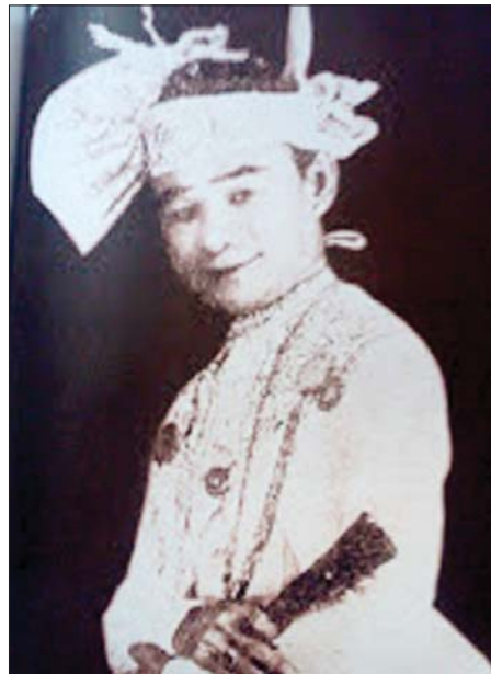
ဇာတ်မင်းသားကြီးဦးအောင်မောင်

အကြောင်းအရာတွေ၊ ဒဏ္ဍာရီဇာတ်တွေကိုပဲ ကပြ ကြတာပေါ့။ ထိုခေတ်က ရုပ်သေးရော၊ ဇာတ်ပါ ဘာကြောင့်ဒဏ္ဍာရီတွေကိုပဲဇာတ်ကကြသလဲဆိုရင် ဇာတ်နိပါတ်တော်တွေကို ကရင်ဂိုဏ်းမလွတ် လေဟန်၊ အပြစ်ဖြစ်ပြီး ငရဲကြီးလေဟန် ထင်ခဲ့ကြ လို့ပဲဖြစ်ပါတယ်။