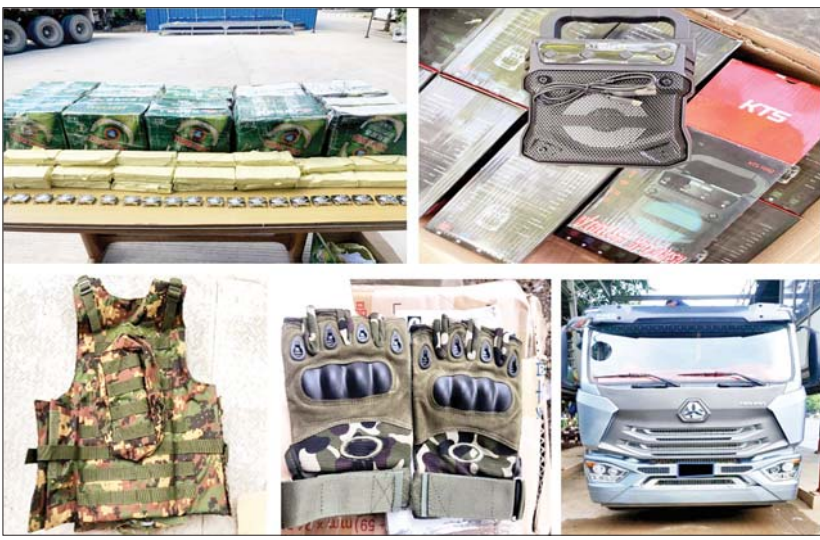
မန္တလေး (၁၆)မိုင် ကျောက်ချောစစ်ဆေးရေးစခန်း၌ သိမ်းဆည်းရမိမှု။

တရားမဝင်ကုန်သွယ်မှုတိုက်ဖျက်ရေး ဦးဆောင်ကော်မတီ၏ ကြီးကြပ်ကွပ်ကဲမှုဖြင့် တရားမဝင် ကုန်သွယ်မှုများကို ဥပဒေနှင့်အညီ ထိရောက်စွာ တားဆီးအရေးယူနိုင်ရေးဆောင်ရွက်လျက်ရှိရာ ဩဂုတ် ၂၄ ရက်တွင် မန္တလေးတိုင်းဒေသကြီး တရားမဝင်ကုန်သွယ်မှုတိုက်ဖျက်ရေးအထူးအဖွဲ့၏ စီမံခန့်ခွဲမှုဖြင့် (၁၆)မိုင်ကျောက်ချောစစ်ဆေးရေးစခန်း၌ စခန်းတာဝန်ကျ ကွပ်ကဲရေးမှူးကြီးကြပ်၍ တာဝန်ကျပူးပေါင်းစစ်ဆေးရေးအဖွဲ့က စစ်ဆေးမှုများဆောင်ရွက်ခဲ့ရာ မော်တော်ယာဉ်တစ်စီးပေါ်မှ ဂျူတီပစ္စည်းများနှင့်အတူ ရောနှောသယ်ဆောင်လာပြီး တရားဝင်တင်သွင်းသယ်ယူခွင့်အထောက်အထား တစ်စုံတစ်ရာတင်ပြနိုင်ခြင်းမရှိသည့် ကန့်သတ်တားမြစ်ထားသော လုံခြုံရေးတပ်ဖွဲ့သုံး အဆောင်အယောင်ပစ္စည်းများ၊ အကောက်ခွန်မဲ့ လျှပ်စစ်ပစ္စည်းမျိုးစုံနှင့် မော်တော်ဆိုင်ကယ်အပိုပစ္စည်းများ (ခန့်မှန်းတန်ဖိုး ငွေကျပ် ၁၆၆၀၉၁၀၀)နှင့် အဆိုပါပစ္စည်းများ တင်ဆောင်လာသော Hohan (Sino Truck) Tractor Head အမျိုးအစား မော်တော်ယာဉ်တစ်စီးနှင့် နောက်တွဲယာဉ်(ခန့်မှန်းတန်ဖိုးငွေကျပ် ၃၂၀၀၀၀၀)၊ စုစုပေါင်း (ခန့်မှန်းတန်ဖိုးငွေကျပ် ၁၉၈၀၉၁၀၀)ကို သိမ်းဆည်းရမိခဲ့ပြီး အကောက်ခွန် လုပ်ထုံးလုပ်နည်းနှင့်အညီ အရေးယူဆောင်ရွက်လျက်ရှိသည်။