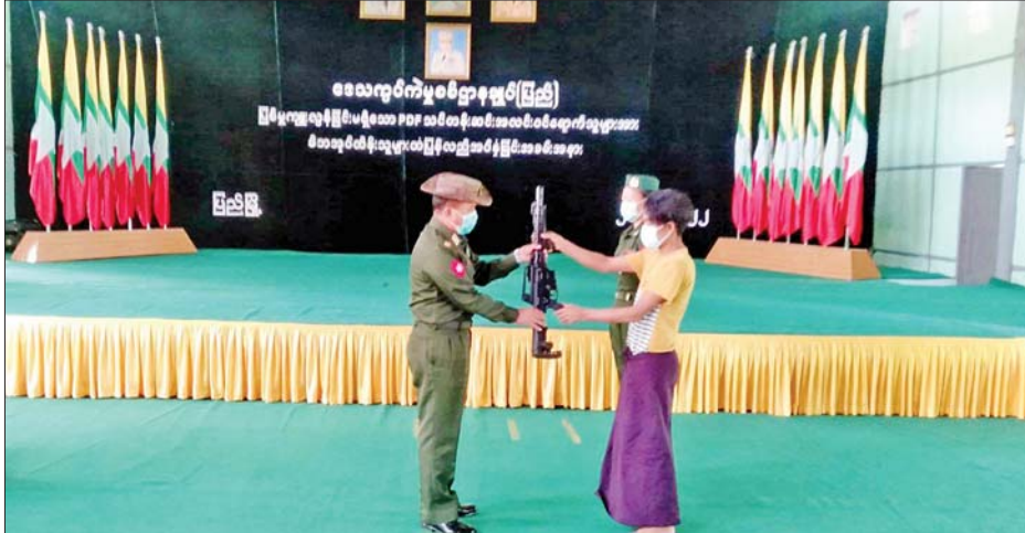
များက တိုင်းဒေသကြီးနှင့် ပြည်နယ်အသီးသီး၌ ဥပဒေဘောင်အတွင်း ပြန်လည်ဝင်ရောက်လျက် ရှိကြသဖြင့် သက်ဆိုင်ရာတာဝန်ရှိသူများက ၎င်းတို့ ၎င်း၏မိဘအုပ်ထိန်းသူများထံသို့ လွှဲပြောင်းအပ်နှံပေးလျက်ရှိကြောင်း သိရသည်။ သတင်းစဉ်

ထို့နောက် ဥပဒေဘောင်အတွင်းဝင်ရောက်ခဲ့သည့် ပြစ်မှုကျူးလွန်ခြင်းမရှိခဲ့သော ကြိုပင်ကောက် မြို့နယ်မှ PDF အဖွဲ့ဝင် အမျိုးသားသုံးဦးနှင့် အမျိုးသမီးတစ်ဦးတို့ကို ဝန်ခံကတိလက်မှတ်ရေးထိုးစေကာ ၎င်းတို့သယ်ဆောင်လာသည့် လက်နက်၊ ခဲယမ်းများကို လွှဲပြောင်းရယူ၍ မိဘအုပ်ထိန်းသူများထံသို့ လွှဲပြောင်းအပ်နှံပေးကြပြီး ထောက်ပံ့ပစ္စည်းများ ပေးအပ်သည်။ PDF အပါအဝင် အဖွဲ့အစည်းအမျိုးမျိုးတို့အနေဖြင့် နိုင်ငံတော်၏ရှေ့လုပ်ငန်းစဉ်များတွင် ပါဝင်ပူးပေါင်းဆောင်ရွက်နိုင်ရေး သတ်မှတ်စည်းကမ်းချက်များနှင့်အညီ ဥပဒေဘောင်အတွင်းသို့ လက်နက်အပ်နှံပြီး ပြည်သူ့ဘဝသို့ပြန်လည်ဝင်ရောက်ခြင်းပြုမည်ဆိုပါက ကြိုဆိုလက်ခံသွားမည် ဖြစ်ကြောင်း နိုင်ငံတော်အစိုးရက ထုတ်ပြန်ထားပြီး ဖြစ်ရာ ပြစ်မှုကျူးလွန်ခြင်းမရှိသော PDF အဖွဲ့ဝင်