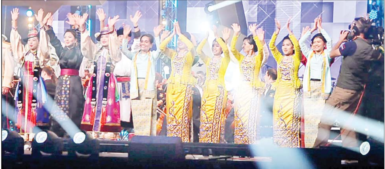
International Army Games-2022 ပြိုင်ပွဲ ပိတ်ပွဲအခမ်းအနားတွင် ရိုးရာယဉ်ကျေးမှုများဖြင့် ဖျော်ဖြေဧည့်ခံကြစဉ်။

🌟 မြန်မာ့တပ်မတော် တင့်တယ်ဖွဲ့အနေဖြင့် Tank Biathlon (Tank Crews Competition) Division-2 ၌ စုစုပေါင်း ပြိုင်ပွဲဝင်စံချိန် ၁ နာရီ ၃၆ မိနစ် ၂၅ စက္ကန့်ရရှိခဲ့ပြီး စုစုပေါင်း ပစ်မှတ် ၁၅ ခုတွင် ၁၄ ခုကို ထိမှန်ခဲ့ကာ ပြိုင်ပွဲဝင် ၁၁ သင်းတွင် ပထမဆုကို ထိုက်ထိုက်တန်တန် ဆွတ်ခူးရရှိ 🌟 လက်ဖြောင့်သေနတ် ပစ်ခတ်ခြင်းပြိုင်ပွဲတွင် ပြိုင်ပွဲဝင် နိုင်ငံ ၃ နှစ်နိုင်ငံအနက် အဆင့် ၄ နေရာ၌ လည်းကောင်း၊ ဆေးတပ်ဖွဲ့ စွမ်းရည်ပြိုင်ပွဲတွင် ဇွဲသတ္တိဆုနှင့် အသင်း ၁၆ သင်းအနက် အဆင့် ၄ နေရာ၌ လည်းကောင်း ရရှိအောင် စွမ်းဆောင်နိုင်ခဲ့