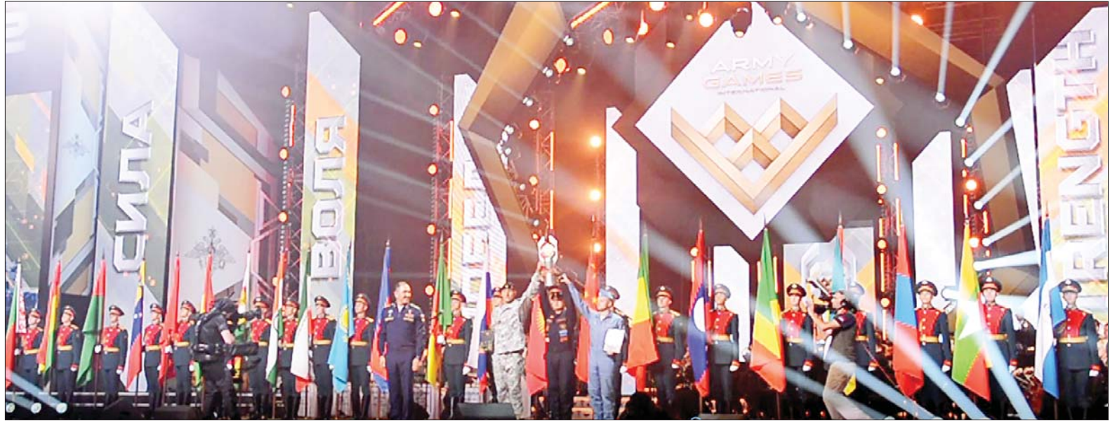
နိုင်ငံတော်စီမံအုပ်ချုပ်ရေး ကောင်စီဒုတိယဥက္ကဋ္ဌ ဒုတိယ တပ်မတော် ကာကွယ်ရေး ဦးစီးချုပ် ကာကွယ်ရေးဦးစီးချုပ် (ကြည်း) ဒုတိယဗိုလ်ချုပ်မှူးကြီး စိုးဝင်း ရုရှားဖက်ဒရေးရှင်းနိုင်ငံ မော်စကိုမြို့ Convention Center တွင် ကျင်းပပြုလုပ်သည့် International Army Games-2022 ပြိုင်ပွဲ ပိတ်ပွဲအခမ်းအနား သို့ တက်ရောက်စဉ်။

ရုရှားဖက်ဒရေးရှင်းနိုင်ငံ၊ ဘီလာရစ် နိုင်ငံနှင့် ဥဇဘက်ကစွတန်နိုင်ငံ တို့မှ ပြိုင်ပွဲဝင်အသင်းများ၏ ယှဉ်ပြိုင်နေမှုများကို ကြည့်ရှု အားပေးကြသည်။ အဆိုပါပြိုင်ပွဲ တွင် ရုရှားနိုင်ငံ တင့်တယ်ဖွဲ့က ၁ နာရီ ၂၉ မိနစ် ၃၆ စက္ကန့်ဖြင့် ပထမဆုကို လည်းကောင်း၊ ဘီလာရစ်နိုင်ငံ တင့်တယ်ဖွဲ့က ၁ နာရီ ၄၁ မိနစ် ၀၄ စက္ကန့်ဖြင့် ဒုတိယဆုကို လည်းကောင်း၊ တရုတ်နိုင်ငံ တင့်တယ်ဖွဲ့က ၁ နာရီ ၄၄ မိနစ် ၀၃ စက္ကန့်ဖြင့် တတိယဆု ကို လည်းကောင်း ရရှိခဲ့သည်။ ယင်းနောက်ရုရှားဖက်ဒရေးရှင်း နိုင်ငံ ကာကွယ်ရေးဝန်ကြီး ကိုယ်စား တာဝန်ရှိသူတစ်ဦးက