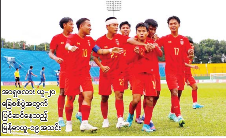
အာရှဖလား ယူ-၂၀ ခြေစမ်းပွဲအတွက် ပြင်ဆင်နေသည့် မြန်မာယူ-၁၉ အသင်း

ရန်ကုန် ဩဂုတ် ၂၈ နိုင်ငံတကာပြိုင်ပွဲများ ယှဉ်ပြိုင်ရန် စခန်းဝင်လေ့ကျင့်နေသည့် မြန်မာ ယူ-၁၉ လက်ရွေးစင်အသင်းနှင့် ယခုလအတွင်း ကျင်းပပြီးစီးခဲ့သည့် ၂၀၂၂ တိုင်းဒေသကြီးနှင့် ပြည်နယ် ယူ-၁၉ ပြိုင်ပွဲမှ ခြေစမ်းပြိုင်ပွဲများဖြင့် ဖွဲ့စည်းထားသည့် တိုင်းဒေသကြီး/ပြည်နယ် ယူ-၁၉ အသင်းတို့ ရန်ကုန်မြို့၌ ခြေစမ်းပွဲနှစ်ပွဲ ယှဉ်ပြိုင်ကစားမည်ဖြစ်သည်။ စာမျက်နှာ ၂၆ ကော်လံ ၁ သို့