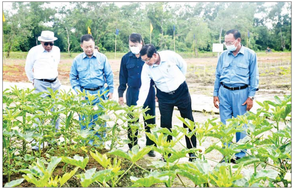
စိုက်ပျိုးရန် ပြောကြားသည်။ ညီလာခံသို့ အရည်ပေ ၁၂၀၀ ဖောက်လုပ်နေသည့် လုပ်ငန်းခွင် ယင်းနောက် တိုင်းဒေသကြီး မြေသားတာဘောင်အကျယ် ၄၈ ဝန်ကြီးချုပ်သည် ခရိုင်ချင်းဆက် ပေ၊ ကွန်ကရစ်လမ်းအကျယ် ၂၂ သည်များမှာ ကြားခဲ့ကြောင်း သိရ ပေ၊ လမ်းအူကြောင်းအသစ် သည်။တိုင်းဒေသကြီး(ပြန်/ဆက်)

လျှပ်စစ်မီး၊ လမ်းပန်းဆက်သွယ် ရေးတို့ကို ဖြည့်ဆည်းဆောင်ရွက် ပေးမည့် အခြေအနေများနှင့် စိုက်ပျိုးမွေးမြူစေရေး တာဝန် ရှိသူအဆင့်ဆင့်က ကြီးကြပ် ဆောင်ရွက်သွားရန်နှင့် လုပ်ကိုင် ခွင့် ရရှိထားသူများအနေဖြင့် လုပ်ငန်းဆောင်ရွက်ခြင်းမရှိပါက သက်ဆိုင်ရာဇုန်ကော်မတီများ၊ ဌာနဆိုင်ရာတာဝန်ရှိသူများက ဝိုင်းဝန်း၍ ပေါင်းစပ်ဆောင်ရွက် ပေးကြရန် မှာကြားသည်။ ဆက်လက်၍ တိုင်းဒေသကြီး ဝန်ကြီးချုပ်နှင့် အဖွဲ့သည် ဇုန် အတွင်းရှိ စစ်မှုထမ်းဟောင်း လေ့ကျင့်ရေးသင်တန်းကျောင်းသို့ ရောက်ရှိရာ မြေကွက်အလွတ်များ ကို ဝင်ငွေရရှိအောင် ငှားရမ်းချ ထားပေးရန်နှင့် နေကြာပင်များ