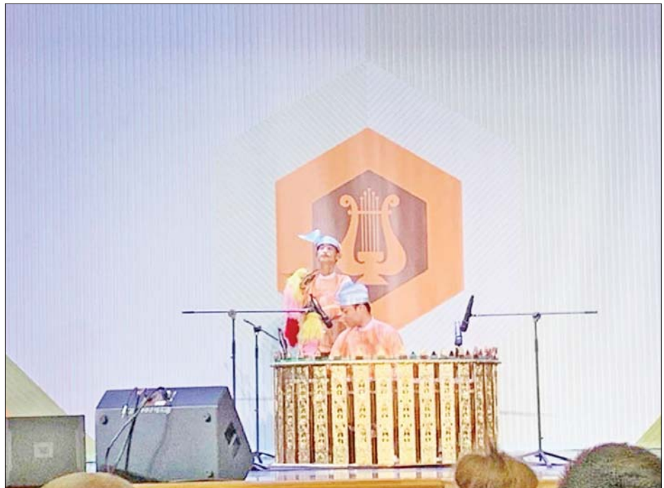
International Army Games-2022 ပြိုင်ပွဲ၏ ဆက်စပ်ပြိုင်ပွဲတစ်ရပ်ဖြစ်သည့် Army of Culture ပြိုင်ပွဲတွင် မြန်မာ့တပ်မတော်ကိုယ်စားပြု ရိုးရာယဉ်ကျေးမှုအဖွဲ့ ဝင်ရောက်ယှဉ်ပြိုင်စဉ်။

တင်ပြသည်။ ယင်းနောက် တက်ရောက်လာကြသူများက မိမိတို့၏ သဘောထားများ၊ လိုလားချက်များကို အပြန်အလှန် ဆွေးနွေးညှိနှိုင်းကာ သဘောထားစုစည်းချက်များရယူပြီး တွေ့ဆုံဆွေးနွေးပွဲ တတိယနေ့ကို ရပ်နားခဲ့သည်။ စတုတ္ထနေ့ဆွေးနွေးပွဲကို ဩဂုတ် ၂၆ ရက်တွင် ဆက်လက်ကျင်းပသွားမည် ဖြစ်ကြောင်း သိရသည်။ သတင်းစဉ်