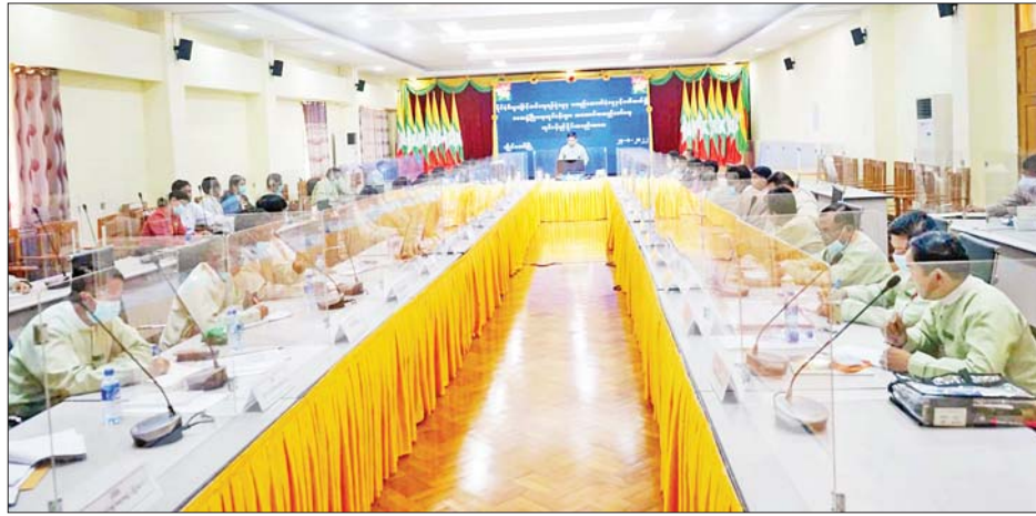
ချမှတ်ပေးထားသော အခြေခံမူများ၊ ဘဏ္ဍာရေး အညီ အကောင်အထည်ဖော် ဆောင်ရွက်ရမည် လုပ်ထုံးလုပ်နည်းများ၊ ညွှန်ကြားချက်များနှင့် ဖြစ်ကြောင်း ပြောကြားသည်။

အကောင်အထည်ဖော် ကယားပြည်နယ်ဝန်ကြီးချုပ် ဦးဇော်မျိုးတင်က နိုင်ငံတော်စီမံအုပ်ချုပ်ရေးကောင်စီ၏ လမ်းညွှန်စီစဉ် မှုဖြင့် နိုင်ငံစီးပွားမြှင့်တင်ရေးရန်ပုံငွေမှ ကယား ပြည်နယ်အတွက် မတည်ငွေအဖြစ်ပေးအပ်သော ငွေကျပ် ၁၀ ဘီလီယံကို ဒေသဖွံ့ဖြိုးတိုးတက်ရေး လုပ်ငန်းများတွင် သတ်မှတ်ကာလအတွင်း