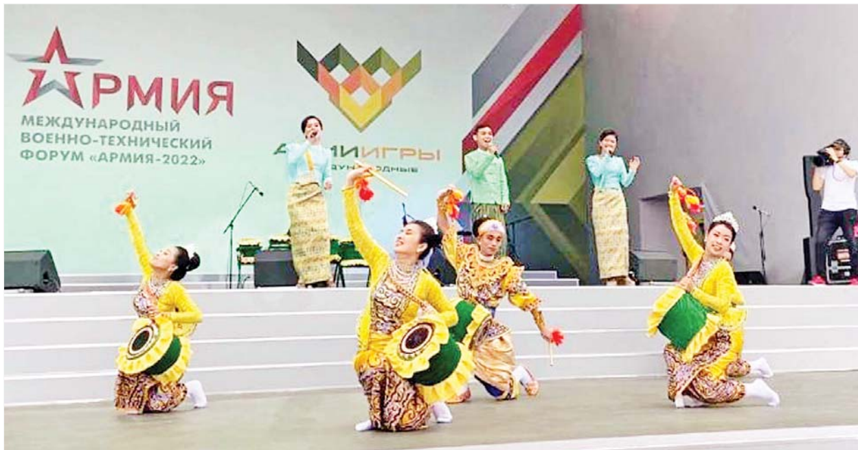
International Army Games-2022 ပြိုင်ပွဲ၏ ဆက်စပ်ပြိုင်ပွဲတစ်ရပ်ဖြစ်သည့် Army of Culture ပြိုင်ပွဲတွင် မြန်မာ့တပ်မတော်ကိုယ်စားပြု ရိုးရာယဉ်ကျေးမှုအဖွဲ့ ဝင်ရောက်ယှဉ်ပြိုင်စဉ်။