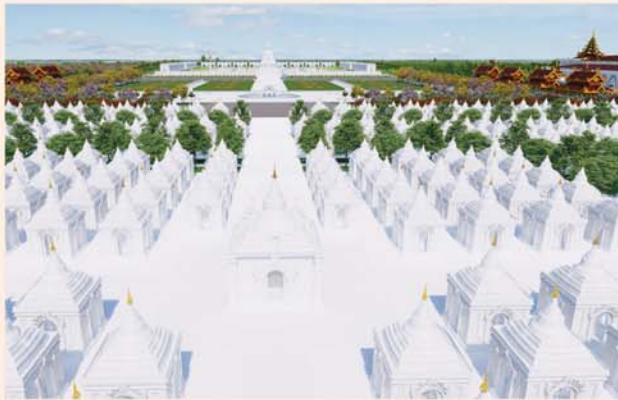
ကျောက်စာရုံစေတီ(၁၂ x ၁၂x ၁၈)ပေ ၁ ဆူ တန်ဖိုး- ၂၇၉ သိန်း