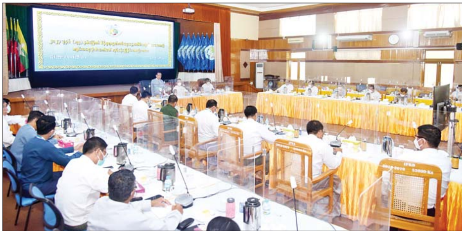
ဦးစီးကော်မတီ ဒုတိယဥက္ကဋ္ဌ (၁) ပြည်ထောင်စုဝန်ကြီး ဦးကိုကို (၇၅) နှစ်မြောက် စိန်ရတု လွတ်လပ်ရေးနေ့ အထိမ်းအမှတ်ပဒေသာကပွဲကျင်းပရေး ဦးစီးကော်မတီ လုပ်ငန်းညှိနှိုင်းအစည်းအဝေးတွင် အမှာစကားပြောကြားစဉ်။

နေပြည်တော် ဩဂုတ် ၂၃ ၂၀၂၃ ခုနှစ် (၇၅) နှစ်မြောက် စိန်ရတု လွတ်လပ်ရေးနေ့ အထိမ်းအမှတ်ပဒေသာကပွဲကျင်းပ ရေး ဦးစီးကော်မတီ လုပ်ငန်းညှိနှိုင်းအစည်းအဝေးကို ယနေ့နံနက် ၁၀ နာရီက နေပြည်တော်ရှိ ပြန်ကြားရေး ဝန်ကြီးဌာန စုပေါင်းခန်းမ၌ ကျင်းပသည်။