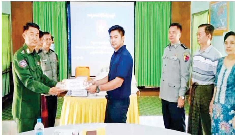
အတွင်း ပြန်လည်ဝင်ရောက်လျက်ရှိကြသဖြင့် အုပ်ထိန်းသူများထံသို့ လွှဲပြောင်းအပ်နှံပေးလျက် သက်ဆိုင်ရာတာဝန်ရှိသူများက ၎င်းတို့၏ မိဘ ရှိကြောင်း သိရသည်။ သတင်းစဉ်

ဘောင်အတွင်း ဝင်ရောက်ခဲ့သည့် ပြစ်မှုကျူးလွန်ခြင်း မရှိခဲ့သော မော်လမြိုင်မြို့ ခိုင်းဝန်ကွင်းရပ်ကွက်မှ PDF အဖွဲ့ဝင် အမျိုးသားတစ်ဦးကို ဝန်ခံကတိ လက်မှတ်ရေးထိုးစေကာ ၎င်း၏ မိဘအုပ်ထိန်းသူများ ထံသို့ လွှဲပြောင်းအပ်နှံပြီး ထောက်ပံ့ပစ္စည်းများ ပေးအပ်သည်။ ကြိုဆိုလက်ခံသွားမည့် PDF အပါအဝင် အဖွဲ့အစည်းအမျိုးမျိုးတို့ အနေဖြင့် နိုင်ငံတော်၏ရှေ့လုပ်ငန်းစဉ်များတွင် ပါဝင်ပူးပေါင်းဆောင်ရွက်နိုင်ရေး သတ်မှတ်စည်းကမ်းချက်များနှင့်အညီ ဥပဒေဘောင်အတွင်းသို့ လက်နက်အပ်နှံပြီး ပြည်သူ့ဘဝသို့ ပြန်လည်ဝင်ရောက်ခြင်း ပြုမည်ဆိုပါက ကြိုဆိုလက်ခံသွားမည်ဖြစ်ကြောင်း နိုင်ငံတော်အစိုးရက ထုတ်ပြန်ထားပြီးဖြစ်ရာ ပြစ်မှုကျူးလွန်ခြင်းမရှိသော PDF အဖွဲ့ဝင်များက တိုင်းဒေသကြီးနှင့် ပြည်နယ်အသီးသီး၌ ဥပဒေဘောင်