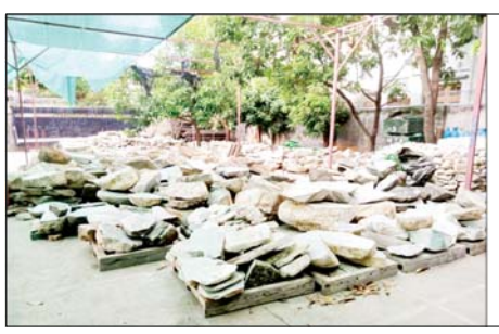
၂၀၂၂ ခုနှစ် ဩဂုတ် ၁၈ ရက်တွင် ချမ်းအေးသာစံမြို့နယ် ပြည်ကြီးပျော်ဘွယ် အနောက်ရပ်ကွက်ရှိ မြန်မာသူရကျောက်မျက်ကုမ္ပဏီအလုပ်ရုံမှသိမ်းဆည်းရမိသည့် ကျောက်စိမ်းဖြတ်သားမျိုးစုံ တန် ၈၀ ခန့်၏ မှတ်တမ်းဓာတ်ပုံ။