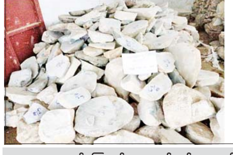
၂၀၂၂ ခုနှစ် ဩဂုတ် ၁၉ ရက်တွင် ဖားကန့်မြို့နယ် နမူဖြစ်ကျေးရွာရှိ ကျော်သူရပိုင်ဆိုင်သော မြန်မာသူရကျောက်မျက်ကုမ္ပဏီဝင်းအတွင်းမှ သိမ်းဆည်းရမိခဲ့သည့် ကျောက်စိမ်းဖြတ်သားများနှင့် ကျောက်စိမ်းအရိုင်းတုံးများ မှတ်တမ်းဓာတ်ပုံ။