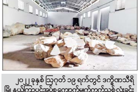
၂၀၂၂ ခုနှစ် ဩဂုတ် ၁၉ ရက်တွင် ဒက္ခိဏသီရိ မြို့နယ်ကြာပင်အုပ်စုကျောက်မျက်ကွက်သစ်လုံးခင်း လမ်းရှိ ကျော်သူရပိုင်ဆိုင်သော မြန်မာသူရကျောက် မျက်ကုမ္ပဏီရုံးအတွင်းရှိ ဂိုဒေါင်မှ သိမ်းဆည်းရ မိသည့်ကျောက်စိမ်းဖြတ်သားများ မှတ်တမ်းဓာတ်ပုံ။