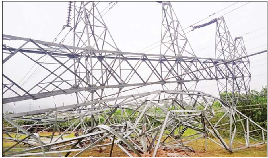
မိုင်းထောင်ဖောက်ခွဲခံရသည့် တာဝါတိုင်အမှတ် ၁၇၃ ၏ ပျက်စီးမှု မှတ်တမ်းဓာတ်ပုံ။

နေပြည်တော် ဩဂုတ် ၂၀ ကရင်ပြည်နယ် ကော့ကရိတ် မြို့နယ် ကော့နွဲ့ရွာအနီးရှိ ဓာတ်အားပေးတာဝါတိုင် နှစ်ခု အား ဩဂုတ် ၂၀ ရက် ည ၁၁ နာရီ ခန့်တွင် KKO (ခွဲထွက်)အဖွဲ့နှင့် PDF အမည်ခံ အကြမ်းဖက်သမား များက မိုင်းထောင်ဖောက်ခွဲ ဖျက်ဆီးခဲ့မှုကြောင့် ကရင် ပြည်နယ်အတွင်းရှိ မြို့နယ်အချို့ တွင် ဓာတ်အားပြတ်တောက် လျက်ရှိကြောင်း သိရသည်။ ဖြစ်စဉ်မှာ မော်လမြိုင်- မြဝတီ ဓာတ်အားလိုင်း ၂၃၀ ကေဗီ တာဝါတိုင်အမှတ် ၁၇၂ နှင့် စာမျက်နှာ ၁၇ ကော်လံ ၁ သို့