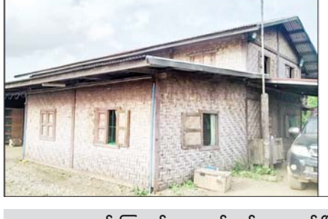
၂၀၂၂ ခုနှစ် ဩဂုတ် ၂၀ ရက်တွင် ဖားကန့်မြို့နယ် ဆိပ်မူကျေးရွာအုပ်စု စပေါ့ကျေးရွာရှိ မြန်မာ သူရကျောက်မျက်ကုမ္ပဏီလုပ်ကွက်အတွင်း ချုပ်ပိတ်သိမ်းဆည်းခဲ့သည့်အဆောက်အအုံများ မှတ်တမ်း ဓာတ်ပုံ။