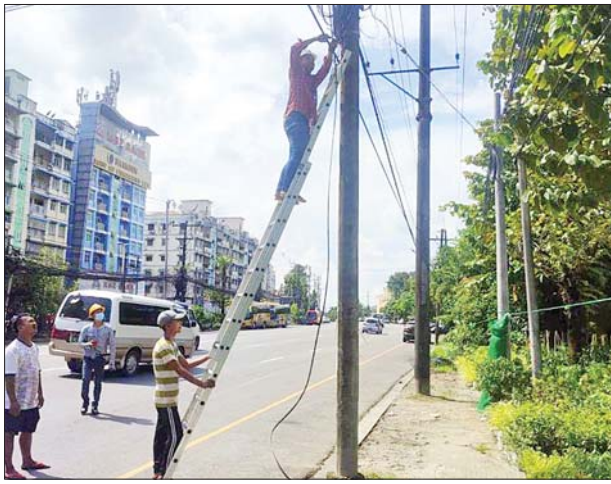
ဆောင်ရွက်ခဲ့ကြကြောင်း ရန်ကုန်လျှပ်စစ်ဓာတ်အားပေးရေးကော်ပို ရေးရှင်းမှ သိရသည်။

သို့ရာတွင် လိုက်နာဆောင်ရွက်မှုမရှိဘဲ တရားမဝင် ဆက်လက် သွယ်တန်းထားသော ဖိုက်ဘာကေဘယ်ကြိုးများနှင့် ဝိုင်ဖိုင်ကြိုးများကို စစ်ဆေးဖော်ထုတ်ဖယ်ရှားရှင်းလင်းခြင်းများ ဆောင်ရွက်လျက်ရှိရာ ရန်ကုန်တိုင်းဒေသကြီး မရမ်းကုန်းမြို့နယ် မင်းဓမ္မလမ်းတစ်လျှောက်ရှိ ရန်ကုန်လျှပ်စစ်ဓာတ်အားပေးရေးကော်ပိုရေးရှင်းပိုင် ဓာတ်အားလိုင်း တိုင်များပေါ်တွင် တရားမဝင်သွယ်တန်းထားသော ဖိုက်ဘာကေဘယ် ကြိုးများနှင့် ဝိုင်ဖိုင်ကြိုးများ ဖယ်ရှားရှင်းလင်းခြင်းကို ဩဂုတ် ၂၀ ရက် တွင် ရန်ကုန်လျှပ်စစ်ဓာတ်အားပေးရေးကော်ပိုရေးရှင်း အနေအထားပိုင်း ခရိုင် မရမ်းကုန်းမြို့နယ် လျှပ်စစ်မန်နေဂျာရုံးမှ ဝန်ထမ်းများနှင့် တရားဝင်ခွင့်ပြုထားသော ဆက်သွယ်ရေးကုမ္ပဏီများမှ ဝန်ထမ်းများဖြင့်