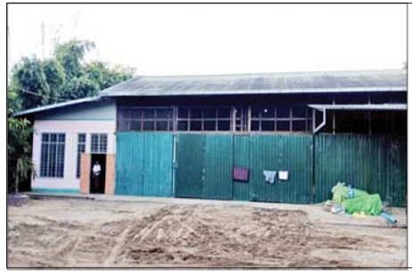
၂၀၂၂ ခုနှစ် ဩဂုတ် ၁၉ ရက်တွင် ဖားကန့်မြို့နယ် နမူဖြစ်ကျေးရွာရှိ ကျော်သူရပိုင်ဆိုင်သော မြန်မာသူရကျောက်မျက်ကုမ္ပဏီဝင်းအတွင်းရှိ အဆောက်အအုံများ ချုပ်ပိတ်သိမ်းဆည်းခဲ့သည့် မှတ်တမ်းဓာတ်ပုံ။