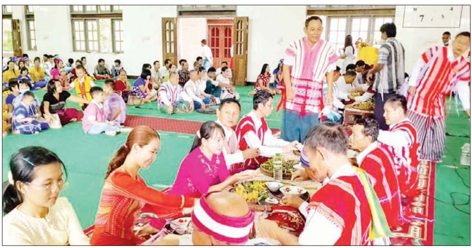
တိုးတက်ကောင်းမွန်စေရန် လိပ်ပြာဖွဲ့ဆုတောင်းပေးခဲ့ သီချင်းဖြင့် သီဆိုကပြပျော်ဖြေခဲ့ကြကြောင်း သိရသည်။ သီဆိုကပြပျော်ဖြေခဲ့ကြကြောင်း သားငယ် (မုဒုံ)

အချင်းချင်း စည်းလုံးညီညွတ်ချစ်ချစ်ခင်ခင်နေထိုင် သွားကြရန်၊ ကွဲကွာနေသောဆွေမျိုးများ မိသားစု အချင်းချင်း ပြန်လည်တွေ့ဆုံစုစည်းကြစေရန်၊ ကရင်အမျိုးသားအချင်းချင်း ချစ်ကြည်ရင်းနှီးမှု ရရှိစေရန်၊ မျိုးဆက်သစ်လူငယ်များအား လူကြီးများ ထံမှ သွန်သင်ဆုံးမစကား ပြောကြားနိုင်ရန်နှင့် ရိုးရာယဉ်ကျေးမှုဖြစ်သည့် စကား၊ စာပေ၊ အနုပညာ၊ ဝတ်စားဆင်ယင်မှု၊ ရိုးရာဓလေ့များ မပျောက်ကွယ် စေရန် ကျင်းပရခြင်းဖြစ်ကြောင်း ပြောကြားသည်။ ဆက်လက်၍ ကရင်တိုင်းရင်းသား သက်ကြီး များက ဧည့်သည်တော်များ၊ ကရင်မျိုးဆက်သစ် မောင်မယ်များ၊ ကလေးငယ်များအား ချည်ဖြူဖွဲ့ပေး ခြင်း၊ စီးပွားရေး၊ လူမှုရေး၊ ကျန်းမာရေးတို့တွင်