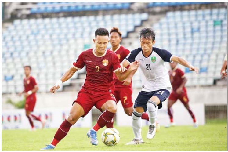
ဧရာဝတီနှင့် မြဝတီအသင်းတို့ ယှဉ်ပြိုင်စဉ်။

ဧရာဝတီအသင်းသည် အမာခံကစား သမားအစုံအလင်ဖြင့် ပွဲထွက်ခဲ့သလို မြဝတီအသင်းကလည်း လူစုံအသုံးပြုခဲ့ သည်။ ပွဲအစပိုင်းတွင် ဧရာဝတီအသင်း အထူးမှူးကို အခွင့်ကောင်းယူကာ မြဝတီအသင်းက တိုက်စစ်မြှင့်ကစားခဲ့ပြီး ၄၂ မိနစ်တွင် နိုင်ငံထက်က နှစ်ဂိုးဆက် သွင်းယူခဲ့သည်။ နှစ်ဂိုးဆက်ပေးလိုက်