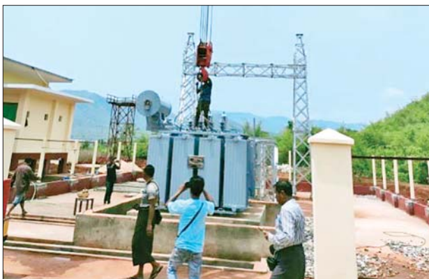
ကျေးရွာပေါင်း ၃၂ ရွာတွင် မကြာမီ လျှပ်စစ်မီးလင်းတော့မည် ဖြစ်ကြောင်း မြို့နယ်လျှပ်စစ်မန်နေဂျာထံမှ သိရသည်။ တင်ဦး(ရမည်းသင်း)

ရမည်းသင်း ဩဂုတ် ၂၁ ရမည်းသင်းမြို့နယ် ပျားစီကျေးရွာ၌ ၃၃/၁၁ ကေဗွီ ဓာတ်အားခွဲရုံသစ် တိုးချဲ့တည်ဆောက်ခြင်းနှင့် မြို့လှကျေးရွာမှ ပျားစီကျေးရွာသို့ ၃၃/၁၁ ကေဗွီ ဓာတ်အားလိုင်း ၁၁ ဒဿမ ၅ မိုင် အသစ်တိုးချဲ့လိုင်းဆွဲခြင်း လုပ်ငန်းများကို ၂၀၂၀-၂၀၂၁ ဘဏ္ဍာနှစ် တိုင်းဒေသကြီးဘတ်ဂျက်ဖြင့် ဆောင်ရွက်လျက်ရှိရာ 5.MVA မိန်းထရန်စဖော်မာ တပ်ဆင်ပြီးဖြစ်သည်။ ယနေ့တွင် လုပ်ငန်းများဆောင်ရွက်ထားမှု ၇၅ ရာခိုင်နှုန်း ဆောင်ရွက်ပြီးဖြစ်သည့်အတွက် ရမည်းသင်းမြို့နယ် အနောက်ခြမ်းရှိ