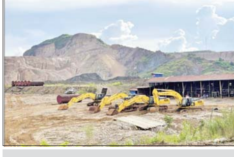
၂၀၂၂ ခုနှစ် ဩဂုတ် ၂၀ ရက်တွင် ဖားကန့်မြို့နယ် ဆိပ်မူကျေးရွာအုပ်စု စပေါ့ကျေးရွာရှိ မြန်မာ သူရကျောက်မျက်ကုမ္ပဏီလုပ်ကွက်မှ သိမ်းဆည်းရမိသည့် စက်ယန္တရားများမှတ်တမ်းဓာတ်ပုံ။