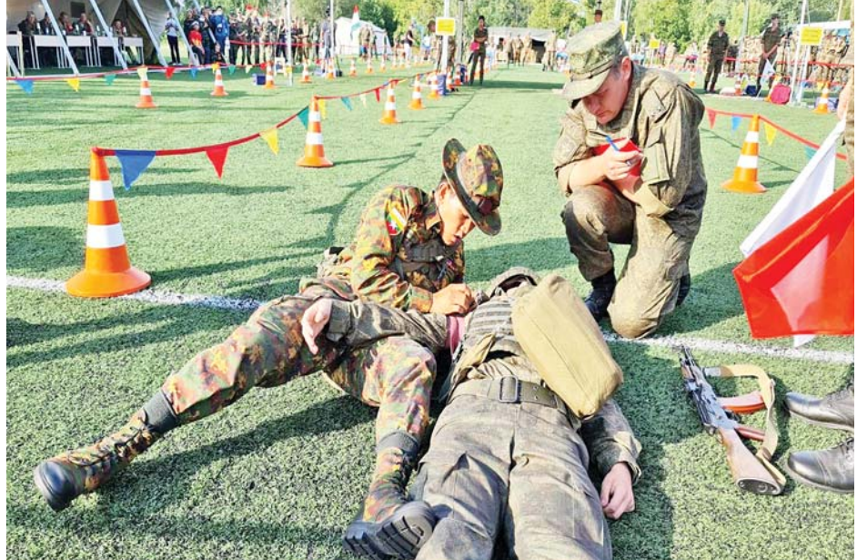
သူနာပြု(အမျိုးသား) ပြိုင်ပွဲဝင်များ တစ်ဦးချင်းအထူးစွမ်းရည်ပြသခြင်းပြိုင်ပွဲ ဝင်ရောက်ယှဉ်ပြိုင် နေမှုကို တွေ့ရစဉ်။

အဆင့်ဆင့်နှင့် လယ်တစ်ဧကလျှင်တစ်နာရီခန့်သာ ကြာမြင့်သည့် ကူဘိုတာခြောက်တန်းသွား မောင်းနှင် အသုံးပြုပုံကို ရှင်းလင်းပြောကြားသည်။ ထို့နောက် ပြည်နယ်ဝန်ကြီးချုပ်က တက် ရောက်လာသော တောင်သူလယ်သမားများနှင့် တွေ့ဆုံ၍ ယခုကဲ့သို့ စိုက်ပျိုးသရုပ်ပြခြင်းသည် တောင်သူများအတုယူလုပ်ကိုင်နိုင်စေရန် ရည်ရွယ် ကြောင်း၊ မြေလွတ်မြေလပ်မထားဘဲ သီးထပ်သီးညှပ် များဖြင့် အနည်းဆုံး နှစ်သီးစားခန့် စိုက်ပျိုးလုပ်ကိုင် ကြစေလိုကြောင်း၊ စပါးအပြီးတွင် ပဲတီစိမ်းကို စိုက်ပျိုးစေလိုပြီး ဆီထွက်သီးနှံများလည်းစိုက်ပျိုး နိုင်ကာ ဈေးကွက်ရှိသောသီးနှံများကို ရွေးချယ် စိုက်ပျိုးကြစေလိုကြောင်းနှင့် လိုအပ်သည်များ ဆွေးနွေးတင်ပြပေးကြရန်ပြောကြားပြီး တောင်သူ များက မြေဩဇာ၊ ကုန်ထုတ်လမ်းနှင့် စိုက်ပျိုးရေး ဆိုင်ရာလိုအပ်ချက်များကို ဆွေးနွေးတင်ပြကြရာ ပြည်နယ်ဝန်ကြီးချုပ်က သက်ဆိုင်ရာဌာနများနှင့် ပေါင်းစပ်ညှိနှိုင်းဆောင်ရွက်ပေးခဲ့ကြောင်း သိရ သည်။ ပြည်နယ်(ပြန်/ဆက်)