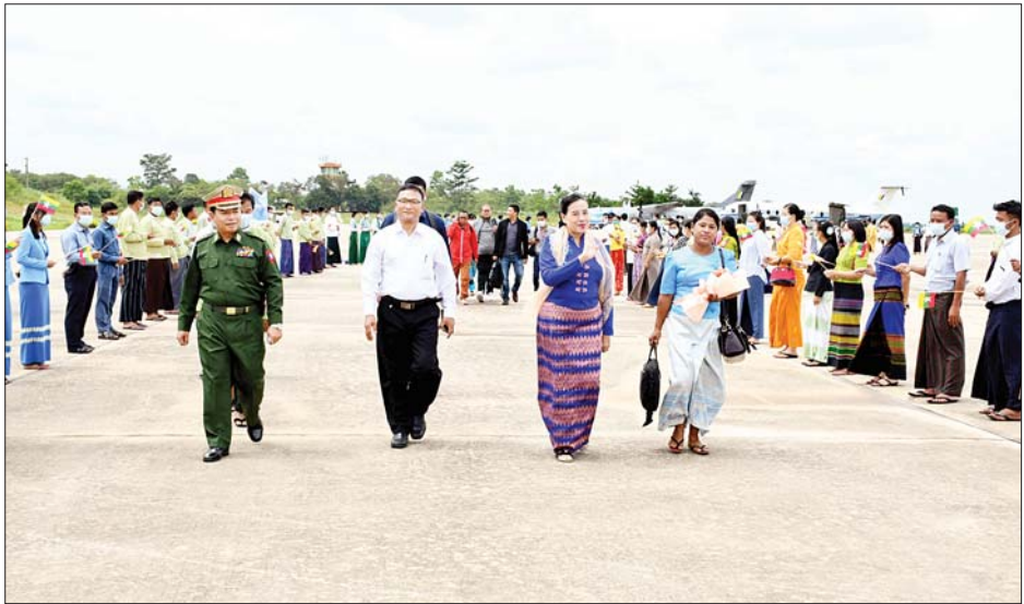
ရခိုင်ပြည်လွတ်မြောက်ရေးပါတီ(ALP) ဒုတိယဥက္ကဋ္ဌ စောမြရာဇာလင်း ဦးဆောင်သည့် ငြိမ်းချမ်းရေးကိုယ်စားလှယ်အဖွဲ့ နေပြည်တော်သို့ ရောက်ရှိရာ တာဝန်ရှိသူများနှင့် ဒေသခံပြည်သူများက ကြိုဆိုကြစဉ်။