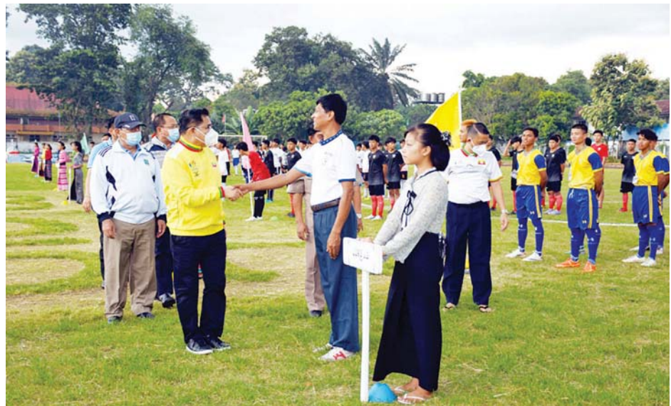
၁၆ နှစ်အောက် အမျိုးသားဘောလုံးပြိုင်ပွဲကို အသင်း ၁၀ သင်းဖြင့် ကျင်းပခဲ့ကြောင်း သိရသည်။ ပြည်နယ်အတွင်းရှိ မြို့နယ်ပေါင်းစုံမှ ဘောလုံး ပြည်နယ် (ပြန်/ဆက်)

များတွင် တံခွန်စိုက်ဆုလားများနှင့် ဆုတံဆိပ်များ ရယူနိုင်ခဲ့သည်ကို အားလုံးအသိဖြစ်ကြောင်း၊ ဝင်ရောက်ယှဉ်ပြိုင်ကြမည့် အားကစားသမားများ အနေဖြင့် ယှဉ်ပြိုင်ခြင်းသည် အဓိကဖြစ်သလို အနိုင် ရခြင်းသည် ပဓာနကျသည်ဟူသော ခံယူချက်ဖြင့် မိမိတို့ကိုယ်စားပြုယှဉ်ပြိုင်ကြမည့် မြို့နယ်အတွက် အကောင်းဆုံး၊ အသန်ရှင်းဆုံးနှင့် အစွမ်းကုန် ကြိုးစားယှဉ်ပြိုင်ကြရန် လိုအပ်ကြောင်း ပြောကြား သည်။ ထို့နောက် ပြည်နယ်ဝန်ကြီးချုပ် ပြည်နယ်ဝန်ကြီး များနှင့် တာဝန်ရှိသူများက မြို့နယ်ပေါင်းစုံမှ ဘောလုံး အသင်းများအား ရင်းရင်းနှီးနှီး လိုက်လံနှုတ်ဆက် အားပေးခဲ့ကြသည်။ အဆိုပါ ပြည်နယ်ဝန်ကြီးချုပ်ဖလား အသက်