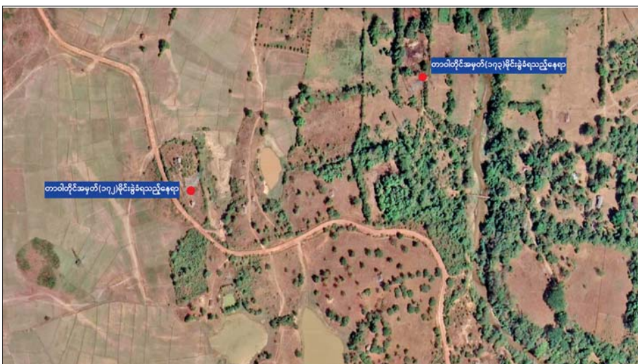
ဓာတ်အားတာဝါတိုင် မိုင်းခွဲခံရသည့်ဖြစ်စဉ် နေရာပြမြေပုံ။

အဆိုပါ KKO (ခွဲထွက်)အဖွဲ့ နှင့် PDF အမည်ခံ အကြမ်းဖက် သမားများ၏ မိုင်းထောင်ဖောက်ခွဲ မှုကြောင့် ပျက်စီးလျက်ရှိသော တာဝါတိုင်များကို ပြန်လည်ပြုပြင် နိုင်ရေး သက်ဆိုင်ရာဌာနက စီစဉ် ဆောင်ရွက်လျက်ရှိကြောင်းနှင့် လုံခြုံရေး တပ်ဖွဲ့ဝင်များက လိုအပ်သည့် လုံခြုံရေးလုပ်ငန်း များ ဆက်လက်ဆောင်ရွက်လျက် ရှိကြောင်း သိရသည်။ သတင်းစဉ်