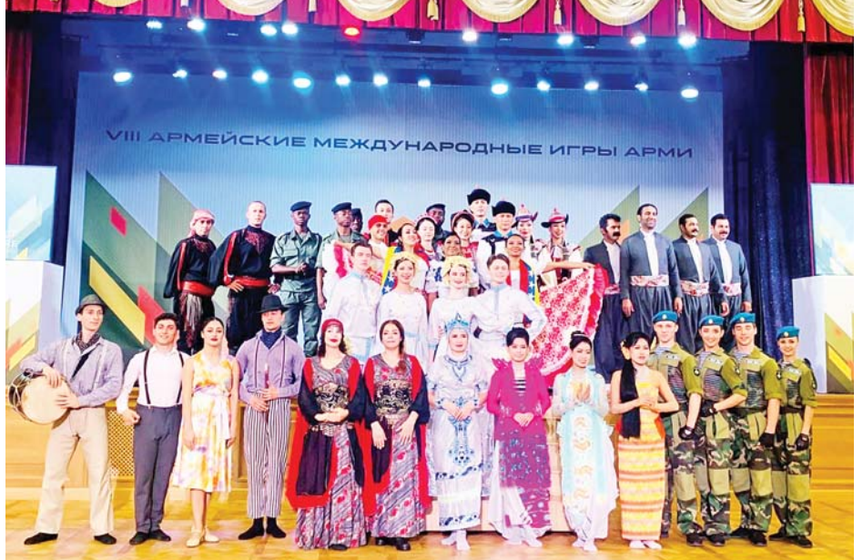
ရိုးရာယဉ်ကျေးမှုပြိုင်ပွဲဝင်အသင်းမှ ဝင်ရောက်ယှဉ်ပြိုင်နေမှုကို တွေ့ရစဉ်။

❖ ရှေ့ဖုံးမှ မြန်မာ့တပ်မတော်တင့်တပ်ဖွဲ့အနေဖြင့် Tank Biathlon (Tank Crews Competition) Division-2 ၌ ဆီးရီးယား၊ လာအို၊ အီရန်၊ တာဂျစ်ကစတန်၊ တောင်အာဆင်စတန်၊ အာချီဇီယာ၊ ဆူဒန်၊ ဇင်ဘာဘွေ၊ အာမေရိကန်နှင့် မာလီနိုင်ငံတို့မှ တင့်တပ်ဖွဲ့ဝင်များနှင့်အတူ မိုင်ကုန်မောင်းနှင်၍ စံချိန်ယူခြင်း၊ ၁၅၅ မီလီမီတာ အမြောက်အား ရပ်လျက်ကျည် သုံးတောင့်ပစ်ခတ်ခြင်း၊ ၁၂ ဒဿမ ၇ မီလီမီတာ လေယာဉ်ပစ်ခတ်ကျည် ၁၅ တောင့် ရပ်လျက်ပစ်ခတ်ခြင်း၊ ၇ ဒဿမ ၆၅ မီလီ မီတာ ယှဉ်တွဲစက်သေနတ်ကျည် ၁၅ တောင့် ရပ်လျက်ပစ်ခတ်ခြင်းတို့ကို ယှဉ်ပြိုင်ခဲ့ပြီး မြန်မာ့ တပ်မတော်တင့်တပ်ဖွဲ့ Crew - 1 အနေဖြင့် ပြိုင်ပွဲ