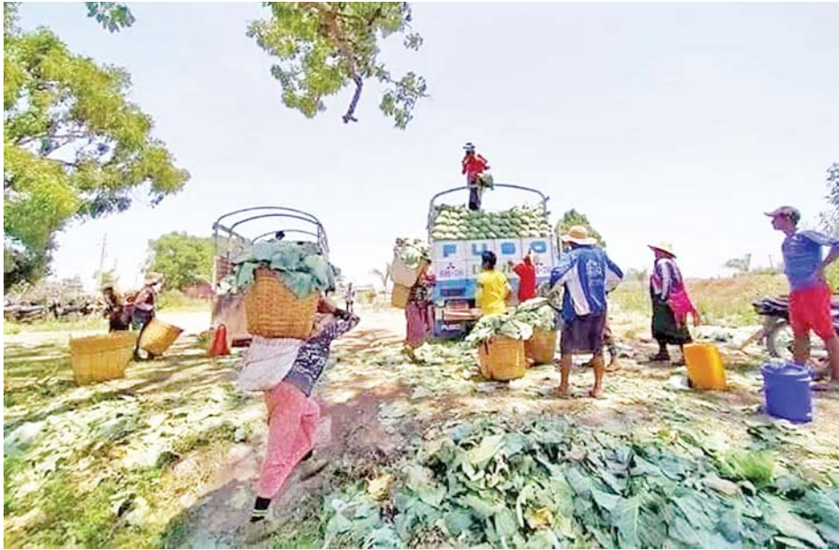
“လက်ရှိမှာတော့ ဂေါ်ဖီအဓိကစိုက်ပျိုးတဲ့ အောင်ပန်းဒေသနဲ့ ပြင်ဦးလွင်ဒေသဘက်ကပဲ ဝင်ရောက်လာတာပါ။ ကျန်တဲ့ဒေသက ဂေါ်ဖီထွက်တာ မရှိသေးပါဘူး။ တောင်သူတွေက စိုက်တဲ့သူနည်းပါးသွားလို့ ဒီလထဲမှာ ဈေးနှုန်းတွေက မထင်မှတ်ဘဲတက်သွားတာပါ။ လက်ရှိမှာ ဒီဈေးကို

မန္တလေး ဩဂုတ် ၂၀ မန္တလေးမြို့ အောင်မြေသာစံမြို့နယ်ရှိ သီရိမာလာ ကုန်စိမ်းလက်ကားဈေးအတွင်းသို့ ပြင်ဦးလွင် ဒေသနှင့် အောင်ပန်းဒေသတို့မှ ဝင်ရောက်လာသည့် ဂေါ်ဖီထုပ်များ ယခင်လထက် ဈေးကောင်းရရှိနေကြောင်း အဆိုပါ ဈေးအတွင်းရှိ ဂေါ်ဖီပွဲရုံများထံမှ သိရသည်။