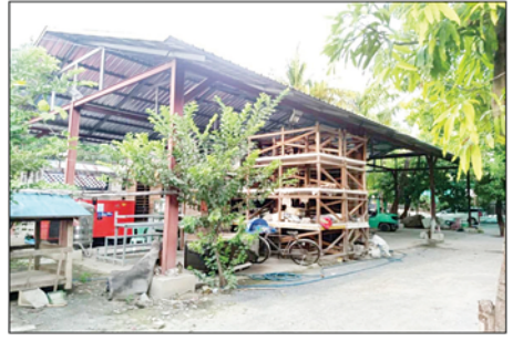
၂၀၂၂ ခုနှစ် ဩဂုတ်လ ၁၈ ရက်တွင် ချမ်းအေး သာစံမြို့နယ် ပြည်ကြီးပျော်ဘွယ် အနောက် ရပ်ကွက်ရှိ မြန်မာသူရကျောက်မျက်ကုမ္ပဏီ အလုပ်ရုံအား ချုပ်ပိတ်သိမ်းဆည်းခဲ့မှု မှတ်တမ်း ဓာတ်ပုံ။