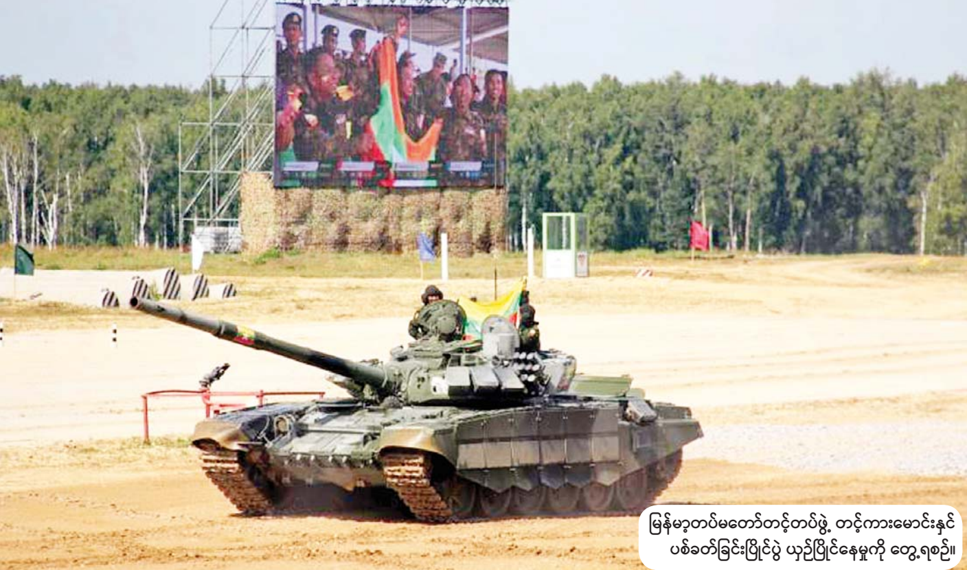
မြန်မာ့တပ်မတော်တင့်တပ်ဖွဲ့ တင့်ကားမောင်းနှင် ပစ်ခတ်ခြင်းပြိုင်ပွဲ ယှဉ်ပြိုင်နေမှုကို တွေ့ရစဉ်။