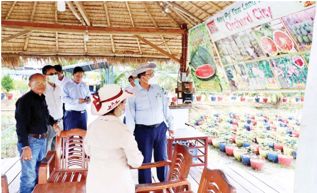
ဘစ်အမ်ပျိုးပင်နှင့် မျိုးစေ့ပြခန်းအား ကြည့်ရှုလေ့လာ။

“ဟုတ်ပါပြီ။ စပါးကို ကျွန်တော်တို့ ကောက်စိုက်စက်နဲ့ စိုက်မယ်ဆိုရင် ပျိုးသက် ၁၄ ရက်ကနေ ၁၆ ရက်ကြား စိုက်ရင် အကောင်းဆုံးပါပဲ။ တစ်ရက်၊ နှစ်ရက် ကျော်သွားရင်ရေပမယ့် ပျိုး သက်ရက် ၂၀ ထက်ကျော်ရင် မကောင်းပါ ဘူး။ ကျွန်တော်တို့ ဒီကောက်စိုက်စက်နဲ့