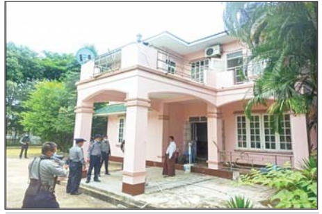
၂၀၂၂ ခုနှစ် ဩဂုတ်လ ၁၉ ရက်တွင် ဥတ္တရ သီရိမြို့နယ် ဥတ္တရသီရိရပ်ကွက် စစ်ကိုင်းလမ်းနှင့် သဇင်(၆)လမ်းထောင့်ရှိ ကျော်သူရ ပိုင်ဆိုင်သော အိမ်အမှတ်(၅၀၄၆)အား ချုပ်ပိတ်သိမ်းဆည်းခဲ့ သည့် မှတ်တမ်းဓာတ်ပုံ။