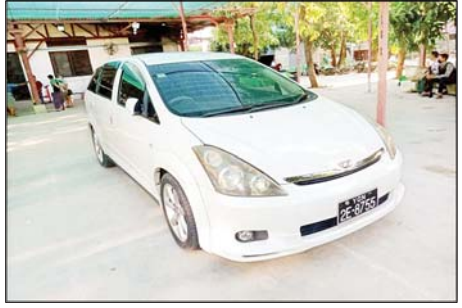
၂၀၂၂ ခုနှစ် ဩဂုတ် ၁၈ ရက်တွင် ချမ်းအေး သာစံမြို့နယ် ပြည်ကြီးပျော်ဘွယ် အနောက် ရပ်ကွက်ရှိ မြန်မာသူရကျောက်မျက်ကုမ္ပဏီ အလုပ်ရုံမှ သိမ်းဆည်းရမိသည့် ယာဉ်၏ မှတ်တမ်း ဓာတ်ပုံ။