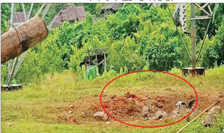
မိုင်းထောင်ဖောက်ခွဲခံရသည့် တာဝါတိုင်အမှတ် ၁၇၂ ၏ ပျက်စီးမှုမှတ်တမ်းဓာတ်ပုံ။