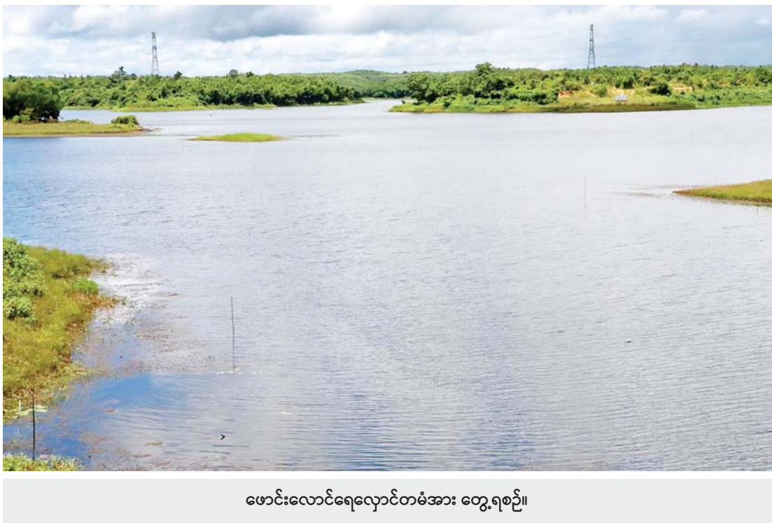
ဖောင်းလောင်ရေလှောင်တံခံအား တွေ့ရစဉ်။