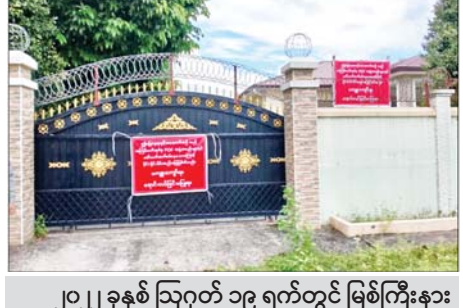
၂၀၂၂ ခုနှစ် ဩဂုတ် ၁၉ ရက်တွင် မြစ်ကြီးနား မြို့ ရွှေအိုက်ရပ်ကွက် ရွှေလမ်းမကြီးဘေး A လမ်း နှင့် B လမ်းကြားရှိ ကျော်သူရပိုင်ဆိုင်သော နေအိမ် အား ချုပ်ပိတ်သိမ်းဆည်းခဲ့သည့် မှတ်တမ်းဓာတ်ပုံ။