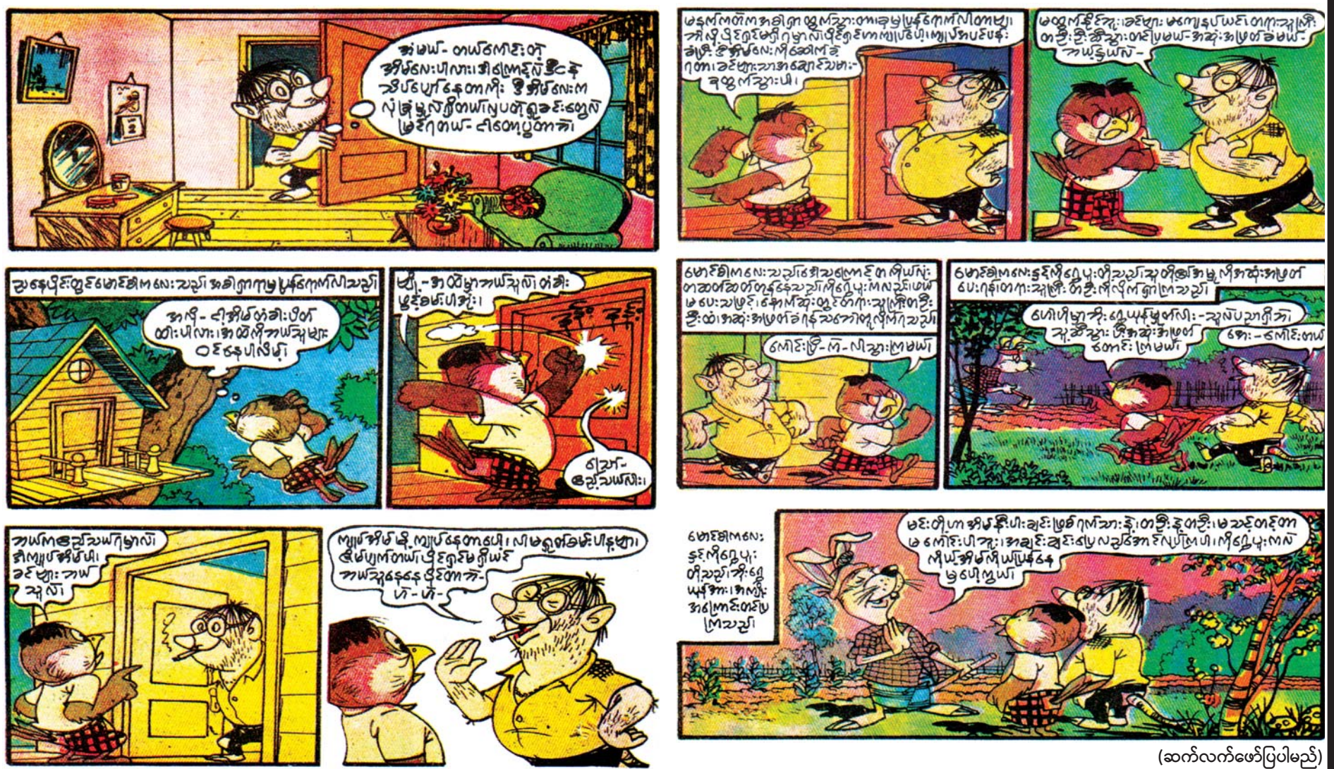
(ဆက်လက်ဖော်ပြပါမည်)