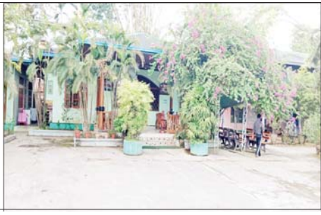
၂၀၂၂ ခုနှစ် ဩဂုတ် ၁၉ ရက်တွင် ဒက္ခိဏ သီရိမြို့နယ် ကြာပင်အုပ်စု ကျောက်မျက်ကွက်သစ် လုံးခင်းလမ်းရှိ ကျော်သူရပိုင်ဆိုင်သော မြန်မာ သူရကျောက်မျက်ကုမ္ပဏီရုံးအား ချုပ်ပိတ် သိမ်းဆည်းခဲ့သည့်မှတ်တမ်းဓာတ်ပုံ။