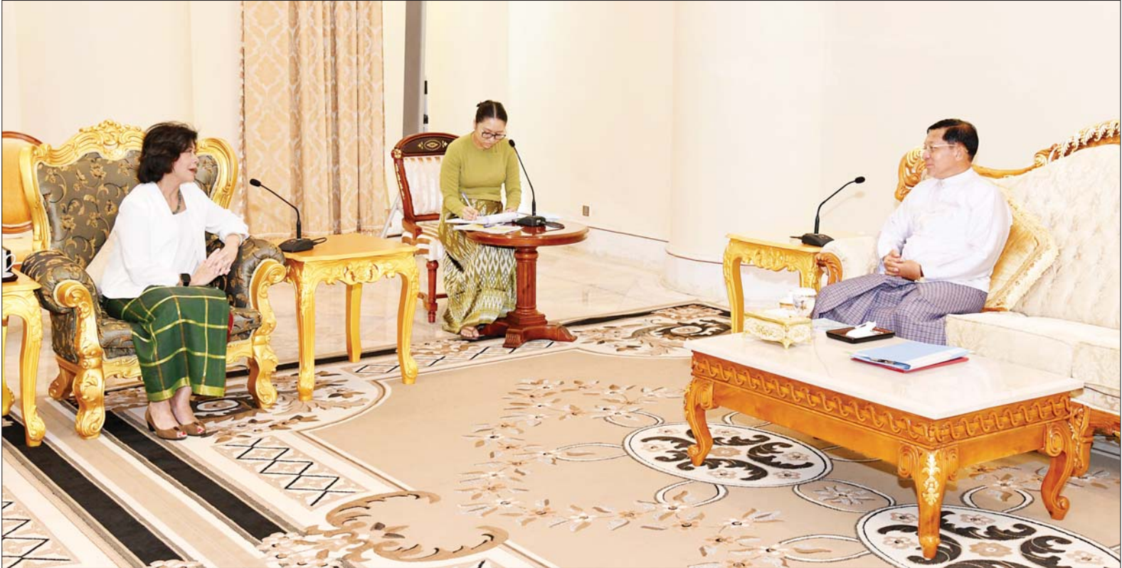
နိုင်ငံတော်စီမံအုပ်ချုပ်ရေးကောင်စီဥက္ကဋ္ဌ နိုင်ငံတော်ဝန်ကြီးချုပ် ဗိုလ်ချုပ်မှူးကြီး မင်းအောင်လှိုင် ကုလသမဂ္ဂအတွင်းရေးမှူးချုပ်၏ မြန်မာနိုင်ငံဆိုင်ရာ အထူးကိုယ်စားလှယ် Ms. Noeleen Heyzer ကို လက်ခံတွေ့ဆုံ