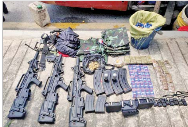
PDF အမည်ခံ အကြမ်းဖက်သမားများ လိုက်ပါလာသည့် ခရီးသည်တင်ယာဉ်နှင့် ဖမ်းဆီးရမိသည့် လက်နက်၊ ခဲယမ်းများကို တွေ့ရစဉ်။