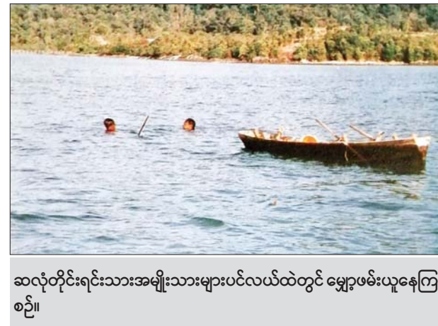
ဆလုံတိုင်းရင်းသားအမျိုးသားများပင်လယ်ထဲတွင် မျှောဖမ်းယူနေကြ စဉ်။

မျှောကိုဖမ်းဆီးရာတွင် ရေကျချိန်၌ တွင်းထဲဝင်နေတတ်သော ကြောင့် ညအချိန်တွင် တွင်းထဲသို့ ဂုန်နီကြိုးကို ဒီဇယ်ဆီဆွတ်၍ မီးရှို့ပြီးထည့်လိုက်သောအခါ တွင်းထဲမှမျှောများ ထွက်လာကြသဖြင့် အလွယ်တကူ ဖမ်းဆီးလိုက်နိုင်ကြကြောင်း သိရသည်။ သို့ဖြစ်သောကြောင့် ကမ်းစပ်တွင်ရှိသည့် ဘူမိမျှောဖမ်းသည့် အလုပ်ကို အမျိုးသမီးများက အများဆုံးလုပ်ကိုင်ကြသည်။ ပင်လယ် မျှောကို နံနက်ပိုင်းနှင့် ညပိုင်းတို့တွင် ဖမ်းယူလေ့ရှိကြသည်။ အဆိုပါ ပင်လယ်မျှောဖမ်းခြင်းလုပ်ငန်းကို ယခင်က ယောက်ျား၊ မိန်းမ မရွေးလုပ်ကိုင်ကြပြီး ယခုအချိန်တွင် ရေကန်ထဲတွင်ပင်လယ်မျှော ငုပ်ခြင်းကို အမျိုးသားများက အဓိကလုပ်ဆောင်ကြသည်။ အနည်းငယ် မျှသော အမျိုးသမီးများသာ လုပ်ကိုင်ကြတော့သည်။ ပင်လယ်မျှောဖမ်းရာတွင် အုပ်စုလိုက်ဖမ်းကြခြင်းဖြစ်ရာ အနည်း ဆုံး လူငါးယောက်၊ ခြောက်ယောက်ဖြင့် လုပ်ကိုင်ကြသည်။ မျှောဖမ်းသည့်အခါ လှေကိုနိုင်လွန်ကြိုးဖြင့် ချည်ထားပြီး ကျန်သည့် ကြိုးစတစ်ဖက်ကို ရေငုပ်သူ၏ခါးတွင် ချည်ထားရသည်။ လှေနှင့်လူကို ကြိုးဖြင့်ချည်နှောင်ဆက်သွယ်ထားခြင်း ဖြစ်သည်။ သို့မှသာလျှင် လှေသည် ရေငုပ်သူသွားသည့်နေရာသို့ လိုက်ပါရောက်ရှိ နိုင်မည်ဖြစ်သည်။ မျှောဖမ်းရာတွင် နှစ်လခန့်ရှည်သည့်ရူးဖြင့် ထိုးပြီး ဖမ်းရသကဲ့သို့ ပိုက်ကွန်ဖြင့်လည်း ဆွဲယူရသည်။