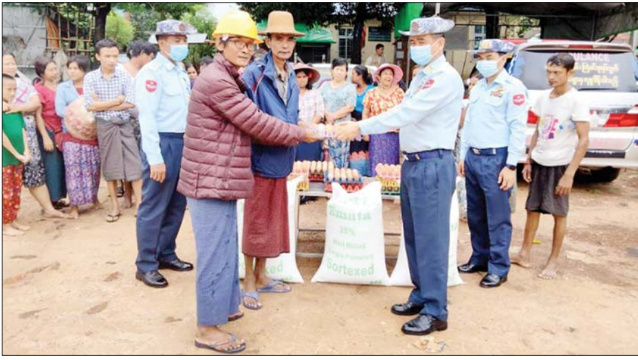
မင်္ဂလာဒုံမြို့နယ် ကြိုခင်းစုရပ်ကွက်ရှိ ရေဘေးသင့်ပြည်သူများအား စားသောက်ဖွယ်ရာများ ထောက်ပံ့ပေးအပ်စဉ်။

နေပြည်တော် ဩဂုတ် ၁၇ မြန်မာနိုင်ငံအတွင်း ဒေသအချို့တွင် ဩဂုတ် ၁၆ ရက်နှင့် ယနေ့ တို့တွင် မိုးသည်းထန်စွာ ရွာသွန်းပြီး လေပြင်းတိုက်ခတ်မှုများကြောင့် ပျက်စီးမှုများ ဖြစ်ပေါ်ခဲ့သည့် မြို့နယ်/ကျေးရွာများ၌ လိုအပ်သည့် ကူညီကယ်ဆယ်ရေးလုပ်ငန်းများ ဆောင်ရွက်ပေးပြီး ရေဘေးသင့် ပြည်သူများအား စားသောက်ဖွယ်ရာများ ထောက်ပံ့ပေးအပ်ခဲ့သည်။