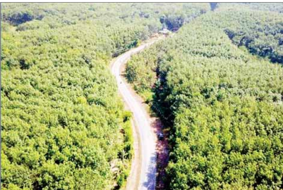
သံဖြူဇရပ် (သက္ကော) - ဘုရားသုံးဆူလမ်း (သက္ကော-လွတ်ရှမ်းအပိုင်း)ကို တွေ့ရစဉ်။

“လက်ရှိပြည်နယ်အတွင်းက လမ်းအခြေအနေမှာ ကတ္တရာကွန်ရက် (AC) လမ်း ၂၆၄ မိုင် ၇ ဖာလုံ၊ ကတ္တရာလမ်း ၄၂၀ မိုင် ၇ ဖာလုံ၊ ကွန်ကရစ်လမ်း ၅ မိုင် ၃ ဖာလုံနဲ့ မြေလမ်း ၄၀ မိုင် ၅ ဖာလုံ ဖြစ်ပါ