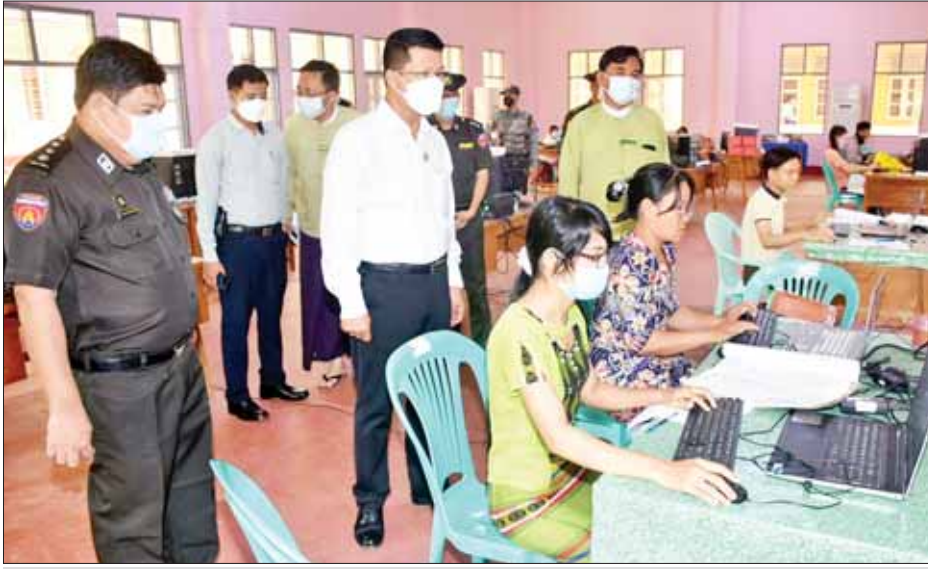
တိုင်းဒေသကြီး ဝန်ကြီးချုပ် ဦးတင်မောင်ဝင်း e-ID စနစ်ဖြင့် အိမ်ထောင်စုလူဦးရေစာရင်း ဖြည့်သွင်း လုပ်ဆောင်နေမှုများကို ကြည့်ရှုစဉ်။

ပုသိမ် ဩဂုတ် ၁၄ ဧရာဝတီ တိုင်းဒေသကြီး ဝန်ကြီးချုပ် ဦးတင်မောင်ဝင်းသည် တာဝန်ရှိသူများနှင့်အတူ ယနေ့နံနက်ပိုင်းက ပုသိမ်မြို့ အမှတ်(၅)ရပ်ကွက်တွင် ဆောက်လုပ်ရေးဝန်ကြီးဌာန၊ မြို့ပြနှင့် အိမ်ရာ ဖွံ့ဖြိုးရေးဦးစီးဌာနမှ တာဝန်ယူတည်ဆောက်လျက်ရှိသည့် လေးခန်းတွဲ လေးထပ် ဝန်ထမ်းအိမ်ရာ တည်ဆောက်ရေး လုပ်ငန်းခွင်နှင့် ဥမ္မာဒန္တအိမ်ရာဝင်း ရှိ ကျန်းမာရေးဝန်ကြီးဌာန ဝန်ထမ်းအိမ်ရာများသို့ လှည့်လည် ကြည့်ရှုစစ်ဆေးခဲ့ပြီး စည်ပင်သာယာရေးအဖွဲ့ ဝန်ထမ်းများ၊ ရပ်ကွက်အုပ်ချုပ်ရေးမှူးများနှင့် တွေ့ဆုံသည်။