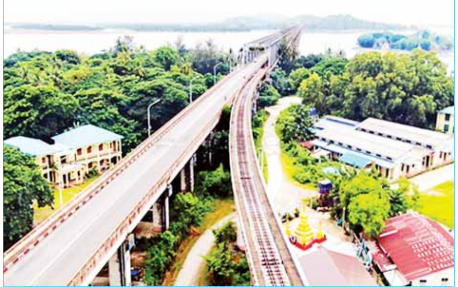
ဘုရားကြီး-မော်လမြိုင်-ထားဝယ်-မြိတ်-ဘုတ်ပြင်း-ကော့သောင်းလမ်း (မော်လမြိုင်-ရေး-မလွဲတောင်အပိုင်း)ပေါ်ရှိ သံလွင်တံတား(မော်လမြိုင်)ကို တွေ့ရစဉ်။

ဘုရားကြီး - မော်လမြိုင် - ထားဝယ် - မြိတ် - ဘုတ်ပြင်း - ကော့သောင်းလမ်း (စစ်တောင်း - သထုံ - မော်လမြိုင် - ရေး - မလွဲတောင်အပိုင်း) သည် မွန်ပြည်နယ်နှင့် တနင်္သာရီတိုင်းဒေသကြီးကို ဆက်သွယ်ထားသော အဓိကလမ်းမကြီးဖြစ်သည်။ ယင်းလမ်းသည် နိုင်ငံတကာဆက်သွယ်ရေးလမ်းမကြီးဖြစ်ပြီး ပြည်သူများ အချိန်တိုနှင့် အဆင်ပြေလွယ်ကူစွာ အသုံးပြုနိုင်ခြင်းဖြင့် ယခင်ကတည်ရှိခဲ့သော ထားဝယ် - မြိတ် - ဘုတ်ပြင်း - ကော့သောင်းခရီးစဉ်ကို ရေလမ်းခရီးမှ ရုပ်ပြေးယာဉ်များကိုသာ အားထားအသုံးပြုရသည့်အခြေအနေကို ကျော်လွှားနိုင်ခဲ့ပြီ