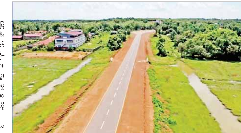
ကျိုက်ထိုမြို့ရှောင်လမ်းကို တွေ့ရစဉ်။

“ကျိုက်ထိုမြို့နယ်အပိုင်းမှာ ပွင့်လင်းကာလ ဘုရားဖူးရာသီချိန်ဆို ယာဉ်အစီးရေ ၅၀၀၀ မှ ၁၀၀၀၀ ကျော်ခန့် ဖြတ်သန်းသွားလာမှုရှိတဲ့အတွက် ကျိုက်ထို မြို့တွင်းအပိုင်းနဲ့ ကျိုက်ထို - ကင်မွန်းစခန်းလမ်း အပိုင်းမှာ ယာဉ်ကြောပိတ်ဆို့မှု မကြာခဏဖြစ်ပေါ် တယ်။ ဒါကြောင့် ယာဉ်အန္တရာယ်ကင်းရှင်းစေဖို့ ဖောက်လုပ်ခဲ့တာဖြစ်ပါတယ်။ ဒီလမ်းက ၃ မိုင်