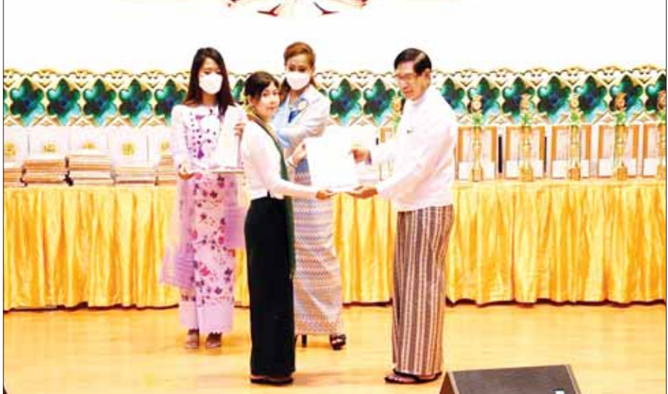
တွင် ဂုဏ်ထူးဖြင့် အောင်မြင်ကြသော ကျောင်းသား ဆုတံဆိပ်နှင့် ဂုဏ်ပြုချီးမြှင့်ငွေများ ပေးအပ်ခဲ့ ကျောင်းသားများအား ဂုဏ်ပြုမှတ်တမ်းလွှာ၊ ဂုဏ်ပြုကြောင်း သိရသည်။ တိုင်းဒေသကြီး(ပြန်/ဆက်)

(ဗဟို)ဥက္ကဋ္ဌ(ကိုယ်စား) ဒုတိယဥက္ကဋ္ဌ မဟာမင်္ဂလဓမ္မဦးသောင်းဝင်းက အမှာစကားပြောကြားသည်။ ပေးအပ် ယင်းနောက် ရန်ကုန်တိုင်းဒေသကြီး ဝန်ကြီးချုပ်၊ ရန်ကုန်တိုင်းစစ်ဌာနချုပ်တိုင်းမှူး၊ ဗိုလ်ချုပ် ညွှန်ကြားရေးမှူးချုပ်၊ တိုင်းဒေသကြီးဝန်ကြီးများ၊ ဗုဒ္ဓဘာသာကလျာဏယုဝအသင်း ဗဟိုဒုတိယဥက္ကဋ္ဌ တိုင်းဒေသကြီးဥက္ကဋ္ဌနှင့် တာဝန်ရှိသူများက ဗုဒ္ဓဝင်စာမေးပွဲအောင်မြင်သူများ၊ (၃၈)ဖြာမင်္ဂလာ အခြေခံဗုဒ္ဓဘာသာယဉ်ကျေးလိမ္မာ သင်တန်းနည်းပြများ၊ ဗုဒ္ဓဘာသာကလျာဏယုဝအသင်း (ဗဟို)နှင့် တိုင်းဒေသကြီးမှ အသင်းဝင်များ၏ သားသမီးများ အနက် ၂၀၂၁-၂၀၂၂ ပညာသင်နှစ် တက္ကသိုလ်ဝင်တန်း