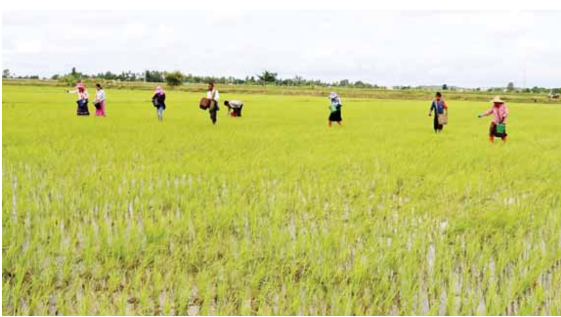
သဘာဝမြေဩဇာနှင့် ယူရီးယားဓာတ်မြေဩဇာကို ရောစပ်ပြီးကြပက်နေစဉ်။

နေပြည်တော် ကောင်စီနယ်မြေ စိုက်ပျိုးရေးဦးစီးဌာန တိုင်းဦးစီးမှူး