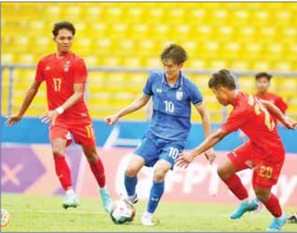
မြန်မာနှင့် ထိုင်းအသင်းတို့ ယှဉ်ပြိုင်နေစဉ်။

တတိယလှပွဲတွင် ထိုင်းအသင်းက မြန်မာအသင်းကို ခုနစ်ဂိုး-သုံးဂိုးဖြင့် အနိုင်ရခဲ့သည်။ မြန်မာ အသင်းသည် အုပ်စုပွဲတွင် ထိုင်းကို တစ်ဂိုး-ဂိုးမရှိဖြင့်သာ အရေးနိမ့်ခဲ့ သော်လည်း ယခုပြန်လည်တွေ့ဆုံ ရာတွင် ဂိုးပြတ်အရေးနိမ့်ပြီး စာမျက်နှာ ၂၁ ကော်လံ ၄ သို့ ၀