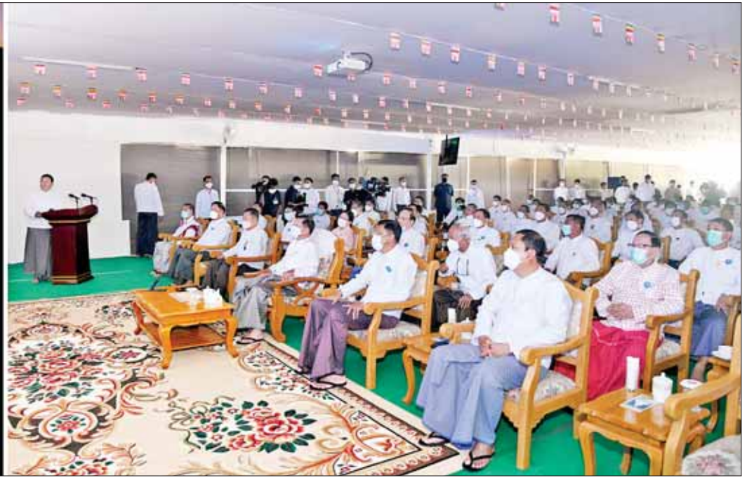
နိုင်ငံတော်စီမံအုပ်ချုပ်ရေးကောင်စီဥက္ကဋ္ဌ နိုင်ငံတော်ဝန်ကြီးချုပ် ဗိုလ်ချုပ်မှူးကြီးမင်းအောင်လှိုင်နှင့် အဖွဲ့ဝင်များအား တာဝန်ရှိသူတစ်ဦးက ရှင်းလင်းတင်ပြစဉ်။

● ရှေ့ဖိုးမှ နာယူကြည်ညိုကြသည်။ ထို့နောက် ဦးဆောင်ဘုရားဒါယကာ နိုင်ငံတော် စီမံအုပ်ချုပ်ရေးကောင်စီဥက္ကဋ္ဌ နိုင်ငံတော် ဝန်ကြီးချုပ်ဗိုလ်ချုပ်မှူးကြီး မင်းအောင်လှိုင် နှင့် ကောင်စီအတွင်းရေးမှူး ဒုတိယ ဗိုလ်ချုပ်ကြီးအောင်လင်းဒွေး၊ ကာကွယ်ရေး ဦးစီးချုပ်ရုံး(ကြည်း)မှ ဒုတိယဗိုလ်ချုပ်ကြီး ကံမြင့်သန်းတို့သည် အမှတ်(၁) ကျည်းပင် စိုက်ပျိုးပူဇော်မည့်နေရာတွင် လည်း ကောင်း၊ ကောင်စီဒုတိယဥက္ကဋ္ဌ ဒုတိယ ဝန်ကြီးချုပ် ဒုတိယဗိုလ်ချုပ်မှူးကြီးစိုးဝင်း နှင့် ကောင်စီဝင်များဖြစ်ကြသည့် ဗိုလ်ချုပ်ကြီးမြထွန်းဦး၊ ဗိုလ်ချုပ်ကြီး တင်အောင်စန်းတို့သည် အမှတ်(၂)