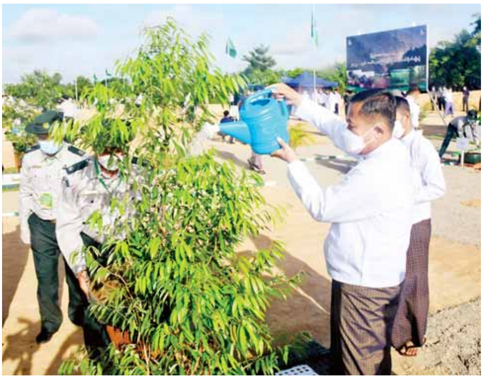
နိုင်ငံတော်စီမံအုပ်ချုပ်ရေးကောင်စီ ဒုတိယဥက္ကဋ္ဌ ဒုတိယဝန်ကြီးချုပ် ဒုတိယဗိုလ်ချုပ်မှူးကြီး စိုးဝင်းကုံကော်ပင်ကို ဦးဆောင်စိုက်ပျိုးပေးစဉ်။

နိုင်ငံတော်စဉ်ဆက်မပြတ် ဖွံ့ဖြိုးတိုးတက်ရေးအတွက် ရေသယံဇာတဖွံ့ဖြိုးရေးလုပ်ငန်းများ၊ ရေအရင်းအမြစ်များကိုအခြေခံသည့် စီးပွားရေး ရင်းနှီးမြှုပ်နှံမှုလုပ်ငန်းများ ဆောင်ရွက်ရန် အလားအလာကောင်းများစွာ ရှိပါကြောင်း၊ နိုင်ငံ၏မြစ်ချောင်းကွန်ရက်များကို ရေရှည်ထိန်းသိမ်းအသုံးပြုနိုင်ရေးအတွက် ရေဝေရေလဲဒေသ သစ်တောများ ထိန်းသိမ်းရေးကို ထိရောက်စွာဆောင်ရွက်ရန် လိုအပ်ပါကြောင်း၊ ရေဝေရေလဲဒေသတွင်ရှိသည့် သစ်တောများ ပျက်စီးပြုန်းတီးသည့်အခါ နန်းအနည်အနှစ်များသည့်ရေများ မြစ်ချောင်းများအတွင်း တိုက်ရိုက်စီးဆင်းခြင်း၊ ရေစီးကြောင့် မြေပြိုတိုက်စားခြင်း၊ ရေကြီးခြင်း၊ မြေအောက်ရေထိန်းသိမ်းနိုင်မှုမရှိခြင်း၊ မြစ်ချောင်းများ တိမ်ကောစေခြင်း၊ စိုက်ပျိုးမြေများ ရေတိုက်စားမှုကြောင့် ပျက်စီးခြင်း စသည့် နောက်ဆက်တွဲဆိုးကျိုးများ သက်ရောက်စေသည့်အပြင် ရေသယံဇာတအခြေပြု ဖွံ့ဖြိုးရေးလုပ်ငန်းများဖြစ်သည့် ရေအသုံးပြုရေး၊ လျှပ်စစ်ထုတ်လုပ်ရေး၊ ငါးနှင့်ရေထွက်ကုန်သယံဇာတ ထုတ်လုပ်ရေး၊ သယ်ယူပို့ဆောင်ရေးလုပ်ငန်းများကိုပါ ထိခိုက်နိုင်သည့်အတွက် ရေဝေရေလဲ ဧရိယာအတွင်းရှိသစ်တောများထိန်းသိမ်းရေးကို သက်ဆိုင်ရာ