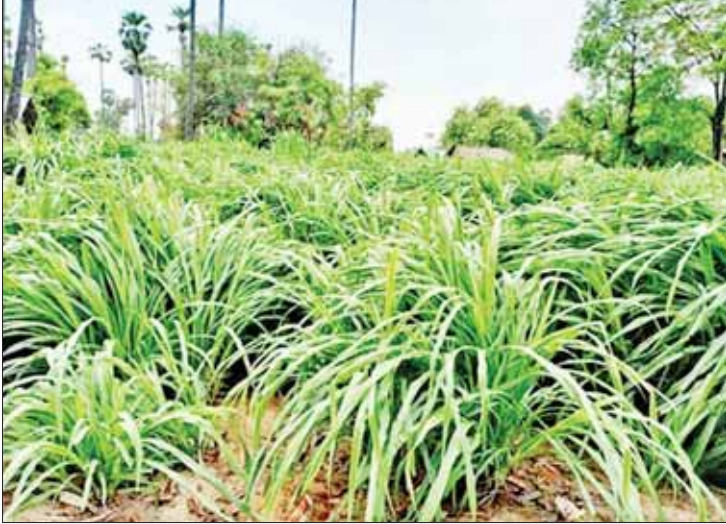
နာဂဒေသအတွင်း တိရစ္ဆာန်အစာပင်များ စမ်းသပ်စိုက်ပျိုးထားသည်ကို တွေ့ရစဉ်။

ဒေသခံများအတွက် ရေရှည်တည်တံ့ခိုင်မြဲစေမည့် တောင်စောင်းစိုက်ပျိုးနည်းစနစ်ဖော်ဆောင်မှုကို တိုင်းဒေသကြီးအစိုးရအဖွဲ့ ရန်ပုံငွေဖြင့် ၂၀၂၀-၂၀၂၁ ခုနှစ်တွင် လေ့ကျင့်ထုတ်ပေးခဲ့သည့်အပြင် ယခုနှစ်တွင် လဟယ်မြို့မျက်နှာစာ အရှေ့ဘက်ခြမ်းရှိတောင်ကုန်းများတွင် တောင်စောင်းစိုက်ပျိုးနည်းစနစ်ဖြင့် စိုက်ပျိုးရန် ၁၀ ဧက တိုးချဲ့ဖော်ဆောင်ခဲ့ပြီး အဆင့်မြင့်လယ်ယာမြေဖော်ဆောင်ခြင်းလုပ်ငန်းများကို ၂၀၂၁-၂၀၂၂ ဘဏ္ဍာနှစ်အတွင်း လဟယ်မြို့နယ်တွင်မြေဧက ၃၀ နှင့် ၂၀၂၂-၂၀၂၃ ခုနှစ်တွင် ကုန်းမြင့်လယ်ယာဧက ၃၀၀ ထပ်မံဖော်ထုတ်ပေးရန် စီစဉ်ဆောင်ရွက်