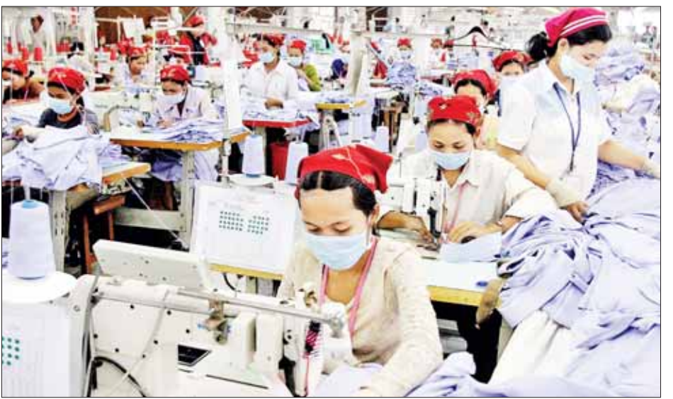
ယခုကဲ့သို့ စက်ရုံများ ဖွင့်လှစ်နိုင်ခြင်းသည် ကမ္ဘောဒီးယားနိုင်ငံသားများအတွက် အလုပ်အကိုင်များ ပိုမိုဖန်တီးနိုင်မည်ဖြစ်ကြောင်း သိရသည်။ ကိုးကား - ဆင်ဟွာ၊ ဘာသာပြန် - အောင်ကျော်ကျော်

သတင်းစာရှင်းလင်းပွဲတစ်ရပ်တွင် ပြောကြားသည်။ အဆိုပါစက်ရုံများတွင် အထည်ချုပ်စက်ရုံ၊ ဖိနပ်စက်ရုံနှင့် ခရီးသွားအသုံးအဆောင်ပစ္စည်း စက်ရုံတို့ ပါဝင်ကြောင်း သိရသည်။ ယင်းသို့ နိုင်ငံအတွင်း၌ ရင်းနှီးမြှုပ်နှံမှုများ ဝင်ရောက်လာခြင်းမှာ နိုင်ငံ၏ ဒေသဆိုင်ရာ ဘက်စုံစီးပွားရေးပူးပေါင်းဆောင်ရွက်မှု (RCEP) ဆိုင်ရာ လွတ်လပ်သောကုန်သွယ်မှုစာချုပ်နှင့် ကမ္ဘောဒီးယား-တရုတ် လွတ်လပ်သော ကုန်သွယ်မှုသဘောတူညီချက် (CCFTA) တို့အပြင် နိုင်ငံ၏ နှစ်လို့ဖွယ်ကောင်းသော ရင်းနှီးမြှုပ်နှံမှုဥပဒေအသစ်တို့ကြောင့် ဖြစ်သည်။ ကိုဗစ်-၁၉ ရောဂါ ကူးစက်ပျံ့နှံ့သည့်ကာလအတွင်း၌ပင် ကမ္ဘောဒီးယားနိုင်ငံ၌ စက်ရုံအသစ်များကို ဖွင့်လှစ်နိုင်ခဲ့ကြောင်း သိရသည်။