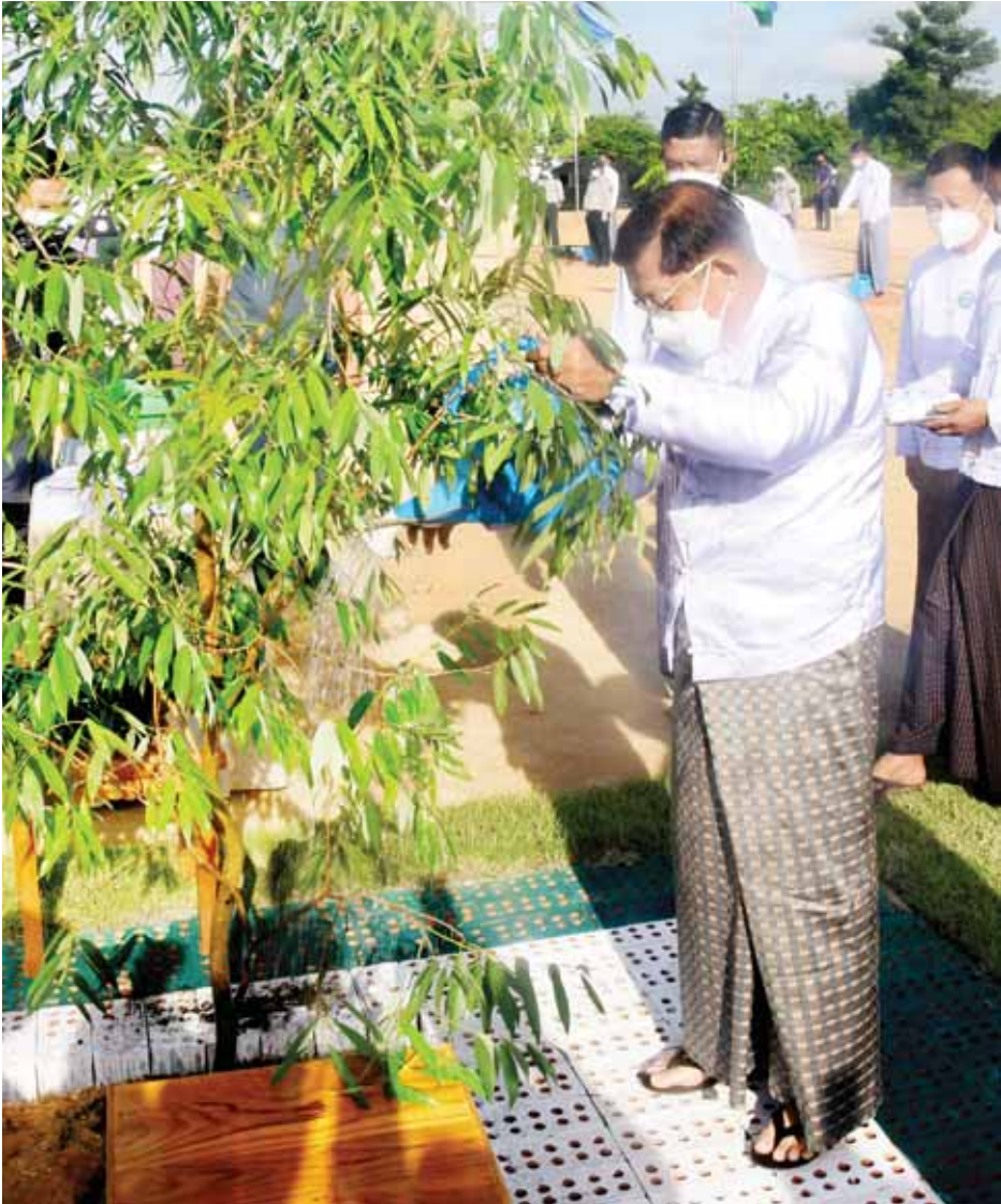
နိုင်ငံတော်စီမံအုပ်ချုပ်ရေးကောင်စီဥက္ကဋ္ဌ နိုင်ငံတော်ဝန်ကြီးချုပ် ဗိုလ်ချုပ်မှူးကြီးမင်းအောင်လှိုင် ကံ့ကော်ပင်ကို ဦးဆောင်စိုက်ပျိုးပေးစဉ်။

ဦးစွာ နိုင်ငံတော်စီမံအုပ်ချုပ်ရေးကောင်စီဥက္ကဋ္ဌ နိုင်ငံတော်ဝန်ကြီးချုပ် ဗိုလ်ချုပ်မှူးကြီးမင်းအောင် လှိုင်က အမှာစကားပြောကြားရာတွင် ၂၀၂၂ ခုနှစ် အတွင်း နိုင်ငံတော်အနေဖြင့် မိုးရာသီသစ်ပင်စိုက်ပျိုးပွဲ အခမ်းအနားများကို မိုးကြိုကာလ၊ မိုးဦးကာလများမှ ယခုမိုးလယ်ကာလအထိ ကျင်းပဆောင်ရွက်ပေးနေ ခြင်းသည် သစ်တောသယံဇာတများ ရေရှည်တည်တံ့ စေရေး၊ ဇီဝမျိုးစုံမျိုးကွဲများထိန်းသိမ်းရေး၊ ပတ်ဝန်း