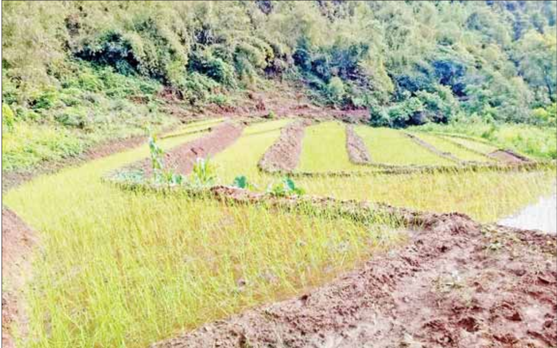
နာဂဒေသ လဟယ်မြို့နယ်မှ တောင်ယာစပါးစိုက်ခင်းကို တွေ့ရစဉ်။

စစ်ကိုင်းတိုင်းဒေသကြီး စိုက်ပျိုးရေးဦးစီးဌာနအနေဖြင့် တိုင်းဒေသကြီးအတွင်းရှိ နာဂဒေသနှင့် နယ်စပ်ဒေသများ၏ ဒေသစိုက်ပျိုးစီးပွားလုပ်ငန်း မြှင့်တင်နိုင်ရန်၊ လက်ရှိ စိုက်ပျိုးနေသည့် ဒေသမျိုးများအစား အထွက်နှုန်းနှင့် အရည်အသွေးကောင်းမွန်သည့် သီးနှံမျိုးကောင်းမျိုးသန့်များ ပြောင်းလဲစိုက်ပျိုးနိုင်ရန်၊ ဒေသနှင့် ကိုက်ညီသည့် နှစ်ရှည်သီးနှံများ တိုးချဲ့စိုက်ပျိုးနိုင်ရန်နှင့် သီးနှံအမည်သစ်များကို ပျိုးထောင်၊ မျိုးပွားစိုက်ခင်းများ ထူထောင်လာစေရန်၊ ဒေသခံတောင်သူများ၏ ပူးပေါင်းပါဝင်မှုနှင့် စုပေါင်းဆောင်ရွက်မှုများကြောင့် နာဂဒေသဖွံ့ဖြိုးတိုးတက်လာစေရန်နှင့် လက်ရှိ ကျင့်သုံးစိုက်ပျိုးနေကြသည့် ရွှေ့ပြောင်းတောင်ယာမှ ရေရှည်တည်တံ့ခိုင်မြဲသောစိုက်ခင်းများ ပေါ်ထွက်လာစေရန်ရည်ရွယ်၍ နာဂဒေသနှင့် နယ်စပ်ဒေသဖွံ့ဖြိုးတိုးတက်ရေး စီမံကိန်းကို တိုင်းဒေသကြီးအစိုးရအဖွဲ့၊ ငွေလုံးငွေရင်းဘဏ္ဍာရန်ပုံငွေနှင့် နာဂကိုယ်ပိုင်အုပ်ချုပ်ခွင့်ရဒေသ လေရှီး၊ လဟယ်၊ နန်းယွန်း၊ မိုပိုင်လွတ်၊ ထန်ပါခွေ၊ ဒုံဟီးမြို့နယ်များတွင် ၂၀၂၀-၂၀၂၁ ဘဏ္ဍာ