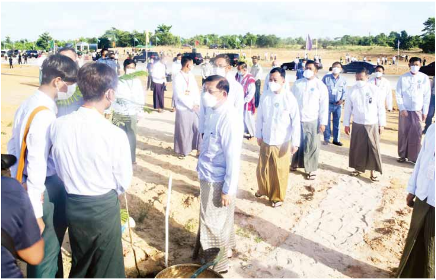
နိုင်ငံတော်စီမံအုပ်ချုပ်ရေးကောင်စီဥက္ကဋ္ဌ နိုင်ငံတော်ဝန်ကြီးချုပ် ဗိုလ်ချုပ်မှူးကြီး မင်းအောင်လှိုင် ပြည်ထောင်စုနယ်မြေ နေပြည်တော် ၂၀၂၂ ခုနှစ် မိုးရာသီသစ်ပင်စိုက်ပျိုးပွဲအခမ်းအနားသို့ တက်ရောက်လာကြသူများက ပျိုးပင်များ တပျော်တပါးစိုက်ပျိုးနေမှုများကို လှည့်လည်ကြည့်ရှုအားပေးစဉ်။

ဒီရေတောများ ထိန်းသိမ်းကာကွယ်ရေး ထို့ကြောင့် ဒီရေတောများ ထိန်းသိမ်းကာကွယ်ရေးနှင့် ပြန်လည်တည်ထောင်စိုက်ပျိုးရေးတို့ကို ဦးစားပေးမြှင့်တင် ဆောင်ရွက်သွားကြရန် ကမ်းရိုးတန်း တိုင်းဒေသကြီးနှင့် ပြည်နယ်ခရီးစဉ်များတွင် အစဉ်လမ်းညွှန်မှာကြားလျက်ရှိသကဲ့သို့ နိုင်ငံအဆင့် ပင်လယ်ကမ်းရိုးတန်း သယံဇာတစီမံအုပ်ချုပ်လုပ်ကိုင်မှုကော်မတီ ဖွဲ့စည်းပေးပြီး ဆောင်ရွက်လျက် ရှိပါကြောင်း၊ နိုင်ငံတော်အနေဖြင့် ဒီရေတောကြီးပိုင်း/ကြီးပြင်ကာကွယ်တောများ၊ အဏ္ဏဝါအမျိုးသားဥယျာဉ်များ တိုးချဲ့ဖွဲ့စည်းခြင်း၊ နိုင်ငံပိုင် ဒီရေတောစိုက်ခင်းများ တည်ထောင်ခြင်းနှင့် ယခုနှစ်မိုးရာသီမှစတင်ပြီး ကိုကိုးကျွန်း အပါအဝင် ပင်လယ်ကမ်းရိုးတန်းဒေသ မြို့နယ် ၆၀ ၌ ဒီရေတောပင်၊ အရိပ်ရပင် တစ်အုပ်တစ်စုစိုက်ခင်းများကို လူထုပူးပေါင်းပါဝင်မှုဖြင့် စိုက်ပျိုးတည်ထောင်လျက်ရှိသည့်အတွက် သက်ဆိုင်ရာဝန်ကြီးဌာနနှင့် အတူ တိုင်းဒေသကြီး/ ပြည်နယ်အစိုးရအဖွဲ့များ၊ လူမှုအဖွဲ့အစည်းများက တက်တက်ကြွကြွ ပါဝင်ဆောင်ရွက်သွားကြရန် မှာကြားလိုပါကြောင်း။ မြန်မာနိုင်ငံတွင်ရှိသည့် မြစ်ကြီးလေးသွယ်အပါအဝင် မြစ်ချောင်းကွန်ရက်များမှ နှစ်စဉ် ရေချိုဧက