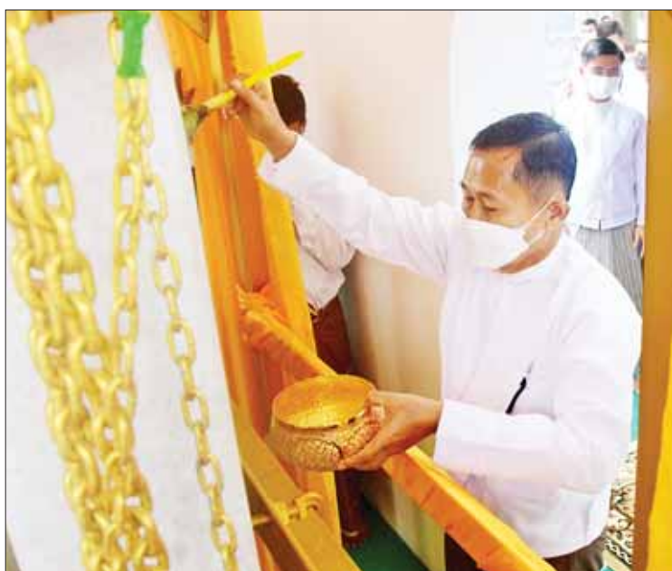
နိုင်ငံတော်စီမံအုပ်ချုပ်ရေးကောင်စီဒုတိယဥက္ကဋ္ဌ ဒုတိယဝန်ကြီးချုပ် ဒုတိယဗိုလ်ချုပ်မှူးကြီးစိုးဝင်း ပိဋကတ်ကျောက်စာတော်များကို ပရိတ်နံ့သာရည် ပက်ဖျန်းပူဇော်စဉ်။

မူလဉာဏ်တော်အမြင့်ကို မထိခိုက်စေဘဲ အစိတ်အပိုင်း ၄ ပိုင်းခွဲ၍လည်းကောင်း၊ ပလ္လင်တော်ကို အစိတ်အပိုင်း ၅ ပိုင်းခွဲ၍ လည်းကောင်း အပိုင်းလိုက်ဖြတ်တောက်၍ သယ်ယူနိုင်ရန် စီစဉ်ဆောင်ရွက်ခဲ့ကြောင်း၊ သယ်ဆောင်နိုင်ရေးအတွက် စကျင်ကျောက်တော်ကြီး တည်ရှိရာ မတ္တရာမြို့နယ် စကျင်တောင်မှ မြောင်မြစ်အထိ တူးမြောင်းဖောက်လုပ်ကာ Barge ရေယာဉ်ပေါ်သို့ တင်ဆောင်နိုင်ရေး လုပ်ဆောင်ခဲ့ကြောင်း၊ ယင်းမှတစ်ဆင့် ဧရာဝတီမြစ်ကြောင်းအတိုင်း မြင်းခြံမြို့နယ်ရှိ ဆီမီးခုံဆိပ်ကမ်းသို့ ပထမအဆင့် ပင့်ဆောင်ပူဇော်ရကြောင်း၊ ဆီမီးခုံဆိပ်ကမ်းတွင် အလေးချိန်လျှော့ချခြင်း လုပ်ငန်းများကို လုပ်ဆောင်ခဲ့ပြီး ယင်းမှတစ်ဆင့် မန္တလေး-ရန်ကုန် အမြန်လမ်းအတိုင်း Modular Trailer များဖြင့် နေပြည်တော်သို့ အခက်အခဲများကြားမှ ဆက်လက် ပင့်ဆောင်ခဲ့ခြင်းဖြစ်ကြောင်း၊ ထိုသို့ ကျောက်တုံးတော်ကြီးများ သယ်ယူခဲ့ခြင်းသည် ရေလမ်းအရ ကမ္ဘာပေါ်တွင် အဝေးဆုံးသယ်ဆောင်ခြင်း၊ ကုန်းလမ်းအရ အဝေးဆုံးသယ်ဆောင်ခြင်းမှတစ်ဆင့် ဝင်ခဲ့ပါကြောင်း၊ ယခုဆင်းတုတော်ကြီး တည်ထားကိုးကွယ်ပြီးစီးပါက မြန်မာတွင်မက ကမ္ဘာ့နိုင်ငံများတွင်ပါ စကျင်ကျောက်တော်ကြီးဖြင့် ထုဆစ်သည့် ဆင်းတုတော်ကြီးများအနက် အကြီးဆုံး၊ ဉာဏ်တော်အမြင့်မားဆုံး ဆင်းတုတော်ကြီးဖြစ်လာမည်ဖြစ်ပါကြောင်း။