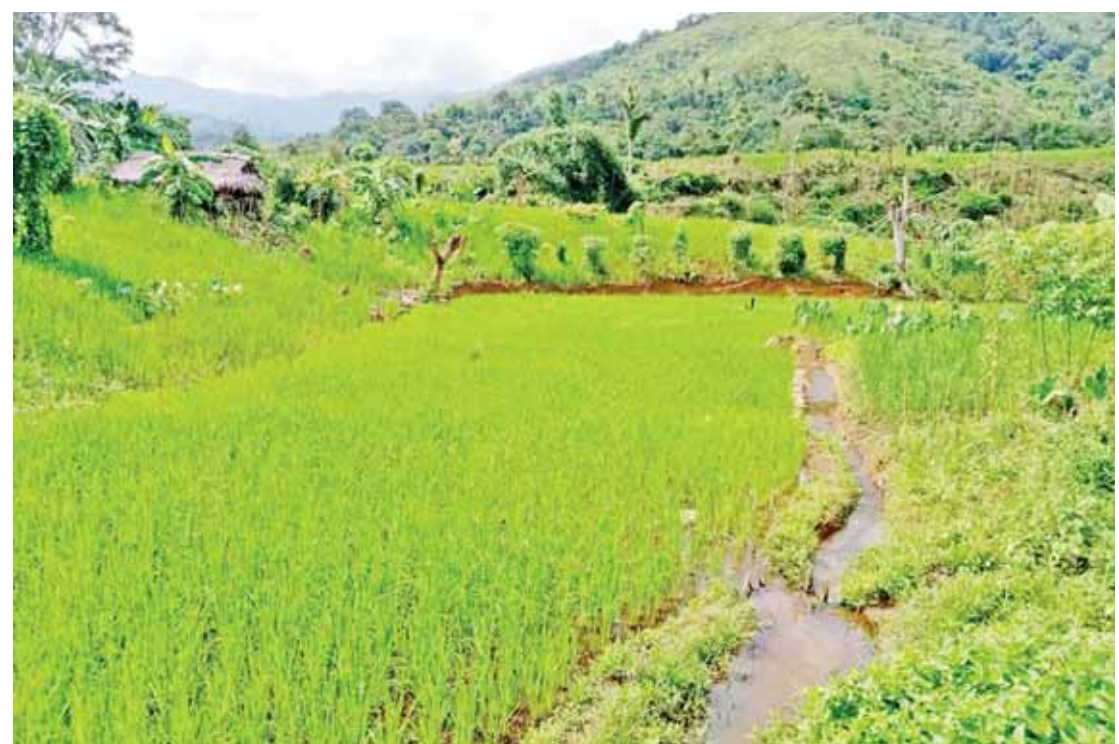
နာဂဒေသ လေရိုးမြို့နယ်မှ စိုက်ခင်းများကို တွေ့ရစဉ်။

နွားနောက် ၅၀၁၇ ကောင်၊ ကျွဲ ၇၁၁၂ ကောင်၊ နွား ၉၆၉၂ ကောင်၊ ဆိတ် ၄၉၄၄ ကောင်၊ ဝက် ၅၁၅၉၇ ကောင်၊ ကြက် ကောင်ရေ ၂၅၅၀၇၀ နှင့် ဘဲကောင်ရေ ၃၂၆၄၀ ကို မွေးမြူနိုင်ရေး ဆောင်ရွက်ထား သကဲ့သို့ မွေးမြူထားသည့် တိရစ္ဆာန် များကို ကာကွယ်ဆေးများ ထိုးနှံပေးခြင်း၊ တိရစ္ဆာန်ကူးစက်ရောဂါ ကာကွယ် ထိန်းချုပ်ရေးဆိုင်ရာ ပညာပေးဆွေးနွေး ခြင်း၊ တိရစ္ဆာန်အစာပင် စိုက်ပျိုးမှုနှင့် ပတ်သက်၍ ပညာပေးဆွေးနွေးခြင်းများ ဆောင်ရွက်ခဲ့သည်။ စစ်ကိုင်းတိုင်း ဒေသကြီးအတွင်း တိရစ္ဆာန်အစာပင် စိုက်ပျိုးထားရှိမှု အနေဖြင့် နေဗီယာမြက် ၂၀၇ ဧက၊ မွန်ဘားဆား ၁၃ ဧက၊ ရှုဇီ ၁၃၆ ဧကနှင့် အခြား ၁၉ ဧက စုစုပေါင်း ၃၇၅ ဧက စမ်းသပ်စိုက်ပျိုးလျက်ရှိရာ နာဂဒေသ လေရိုးမြို့နယ်နှင့် လဟယ်မြို့နယ်များ တွင် တိုင်းဒေသကြီး အစိုးရအဖွဲ့၏ ဘဏ္ဍာရန်ပုံငွေဖြင့် တိရစ္ဆာန်အစာ နေဗီယာမြက်များ စမ်းသပ်စိုက်ပျိုးခဲ့ရာ လက်ရှိတွင် အောင်မြင်ဖြစ်ထွန်းလျက် ရှိသဖြင့် ပိုမိုတိုးချဲ့စိုက်ပျိုးနိုင်ရေး လျာထားဆောင်ရွက်လျက်ရှိသည်။