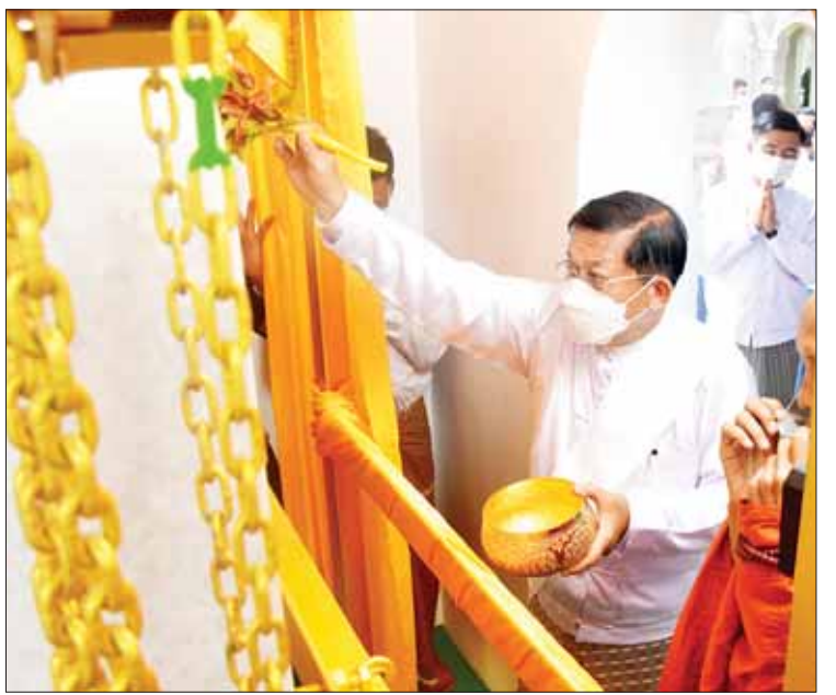
နိုင်ငံတော်စီမံအုပ်ချုပ်ရေးကောင်စီဥက္ကဋ္ဌ နိုင်ငံတော်ဝန်ကြီးချုပ် ဗိုလ်ချုပ်မှူးကြီးမင်းအောင်လှိုင် ပိဋကတ်ကျောက်စာတော်များကို ပရိတ်နံ့သာရည် ပက်ဖျန်းပူဇော်စဉ်။

ပူဇော်သည်။ ထို့နောက် နိုင်ငံတော် စီမံအုပ်ချုပ်ရေးကောင်စီဥက္ကဋ္ဌ နိုင်ငံတော် ဝန်ကြီးချုပ်နှင့် အဖွဲ့ဝင်များသည် အမှတ်(၁) ကျည်းပင်အား မြေဆီဩဇာများ ကျွေးမွေး ပြီး ရေစင်ရေသန့်များ သွန်းလောင်းကာ အမွှေးနံ့သာရည်များ ပက်ဖျန်းပူဇော်ကြ သည်။ တစ်ချိန်တည်းတွင် အမှတ်(၂) ကျည်းပင်ကို ကောင်စီဒုတိယဥက္ကဋ္ဌ ဒုတိယဝန်ကြီးချုပ်နှင့် အဖွဲ့ဝင်များက လည်းကောင်း၊ အမှတ်(၃) ကျည်းပင်ကို ကောင်စီဝင် မန်းငြိမ်းမောင်နှင့် အဖွဲ့ဝင် များကလည်းကောင်း စိုက်ပျိုးပူဇော်ကြပြီး အမွှေးနံ့သာရည်များ ပက်ဖျန်းပူဇော်ကြ သည်။