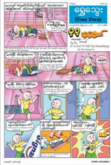
ရွှေသွေးဂျာနယ်ထွက်ရှိ နေပြည်တော် ဩဂုတ် ၁၁ ပြန်ကြားရေးဝန်ကြီးဌာန ပုံနှိပ်ရေးနှင့်ထုတ်ဝေရေးဦးစီးဌာန စာပေဗိမာန်ရုံးက အပတ်စဉ် စနေနေ့တိုင်း ရွှေသွေးဂျာနယ်ကို ထုတ်ဝေဖြန့်ချိလျက်ရှိသည်။

သည့် “Myo Win” Facebook အကောင့်တို့သည် အသိပေးသတင်းထုတ်ပြန်ချက်အပေါ် မျက်ကွယ်ပြု၍ နိုင်ငံတော်တည်ငြိမ်အေးချမ်းရေးကို ပျက်ပြားစေရန် ရည်ရွယ်လျက် လှုံ့ဆော်ခြင်း၊ ဝါဒဖြန့်ခြင်းများ ပြုလုပ်ဆောင်ခဲ့သည့်အတွက် တရားဥပဒေနှင့်အညီ ဖမ်းဆီးထိန်းသိမ်း အမှုဖွင့်လှစ်အရေးယူခြင်းများ ဆောင်ရွက်ခဲ့ရသည်။ ထိုကဲ့သို့ CRPH၊ NUG နှင့် ယင်းတို့၏လက်အောက်ခံအဖွဲ့အစည်းများ၊ ယင်းတို့နှင့် ဆက်သွယ်နေသော အဖွဲ့အစည်းများ၊ လူပုဂ္ဂိုလ်များသည် နိုင်ငံတော်တည်ငြိမ်အေးချမ်းရေးကို ပျက်ပြားစေရန်နှင့် အစိုးရယန္တရားများ ပျက်ပြားစေရန်ရည်ရွယ်လျက် လှုံ့ဆော်ခြင်း၊ ဝါဒဖြန့်ခြင်းများ ပြုလုပ်ခဲ့သူများကို အားပေးကူညီခြင်း ပြုလုပ်ခဲ့သူများကို ဥပဒေနှင့်အညီ ထိရောက်စွာ အရေးယူသွားမည်ဖြစ်ကြောင်းနှင့် ထိုသို့ လှုံ့ဆော်သူ၊ ဝါဒဖြန့်သူများကို ဆက်လက်ဖော်ထုတ်အရေးယူ သွားမည်ဖြစ်ကြောင်း သိရသည်။ သတင်းစဉ်