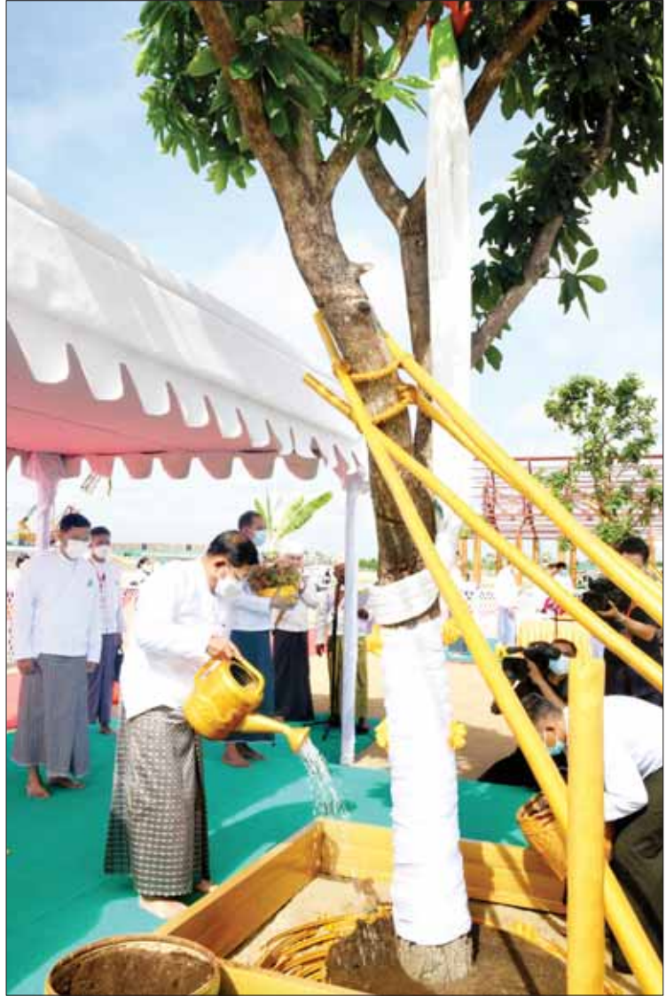
နိုင်ငံတော်စီမံအုပ်ချုပ်ရေးကောင်စီဥက္ကဋ္ဌ နိုင်ငံတော်ဝန်ကြီးချုပ် ဗိုလ်ချုပ်မှူးကြီးမင်းအောင်လှိုင် အမှတ်(၁)ကျည်းပင်အား ရေစင်ရေသန့်များ သွန်းလောင်းစဉ်။

ဆက်လက်ပြီး အခမ်းအနားသို့ ကြွရောက် ချီးမြှင့်တော်မူကြသည့် ဆရာတော်ကြီးများအမှူးပြု၍ ဦးဆောင် ဘုရားဒါယကာ နိုင်ငံတော်စီမံအုပ်ချုပ် ရေးကောင်စီဥက္ကဋ္ဌ နိုင်ငံတော်ဝန်ကြီးချုပ် နှင့် အဖွဲ့ဝင်များသည် ဆဋ္ဌသင်္ဂါယနာမူ ပိဋကတ်ကျောက်စာတော် ဓမ္မစေတီ တော်များ စတင်စိုက်ထူပူဇော်မည့် နေရာသို့ ရောက်ရှိကြပြီး မင်္ဂလာအချိန် တွင် ပိဋကတ်ကျောက်စာတော်များကို မင်္ဂလာရွှေကြိုးဆွဲ၍ စတင်တည်ထား ပူဇော်ကြသည်။