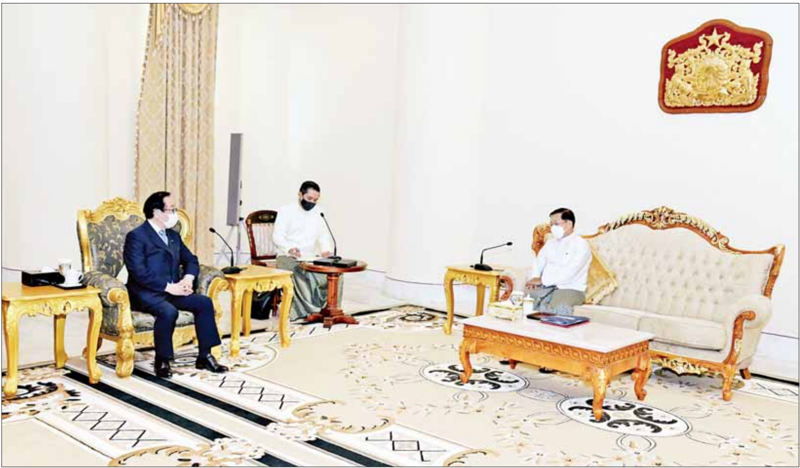
နိုင်ငံတော်စီမံအုပ်ချုပ်ရေးကောင်စီဥက္ကဋ္ဌ နိုင်ငံတော်ဝန်ကြီးချုပ် ဗိုလ်ချုပ်မှူးကြီး မင်းအောင်လှိုင် ဂျပန်နိုင်ငံ လစ်ဘရယ်ဒီမိုကရက်တစ်ပါတီ အောက်လွှတ်တော်အမတ် Mr. Hiromichi Watanabe ဦးဆောင်သည့်အဖွဲ့ကို လက်ခံတွေ့ဆုံစဉ်။

ဆွေးနွေး ထိုသို့တွေ့ဆုံစဉ် ကမ္ဘာ့အကြီး ဆုံး ကျောက်ဆစ်ဗုဒ္ဓရုပ်ပွားတော် ဖြစ်လာမည့် မာရဝိဇယဗုဒ္ဓရုပ်ပွား တော်ကြီးတည်ရှိရာ မာရဝိဇယ ဗုဒ္ဓဥယျာဉ်တော်အတွင်း ဂျပန်- မြန်မာနှစ်နိုင်ငံ ချစ်ကြည်ရေး အတွက်ရည်ရွယ်၍ ချယ်ရီပင်များ ကို ဂျပန်နိုင်ငံမှ စိုက်ပျိုးလှူဒါန်း သွားမည့် အခြေအနေ၊ မြန်မာနိုင်ငံ ၏ နိုင်ငံရေးဖြစ်ပေါ် ပြောင်းလဲမှု အခြေအနေ၊ နှစ်နိုင်ငံချစ်ကြည်မှု နှင့် ပူးပေါင်းဆောင်ရွက်မှုများ မြှင့်တင်ဆောင်ရွက်ရေး၊ စီးပွားရေး နှင့် ရင်းနှီးမြှုပ်နှံမှုများတွင် ပိုမို တိုးမြှင့် ပူးပေါင်းဆောင်ရွက်ရေး၊ မြန်မာနိုင်ငံ၏ နိုင်ငံရေးအခြေအနေ များနှင့်ပတ်သက်၍ ပြည်ပနိုင်ငံ များတွင် သတင်းမှားများ ဖြစ်ပေါ် နေမှုနှင့် အဖြစ်မှန်များကို ဂျပန် နိုင်ငံရှိ ပြည်သူများသိရှိရန်လိုအပ်