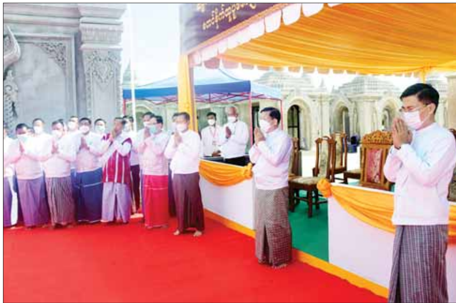
နိုင်ငံတော်စီမံအုပ်ချုပ်ရေးကောင်စီဥက္ကဋ္ဌ နိုင်ငံတော်ဝန်ကြီးချုပ် ဗိုလ်ချုပ်မှူးကြီးမင်းအောင်လှိုင်နှင့် အဖွဲ့ဝင်များ ကျောက်စာရုံများ တည်ဆောက်ပြီးစီးမှု အခြေအနေများကို ကြည့်ရှုစဉ်။