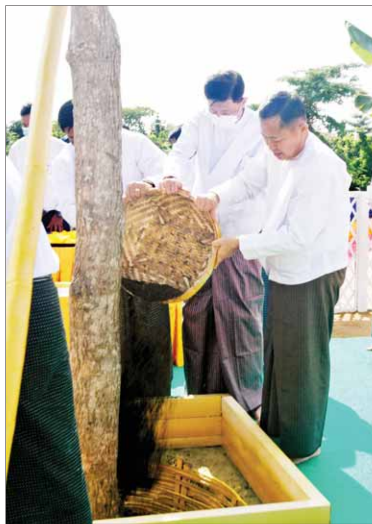
နိုင်ငံတော်စီမံအုပ်ချုပ်ရေးကောင်စီဒုတိယဥက္ကဋ္ဌ ဒုတိယဝန်ကြီးချုပ် ဒုတိယဗိုလ်ချုပ်မှူးကြီးစိုးဝင်းနှင့် အဖွဲ့ဝင်များက အမှတ်(၂)ကျည်းပင်ကို မြေဆီဩဇာများကျွေးမွေးစဉ်။

ရေးထိုးပူဇော်ထားခြင်းဖြစ်သည့်အတွက် မာရဝိဇယ ဗုဒ္ဓရုပ်ပွားတော်မြတ်ကြီး၏ မျက်နှာတော်မူရာ ရှေ့မျက်နှာစာ၌ စိုက်ထူပူဇော်ထားရှိခြင်းဖြစ်ပြီး ဘုရားဖူးလာ မိဘပြည်သူများအနေဖြင့် ဗုဒ္ဓရုပ်ပွားတော်မြတ်ကြီးအား လာရောက်ဖူးမြော်ချိန်တွင် ကျောက်စာတိုက်များအတွင်းရှိ ပိဋကတ်သုံးပုံပါဠိတော် အဋ္ဌကထာဋီကာကျမ်းစာများကိုပါ တစ်ပါတည်း လေ့လာကြည့်ညှိ၍ နာယူကြည့်ညှိနိုင်ရေး စီစဉ်ဆောင်ရွက်ခဲ့ခြင်းဖြစ်ကြောင်း။